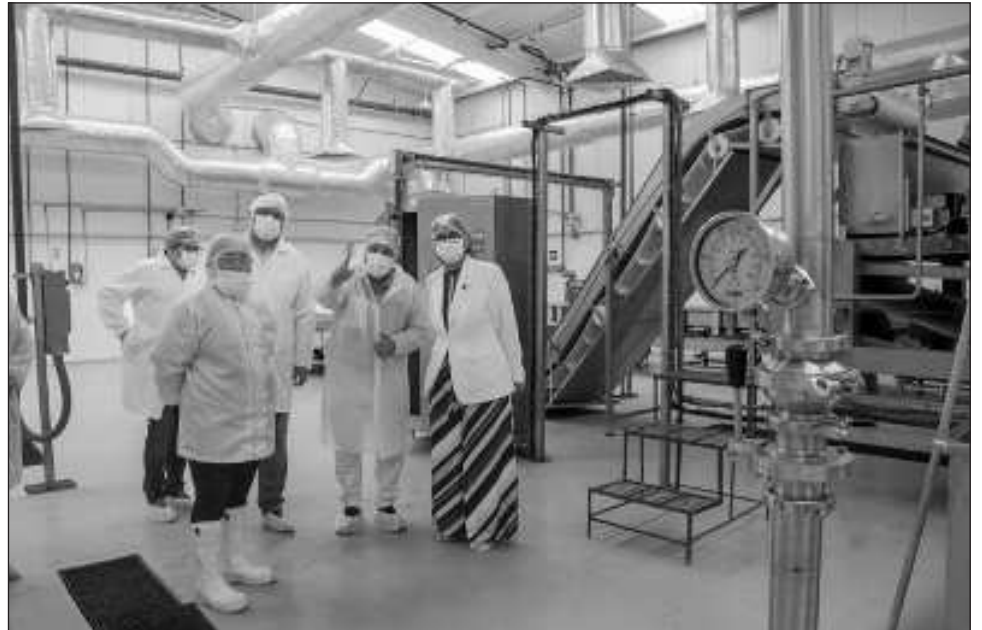
▲ Al adherirse al programa Entornos Laborales Seguros y Saludables, el personal de esta empresa que siembra y produce aloe desde la capital campechana se beneficiará directamente, al igual que sus familias.

En la planta de producción ubicada en la capital del estado que proporciona materia prima a la industria alimentaria, cosmética y farmacéutica, recibió el distintivo del IMSS, la gerente de con-