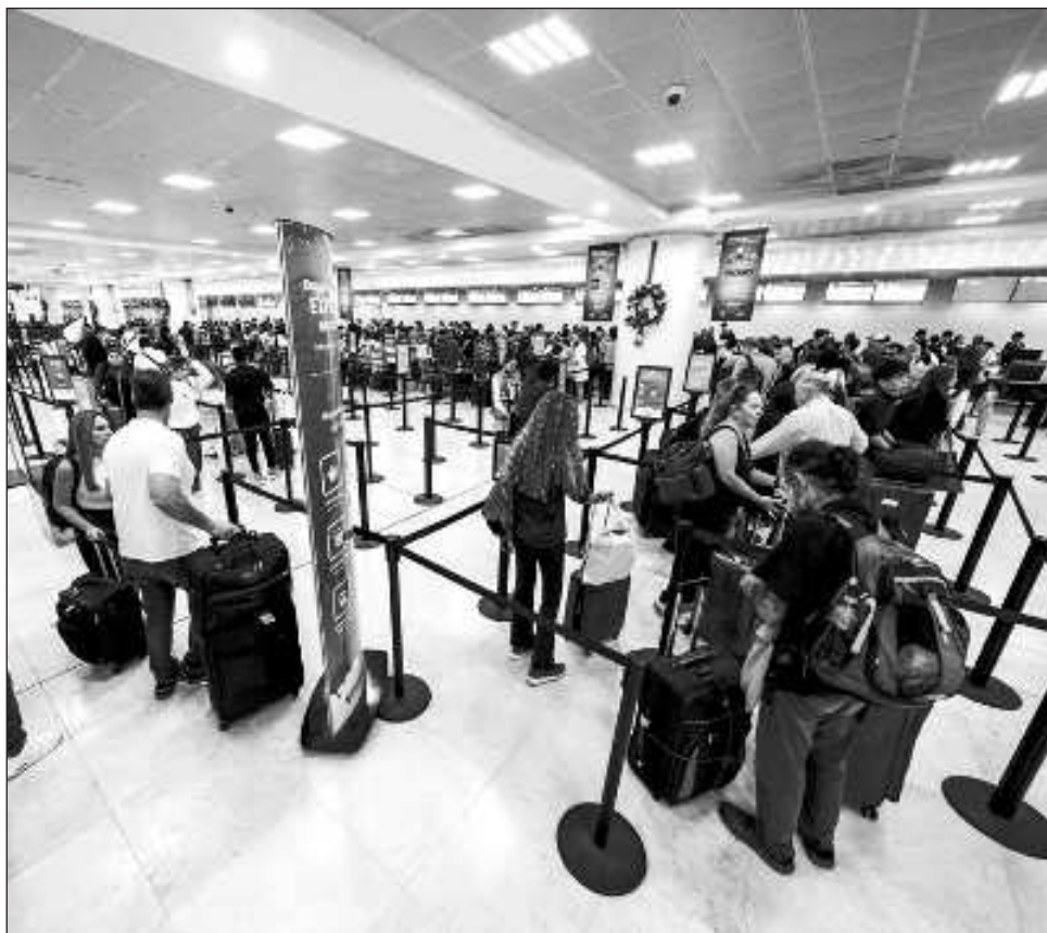
▲ Desde su inauguración, la IATA proyectó que el aeropuerto de la selva maya operaría 4 mil 500 vuelos en su primer año; actualmente, el recinto acumula casi 8 mil.

Desde su inauguración, la Asociación Internacional de Transporte Aéreo (IATA) proyectó que el Aeropuerto Internacional de Tulum Felipe Carrillo Puerto recibiría 700 mil pasajeros anualmente y operaría 4 mil 500 vuelos en su primer año. Sin embargo, ha superado estas expectativas, acumulando ya más de 7 mil 790 operaciones y alcanzando la cifra de un millón de pasajeros.