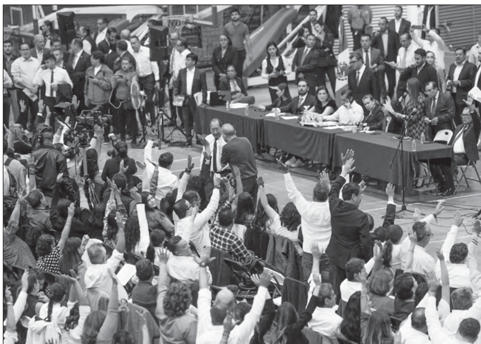
▲ A pesar de la postura de Morena en contra, el presidente en turno de la cámara, Sergio Gutiérrez Luna, concedió el receso para permitir el ingreso del panismo.