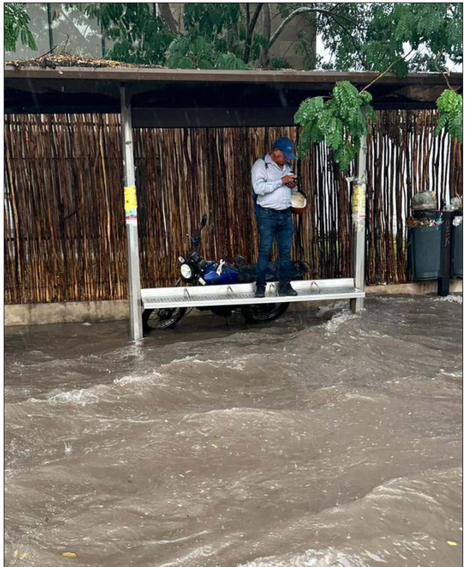
▲ Procivy alertó que del 7 al 9 de septiembre habrá lluvias con actividad eléctrica.

El lunes, las lluvias más intensas se registraron en el centro de Mérida. Según los datos pluviométricos de la Red de Monitoreo Atmosférico Peninsular, la capital yucateca registró una caída de lluvia de hasta 64 mm.