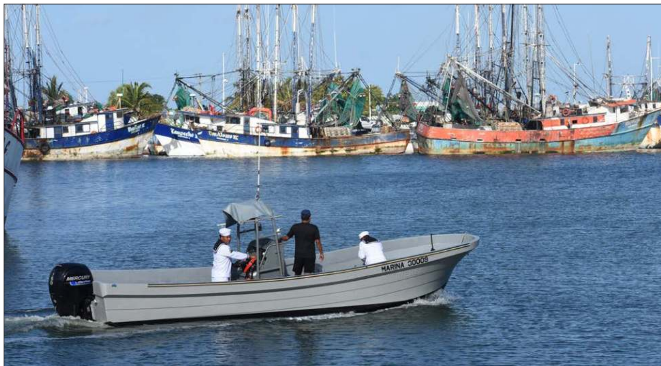
▲ Hasta el momento, no se sabe con exactitud cuántos de los pescadores podrán sumarse a la temporada de captura.

La veda debió levantarse el 15 de agosto pasado; el presidente de la Cámara Nacional de la Industria Pesquera y Acuícola (Canainpesca) en Campeche,