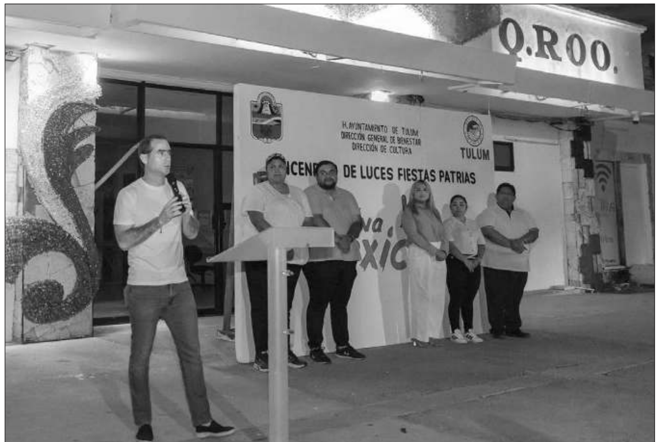
▲ El alcalde anticipó que septiembre "será un mes lleno de actividades y proyectos relevantes (...) El municipio se prepara para avanzar en su desarrollo y seguir fortaleciendo la colaboración con las instancias de gobierno".

Añadió que este mes quedará marcado en materia de obras que implementó el presidente de México, Andrés Manuel López Obrador, toda vez que inaugurarán el Parque del Jaguar y las estaciones del Tren Maya, dos proyectos