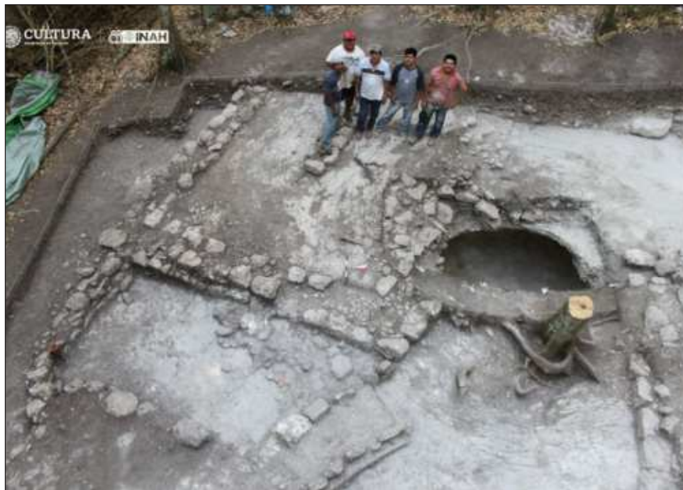
▲ Descubren restos óseos humanos, así como de varios animales, al fondo de una cavidad que, después de servir como depósito de agua, fue convertida en lugar de enterramiento.