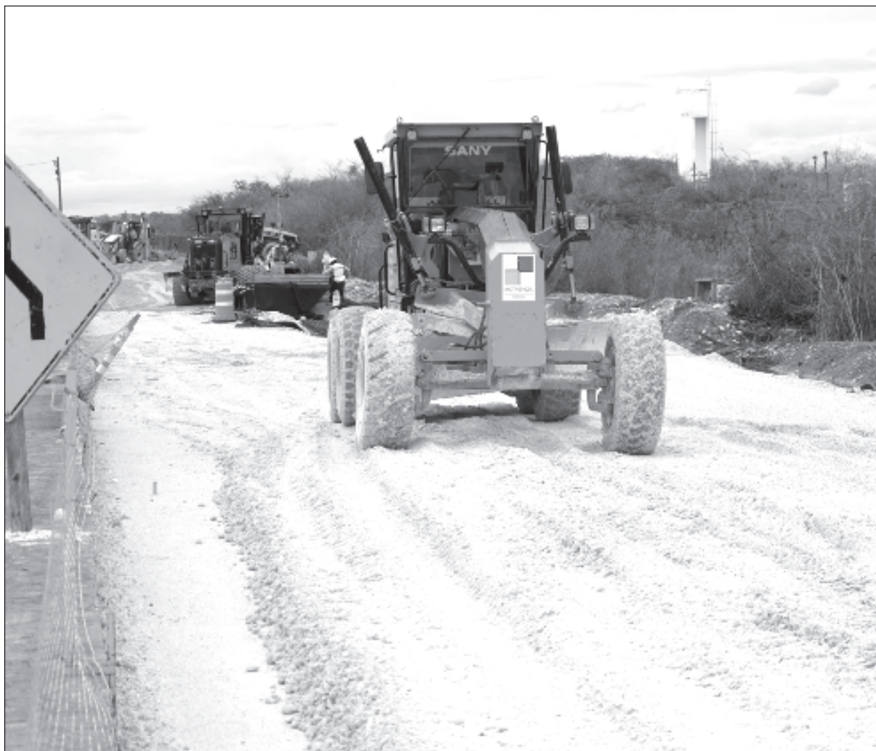
▲ El objetivo de esta iniciativa es no permitir que gobiernos opositores bloqueen o suspendan los trabajos de obras que tendrán un impacto social y económico benéfico para el estado y los ciudadanos alrededor de estas.

En este sentido, los diputados del Partido Revolucionario Institucional (PRI) y Movimiento Ciudadano se opusieron a la iniciativa destacando precisamente las afectaciones a la ciudad descritas anteriormente, por no presentar un proyecto ejecutivo, tal como ocurrió con el Tren Maya, ya que hoy varias comunidades se inundan por no contar con los drenajes ofrecidos.