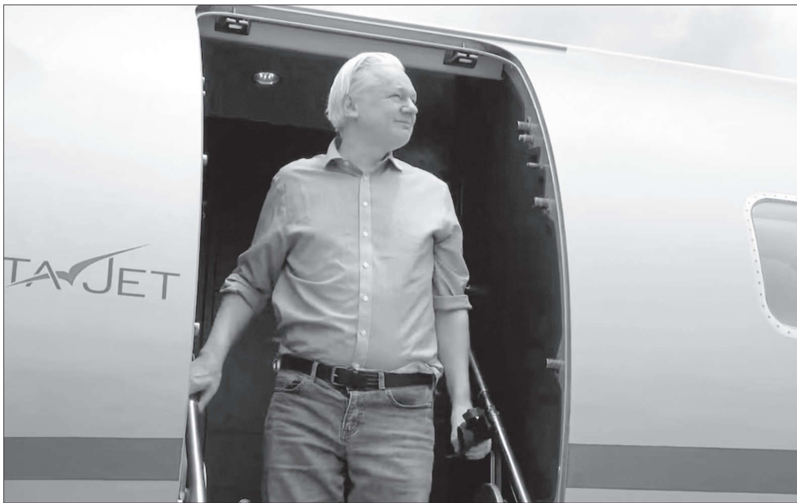
▲ “Ante el impacto que alcanzó la figura de Julian, Fidel Castro expresó en 2010: ‘el audaz desafío no provenía de una superpotencia rival; de un Estado con más de cien armas nucleares; o de una doctrina revolucionaria capaz de estremecer los cimientos al Imperio (...) era sólo una persona’”.