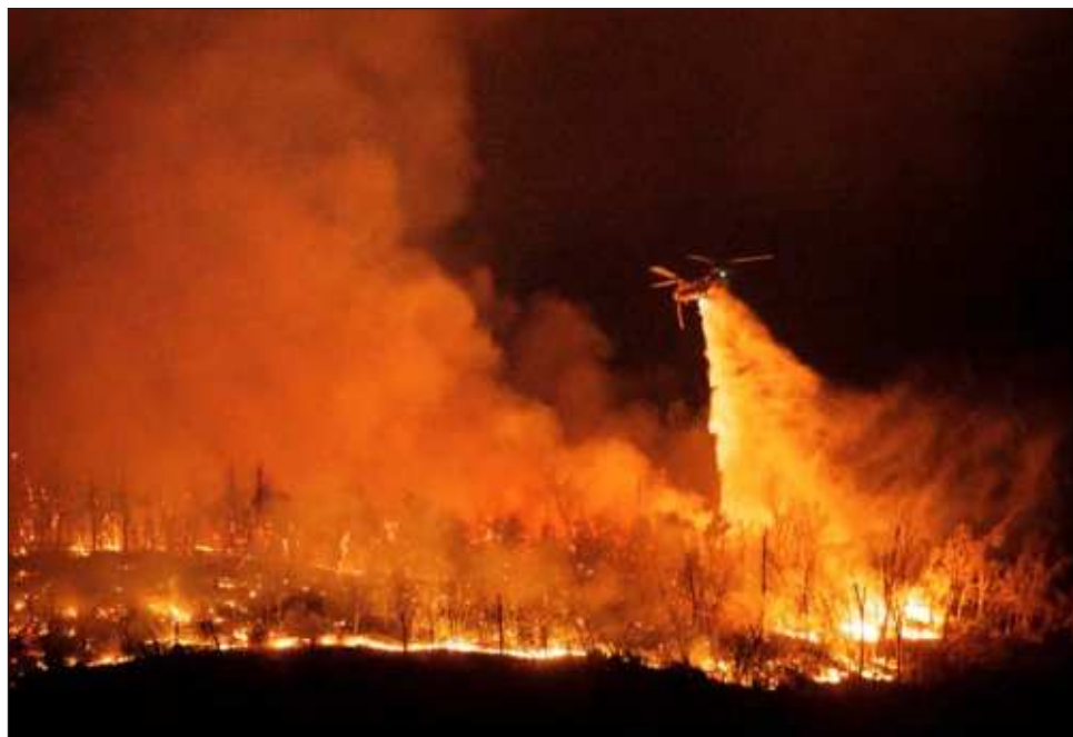
▲ El siniestro ha consumido más de mil 200 hectáreas desde que inició el martes. El condado (Butte) está bajo alerta roja desde anoche y se mantendrá así hasta mañana en la noche”, informó este miércoles el jefe de los bomberos en la localidad.

“El condado (Butte) está bajo alerta roja desde anoche y se mantendrá así hasta mañana en la noche”,