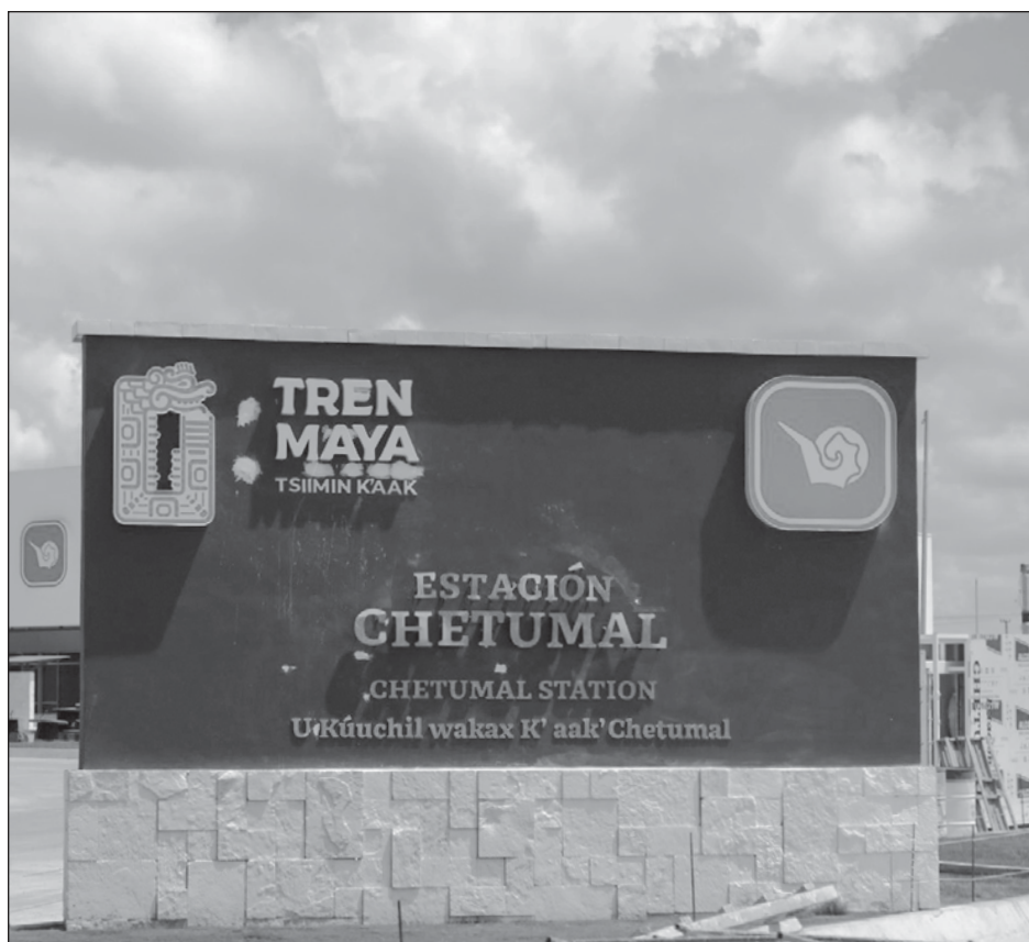
▲ La gobernadora destacó a Kohunlich, con sus impresionantes mascarones que se relacionan con la deidad del Sol y de Venus, que podrán ser visitadas por los turistas.

“Los corales se restablecen y vuelven a recuperar sus algas y se mejoran, por así decirlo. Pero lo que pasó el año pasado fue una ola de calor sin precedente que causó una mortalidad muy alta en muchos de los corales. Entonces este año estamos previendo que va a haber mucho calentamiento y va a haber también otra afectación”, adelantó.