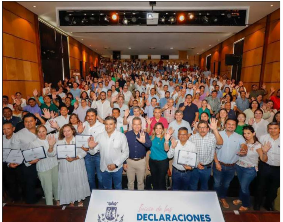
▲ “Debido a que mayo es el mes establecido por la citada Ley para la presentación de esta declaración en su modalidad anual, es de vital importancia que el personal esté preparado”: Ruz.

Finalmente, mencionó que todas y todos los servidores públicos municipales, independientemente de su nivel jerárquico, que ingresaron al Ayuntamiento antes del presente año 2024, realizaron su declaración de manera anual.