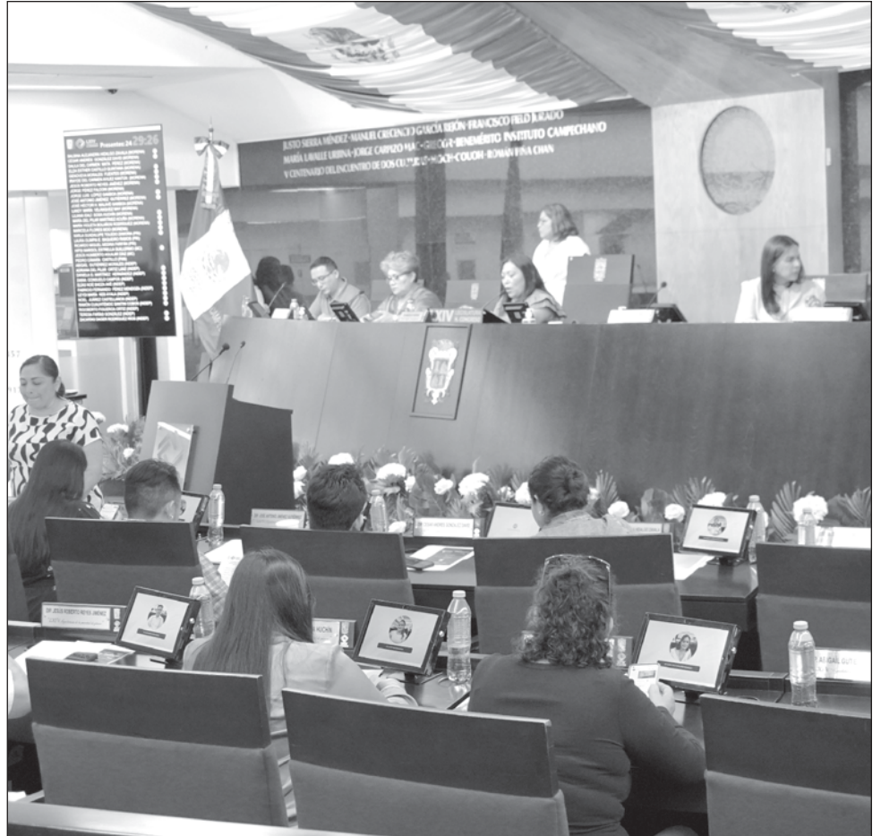
▲ Los resultados propician a que las curules plurinominales se queden en Morena y Movimiento Ciudadano, pues no habrá otra fuerza política en el Legislativo de Campeche.

Los virtuales ganadores han publicado en sus perfiles de Facebook mensajes de agradecimiento y compromiso para los siguientes tres años de administración pública y que arrancarán el próximo 1 de octubre.