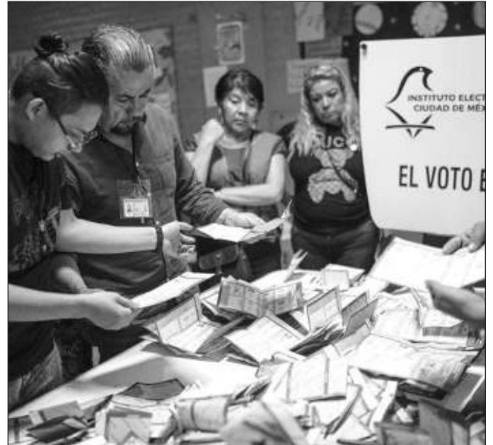
▲ Un día después de la jornada electoral, espero que este país pueda reencontrar la capacidad de dialogar para resolver lo urgente, discutir lo importante, y acordar lo necesario.

El ejemplo más nítido y reciente de este fenómeno es el asesinato, transmitido en vivo, del candidato del PRI y la alianza opositora, en Coyuca, Guerrero. El crimen vota y veta. El crimen decide quién gobierna en los municipios, quién manda en las policías y cómo se orienta el raquítico presupuesto público de cientos de alcaldías. Esa es nuestra realidad, y la política ha llevado la seguridad a su terreno. Así, tocar el tema de seguridad parece un tema contra el gobierno, y la defensa de las políticas públicas de seguridad cae en oídos sordos de la oposición.