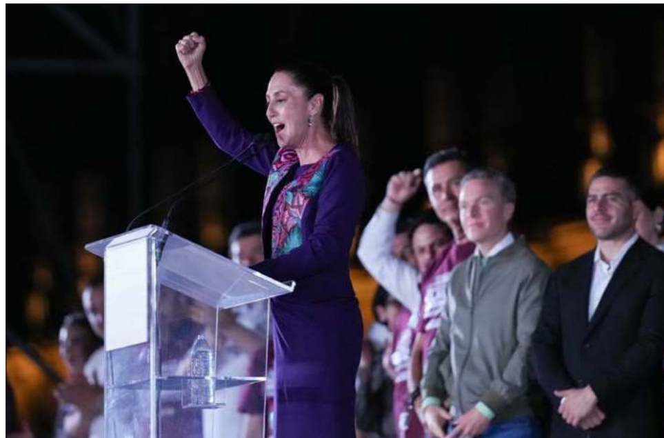
▲ Mandatarios del mundo y dirigentes de instituciones saludaron a la que será la primera presidenta de México, Claudia Sheinbaum, abanderada de Sigamos Haciendo Historia .

El primer ministro de Canadá, Justin Trudeau, hizo