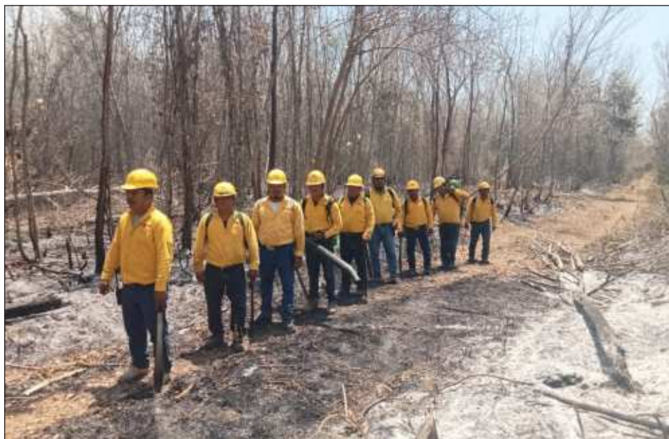
▲ El CEMF detalló que en Tulum el incendio se presentó en Los Tres Cenotes y a la fecha se registra una superficie afectada de 35 hectáreas, con 50% del fuego liquidado.

En Bacalar el siniestro se reportó en el norte de la comunidad de Caanán, teniendo a la fecha 20 hectáreas arbustivas afectadas con un control del 70 por ciento y liquidado en un 50 por ciento; informaron también que el lunes se liquidó otro incendio forestal en