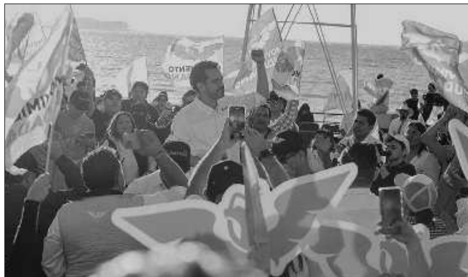
▲ La muestra de la fallida política de seguridad en el país y en dicha entidad son los “baños de sangre”, recriminó el candidato presidencial por MC.