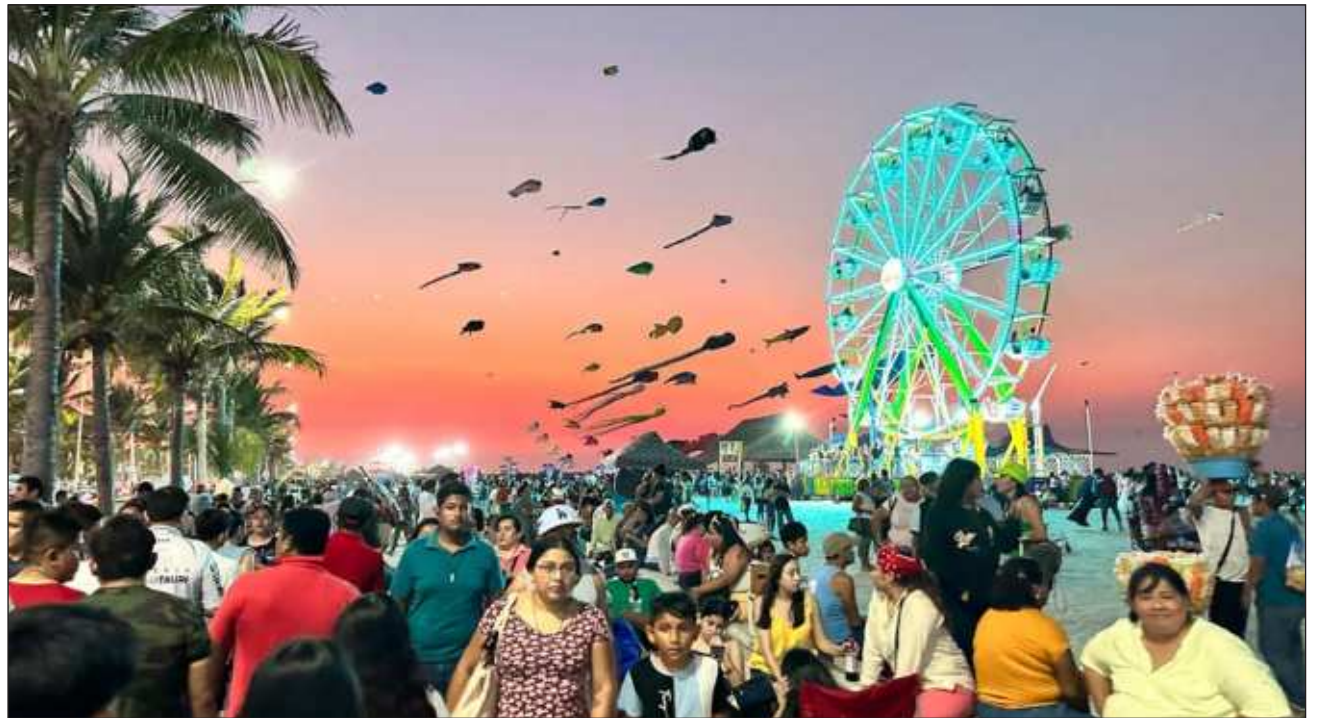
▲ Durante el fin de semana, las más de cinco mil habitaciones disponibles en la Isla resultaron insuficientes.