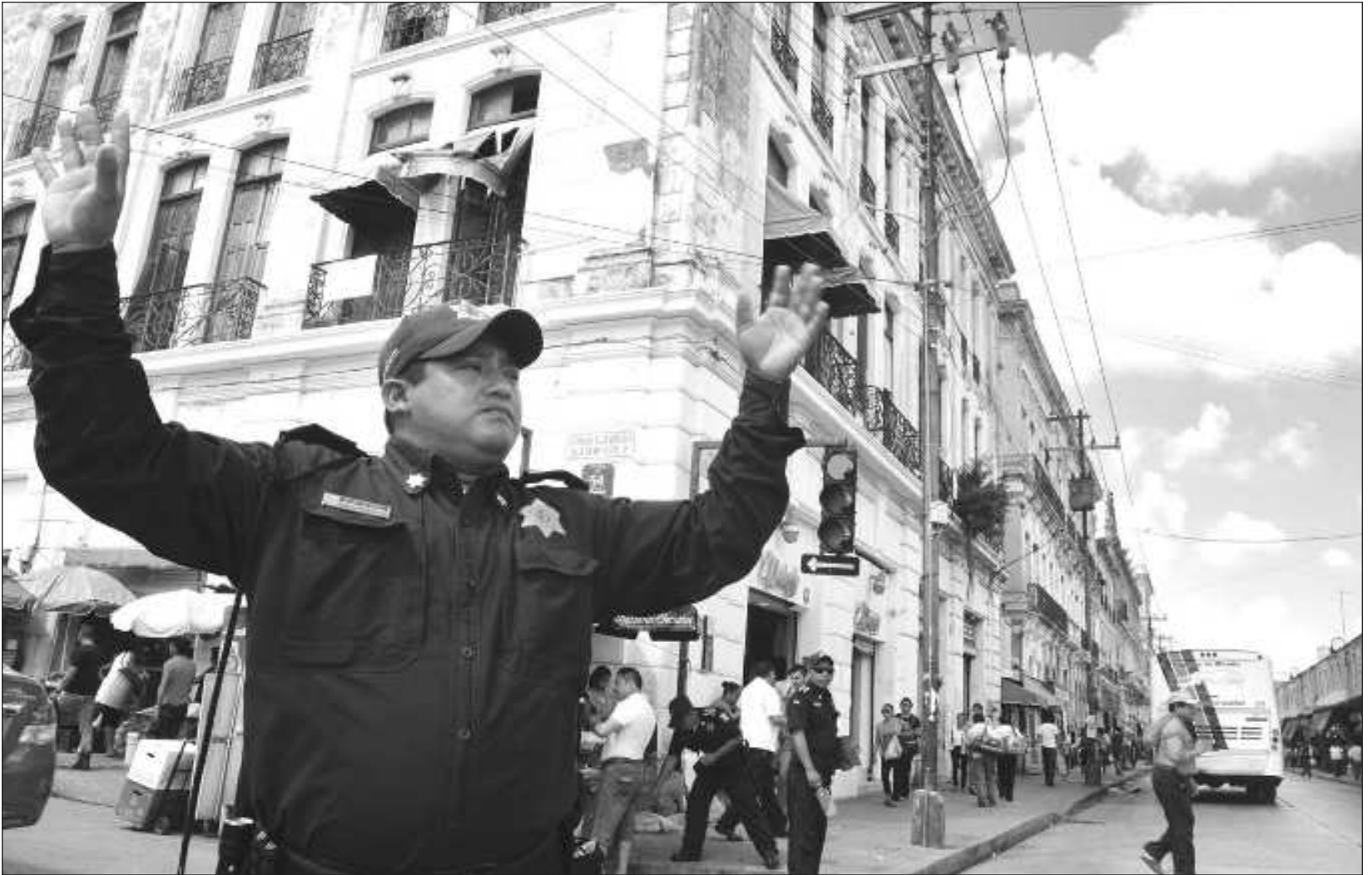
▲ Mediante el programa Yucatán Seguro, el gobierno del estado está dotando de equipamiento, tecnología y fuerte capacitación a la policía.