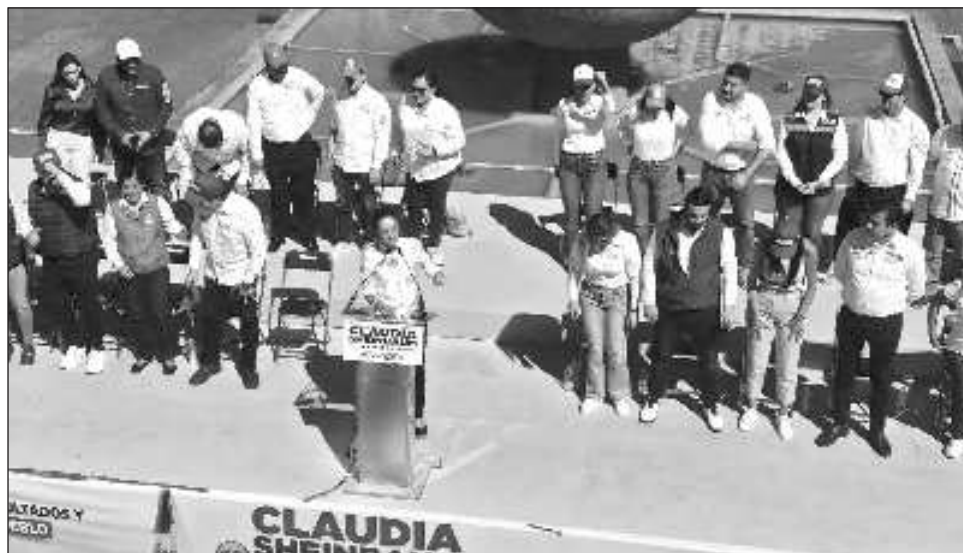
▲ La candidata presidencial morenista encabezó un mitin en la Plaza de la Liberación, donde se encuentra una estatua que representa la abolición de la esclavitud.

“Aquí es la plaza de la liberación, donde el padre de la patria decidió acabar con la esclavitud, rompió las cadenas, pues aquí se van a romper las cadenas de la corrupción en Jalisco y se van a seguir rompiendo las cadenas para que no re-