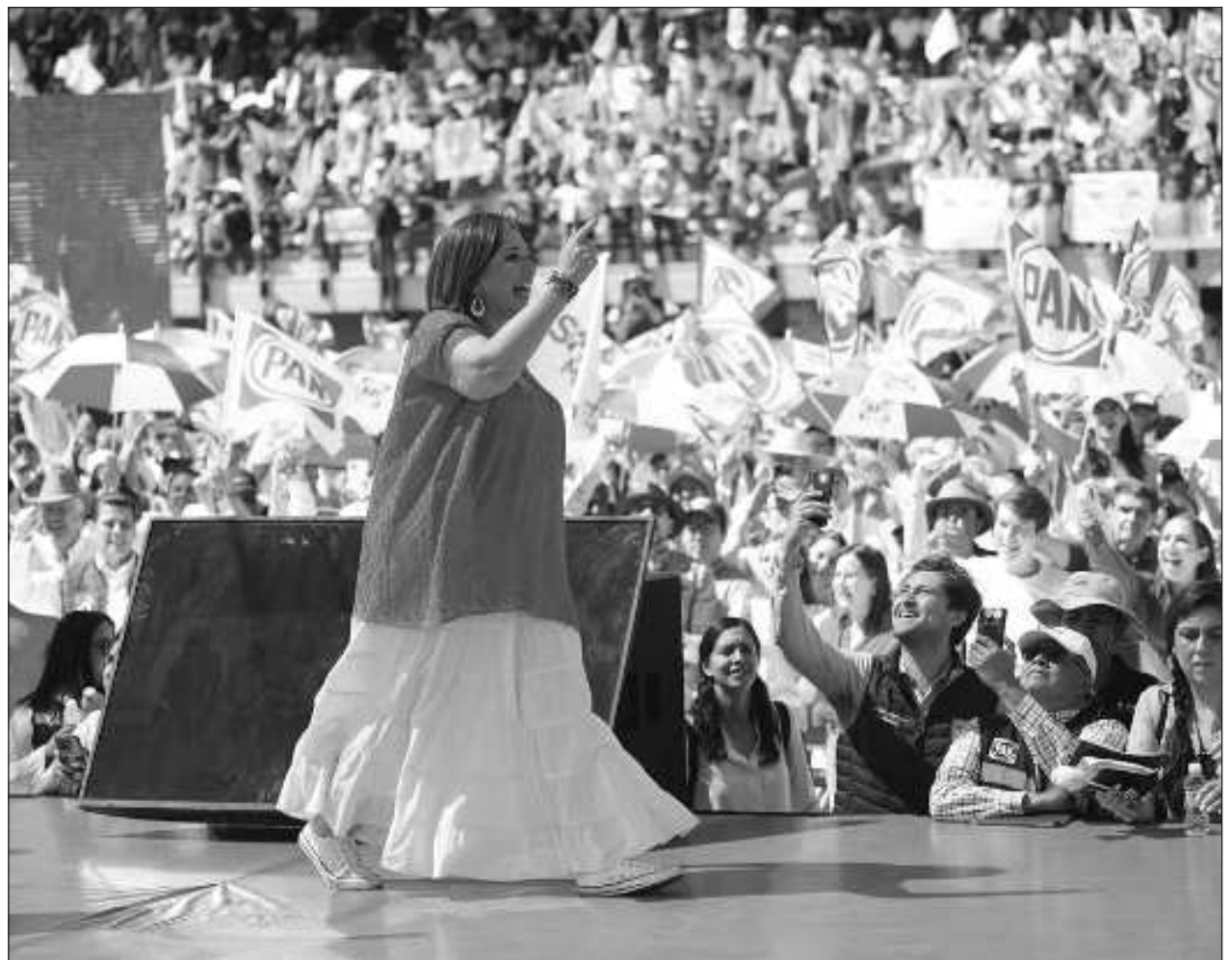
▲ La candidata presidencial de la coalición Fuerza y Corazón por México, sostuvo que la elección del 2 de junio es entre dos proyectos, pero aprovechó para insistir: "Morena representa el miedo, representa la muerte, representa el narco".

Gálvez Ruiz estuvo por la tarde del domingo en la sede del Comité Directivo Estatal del PRI en el estado de México. Este lunes ofrecerá conferencia de prensa en la Ciudad de México, antes de viajar a Yucatán.