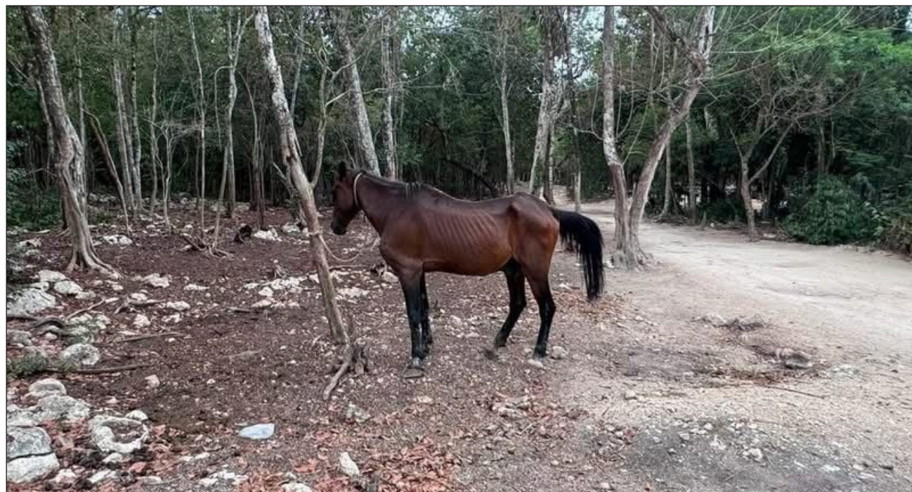
▲ Durante la diligencia en el parque Adrenaline Tours, las autoridades constataron que los caballos permanecían en condiciones inadecuadas, sin acceso suficiente a agua y alimento, además de presentar diversos problemas de salud.

La intervención se llevó a cabo luego de la difusión de una denuncia anónima que alertaba sobre crueldad animal