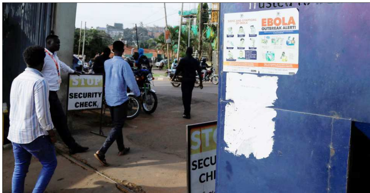
▲ Al 31 de mayo, la OMS registró 116 casos sospechosos del virus en la RDC, frente a 906 reportados la semana pasada.

El Ministerio de Transporte informó que las autoridades habían evaluado cómo se estaba vigilando el brote