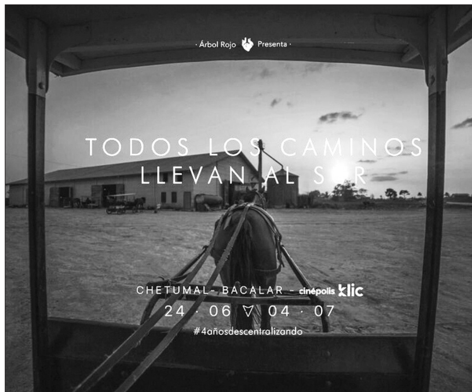
▲ Este año la apuesta es por una programación propia, con un catálogo que los represente.