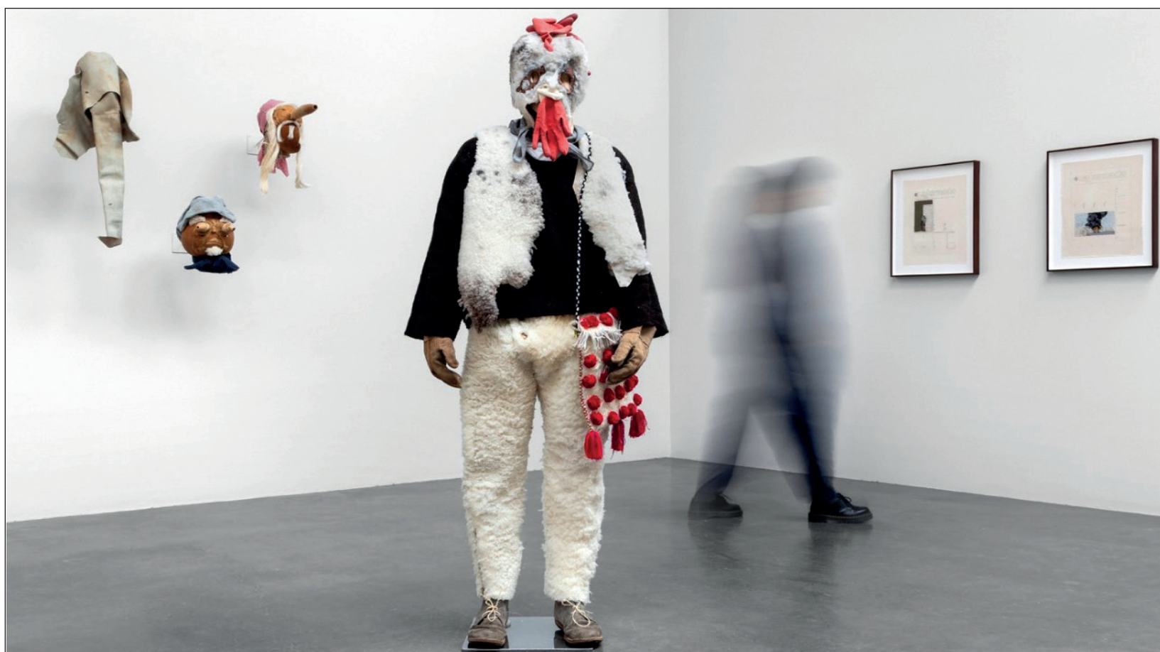
▲ Para Ortega, las portadas bordadas de La Jornada se volvieron una especie de calendario.

El artista Damián Ortega presenta serie que forma parte de la exposición Siembra 20