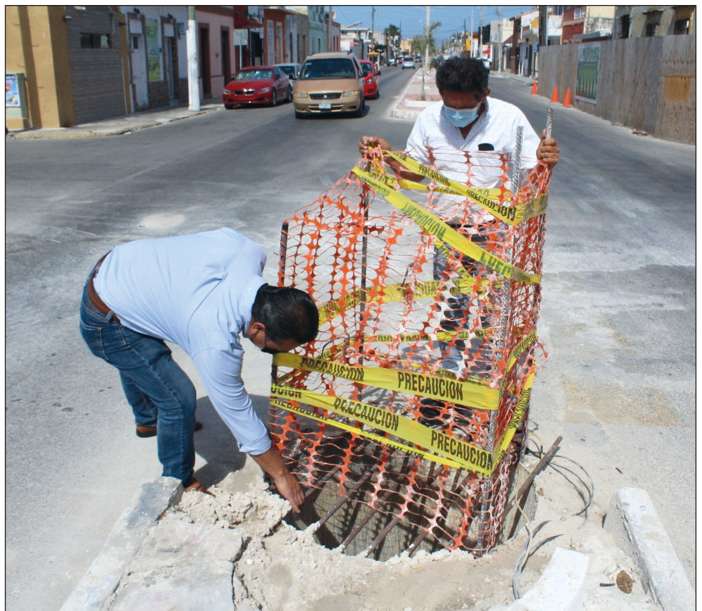
De acuerdo con el alcalde interino de Progreso, José Alfredo Salazar Rojo, las rejillas y pozos que se encuentren en malas condiciones serán atendidas rápidamente.

Finalmente, el Salazar Rojo externó: “la seguridad de los ciudadanos es prioridad para nosotros y tengan por seguro que estamos trabajando para que no se repita este incidente”.