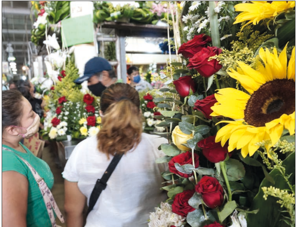
▲ Durante 2020, las ventas de todos los comercios fueron fuertemente afectadas por la pandemia de Covid-19 y el confinamiento masivo del segundo trimestre.

“Debido a que la celebración será el lunes se prevé que desde el fin de semana, 8 y 9 de mayo, empiecen a salir a festejar a las mamás, lo cual permitirá un mayor movimiento comercial, en sitios de esparcimientos y restaurantes”, destacó el organismo empresarial.