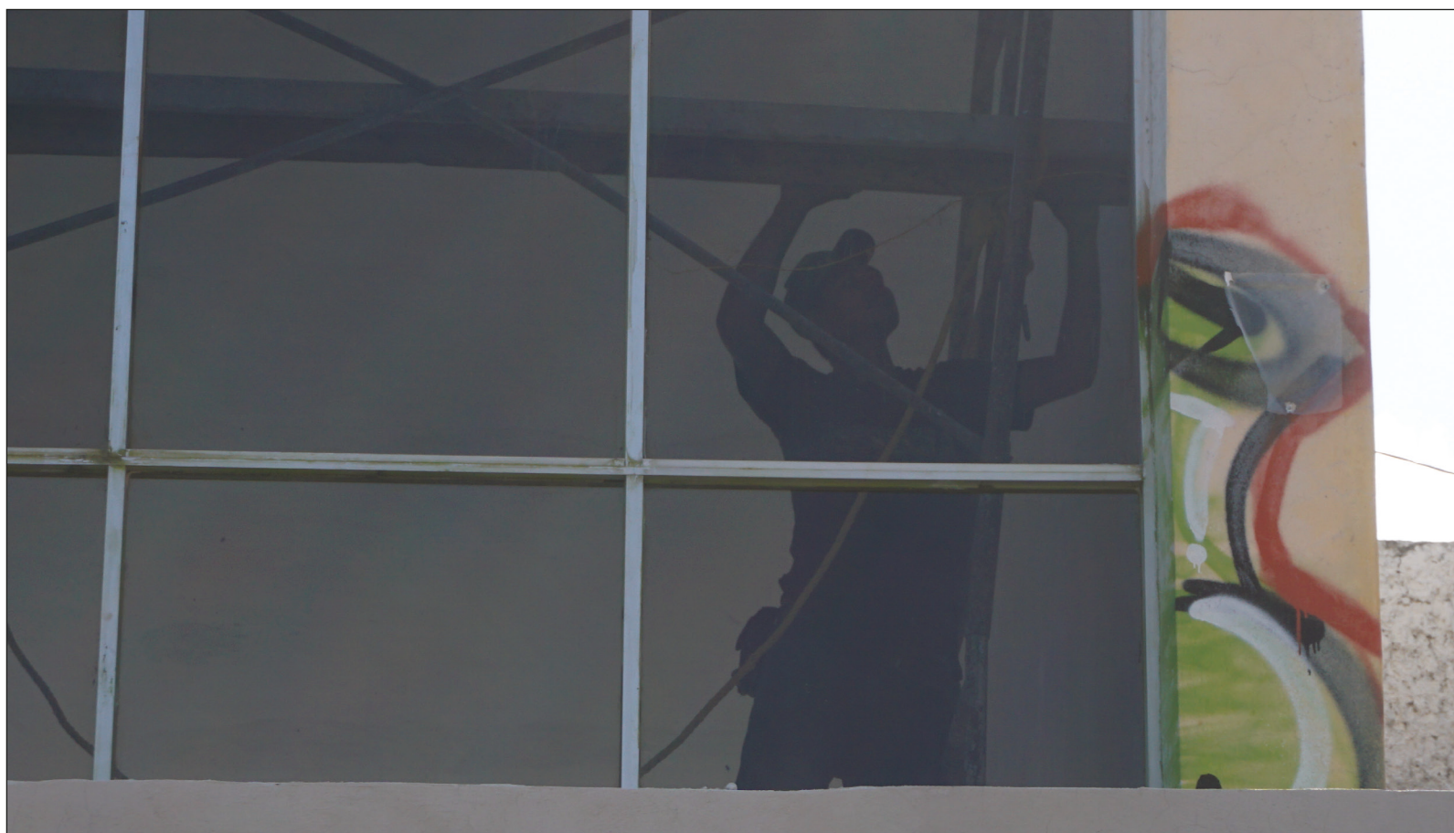
▲ El trabajo no es únicamente un medio para la producción de mercancías-objetos sino un fin en sí mismo deseado y buscado para su satisfacción.