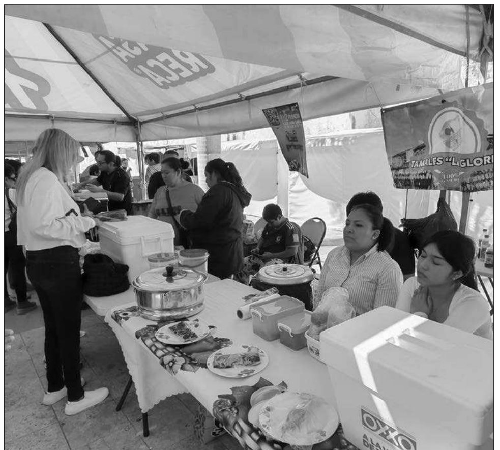
▲ Durante el festival, realizado en Ciudad del Carmen, participaron 40 tamaleros que presentaron tamales de elote, de masa colada, de xpelón, de mole, torteados, entre otros.

De esta manera se estima que los tamaleros logramos comercializar más de 13 mil tamales, en esta edición 2026 del Festival del Tamal.