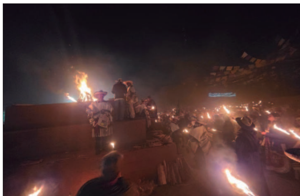
▲ De Santa Clara del Cobre, donde permanecieron las brasas de fuego durante un año, cientos de habitantes de esta región del municipio de Salvador Escalante partieron con el brasero a costas a Tingambato el 30 de enero por la mañana.

La caminata del fuego salió de Santa Clara rumbo a Iramuco, y de ahí a Santa Rita, Agua Verde, en la ribera del lago de Zirahuén, entre otros