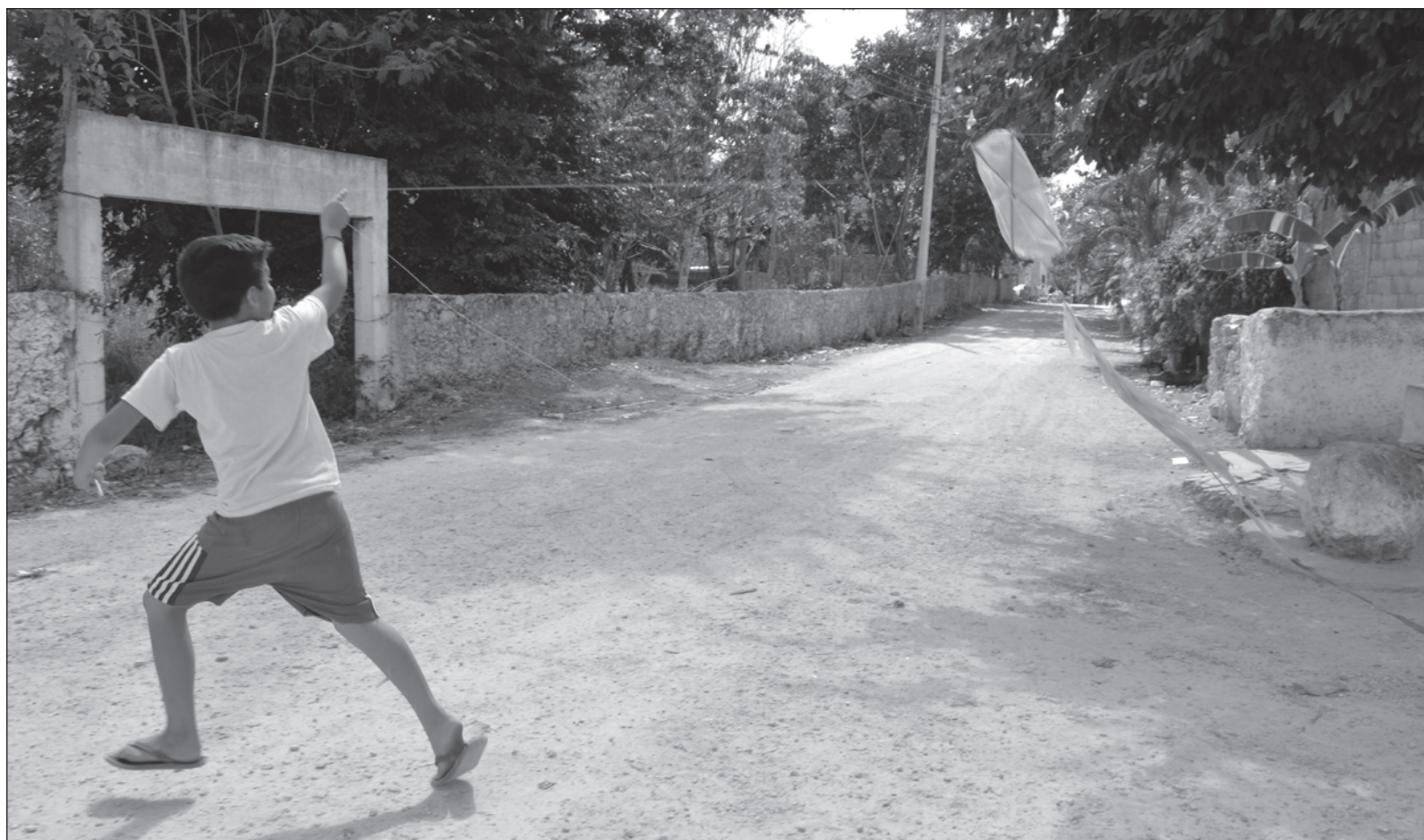
▲ “Aunque hablamos de acoso escolar, los estudiantes que acosan pueden haber aprendido las conductas agresivas fuera de la escuela”.