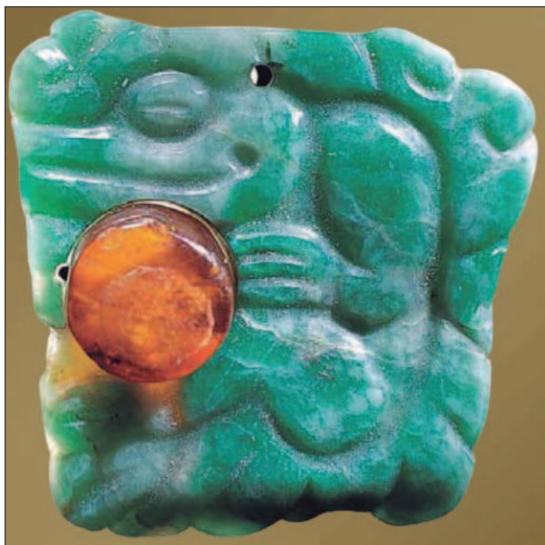
▲ "El ámbar del México prehispánico fue mucho más que un adorno, fue un producto comercial exclusivo que unió las montañas de Chiapas con importantes zonas arqueológicas mesoamericanas".

EN CUANTO A registros de ámbar en el área maya de la península de Yucatán, solamente tenemos reportes procedentes del informe preliminar de las exploraciones efectuadas al interior del Cenote Sagrado de Chichén Itzá por Piña Chan. Durante el dragado realizado en dicho cenote, se recuperaron piezas de ámbar que probablemente habían sido lanzadas como ofrendas. Algunas de estas piezas mostraban restos de copal, sugiriendo que el ámbar se utilizaba en conjunto con otras resinas aromáticas. Finalmente, y fuera del territorio mexicano se ha reportado en Kaminaljuyú (Guatemala) la recuperación de cuentas de ámbar en entierros de élite que datan del periodo Preclásico Tardío (400 a.C. - 200 d.C.), que lo convierte en un descubrimiento clave porque indica que las rutas comerciales del ámbar chiapaneco ya estaban establecidas siglos antes de la lle-