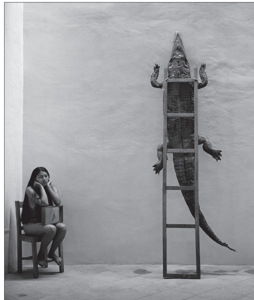
▲ Las fotografías de la maestra mexicana Graciela Iturbide combinan la observación documental con la reflexión personal.

En su página de Internet, C/O Berlín informa que uno de los ejes de la exhibición es la representación de la mujer y su papel en la sociedad. Los visitantes se encontrarán, entre otras obras, con