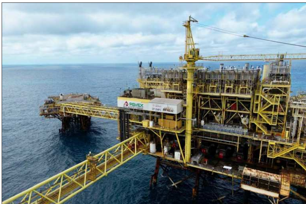
▲ Quien ocupe el gobierno de Campeche el próximo año tendrá que enfrentarse al mismo reto: que la relación de la entidad con Pemex se funde en la aportación que se ha hecho a la actividad petrolera.

Lo relevante, sin embargo, es que quien ocupe el gobierno de Campeche el próximo año tendrá que enfrentarse al mismo reto: que la relación de la entidad con Pemex se funde en la aportación que se ha hecho a la actividad petrolera. Ya de ahí, el respeto entre ambos actores debe resultar en el simple cumplimiento puntual de las obligaciones, especialmente el pago a proveedores y mantener los programas de Obras de Beneficio Mutuo y de Apoyo a Comunidades y Medio Ambiente.