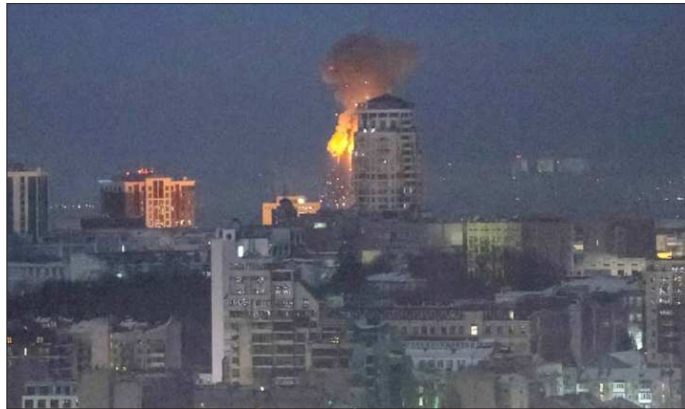
▲ Conversaciones se celebran poco antes de que se cumplan cuatro años de la ofensiva rusa.

De su lado, Zelensky dijo más tarde que una reciente “desescalada” con Rusia — una aparente referencia a una breve tregua en los ataques contra instalaciones