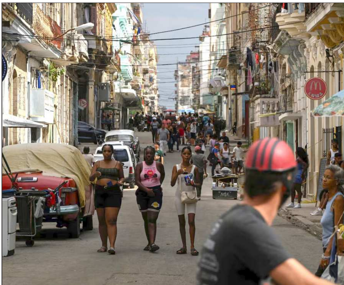
▲ “El imperialismo estadounidense intensifica el bloqueo económico para generar carestía en la isla, tratando de capitalizar la necesidad como un arma desmoralizante y contrarrevolucionaria. Es el mismo manual utilizado en otras naciones”.

Es claro que Trump busca generar una crisis interna en Cuba para luego, de manera cínica, hablar de una crisis humanitaria y así, según él, “justificar” una intervención directa. El imperialismo estadounidense intensifica el bloqueo económico para generar carestía en la isla, tratando de capitalizar la necesidad como un arma desmoralizante y contrarrevolucionaria. Es el mismo manual utilizado en otras naciones de Nuestra América y que también durante décadas han tratado de concretar contra la isla de la dignidad, pero es precisamente ahí donde han encontrado la resis-