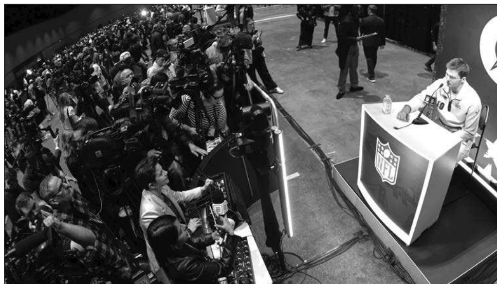
▲ Drake Maye, quarterback de los Patriots, durante la Noche de Apertura del Súper Tazón.

“Regresaremos a Ciudad de México en diciembre, lo cual creo que es maravilloso