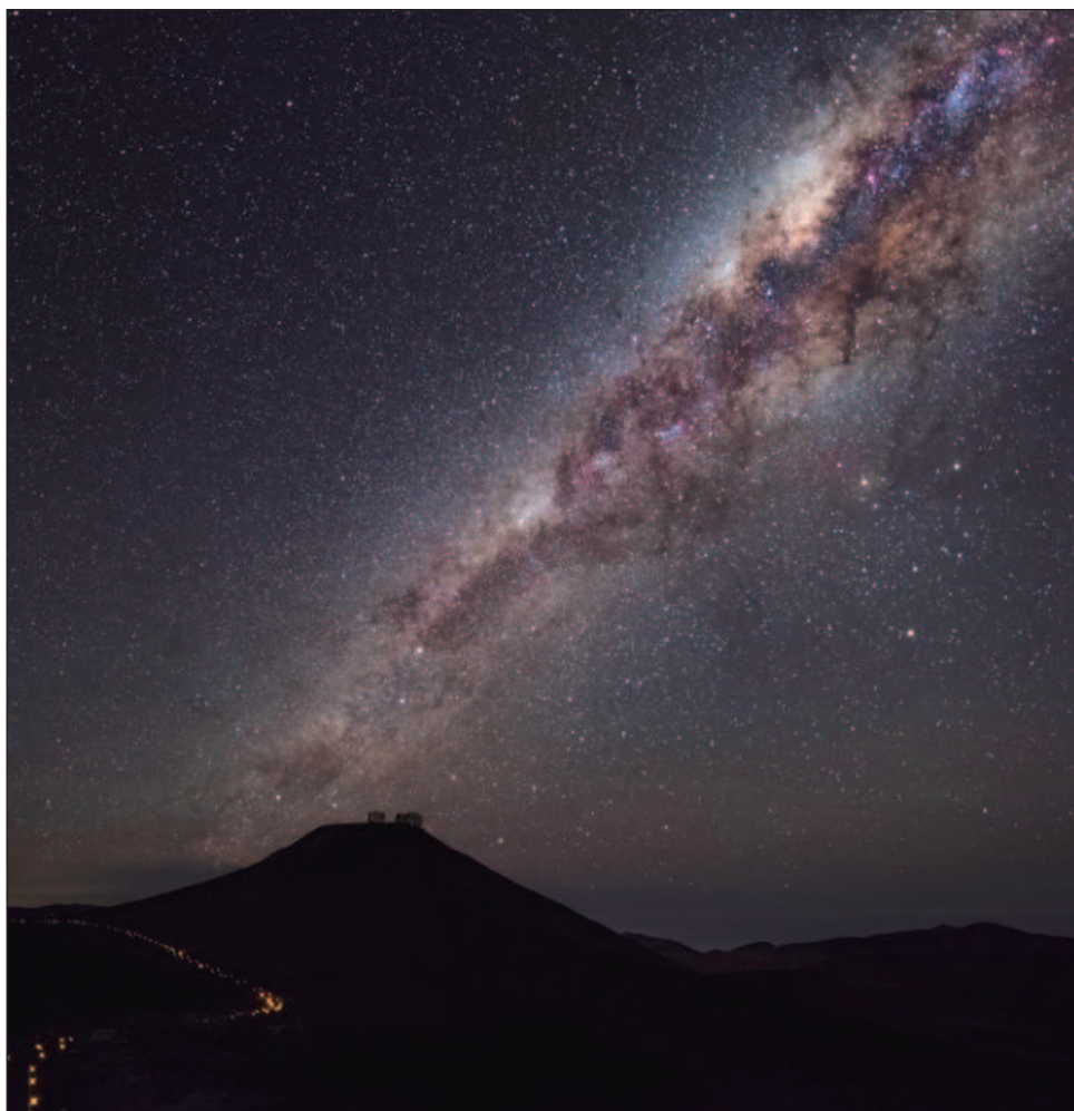
▲ El Paranal está situado a 2 mil 635 metros de altitud, lejos de la contaminación lumínica de las grandes ciudades, volviéndolo uno de los observatorios más productivos del mundo.

El proyecto empresarial también ponía en peligro el buen funcionamiento del Telescopio Extremadamente Grande (ELT), un proyecto colosal que está previsto que sea terminado en 2028.