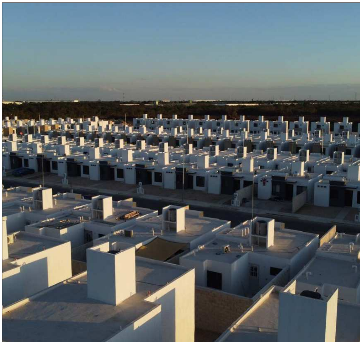
▲ “¿Quién decide cómo y hacia dónde crece Mérida? Aunque existen planes y normas, las decisiones reales responden más a la presión del mercado inmobiliario que a una visión estratégica”.