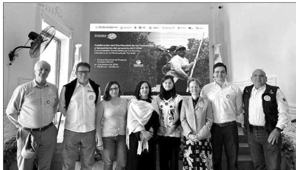
▲ La Conanp reconoció la importancia de los humedales como ecosistemas estratégicos para la conservación de la biodiversidad y el bienestar de la península de Yucatán.

En este contexto, la Conanp reconoció la importancia de los humedales como ecosistemas estratégicos para la conservación de la biodiversidad y el bienestar de las comunidades. Destacó su compromiso con la protección, el manejo sos-