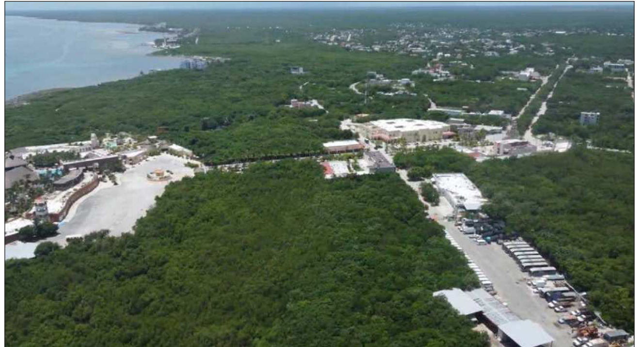
▲ La suspensión definitiva se da en un contexto donde ya se han documentado preocupaciones sobre presión sobre ecosistemas de manglar, impactos acumulativos por proyectos de gran escala e infraestructura ambiental insuficiente en la zona.

La suspensión definitiva -aclaró- es una medida cautelar reforzada que se concede cuando el juzgado advierte que existen elementos que respaldan la posible