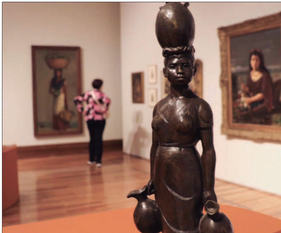
▲ El recinto busca aprovechar los reflectores del Mundial de fútbol que se celebrará en verano para mostrar una nueva faceta del arte del país.

“Con México: Ruta y destino nos basamos en la gran pluralidad de identidades y culturas que tenemos en el territorio nacional. Queremos que los visitantes internacionales vean lo que significa habitar nuestro país, romper los estereotipos de que somos ‘un lugar paradisíaco’ o ‘una tierra llena de problemas y violencia’. No somos lo que queremos ser, pero tampoco un fracaso o una tragedia.”