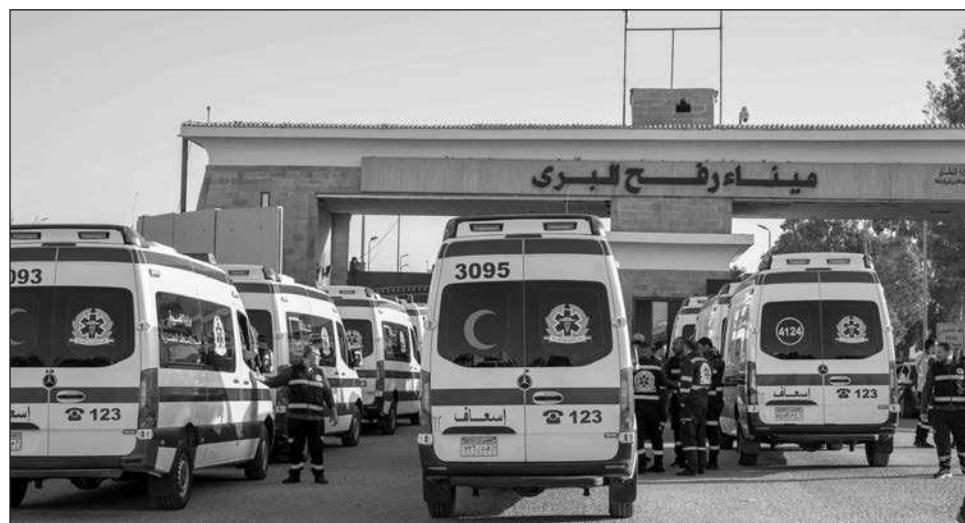
▲ El cruce cerrado desde 2024 -único paso entre Gaza y el mundo exterior que no pasa por Israel- reabrió este lunes en ambas direcciones, pero bajo condiciones muy estrictas.