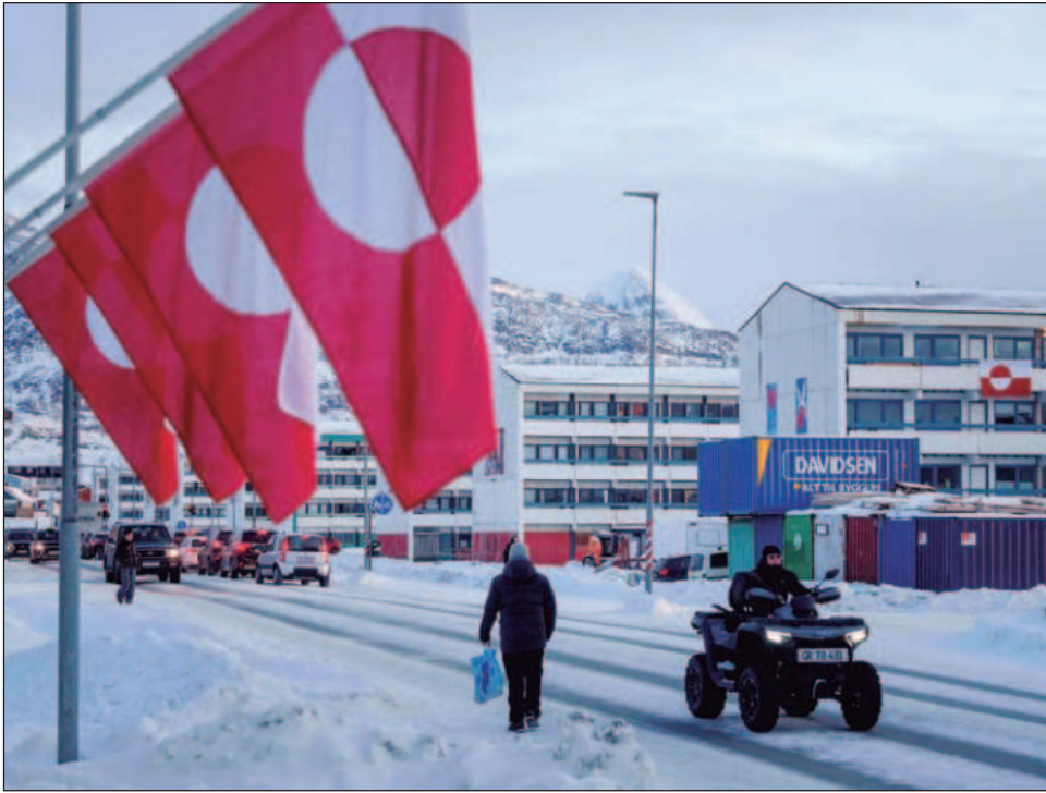
▲ Trump intensificó sus llamamientos a favor del control estadounidense sobre Groenlandia a principios de año, alegando motivos de seguridad nacional relacionados con Rusia y China.

El mandatario ha renunciado a las amenazas de usar la fuerza militar sobre la isla ártica