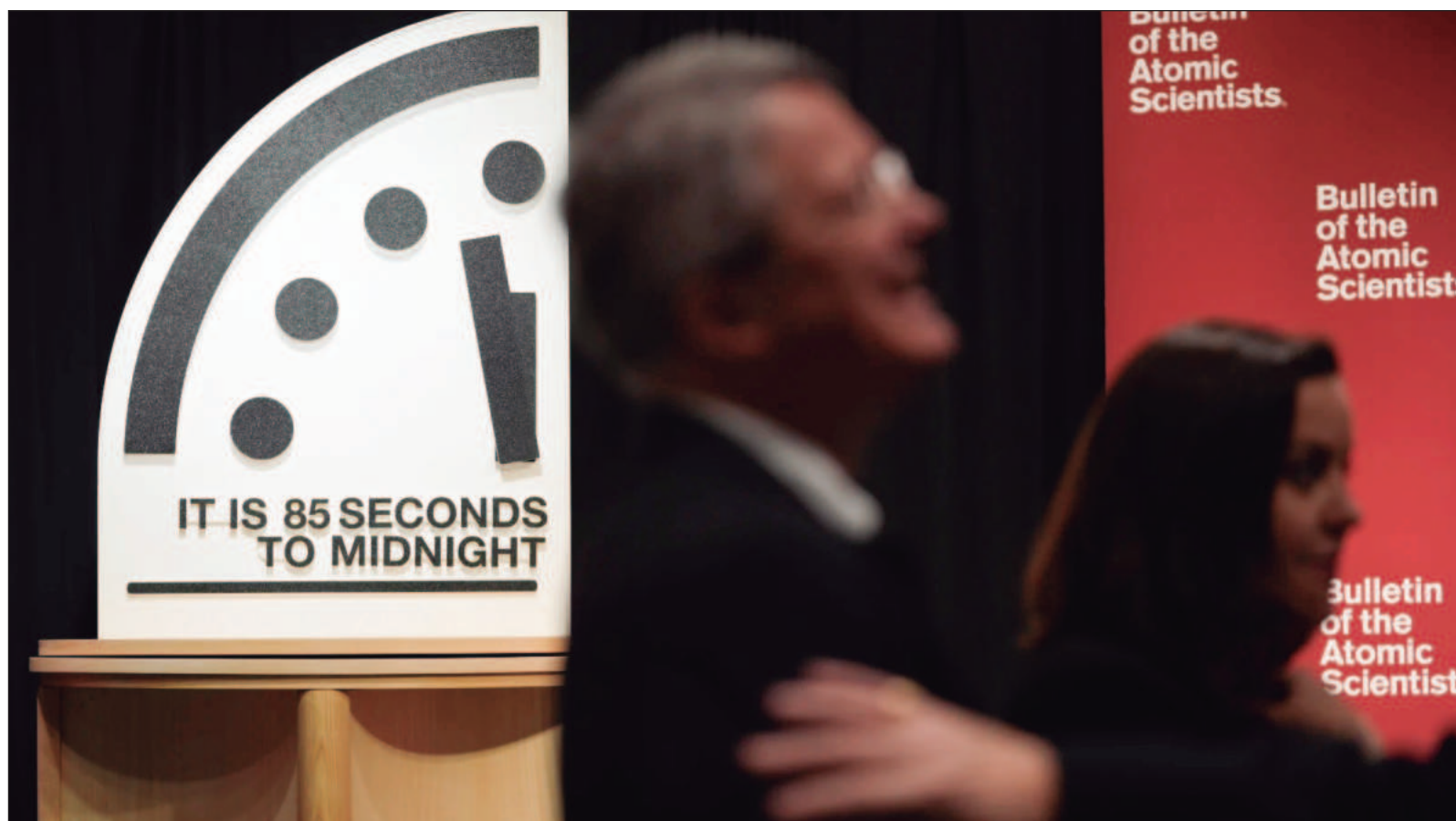
▲ "Nunca se había anunciado un tiempo tan cercano para el Juicio Final. Las causas son el calentamiento global, amenazas biológicas como posibles pandemias y pérdida de biodiversidad, tecnologías disruptivas como la inteligencia artificial (...) y por supuesto las amenazas de guerras".