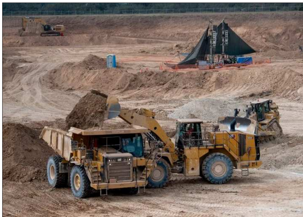
▲ Frisco, de Carlos Slim, dueño de grandes conglomerados como Grupo Carso y América Móvil, con un aumento de 73 por ciento en un mes, está en tercer lugar.

Durante este enero, el valor de 4 mineras mexicanas se disparó 25 por ciento, equivalente a 433 mil millones de pesos, reporta la BMV