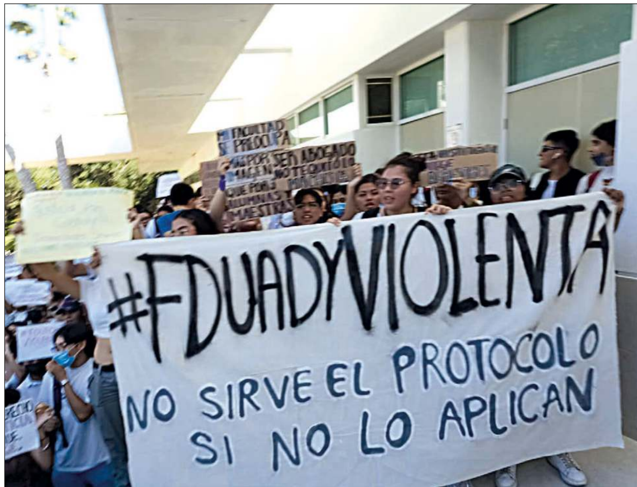
▲ En la denuncia, la docente alegó que un funcionario le causó daño a su estima, integridad y estabilidad laboral, pues la acusó sin pruebas y la amenazó con no renovar su contrato laboral, esto llevó a protestas.

Inició entonces dos procedimientos de tipo administrativo-laboral, uno por