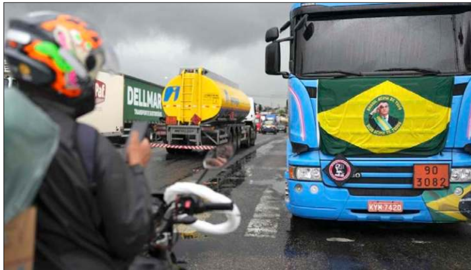
▲ Algunos camioneros han publicado videos en los que pedían un golpe militar para impedir que Lula, un izquierdista que fue presidente de Brasil entre 2003 y 2010, asumiera el cargo.

Se esperaba que el discurso presidencial calmara las protestas de partidarios que han bloqueado carreteras