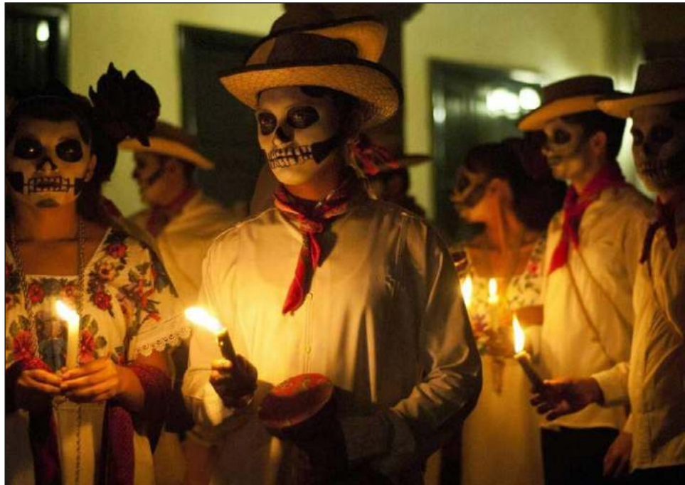
Con motivo de los festivales Xibalbá y Janal Pixan , miles de turistas recorrieron la exposición de altares y ofrendas que realizaron los negocios de Tulum.

Destacó que negocios como restaurantes, hoteles, tiendas de artesanías y bares, entre otros comercios instalaron más de 85 altares y 10 megaofrendas. Esta es la novena edición de este proyecto que inició en 2014 gracias a un esfuerzo 100 por ciento de