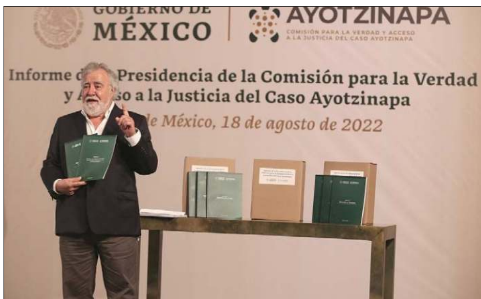
▲ El mandatario sostuvo que pese a la poca fiabilidad de esas capturas de pantalla, las autoridades seguirán haciendo averiguaciones a fin de fortalecer la investigación.