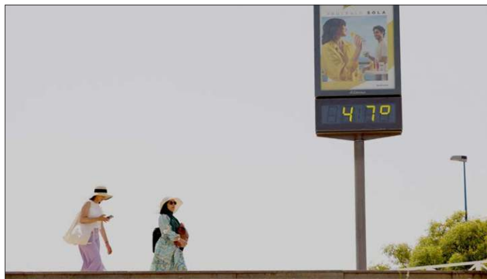
▲ Entre 1992 y 2013, los periodos de calor extremo costaron cerca de 16 billones de dólares a la economía mundial; para los países pobres este costo representa 6.7% del PIB anual.

Entre 1992 y 2013, los periodos de calor extremo costaron cerca de 16 billones de dólares a la economía