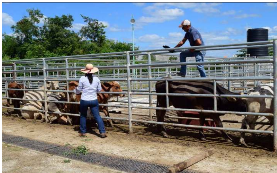
▲ Brigadistas del Inegi alegan la poca participación de los campechanos en el censo, en especial por la desconfianza de los campesinos a proporcionar datos a personas desconocidas.

Por el momento coadyuvan para que el censo