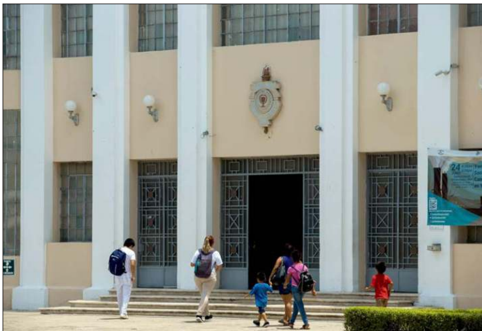
▲ El programa educativo de la UADY recibió doble acreditación: una por el Comaem y la otra por la Federación Mundial para la Educación Médica.

La Facultad de la UADY sería la segunda institución de educación superior en obtener esta certificación internacional de la región sureste del país.