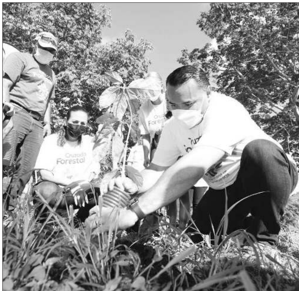
▲ “Es importante que los responsables de desarrollar las políticas públicas basadas en la sostenibilidad y la sustentabilidad estén actualizados en los retos que enfrentan otras ciudades”, declaró el alcalde Renán Barrera.

Aunque las ciudades ocupan tan sólo 2 por ciento de la superficie del planeta, representan más de 60 por ciento del consumo mundial de energía, 70 por ciento de las emisiones de gases de efecto invernadero y 70 por ciento de la generación de desechos.