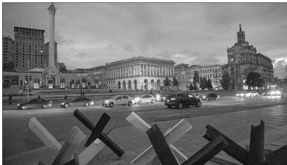
▲ El alcalde de Kiev avisó de que persistirían algunos cortes de luz programados en la ciudad, debido al déficit en el sistema eléctrico después de los "salvajes ataques" de Rusia.

El ejército de Ucrania informó de que Rusia lanzó el lunes 55 misiles de crucero y decenas de proyectiles más en todo el país.