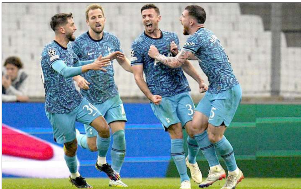
▲ El Tottenham de Antonio Conte logró su boleto a los octavos de final con un triunfo ante Marsella.

El club francés tenía que ganar para avanzar a la fase