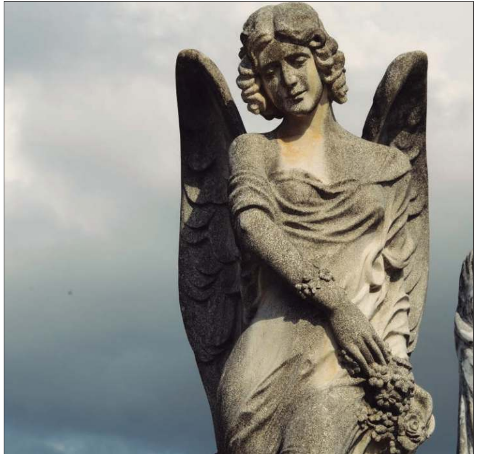
La Muerte en Xcoholté se llevará a cabo este viernes 4 de noviembre a partir de las 19:30 horas en el Cementerio General de Mérida; será un evento gratuito.

La conferencia la impartirán cuatro estudiantes de la licenciatura en Historia de la Facultad de Ciencias Antropológicas de la UADY; y otros de sus compañeros ambientarán todo lo que ellos digan con la ayuda de luces y sonidos.