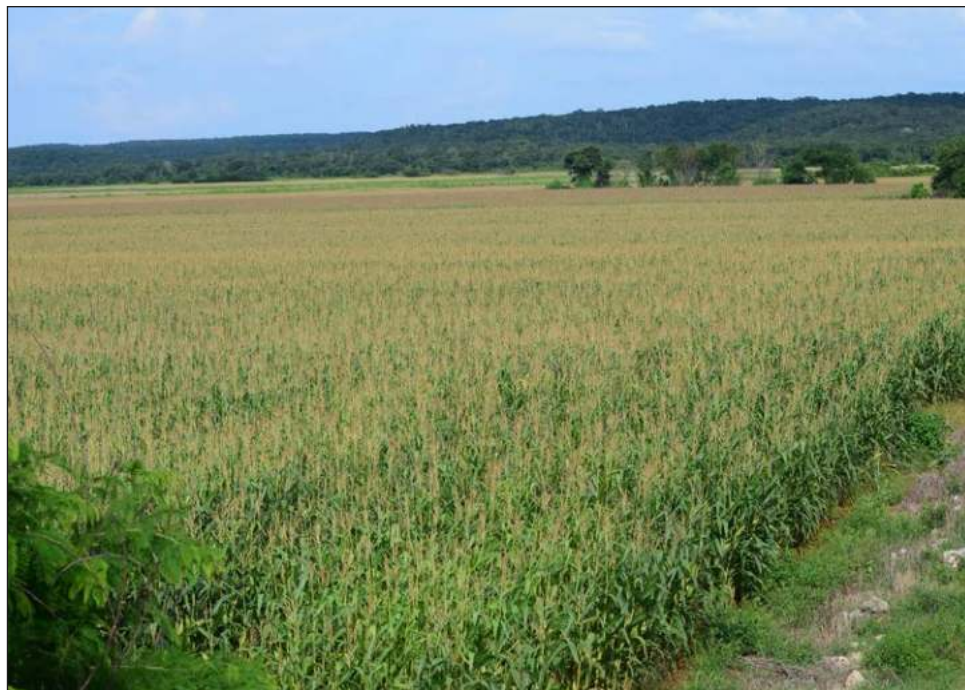
▲ A la fecha se han vendido 5 millones 294 mil 556 hectáreas en todo el territorio nacional, sobre todo de zonas de riego, turísticas y de expansión urbana.

Con los cambios al artículo 27 de la Constitución mexicana en 1992, durante el gobierno Carlos Salinas de Gortari (1988-1994), se puso fin al reparto agrario; se autorizó el aprovechamiento por parte de terceros de las tierras ejidales y comunales, la transmisión de los derechos parcelarios, así como la adquisición del dominio pleno de las parcelas para que se puedan convertir en propiedad privada y venderse.