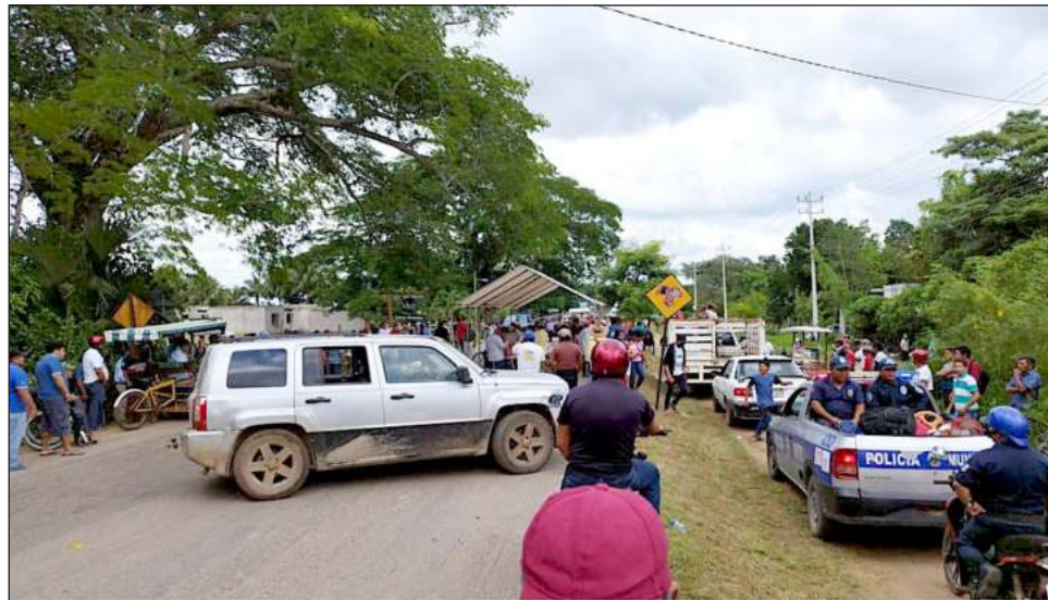
▲ El bloqueo de los ejidatarios afectó decenas de tours; algunos turistas optaron por caminar hasta el muelle para poder cruzar a la isla.

El pasado 16 de octubre los ejidatarios realizaron el primer bloqueo, y tras la mediación del gobierno estatal y para no afectar al turismo que cruza hacia Holbox decidieron levantarlo, no sin antes establecer acuerdos que deberían cumplirse en un lapso de dos semanas; es decir, el lunes 31 de octubre deberían haber recibido una respuesta de la CFE, lo que no ocurrió.