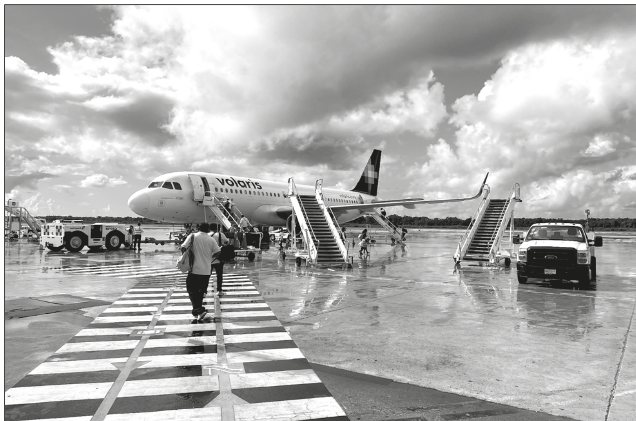
▲ Las cancelaciones se deben a los ajustes operacionales por la reducción de horarios de aterrizajes y despegues para la temporada invernal implementada en el Aeropuerto Internacional de la Ciudad de México.

de usuarios han asegurado que esta no es la primera vez que ocurre esta situación; la aerolínea les cambia su día de viaje, sin costo adicional, así como 25 por ciento de bonificación en crédito electrónico para futuras compras, pero sin considerar en muchos casos los gastos que esto les representa.