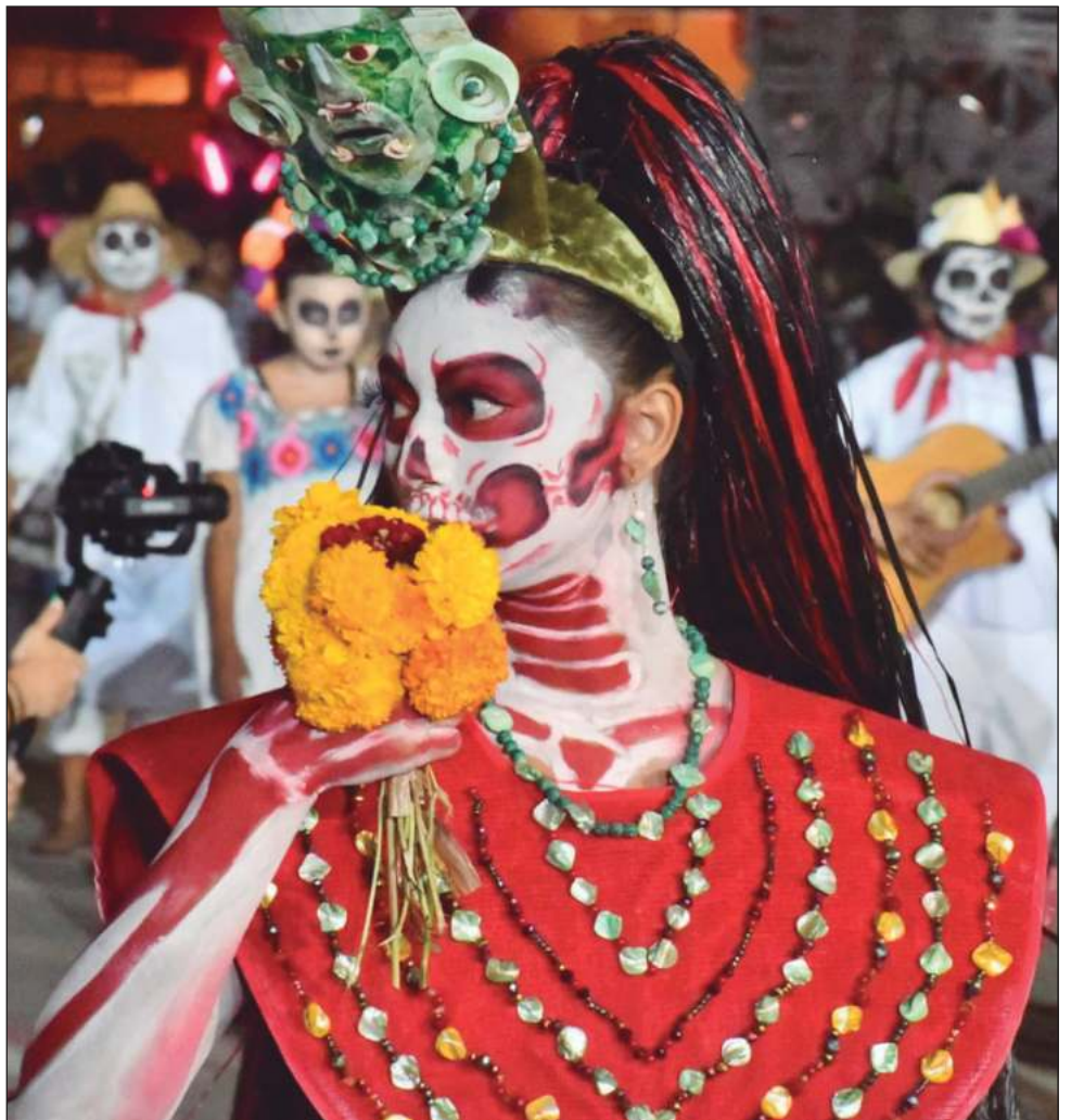
Los pomuchenses presenciaron un desfile de grupos caracterizados como catrines, así como otros personajes de la cultura local.

Transporte hubo de Campeche a Pomuch y viceversa toda la noche, los negocios fueron abarrotados por visitantes y locales; el pueblo es conocido por ser un pueblo panadero, las filas eran hasta de 100 personas.