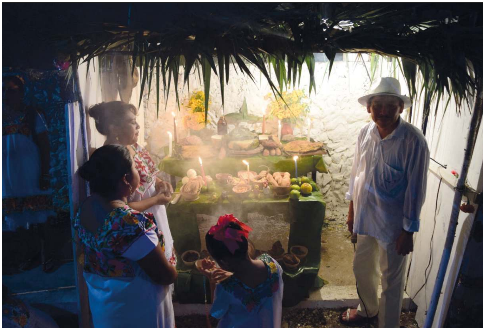
"Se cree que todos los que recuerdan con amor las almas de los difuntos en esta tierra recibirán protección de ellos en este mundo".

Esta tradición permite mantener viva la ilusión de las y los seres queridos, así como la de quienes aún están con vida para crear esa conexión y alimentarles "y saborear junto con ellos nuestros sagrados alimentos".