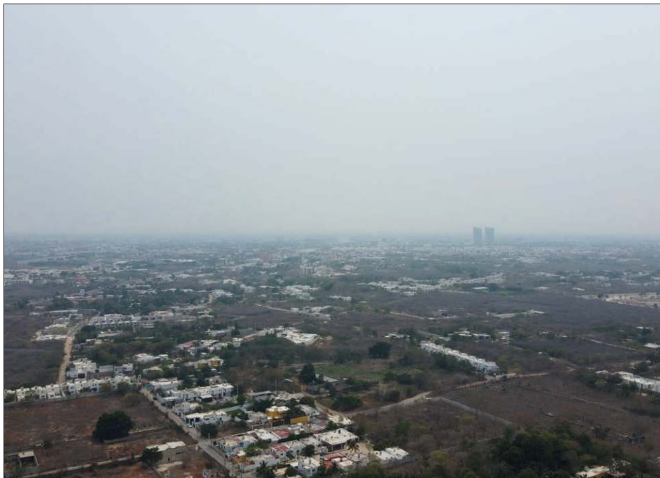
▲ El director en jefe del Registro Agrario Nacional consideró que es necesaria una nueva legislación en materia agraria, “porque nos enfrentamos a una (la que está vigente) que tiene en la mira privatizar y abrir el ejido al mercado de la tierra.