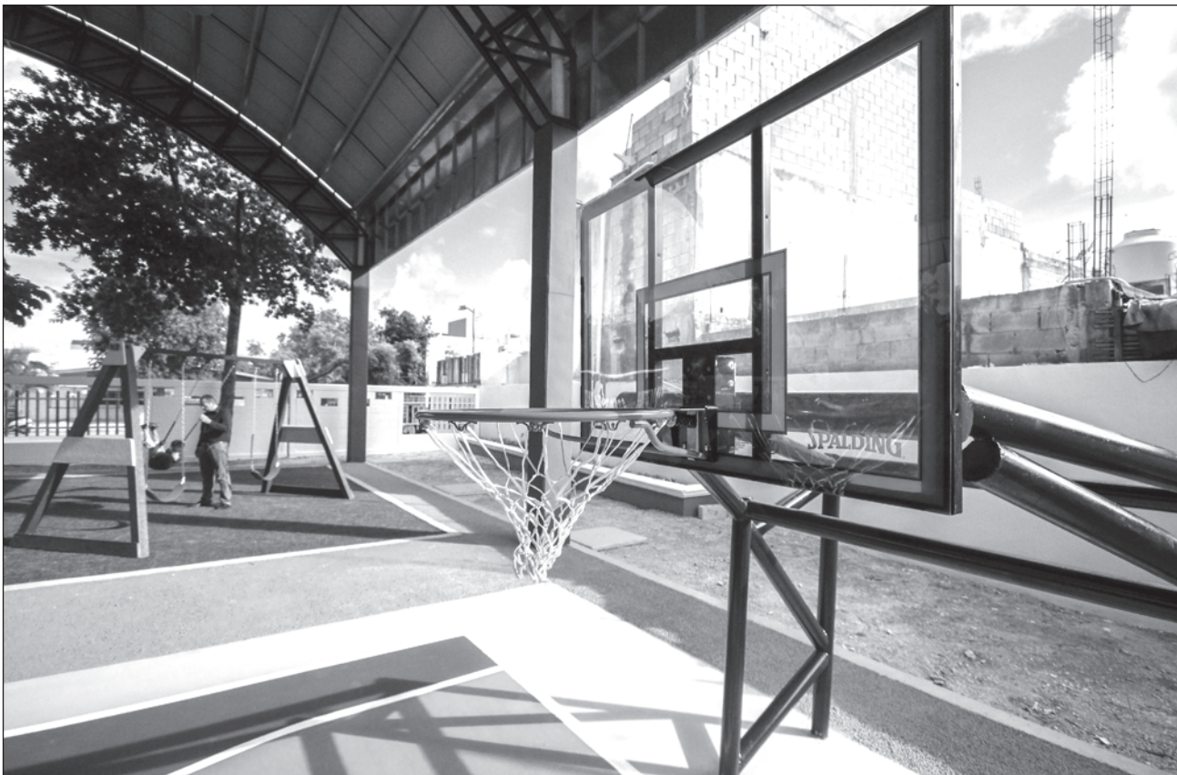
▲ Cuando no hay motivación para realizar actividad física, los niños terminan perdiendo el interés.

La sicóloga aconseja que para hacer un poco más amigable este proceso de cambio, para los niños y adolescentes, es importante que los papas vayan estructurando nuevamente ciertas rutinas, para hacer crecer la confianza y seguridad en el estudiante. "Y, también, trabajar la empatía no solamente de los papás hacia el niño, sino de los papás hacia los maestros y viceversa", concluye.