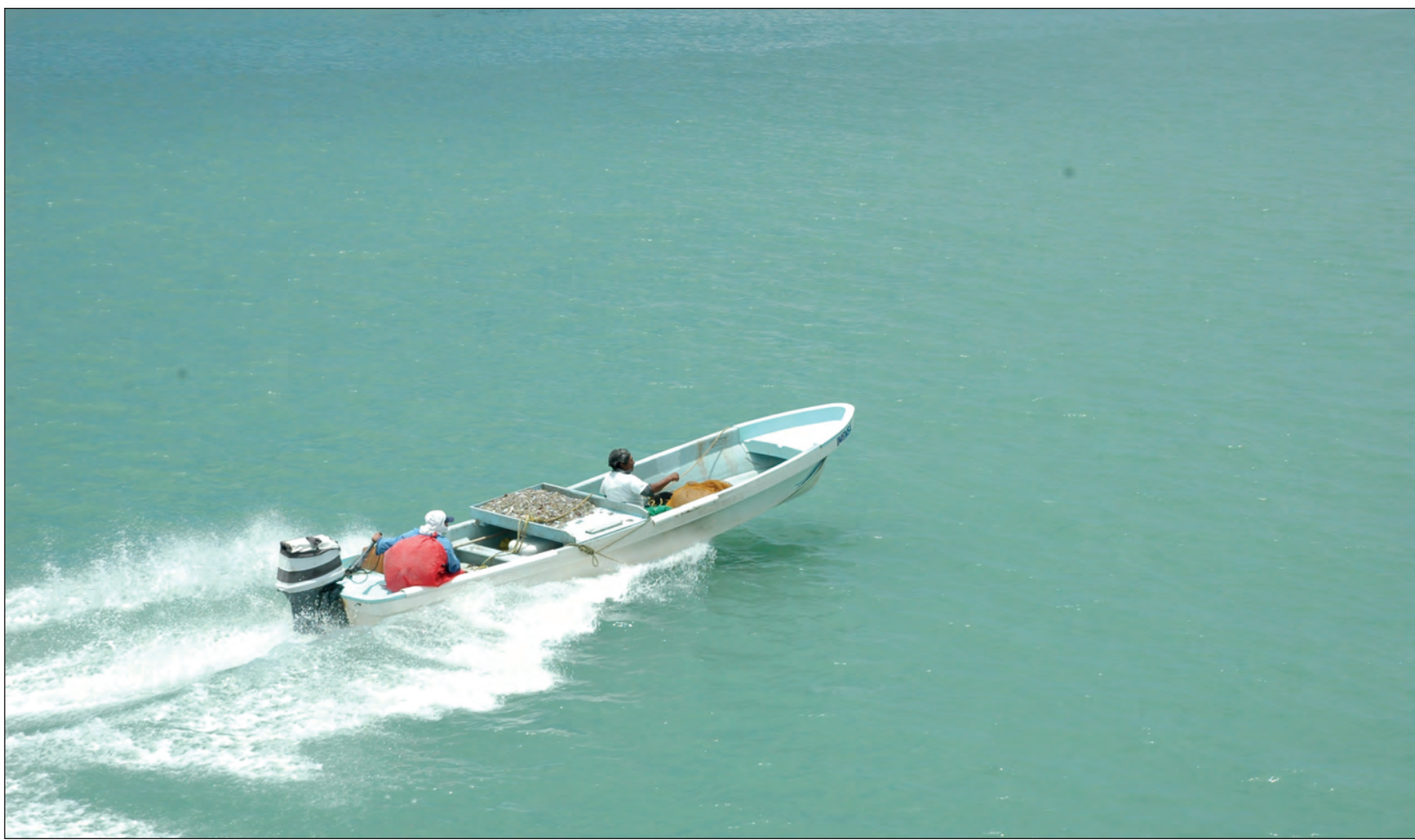
▲ San Pedro González Telmo es patrono del municipio de Progreso y los hombres de mar.