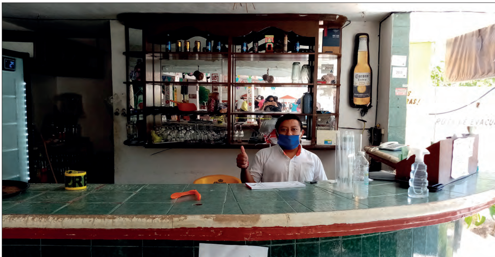
▲ A partir de julio, las autoridades acudieron a una serie de esfuerzos conjuntos con el sector empresarial para reactivar la economía y no quedarse exclusivamente con medidas de contención.

Síguenos en: http://orga.enesmerida.unam.mx/ ; redes sociales: https://www.facebook.com/ORGACovid19/ ; https://www.instagram.com/orgacovid19/ ; https://twitter.com/ORGACOVID19/