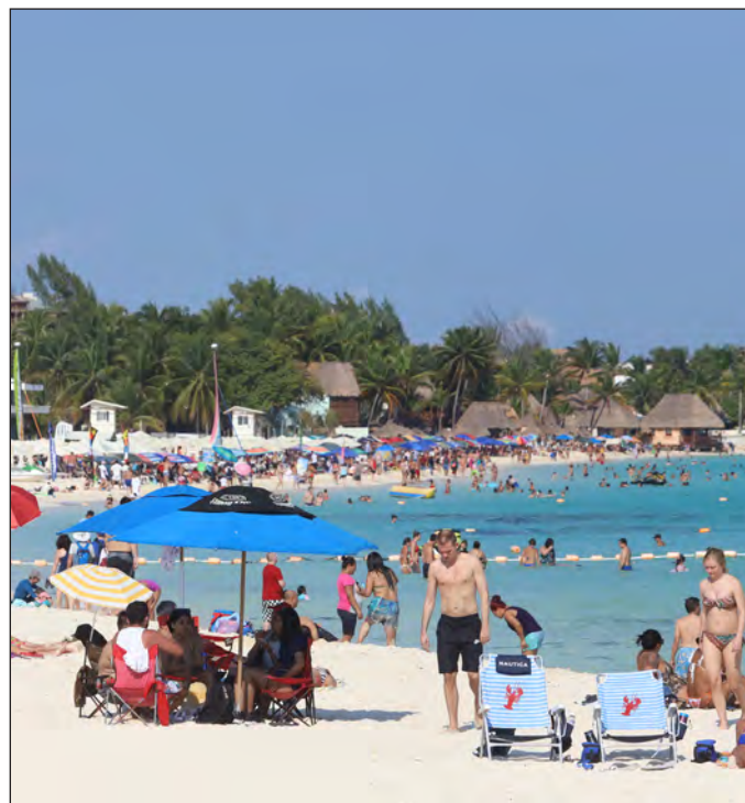
▲ El modelo de turismo excluyente prosperó gracias a la ausencia del Estado, porque se creyó que el mercado lo regula todo.

Pero para este caso, el efecto del decreto es el mismo: la población tiene el absoluto derecho de ingresar al escaso recurso que es la playa. El conflicto es con la propiedad privada y especialmente con el modelo turístico que vende sol, playa y aguas azules para el disfrute exclusivo/excluyente de quien puede pagar por unas cuantas noches de hospedaje. Ese modelo es el que impuso que en 25 kilómetros de la zona hotelera de Cancún haya apenas 10 accesos públicos a las