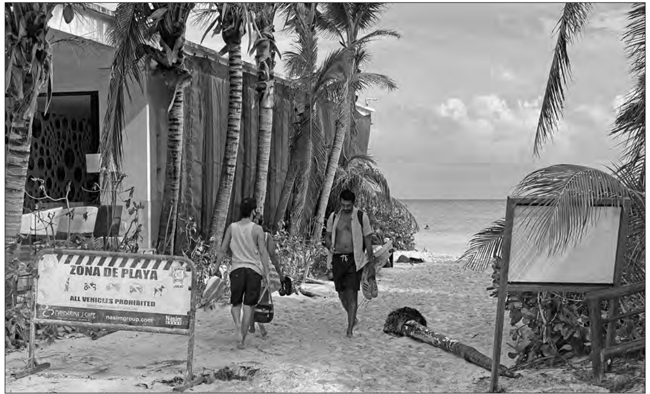
▲ Para el organismo turístico, es indispensable promover que los ayuntamientos habiliten las ventanas al mar en términos de la ley.

Sin embargo, para el organismo turístico “es indispensable promover que los