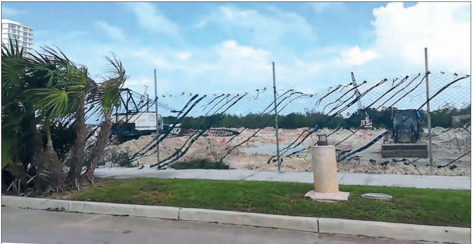
▲ Desde la creación de Cancún, residenciales, marinas y hoteles redujeron la posibilidad de ingresar a las playas.

A Tortugas le siguen: Caracol, Gaviota Azul, Chac Mool, Marlin, Ballenas, Delfines y Coral Negro, casi todos con las mismas problemáticas, pocos espacios de estacionamiento (si es que los tienen), sin baños públicos o cobros por el ingreso y prácticamente todas muy alejadas de la ciudad, por lo que es imposible como local no gastar una buena parte de la quincena si se quiere pasar un día en la playa.