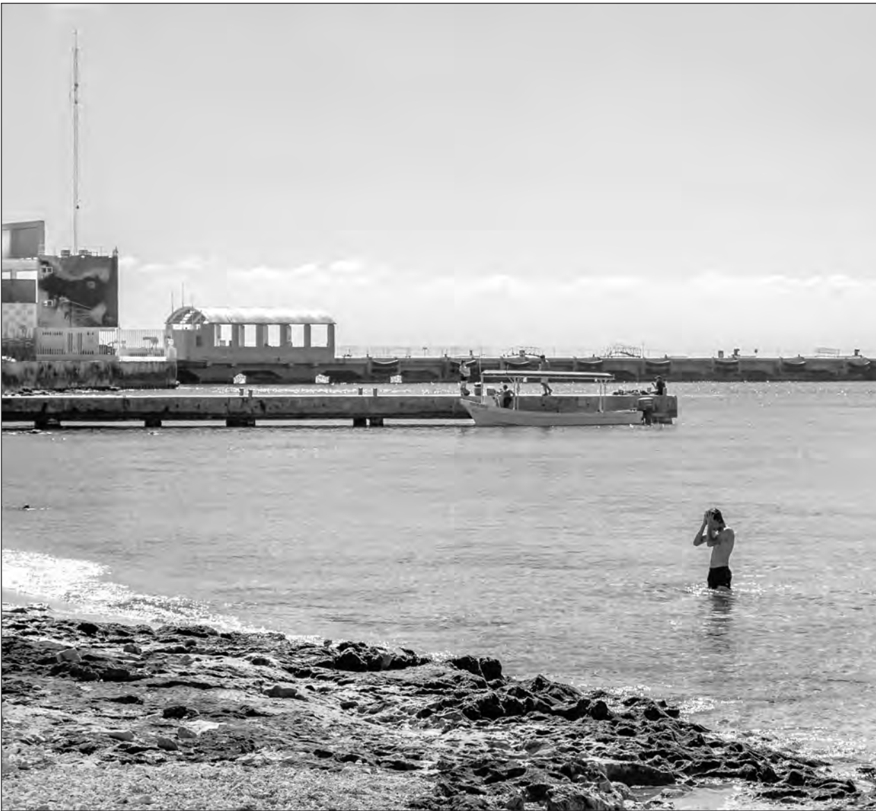
▲ Actualmente, los concesionarios tienen derecho a 20 metros mar adentro.