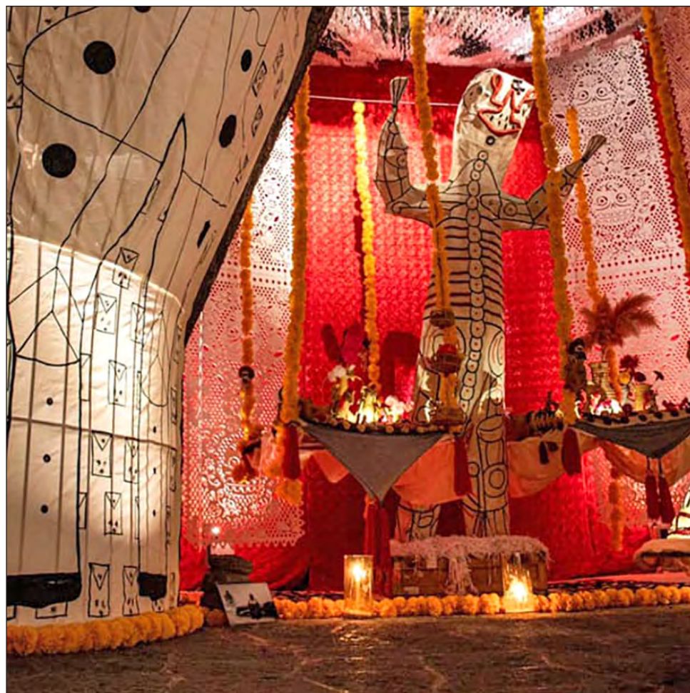
▲ El altar del Museo Diego Rivera-Anahuacalli giró en torno a Diego Rivera y Frida Kahlo, así como a la tradición de los Judas de la Semana Santa.