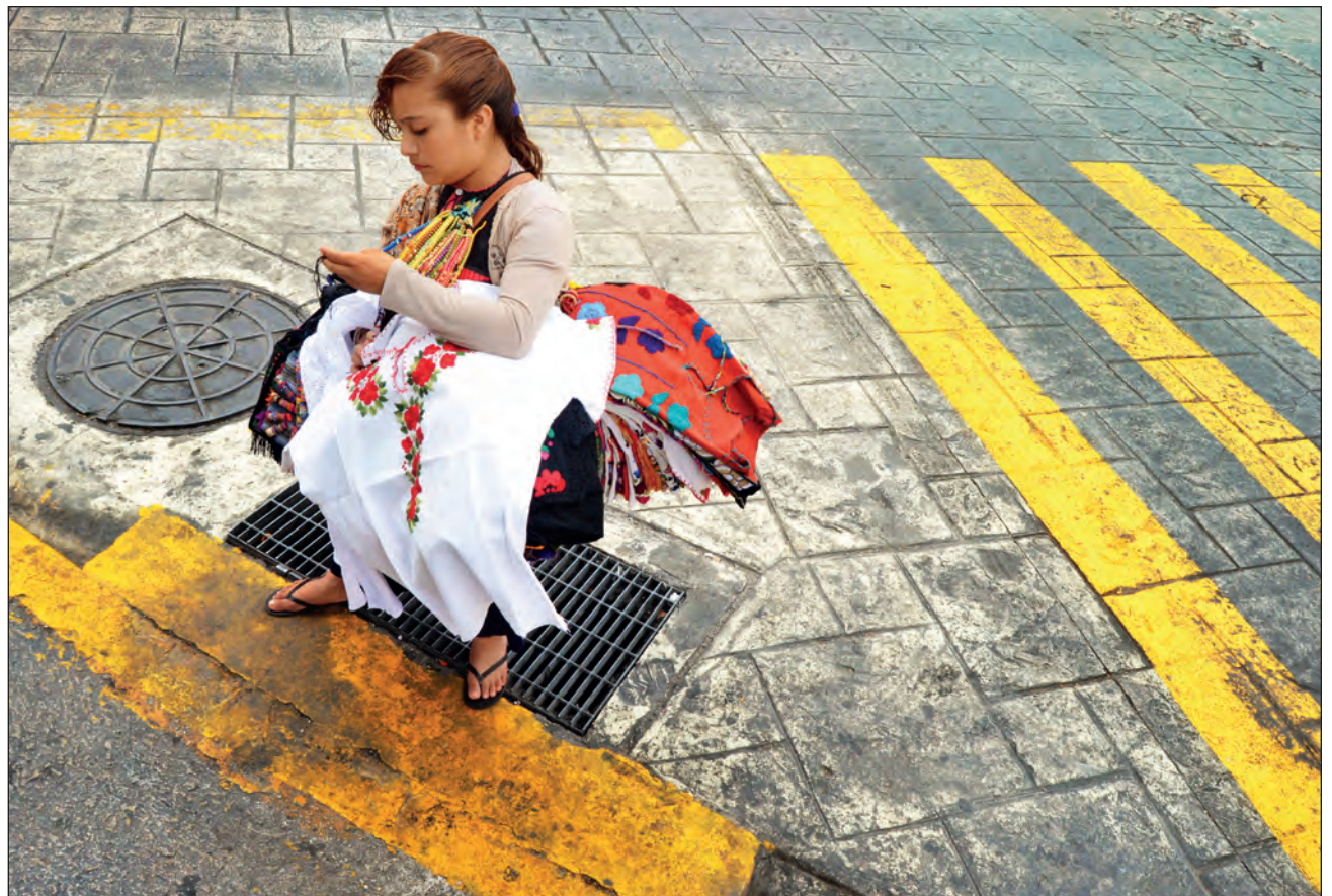
▲ La falta de conectividad en comunidades indígenas agudiza problemas como el abandono escolar, que los niños tengan que trabajar desde temprana edad o las niñas se casen muy jóvenes.

El acceso limitado a los servicios de salud y a las plataformas digitales y tecnología para continuar con sus estudios podría reflejarse en problemas de rezago educativo, embarazos y matrimonios a temprana edad o trabajo infantil, entre otros.