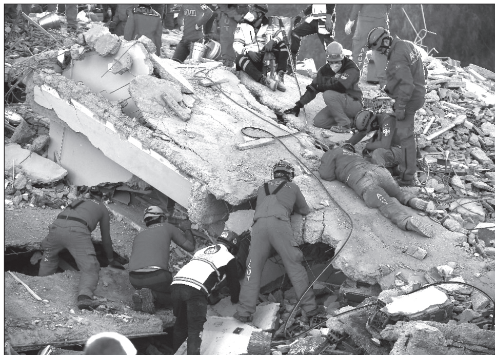
▲ Esta fue la segunda vez este año que Turquía, país atravesado por numerosas fallas sísmicas, sufre un terremoto.

Según el vicepresidente turco Fuat Oktay, al menos 51 personas murieron y 896 resultaron heridas en Turquía en este sismo que también causó la muerte de dos