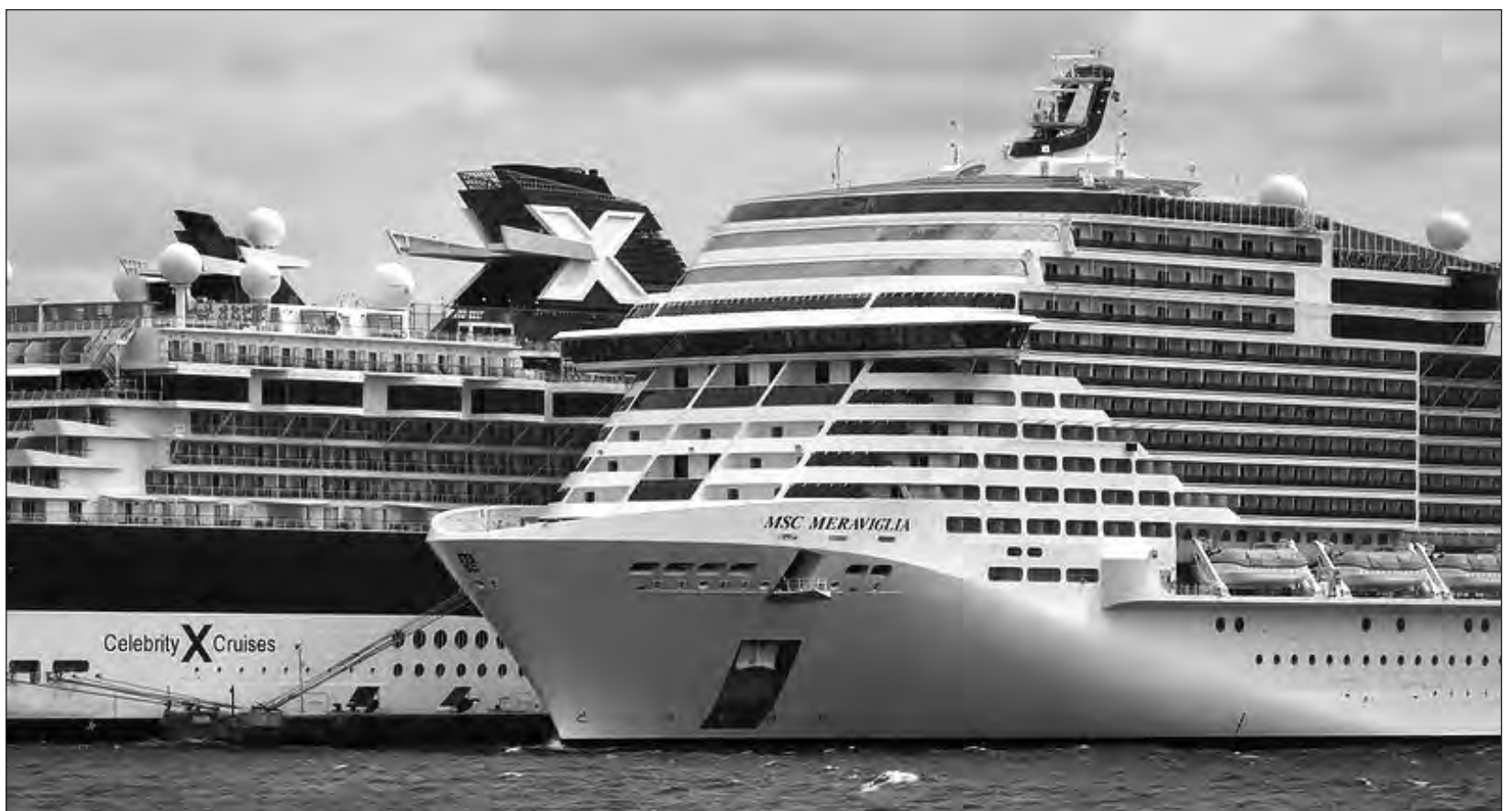
▲ Las líneas de cruceros deben implementar medidas para garantizar que las personas involucradas en el traslado nos sean expuestas al COVID-19.

"Las consecuencias económicas de la suspensión continua del servicio se sienten en las comunidades de los Estados Unidos y con cientos de miles de puestos de trabajo en juego, nos comprometemos a reanudar la navegación de una manera responsable que mantenga la salud pública en primer plano", menciona el comunicado compartido por CLIA en su sitio web.