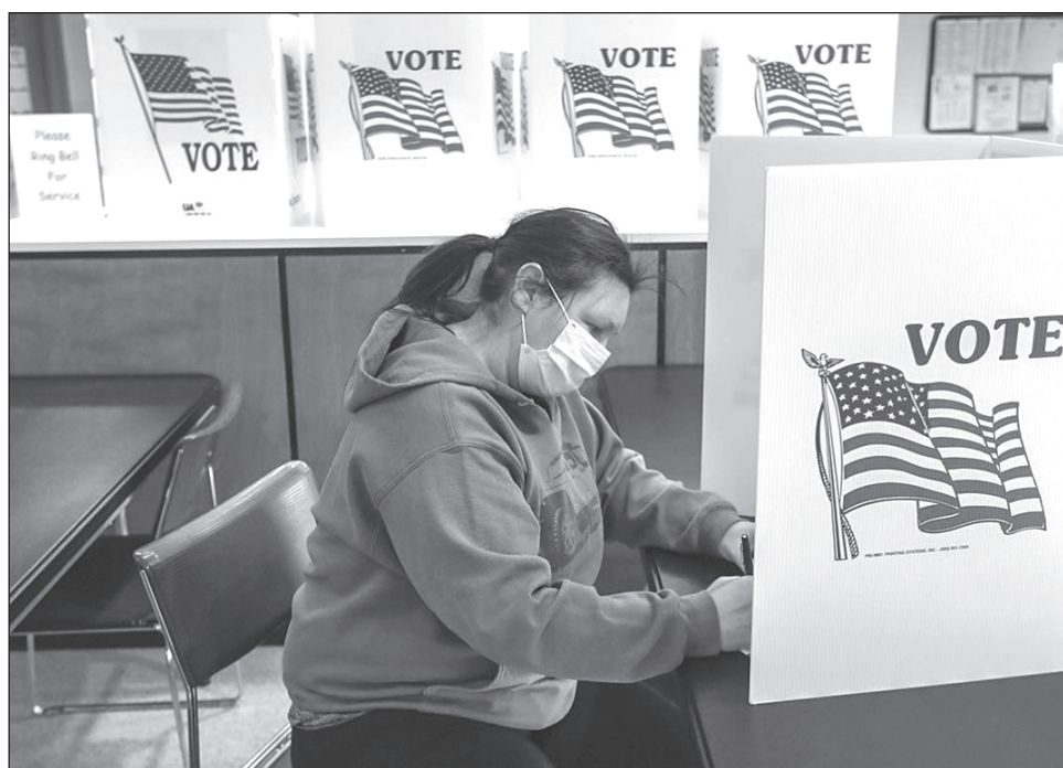
▲ Según los datos más recientes, más de 1 de cada 4 boletas presentadas por el momento, el 27 por ciento, son de votantes nuevos o infrecuentes.

Hasta el viernes por la tarde, 86.8 millones de personas habían votado en las elecciones presidenciales. Eso equivale a 63 por ciento del total de boletas presentadas en los comicios de 2016. La mayoría de los