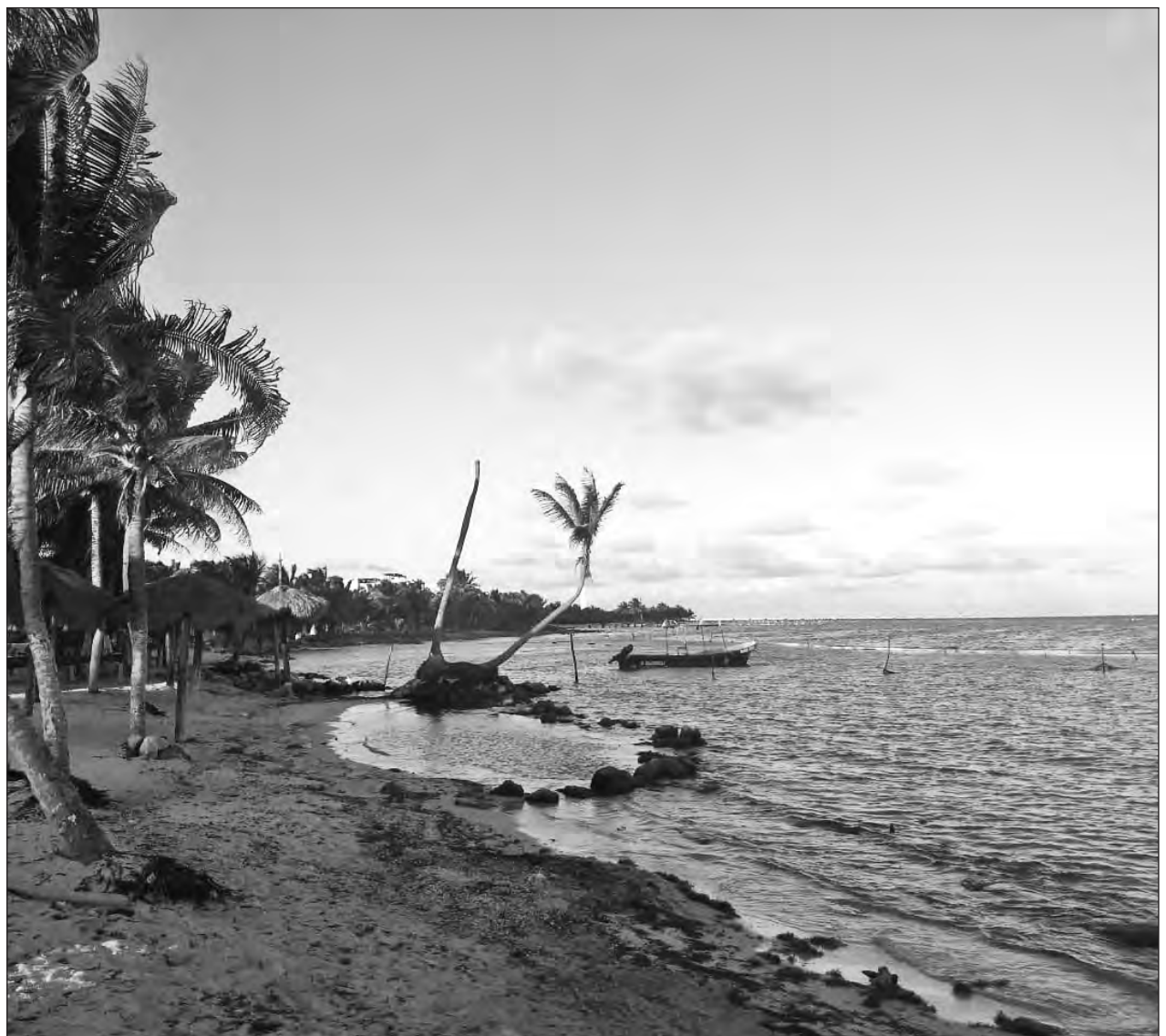
▲ La medida generará mayor polarización y conflictos entre el sector empresarial y la población.

“Nosotros reprobamos completamente esta idea populista y mediática (...) no nos parece justo que se beneficie y haga usufructo quien no le costó cuando a nosotros nos costó mantenerla limpia y es el producto que ofrecemos”, apuntó.