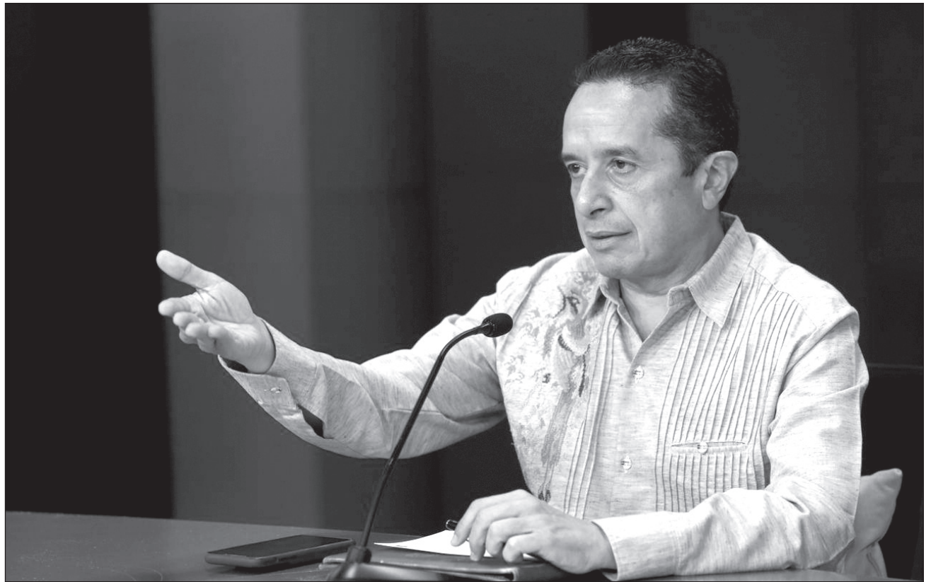
▲ Para el 2021, el presupuesto federal para Quintana Roo tiene una reducción en los ingresos tributarios, anunció el gobernador Carlos Joaquín.

El mandatario dejó patente la necesidad de más servicios públicos ante fenómenos naturales, como el paso de los huracanes por el estado: “requerimos de apoyos inmediatos para la población y lo que queremos es contar con más recursos para ayudar a quienes más lo necesitan”.