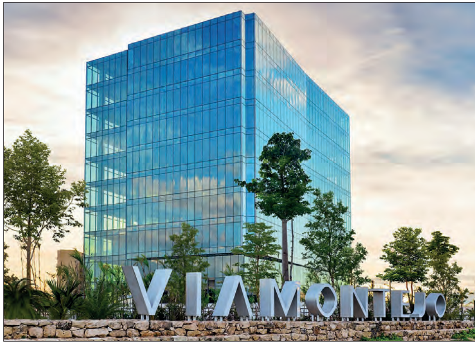
▲ El complejo de edificios del Consulado de Estados Unidos representará la fuerte y duradera amistad entre ese país y México, expresó la cónsul Courtney Beale.

El complejo de edificios estará ubicado en el desarrollo Vía Montejo y proporcionará una plataforma