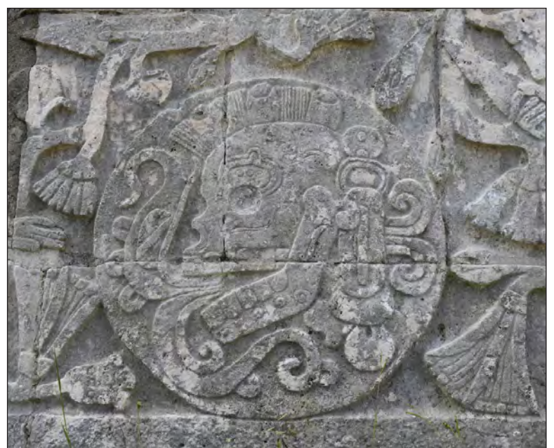
▲ Los pueblos del México antiguo asociaban la cabeza humana con el tonalli, el maíz y el Sol; la práctica de la decapitación se asociaba a rituales que simbolizaban la lucha de los contrarios.