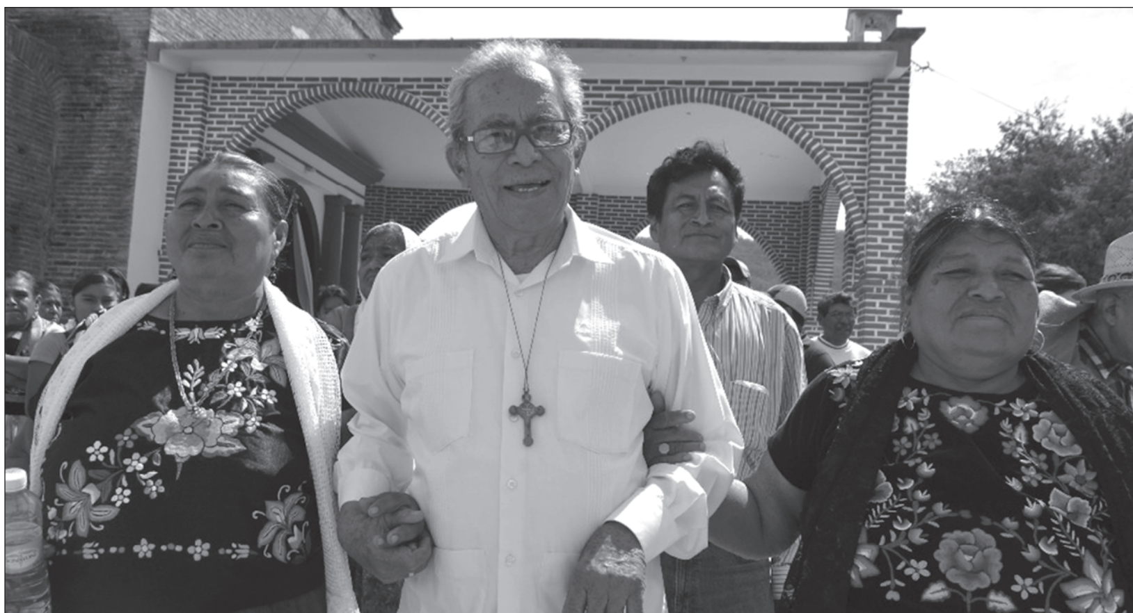
▲ La lucha de Lona fue la prédica con el ejemplo: creó dos cooperativas de producción en las que todos los empleados reciben utilidades en partes iguales.

(Con información de Jorge A. Pérez, corresponsal, y Fernando Camacho, reportero)