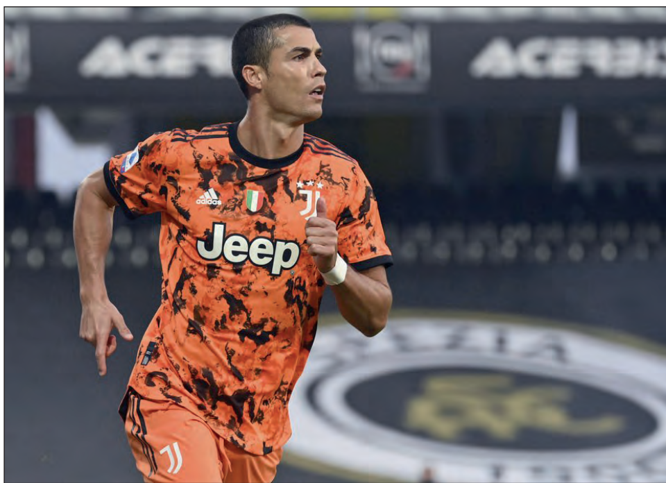
▲ Cristiano entró en el segundo tiempo y condujo a Juventus a la victoria.

Juventus quedó tercero en la clasificación, a cuatro puntos del líder Milán, que salió airoso 2-1 en la cancha de Udinese gracias a un gol de chilena de Zlatan Ibrahimovic en el tramo final. El sorprendente Sassuolo quedó de escolta, a dos unidades de los punteros, luego de llevarse una victoria 2-0 en su visita al Napoli.