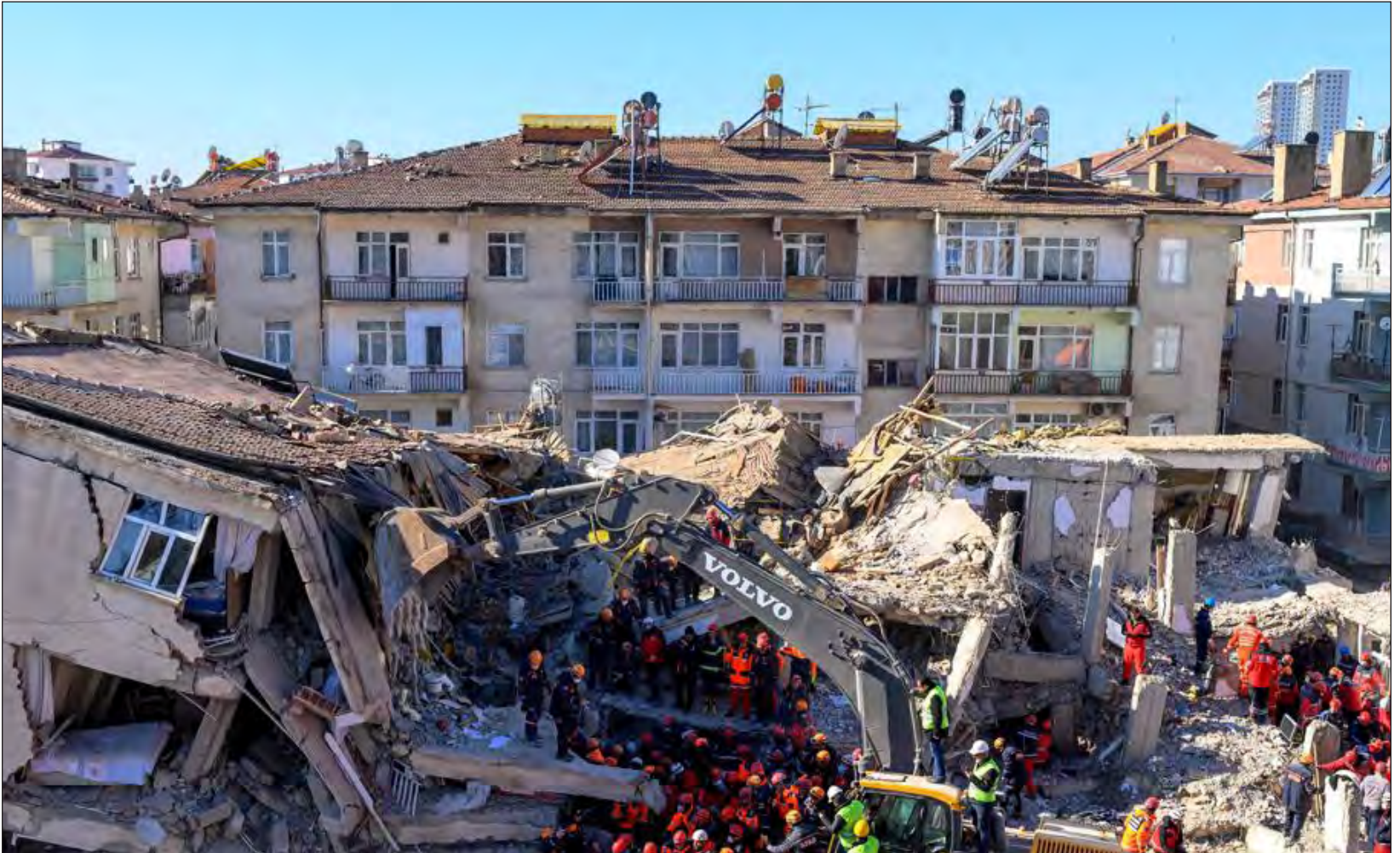
Región de Elazığ, devastada por el terremoto.

CAMPECHE · YUCATÁN · QUINTANA ROO · AÑO 6 · NÚMERO 1350 · www.lajornadamaya.mx