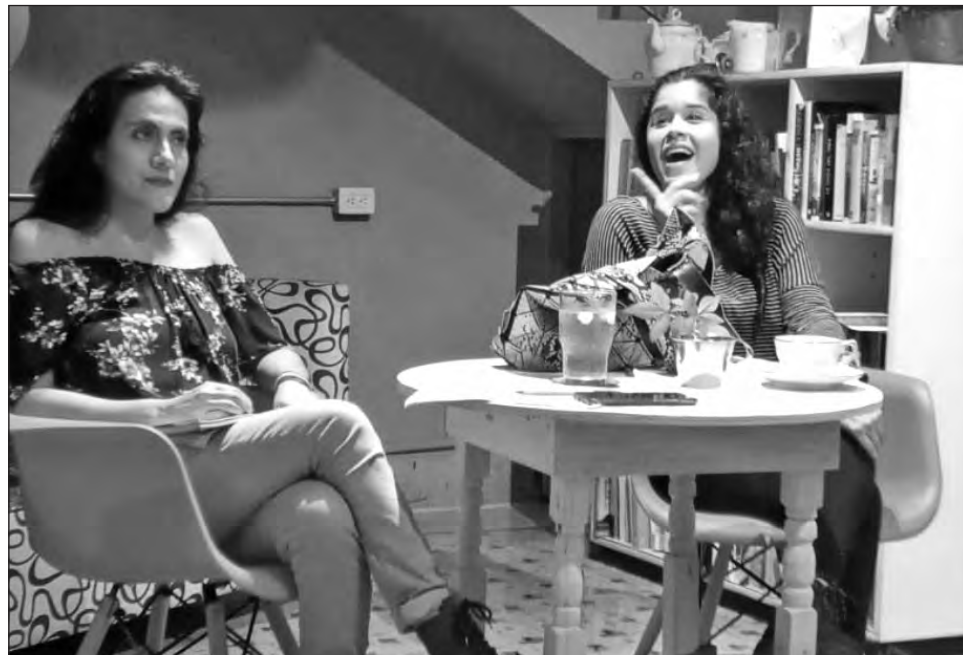
▲ La más fuerte es una puesta en escena del dramaturgo sueco August Strindberg que tendrá funciones los viernes y sábados de noviembre en YAJ Coworking-Café Cultural.

tro de impresión, rápida conexión a internet y salas privadas, también tenemos un rico y variado abanico de actividades culturales, artísticas y científicas que convertirán un habitual día de trabajo en algo extraordinario”, aseguraron.