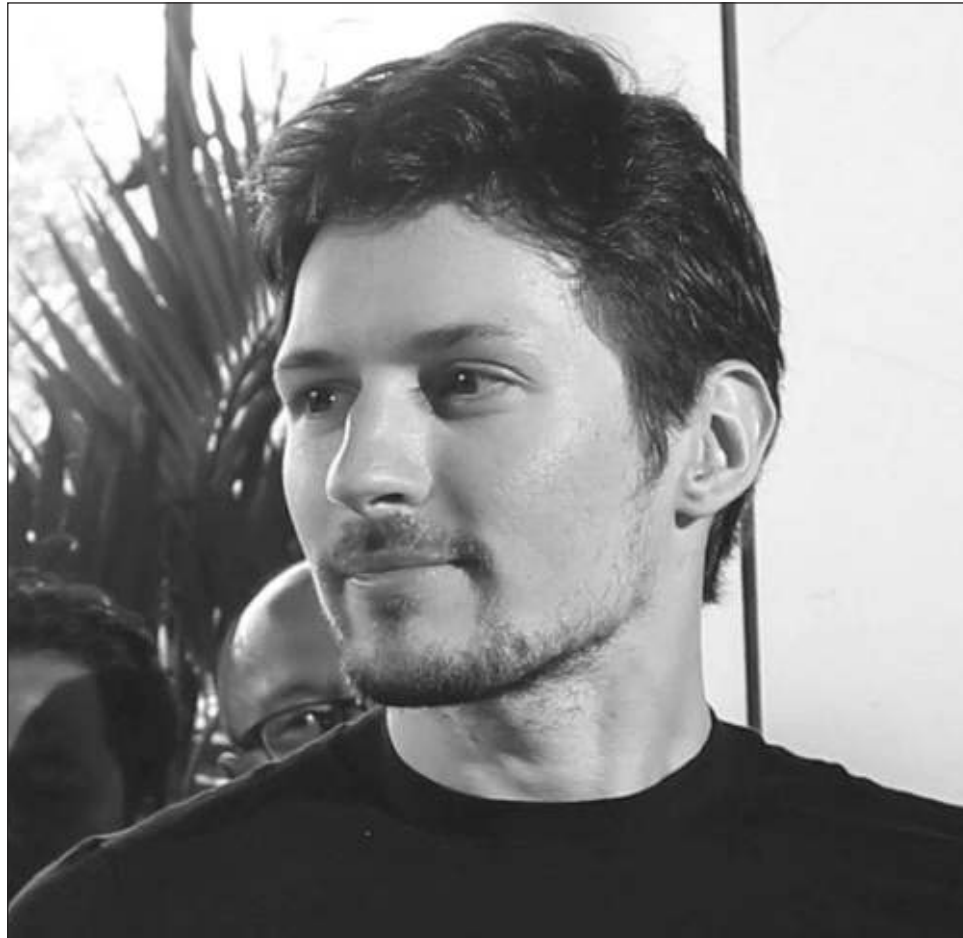
▲ El fundador de la aplicación enfrenta un proceso judicial por no actuar contra la difusión de contenidos delictivos en su servicio de mensajería cifrada.

En Rusia, los canales de Telegram cubren muchos temas que son objeto de censura en los medios estatales.