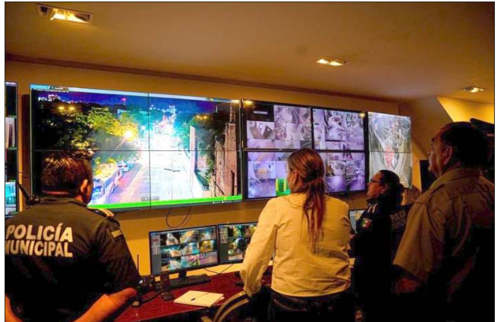
▲ La presidenta municipal de Mérida realizó un recorrido este domingo para saludar al personal policiaco que se encontraba en funciones.

Finalmente participó en un patrullaje hasta el Palacio Municipal sosteniendo conversaciones con elementos del cuerpo de seguridad y ciudadanos.