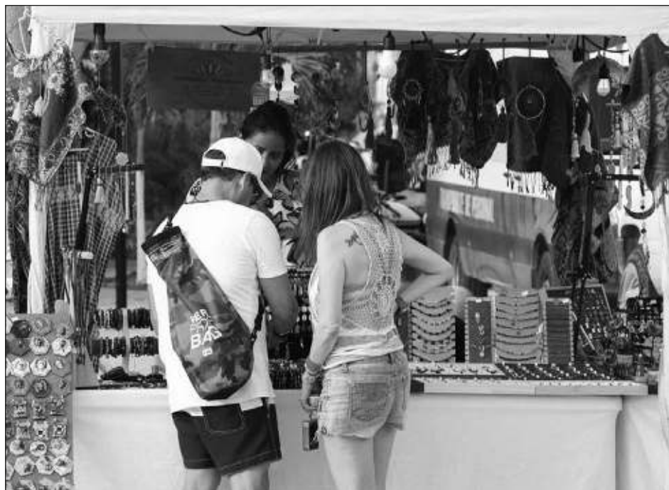
▲ En lo que va del año ya son más de 200 personas beneficiadas en los diversos programas que ofrece la Secretaría de Desarrollo Económico.

Este trabajo ha permitido que proveedores que han comenzado a colocar sus productos en supermercados iniciaran con unos 20 o 40 mil pesos y que hoy en día facturen más de 300 mil, y esa es la meta. Para avanzar en esas estrategias, desde la secretaría hay programas de financiamiento