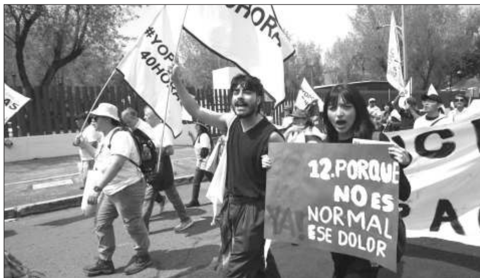
▲ Con banderas y pancartas, los manifestantes se reunieron a un costado de la plancha del Zócalo, una hora antes de iniciar el mensaje de AMLO con motivo de su sexto informe.

Con banderas y pancartas con los que hicieron esta