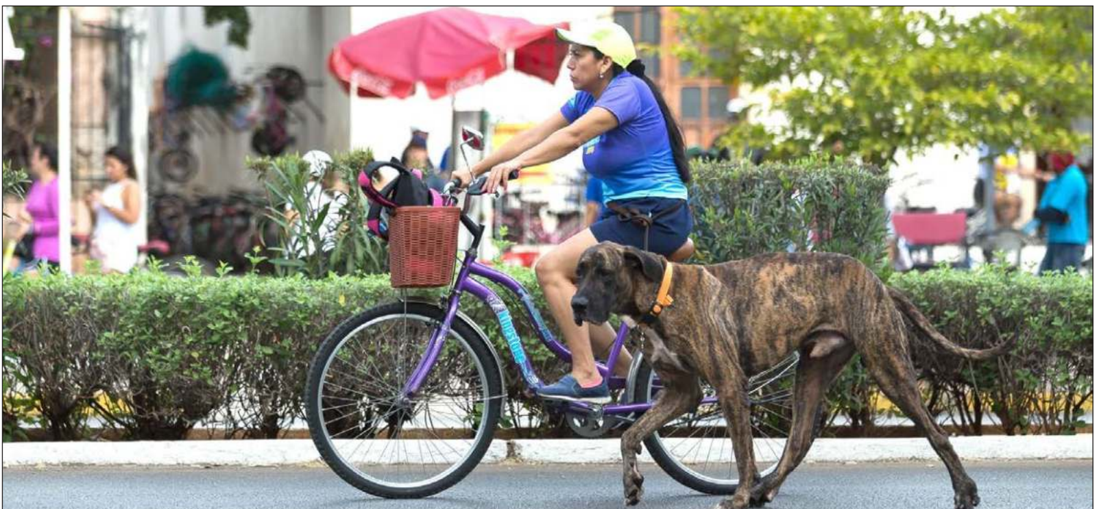
▲ "Los espacios que son realmente públicos en Mérida, su propiedad está a nombre de la ciudad, y por lo tanto, se asegura su permanencia a través del tiempo".

SÍGANOS EN: http://orga.enesmerida.unam.mx/ Facebook: @ORGACovid19 Instagram: @orgacovid19 X: @ORGA_COVID19