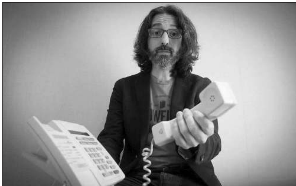
▲ El poeta presentó ayer Pequeño hablante en la Feria Internacional del Libro de las Universitarias y los Universitarios, en el Centro de Conferencias y Exposiciones UNAM.

Neuman (Buenos Aires, 1977) dijo que hacer este re-