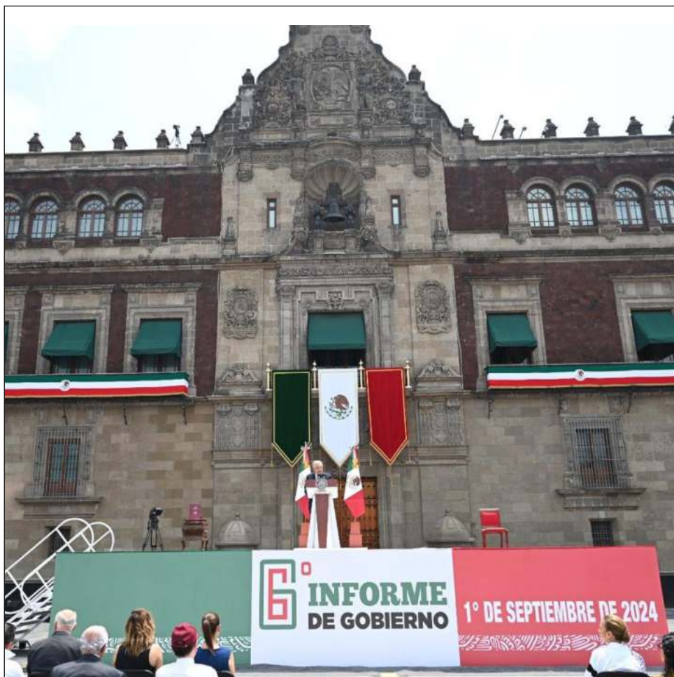
▲ AMLO realizó el acto ante miles de personas en el Zócalo de la CDMX.

También mencionó que “las reservas internacionales del Banco de México suman 224 mil 709 millones de dólares, 29 por ciento más que en 2018. Es récord histórico de reservas internacionales”.