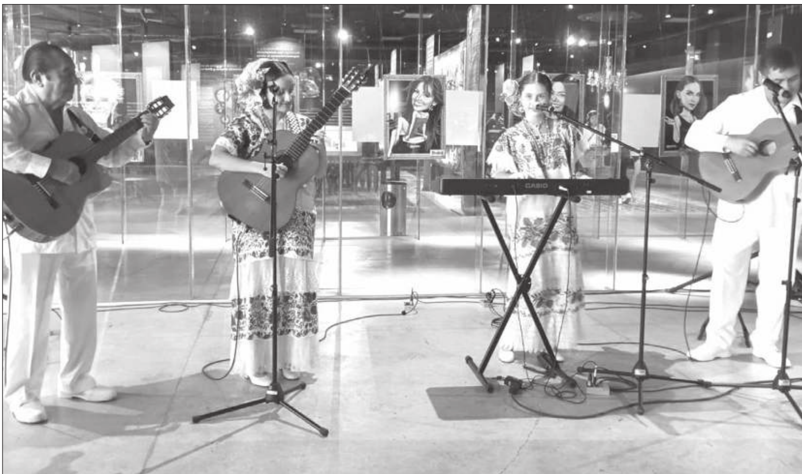
▲ Las Hermanitas Pech, acompañadas por su abuelo y su padre, son una promesa viviente de que con talento la trova yucateca seguirá vigente.