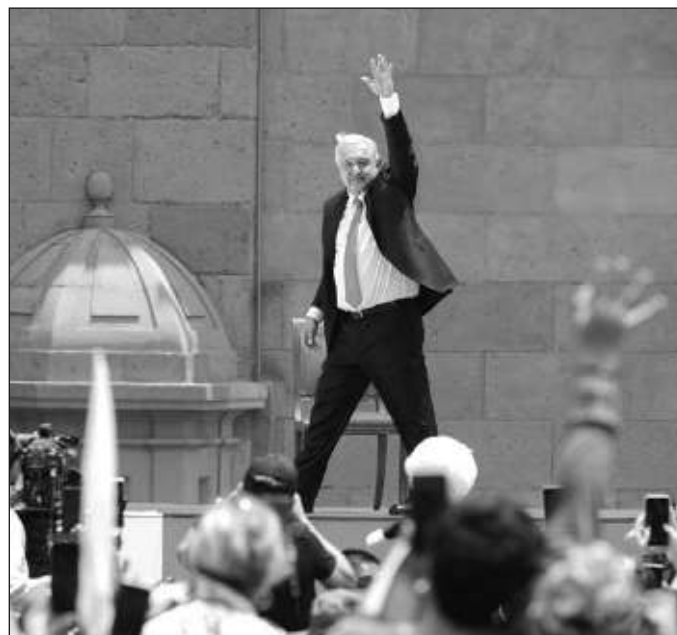
▲ AMLO mencionó en varias ocasiones a la presidenta electa, Claudia Sheinbaum, a quien describió como una mujer "excepcional, experimentada, honesta y sobre todo de buenos sentimientos".

Por supuesto, se debe dejar constancia de que el mensaje del Presidente tuvo ausencias