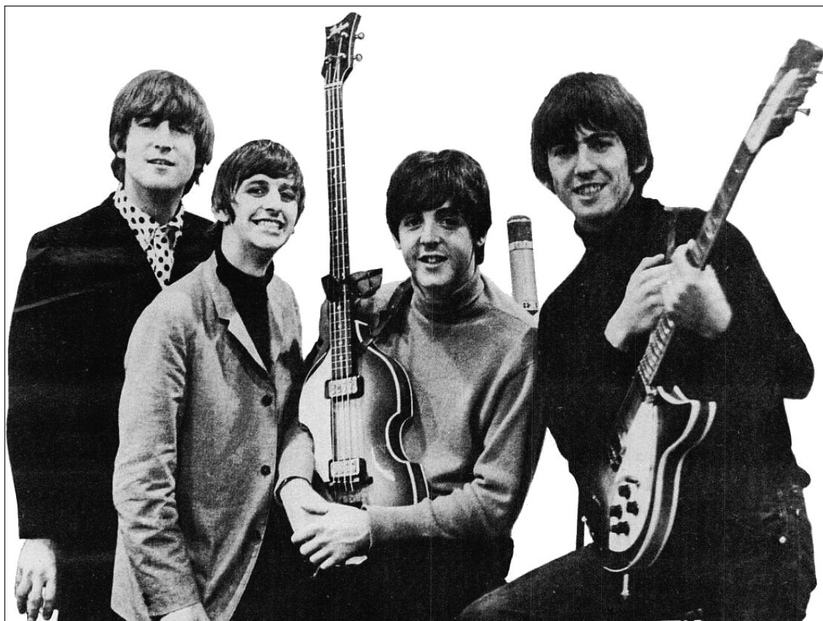
▲ “Esta canción cuestionaría las formas culturales inscritas en las estructuras de poder de los EU en la década de 1960, por lo que la interpretación cultural del artículo manifestaría estereotipos sobre la homosexualidad femenina”.

LA CANCIÓN NARRA a un joven que desea seducir a la protagonista de la historia cuando ella lo invita a su departamento; toman vino, ríen, sin embargo, al final de la noche, la mujer decide irse a dormir, por lo que el narrador pasa la noche en la bañera. Al final la mujer sale a trabajar muy temprano. Podemos deducir que la conclusión del artículo de la revista Time es la siguiente: