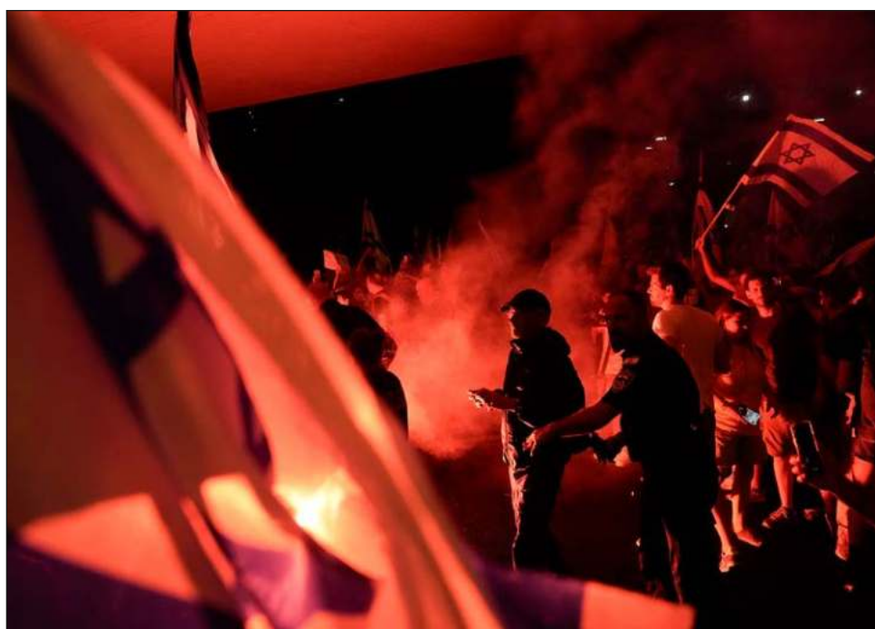
▲ Miles de personas se congregaron el domingo ante la oficina de Netanyahu en Jerusalén. En Tel Aviv, familiares de los rehenes desfilaron con ataúdes que simbolizaban a los rehenes muertos.

Mientras, las fuerzas israelíes siguieron combatiendo a los militantes dirigidos por Hamas en varias zonas del enclave palestino. Los residentes afirmaron que las tropas del ejército israelí volaron varias casas en Rafah, cerca de la frontera con Egipto, mientras que los tanques seguían operando en el suburbio de Zeitoun, al norte de la ciudad de Gaza.