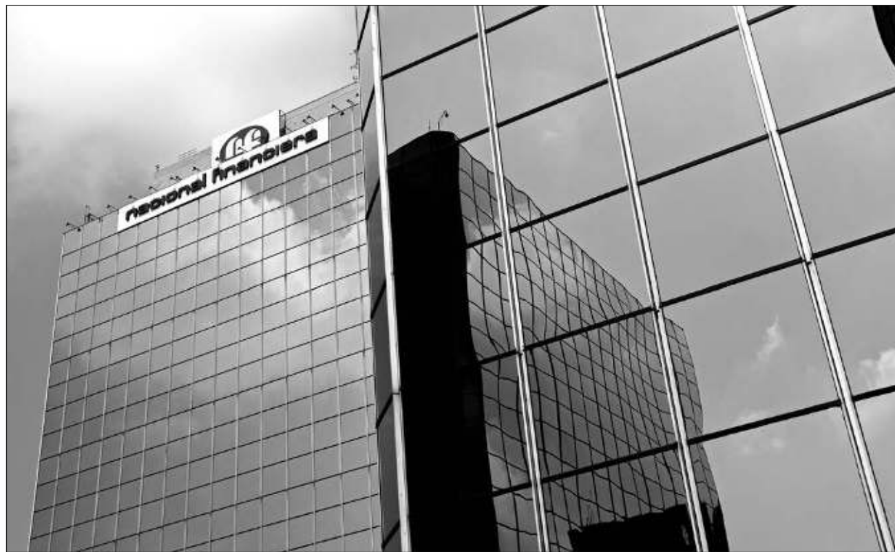
▲ Estas instituciones de crédito oficiales tienen como propósito apoyar y atender los proyectos de mayor importancia para el gobierno, así como otorgar financiamiento a la población más vulnerable del país sin acceso a servicios financieros.

Cabe recordar que estas instituciones de crédito oficiales tienen como propósito apoyar y atender los proyectos de mayor importancia para el gobierno, así como otorgar financiamiento a la población más vulnerable del país que carece de acceso a servicios financieros.