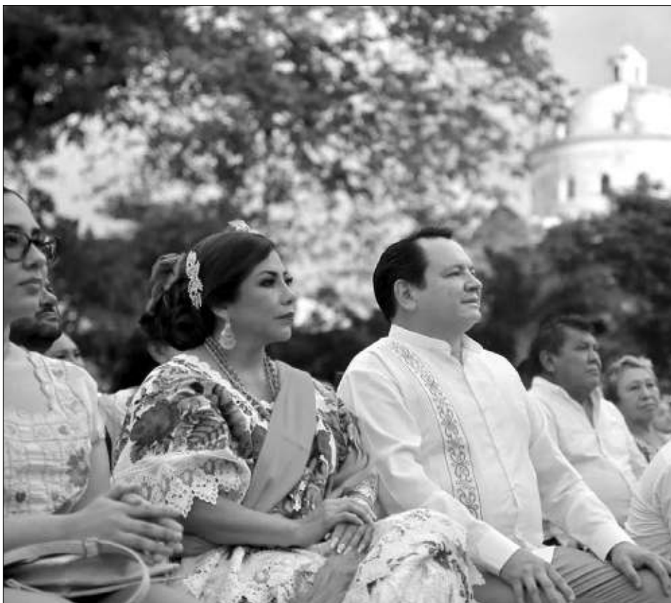
▲ El gobernador electo aseguró que "juntos" construirán un Yucatán con bienestar, derechos, solidaridad y justicia bajo los principios de la 4T.

"Quiero reiterar mi compromiso, con cada uno de ustedes; las puertas de palacio de gobierno, a partir de este primero de octubre estarán abiertas para todos" refrendó Huacho Díaz Mena, quien aprovechó para invitar a todos los presentes a que acudan el 30 de septiembre, a las 9 de la noche, a la Plaza Grande, y les pidió que, tras acompañarlo a rendir protesta, lo acompañen a entrar juntos a Palacio de Gobierno.