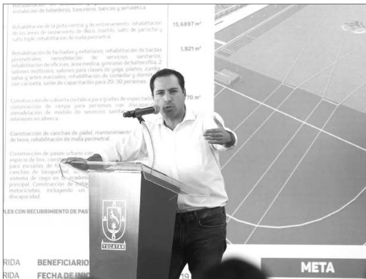
▲ Vila Dosal “deja a un Yucatán con indicadores positivos en la economía, en la seguridad, con un nuevo transporte público (...) pero como le pasa a todo gobernante, el desgaste del tiempo también le afectó”.

La Plancha generó un capítulo especial de Yucatán en el cual es imposible separar la responsabilidad de los tres órdenes de gobierno. El principal proyecto de la administración de Andrés Manuel López Obrador fue el Tren Maya que inicialmente iba