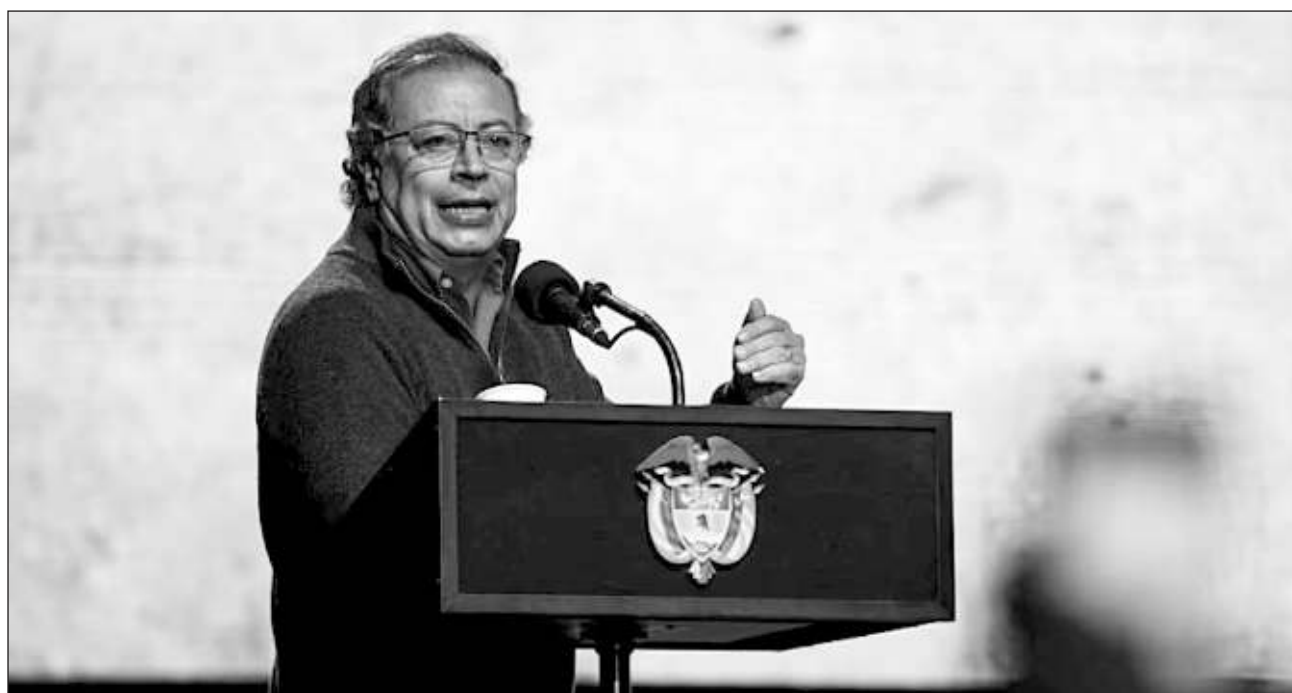
▲ “Del pueblo que me eligió dependerá que el designio oligárquico se vuelva realidad o los derrotemos de nuevo. Esta no será una votación parlamentaria de nuestros enemigos para sacarnos. Esto será una lucha popular”, informó el presidente colombiano.

Tras la denuncia, el jefe de Estado recibió muestras de solidaridad en redes sociales con mensajes que reproducen la etiqueta #TodosConPetro.