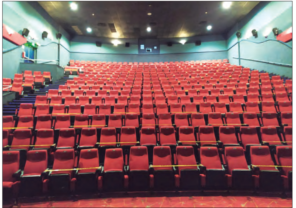
▲ Las salas operan con un aforo de 30%, respetando la sana distancia entre las butacas.

De igual manera, explicaron que un detalle muy