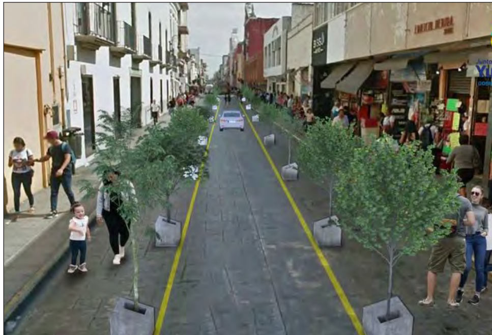
▲ Una de las modificaciones contempladas es la ampliación de espacios para el tránsito peatonal. Ilustración Gobierno del estado

“El cuidado de la salud de los yucatecos es algo que no se puede regatear y donde todos tenemos una cuota de participación, incluso algunas de ellas significan un poco de sacrificio, pero valen la pena, con tal de proteger la salud de todos”, externó.