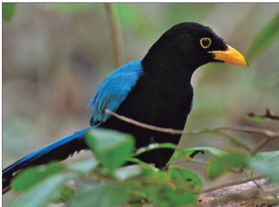
▲ La Chara yucateca es una de las especies de aves con más abundancia en el santuario.

Esta investigación reportó que en Xcabel-Xcabelito, santuario que posee una superficie de 362 hectáreas de selva y playas donde se encuentran manglares, cenotes y arrecifes coralinos, las aves que presentan mayor abundancia son la Chara yucateca ( Cyanocorax yucatanicus ), el