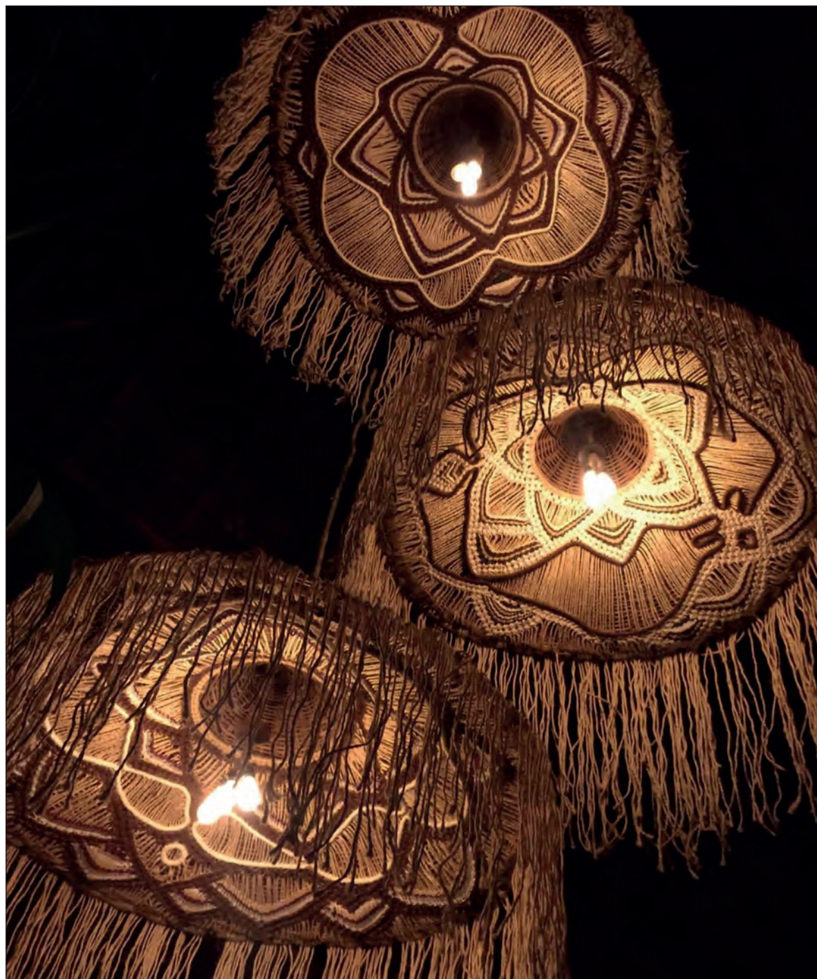
▲ Entre trama y urdimbre, nudo a nudo, puntada a puntada, tejido a tejido, telar a telar, la humanidad también avanza de acuerdo a las tendencias de cada época.

En la zona fronteriza norte de México se elaboraban miles de maceteros artísticos de henequén. Los mayoristas de USA inundaron su país con esos hermosos tejidos; literal cada casa tenía mínimo un macetero tejido adornando su por-