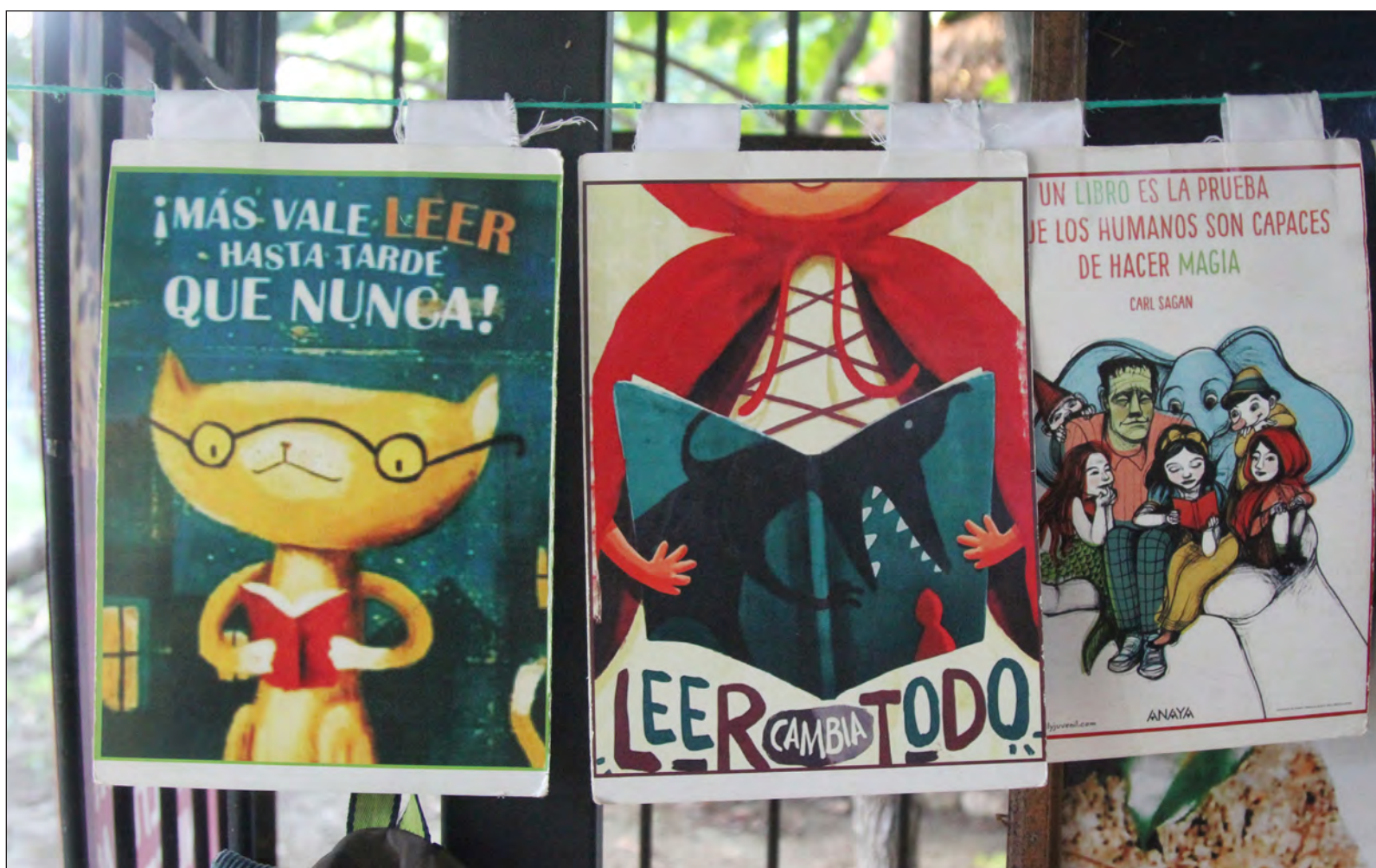
▲ Los textos literarios pueden provocar estados de ánimo y el lector podría transferir tales vivencias a la esfera de su conciencia. Entonces, el individuo ampliaría sus posibilidades afectivas y desarrollaría una especie de cultura sentimental que le permitirá reconocer sentimientos indiferenciados.