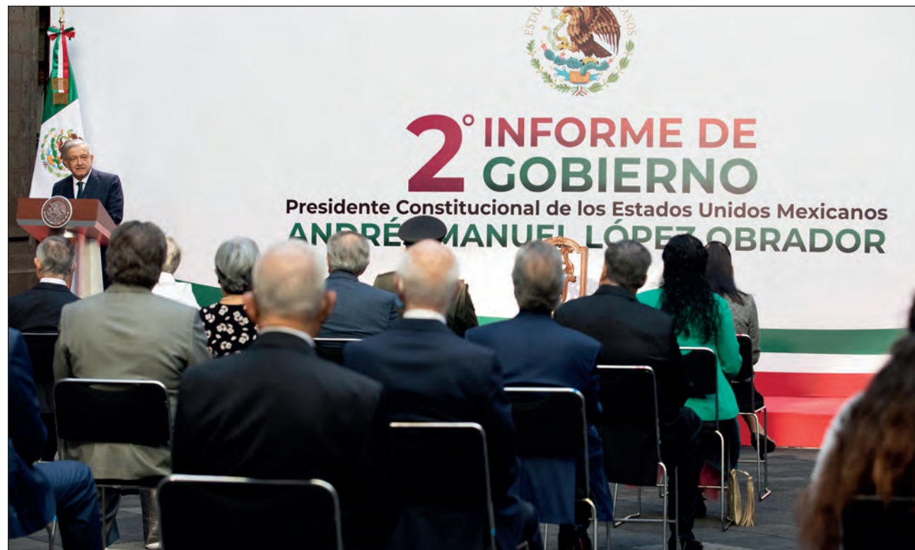
▲ En sus principales proyectos, el aeropuerto Felipe Ángeles, la refinera de Dos Bocas y el Tren Maya, vamos “viento en popa”, indicó López Obrador.

López Obrador resaltó que la pandemia de COVID-19 no es un asunto político, sino de salud pública, y ratificó que en noviembre se esperan resultados de la vacuna que México desarrolla con la Universidad de Oxford, la empresa británica AstraZeneca y el gobierno de Argentina, para aplicarla a más tardar a