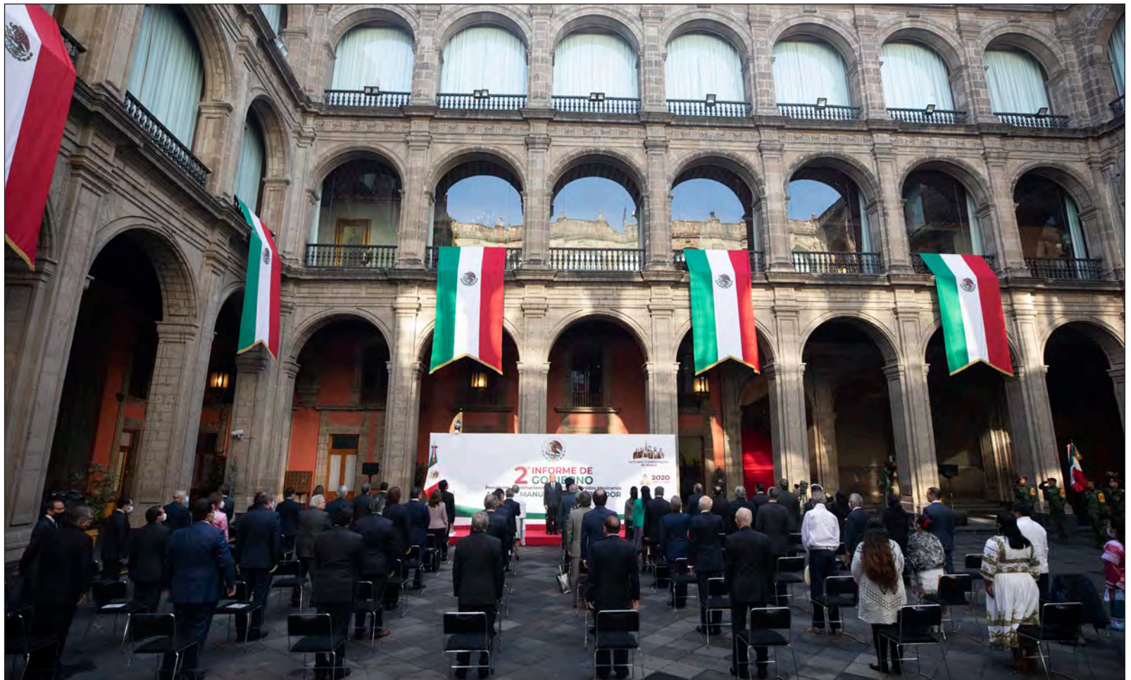
▲ Andrés Manuel López Obrador, presidente Constitucional de los Estados Unidos Mexicanos rinde su 2º Informe de Gobierno.