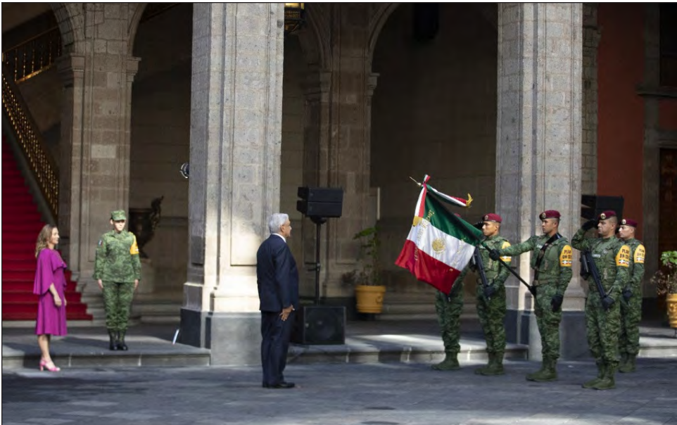
▲ El sector hotelero de Quintana Roo calificó el informe presidencial como una mañana especial en donde no se dijo nada nuevo.

José Manuel López Campos, presidente de la Confederación de Cámaras Nacionales de Comercio, Servicios y Turismo (Concanaco Servytur), indicó que las líneas acción sobre la inyección de recursos desde el gobierno federal será clave para la recuperación económica, y destacó el reconocimiento que hizo el presidente López Obrador al sector empresarial en su informe de actividades para la conservación del empleo.