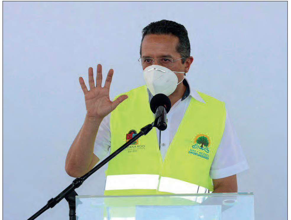
▲ El gobernador Carlos Joaquín cumplirá con la entrega al Congreso del Estado del cuarto informe en el mismo día del evento.

El titular del Ejecutivo explicó que los colaboradores tendrán diferentes turnos y horarios de trabajo para evitar aglomeraciones en las oficinas y riesgos de contagio. Además, se aplicarán pruebas rápidas de COVID-19 al personal del gobierno estatal.