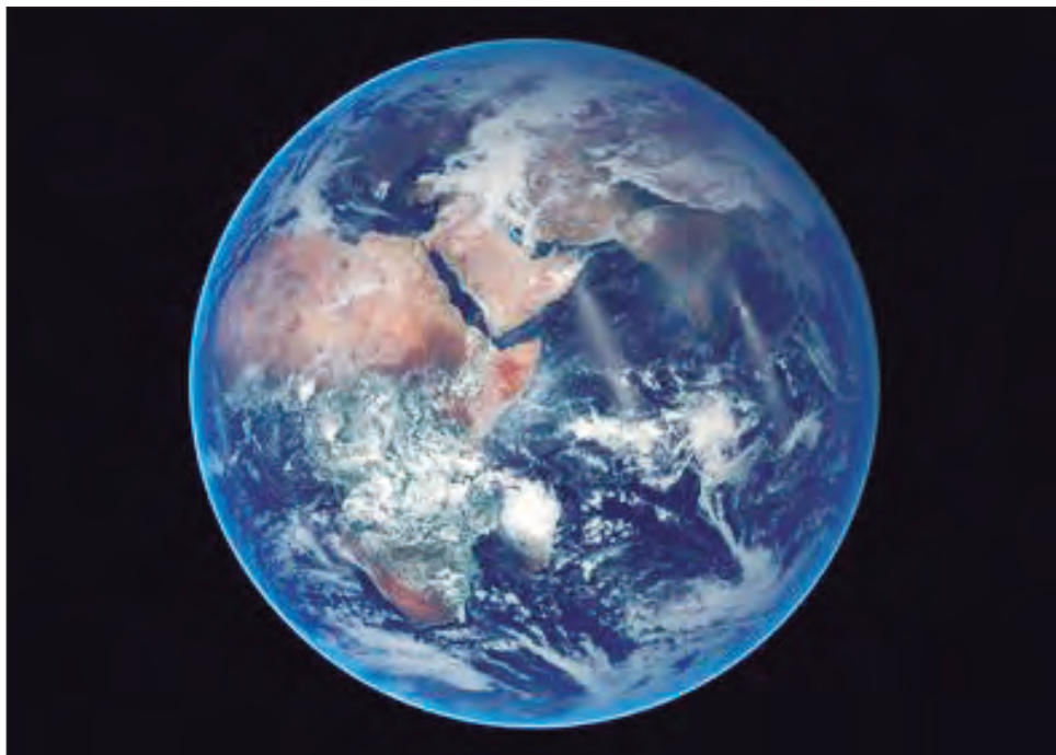
▲ La investigación no excluye que más partículas del vital líquido hayan llegado luego de otras fuentes, como cometas.

Otro tipo de meteoritos, llamado condritas de enstatita, posee una composición química mucho más cercana, lo