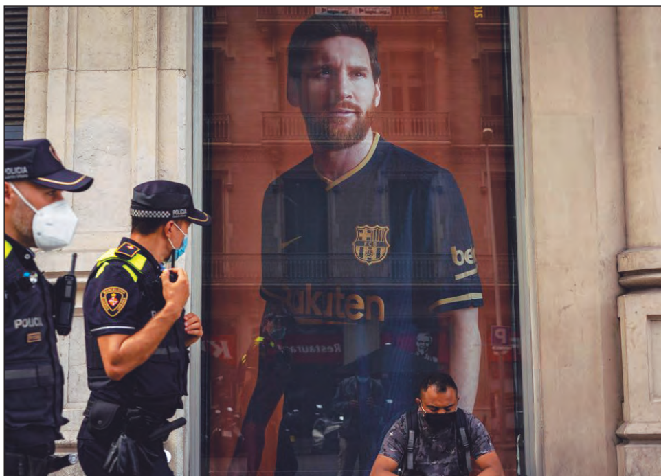
▲ Los días de Messi en el Barcelona estarían contados, pero el club confía en que puede convencerlo de que se quede.

El presidente del club, Josep Bartomeu, charló telefónicamente con el padre de Messi tras la derrota ante el Bayern y se le dijo que el jugador quedó muy decepcionado. Han conversado unas cuantas veces más luego del