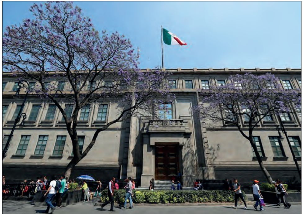
▲ Entre los temas que deberá resolver la SCJN se cuentan el cambio de fechas para iniciar el proceso comicial.

Entre los temas electorales que deberá resolver la SCJN, se cuentan el cambio de fechas para iniciar el proceso comicial, debido a la pandemia; reformas sobre la forma en que se nombran a funcionarios encargados de la organización logística de los comicios; y también la decisión presidencial de recortar los tiempos fiscales en radio y televisión.