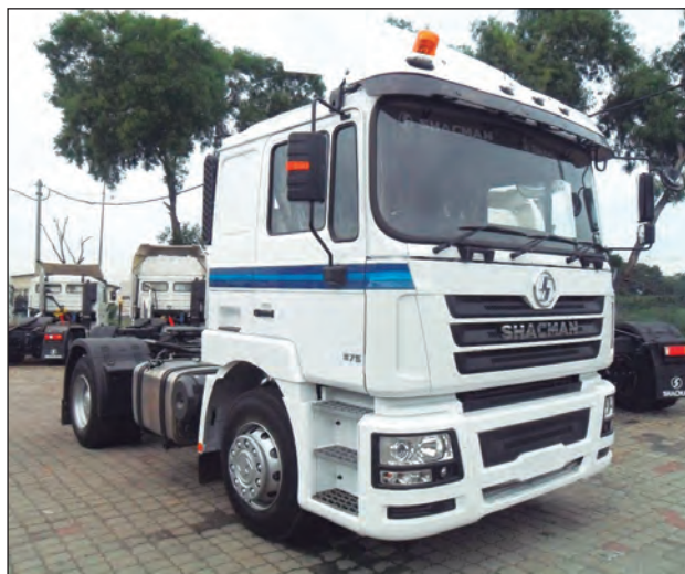
▲ La ensambladora tiene el objetivo de producir 5 mil unidades a lo largo de cinco años.

Se decidió México por la alta especialización de su mano de obra en la producción automotriz, subrayó. Sumado a ello, se espera abrir centros de distribución en la Ciudad