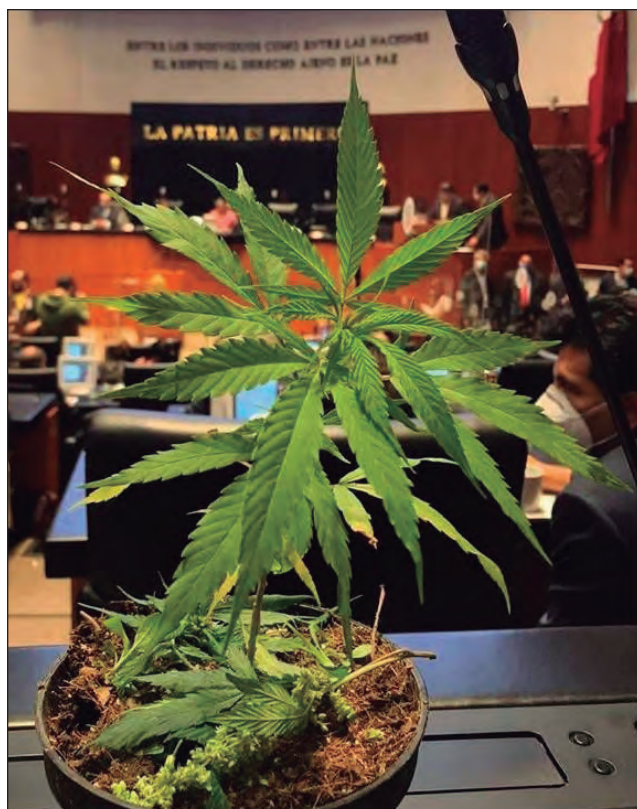
▲ La senadora Jesusa Rodríguez llegó al pleno del Senado con una planta de marihuana, exigiendo que la regulación de la cannabis sea una de las prioridades en la agenda legislativa. El senador Ricardo Monreal indicó que así será.