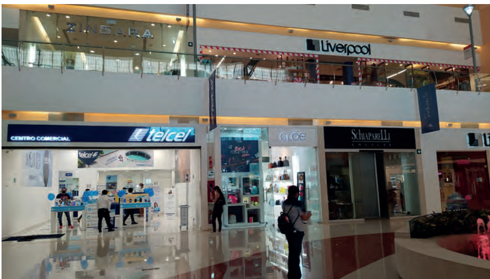
▲ Al interior de centros comerciales como la Gran Plaza y Galerías, cada local ha adoptado además medidas sanitarias y limita contacto entre clientes.