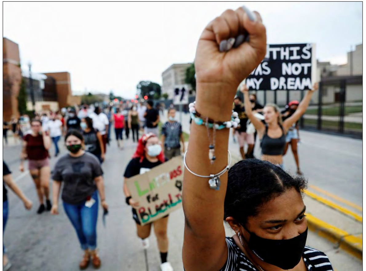
▲ The recent shooting of Jacob Blake by a white policeman led to further rioting as crowds protested once again against the unchecked brutality by white police officers against black victims.

INDEED, THE MEDIA continues to play Trump's game. The liberal media criticizes Trump for his constant attacks against them, yet they do not realize that they are not only enabling him at every