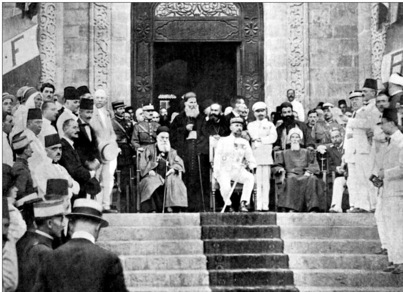
▲ El 1 de septiembre de 1920 se creó el Gran Líbano y seis años después se instauró la república bajo el mandato francés.

La proclamación del Gran Líbano por el general francés Henri Gouraud fue un paso positivo para los maronitas, la comunidad cristiana más grande del país, aunque no para los musulmanes, ya que vieron cómo se trazaban unas fronteras entre Siria y Palestina.