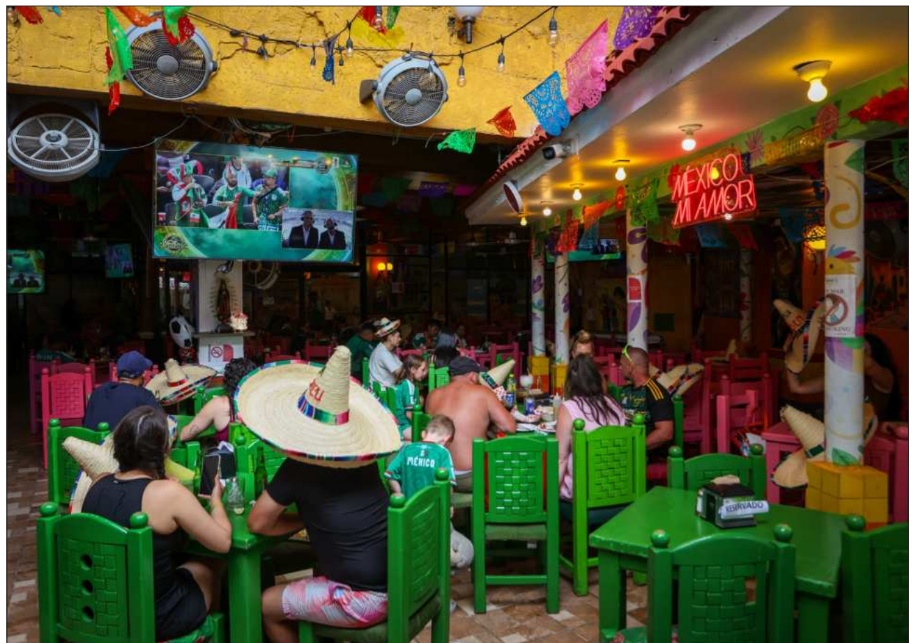
▲ Si bien el inicio fue lento, el consumo se ha acelerado notablemente, impulsado por el aumento en la ocupación hotelera, el gasto en restaurantes, hoteles, comercio, en particular en productos relacionados con los festejos.

El presidente de la Concanaco destacó y agradeció a los mexicanos por su comportamiento festivo y solidario, que ha transformado la percepción de los visitantes extranjeros sobre México.