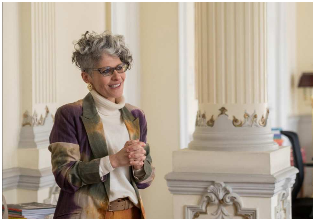
▲ “La historia la escriben los adultos, normalmente los hombres y los vencedores. ¿Dónde están las voces de quienes tuvieron que huir, de quienes fueron torturados, de las mujeres, de las infancias y de los adolescentes?”, subrayó Saia.

“Yo pongo mi voz al servicio de todas esas causas, por supuesto, desde la legalidad, porque yo no deseo en ningún caso volver a repetir la historia de mi padre y de tantas personas que murieron con este afán de que hubiera otro tipo de sistema político que no les matara, yo espero que nunca me toque vivir en un Estado así jamás”.