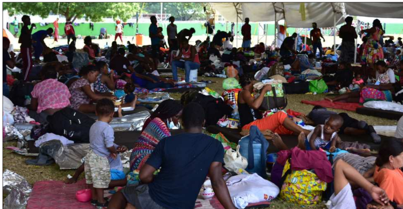
▲ El centro de asistencia social, además de consolidar su infraestructura y equipamiento, deberá garantizar atención permanente las 24 horas del día, los siete días de la semana para asegurar alojamiento, cuidados y protección integral.

Más allá de la transferencia de recursos, el acuerdo establece que la atención a esta población no podrá suspenderse. Al tratarse de un centro de acogimiento residencial, la operación deberá mantenerse de manera continua para asegurar alojamiento, cuidados y protección integral a niñas, niños y adolescentes migrantes que lleguen al estado.