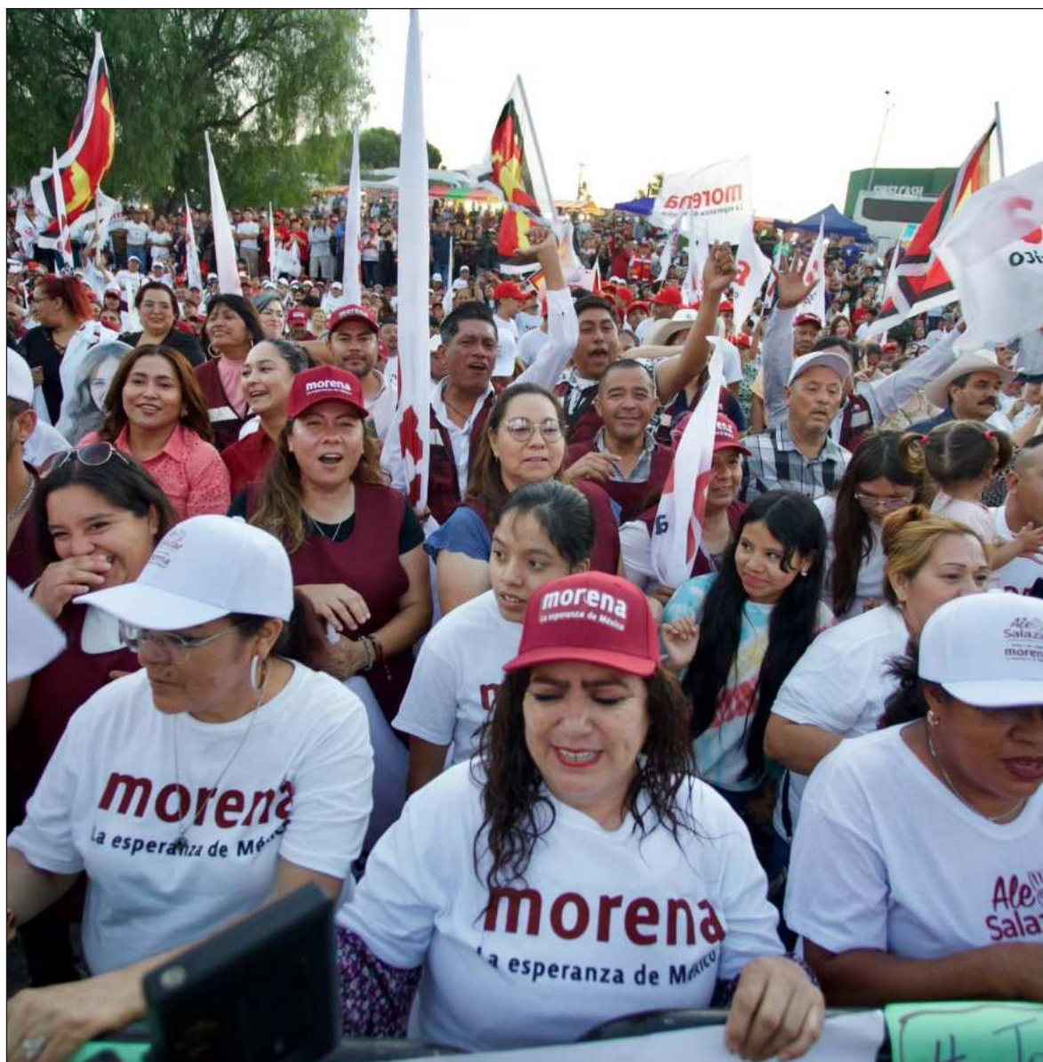
▲ "Morena deberá privilegiar las candidaturas de personajes sin manchas en su desempeño".