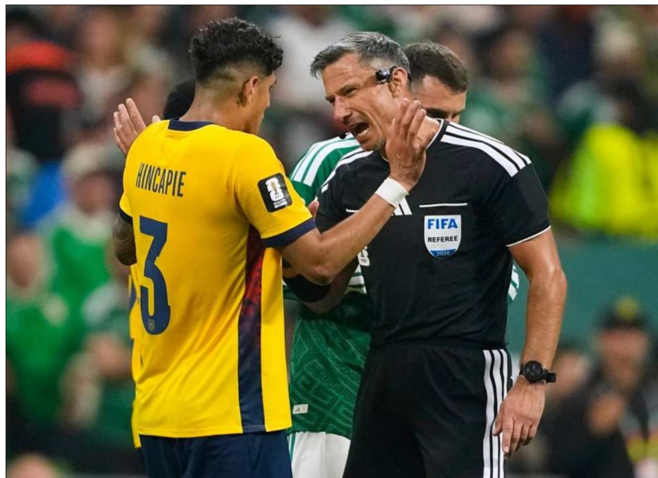
▲ A pesar de la que norma no es obligatoria dentro de las Reglas de Juego, sí otorga a los organizadores de torneos -como la FIFA- la opción de utilizarla a su discreción, esto luego de aprobar la medida por unanimidad por la IFAB.