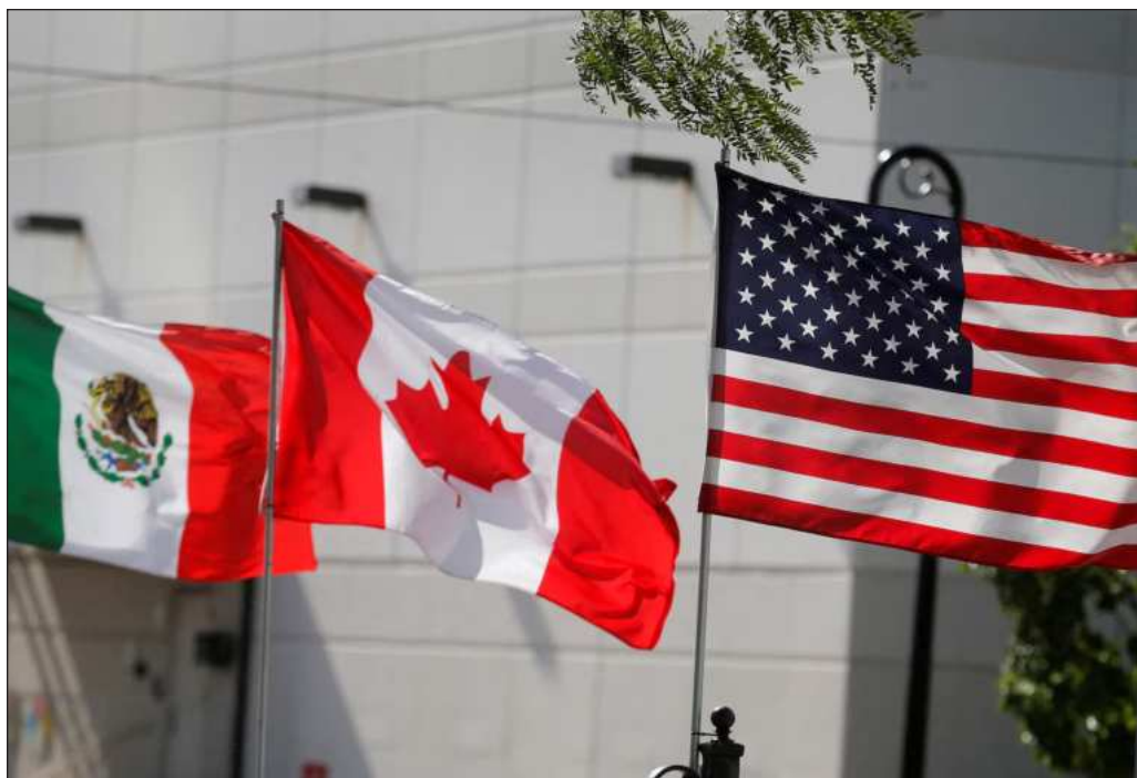
▲ Lo que ocurrirá es un proceso que rebasará a los gobernantes actuales de los tres países, durante el cual se deben ir afinando varios mecanismos que muy probablemente conducirán a la firma de un nuevo tratado.

Por lo pronto, el 20 de julio inicia una nueva etapa de conversaciones y revisiones, y en cuanto al T-MEC, hay 10 años para prepararse ante cualquier eventualidad, sin dejar de insistir en que en sus ya 32 años ha sido sumamente benéfico para los tres países, a pesar de lo que digan en la Casa Blanca.