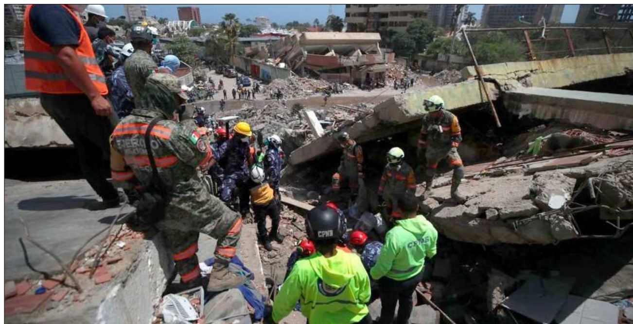
▲ Las personas heridas por los sismos ascienden a 11 mil 267 y los rescatados llegan a 6 mil 461.

La presidenta encargada de Venezuela, Delcy Rodríguez, decretó este miércoles siete días de duelo nacional