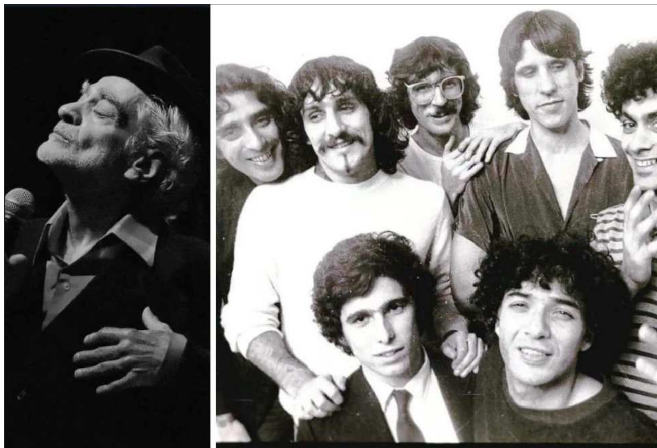
▲ Reconocido por su estilo particular, Alejandro Daniel Melingo fue integrante de Los Abuelos de la Nada y cofundador de Los Twist, agrupaciones fundamentales dentro de la historia del rock argentino en la década de 1980.

En enero de 2022 creó la Ópera Linyera (Oasis) , estrenada en septiembre y octubre de ese año en Buenos Aires.