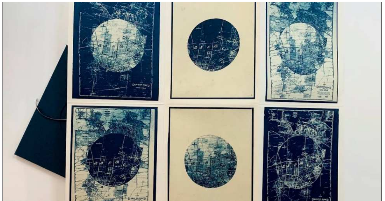
▲ Para la muestra de 35 obras, Revueltas Valle intervino digitalmente el primer mapa del estado de Tabasco. Foto cortesía de la artista

“Los mapas eran representaciones fantásticas del valle de México” gracias a relatos