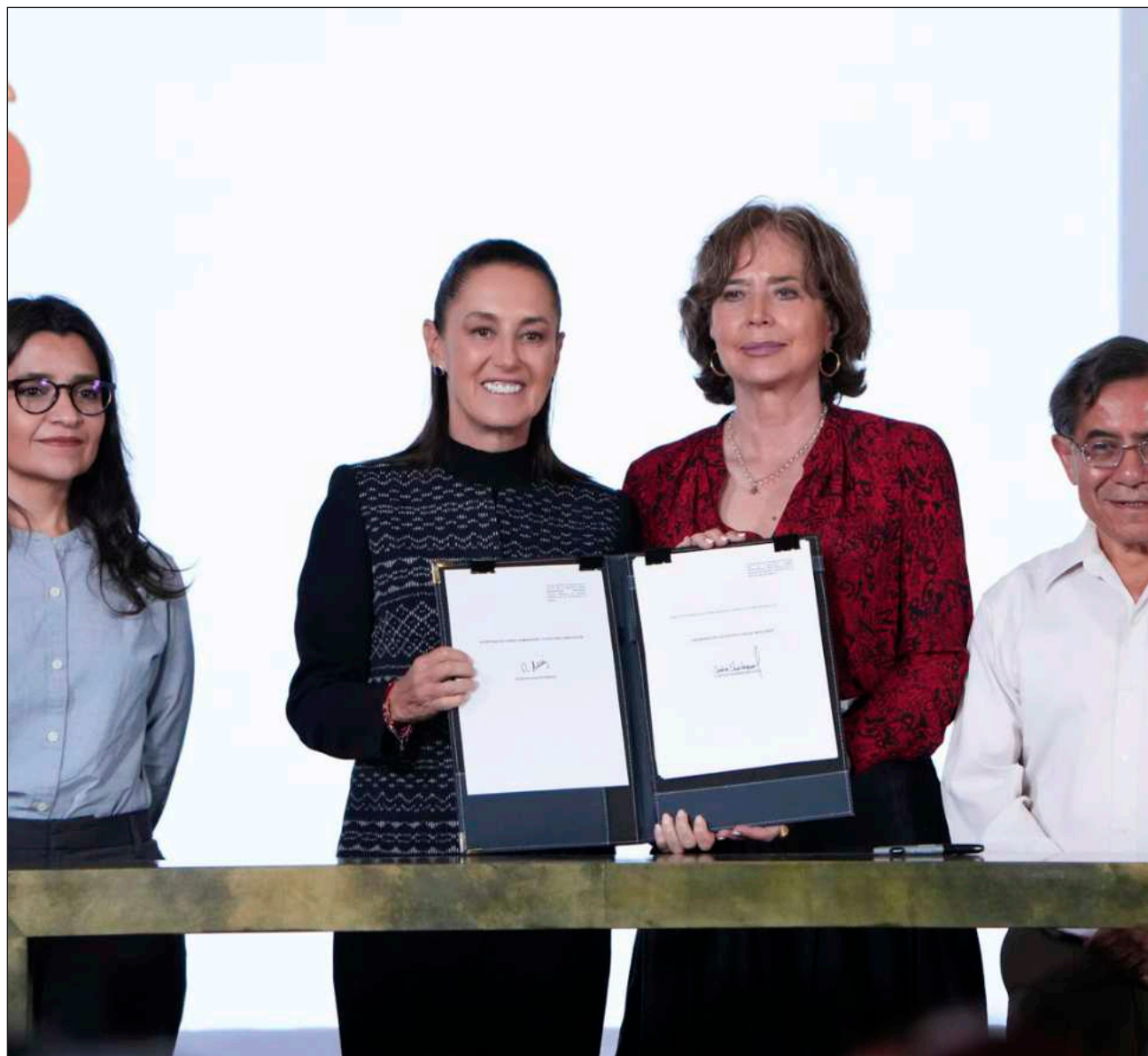
▲ Una de las líneas de trabajo encomendadas por la Presidenta será el análisis del avance de la extrema derecha.

Las funciones son el 10 y 11 de julio, a las 20 horas, en el Centro Cultural Tapanco. El costo de entrada será de 120 pesos para público general y de 100 pesos para estudiantes y personas que acuden en bicicleta.