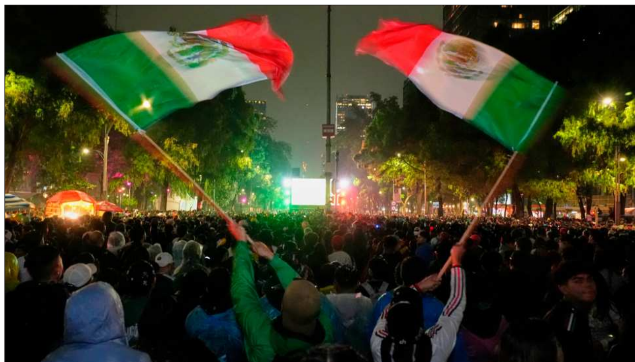
▲ La presidenta de la República, Claudia Sheinbaum Pardo, expresó su pésame por las personas que murieron durante las celebraciones en el Ángel de la Independencia. Entre los decesos se registra un hombre de aproximadamente 30 años, aún sin identificar.

La jefatura de Gobierno de la Ciudad de México está en contacto con las familias de los fallecidos