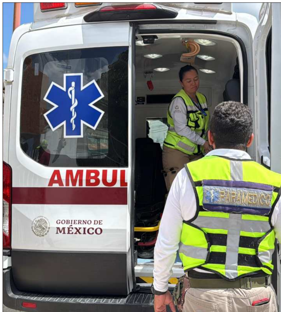
▲ Los expertos señalaron que la situación se convierte en preocupante, principalmente los fines de semana, cuando la demanda del servicio aumenta.

Indicaron que la falta de esto no se deriva de una "falta de vocación, de humanismo o de disposición para ayudar. La realidad es otra: existe un déficit de infraestructura y recursos". Situación que se convierte en preocupante, principalmente los fines de semana, cuando la demanda del servicio aumenta. Hizo un llamado a la población para que apoyen a instituciones privadas y grupos de voluntarios.