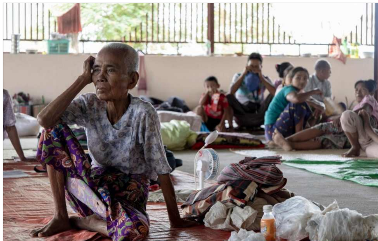
▲ Hubo activistas prodemocracia que salieron de las ciudades y empezaron a combatir a la junta dentro de movimientos armados encabezados por minorías étnicas, hostiles desde hacía tiempo al poder central.

En aquel entonces, las manifestaciones en contra del golpe fueron duramente reprimidas por las fuerzas de seguridad, pero hubo ac-