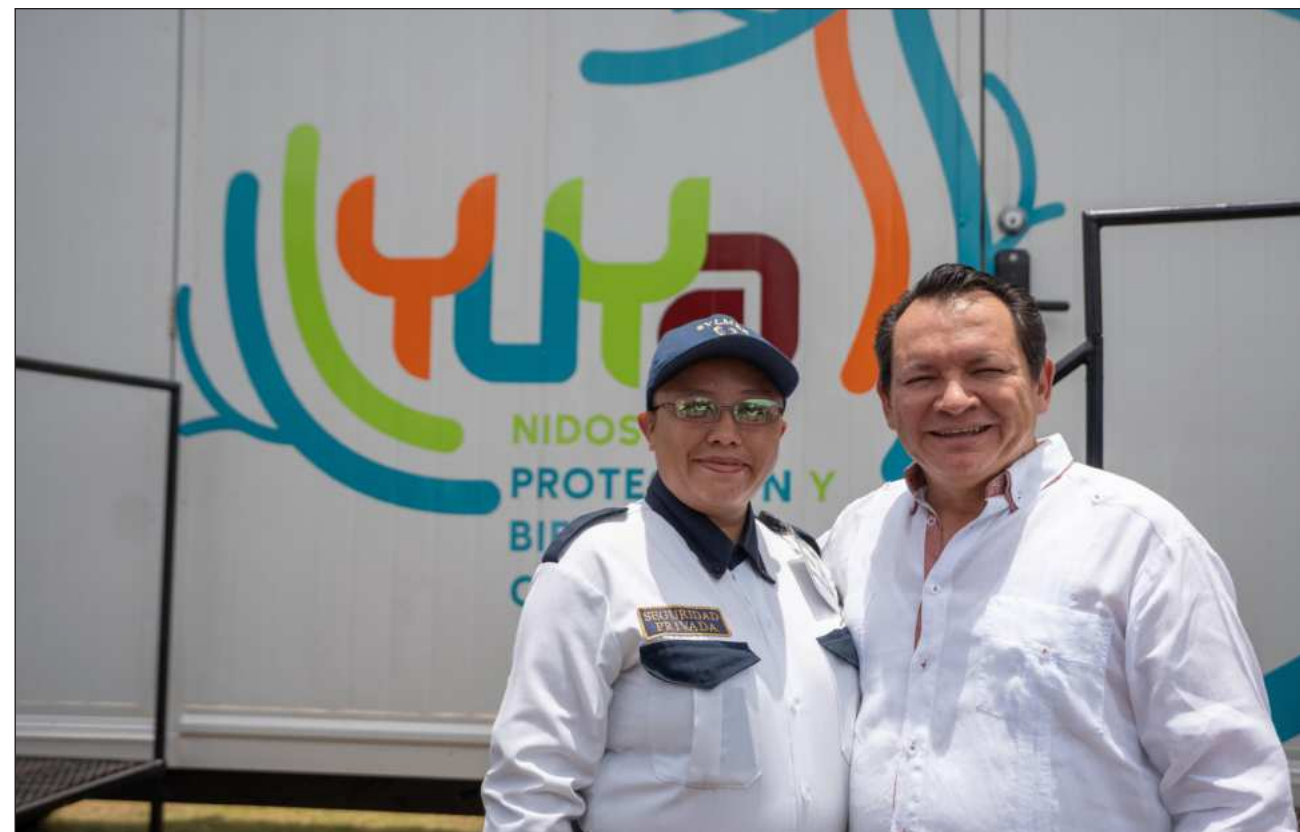
▲ El gobierno de Yucatán puso en marcha el nuevo Modelo de Prevención y Atención a las Víctimas, una iniciativa que busca país fortalecer la atención a las causas y expresiones de las violencias.

El gobernador Joaquín Díaz Mena destacó que esta