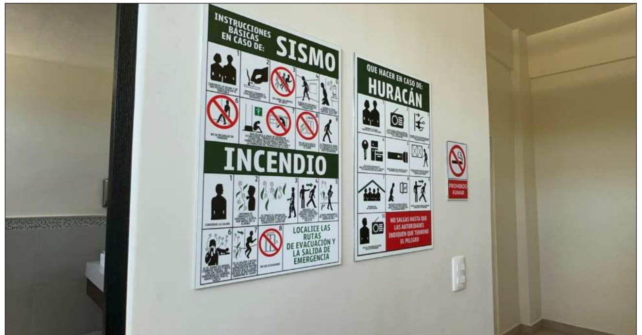
▲ De acuerdo con la Coeproc, históricamente el estado ha registrado dos sismos relevantes: uno en Felipe Carrillo Puerto, en 2002, y otro en Playa del Carmen, en 2015, sin que se reportaran afectaciones de consideración.

Indicó que actualmente la prioridad operativa sigue