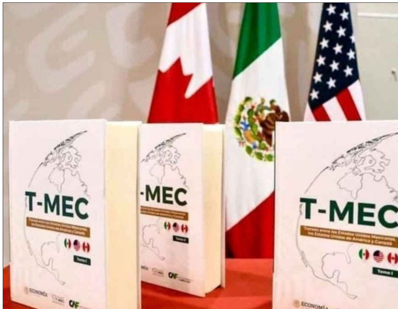
▲ Marcelo Ebrard añadió que el comercio entre los tres países continuará operando bajo las reglas vigentes.

El ministro de Comercio de Canadá, Dominic LeBlanc, también emitió una declaración, en la que reafirmó el respaldo de su país al T-MEC y a su eventual renovación.