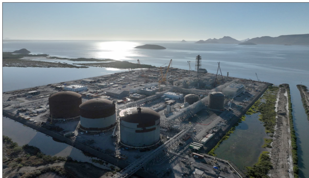
▲ La planta de GPO tendrá una capacidad de 800 mil toneladas anuales de amoniaco. Con ese volumen, la dependencia estimó que el país dejará de gastar 500 millones de dólares al año en importaciones.

A través del comunicado, la dependencia explicó que la producción de alimentos suficientes para reducir la vulnerabilidad frente al exterior requiere fertilizantes, y que estos, a su vez, dependen de la producción de amoniaco. Señaló que cerca de la mitad de la población mundial se alimenta gracias a fertilizantes derivados de ese químico.