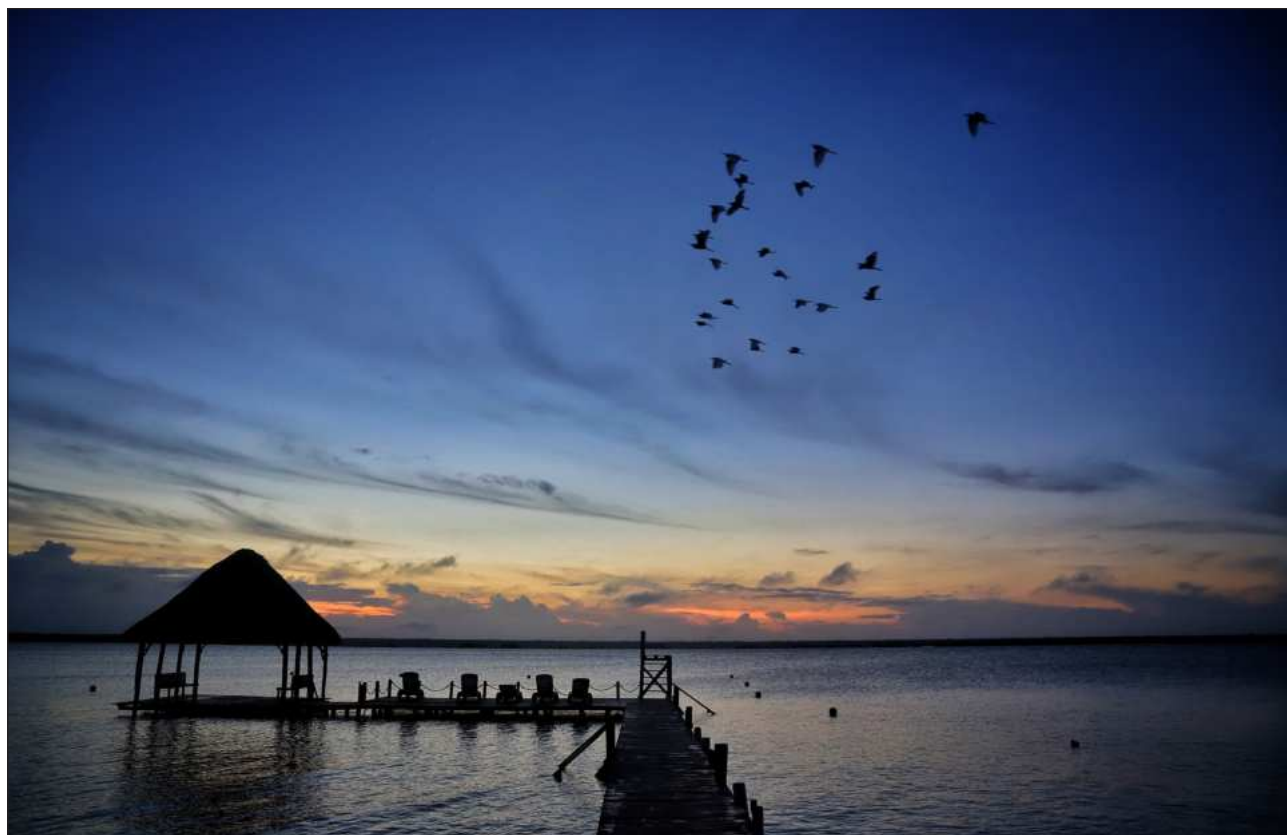
▲ Las y los integrantes refrendaron su compromiso de fortalecer la agenda climática estatal mediante la coordinación de acciones estratégicas que permitan incrementar la resiliencia de Quintana Roo frente a los efectos del cambio climático.

La comisión es un órgano institucional permanente encargado de coordinar, dar seguimiento y evaluar el Programa Estatal de Acción ante el Cambio Climático, así como for-