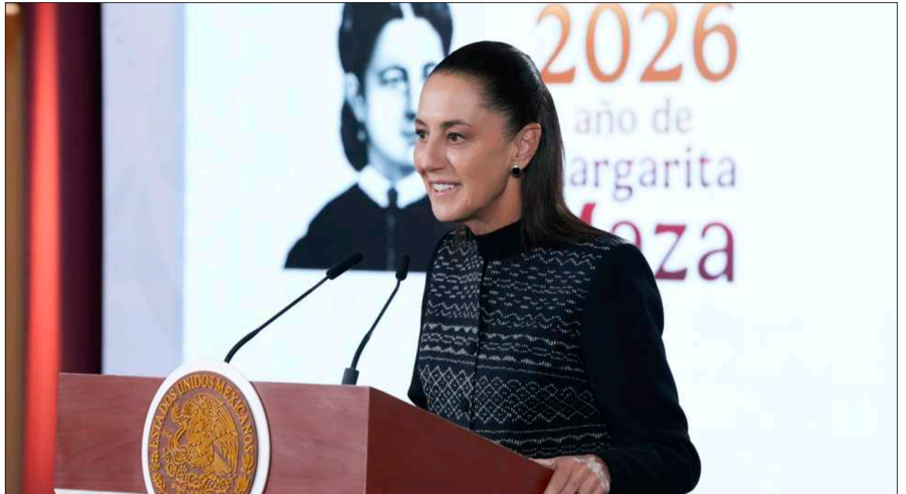
▲ La presidenta Claudia Sheinbaum Pardo subrayó que “cuando hemos solicitado, por ejemplo, en el caso de extradición, ellos nos piden pruebas. O sea, es una práctica común que se pidan pruebas de uno y de otro lado”.

En la mañana , reprochó que de nueva cuenta, Estados Unidos diga que “ocurre algo sin ninguna prueba. Así pasó con las tres instituciones financieras (sobre las) que de manera unilateral el Departamento del Tesoro tomó una medida. Cuando nosotros le pedimos que dieran las pruebas para que pudiéramos acompañarlos en ese proceso, sólo se enviaron dos páginas sin pruebas”.