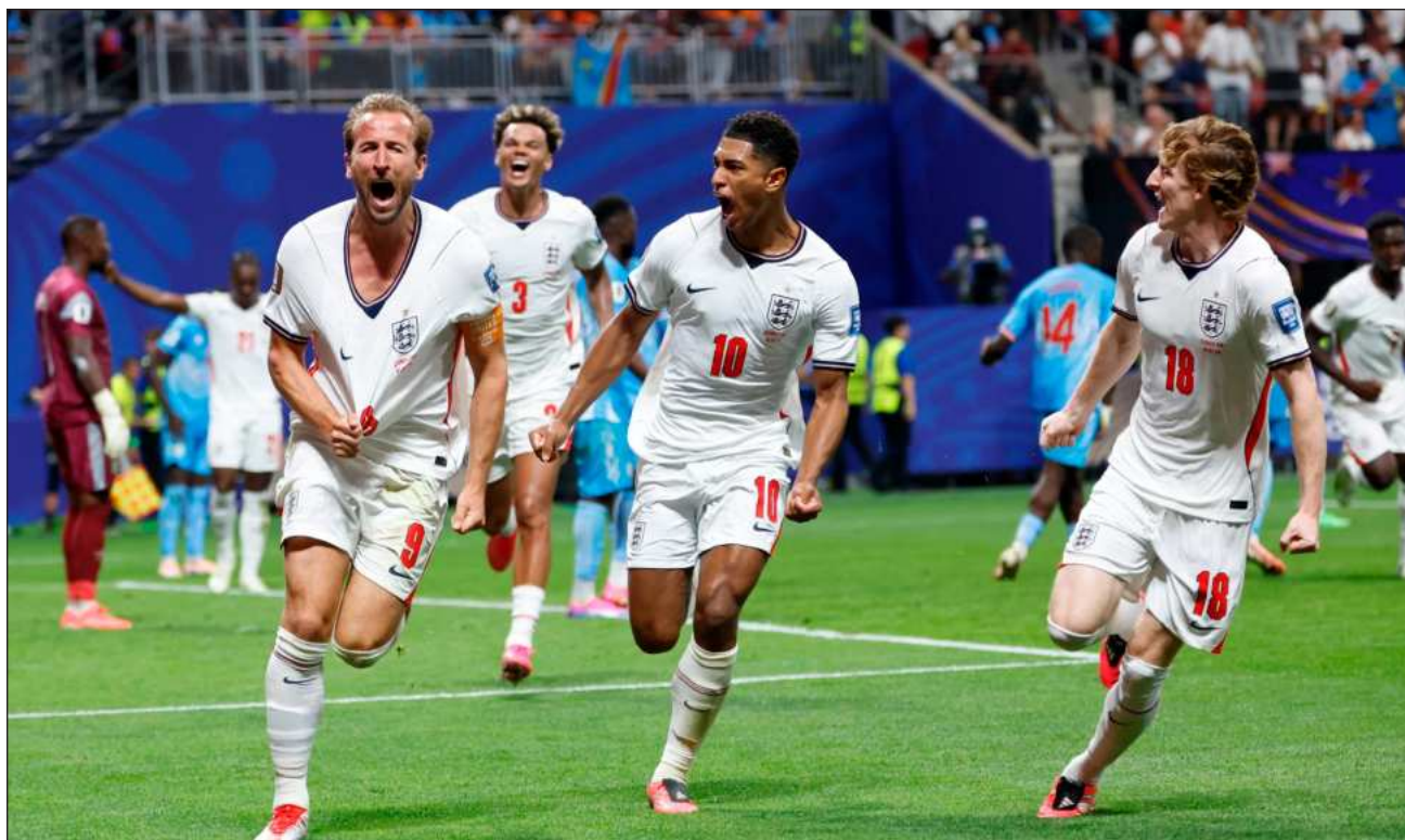
▲ En total, el delantero Harry Kane suma una cifra récord de 84 goles con la selección de los Tres Leones .

“Se trataba simplemente de seguir insistiendo, y nuestro momento llegaría”, manifestó Kane. “Hablamos de atreverse a ser el héroe. Puede ser cualquiera del equipo, y me tocó el día”.