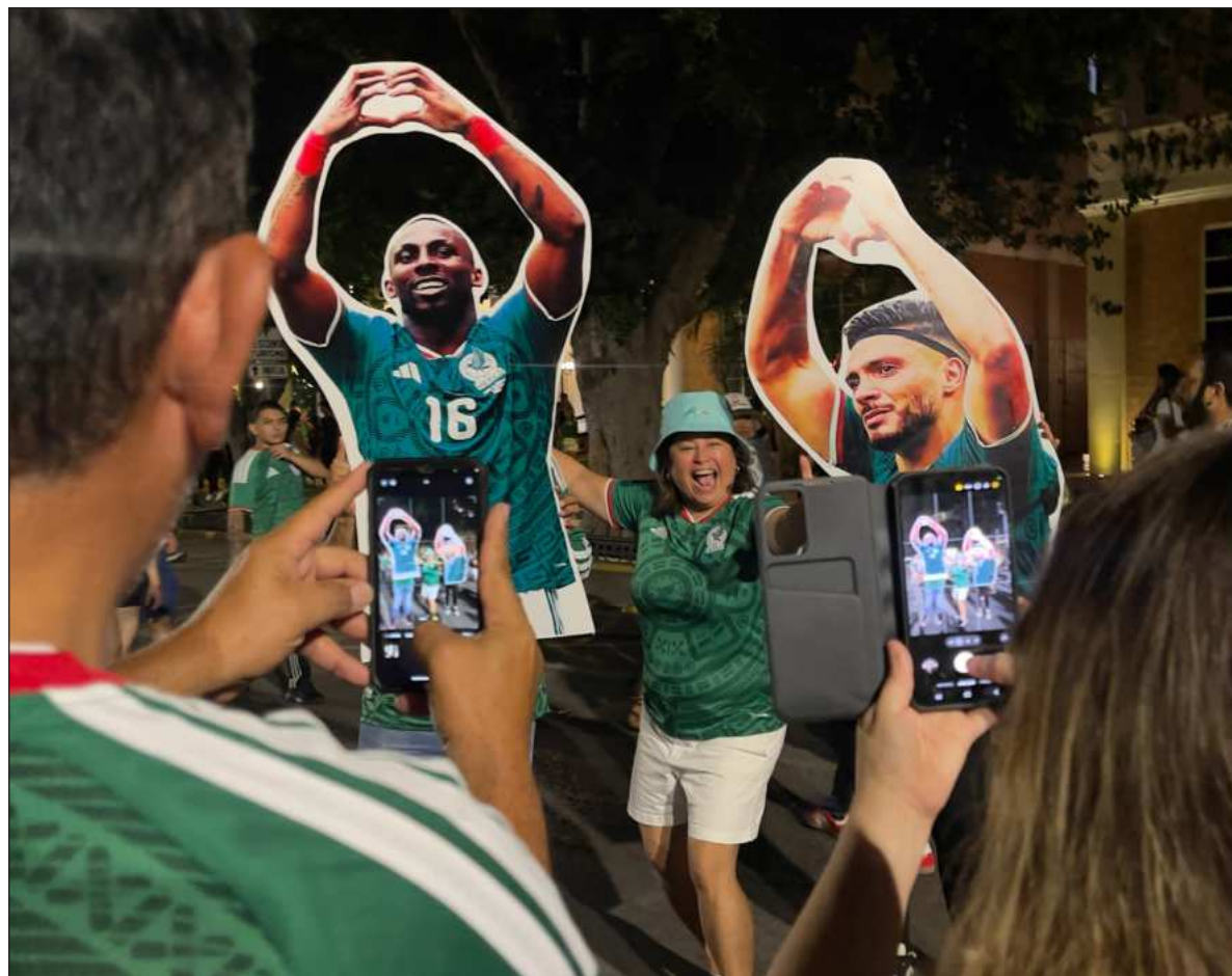
▲ "Quizá por eso la pasión requiere también paciencia y tolerancia. Comprende que la realidad nunca coincide por completo con nuestros deseos".

A esta confusión suele añadirse otro elemento: la prisa. Con frecuencia queremos concluir una decisión o realizar un proyecto lo antes posible porque deseamos alcanzar rápidamente la satisfacción que imaginamos. Esa urgencia nos lleva a confundir el impulso con la convicción y el deseo momentáneo con un compromiso profundo. La prisa no siempre es señal de claridad; muchas veces es la dificultad para tolerar la incertidumbre, la espera y