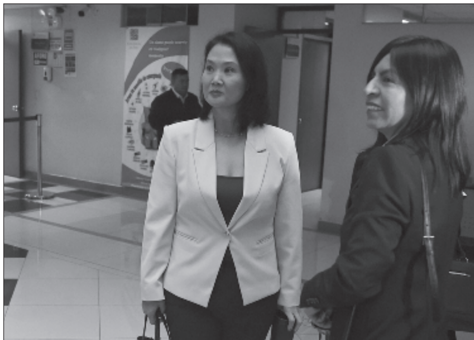
▲ Según la acusación, la constructora brasileña le entregó 1,2 millones de dólares a Fujimori dentro del esquema de sobornos que montó alrededor de América Latina.

El juicio -en el que están citados unos mil 500 testigos- podría tardar más de un año. El fiscal del caso, José Domingo Pérez, llegó a la audiencia con chaleco antibalas y bajo fuerte res-