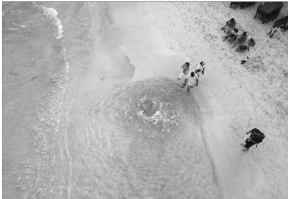
▲ El fenómeno captó la atención de bañistas en Playa del Carmen y Cozumel.

“Siempre en las cuencas hidrológicas, ya sea que haya montañas o no, el agua se infiltra si no es absorbida por las raíces de los árboles, que también es otro proceso muy importante e interesante. La infiltración hacia los tejidos de los árboles sube hacia las ramas y finalmente a las hojas, donde el líquido se evapora, es un proceso que se conoce como evapotranspiración. Se transpira en forma de vapor de agua hacia la atmós-