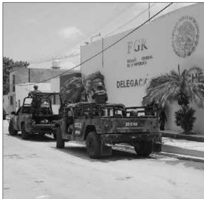
▲ Una reforma a la FGR no debe emprenderse a la ligera, en el tema hay mucha ciudadanía a la cual escuchar y cuya aportación puede ser sumamente enriquecedora.

Nadie podría negar que las fiscalías requieren de una transformación que las haga más eficientes a los ojos de la población en general. En esta misma administración corrieron bromas en las cuales se comparaba a la FGR con una tortuga reumática, por la velocidad con que realiza las investigaciones e integra las correspondientes carpetas. Es obvio que, en la percepción de la ciudadanía, se trata de organismos que requieren de una transformación radical y que debe incorporar protocolos de atención digna para quienes acuden a levantar una denuncia. Es ahí donde comienza la inhibición para presentar cargos y con ello el fomento a la impunidad.