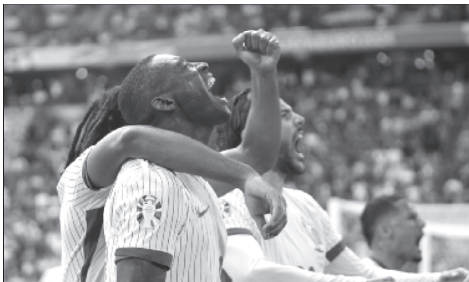
▲ El francés Randal Kolo Muani y sus compañeros celebran el gol con el que eliminaron a Bélgica.

Ese choque representará una revancha de la final de la