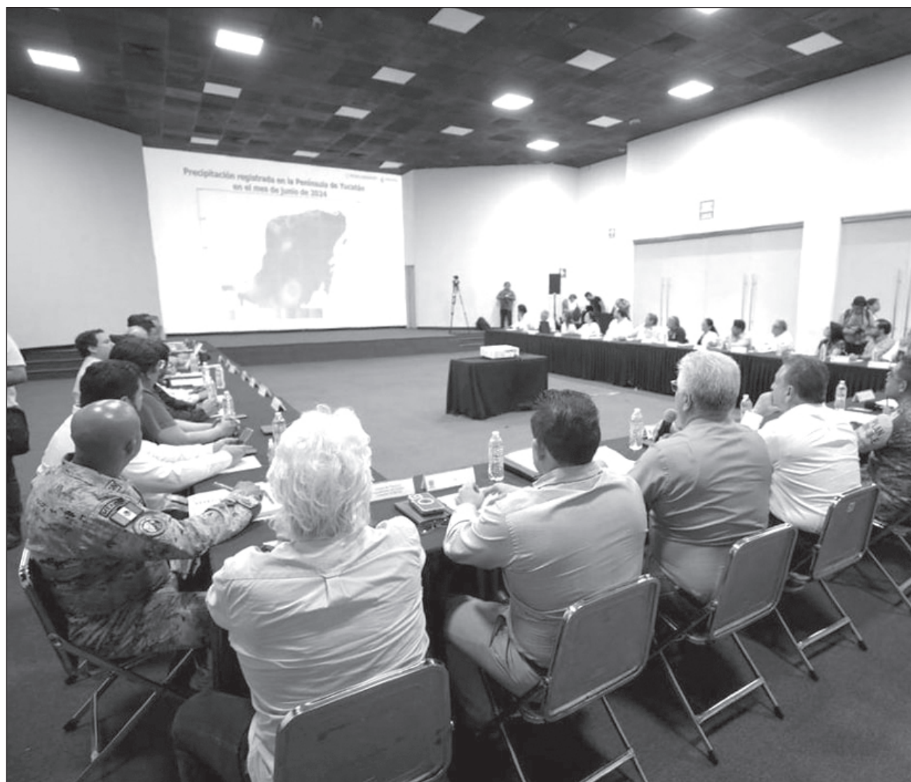
▲ Las autoridades estatales realizan acciones anticipadas sobre el acercamiento de Beryl y llamaron a la población a mantener la calma e informarse sobre la evolución del fenómeno natural únicamente a través de los canales oficiales.

No obstante, continuó, se están realizando acciones anticipadas, dada la consciencia preventiva y el pronóstico, toda vez que lo principal para la administración estatal es preservar