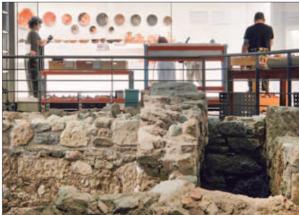
▲ Más de 1.5 millones de personas visitan cada año el Museo de la Acrópolis, cuyo propósito es conectar visualmente con el Partenón y otros templos.

Los restos del barrio sobre el que se erigió el Museo de la Acrópolis reconstruyen un complejo de calles, viviendas con amplias ha-