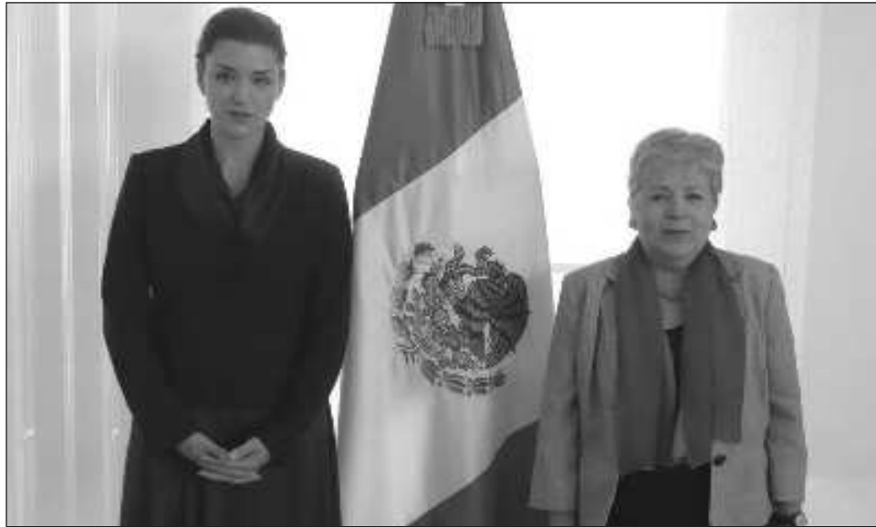
▲ Las prioridades de la actual presidencia del Gafi serán: promover la inclusión financiera para reducir el uso de efectivo y canales no regulados, a fin de disminuir los riesgos de lavado de dinero.

El programa de trabajo será guiado por el principio de inclusión, mediante el cual se busca promover la inclusión financiera, la cohesión de la red global, conformada por más de 200 jurisdicciones, una mayor integración de los actores