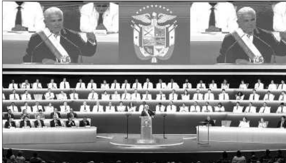
▲ "No permitiré que Panamá sea un camino abierto a miles de personas que ingresan ilegalmente a nuestro país aupados por toda una organización internacional relacionada con el narcotráfico y el tráfico de personas", subrayó el presidente José Raúl Mulino.

El nuevo líder panameño considera que ese flujo mi-