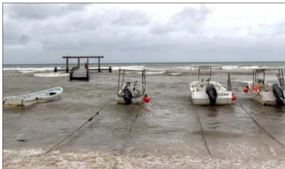
▲ La movilización de embarcaciones la harán a través de siete rampas privadas, debido a que la pública está ocupada por las obras del puente Nichupté.

Toda la salida de embarcaciones será por el bulevar Kukulkán, dependiendo de