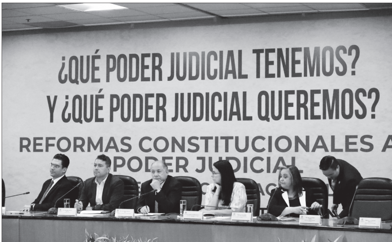
▲ “La participación de los ministros de la Suprema Corte de Justicia en el foro donde se discutió la propuesta de cambiar el sistema de selección de jueces y magistrados sucedido la semana pasada, al menos ha despertado la posibilidad de que el cambio de sistema no sea a rajatabla”.