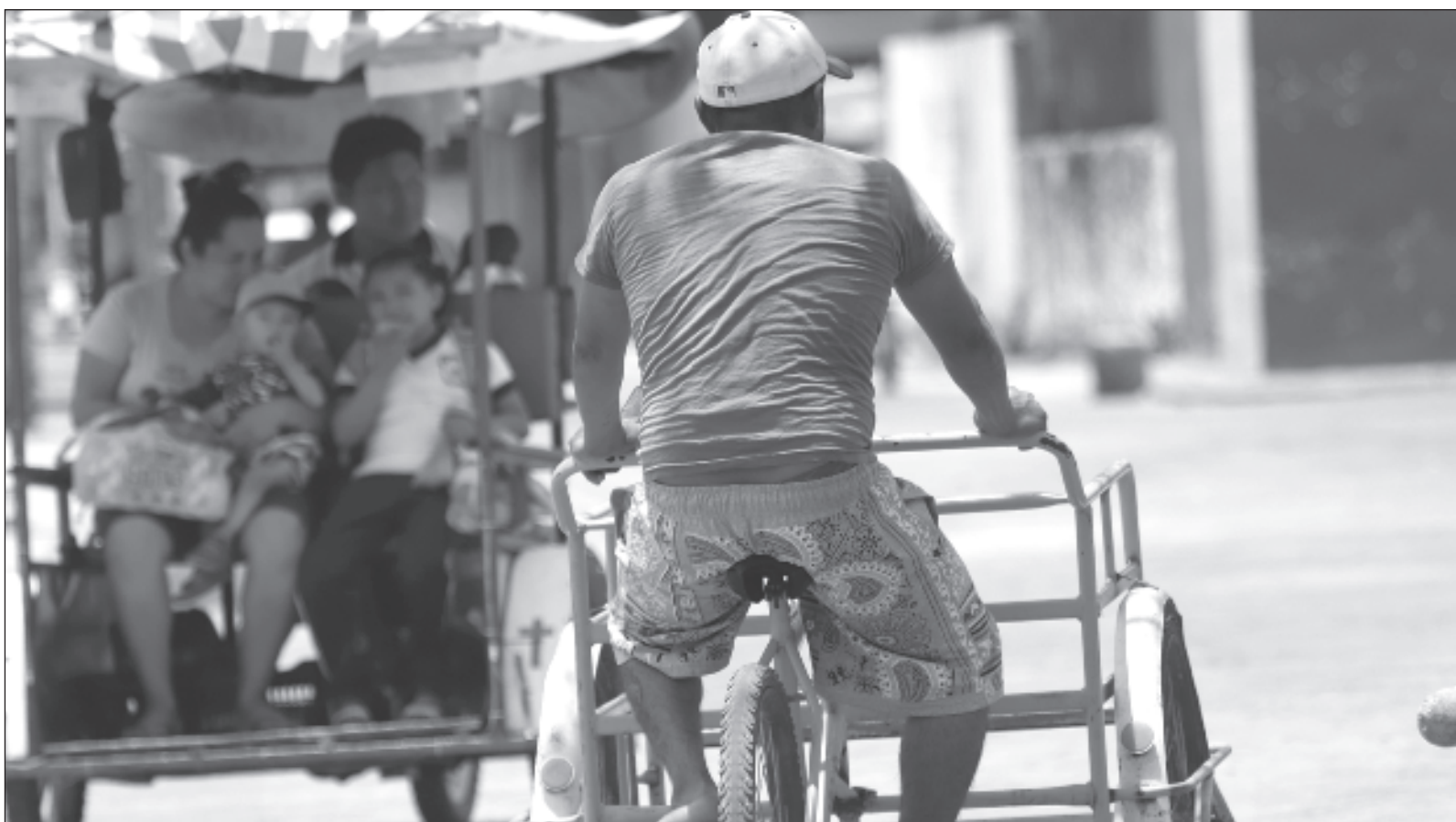
▲ “En la cotidianidad se cruzan diversas maneras de ver el mundo, de sentirlo y de proyectarlo, de tal forma que la vida aparece mucho más rica y conflictiva”.