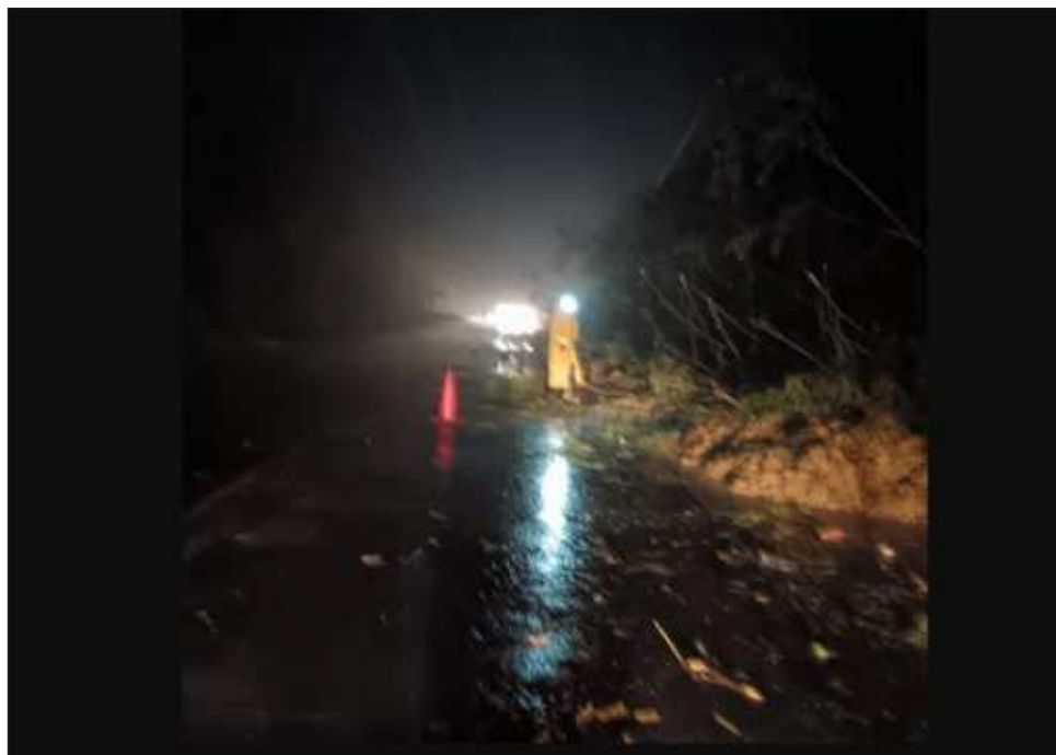
▲ En la carretera Chote-Papantla la circulación fue cerrada debido a la caída de árboles, al igual que en el tramo carretero Altotonga-Orilla del Monte.

En los municipios de Huiloapan y Tlilapan se activó el Plan Tajín por parte de la Secretaría de Seguridad