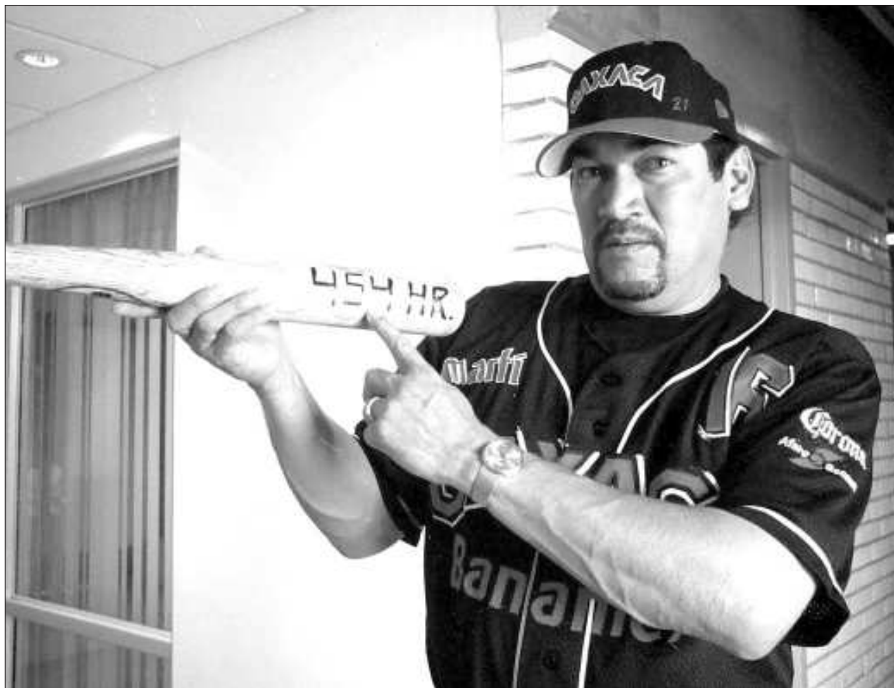
▲ El Almirante tuvo un paso impecable en cuatro de los más grandes equipos de la LMB: Diablos Rojos de México, Tecolotes de Nuevo Laredo, Guerreros de Oaxaca y con el equipo de su estado natal, los Piratas de Campeche.

Este reconocimiento postmortem será entregado el 16 de julio próximo en la explanada Arturo Shields Cárdenas en el marco del inicio de la Feria Carmen 2024.