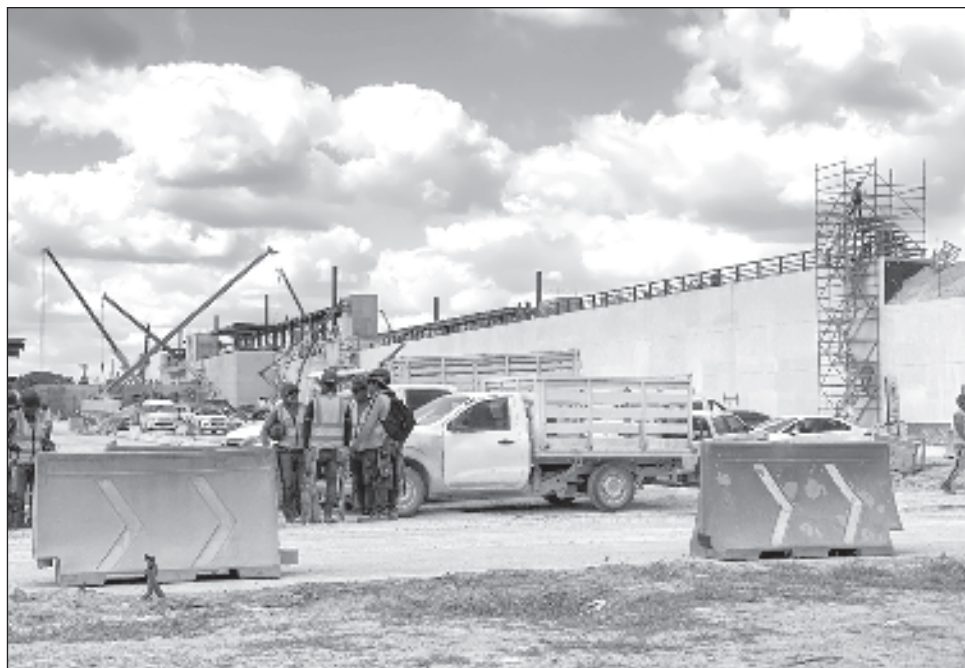
▲ “Tenemos trabajando en el Tren Maya 125 mil obreros, de los mejores obreros del mundo, que son los trabajadores mexicanos, y ya se va a terminar el tren y ¿qué hacer con esos trabajadores? bueno, ya la presidenta electa tiene sus proyectos nuevos”, subrayó el Presidente.

Mencionó que la industria de la construcción reactiva rápidamente la economía, sobre todo en estados como Campeche, Quintana Roo y en el sureste en general,