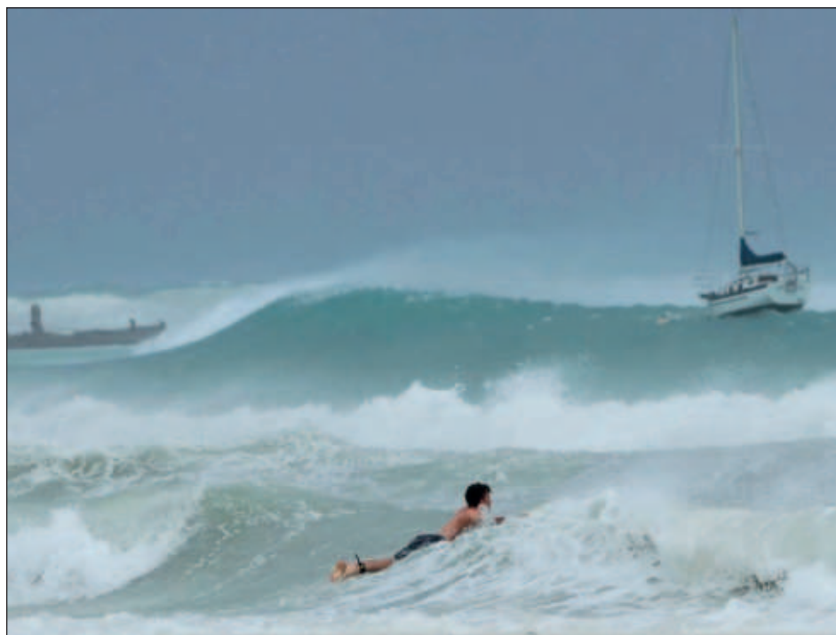
▲ Beryl es el primer huracán de categoría 5 en el Atlántico, impulsado por sus aguas récord de temperatura; hay al menos un muerto y las comunicaciones están interrumpidas en la región.

La tormenta partió árboles de plátano por la mitad y mató vacas que yacían en