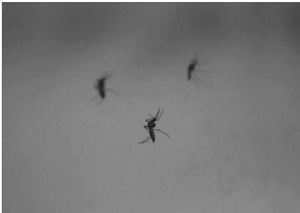
▲ El medicamento IXCHI obtuvo la autorización de la Comisión Europea obtenida para comercializar la nueva vacuna para las personas mayores de 18 años.

La autorización para comercializar la vacuna en Europa contó con el visto bueno de todos los países miembros de la Unión Europea, tras una evaluación positiva de la Agencia Europea de Medicamentos (EMA).