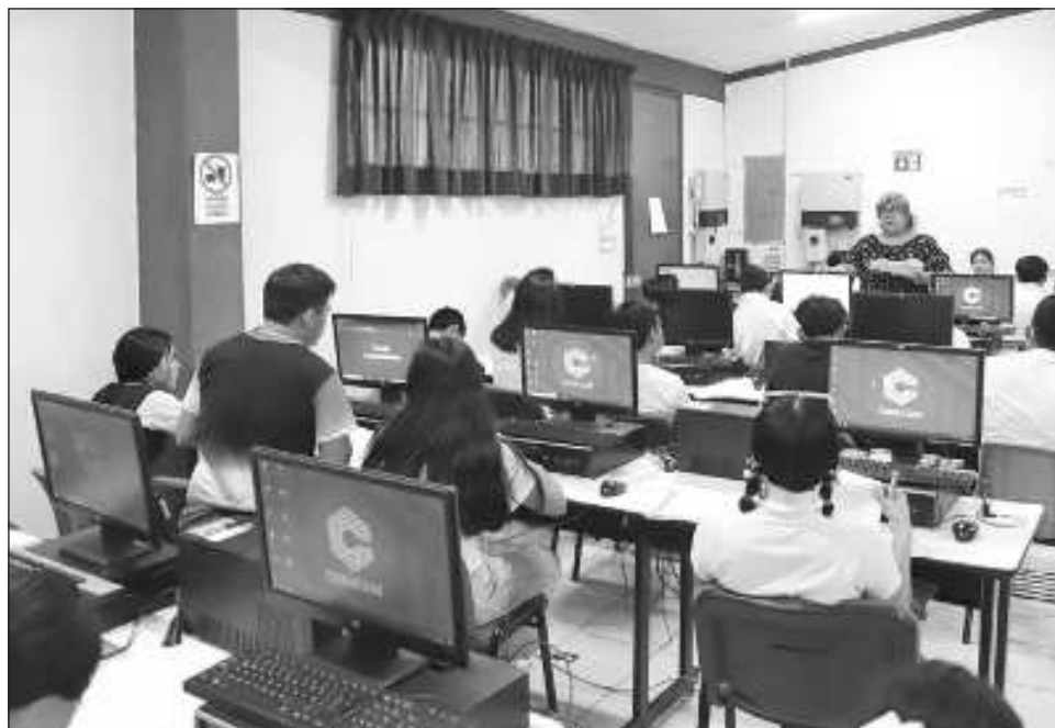
▲ Los programas académicos, alineados a la Nueva Escuela Mexicana promueven la creatividad, el trabajo en equipo y el pensamiento crítico para los desafíos futuros.