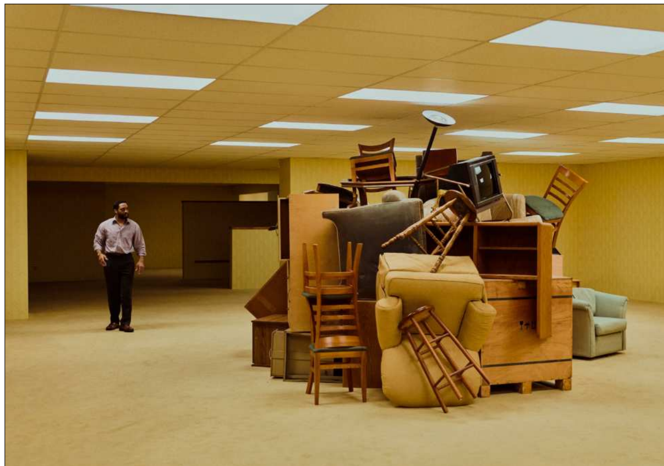
▲ Backrooms, la película de terror más comentada por estos días, protagonizada por los actores nominados al Oscar Renate Reinsve y Chiwetel Ejiofor, y cuyo título proviene de un concepto que surgió a finales de la década de 2010, es la creación de Kane Parsons.

sus películas. “Mi mundo en YouTube, todo el entorno en el que he crecido, ha exigido una atención al detalle extremo desde el principio”, afirma. Incluso antes de que su vídeo entre bastidores se hiciera viral, Parsons ya había acumulado una gran cantidad de seguidores en YouTube con sus videos de fanfic , que expandían con cariño y esmero el universo de su videojuego favorito: Attack on Titan . “La gente, incluyendo a mí, aprecia ese nivel de profundidad, y creo que eso, inherentemente, nos obliga a ser muy rigurosos con lo que debemos hacer creativamente”. Dicho sea de paso, Parsons no tiene planes de abandonar YouTube para dedicarse a lo que considera más prometedor en el mundo del cine.