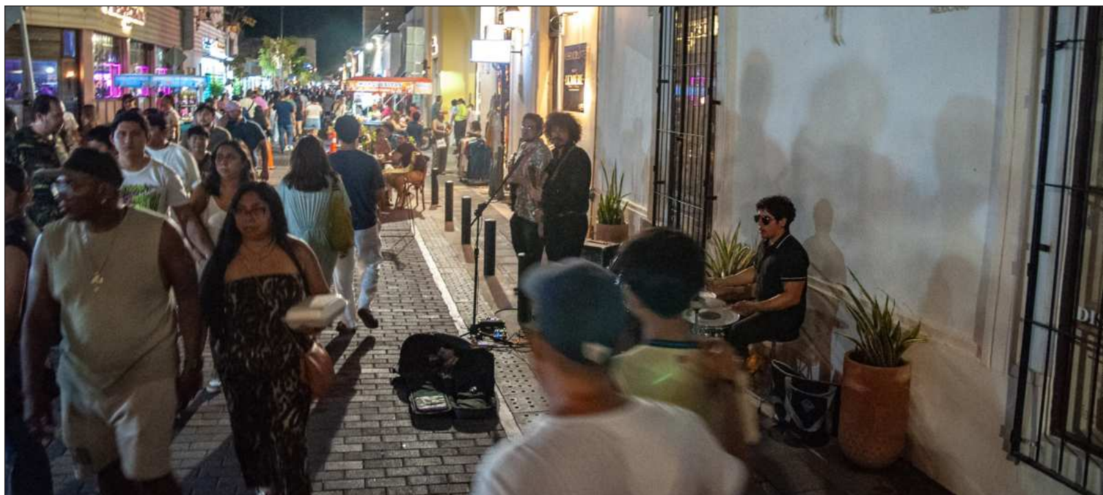
▲ “Algunos gestores y promotores ‘culturales’ confunden con mucha facilidad estos acontecimientos: creen que si ofrecen al público música popular y comercial es porque las audiencias eso esperan, sin ponerse a pensar que la música alternativa tendría más poder socializador y culturizador”.

Otra circunstancia poco afortunada fue que la excesiva cantidad de eventos estuvieran encajados en dos días, el sábado 23 y el domingo 24, cuando bien pudieron suceder a lo largo de una semana, para que los ciudadanos tuvieran la oportunidad de acudir a la mayor diversidad de actos. Para muchos que quisieron asistir a los otros eventos, resultó imposible, lo cual fue realmente frustrante. Ojalá que, en las próximas ediciones de la Noche Blanca, los responsables de la planeación y la operación tomen en cuenta el carácter formativo que deben cumplir los eventos, lo cual eliminaría el enfoque del entretenimiento, y determinen menor cantidad y mayor calidad de los actos.