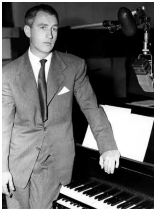
▲ Del músico veracruzano existen más de 228 composiciones, más de 500 personajes y alrededor de 3 mil 560 páginas de textos y cuentos.