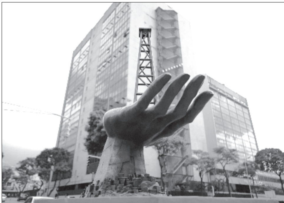
▲ El presidente venezolano, Nicolás Maduro, denunció ayer que el restablecimiento de las sanciones de Estados Unidos contra la estatal Petróleos de Venezuela S.A. (Pdvs) generó pérdidas parciales de

más de 2 mil millones de dólares en los primeros cuatro meses de este año. “Un chantaje permanente del imperio norteamericano”, expresó el mandatario venezolano a través de cadena nacional.