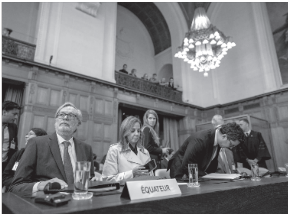
▲ El grupo de abogados de la defensa ecuatoriana ante la Corte Internacional de Justicia, afirmó que se han brindado todas las facilidades para proteger la Embajada de México.