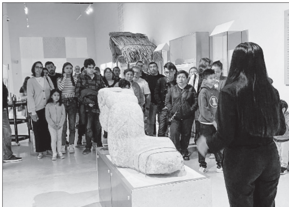
▲ El estado conmemora el Día Internacional de los Museos con actividades como conferencias, conciertos, talleres, exposiciones, bazares y recorridos guiados.