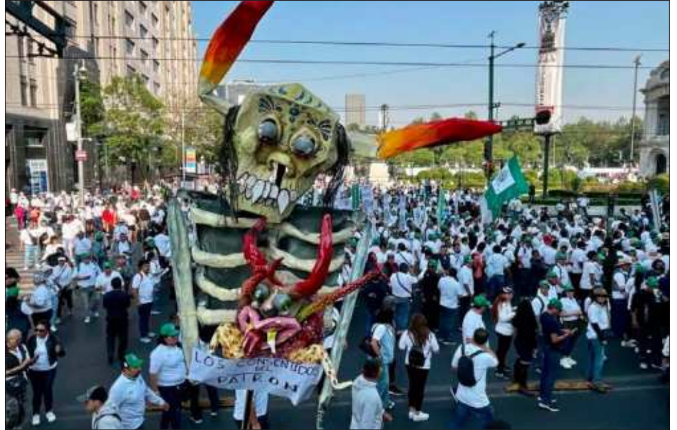
La marcha del Día del Trabajo transcurrió en medio de reclamos y propuestas, entre ellos la mejora de salarios contractuales y la reducción de los impuestos.

En contraparte, la Nueva Central de Trabajadores (NCT) saludó las reformas que han favorecido a los obreros mexicanos; sin embargo, señaló que "han sido insuficientes para reparar los daños ocasionados por las políticas neoliberales", como la democracia e independencia sindical; la recuperación del poder adquisitivo y la resolución de anteriores y