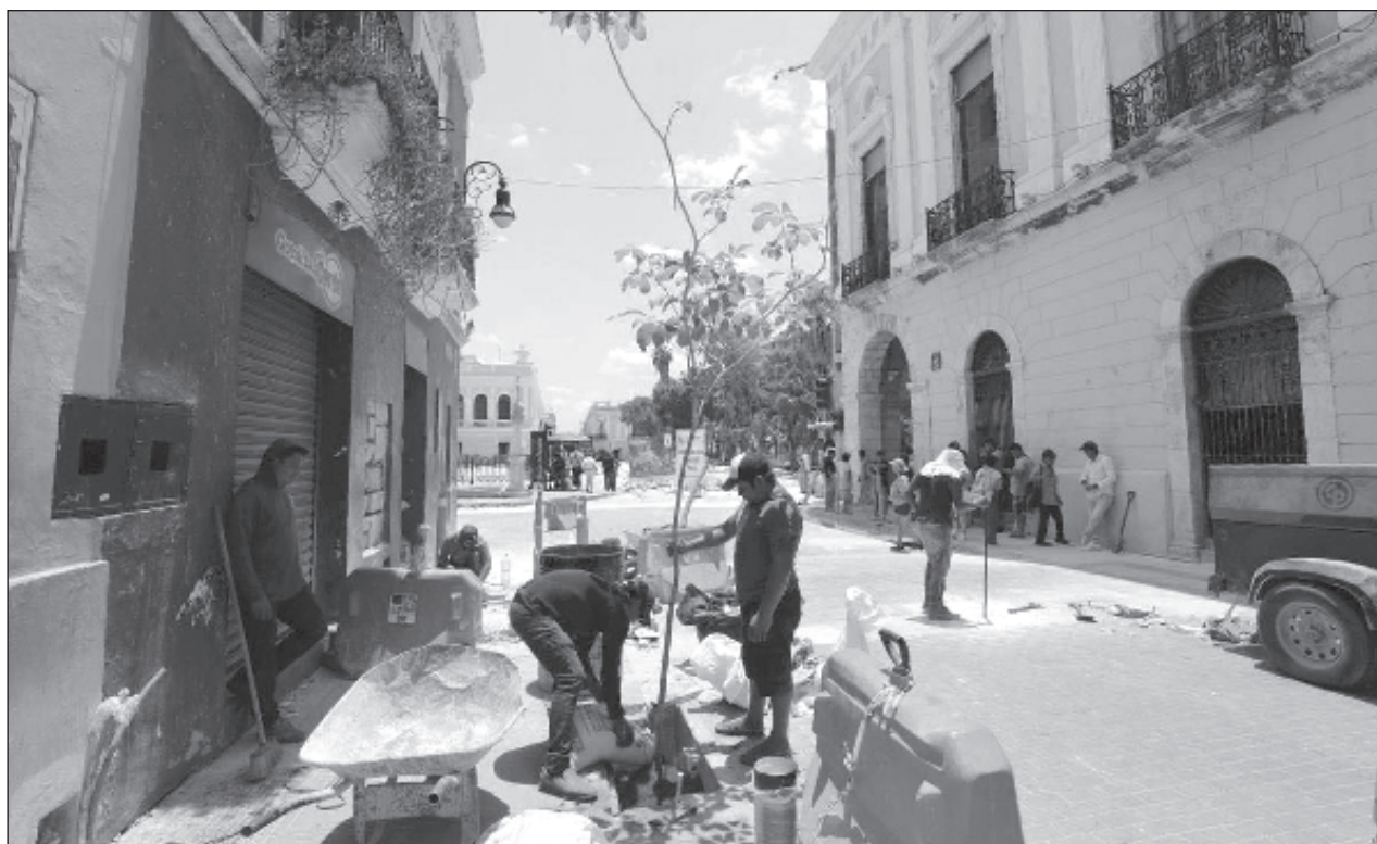
▲ Se realiza a buen ritmo la colocación gradual de un total de 150 árboles de la especie maculís, proyecto que promueve el gobernador Mauricio Vila y que tiene por objetivo a contar con más espacios verdes.

Este proyecto está contemplado en la Declaración Mérida 2050 y, con él, se mejorará un total de mil 750 metros lineales, con ampliación de calles, nuevas banquetas, ciclovía, postes de baja altura, podotáctiles para personas con discapacidad visual y fácil acceso y desplazamiento para quienes tengan alguna discapacidad motriz. También, se consideraron espacios de ascenso y descenso de pasajeros, así como para carga y descarga de mercancía.