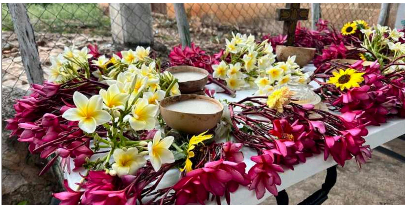
▲ "En esta relación ancestral que tenemos con las plantas nos hemos hecho a su servicio proliferándolas por cualquier lugar donde puedan germinar sus semillas".