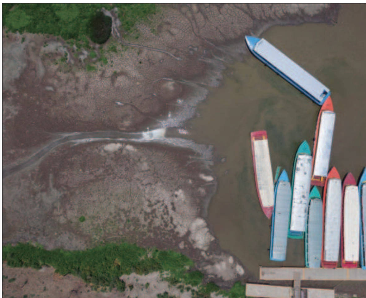
▲ “‘La Agenda 2030’ y sus famosos Objetivos de Desarrollo Sostenible que resaltan principalmente en los discursos políticos, pero en la práctica están por debajo de las expectativas generadas”.