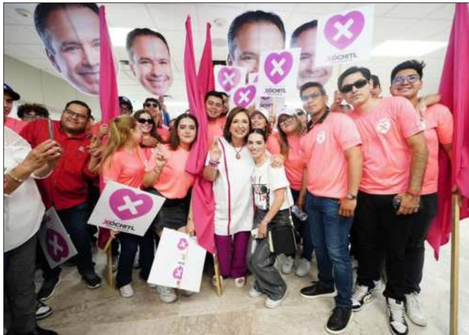
▲ Gálvez arribó el mediodía de ayer a Hermosillo, Sonora, donde ya la esperaba poco más de una veintena de simpatizantes con pancartas y porras en el aeropuerto.

“Esa es la crisis que están viviendo los agricultores,