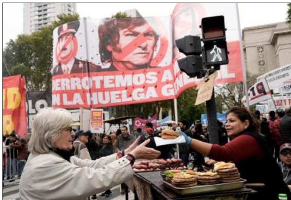
Los trabajadores protestaron ya que la iniciativa amplía los períodos de prueba y deroga multas contra empresas por empleados no registrados, entre otras políticas.

"Cuando todos los derechos sociales, laborales, sindicales y previsionales se encuentran amenazados, es un día de reivindicación y defensa de las conquistas y derechos adquiridos que se pretenden vulnerar sin respetar la voz de las y los trabajadores", expresó la Confederación General del Trabajo (CGT) en un docu-