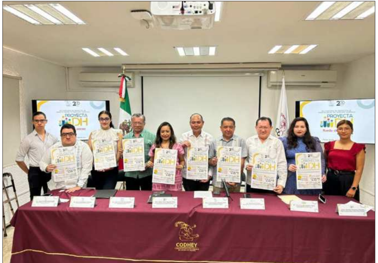
▲ U súutukil tu'ux jts'a'ab k'ajóoltbil le ketlamo'.

Le molayilo'ob ku beetik'ob le payalt'aanila' leti' le je'elo'oba': CODHEY, Inaip Yucatán, APD "Manuel Crescencio García