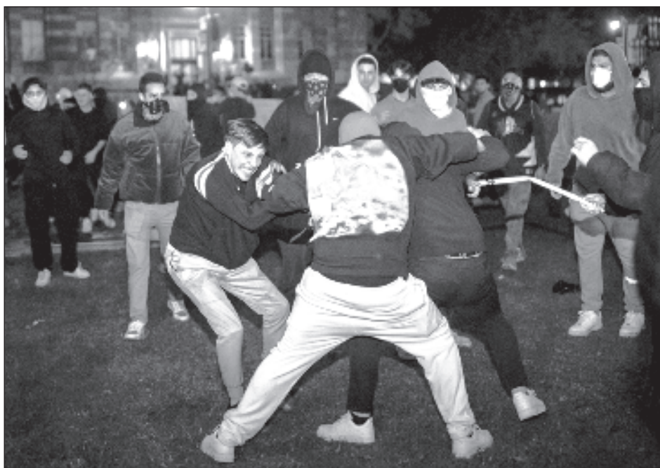
▲ Quince personas resultaron heridas en el enfrentamiento en la UCLA, una de las cuales fue hospitalizada, según el presidente del sistema de la Universidad de California.