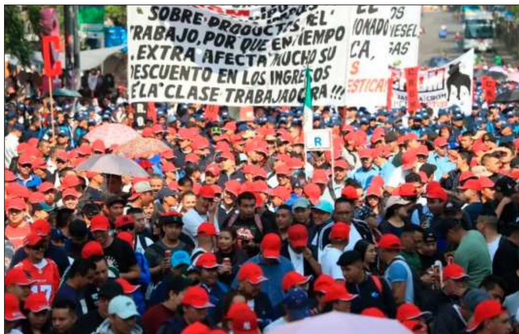
▲ Este miércoles se confirmó que la fortaleza de las organizaciones obreras se encuentra dispersa. Ya no es aquel bloque monolítico resultado de la concentración de organizaciones en la CTM.

En suma, el movimiento obrero sigue siendo un elemento orgánico del Estado mexicano a pesar de las diferencias en sus demandas y estas, aunque ya no vienen completamente del oficialismo, siguen respondiendo a intereses políticos sistematizados en los partidos y las alianzas efectuadas para las elecciones que tendrán lugar en un mes.