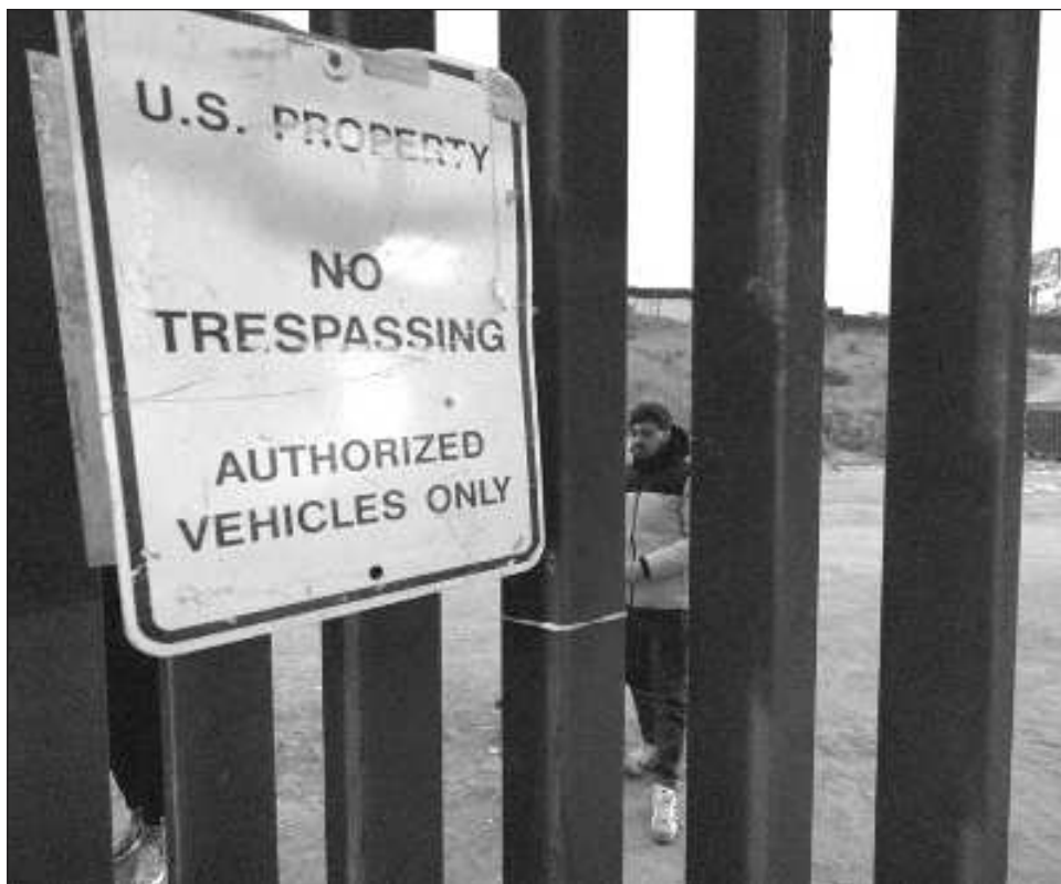
▲ La Oficina Estatal de Investigaciones de Oklahoma podrá recabar y conservar datos de las personas detenidas y procesadas, para cruzarlos con bases de datos estatales o federales.

Por ello, México expresó su preocupación ante la aprobación de dicha ley. A través de su representación consular en Oklahoma City, la cancillería mexicana dijo que se dará seguimiento a la enmienda y particularmente, al Grupo de Trabajo de Permisos de Trabajo Estatal y Visas de Oklahoma que anunció el gobernador Kevin Stitt para fortalecer la fuerza laboral y crear oportunidades de empleo.