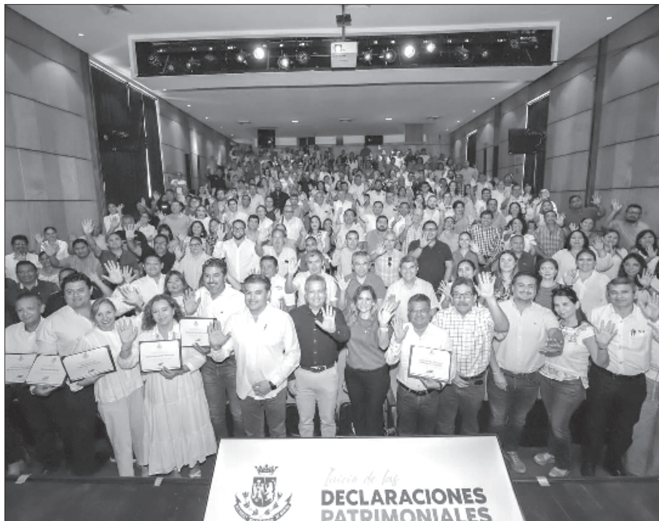
▲ El presidente municipal encabezó el miércoles la presentación del inicio de las Declaraciones Patrimoniales 2024 en el auditorio Silvio Zavala Vallado del Centro Cultural de Mérida Olimpo.