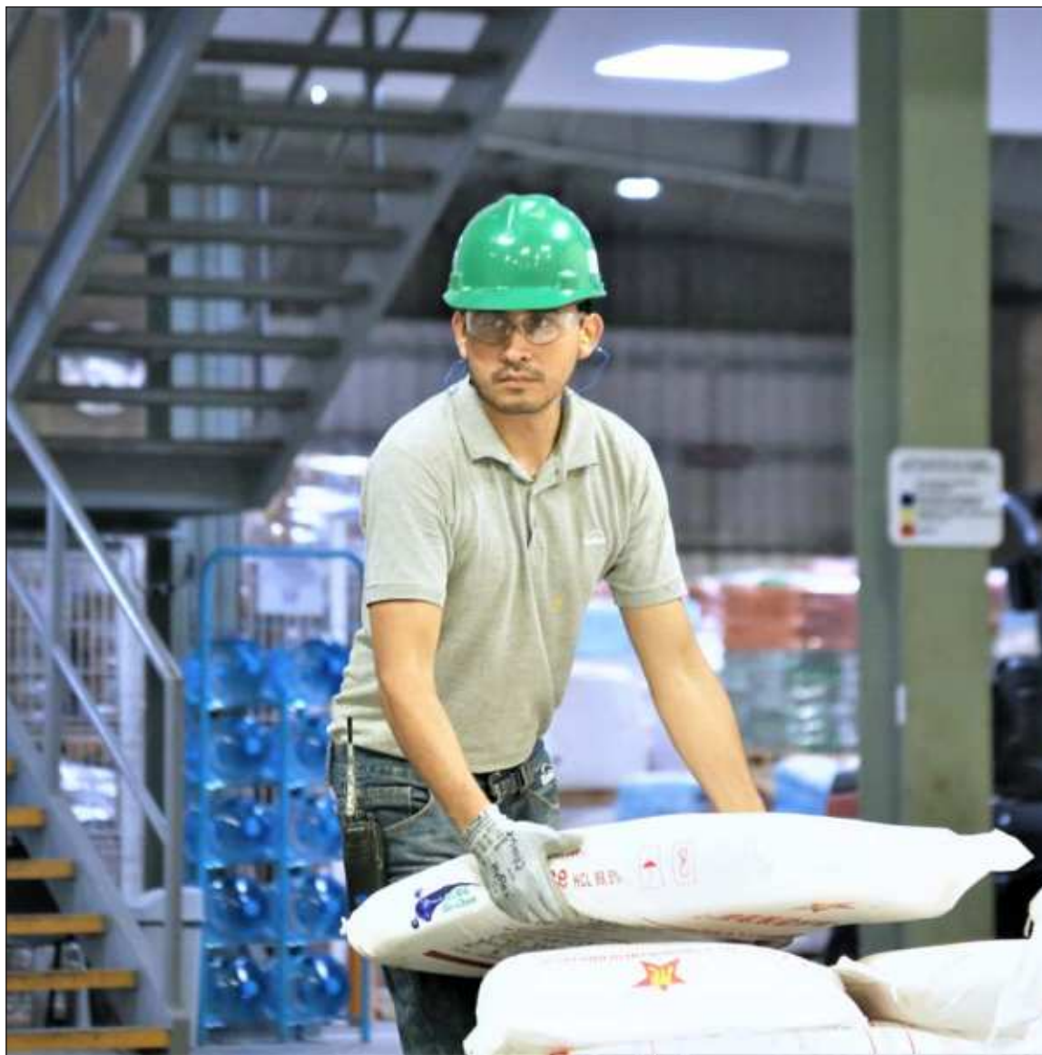
▲ En el caso de la empresa Kekén, obtuvieron el distintivo ELSSA sus tres plantas de alimentos balanceados ubicadas en los municipios de Umán y Hunucmá, así como la establecida en Komchén.

“Dentro de estas iniciativas destaca el tema de instalación de lactarios para las madres trabajadoras, implementación de programas para la prevención de accidentes en manos, tobillos, prevención de enfermedades respiratorias, de enfermedades en la columna. Iniciativas que nos validan a nivel federal como una empresa