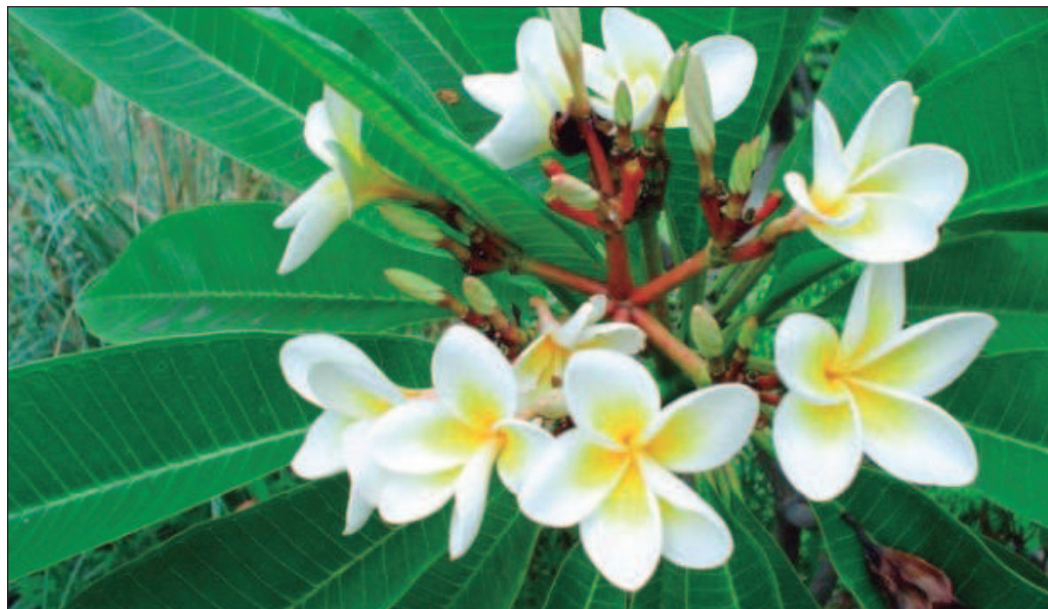
▲ "Sobre los límites de ese camino que tracé y olvidé, nacieron flores. Pequeñas flores amarillas y blancas de las que nunca supe sus nombres. Hablo de flores de verdad, en los caminos que emprendo".

Cuando regresé hace unos meses, creí poder insertar un ritmo heredado de un espacio distinto. En el acto de mudar, supuse también que era suficiente con trasladar algunos objetos valiosos y a mis dos gatos. Uno cree que un movimiento de esa