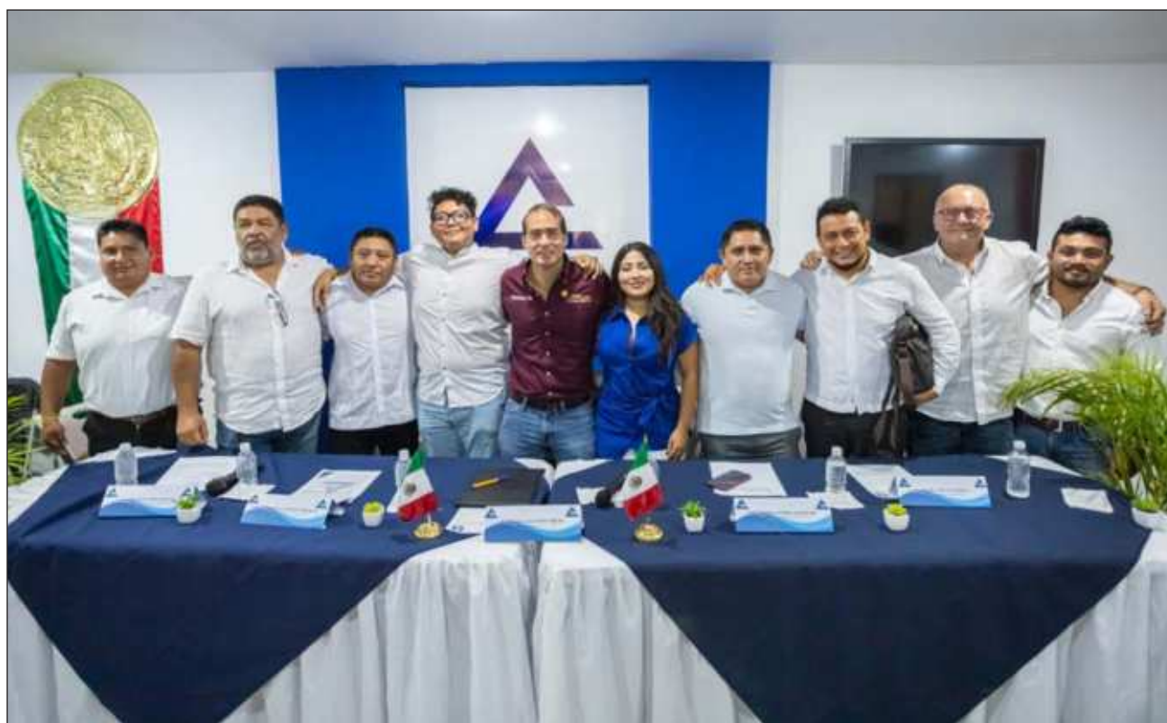
▲ El abanderado de Morena sostuvo un encuentro y diálogo con la Canaco-Servitur en donde habló de los planes y proyectos, que incluye una nueva estrategia de seguridad con más cámaras de videovigilancia.

Dijo que con los gobiernos de Morena se inició la trans-