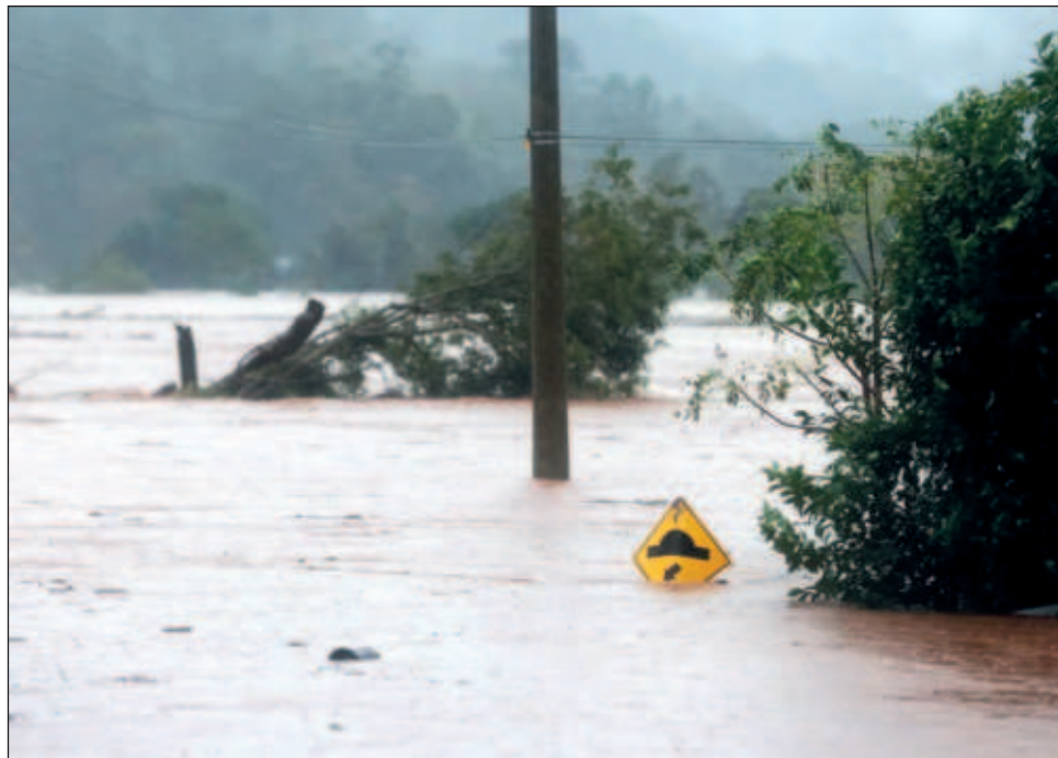
▲ “Estamos viviendo el peor momento en Rio Grande do Sul, el peor desastre de nuestra historia. Es absolutamente, absurdo, extraordinariamente grave lo que está ocurriendo en Rio Grande do Sul en este momento”, subrayó el gobernador Eduardo Leite.

Según el gobernador, las tormentas causaron la mayor devastación en el estado en los últimos años, dejando