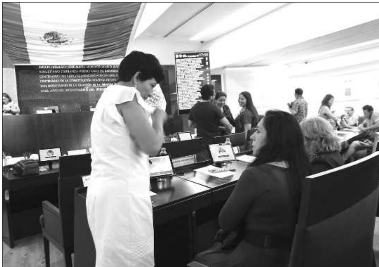
▲ La propuesta sobre revocación fue ingresada desde el año pasado por el grupo parlamentario del PRI y Movimiento Ciudadano, así como Morena, para reformar ambas iniciativas de armonización; sin embargo, ésta no se ha concretado en la entidad.