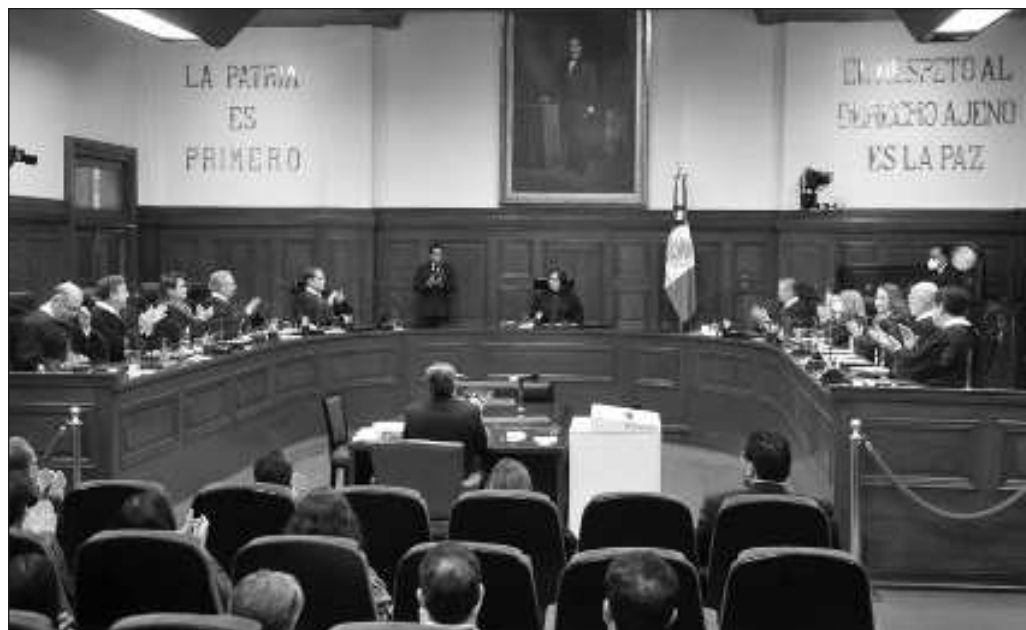
▲ ¿Cómo operaba la SCJN bajo la presidencia de Arturo Zaldívar que el Ejecutivo manifiesta ahora que había mayor vigilancia? ¿Significa que López Obrador percibía una mejor impartición de justicia?.

Un verdadero régimen republicano implica que el Ejecutivo, el Legislativo y el Judicial se vigilen uno al otro, y no que dos de estos poderes se encuentren sometidos a uno de ellos.