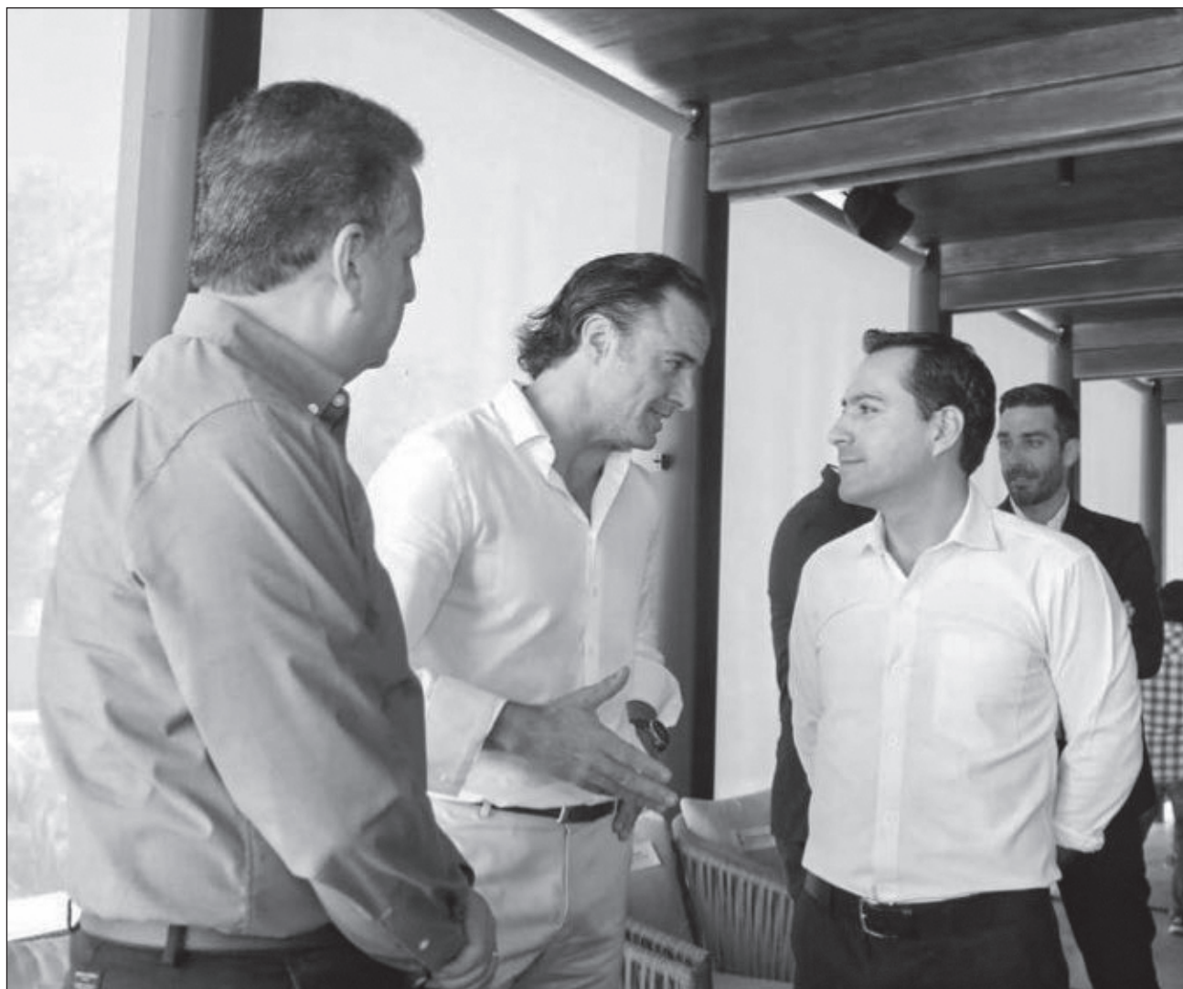
▲ El gobernador Mauricio Vila Dosal recordó que para 2023 y 2024 llegarán a la entidad proyectos por más de 900 millones de dólares de empresas afiliadas a la Asociación de Desarrollos Inmobiliarios de México (ADI).