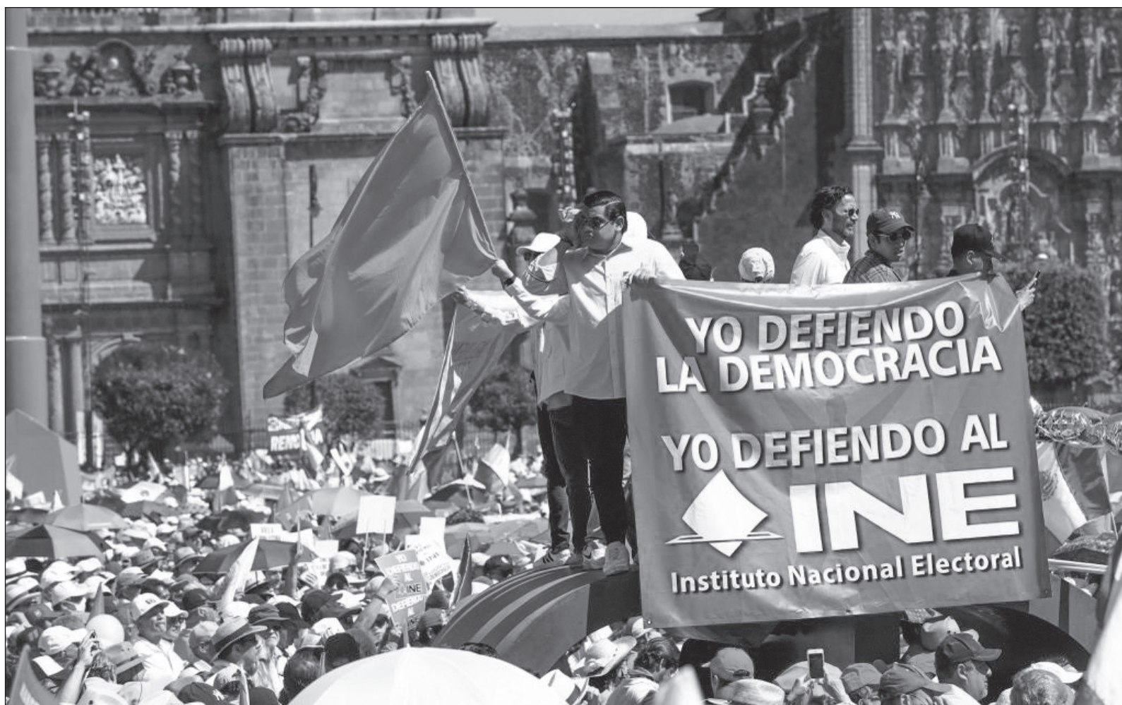
▲ Opositores de AMLO “patentizaron una vez más su odio, pero sin articular propuestas viables para el beneficio colectivo del país”.