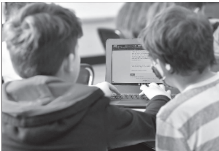
▲ "I realized that each generation seems to come with an innate understanding of the technological world into which they are born".