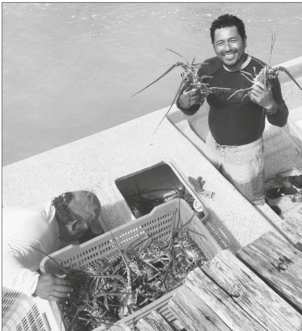
▲ Mal clima, sargazo y pesca furtiva, circunstancias que afectan la actividad.

Alejandro Velázquez Cruz añadió que ahora se abocarán al 100 por ciento a las actividades acuáticas y turísticas durante estos cuatro meses que dura la veda en la pesca de langosta.