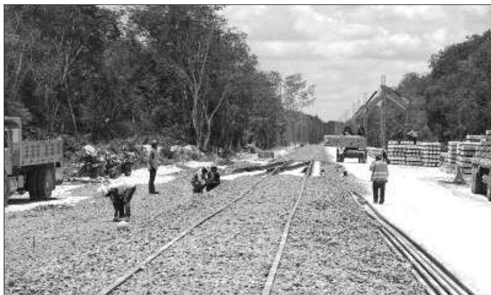
▲ La próxima mandataria puntualizó que en el año 2025 se invertirá "con recursos públicos en trenes, vivienda, agua, caminos, carreteras y energía".

"Ayer (martes) comenté que el sector privado nacional y extranjero tiene planeadas inversiones en el corto plazo en México por 40 mil millones de dólares. Además, en 2025 invertiremos con recursos públicos en trenes, vivienda, agua, caminos, carreteras y energía. Seguiremos impulsando la economía desde abajo con los programas de