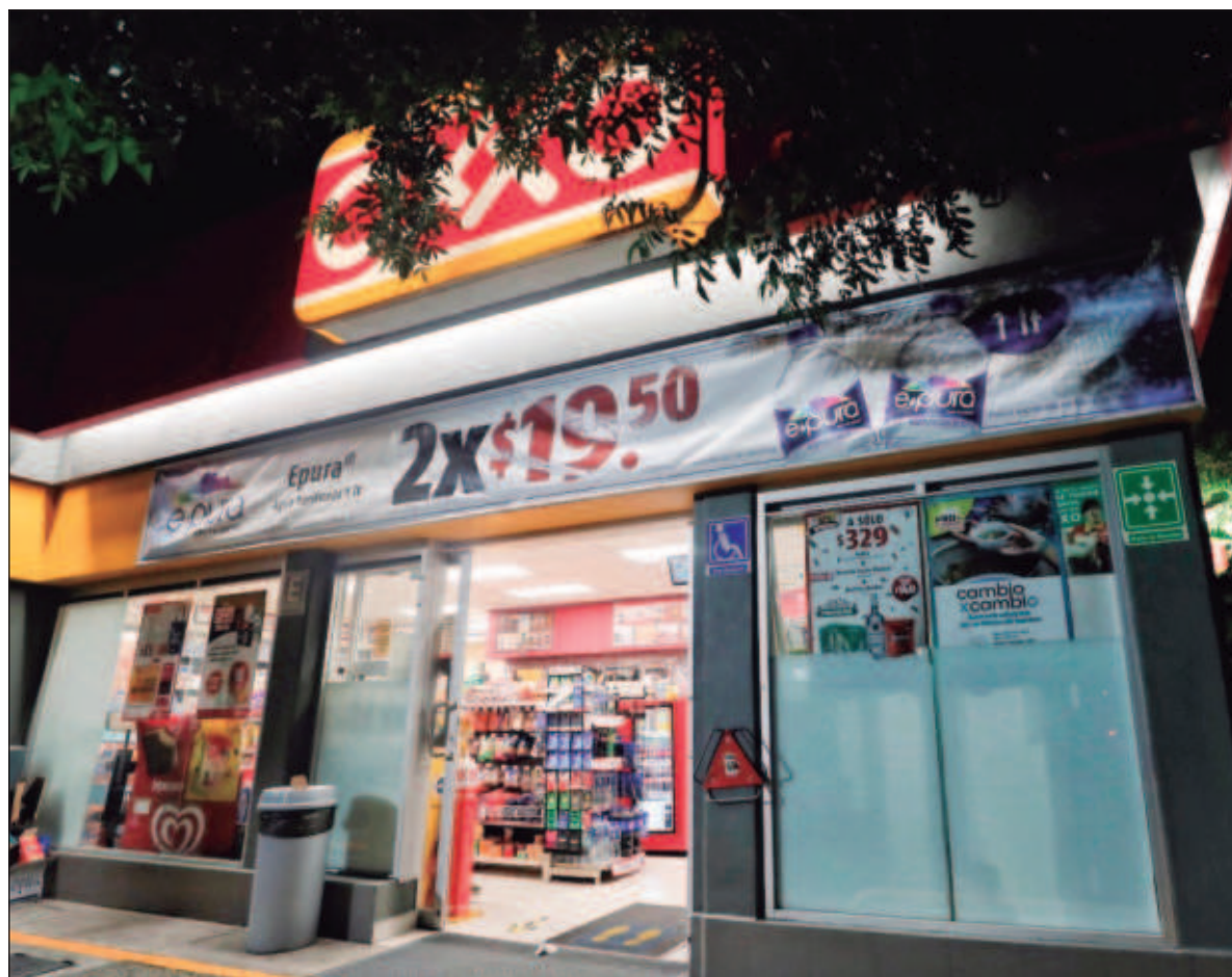
▲ “La versión más sostenida por los gobiernos de México y Estados Unidos sigue instalada en una presunta traición del segundo al primero, aunque hasta ahora no ha habido ninguna reacción vengativa por parte del bando supuestamente traicionado. Todo fluyendo como si fuera un gran acuerdo, no sólo en la esfera de tales narcotraficantes”.

LA EJECUCIÓN DEL dirigente de las cámaras de comercio de Tamaulipas tiene como contexto