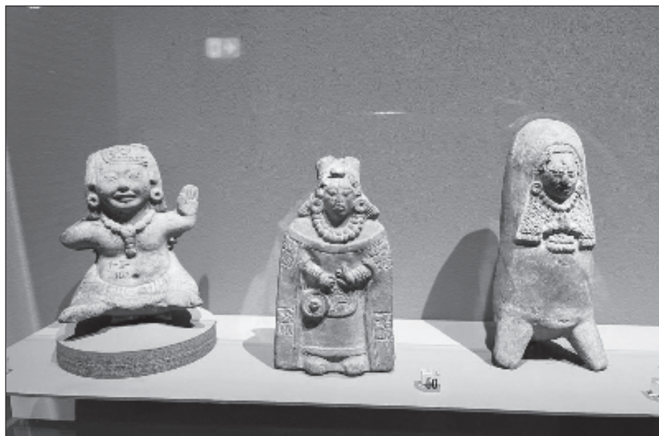
▲ Etnomusicólogos, arqueólogos y antropólogos se han dado a la tarea de rescatar los instrumentos del pasado, los cuales fueron destruidos por el paso del tiempo o durante la evangelización católica que llegó con la conquista española.

"Para ellos (los pueblos originarios), morir es renacer. Pensaban que la divinidad y