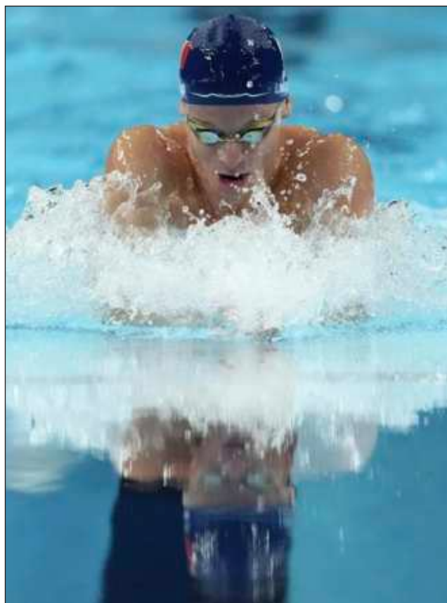
▲ El francés León Marchand impuso dos récords olímpicos durante su memorable actuación del miércoles.

Después de venir de atrás para vencer al campeón y dueño del récord mundial, Kristóf Milák, con un memorable remate en los 200 mariposa, Marchand ganó los 200 pecho con una facilidad pasmosa. Lideró de punta a punta al cronometrar 2 minutos y 5.85 segundos. En los 200 mariposa, tocó la pared con un