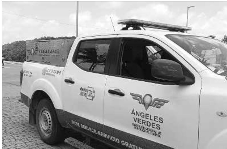
▲ En todo el país Ángeles Verdes brindó 10 mil 157 servicios, siendo las principales atenciones por fallas en neumáticos, de motor y del sistema de refrigeración.

En todo el país Ángeles Verdes brindó 10 mil 157 servicios en el periodo mencionado, siendo las principales atenciones por fallas en neumáticos, de motor y del sistema de refrigeración. Los tramos carreteros con mayor incidencia de servicios fueron: Cuernavaca-Caseta Paso Morelos, con 302; Toluca-México Cuota, con 232; Guanajuato-Irapuato, con 188; Cancún-Playa del Carmen, con 165; y México-Cuernavaca, con 163.