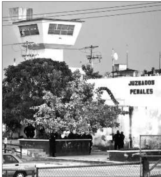
▲ Los tribunales de circuito del PJF se encuentran repartidos en todo el país, pero no resuelven todos los asuntos.

Hay otro inconveniente: los tribunales de circuito del Poder Judicial de la Federación se encuentran repartidos en