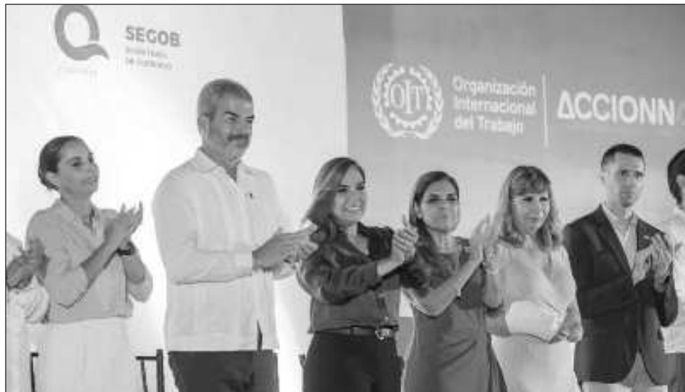
▲ Con la campaña de comunicación Estrategia contra la explotación sexual comercial , Quintana Roo es el primer estado de la península en lanzar una iniciativa de este tipo.

"Esta campaña reafirma nuestro compromiso de se-