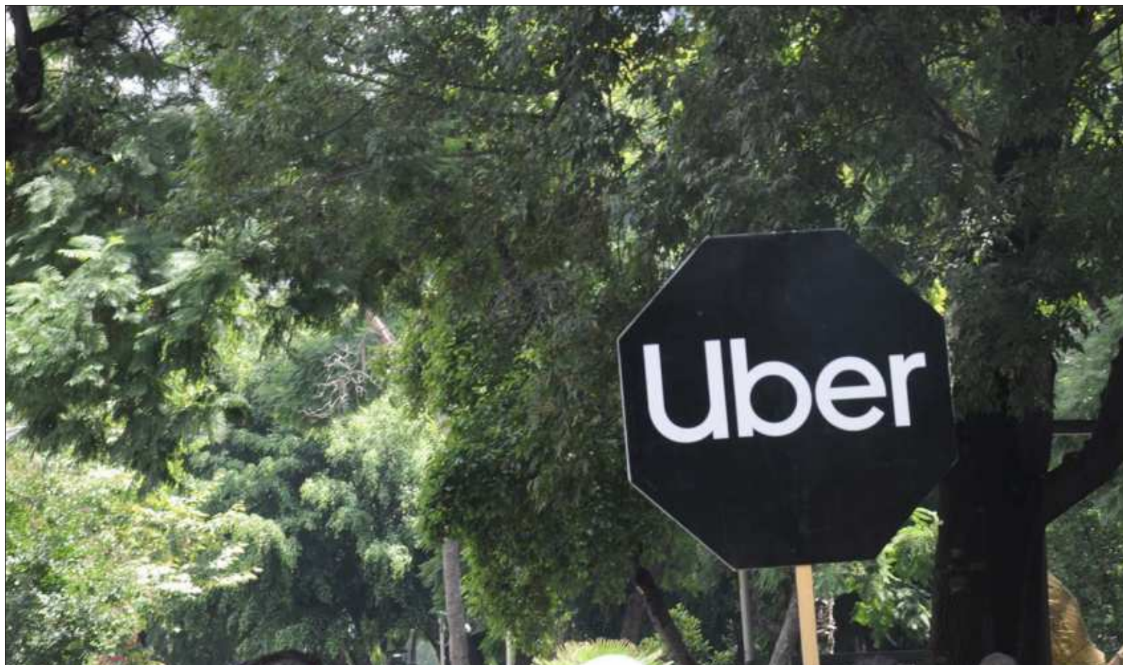
▲ La tarde-noche del martes 30 de julio, ante las agresiones y extorsiones de taxistas, socios conductores organizaron una caravana que salió desde Malecón Tajamar hasta llegar al Aeropuerto Internacional de Cancún, para pedir alto a la violencia y que los dejen trabajar.

“Lo único que nosotros estamos pidiendo es que no nos agredan, que no nos violenten, que no nos amenacen, porque no son autoridades para hacer eso... asustan al turista y se ven obligados a viajar con ellos, sin ningún tipo de seguridad”, acusó la vocera de Uber.