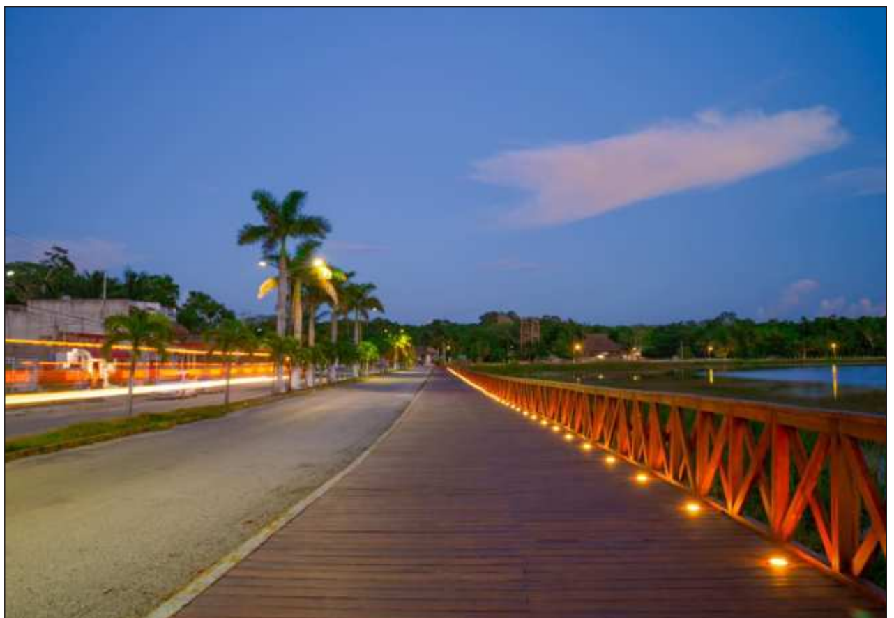
▲ La laguna de Cobá recuperó uno de sus mayores atractivos turísticos con la reconstrucción de la primera etapa del malecón que años atrás fue demolido; “la primera etapa de la obra ya está concluida al 100%”.

Cabe mencionar que entre los años 2021 y el 2022 los ejidatarios, comerciantes y la comunidad en general de Cobá hicieron un llamado a las autoridades del Fondo Nacional de Fomento al Turismo (Fonatur) para reactivar las obras de reparación del malecón de la laguna, que estuvo por varios meses desmantelado y abandonado, propiciando que incluso fauna como los cocodrilos pasaran de la laguna a la carretera.