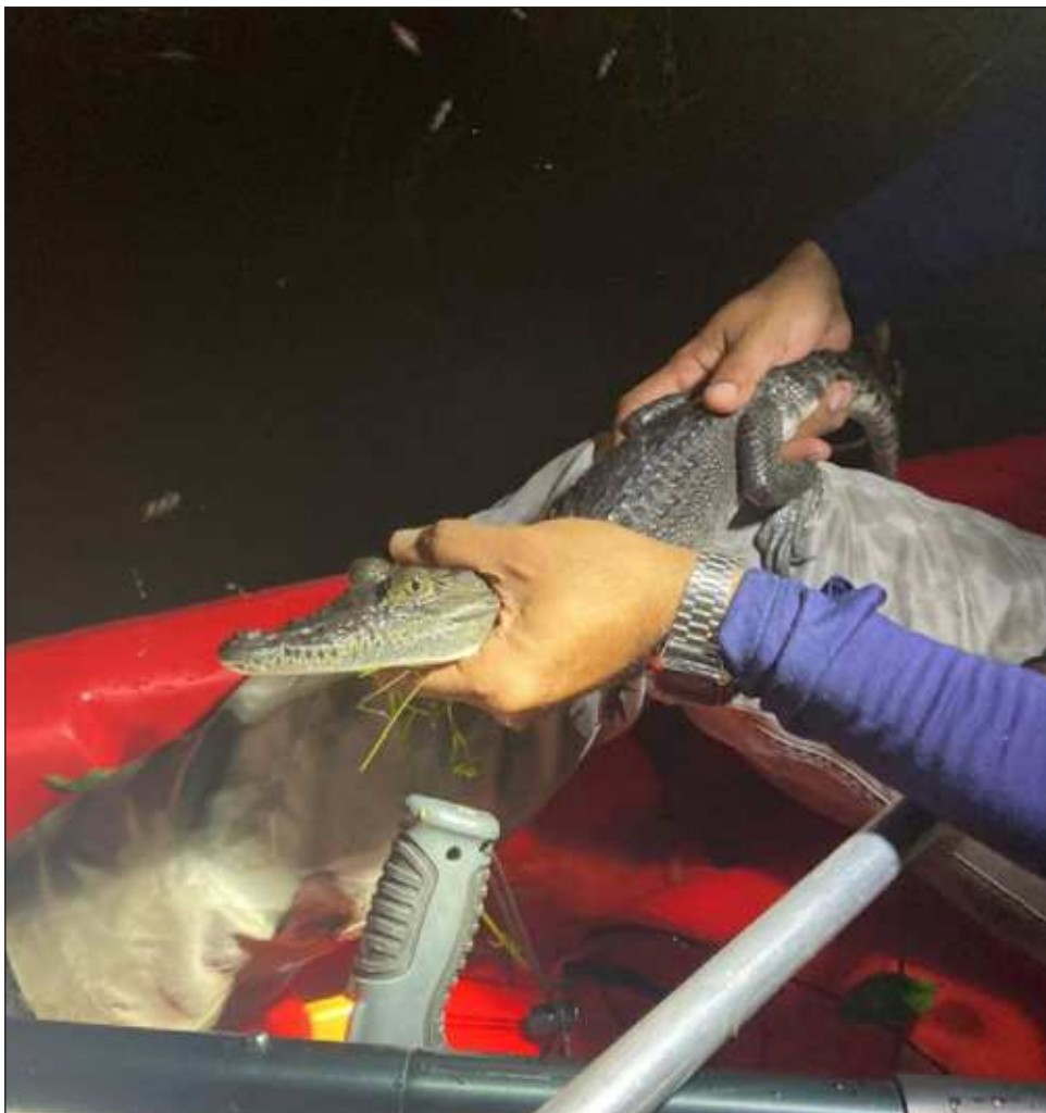
▲ El cocodrilo será atendido y evaluado para que pueda ser liberado en una de las áreas naturales protegidas del estado, informó el gobernador Mauricio Vila Dosal.

El gobernador de Yucatán, Mauricio Vila, informó que el cocodrilo será atendido y evaluado para que pueda ser liberado en una de las áreas naturales protegidas del estado.