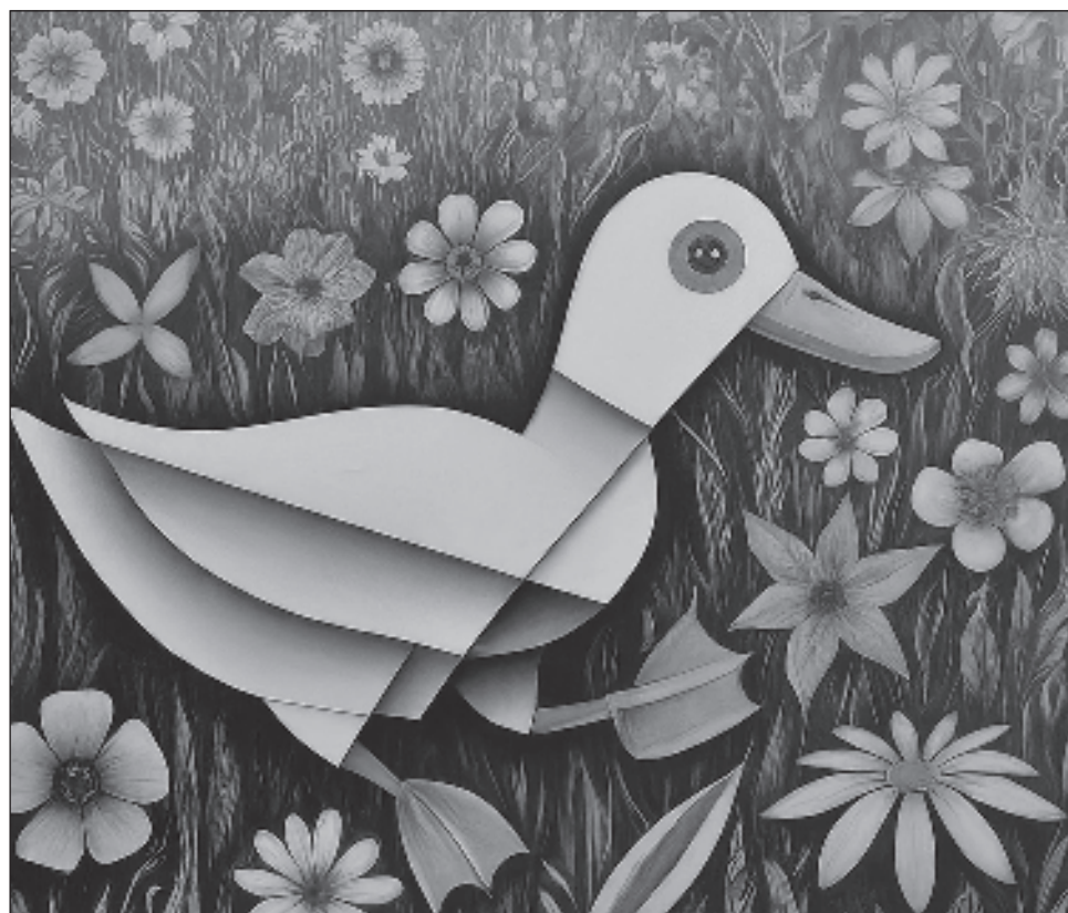
▲ Los usuarios pueden determinar si una ilustración es falsa al acceder a los metadatos de la imagen, la fuente y si hay una marca de agua de Google AI presente. Ilustración creada con Google Gemini

"Es importante recordar que la persona que publica una imagen puede agregar o eliminar metadatos. Cuando estén disponibles, se podrán ver los metadatos que los creadores y editores de imágenes han agregado a una imagen, incluidos los cam-