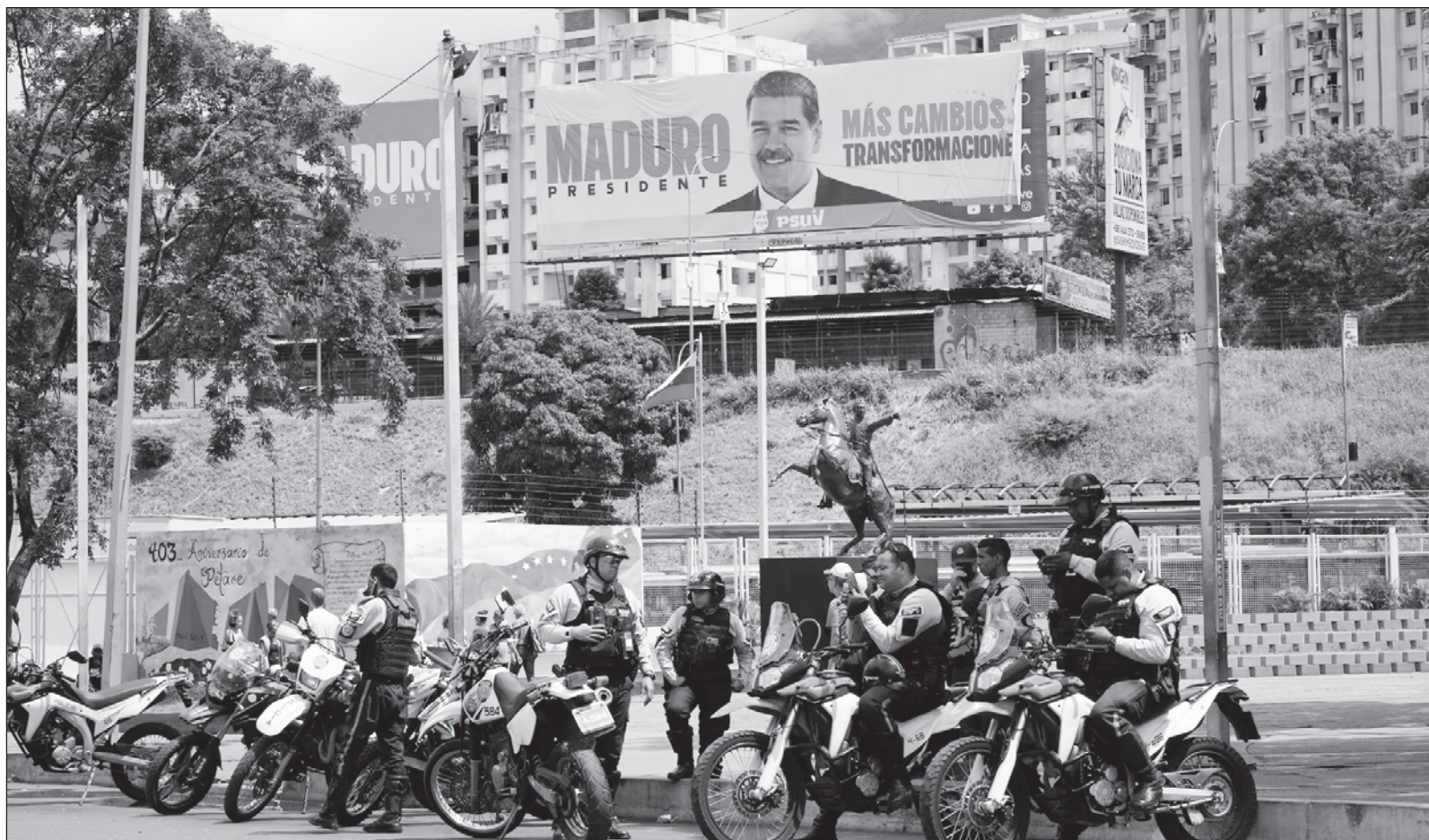
▲ “El mandatario de EU, Joe Biden, y su gobierno instan a sus aliados y afines a pronunciarse contra el gobernante chavista, además que alimentan y propagan la versión, sin pruebas, que ‘su candidato’ Edmundo González Urrutia ganó las elecciones, a pesar de lo informado por la autoridad electoral”.