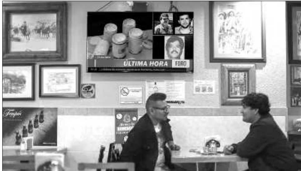
▲ Zambada renunció a estar presente en la audiencia del miércoles pero deberá comparecer en persona hoy ante la Justicia de El Paso en una procedimental, tras haberse declarado no culpable.

Por ello, la jueza ordenó que Zambada sea trasladado