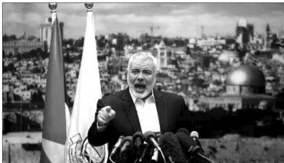
▲ El mayor riesgo derivado del asesinato del líder político de Hamas es la posibilidad de un conflicto directo entre Irán e Israel, si el gobierno iraní decide tomar represalias.

Israel había prometido matar a Haniyeh y a otros líderes del grupo contra el sur de Israel el pasado 7 de octubre. El atentado del miércoles se cometió después de que Haniyeh asistiera a la investidura del nuevo presidente iraní en Teherán, y apenas unas horas después de que Israel atacara a un coman-