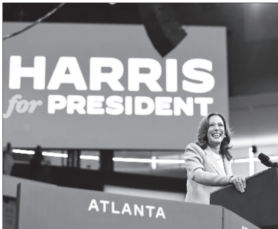
▲ El Partido Demócrata tiene que formalizar la nominación presidencial de Kamala Harris, quien no cuenta con ningún rival interno, en una reunión virtual de delegados.

La vicepresidenta mejora considerablemente los datos de Biden, puesto que sólo 37 por ciento de los demócratas veía satisfactoriamente su candidatura, de acuerdo a un sondeo del mismo centro publicado antes de que el man-