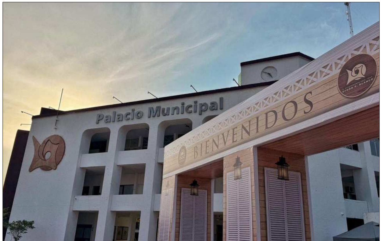
▲ Los financiamientos pueden llegar a los 120 mil pesos, diseñados específicamente para el fortalecimiento de micro-negocios, permitiendo la compra de herramientas o la remodelación de locales comerciales.

Los esfuerzos buscan que las empresas hallen un entorno favorable para establecerse de manera permanente