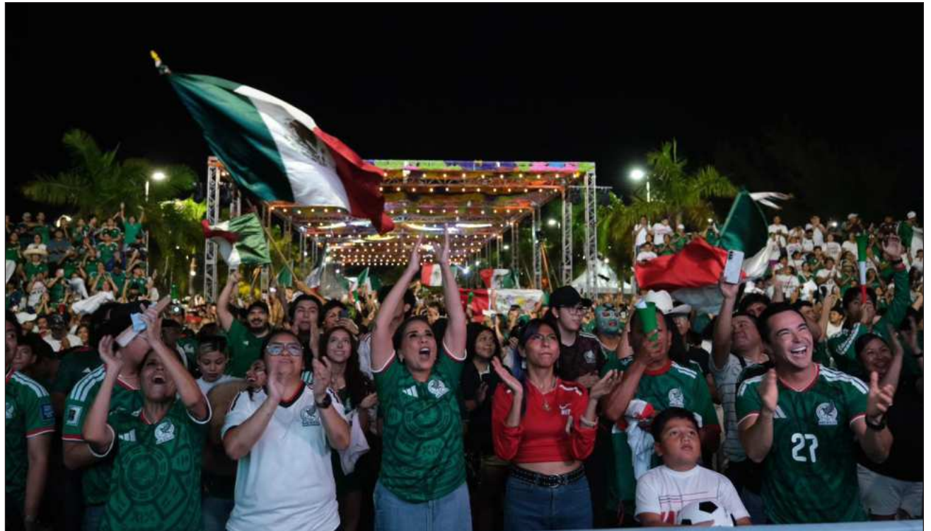
▲ Con este resultado, México avanzó a la siguiente fase, donde podría enfrentar a la selección de la República Democrática del Congo o a Inglaterra. El próximo partido se disputará en el estadio Azteca este 5 de julio.

Aunque el silbatazo inicial se retrasó cerca de una hora debido a las condiciones climatológicas, los asistentes permanecieron en los Fut Fest instalados en diferentes puntos de la entidad con el ánimo intacto, esperando el arranque del encuentro para apoyar al representativo nacional.