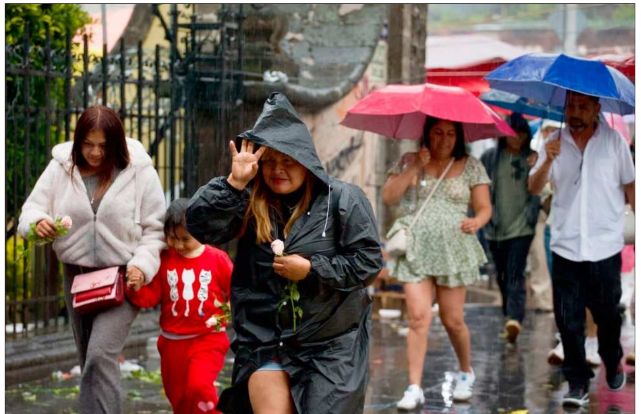
▲ Exhortan a la población a atender los avisos y seguir las recomendaciones de Protección Civil.

En su reporte también alertó que las precipitaciones podrían generar deslaves, incremento en niveles de ríos y arroyos, así como desbordamientos e inundaciones en zonas bajas de los estados mencionados, por lo que exhortó a la población a atender los avisos y