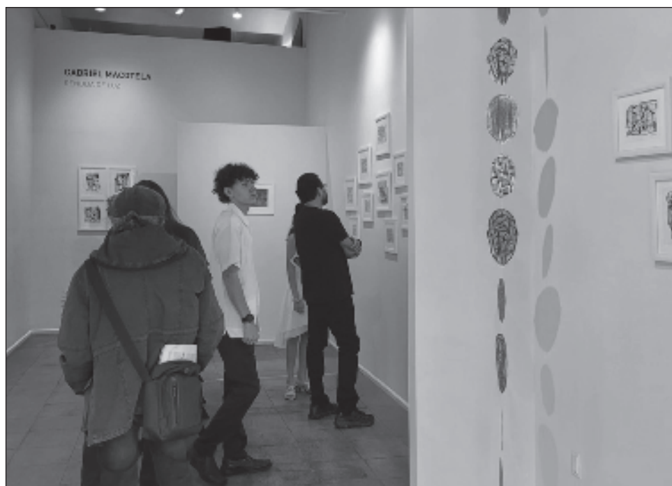
▲ La exposición está conformada por 51 dibujos realizados por Macotela durante su reciente estancia en el hospital, además de una instalación-maqueta.

La exposición está conformada por 51 dibujos realizados por Macotela durante su reciente estancia en el hospital, además de la instalación-maqueta El éxito