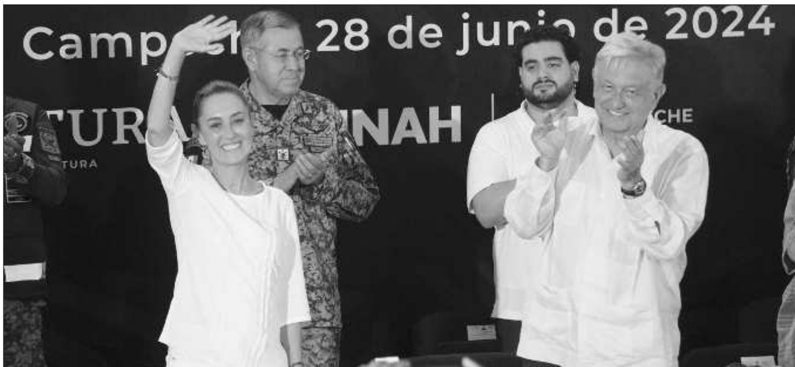
▲ La virtual presidenta electa informó sobre las actividades para constatar los avances, y definió al Tren Maya como una obra que representa “una hazaña histórica”.