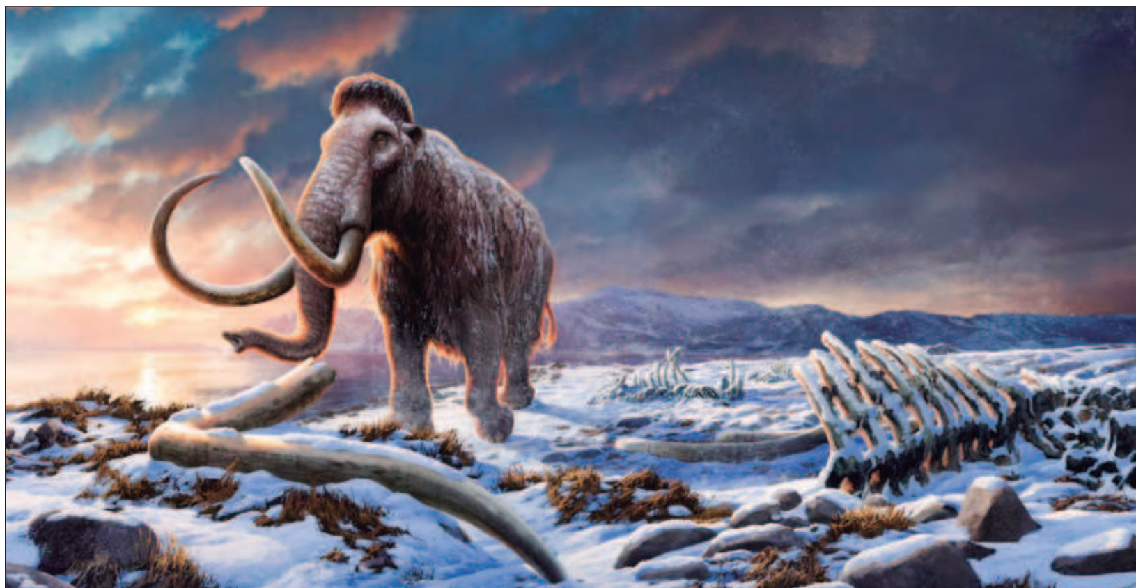
▲ Un nuevo análisis genómico revela que los mamuts aislados, que vivieron en la isla Wrangel, frente a la costa de Siberia, durante los siguientes 6 mil años se originaron a partir de un máximo de ocho individuos, pero crecieron hasta entre 200 y 300 durante 20 generaciones.

Los genomas de mamut analizados abarcan un largo periodo; sin embargo, no incluyen los últimos 300 años de existencia de la especie. "Lo que ocurrió al final sigue siendo un misterio: no sabemos por qué se extinguieron después de haber estado más o menos bien durante 6 mil años, pero creemos que fue algo repentino", subraya Dalén.