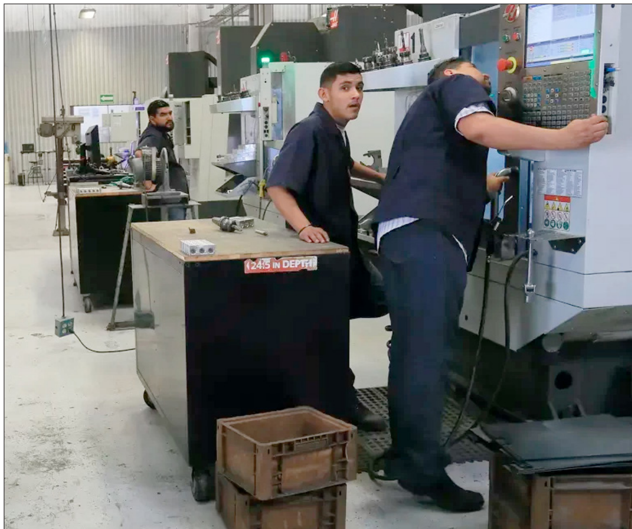
▲ Vertical Kits y Grupo Moyel usaron a sus guardias de seguridad para notificar la baja del personal.

Al concluir la reunión el dirigente de los empresarios de Carmen, Cajún Úc reiteró la disposición de este organismo para continuar fortaleciendo los espacios de colaboración y entendimiento en beneficio de la comunidad empresarial.