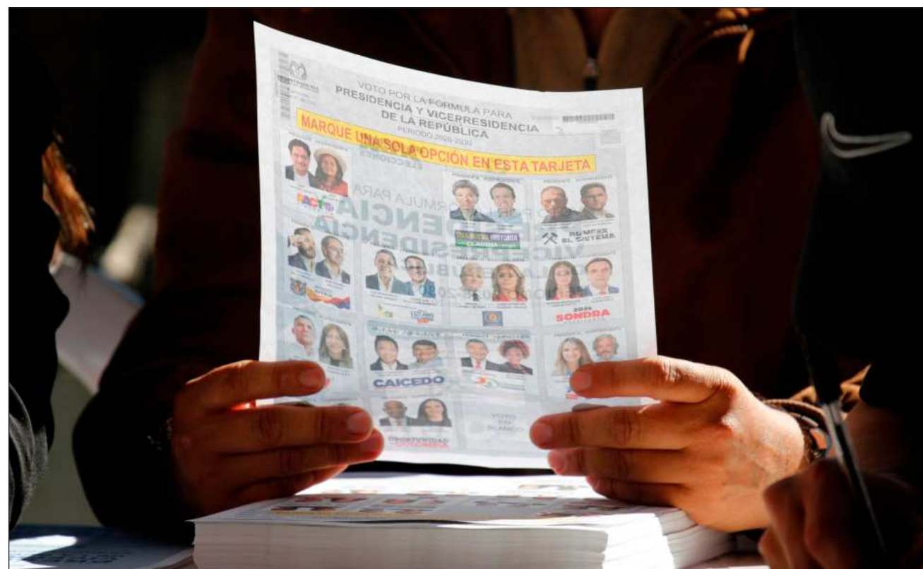
▲ El candidato del movimiento independiente respondió celebrando su resultado y llamando al oficialista un "aliado de narcoterroristas".

Cepeda, del oficialista Pacto Histórico, sembró dudas sobre el conteo previ-