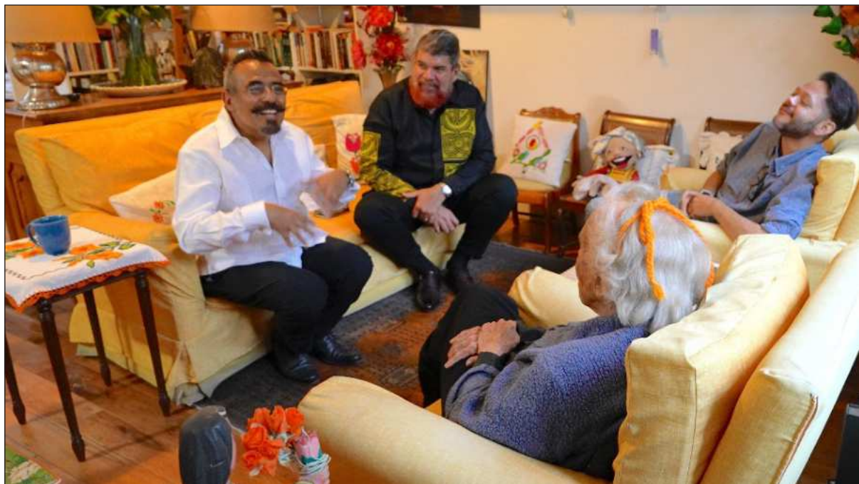
▲ "Queremos que la gente aprenda a narrar ante un público mediante nuestro foro internacional".

-Los cuentos de los argentinos Abelardo Castillo y Silvina Ocampo me encantan, porque