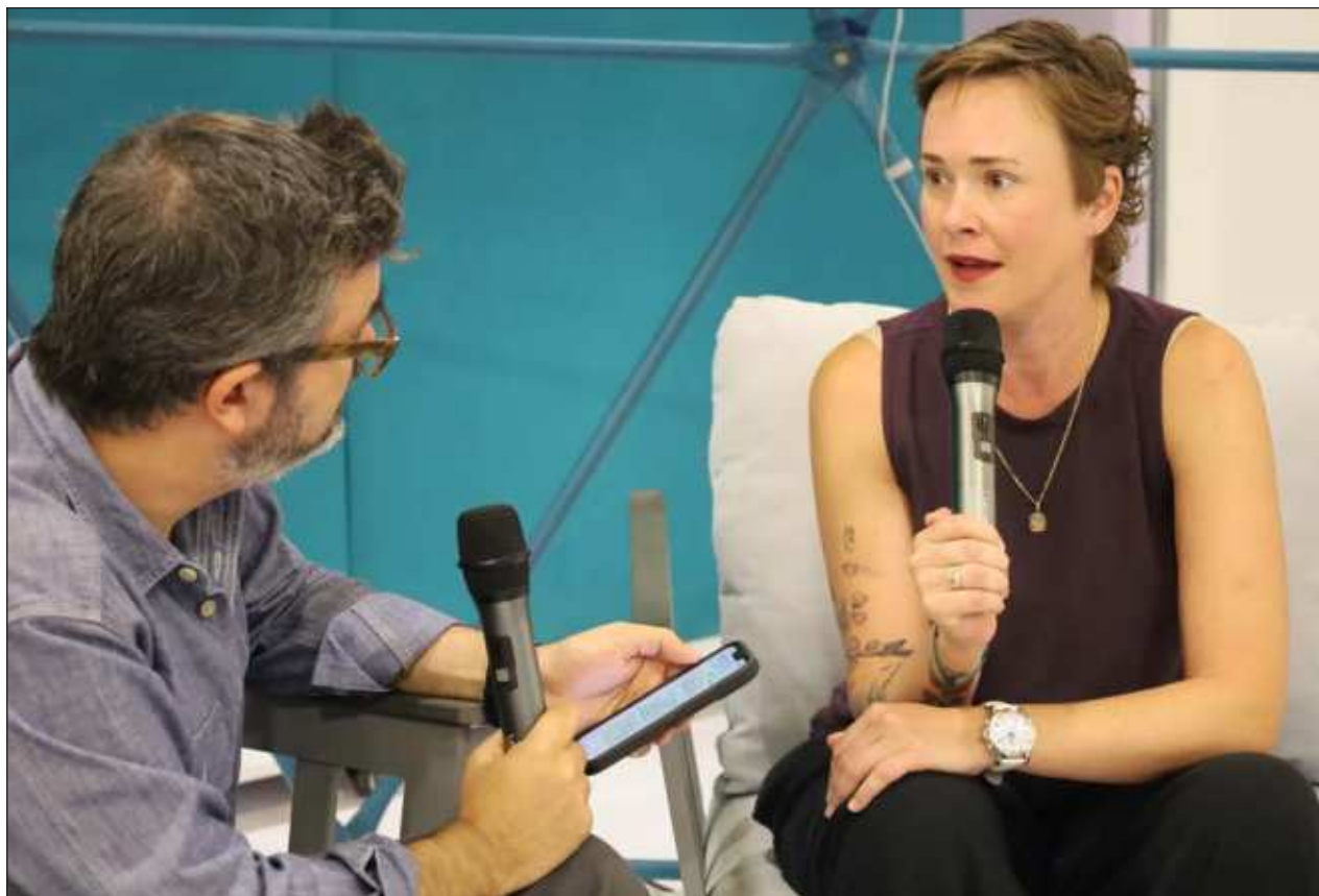
▲ En el stand de LJM , la periodista deportiva recordó algunos casos similares: "Neymar, acusado de violación; Mbappé, acusado de violación; Dani Alves, acusado de violación; Renato Ibarra, golpeando a una mujer embarazada. ¿Quieren que siga?".

"Podemos quejarnos mucho de Cuauhtémoc Blanco pero los varones deben hacer su tarea para que los Cuauhtémoc Blanco dejen de ser la norma y se conviertan en la excepción".