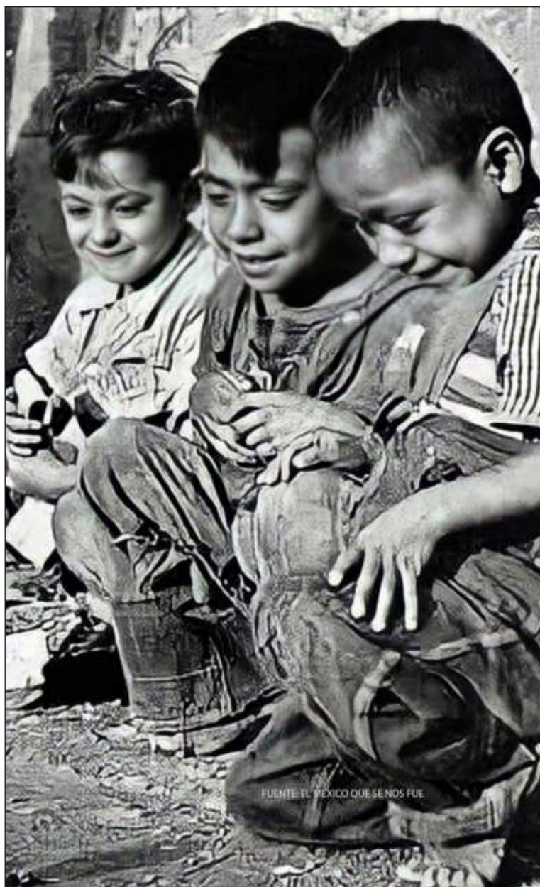
▲ "La franja de edad más vulnerable fue la de 1 a 4 años, con 77 defunciones. Dentro de este grupo, 59 niños murieron antes de cumplir los dos años, una etapa especialmente crítica".

LA FRANJA DE edad más vulnerable fue la de 1 a 4 años, con 77 defunciones. Dentro de este grupo, 59 niños murieron antes de cumplir los dos años, una etapa especialmente crítica para la supervivencia infantil. No se tiene certeza de cuántos de estos niños eran hermanos, pero es probable que muchas familias atravesaran duelos devastadores, sumidas en el dolor y la depresión tras perder a