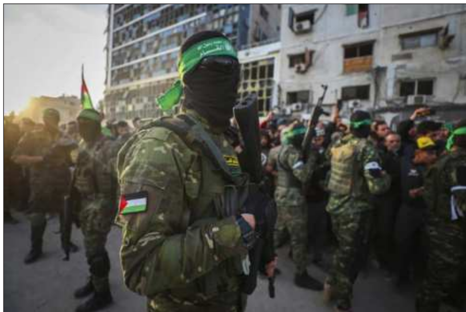
▲ “Que todo el mundo rompa su silencio”, pidió un alto cargo, en un comunicado.

Este lunes, el ministerio de Salud de la Franja de Gaza, gobernada por Hamas, indicó que mil personas murieron en el territorio palestino desde el reinicio de los bombardeos israelíes el 18 de marzo.