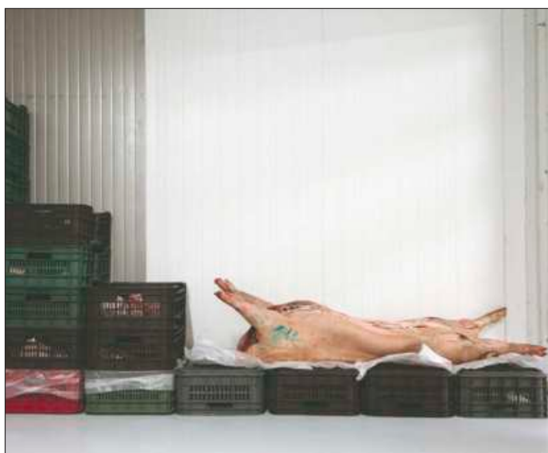
▲ La República del Cerdo es el resultado de un recorrido por todo México que duró cinco años. Según el prologuista Javier Risco, va “de las carnitas al zacahuil, del chicharrón a los tacos al pastor, el cerdo nos acompaña con generosidad infinita, envolviendo nuestra cultura en tortillas y memorias”.