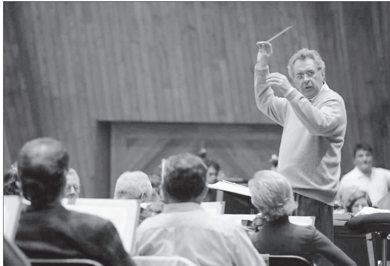
▲ Bátiz fue fundador de la Orquesta Sinfónica del Estado de México; también la dirigió en dos ocasiones.

Bátiz también fungió de director artístico de la Filarmonía de la Ciudad de México, de 1983 a 1989. Asimismo, fue titular invitado y