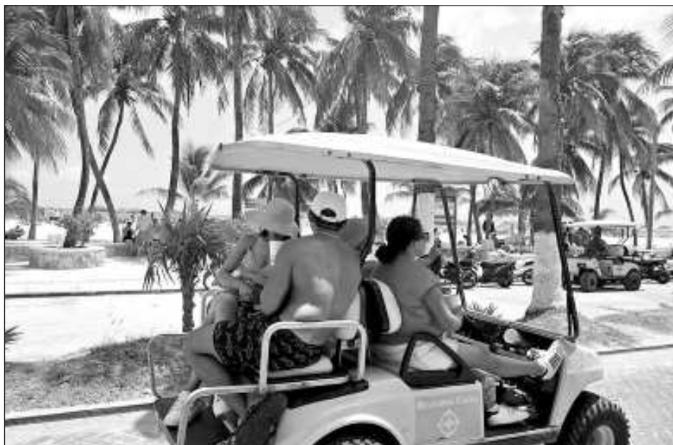
▲ Las arrendadoras buscan que el tarjetón pueda obtenerse a través de la app Guest Assist, para ofrecer un mejor servicio a los turistas y lo hagan de forma segura.

“Aunque el turista no traiga el tarjetón porque no alcanzarían todos los tarjetones, de todos modos se tiene que respetar. Si en algún momento no se respeta como ha sucedido en algún municipio, se habla al director de tránsito de ese municipio y se respeta, y