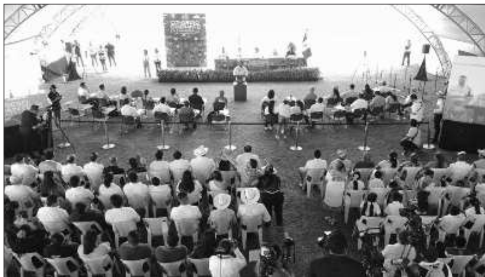
▲ Bajo un toldo contratado por el Poder Legislativo, decenas de personas, niños de la escuela primaria Benito Juárez, e invitados del Instituto Tecnológico Superior de Escárcega, ocurrió lo que se consideró una sesión histórica.

Este lunes, todo el pueblo se reunió en el campo del lugar, donde según los pobladores es el sitio de reuniones y fiestas del Pi-