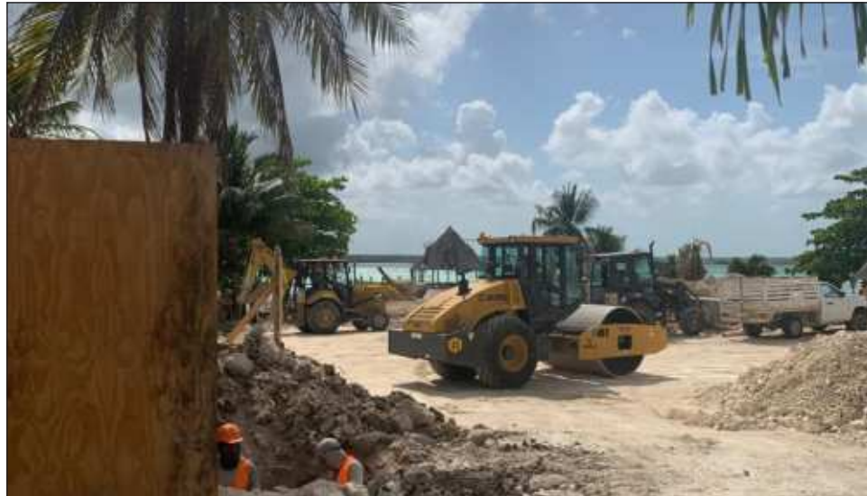
▲ Los habitantes acusaron que el día de ayer hubo más maquinaria y un movimiento intenso frente al fuerte de San Felipe, ubicado a escasos metros de la laguna.

En redes sociales crearon el hashtag #Nodelantedelfuerte para denunciar