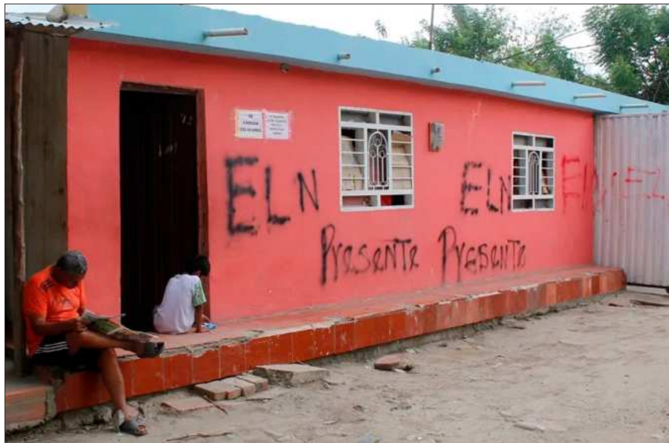
▲ El Frente de Guerra Nororiental del ELN acusó al presidente colombiano de "decepcionar mucho" a la gente que votó por él, y afirmó que su propuesta de "paz total" fue una estrategia electoral para ganar las elecciones pasadas.

En su opinión, "todos los políticos y todos los presidentes tienen que salir con algo (propuestas) porque eso les da votos" y en el caso de Petro fue la "paz total".