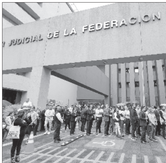
▲ Hay casi 4 mil candidatos para algo más de 800 cargos, entre los juzgados de distrito, tribunales de circuito, el TEPJF y sus Salas Regionales, el Tribunal de Disciplina y la SCJN.

Así, las claves de la organización estarán en cuántas casillas podrán instalarse, con los recursos limitados que se tienen, y convencer a la ciudadanía a participar como funcio-