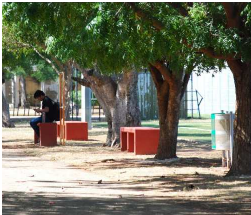
▲ Patrón dio a conocer los avances en la siembra de vegetación al interior de Mérida.

Hasta ahora se han recaudado 825 millones de pesos del predial, la alcaldesa de Mérida expresó que hay convenios y facilidades de pago para los interesados.