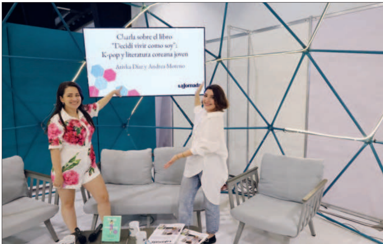
▲ Las creadoras de contenido coincidieron que las autoras coreanas están siendo la resistencia hacia estos discursos mucho más blanqueados que tienen los k-dramas o el k-pop, apostándole a una literatura feminizada.