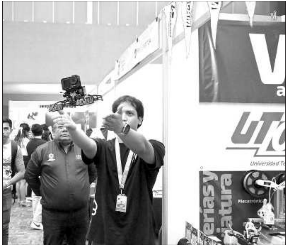
▲ Muchos estudiantes buscan oportunidades laborales, sin embargo, la situación económica que prevalece evita que puedan ser contratados.

Expuso que algunos alumnos en la busca de oportunidades, han tenido que emigrar a otras entidades, para lograr colocarse en empleos referentes a las carreras que estudiaron.