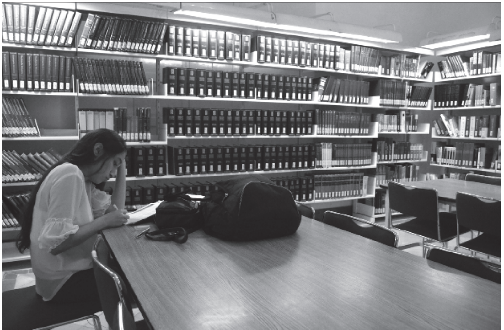
▲ "Los jóvenes ya no consideran al título universitario como sinónimo de triunfo o llave de acceso a un mejor futuro o a un mejor salario".