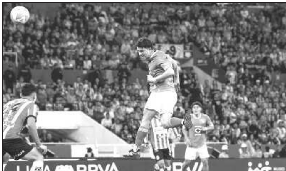
▲ La Máquina se impuso a las Chivas el fin de semana en la Liga Mx.

El América y el Cruz Azul son protagonistas del clásico joven.