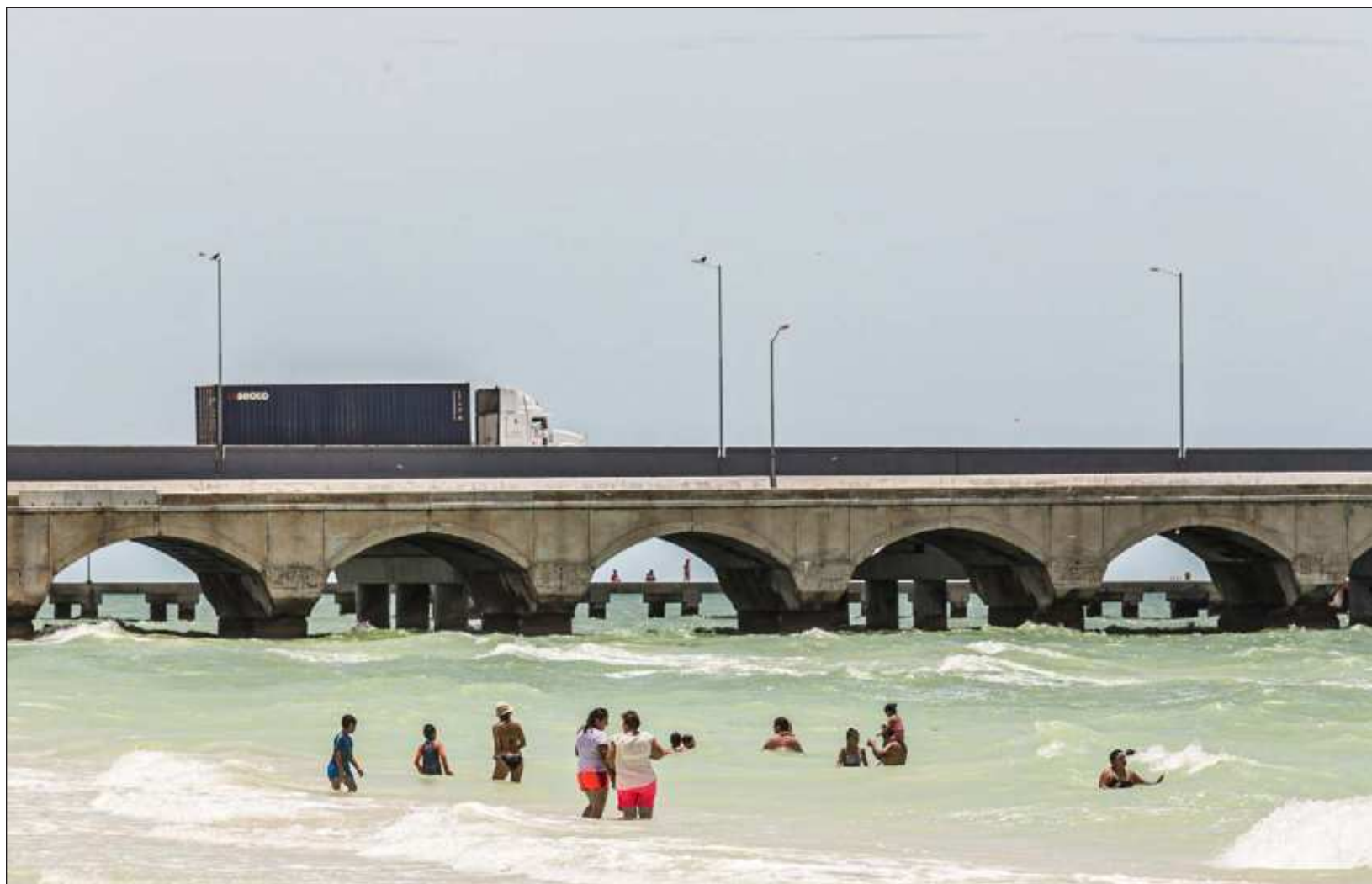
▲ En el último trimestre de 2024, por sector de actividad económica, las exportaciones manufactureras representaron 91% del valor total.

A tasa anual, el valor de las exportaciones de las entidades federativas incrementó 5.6 por ciento.