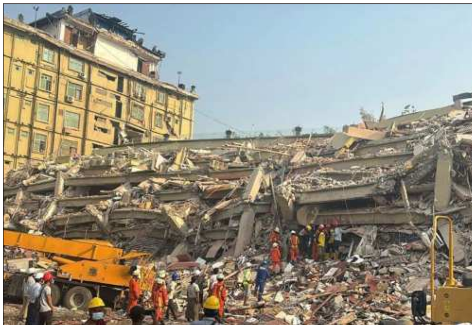
▲ Los expertos esperan que la cifra de decesos continúe creciendo en los próximos días.

Además de los 2 mil 56 fallecidos confirmados, hay más de 3 mil 900 heridos y 270 personas siguen manteniendo desaparecidas tras el sismo de 7.7 grados.