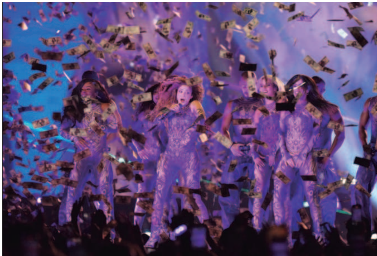
▲ Shakira se encuentra en el segundo puesto de las giras más lucrativas del mundo, solo superada por Coldplay.

En sus conciertos en México tuvo como invitados al Mariachi Gama 1000, así como influencers que des-