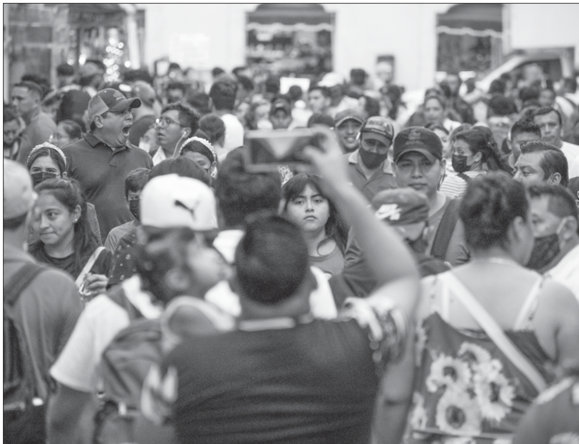
▲ “El modus operandi principal del poder identitario se da en el plano de la imaginación social colectiva. En consecuencia, puede controlar nuestras acciones aún a pesar de nuestras creencias”.

PERO EXISTEN OTROS casos, en los que existe un estereotipo que implica una asociación falsa (una generalización no fiable) acerca de un grupo social en cuestión.