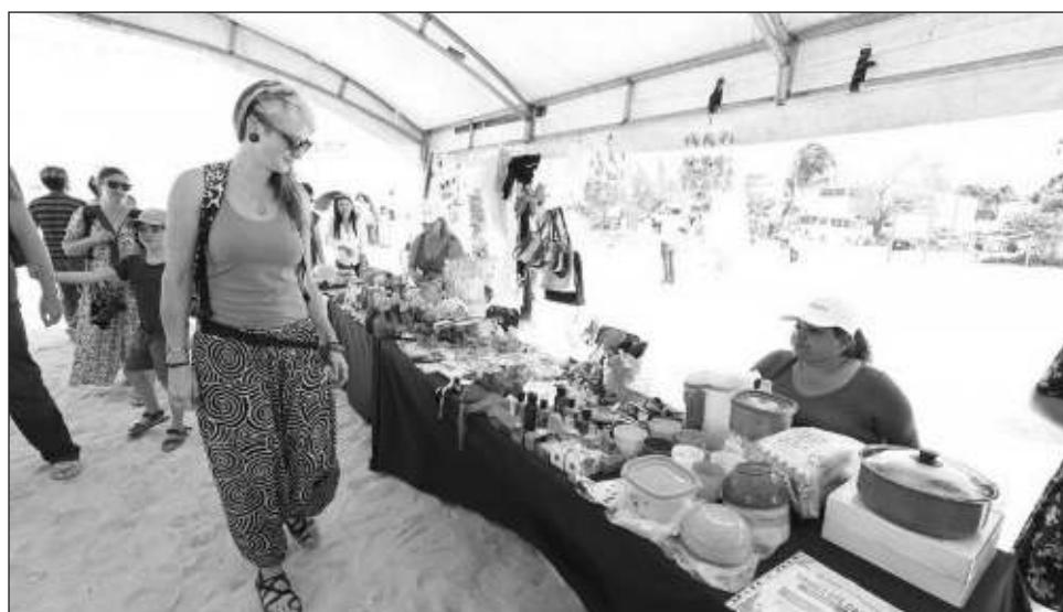
▲ El festival se realizó del 24 de febrero al 31 de marzo, periodo en el que las familias de municipios y comisarías pesqueras contarán con una opción para mejorar sus ingresos.

El Festival de la Veda se realizó del 24 de febrero al 31 de marzo, periodo en el que las familias de municipios y comisarías pesqueras contarán con una opción