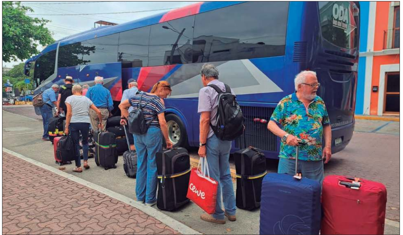
▲ La derrama económica estimada por las autoridades del ramo para este período es de más de mil millones de dólares, lo que constituye un incremento del 5.9 por ciento respecto a la Semana Santa del año anterior.

Para el periodo vacacional de Semana Santa, compren-