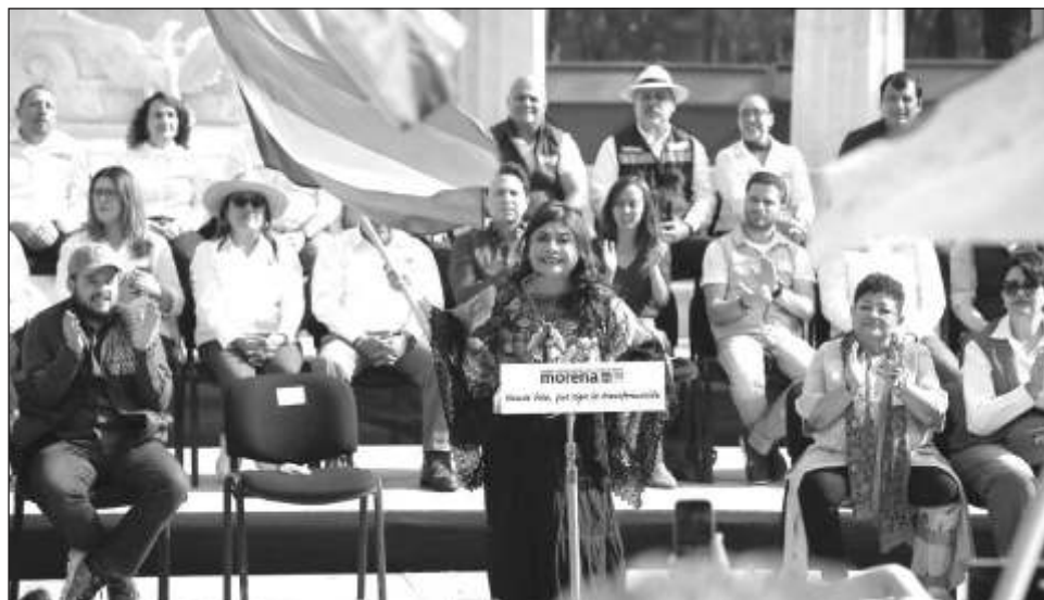
▲ La morenista sostuvo que los unen los principios y las convicciones, no las complicidades como en la oposición, a la que tildó como una “minoría rencorosa y corrupta”.

Apuntó que en este proceso nadie sobra y todos son necesarios, porque lo fundamental es el proyecto de transformación y el deber de llevar a Claudia Sheinbaum a