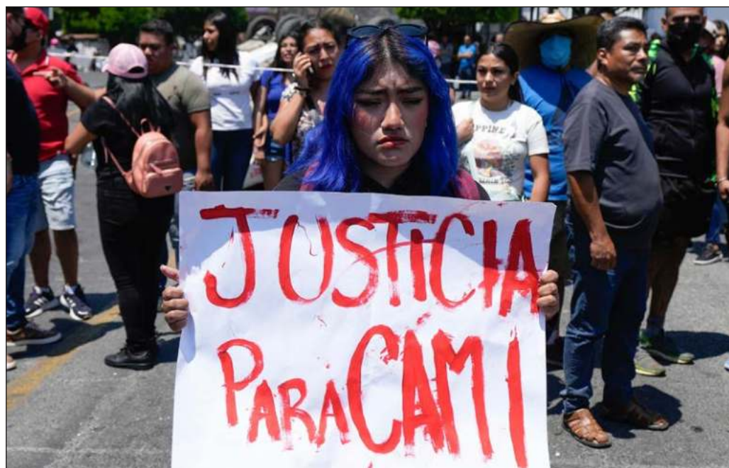
▲ Difícilmente una sociedad sana puede aceptar que una madre y sus hijos se organicen para matar a una niña (...) menos que el jefe de la policía declare que hubo "omisión a la responsabilidad maternal".

Reconstruir socialmente a Guerrero es una tarea importante para todo el país. Permitir la ausencia de autoridad ahí es abrir las puertas a que ocurran en cualquier otro lugar. En respuesta a Doroteo Vázquez, director de Seguridad de Taxco, ¿en quién confiaría una madre, si se le impone no hacerlo en sus vecinos y las autoridades tampoco le brindan garantías? La turba multa es la respuesta.