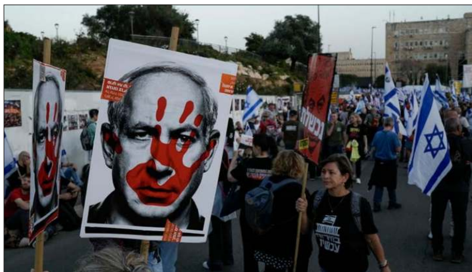
▲ Los manifestantes quieren un reparto más equitativo de la carga del servicio militar que obliga a la mayoría de los israelíes. Alrededor de 600 soldados han muerto hasta ahora desde el 7 de octubre.

Los manifestantes quieren un reparto más equitativo de la carga del servicio militar que obliga a la mayoría de los israelíes. Alrededor de 600 soldados han muerto hasta ahora desde el ataque de Hamás del 7 de octubre y la posterior guerra en Gaza, el mayor número de bajas del ejército en años.