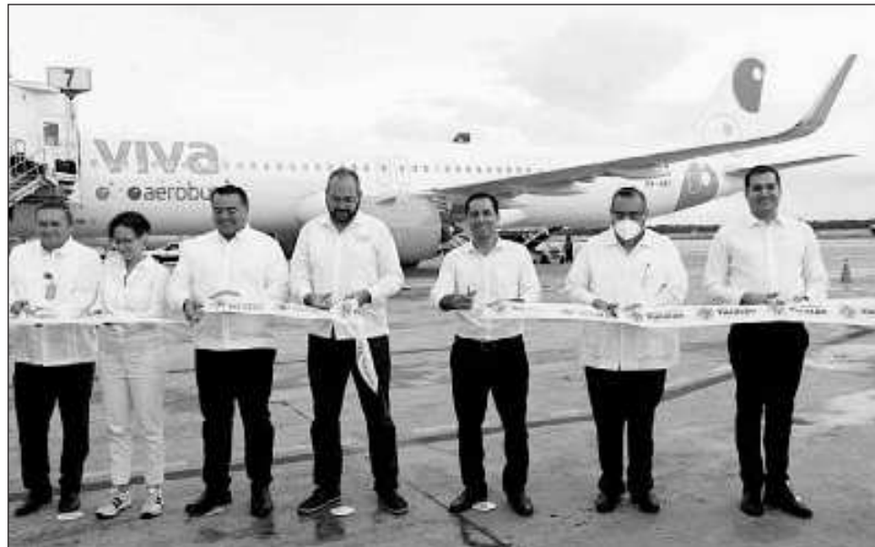
▲ Yucatán se colocó dentro de los primeros cuatro lugares del ranking de crecimiento acumulado de aeropuertos con mayor flujo de viajeros.

Esta cantidad máxima histórica se emite con base en las cifras de la Estadística Operacional de Aeropuertos, presentada por la Secretaría de Infraestructura, Comunicaciones y Transporte (SICT), correspondiente a diciembre de 2023, en la cual, la terminal aérea de Yucatán se posicionó entre las ocho primeras entidades de todo el país en cuanto a pasajeros, lo cual representó