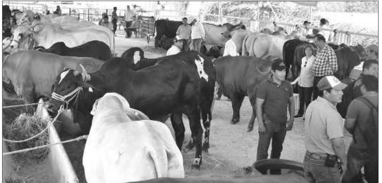
▲ Dentro de las exigencias más importantes de los ganaderos está una mayor presencia de la Guardia Nacional y de la Secretaría de Defensa Nacional, pues la incertidumbre, el miedo, y la preocupación por sus familias crece cada día.