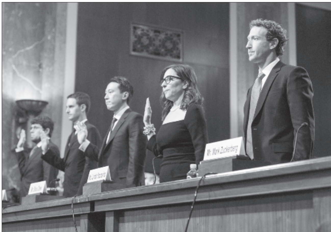
▲ Los senadores contaron historias de jóvenes que se quitaron la vida tras ser extorsionados por dinero tras compartir fotografías con depredadores sexuales; asimismo, reprodujeron videos de víctimas relatando su situación.

Bajo la presión del senador republicano Josh Hawley, Zuckerberg se puso de pie y se dirigió a las familias que sostenían fotografías de sus hijos que, decían, habían sido perjudicados por las redes sociales.