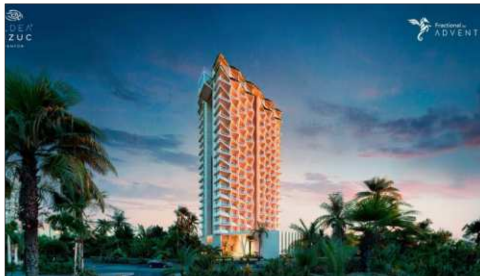
▲ El desarrollo Aldea Nizuc Cancún consta de un hotel, un wellness center, concert hall y área comercial, todo con una inversión de 150 millones de dólares.