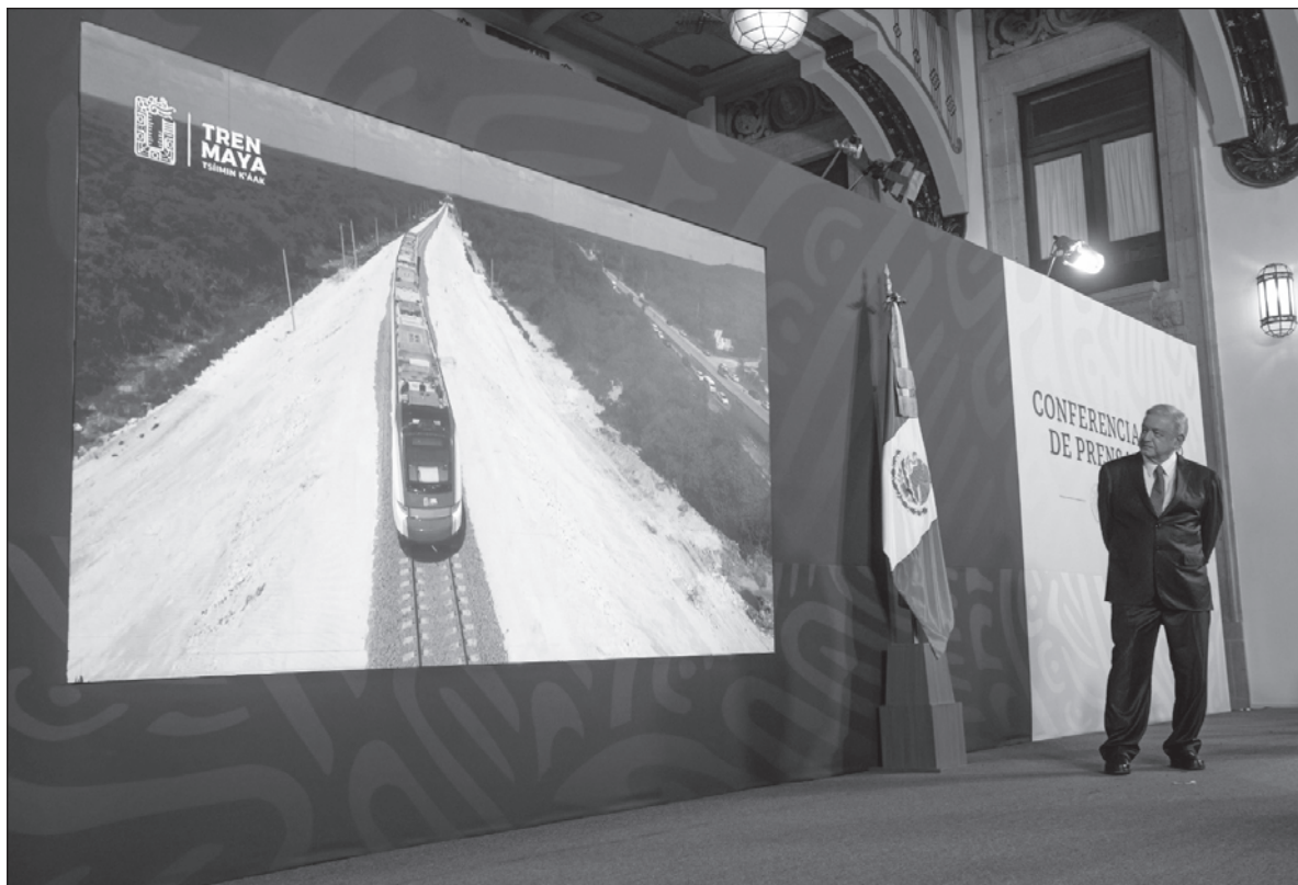
▲ “La verdad es que las mañaneras contribuyen bien poco a que sepamos lo que pasa en nuestro país. Sirven más bien para que nos enteremos de qué es lo que le disgusta al presidente, para que recordemos que ‘todo tiempo pasado fue peor’”.

Ahora se añade a este ejercicio cotidiano de post verdad una imagen espejo: Xóchitl amaga con retarnos su propia versión de la mañanera , dizque “de verdad”. No creo que por esta vía nos enteremos demasiado acerca de lo que es realmente importante entre lo que sucede en México. Más bien creo que entre las dos mañaneras veremos una suerte duelo de narrativas, al estilo de lo que nos deleitaba hace algunas décadas cuando cantaban a dúo Pedro Infante y Jorge Negrete, en Dos Tipos de Cuidado . Nada más que eso sí era divertido, y no ponía nada en juego más que las sonrisas. Lo que nos comunican hoy desde Palacio Nacional, y lo que responden