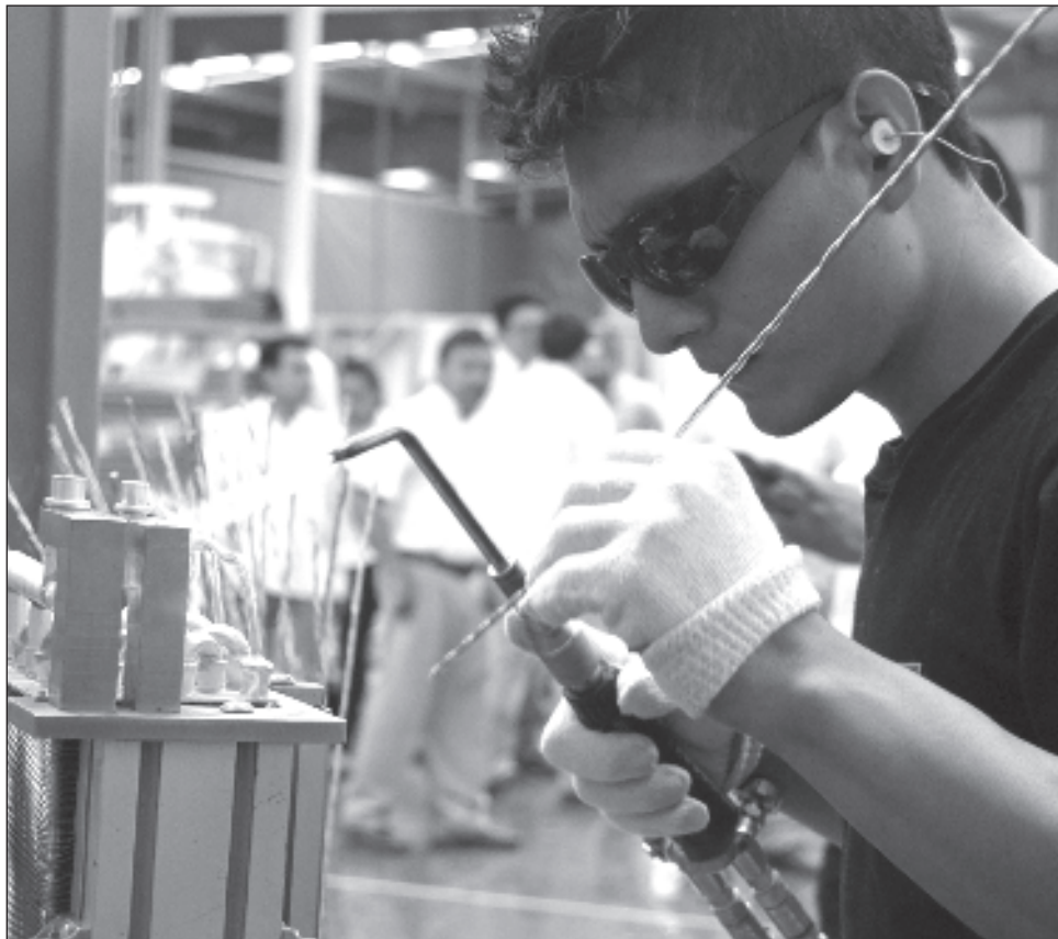
▲ De acuerdo con las cifras presentadas por la Feyac, se estima que al menos 26 empresas, es decir, el 20 por ciento aproximadamente, no renovaron sus distintivos en Campeche.