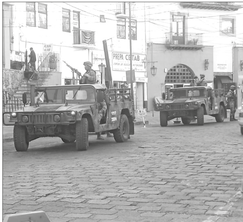
▲ Funcionario de la Fiscalía General Estatal de Guanajuato negó que se haya llevado a cabo la detención de capo del cártel Santa Rosa de Lima.