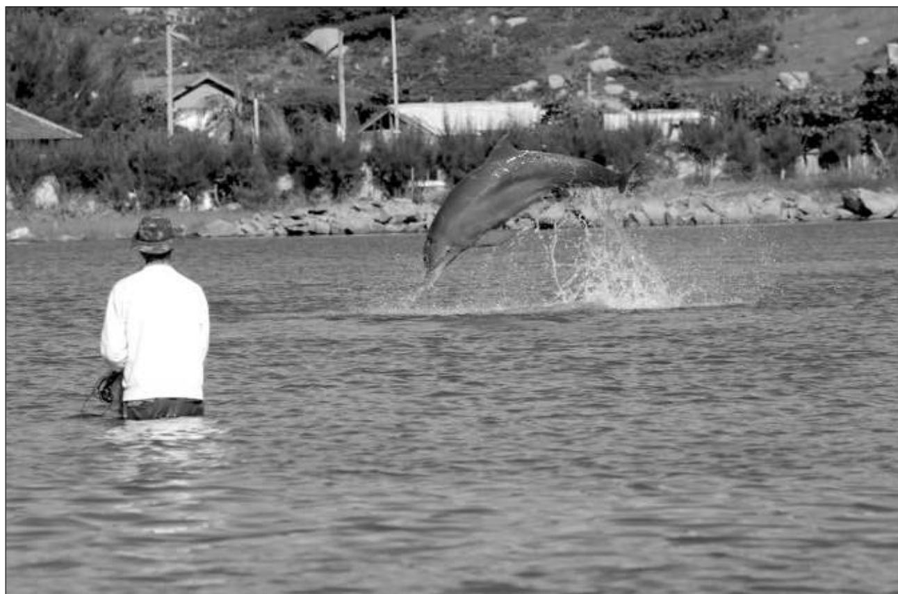
▲ En la ciudad costera de Laguna, los delfines conducen a la gente a los bancos de peces, y los humanos con sus redes facilitan a los animales cazar el alimento. Se trata de una alianza que ha sido registrada en textos periodísticos desde hace 150 años.

Este estudio muestra claramente que tanto los delfines como los humanos están prestando atención al comportamiento de los demás, y que los delfines proporcionan una pista sobre cuándo se deben lanzar las redes, explicó Stephanie King, bióloga que estudia la