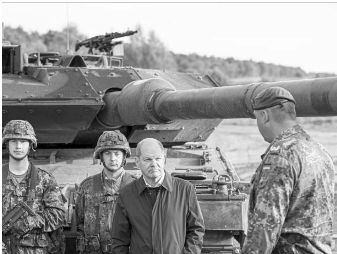
▲ "German public opinion was equally divided between those who supported giving tanks to Ukraine and those who didn't. Scholz had to consider the deep division on this issue and decide the best way forward".

HUNGARY'S PRIME MINISTER Viktor Orban is at best a pragmatist and at worst a Putin ally. Meanwhile, the EU is having significant difficulty in getting him to implement its sanctions and trade policies.