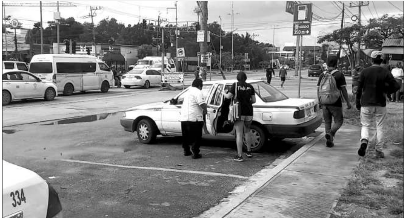
▲ La quinta reunión entre secretarios generales y líderes de los sectores de carga se llevó a cabo en el auditorio del sindicato Tiburones del Caribe de Tulum, donde abordaron el proyecto que desarrollan desde el año pasado.

Recordó que ya han sostenido cinco juntas y esta propuesta la han desarrollado desde el año pasado y espe-