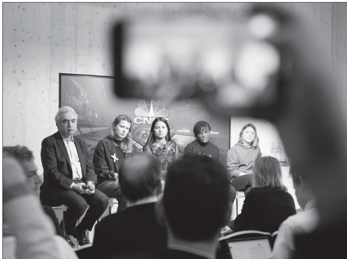
▲ “Diálogos en materia de cambio climático en Dubai serán inclusivos y estarán abiertos para todos”. Foto crédito

La postura formal de los directivos de la conferencia es que cualquiera puede participar, siempre y cuando presente soluciones que permitan acercarse al cumplimiento de los ya añejos acuerdos de París. Detrás del discurso