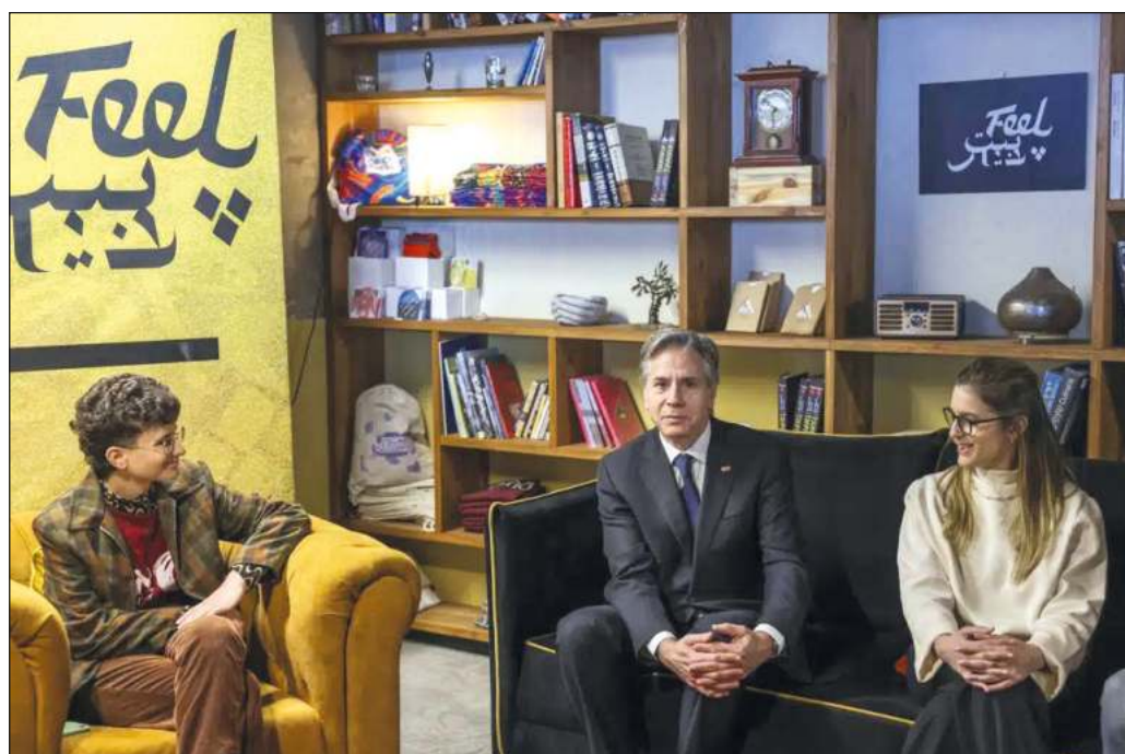
▲ El llamado de Blinken expresa la hipocresía tradicional de Washington ante el conflicto israelí-palestino, en la medida en que pretende tratar por igual a dos bandos colocados en extrema desigualdad.

Cierto es que los gobiernos israelíes han recurrido a toda clase de subterfugios para impedir ese desenlace y han alejado, con ello, la perspectiva de paz y seguridad que su pueblo merece; y es claro, hoy más que nunca, que sin la voluntad política de Europa y Estados Unidos resulta imposible la aplicación de una salida justa a la trágica situación de los palestinos.