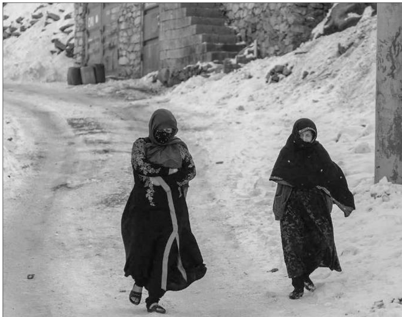
▲ Cerca de dos tercios de la población necesitará ayuda urgente en 2023 para sobrevivir, según la ONU.

La Oficina de Naciones Unidas para la Coordinación de Asuntos Humanitarios (OCHA) alertó que Afganistán “hace frente a una crisis humanitaria sin precedentes con un riesgo muy real de un derrumbe sistémico”. Así, destacó que cerca de dos tercios de la población, necesitarán ayuda urgente en 2023 para “sobrevivir”.