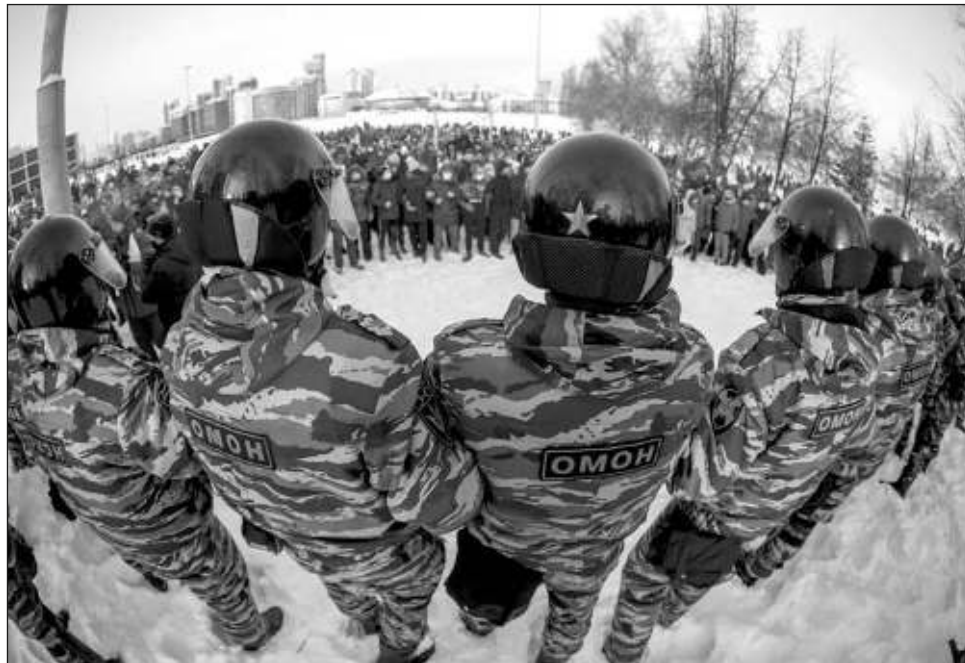
▲ “Como los gobiernos han fracasado de forma colectiva en hacer progresos en su contra, avivan el auge actual de violencia y conflicto y ponen en peligro a todo el mundo”, dijo Delia Ferreira Rubio, presidente de Transparencia Internacional en el índice evaluó a 180 países y territorios.

“La única salida para los estados es hacer el trabajo duro, extirpar la corrupción a todos los niveles para garantizar que los gobiernos trabajen para toda la población, no sólo para una pequeña élite”, añadió.