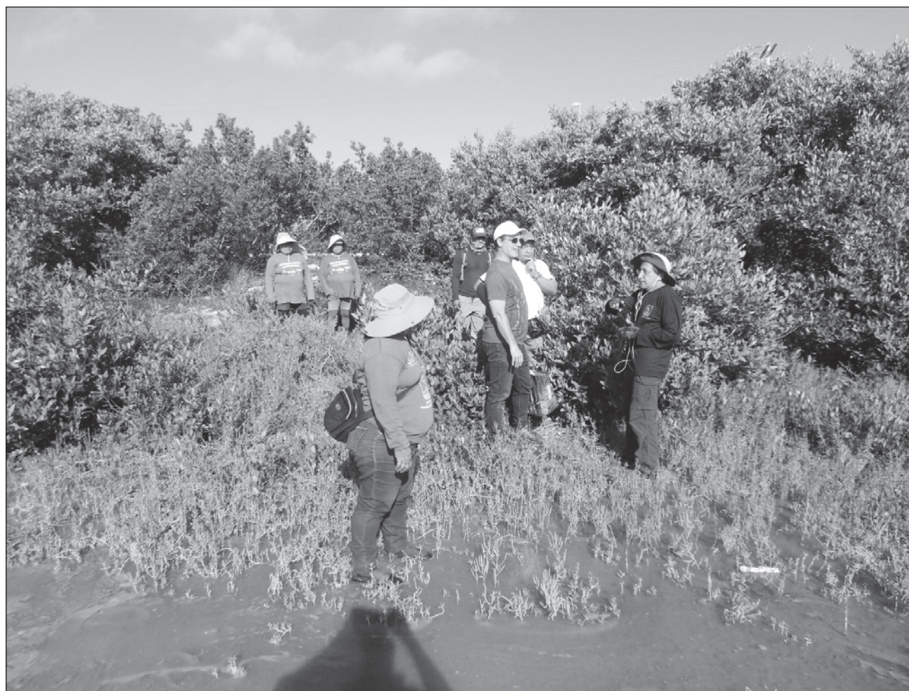
▲ La iniciativa se encuentra en fase experimental; los investigadores no saben si va a funcionar.