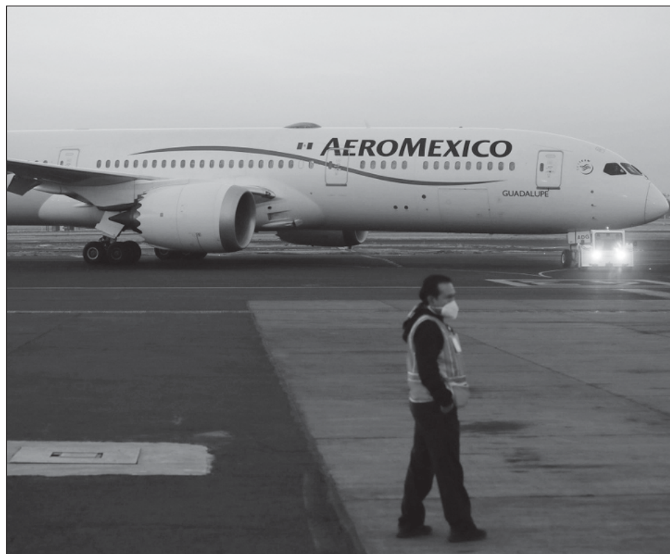
▲ Las autoridades estadounidenses y de México aprobaron la ruta considerando que el AIFA también da servicio a la zona metropolitana del Valle de México, detalló Aeroméxico.

Con ello, aún sin que sea un hecho la recuperación de México de la Categoría 1 en materia de seguridad aeronáutica por parte de la Administración Federal de Aviación de Estados Unidos (FAA, por su sigla en inglés), la firma