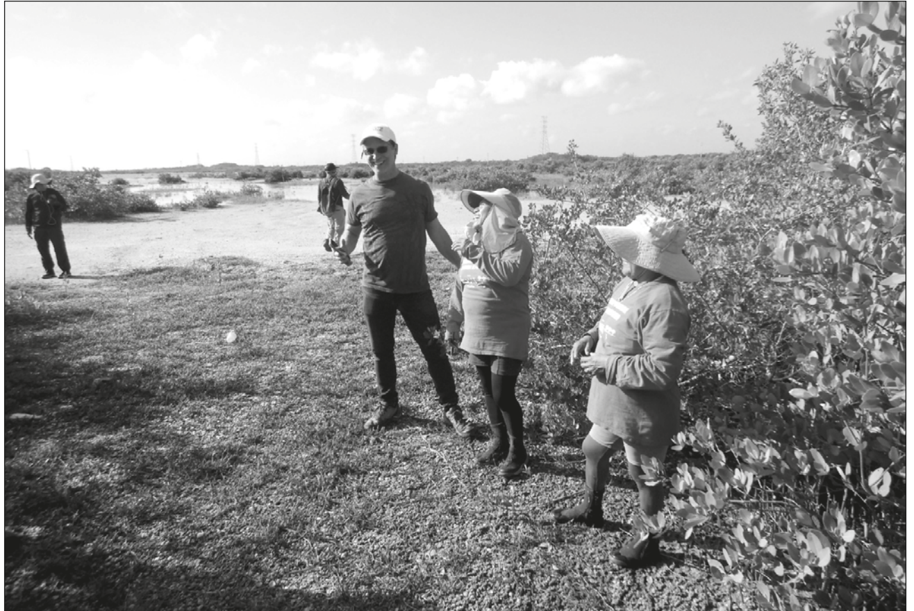
▲ U k'a'ananiil ba'ax ku taal yéetel le meyajá' leti' u táakbesa'al ko'olel yano'ob te'e kaajo'obo', ti'al u yilko'ob uláak' ba'al ku yutstal u meyajtiko'ob tu'ux yano'ob ba'ale' beyxan u xaak'al.

Herrera Silveira tu ya'alaje', le meyajá' jach mix juntéen yáax beeta'ak ti' mix tu'ux uláak' te'e yóok'ol kaaba', tumen láayli' yáax juntéen kun táakbesbil xúunan kaab ti' jump'éel xaak'al je'el bix le je'ela'; yaan uláak' xaak'al beeta'an ba'ale' ti' yaanal u jejeláasil u yik'el kaab.