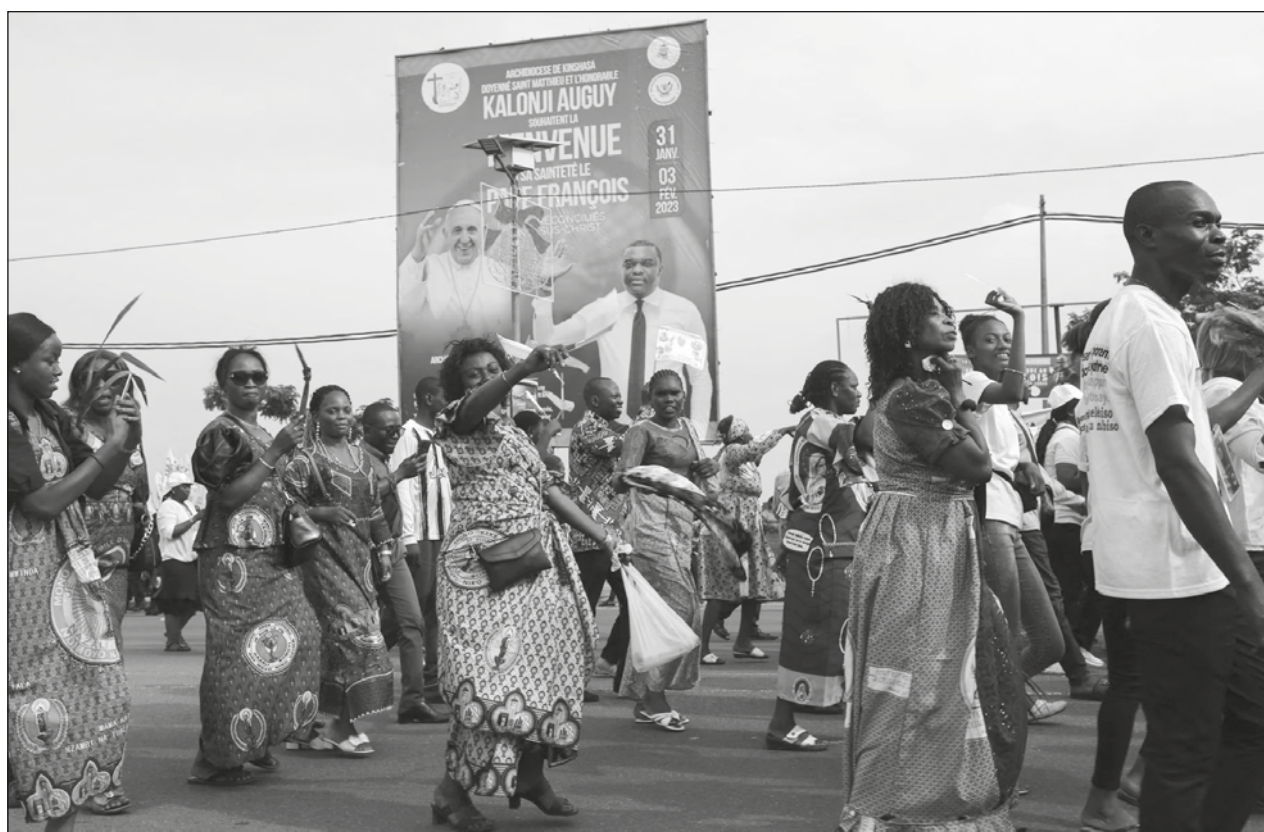
▲ “Que la violencia y el odio no tengan ya cabida en el corazón ni en los labios de nadie”: pide el Papa a congoleños.

Y, ante el recrudecimiento de la violencia en los últimos meses en el país, sobre todo en el este en la frontera con Ruanda, con el enfrentamiento con grupos armados como el rebelde Movimiento 23 de Marzo (M23), el papa pidió a los congoleños “que la violencia y el odio no tengan ya cabida en el corazón ni en los labios de nadie, porque son sentimientos antihumanos y anticristianos que paralizan el desarrollo y hacen retroceder hacia un pasado oscuro”.