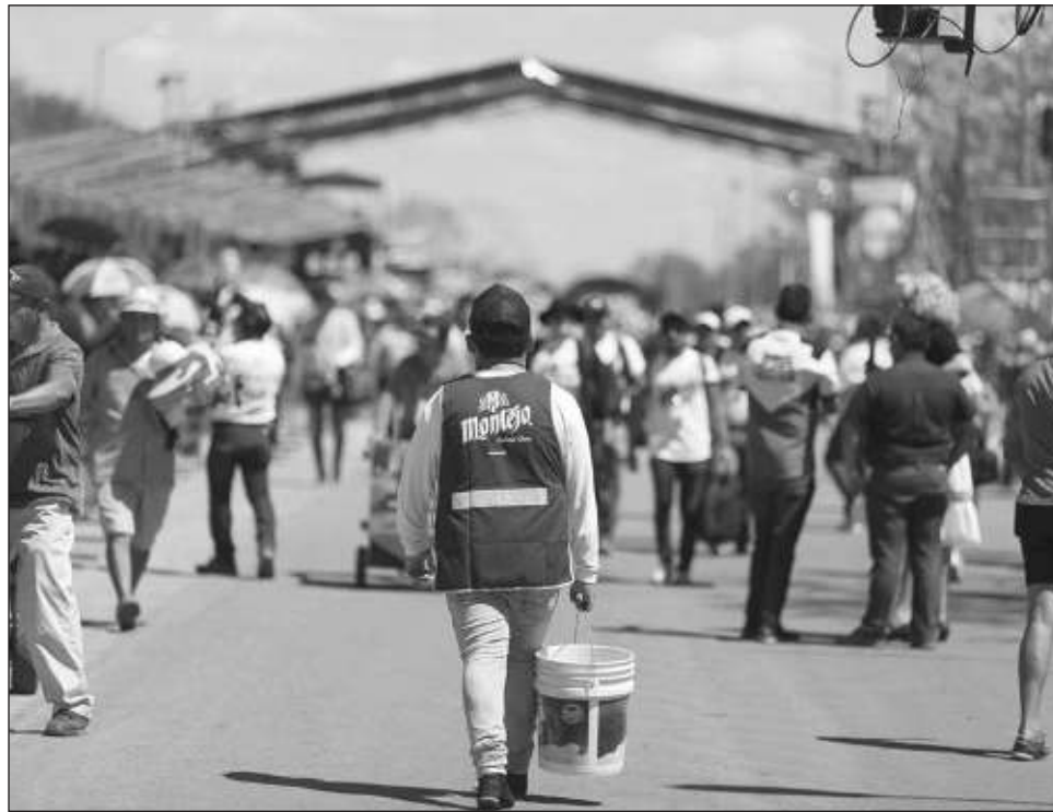
▲ La fiesta de la ciudad se llevará a cabo del 4 al 12 de febrero.

"Como organismo empresarial, nos sumamos a la