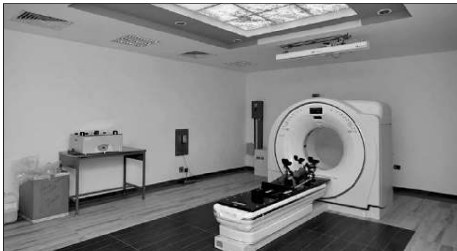
▲ “El IMSS Bienestar está llamado a ser la institución de la cuarta transformación que atienda a las personas sin seguridad social”, indicó Zoé Robledo.

informó sobre los avances en el programa IMSS Bienestar y que en este primer mes del año se integraron nuevas entidades del país: Hidalgo, Tamaulipas y Quintana Roo.