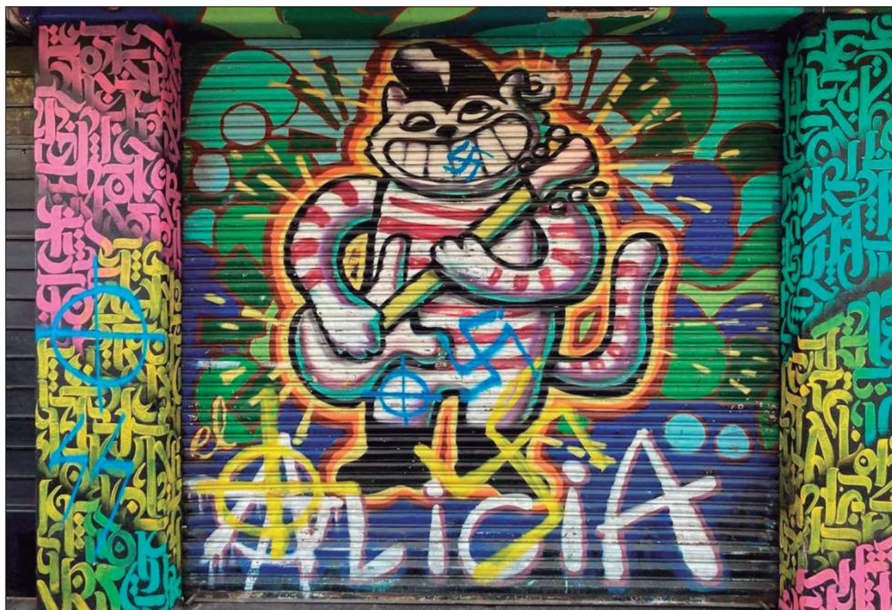
▲ Los ataques al Multiforo Alicia -que cerrará definitivamente sus puertas en unas semanas- se han manifestado luego de los conciertos clandestinos de bandas neonazis nacionales y extranjeras en la Ciudad de México.

Tras la declaratoria de hechos en la fiscalía dijeron que darán seguimiento para hacer la investigación; “van a revisar las cámaras detalle por detalle; en sí, todo fue muy ágil al presentar la denuncia y levantar el acta”.