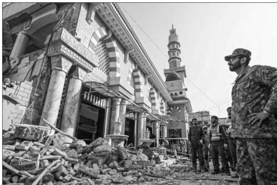
▲ Varias provincias del país aumentaron el nivel de alerta tras la explosión, con el refuerzo de los puestos de control y el envío de fuerzas adicionales de seguridad.