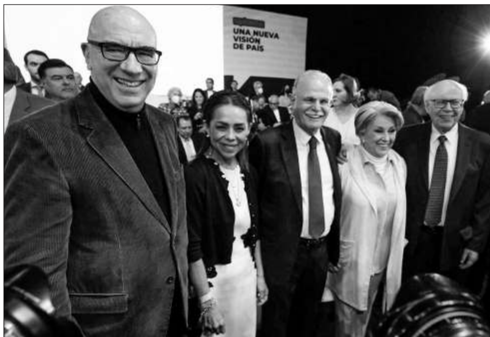
▲ Andrés Manuel López Obrador consideró que los conservadores mexicanos no saben hacer política con la gente, por “eso necesitan hacer estos foros”.

Durante su conferencia, aseveró que están en su derecho de libre expresión y su gobierno está obligado a garantizar el derecho a disentir. Sin embargo, a pregunta expresa sobre si considera a Cuauhtémoc Cárdenas un adversario, dijo que “en