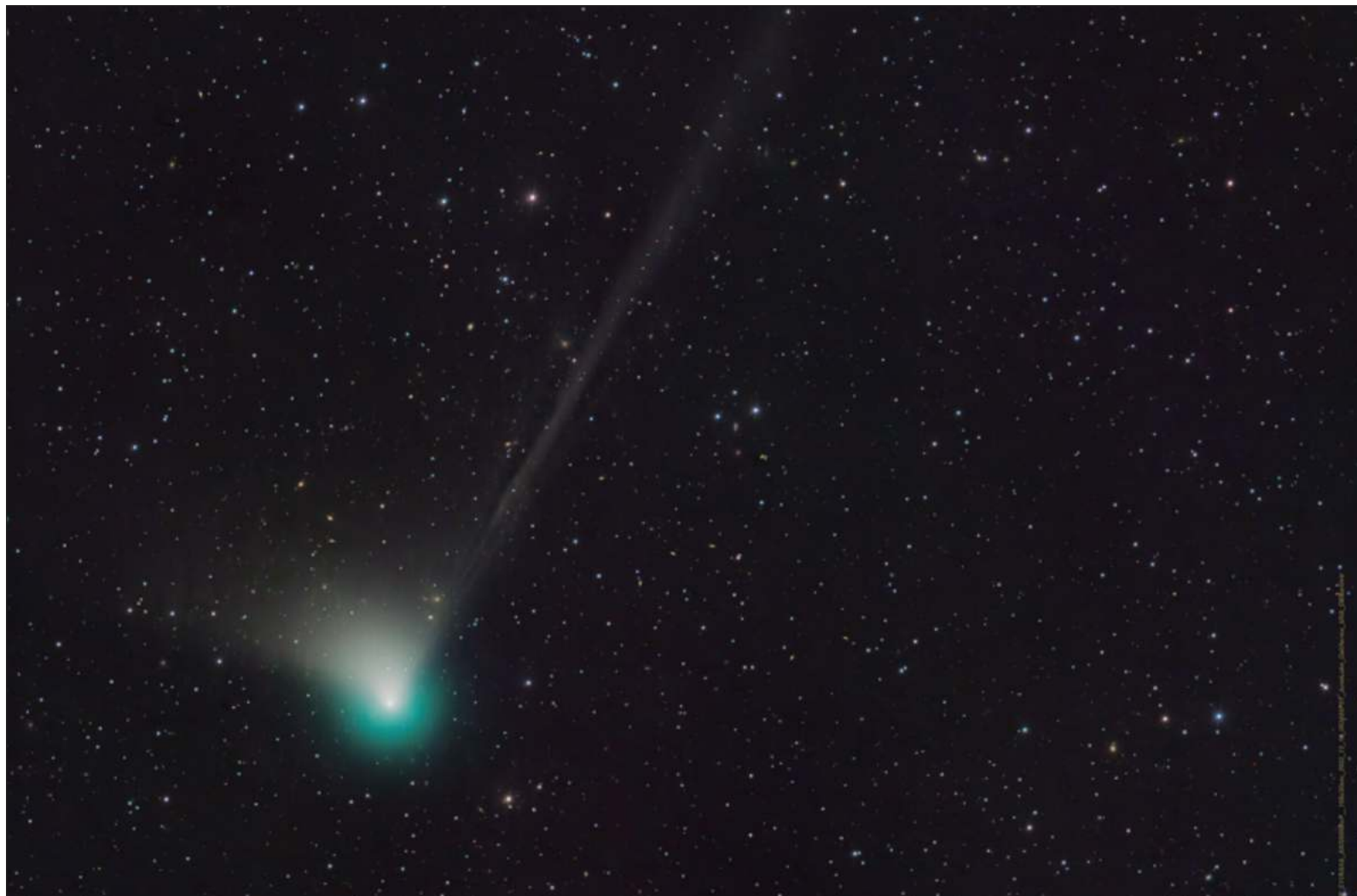
▲ "La singularidad de este peregrino es que los elementos que lo conforma provocan esos colores de jungla; una selva voladora".

Hemos sido capaz de crear artefactos que nos han revelado los confines del cosmos, mostrándonos los ecos del hágase la luz. Sin embargo, otros objetos nos arrebatrán la dicha de contar estrellas, el poder de elegir una y regalársela a alguien; los viejos lobos de mar, los que aún se guían mirando al cielo nocturno, no podrán descubrir otros continentes. Sin embargo, aún tenemos la oportunidad de ver las cabalgatas de cometas.