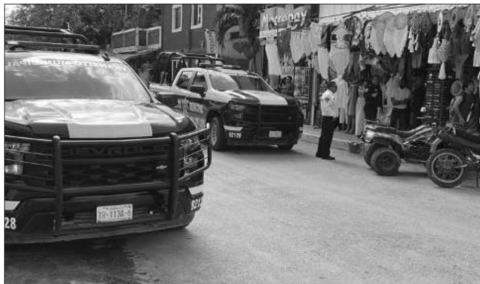
▲ La Dirección de Tránsito Municipal recibió una denuncia ciudadana, de forma que agentes acudieron a una zona comercial de la calle Orión entre Tulum y Andrómeda.

Asimismo, solicitó a la ciudadanía que denuncie estas actividades que van contra el reglamento de tránsito, para que los oficiales puedan acudir a poner orden.