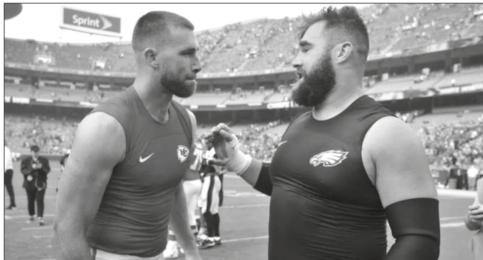
▲ Los hermanos Travis (izquierda) y Jason Kelce son claves para Jefes y Águilas, respectivamente.

"Será una sensación increíble poder jugar contra él", añadió Travis, cuyo equipo ha sido superior a las Águilas de su her-