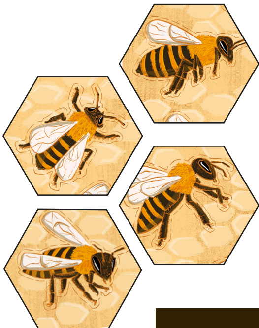
▲ Boonil @ca.ma.leon

▲ Rover Perseverance túuxta'an meyaj tumen NASA tak tu lu'umil Martee' tu jóok'saj u sutik u yich le ba'alo', tak yóok'ol 360 graados. Beey túuno', páatchaj u náats'al, u yáax noj oochelil ti' bix yanik u bak'pachil u kraateril Jezero, úuchik u béeykunsik ju'ulul yéetel u ch'a'abal u yoochel ti' bix yanik chak pláanetáa.