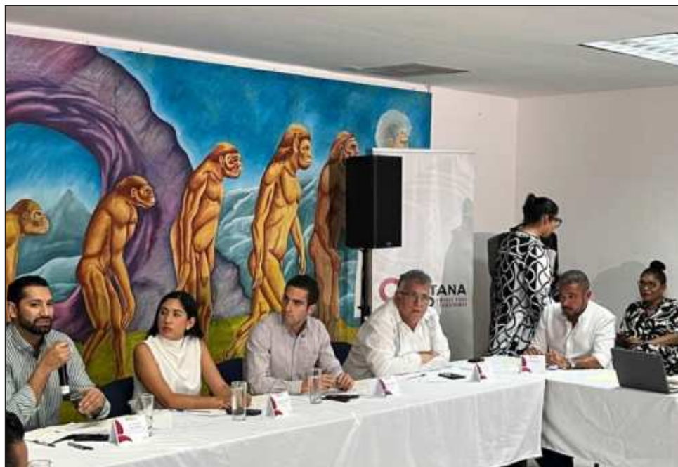
▲ En conjunto con la Sede y Sefiplan, la asociación Empresarios por Quintana Roo también busca la ampliación del decreto a todo el sexenio de Sheinbaum.

En esta ocasión tanto la Secretaría de Finanzas y Planeación (Sefiplan) como la Secretaría de Desarrollo Económico (Sede) del estado están reforzando la propuesta empresarial, que debe llevarse ante el gobierno federal, para lo cual se llevó a cabo una reunión en días pasados. Las tres propuestas principales consisten en: la