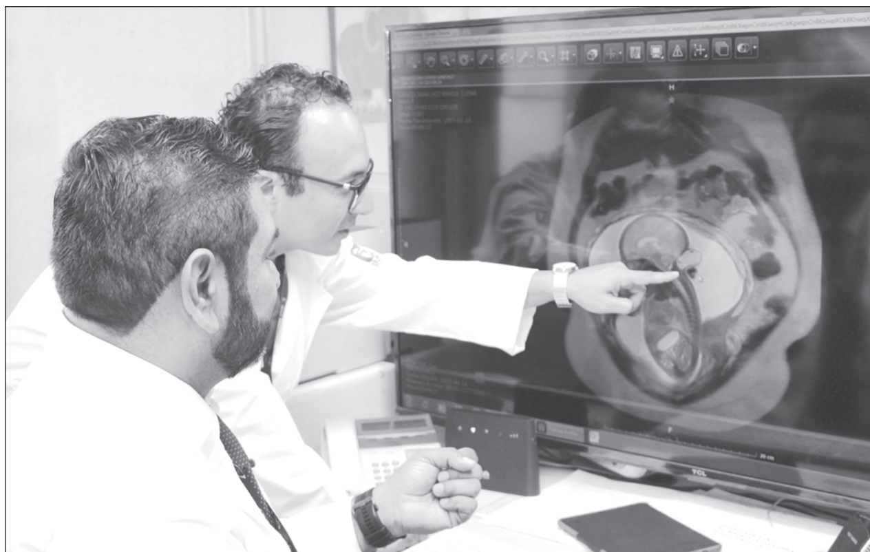
▲ En la CDMX, para 2019, había 381 especialistas en 57 hospitales de especialidades, y a la fecha suman mil 78.

Al contrario, "hay mucha gente que tiene años en la cárcel porque no tiene cómo comprobar su inocencia, increíble pero es así", por eso, recordó que ya ha enviado dos iniciativas para ofrecer indultos.