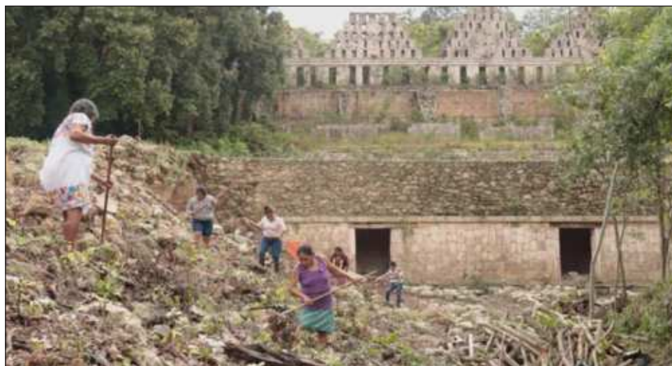
▲ Las mujeres cuentan a sus familias, en particular a sus hijos, que esa esplendorosa zona fue edificada por sus antepasados. Es lo que hicieron nuestros abuelos, nuestros ancestros, afirman.

Ella y otras mujeres de su poblado se han sumado a un proyecto en el que son partícipes de trabajos arqueológicos de ese antiguo sitio maya, ubicado en la región conocida como el Pucc, la cual floreció en el periodo