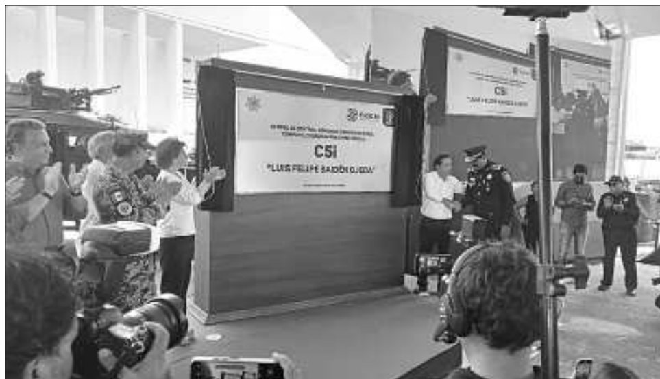
▲ En reconocimiento a la labor del titular de la SSP, Luis Felipe Saidén Ojeda, el gobernador Mauricio Vila Dosal dio al C5i el nombre del funcionario.

Tras develar la placa conmemorativa, el mandatario