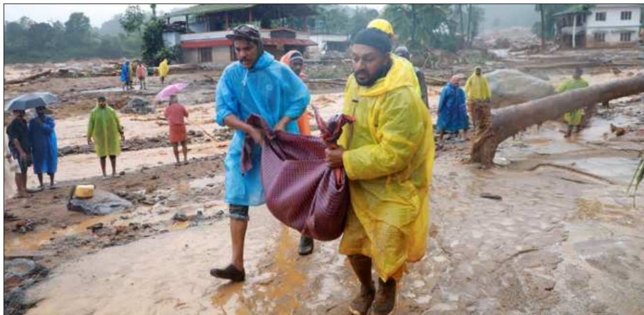
▲ El desprendimiento dejó casas completamente cubiertas de lodo y arrastró coches, chapas metálicas y otros escombros a su paso. Por lo que el ejército anunció el despliegue de más de 200 soldados en la zona para ayudar a las fuerzas de seguridad y equipos de rescate.

“Mis pensamientos están con todos aquellos que per-