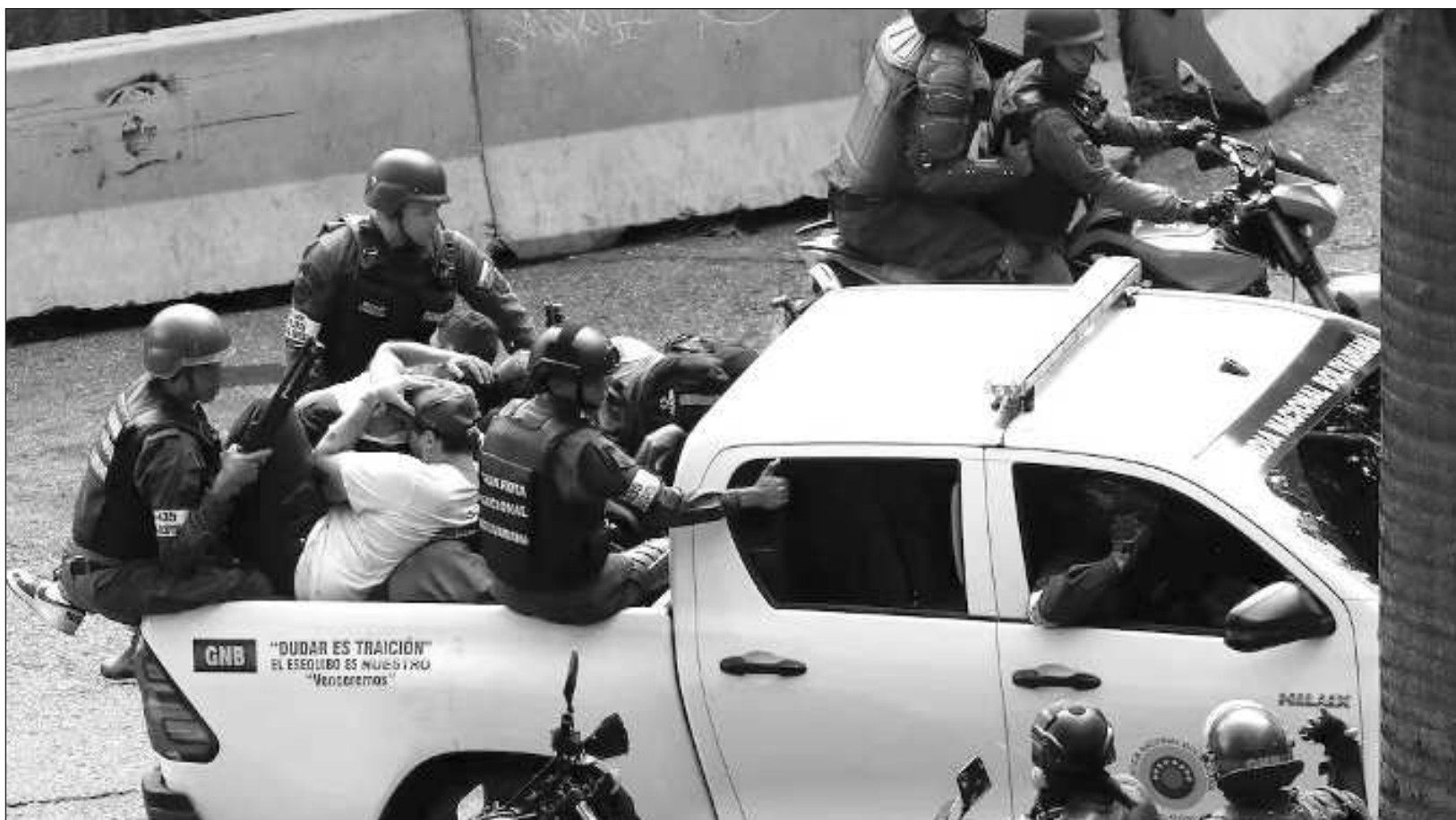
▲ El mandatario venezolano dijo que mantendrá la disposición de movilizar a policías y militares en las protestas que se levantaron en la capital y varios puntos más del país desde el lunes en contra de los resultados anunciados por el Consejo Nacional Electoral.