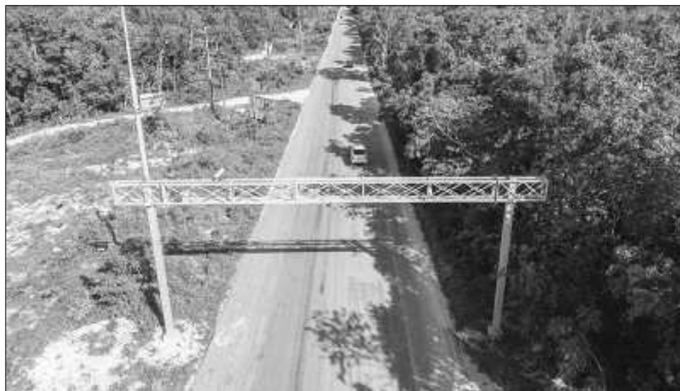
▲ Las cámaras fueron colocadas en las tres entradas a Tulum: del lado norte, hacia Solidaridad; del lado sur, hacia Felipe Carrillo Puerto y al poniente, en la vía que conduce al poblado de Cobá y a Valladolid, en el vecino estado de Yucatán.

“Son tres arcos carreteros que se acaban de instalar, están posicionados en lo que son las entradas del municipio de Tulum: dos están sobre la carretera federal hacia el norte y hacia el sur y uno más está hacia lo que es la carretera que va rumbo a Cobá. Estos arcos cuentan