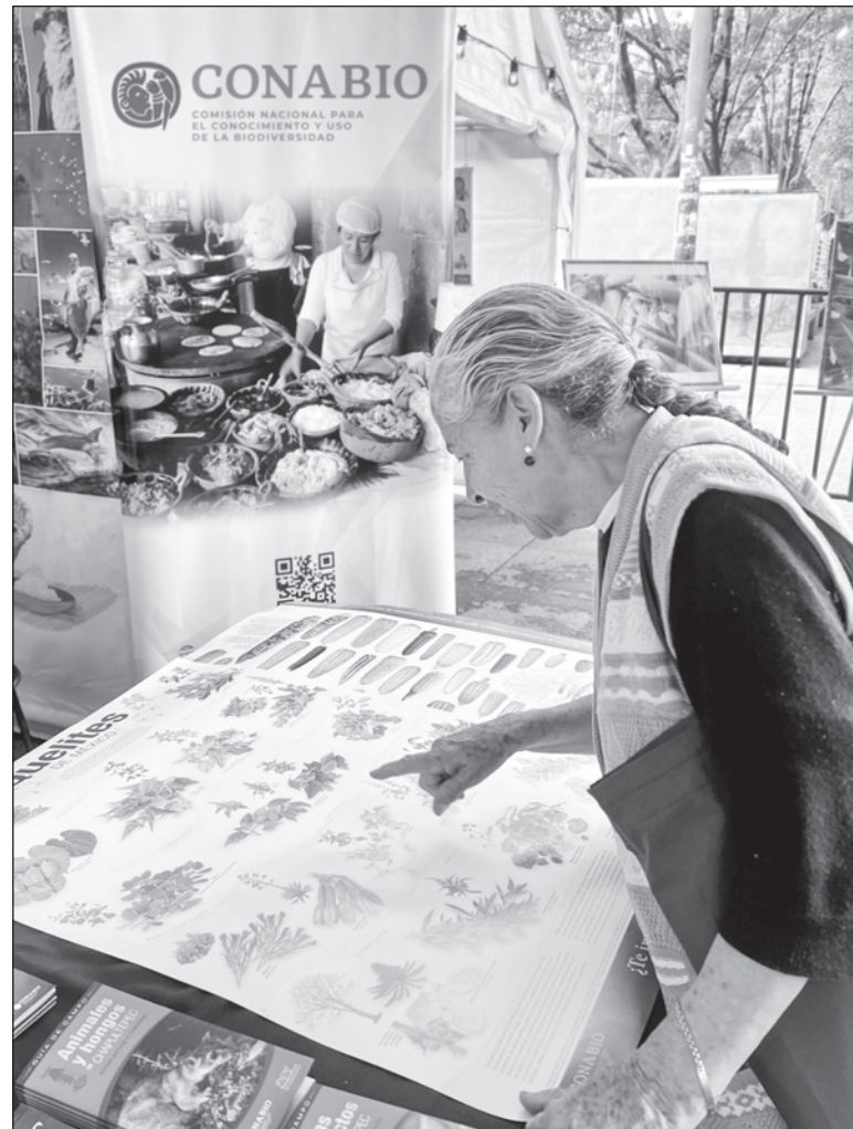
▲ "La Comisión también proporciona información oportunísima acerca de los puntos de calor que pueden desembocar en incendios forestales, lo que permite a las brigadas de combatientes acudir a los sitios de riesgo antes".

Saber qué especies se encuentran en nuestro país, cuál es su ori-