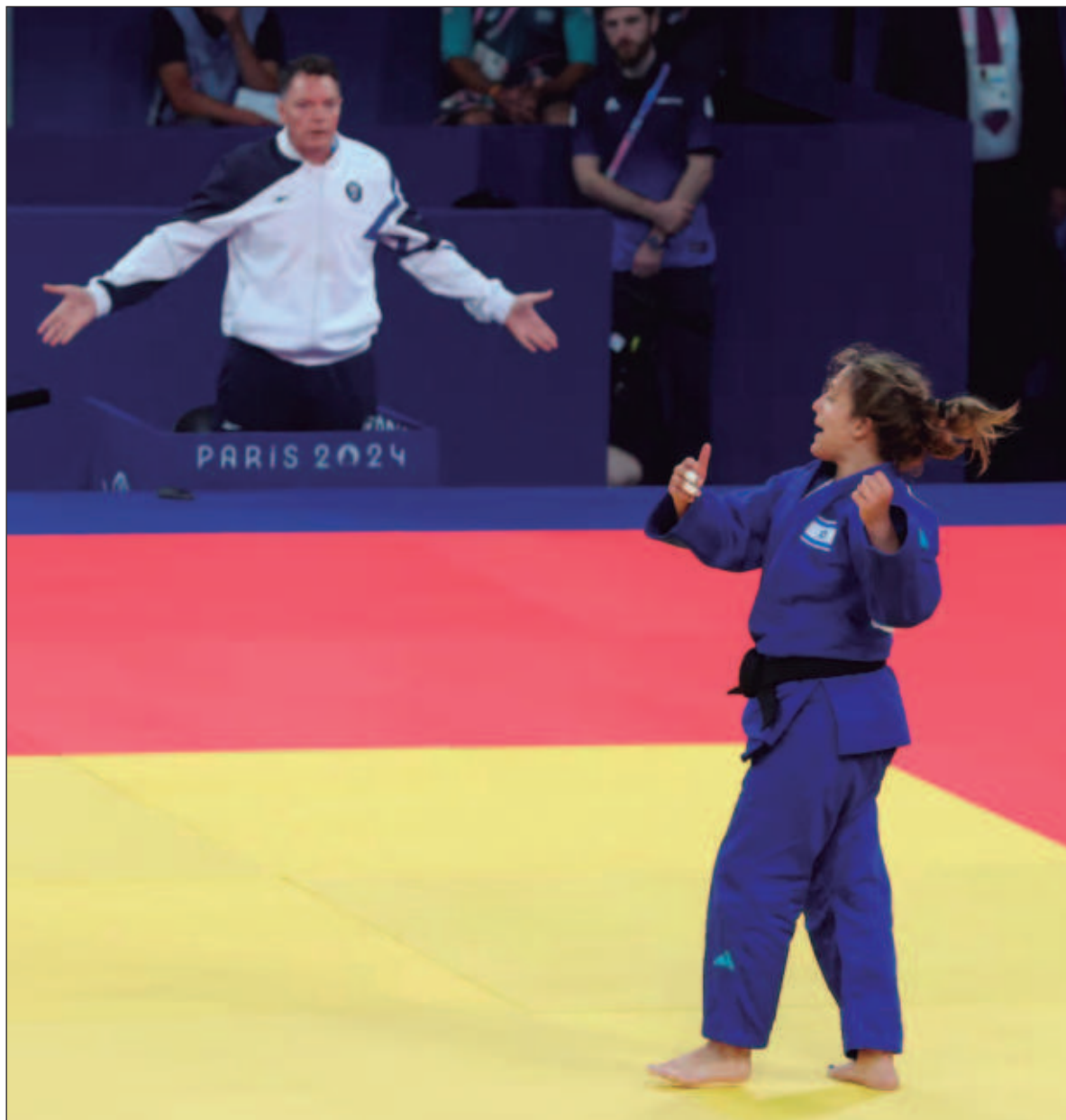
▲ “Es de suma importancia tener muy en claro que muchos deportistas de Israel son miembros del Ejército sionista y han tenido durante estos meses participación activa en el genocidio realizando crímenes de guerra”.

Este 2024, con los Juegos Olímpicos ya en marcha, hemos visto el incremento de protestas ante la presencia de Israel en la justa deportiva, por ejemplo, durante la inauguración cuando desfilaba la delegación israelí una mayoría del público presente repudió con sil-