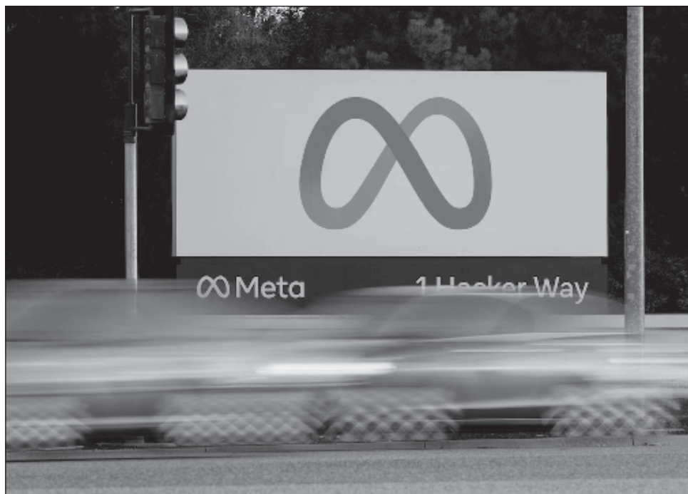
▲ Meta dijo en un comunicado: “estamos encantados de resolver este asunto y esperamos explorar futuras oportunidades para profundizar nuestras inversiones comerciales en Texas”.

Meta dijo en un comunicado: “Estamos encantados de resolver este asunto y esperamos explorar futuras oportunidades para profun-