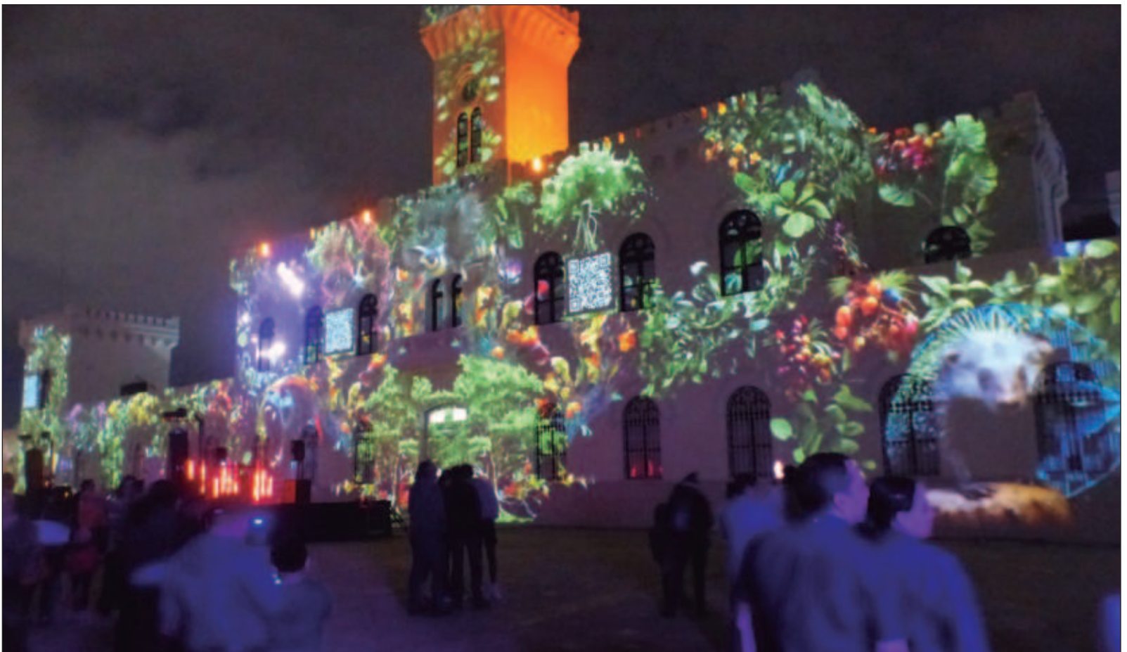
▲ "Hay muchos proyectos que merecen continuar e, incluso, ser fortalecidos. Uno de ellos, por ejemplo, es el del parque de La Paz y la ex peni".