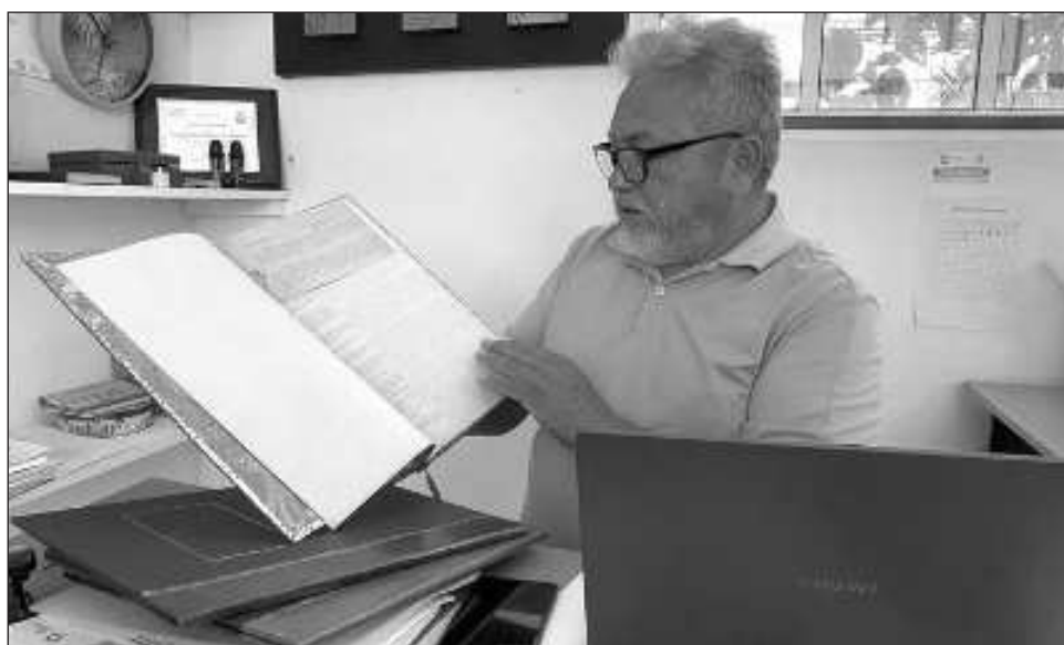
▲ El recinto, que se inaugurará dentro de la Casa de la Cultura de Tulum en octubre próximo, tendrá información acerca de la historia del noveno municipio y del estado.