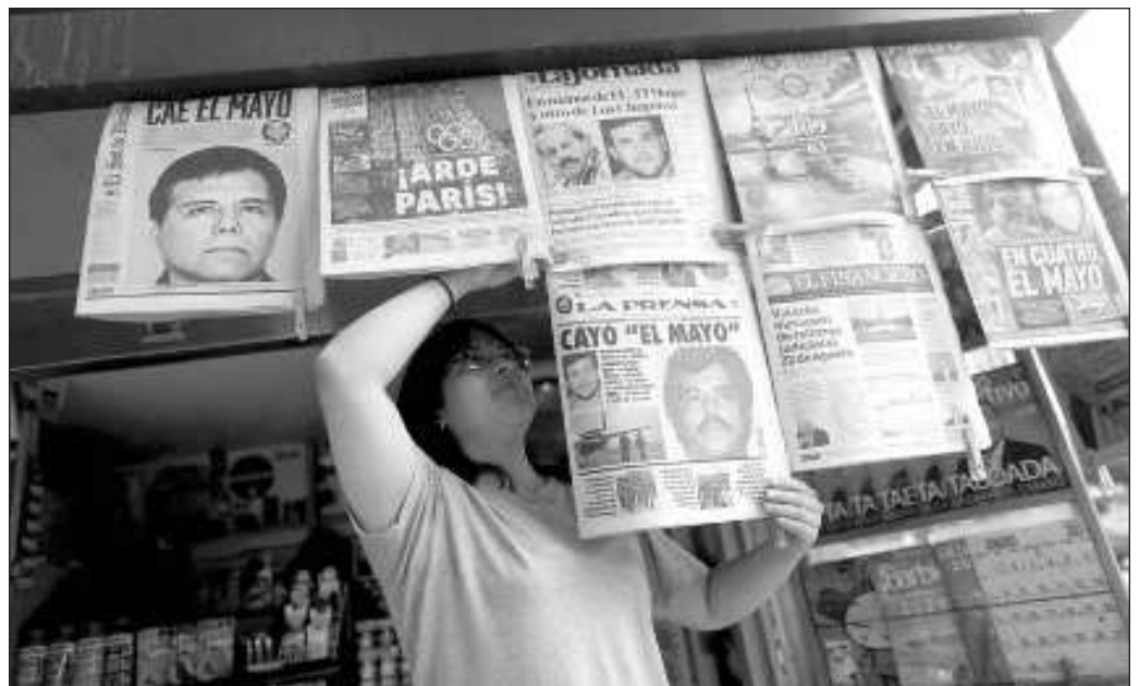
▲ Hacer que Washington entregue toda la información acerca de la captura de El Mayo y Guzmán López resulta crucial tanto para la seguridad en el país como para el combate al crimen organizado.

Las agencias estadounidenses poseen un largo historial de actuaciones extraterritoriales y ajenas a los gobiernos nacionales, incluyendo a México. En la coyuntura electoral que atraviesa ese país, ambos candidatos tienen particular interés en mostrarse fuertes ante su electorado y México suele ser usado de ejemplo para sus intenciones en cuanto lleguen a constituirse en gobierno. En este momento, todo esfuerzo por hacer que se respete la soberanía nacional es vital. Hacer que Washington entregue toda la información acerca de la captura de El Mayo y Guzmán López resulta crucial tanto para la seguridad en el país como para el combate al crimen organizado.