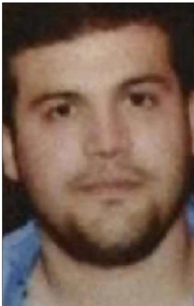
▲ Guzmán López fue puesto bajo custodia estadounidense el jueves por la noche cerca de El Paso, Texas, junto a Ismael El Mayo Zambada, un fundador del Cártel de Sinaloa.

Guzmán López, de unos 30 años, deberá comparecer ante un tribunal federal de Chicago. Fue puesto bajo custodia estadounidense el jueves por la noche cerca de El Paso, Texas, junto a Ismael El Mayo Zambada, el septuagenario acusado de ser capo del narcotráfico que fundó el Cártel de Sinaloa junto a El Chapo .