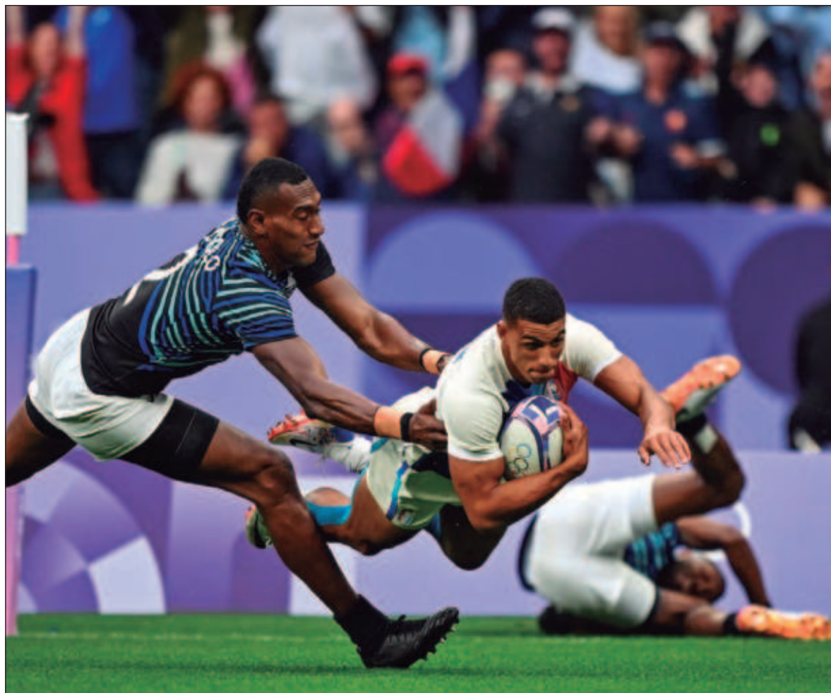
▲ "Ante la avalancha de narrativas que nos tratan de mostrar un mundo diverso que es dominado por unos cuantos, me gusta pensar que siempre habrá hierbas de asfalto que hacen grietas para mostrar sus flores".