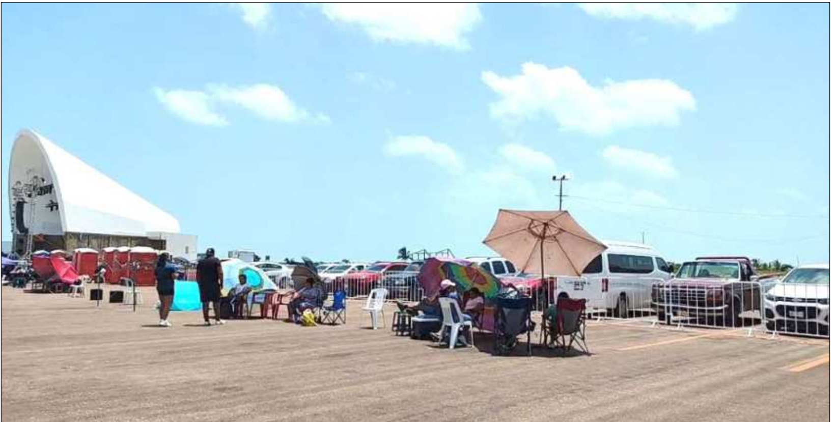
▲ Aun cuando las autoridades informaron que el área de sillas será abierta, cerca de las 19 horas del miércoles, los fans ya se habían apostado para ser los primeros en ingresar.