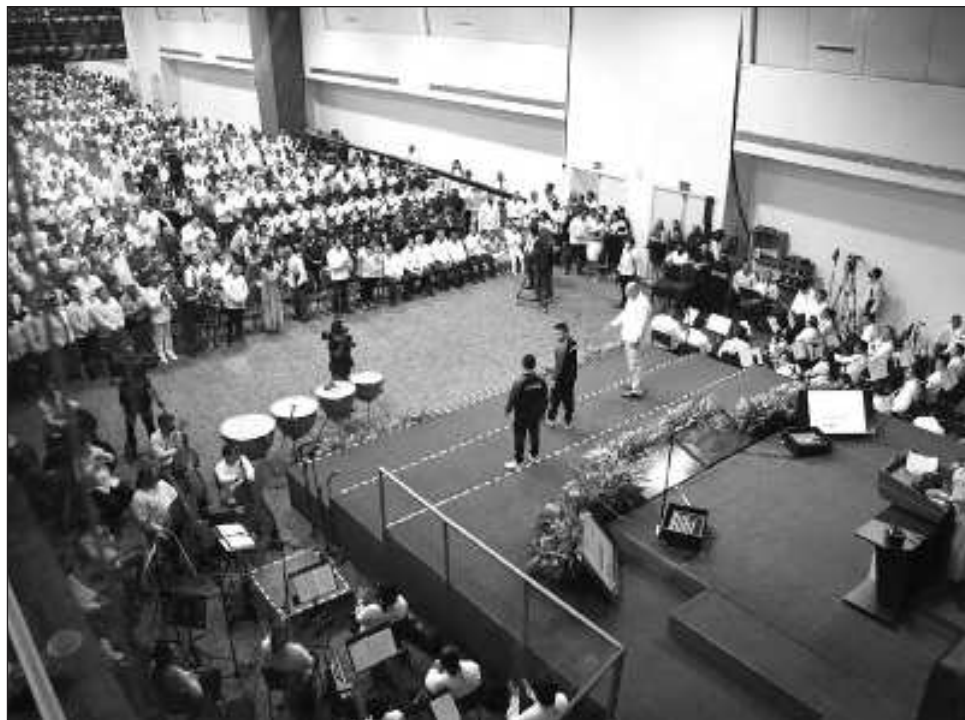
▲ Anteriormente, se hacía el protocolo oficial, y después de la entrega del informe a los diputados, un evento público donde desfilaban invitados especiales.

Si bien el Informe de Gobierno estará dividido por ejes según el Consejo de Planeación para el Desarrollo del Estado de Campeche (Copladecam), y la mandataria dará una explicación de cómo se ha ocupado el recurso disponible para la entidad del 2023, en los siguientes días los integrantes del Gabinete Estatal y ampliado serán sometidos al escrutinio de los legisladores.