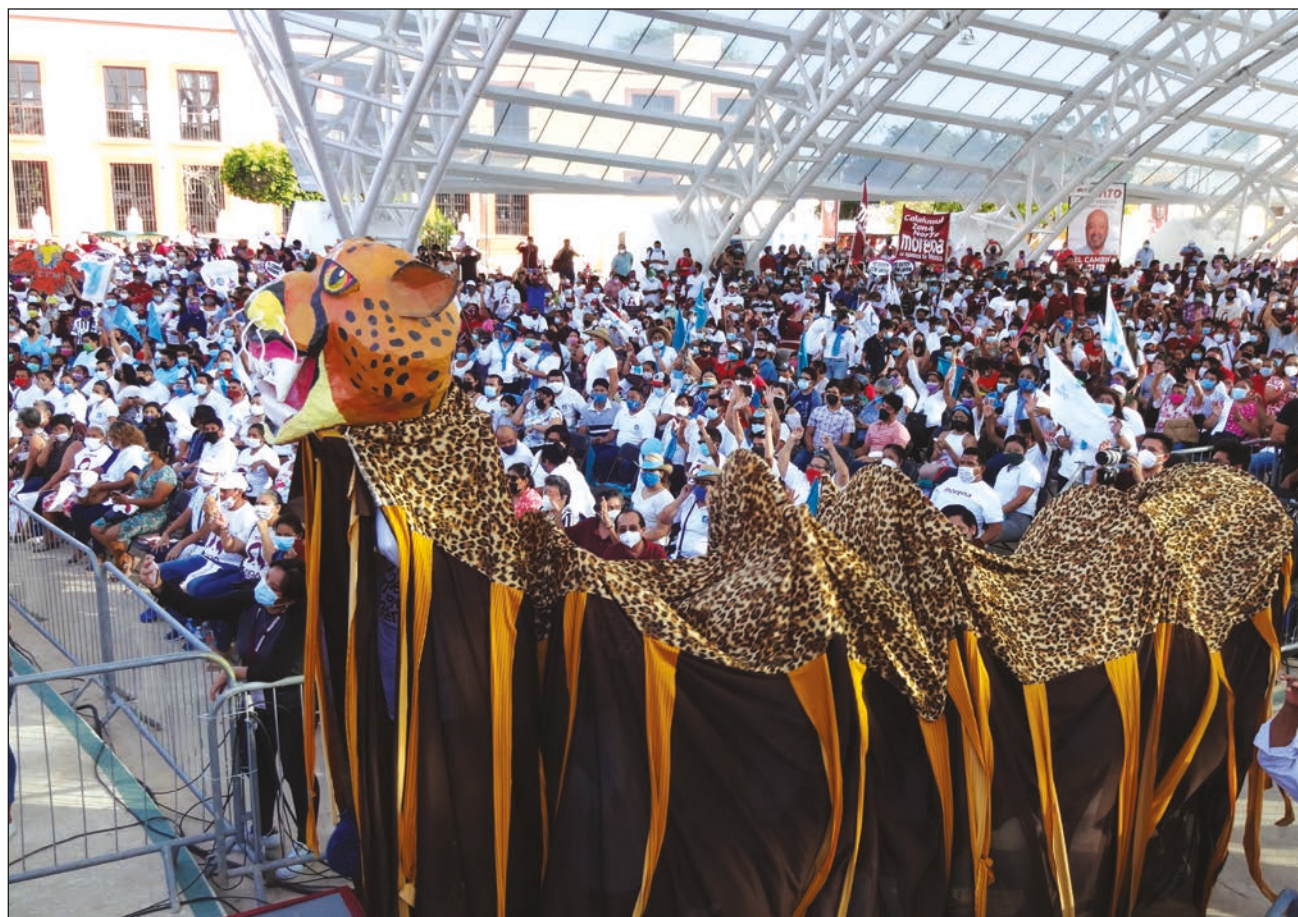
▲ El cierre de campaña de Layda Sansores terminó en agresiones a representantes de medios.

Sansores San Román viene de ser alcaldesa de la delegación Álvaro Obregón en la Ciudad de México; lleva 18 años intentando ser la primera gobernadora de Campeche y más aún, la primera alternancia de gobierno, siendo que en 1997; en su primer intento con el PRD, aparentemente había