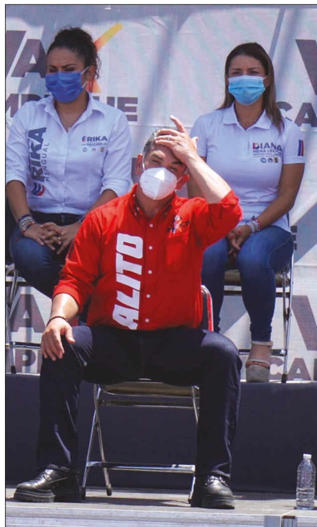
▲ El ex gobernador ha sido denunciado ante la Administración de Fiscalización Estratégica.

También con Distribuidora y Comercializadora Frisia, Everomex Solutions, Inveryuc y Maquila Textil del Sur, entre otras.