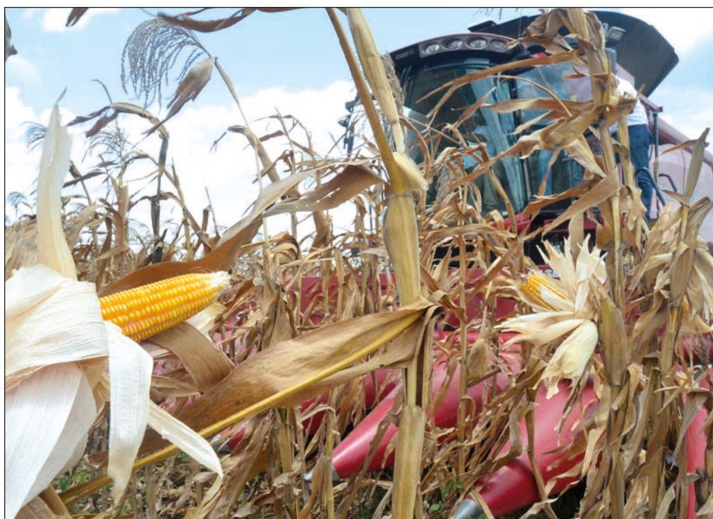
▲ Entre sequía, heladas y calores excesivos, cientos de miles de hectáreas se arruinaron, especialmente en entidades como Sonora y Tamaulipas.

Además de constituir un tema urgente para aliviar las circunstancias de pequeños productores agrícolas y de las clases populares en general, la recuperación de las cosechas nacionales es un requisito ineludible en la búsqueda de la soberanía alimentaria, la cual se aleja en la medida en que debe recurrirse a las importaciones para cubrir el consumo interno.