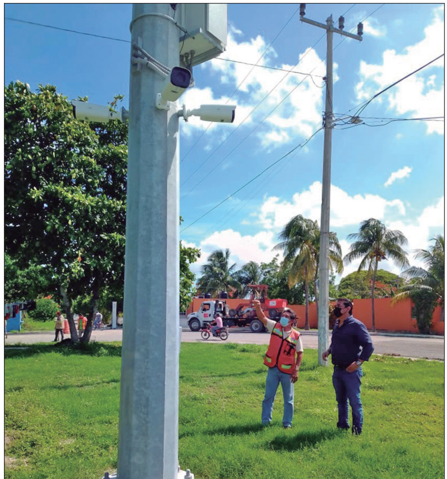
▲ Las tres bases cuentan con cinco cámaras, una de ellas giratoria de 360 grados.

Por todo lo anterior, el edil concluyó al resaltar que gracias al programa “Yucatán Seguro”, el Ayuntamiento de Progreso en coordinación con el Gobierno del Estado refrenda su compromiso de mantener la tranquilidad, seguridad y protección de los habitantes.