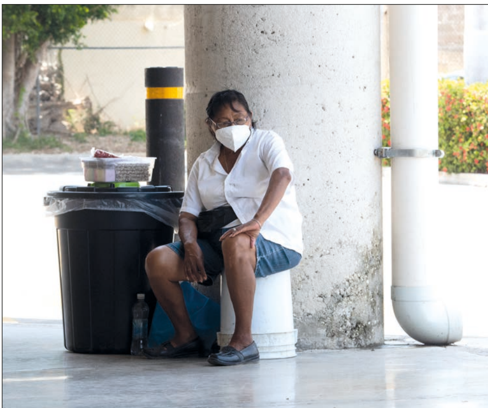
▲ Entre deudas, renta y enfermedades, es imposible quedarse en casa en tiempos de pandemia.