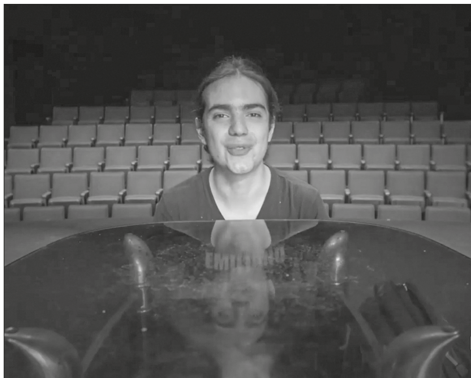
▲ Salir al mar fue escrita para la titulación de la generación 2018 de alumnos del Centro Universitario de Teatro. Foto captura de pantalla

Quiero decir al público que se dé el chance de verlo; es más fácil que en el teatro, porque no tiene que salirse a escondidas y nadie lo ve si no le gustó la obra. Aquí (en el teatro virtual), basta con apagar el dispositivo o cambiarle a Netflix. Dense la oportunidad de ver lo que los artistas estamos haciendo para seguir contando historias y no nos olviden, ésa es nuestra carta en este tiempo.