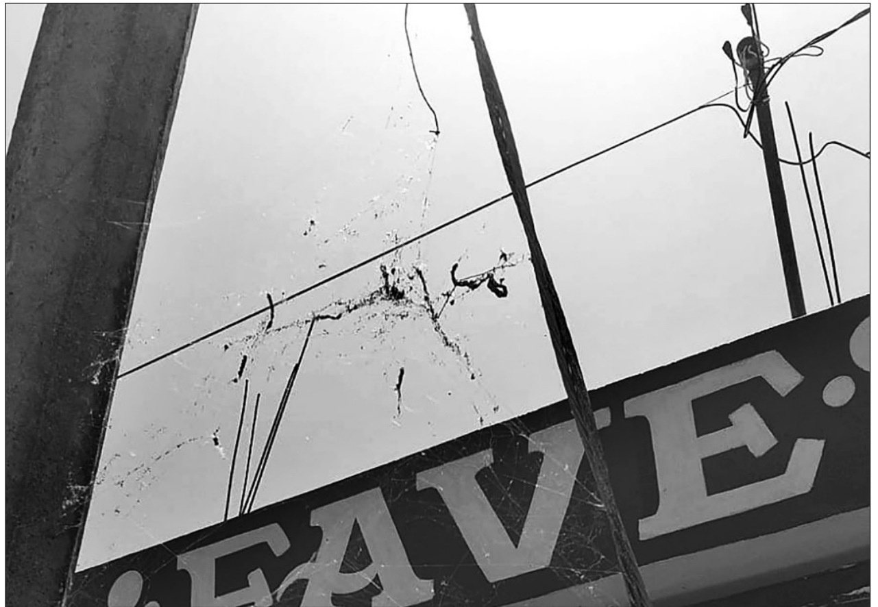
▲ Las telarañas de la especie tetragnatha superaron la vegetación costera y ahora pueden ser observadas en colonias del centro de la capital quintanarroense.

Al no existir más la Comisión de Límites de las Entidades Federativas del Senado, se realizó el resguardo de los expedientes formados con los documentos referentes a los casos de conflicto sobre límites territoriales considerándose como asuntos concluidos, entre los que se encuentran los referidos expedientes de las controversias constitucionales 9/97 y 13/97.