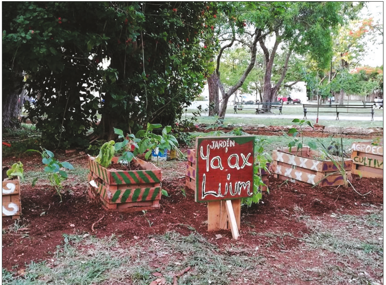
▲ El objetivo de la manifestación fue exponer un agrosistema alimentario y medicinal, asociado con especies de uso tradicional, para que la sociedad conozca la planta de cannabis.

El fin fue exponer un agrosistema alimentario y medicinal, asociado con especies de uso tradicional, que se pueda replicar en los jardines públicos de los diferentes parques de la ciudad de Mérida y de los municipios en el estado de Yucatán, para que la sociedad conozca e identifique la planta de cannabis en un sistema de huerto comunal, tradicional o urbano.