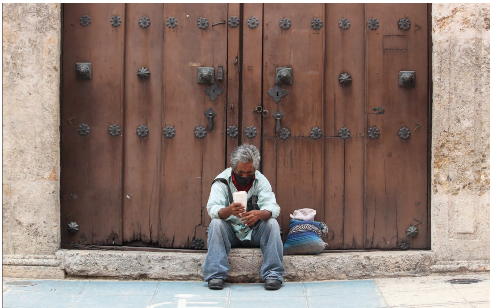
▲ Al principio el supermercado apoyaba a sus cerillitos con un pago semanal, que ahora es de 60 pesos quincenales.