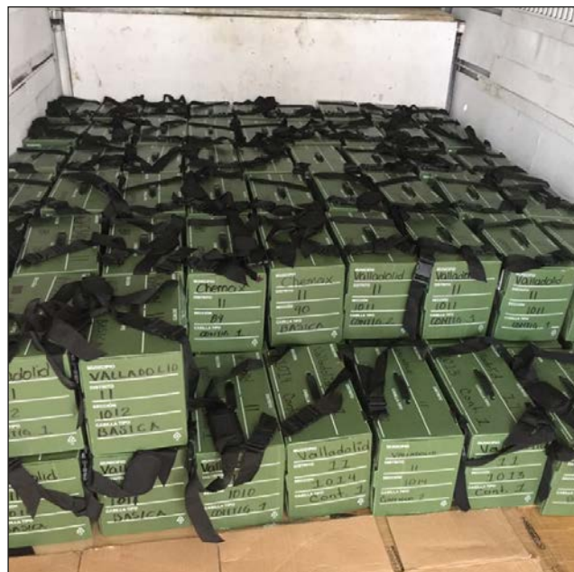
▲ Desde hoy, los paquetes electorales estarán en manos de los presidentes de casilla.

El silencio electoral incluye la actividad en redes sociales, por lo cual los partidos o candidatos deberán suspender cualquier tipo de acto proselitista que tuviera como fin promover su candidatura durante ese periodo previo a la jornada electoral.