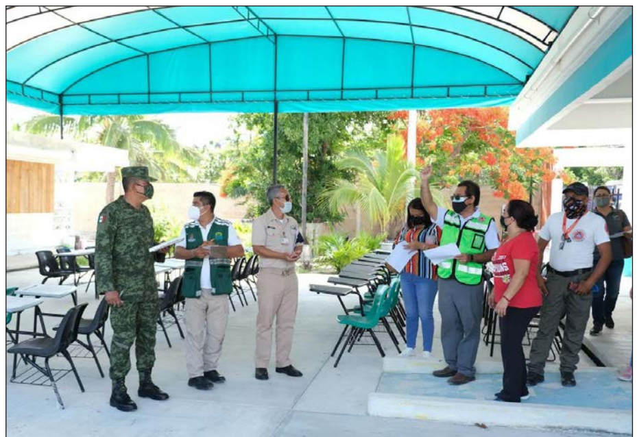
▲ Este año se designarán 24 refugios.

Asimismo, el plantel educativo cuenta con cuatro baños y se habilitaría una cocina y un espacio Covid-19.