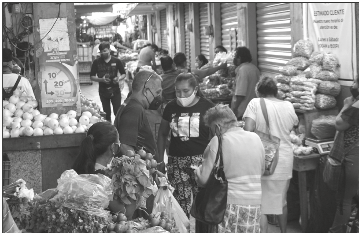
▲ El aumento en el precio de los alimentos que conforman la canasta básica pone en riesgo la seguridad alimentaria de los sectores más vulnerables en el país.

LA CRISIS ECONÓMICA , agudizada por la pandemia, en parte es explicada por el aumento de los costos de producción, transporte y comercialización de forma significativa impactando los ámbitos económicos y sociales. El CONEVAL reportó que en Yucatán el ingreso laboral real cayó 0.8 por ciento del primer trimestre de 2020 al primer trimestre de 2021.