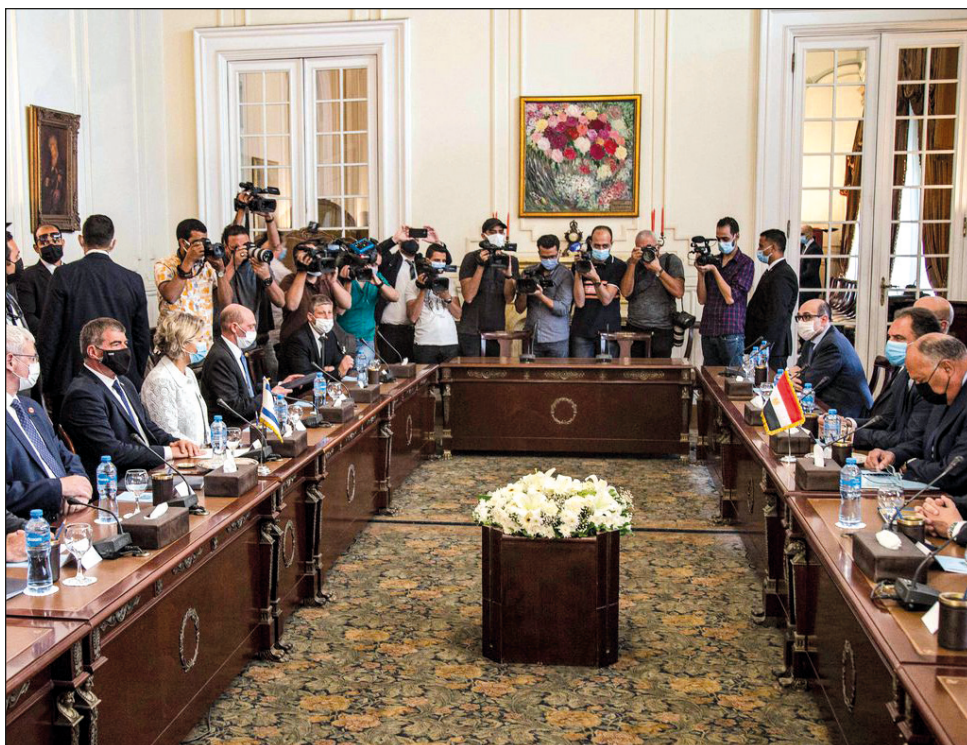
▲ Se trata de la primera visita de un canciller israelí a El Cairo desde 2008.

La CPI acusó a al-Bashir de crímenes de guerra y genocidio y la fiscalía sudanesa inició el año pasado su propio proceso relacionado con el conflicto en Darfur.