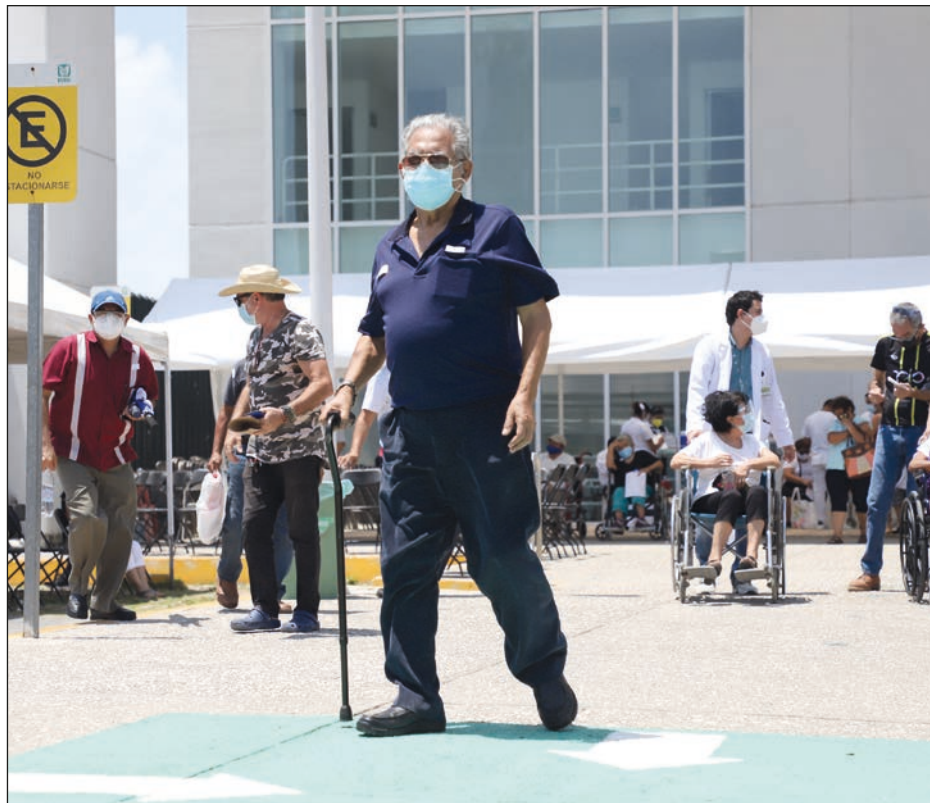
▲ Se prevé que más de 129 mil personas completen su esquema de vacunación.