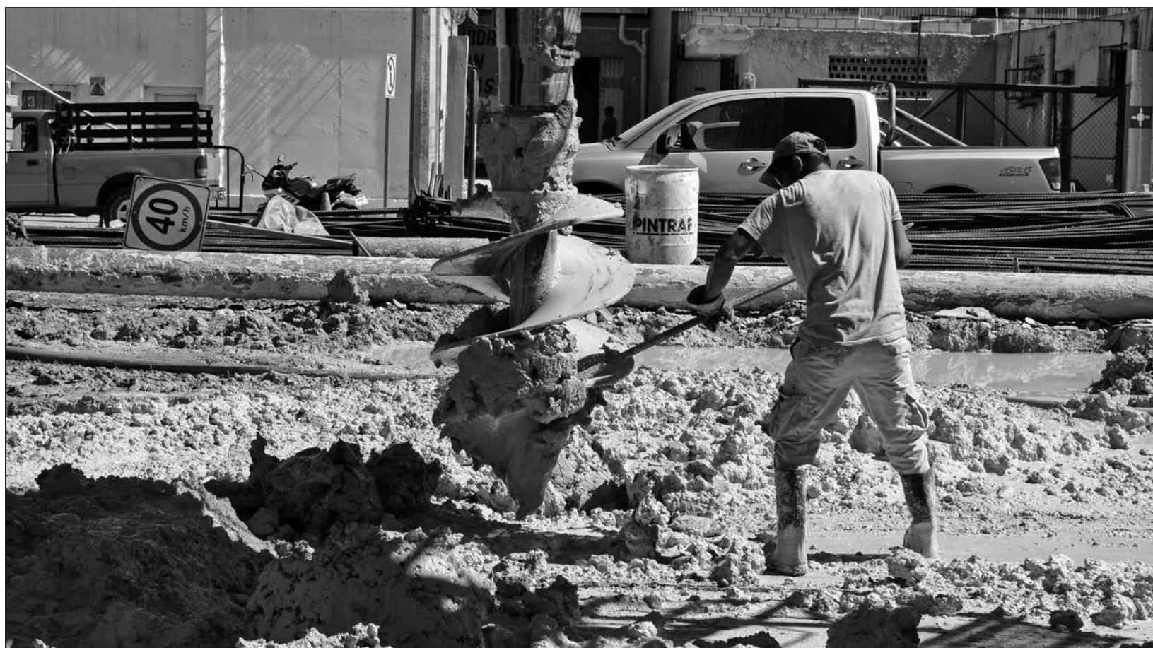
▲ La falta de capital foráneo en las entidades que componen el sur-sureste es una de las razones que explican el rezago económico que arrastra la región.