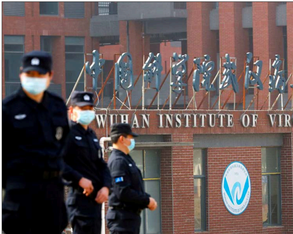
▲ El virus habría escapado accidentalmente del Instituto de Virología de Wuhan .

El equipo llegó el 14 de enero a la ciudad de Wuhan, considerada como la ciudad epicentro de la pandemia, y, tras dos semanas de cuarentena, visitó lugares como el mercado mayorista de mariscos de Huanan, donde se produjo el primer grupo de infecciones conocido, así como el Instituto de Virología de Wuhan.