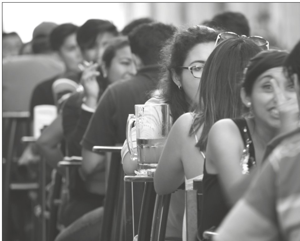
▲ Ya se realizaron 7 mil 160 inspecciones sanitarias en la entidad.

Hasta el momento han efectuado 214 operativos sanitarios en el municipio de Cam-