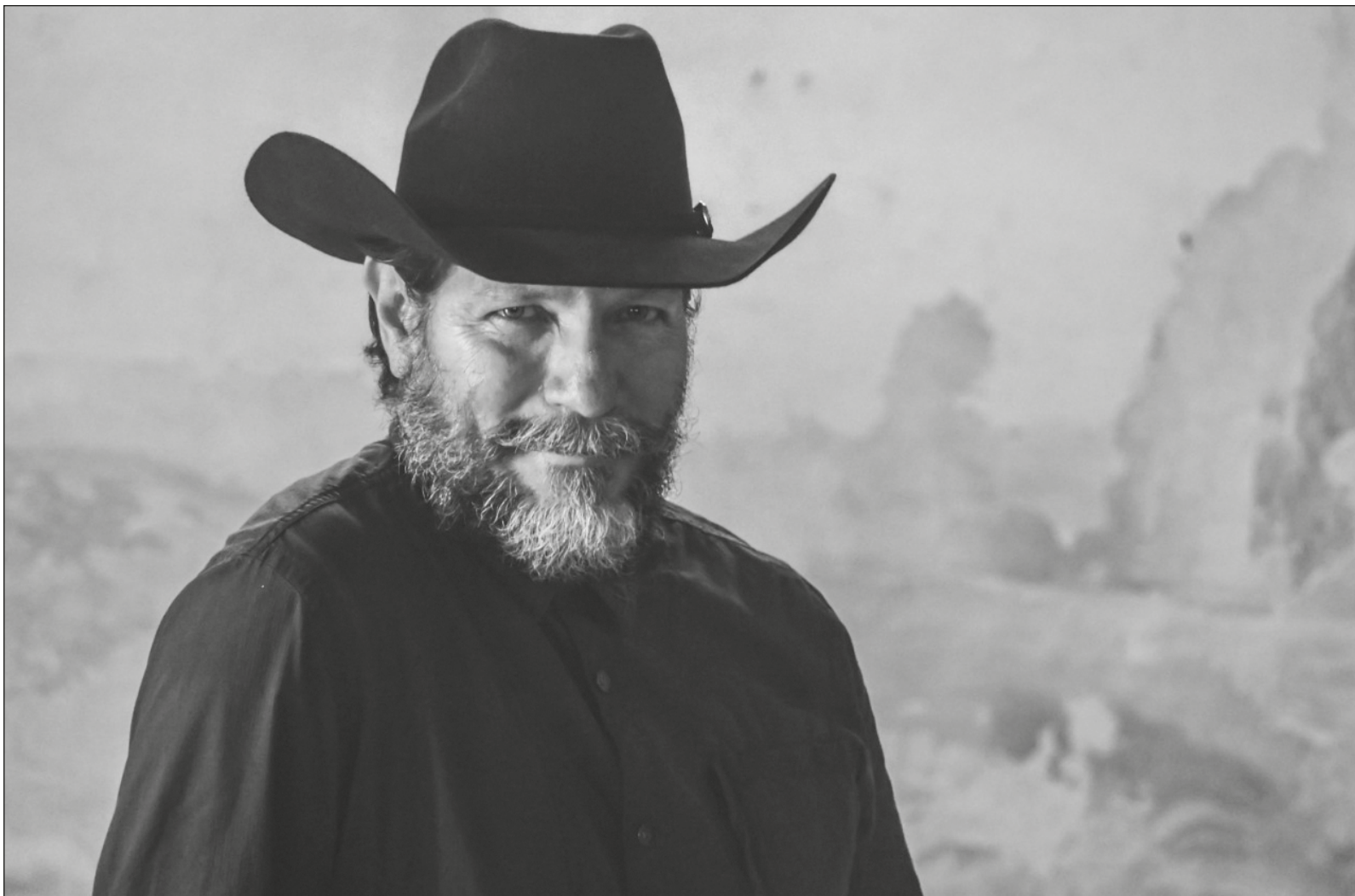
▲ Es alentador el estreno de la obra, el 22 de abril de este año, pues generó una atmósfera de esperanza.

* Escritor, crítico de arte, periodista y documentalista. En este año prepara con el compositor Julio García el estreno de Plegarias para días de estragos , cantata para dos solistas, coro y ensamble de alientos.