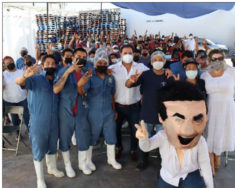
▲ A los trabajadores del mar se les ofreció un esquema de empleo temporal en época de veda.