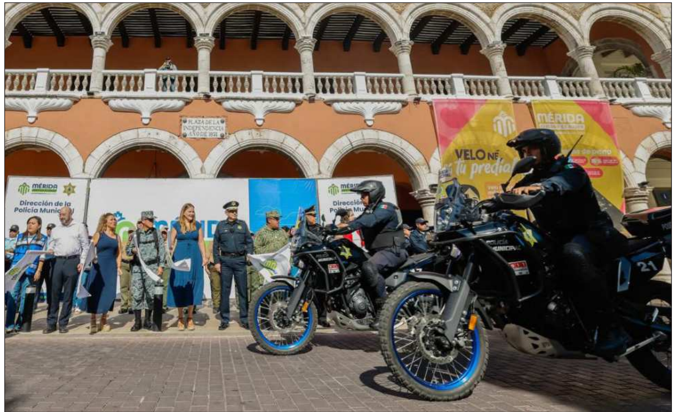
▲ El operativo reforzará la vigilancia en puntos estratégicos, principalmente en el Centro Histórico.

Durante la audiencia inicial, celebrada ante la juez de Control del Segundo Distrito con sede en Kanasín, la FGE imputó el delito y expuso los datos de prueba para solicitar la vinculación a proceso; sin embargo, el encausado solicitó que su situación se