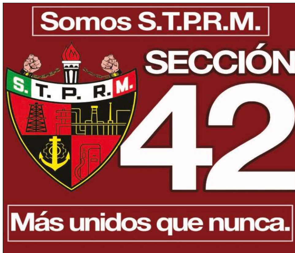
▲ Las votaciones iniciarán a las 5 horas y concluirán a las 18 de este 30 de noviembre, para lo cual deberán presentar identificación de los votantes.

Para la votación se instalarán seis casillas, de las cuales cuatro de ellas serán móviles. Estas se ubicarán en la Terminal Marítima de Pemex; en la Terminal Aérea de Pemex; en los Centros de Procesos, equipos de perforación y embarcaciones del activo Ku Maloob Zaap y Abkatun; y en los Centros de