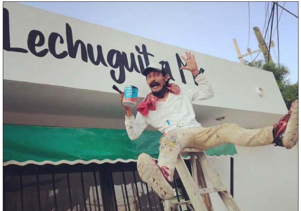
▲ El personaje de CareXulo es un señor adulto que critica las nuevas formas de los jóvenes, pero que intenta mimetizarse con todo lo nuevo.

CareXulo le ha permitido promocionar desde frituras, hasta comida de restaurantes, e incluso, recientemente fue contratado para promover a Campeche mediante una agencia de viajes en el