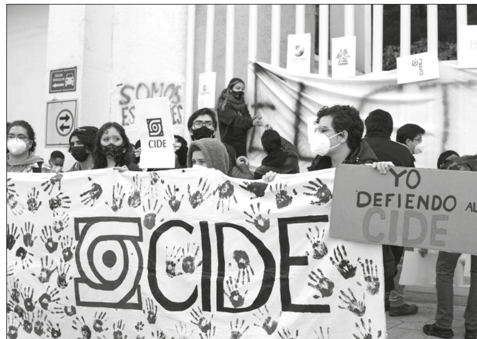
▲ La decisión se dio en medio de protestas de diversos sectores del Centro y otras instituciones académicas.

“Es miembro del Sistema Nacional de Investigadores (SNI) nivel III y goza de prestigio incuestionable nacional e internacional y una trayectoria intachable desde el punto de vista