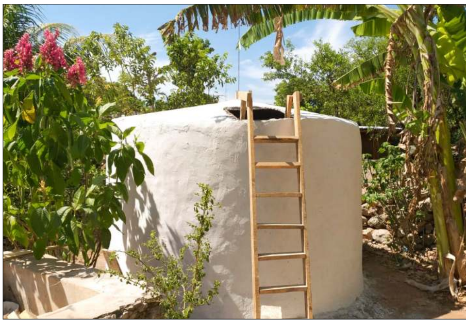
▲ A la población se le enseña el correcto manejo del agua y su almacenamiento, a fin de evitar la proliferación de enfermedades gastrointestinales y transmitidas por vectores.

“En cuanto agua suficiente la hay, pero agua limpia y en mejores condiciones, ese el problema”, indicó.