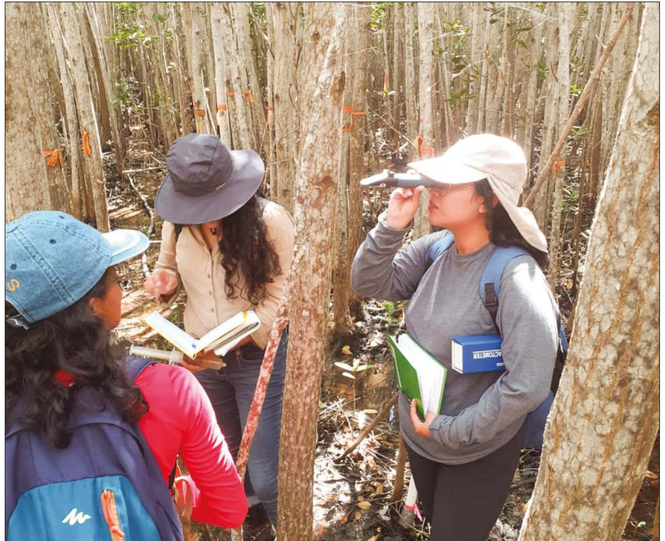
▲ El ser humano usa recursos naturales para mantener su estilo de vida, pero al mismo tiempo desgasta la calidad del medio ambiente.

La licenciatura en Ciencias Ambientales entrega