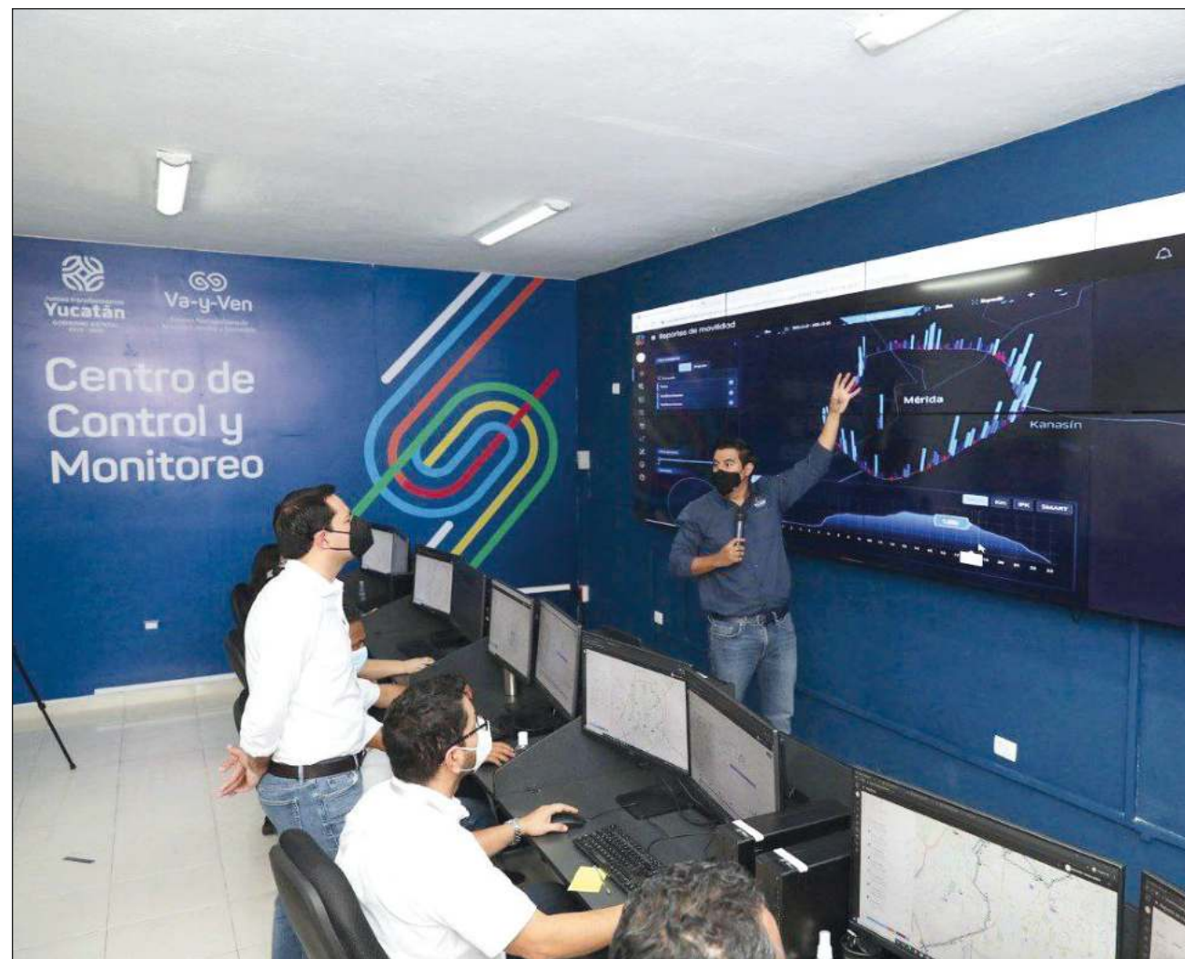
▲ Como resultado del área de monitoreo, han definido que por las mañanas haya 20 camiones en circulación, mientras que por la tarde solamente 14.

Por las mañanas hay 20 camiones en circulación, mientras que por la tarde solamente 14, pero este sábado al darse cuenta de que la afluencia de pasaje continuaba incluso en la tarde, decidieron regresar todas las unidades a las labores.