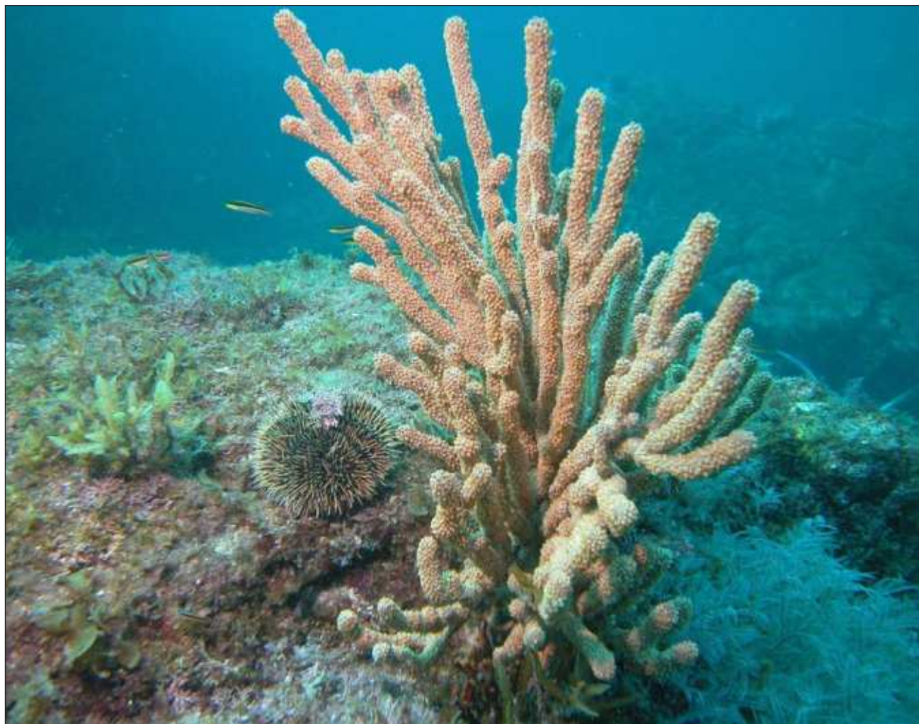
▲ Los brotes graves de enfermedades y blanqueamiento han provocado la reducción de la coberturas de corales de 19 a 17 por ciento, con una mortalidad continua, problemáticas generadas por la calidad del agua y el cambio climático.

La mayoría de los 286 sitios monitoreados están en condiciones malas o críticas