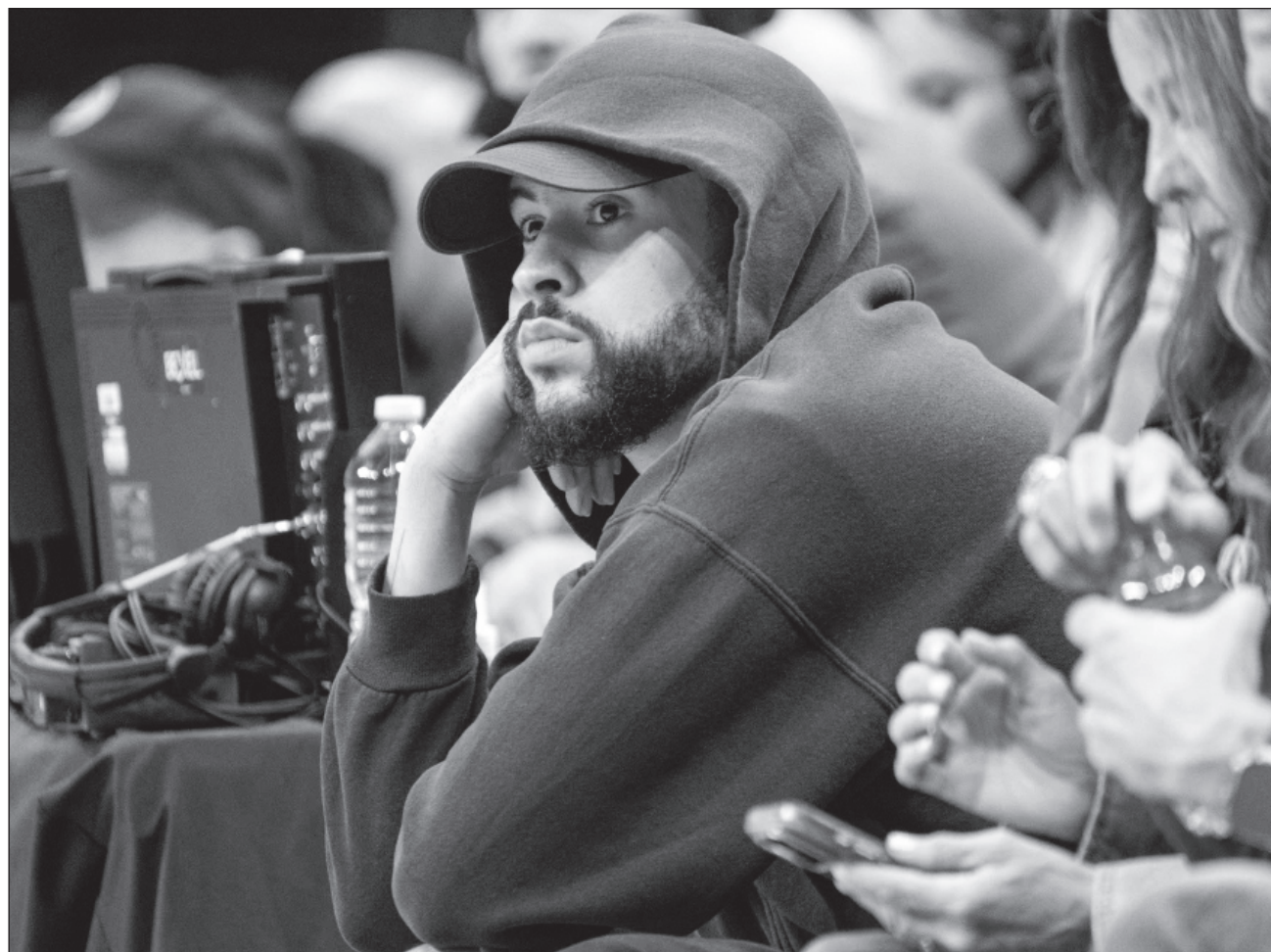
▲ Bad Bunny compartió varias veces otra parte del clip que Harris hizo sobre Puerto Rico, diciendo: “Nunca olvidaré lo que hizo Donald Trump y lo que no hizo cuando Puerto Rico necesitaba un líder cariñoso y competente”.

Bad Bunny mostró su simpatía política momentos después de que el comediante Tony Hinchcliffe hizo los comentarios sobre Puerto Rico. Más tarde, el sujeto dijo que “a estos latinos les encanta hacer bebés”