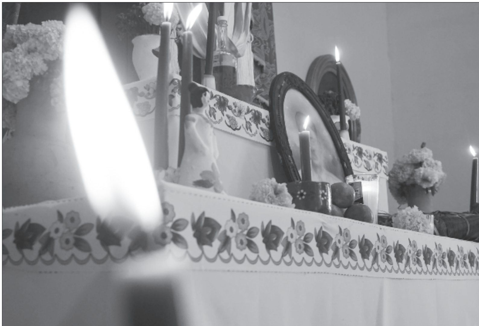
▲ "No llevará a su padre ni a bares ni a viajes, ya que preside su primer hanal pixán. Volverá —ella espera que lo haga— a sus sueños; la seguirá acompañando, e incluso el recuerdo tendrá de nuevo el peso de una mariposa y su voz rasgue el silencio que reina desde ese 2 de junio, que parece ya tan lejos, que se siente aún tan cerca".