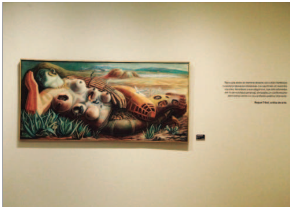
▲ El programa de exposiciones temporales del Festival Internacional Cervantino siempre ha tenido las actividades escénicas de música, teatro y danza.

Oaxaca, invitado de honor, exhibe la obra de Francisco Toledo en galerías de la Universidad de Guanajuato. Asimismo, del estado invitado se expone en el Museo Casa Diego Rivera Con los pies en la tierra y la cabeza en el cielo: Escudri-