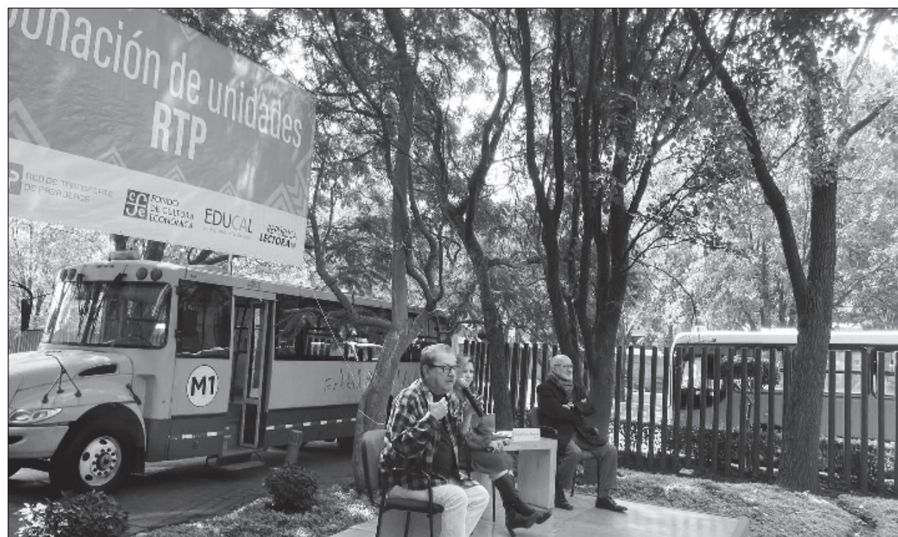
▲ A lo largo de los años, el FCE había “vitalizado la relación con las comunidades y pueblos, y se empezaron a hacer giras por el país”, pero en cierto momento, “no pudimos responder a la demanda social que habíamos creado por medio de las campañas lanzadas en los estados”.

En vista de que un librobús es una librería móvil, el siguiente paso consiste en adecuar las unidades; es decir, diseñar el mobiliario, ver dónde será la entrada, decidir a qué nivel se colocarán los libros para niños y también la decoración. “Un librobús tiene que ser muy festivo; entonces, vamos a incorporar a los grafistas que hacen Vientos de Pueblo para que se animen a hacerlo. También tenemos que crear un nuevo