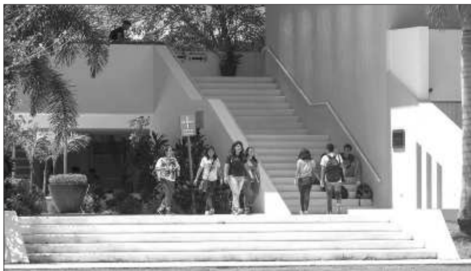
▲ "Existen brechas significativas en la asistencia entre la población por encima y por debajo de la LPEI, y estas tienden a ampliarse al avanzar las trayectorias educativas", mencionó el Coneval.

Asimismo, plantea, que esa estrategia busque fortalecer los diferentes factores asociados al aprendizaje y brinde prioridad a los centros escolares cuyo rendimiento es menor.