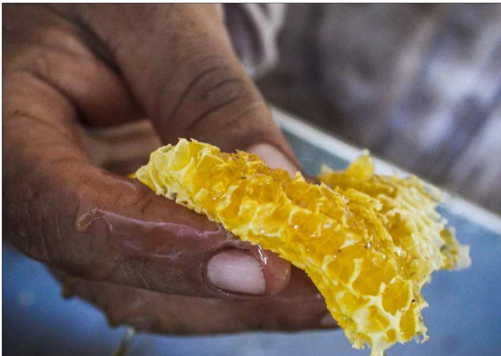
▲ Puntualizó que la recuperación de los manglares es un tema a nivel internacional, ya que interviene la Organización de las Naciones Unidas (ONU) y el gobierno federal de México, a través de la Semarnat, Conafor y Conanp, quienes apoyan para el proyecto de Sabancuy.

Puntualizó que la recuperación de los manglares es un tema a nivel internacional, ya que interviene la Organización de las Naciones Unidas (ONU), el gobierno federal de México, a través de la Semarnat, Conafor y Conanp, quienes apoyan para el proyecto de Sabancuy.