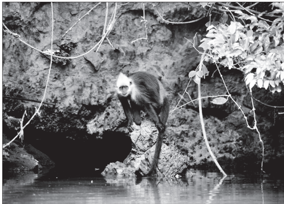
▲ Esta característica extraordinaria es consecuencia directa de su aislamiento en la isla donde viven, en la que hay fuentes limitadas de agua dulce.

Debido a la drástica disminución de su población, la especie sufre empobrecimiento genético, alta endogamia y posible mayor susceptibilidad a las enfermedades. Sin embargo, el análisis de su información muestra que la diversidad genética se ha mantenido en áreas funcionalmente importantes. Esto permite a los langures de Cat Ba ( Trachypithecus poliocephalus ) seguir haciendo frente de forma adecuada a las con-