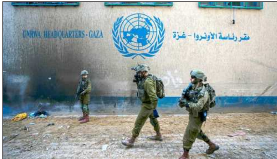
▲ Los planes de Israel de prohibir las actividades de la UNRWA “serían una nueva forma de asesinar niños en Gaza”, acusó la Unicef, mientras que México reiteró su respaldo a la agencia.

Fowler emplea, como llevan haciendo tantos otros desde la guerra árabe-israelí de 1948 que dio lugar a la creación de Israel, el término