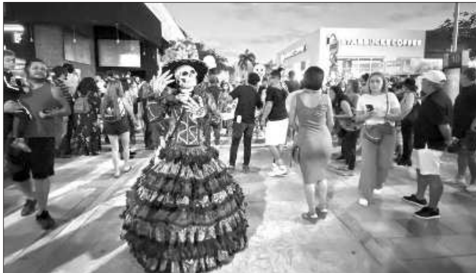
▲ Concursos de disfraces con la temática alebrijes y de catrinas, así como la presentación de artistas como Eugenia León, conforman la cartelera.

El evento se llevará a cabo del 31 de octubre al 3 de noviembre en diversos foros de Playa del Carmen y Puerto Aventuras, con la participación de más de 350 artistas de diferentes géneros, señaló el