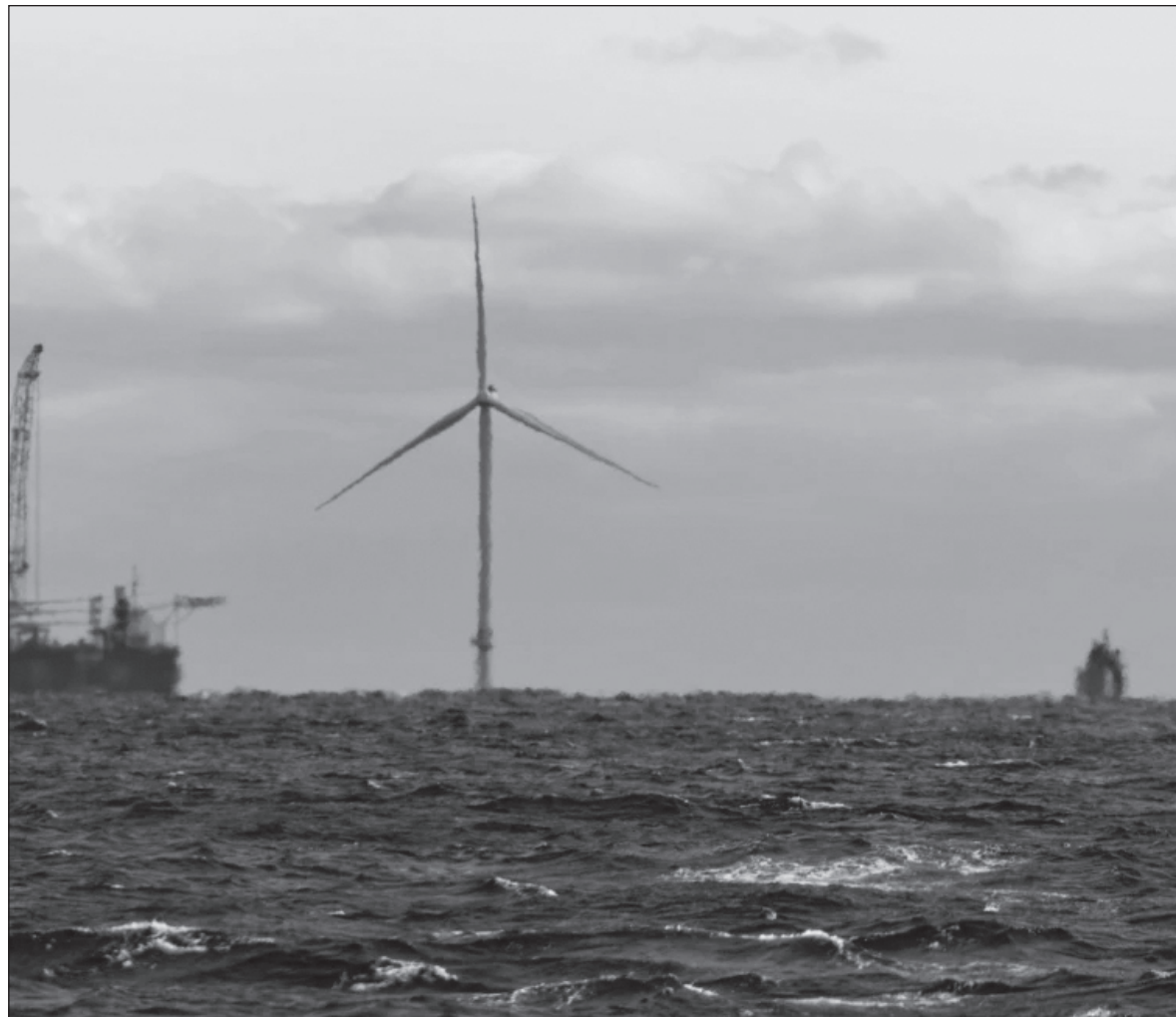
▲ "Si consideramos históricamente quién ha contaminado más, surge otra narrativa, con EU contribuyendo con 25 por ciento de las emisiones del mundo, Europa con 33 por ciento y China con 12.7 por ciento".

Considerando el tamaño poblacional actual, la contaminación per cápita de China es 61 por ciento menor que la de Estados Unidos (EU). Esto es sencillo de comprender si pensamos que en China viven 1.4 mil millones de personas, y en EU sólo 333 millones. Por ta-