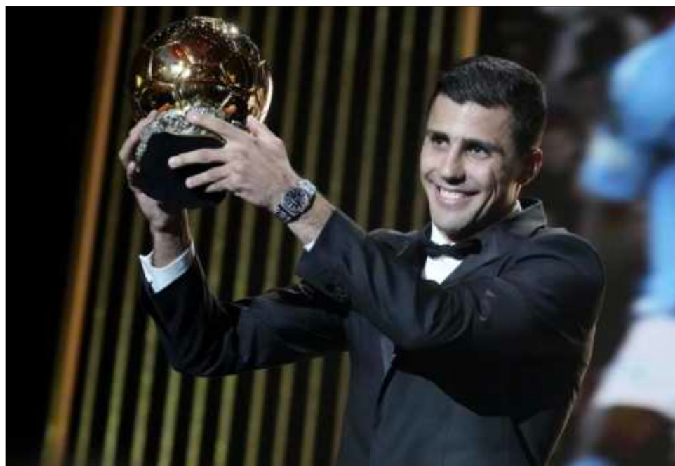
▲ Rodri, estrella del Manchester City y de la selección española, con el Balón de Oro.

"Creo que el futbol español, en la última década, hizo algo increíble con varios seleccionadores, jugadores increíbles en el pasado. Se ganó un Mundial, Eurocopas y nunca un jugador español fue capaz de ganar este premio", opinó el ex entrenador del Barcelona. "La influencia del futbol español en los últimos diez o quince años ha sido muy importante, no sólo ganar títulos, sino la manera en que se juega", continuó durante una rueda de prensa previa a un duelo en la Copa de la Liga contra el Tottenham del miércoles.