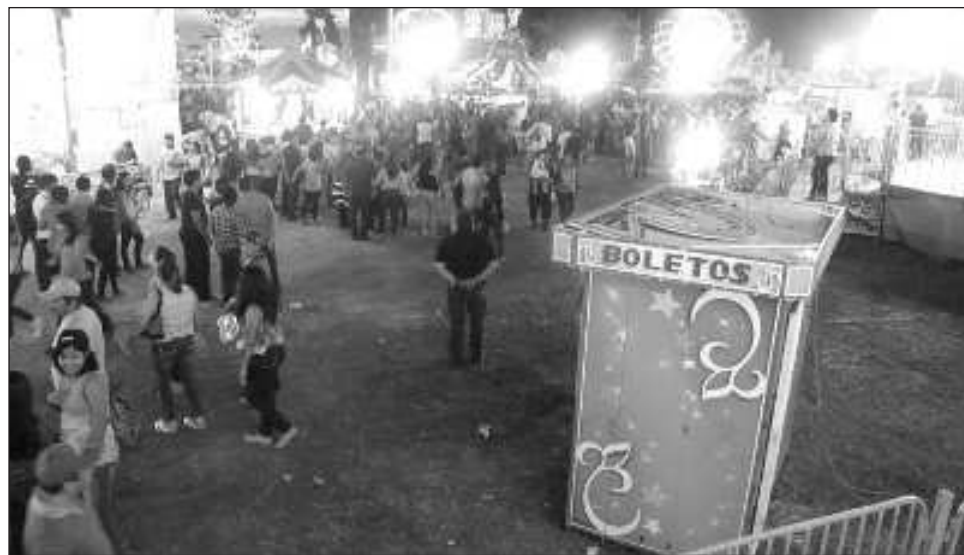
▲ Ofrecerán una amplia oferta ganadera, artesanal, gastronómica y cultural, con más de mil expositores, donde el invitado de honor de esta edición será el estado de Chiapas.

“Esta feria es símbolo de nuestra cultura, diversidad y calidez, que define a nuestro querido estado de Yucatán. Este año, la feria regresa más grande y mejor que nunca, con una expectativa de recibir a casi 3 millones de visitantes que vendrán a disfrutar de todo lo que nuestra tierra tiene para ofrecer: campeonatos ganaderos, producción agrícola