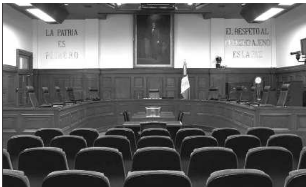
▲ Por ahora, ocho ministros han anunciado que renunciarán y esto les asegurará gozar de su haber de retiro; una suma de pesos nada despreciable para cada uno.

Y por ahora, ocho ministros han anunciado que renunciarán y esto les asegurará gozar de su haber de retiro; una suma de pesos nada despreciable para cada uno, pero independientemente de cuánto se llevarán, este puede ser el único costo de una nueva república, lo que resultaría sumamente barato si se compara con las transformaciones previas, que costaron millones de vidas humanas.