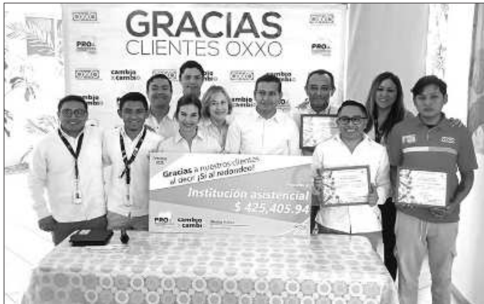
▲ Los 425 mil 405 pesos recaudados durante julio-septiembre serán utilizados para el mantenimiento de las áreas como los techos y para su funcionalidad general.

En este redondeo participaron aproximadamente 250 tiendas Oxxo en todo el estado de Yucatán. El cheque del monto fue en-