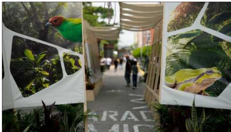
▲ Los debates siguen estancados en torno a la adopción de un mecanismo para compartir las ganancias de la información genética extraída de plantas y animales con las comunidades de las que proceden.

Bajo el lema “Paz con la Naturaleza”, los 196 países del Convenio sobre Diver-