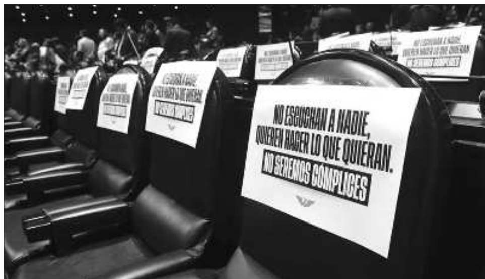
▲ Este lunes Ricardo Monreal Ávila informó que para la construcción de la lista se pondría de acuerdo con Adán Augusto López Hernández.