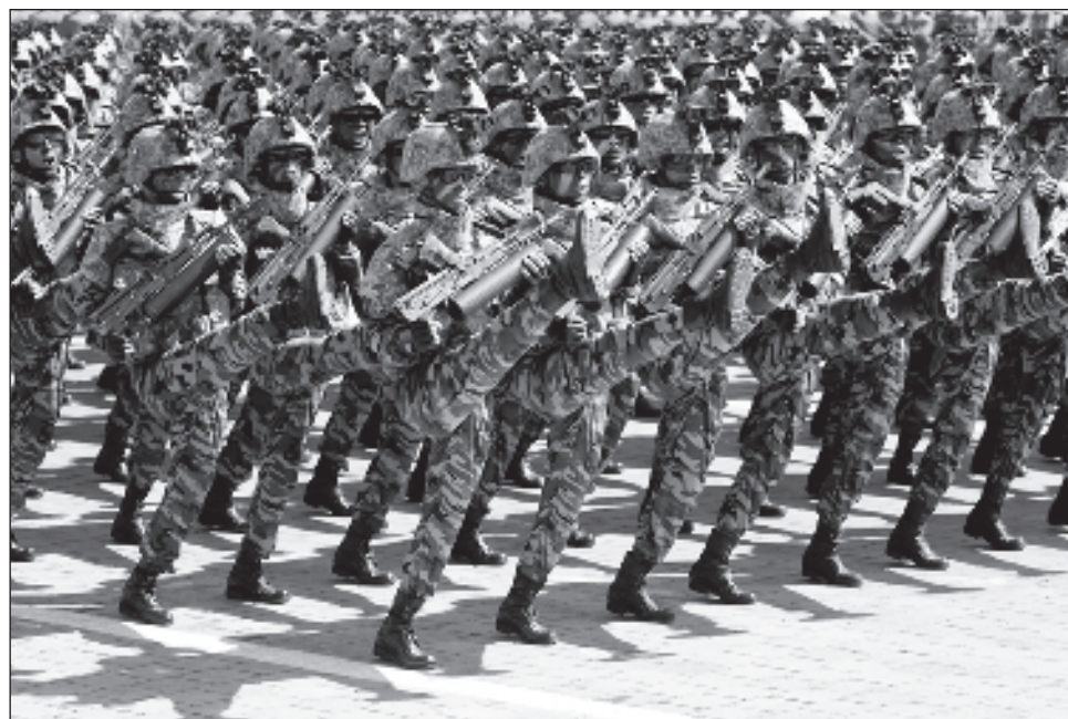
▲ Yoon Suk-yeol expresó su preocupación por la posibilidad de que Moscú transfiera tecnología militar sensible a Pionyang a cambio del envío de tropas, así como que las fuerzas norcoreanas adquieran experiencia de combate en el conflicto de Ucrania.

El NIS obtuvo información sobre el movimiento de tropas e indicó que entre los soldados que estarían desplazándose al frente figura un general de alto rango del Ejército norcoreano, aunque «sigue verificando los deta-