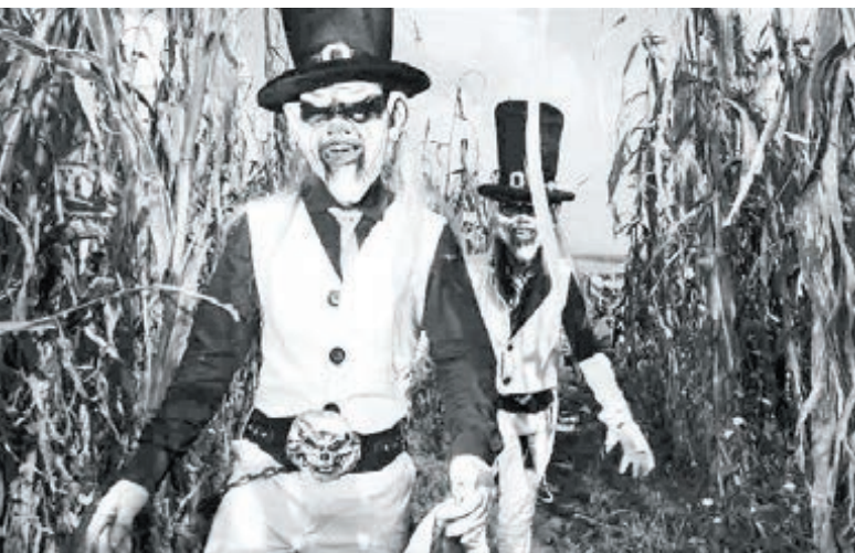
Fotograma de Barroco , 1989.

Paul Leduc Rosenzweig (1942-2020) vivió y murió sabiendo que la lucha era una de las Bellas Artes. Como cineasta encarnó paradojas imposibles: un formalista que no renunciaba al compromiso; poeta que no se apartó de la teoría; muralista social cuyo centro estaba en la vida íntima de personajes extraordinarios. A veces, éstos eran tan conocidos como Frida Kahlo o John Reed; otras, héroes diminutos y anónimos, como una bailarina en Panamá, una fotógrafa argentina, una viuda salvadoreña. Su compromiso doble con lo real y lo imaginario podrían resumirse en una terca lealtad a la vida, hasta el último instante.