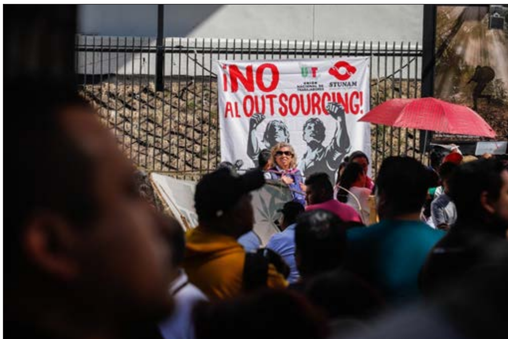
▲ El 96 por ciento de las empresas dedicadas al manejo de recursos humanos no pagaba impuestos en 2018, según ManPowerGroup.

El presidente Andrés Manuel López Obrador anunció que su gobierno presentará una iniciativa para acabar con los abusos laborales y fiscales cometidos a través de la figura del outsourcing , ya sea mediante su regulación o desapareciéndola. Para ejemplificar la conducta de las empresas dedicadas a manejar las nóminas de terceros, el mandatario señaló que a finales de año cientos de miles de trabajadores son dados de baja del Instituto Mexicano del Seguro Social (IMSS) y que estos puestos laborales se recuperan en enero o febrero, maniobra mediante la cual sus empleadores les niegan el pago del aguinaldo y les impiden acumular antigüedad. De acuerdo con López Obrador, la situación actual es producto de la reforma laboral aprobada en las postrimerías del sexenio de Felipe Calderón, cuyo sentido fue dar facilidades para violar los derechos de los trabajadores.