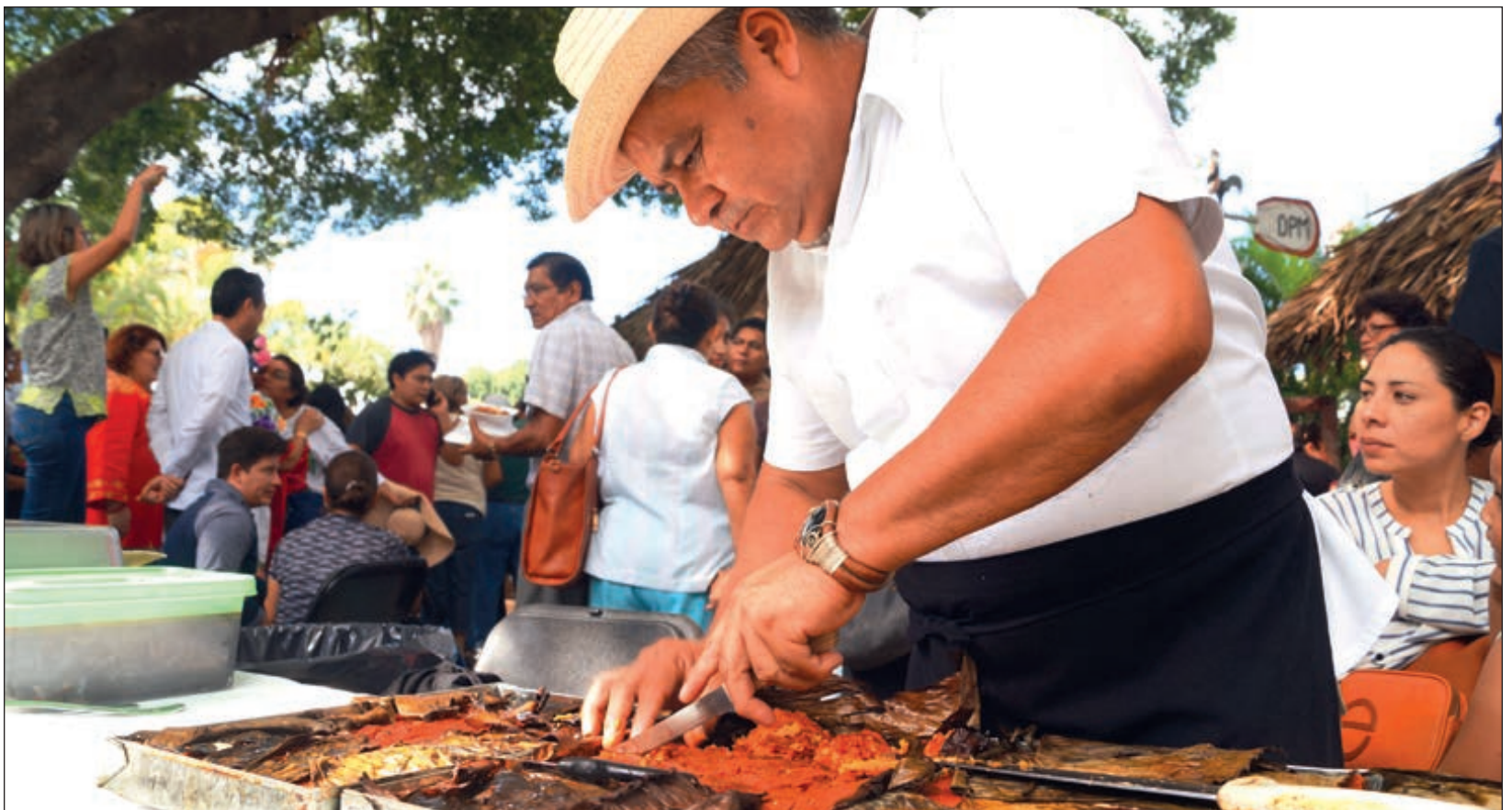
Haber institucionalizado el 2 de noviembre para comer el pib es “un error tremendo”, ya que es un guiso que suele prepararse en cualquier ocasión.

Para estos intelectuales mayas, el Janal Pixán se está debilitando a gran velocidad ante la llegada de brujas y fantasmas, que lamentablemente ya son una realidad en las comunidades yucatecas. De ahí la importancia de representar una práctica lejana a concursos y espectáculos y colocar de nueva cuenta las velas que alumbran los senderos, para que estos vuelvan a ser vistos como los caminos que dan la bienvenida a los pixanes.