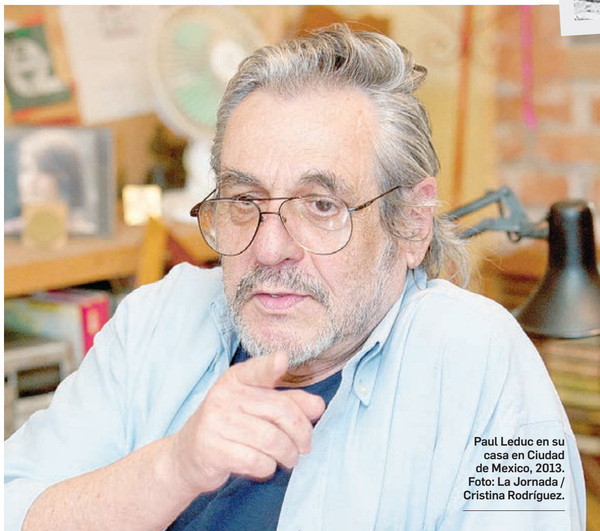
Paul Leduc en su casa en Ciudad de México, 2013.

El asombro fue mayúsculo y Cobrador rebasó todas las expectativas posibles. Sin duda era un filme polémico, dispuesto a sacudir al espectador, realizado con una maestría y una solvencia técnica deslumbrante. Lo más sorprendente es que se trataba del regreso de un cineasta, inactivo