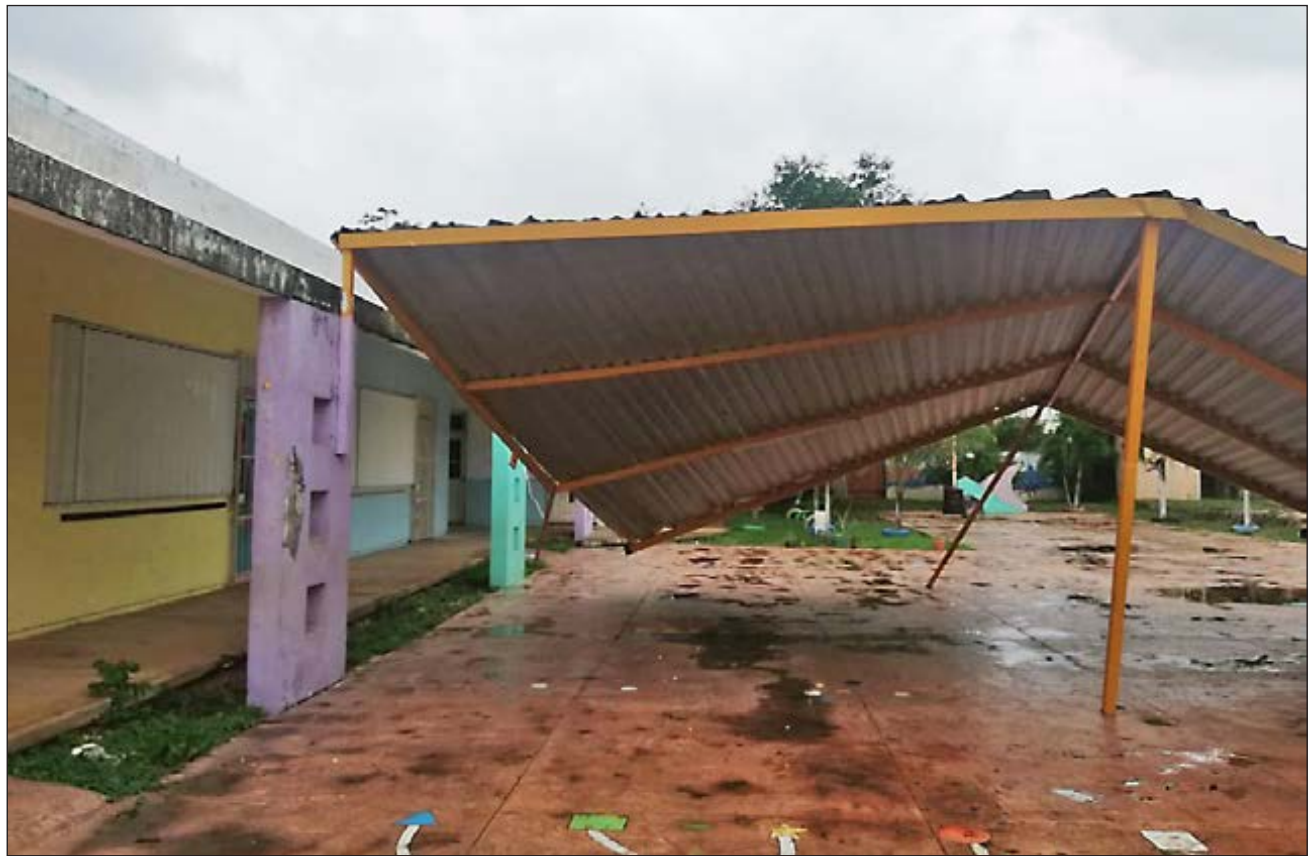
▲ El Instituto de Infraestructura Física Educativa de Quintana Roo realizó la inspección y evaluación de daños, que para presentar los expedientes al gobierno federal.

El gobernador Carlos Joaquín realizó recorridos de supervisión en los que observó muchas escuelas con bardas caídas, árboles sobre aulas y otros daños en infraestructura, por lo que pidió al Instituto de Infraestructura Física Educativa de Quintana Roo (Ifeqroo) la inspección y la evaluación de daños para presentarlos ante la federación a fin de poder acceder a los apoyos del Fondo de Desastres Naturales (Fonden).