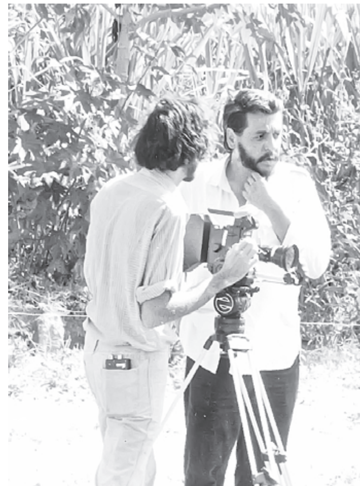
Paul Leduc (1942-2020) durante el rodaje de Historias prohibidas de pulgarcito .

AQUEL PUDO SER un camino alternativo para la vida creativa de Paul Leduc: el periodismo militante, una vocación que retomaría en sus últimos años. Esa parte de su obra, dedicada a capturar retazos de realidad, tiene su cima en Etnocidio: notas sobre el mezquital (1977) una ambiciosa coproducción canadiense que traza un retrato vibrante y sangrante de una comunidad otomí en Hidalgo. Filmada ya a la sombra de López Portillo, Etnocidio alcanza y, a ratos, rebasa a ficciones que le fueron contemporáneas y que quebraron la frontera entre relato y testimonio, como Canoa (1976) o Cascabel (1977). Con ella, Leduc elevó el documental por encargo a las alturas de Jean Rouch.