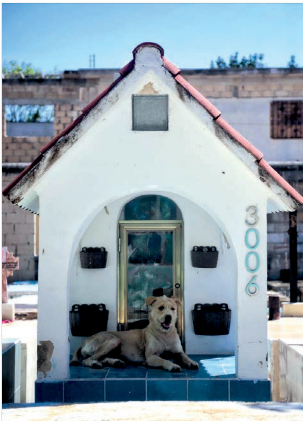
El porcentaje de crecimiento en la mortandad no lo atribuyen solamente a la pandemia, sino también a males vinculados a enfermedades crónico degenerativas.

Recalaron que el Registro Civil solo está a cargo de contabilizar los números para llevar las estadísticas en el crecimiento o baja de la tasa de mortandad así como de los nacimientos.