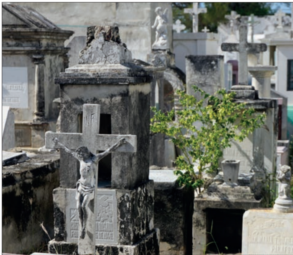
Los marineros fueron sepultados cristianamente en el Panteón General del Carmen, donde el capitán mandó erigir un obelisco en el que se encuentran sus nombres.

En honor de los marinos, el capitán mandó construir un obelisco en el sitio donde sepultaron a sus subordinados y colocaron dos lápidas en las que se incluyen sus nombres: Auffret, Sénes, Kerminguy, Bervas, Céva, Madec, Marec, Gardanne, Cauvin, Tore, Tomasini, Drapeau, Morel, Hallegouet, Couillon, Chevalier, Jeanjean, Coudeno, Catto, Drégeon, Mariani,