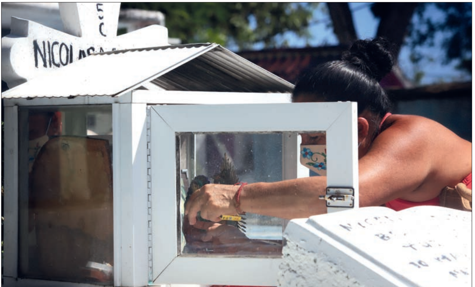
Al no poder realizar un funeral tradicional, las familias no pueden despedirse de su ser querido "como debería ser".

También sugirió expresar las emociones del duelo sin recelo, llorar, gritar, abrazar, y si es necesario buscar apoyo profesional y psicológico emocional para que no haya mayores complicaciones mentales.