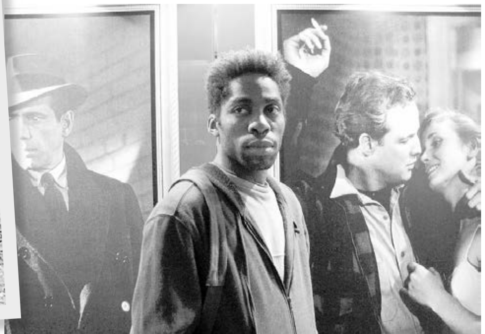
Derecha: Fotograma de Reed. México insurgente , 1970-1971. Izquierda: Fotograma de Cobrador , 2006.