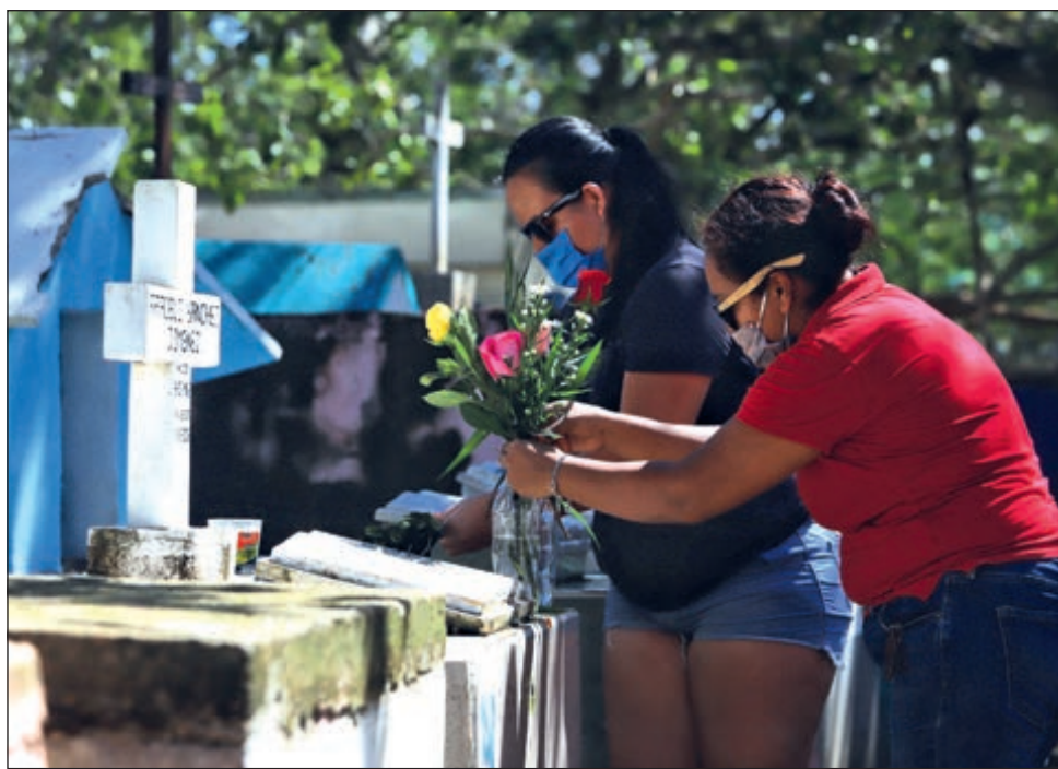
Durante el 2019 las enfermedades del corazón, diabetes y tumores malignos fueron las tres principales causas de muerte en la entidad.

Las tres principales causas de muerte en 2019, tanto para hombres como para mujeres, fueron las enfermedades del corazón, diabetes y los tumores malignos. Los homicidios representaron la cuarta causa de muerte en hombres.