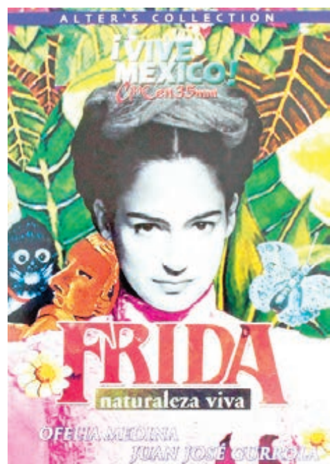
Cartel de Reed. México insurgente , 1970-1971 y Frida: naturaleza viva , 1984.

personalidad y psicología de sus protagonistas. En ellas no existe el arco tradicional de una biografía, sino cuadros breves que avanzan a través de los sentidos y rara vez llegan al puerto esperado: ni en Reed vemos batallas ni en Frida a una pintora frente al lienzo; conocemos en cambio a dos seres retirados en la intimidad, cuyo destino se decide en esos tiempos muertos en los que no hay descargas de balas ni de pinceles.