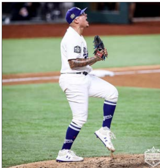
▲ Julio Urías fue un cerrador intratable al asegurar los cetros de la Liga Nacional y Serie Mundial para Los Ángeles.

Seager se convirtió en el torpedero con más cua-