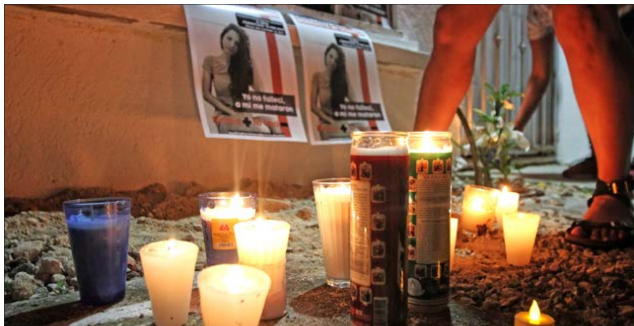
De enero a septiembre de este año, se han registrado nueve feminicidios y 123 víctimas de homicidio doloso en Quintana Roo.

Datos del Secretariado Ejecutivo del Sistema Nacional de Seguridad Pública señalan que, de enero a septiembre, se han acumulado nueve feminicidios en Quintana Roo (seis de ellos en Benito Juárez); el estado ocupa el lugar 24 en todo el país, pero también hay 123 presuntas víctimas de homicidio doloso.