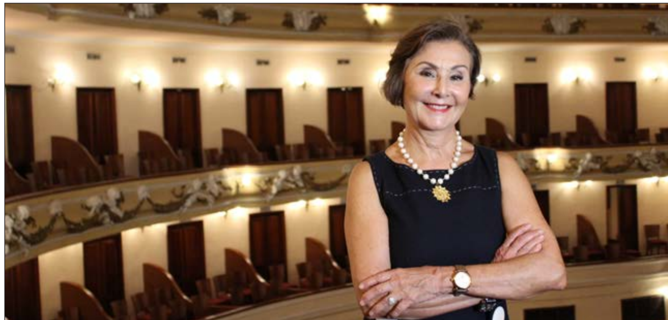
▲ Entre los músicos de la Sinfónica de Yucatán hay varios egresados de la Escuela Superior de Artes (ESAY); hay una generación que no sólo va a crecer con la orquesta, también será parte de ella.

“Existe la creencia que es un grupo de élite; no es cierto, cualquiera puede tener ac-