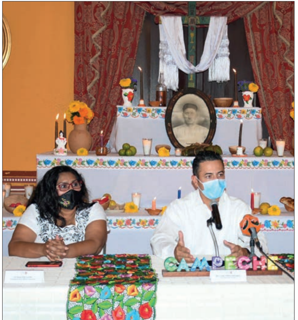
La nueva versión de la exposición traerá menos derrama económica, pero evitará contagios, afirmó Jorge Manos, titular de Turismo en Campeche.

En Tenabo, las autoridades del Ayuntamiento invitaron a sus habitantes a que les manden un video de no más de 10 minutos explicando su altar y el ganador recibirá un premio que no han definido aún, pero al parecer será económico.