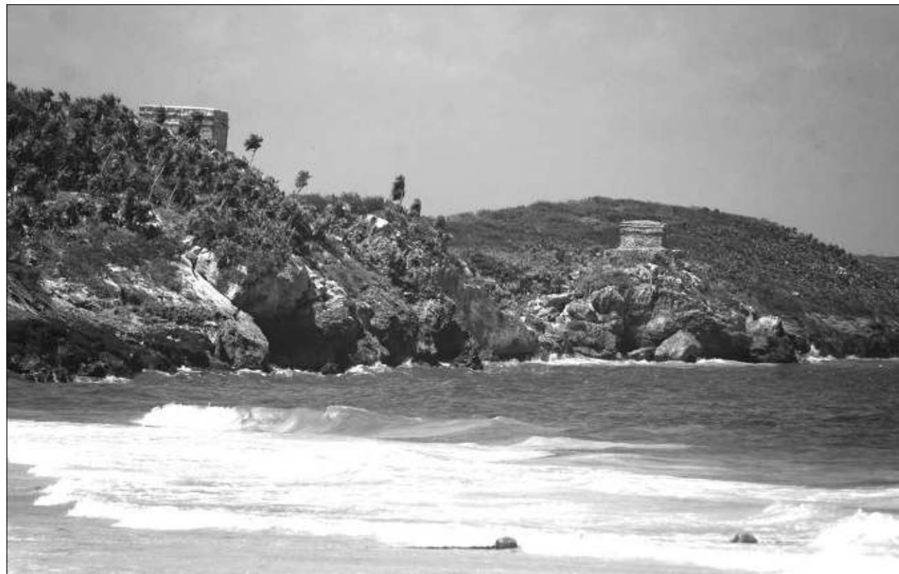
▲ La contratación de servicios para conocer la historia de los monumentos mayas no supera ni 30%.

“Bastante baja la afluencia por ratos, muy desolada la plaza, sí esperábamos que baje la afluencia, pero ha sido más