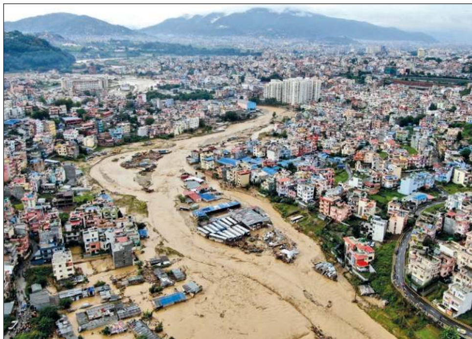
▲ De acuerdo con las autoridades, en las labores de búsqueda y rescate participan más de 3 mil personas, con ayuda de helicópteros y embarcaciones.

“Volvimos esta mañana (domingo) y todo había cambiado. No podíamos ni abrir las puertas de casa, estaban bloqueadas por el barro”, contó a Afp Kumar Tamang, un hombre de 40 años que vive en una villa miseria y tuvo que huir con su familia la madrugada del sábado, cuando el agua se metió en su cabaña.