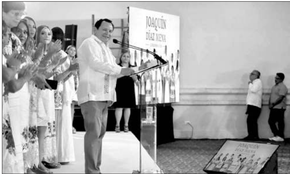
▲ El gobernador electo dio a conocer que, tras la ceremonia de investidura, viajará a la Ciudad de México para participar en la toma de protesta de la presidenta Claudia Sheinbaum.

a todos los yucatecos para que lo acompañen a la Plaza Grande, a celebrar el inicio de la transformación de Yucatán, “que traerá consigo mayor bienestar y desarrollo a nuestro estado, y para