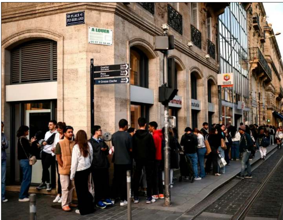
▲ Cada semana, cientos de estudiantes hacen fila para recoger sus paquetes de alimentos, distribuidos por la asociación Linkee; su filial en Burdeos hace dos repartos semanales.