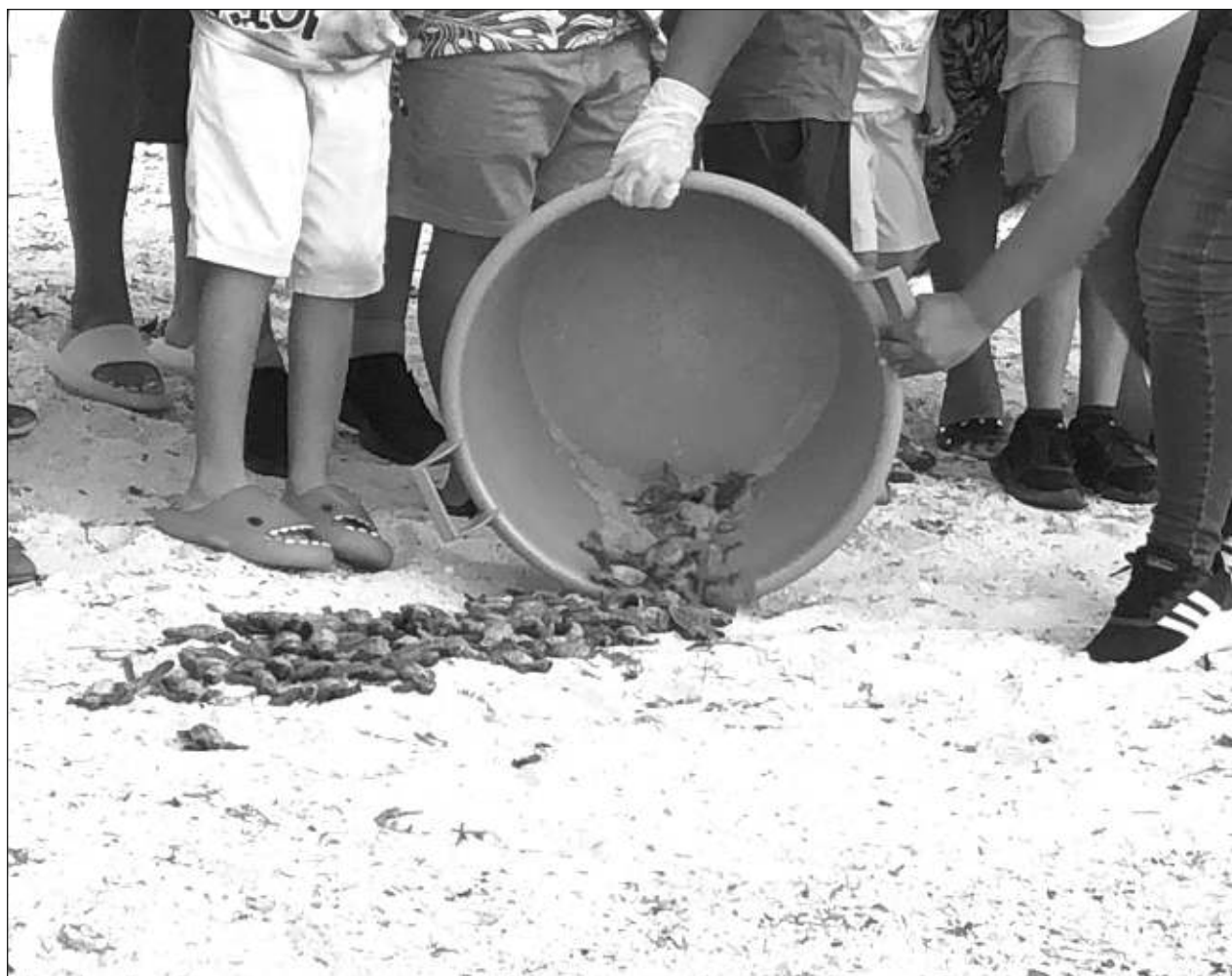
▲ Los procesos naturales por los que pasan las nidadas de tortuga hay que aceptarlos, y solo se debe priorizar salvar los de especies que requieren mayor cuidado, sostuvo el Comité Estatal de Protección, Conservación y Manejo de la especie.

En ese sentido, hicieron un llamado a las autoridades para que tomen en cuenta la denuncia de los vecinos para que se exija a esta instancia cumplir con sus obligaciones.