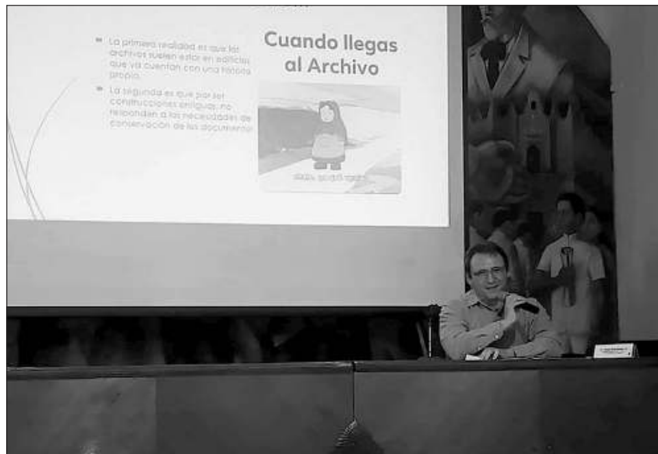
▲ Durante su charla, el historiador señaló que como casa de los famosos , los archivos albergan correspondencia entre personajes históricos y depende del tipo de lugar donde ubiquemos un archivo, será el tipo de documento que podremos encontrar.

Como casa de los famosos , los archivos albergan correspondencia entre personajes históricos y