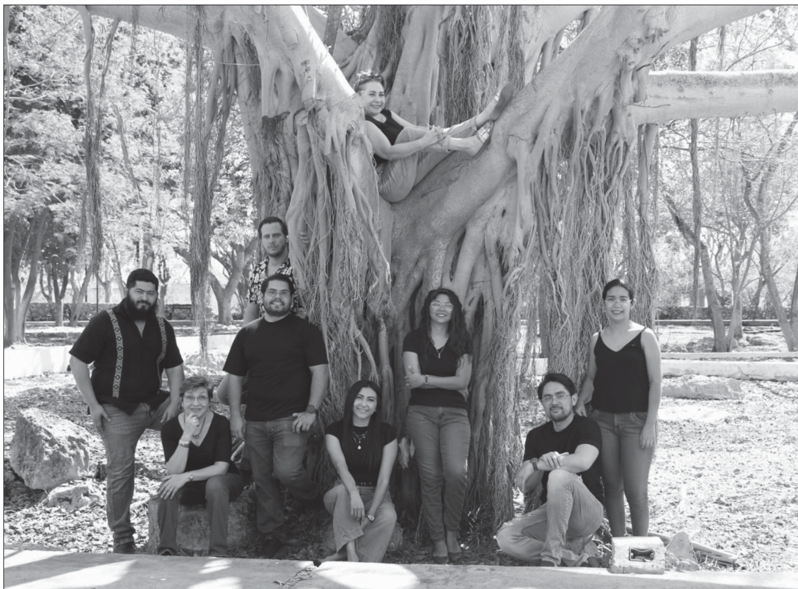
▲ "Más allá de un grupo, somos una comunidad abierta de la que formas parte importante, fue diseñado para ti, a la que te invitamos no solo a leernos en este espacio sino a seguirnos en nuestras redes sociales si se te apetece".