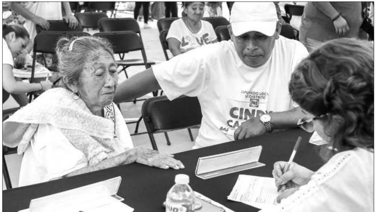
▲ La recolección de residuos sólidos operará de manera habitual en colonias y fraccionamientos; las empresas Sana, Pamplona y Corbase realizarán sus rutas en el horario acostumbrado, pero Servilimpia reanudará sus servicios hasta el día 2.

Estarán disponibles las cajas recaudadoras ubicadas en la Policía Municipal que laborará de 8 a 20 horas y en el Cementerio Xoclán de 8 a 17 horas