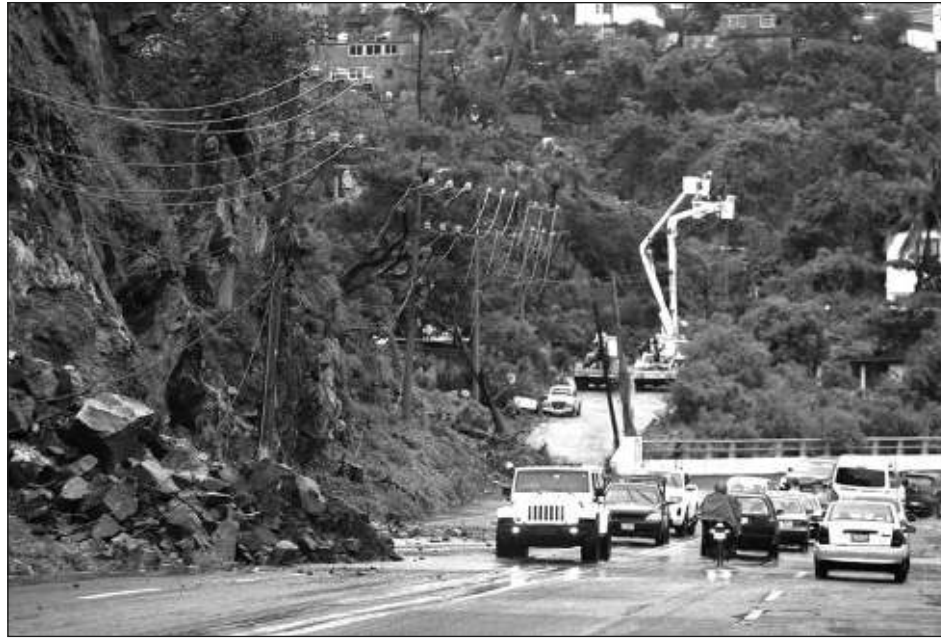
▲ El presidente Andrés Manuel López Obrador informó que el huracán John ocasionó la muerte de 15 personas; al concluir las evacuaciones, hay mil personas en los refugios instalados.

“Les comparto el último informe de Protección Civil sobre la inundación en Acapulco: Está bajando el agua, aunque hay mucho lodo en las calles que ya empezaron a limpiarse. Se restableció el servicio eléctrico y concluyeron las evacuaciones. Hay mil personas en refugios, se garantizan tres comidas calientes diarias, servicios de salud y se entregan despen-