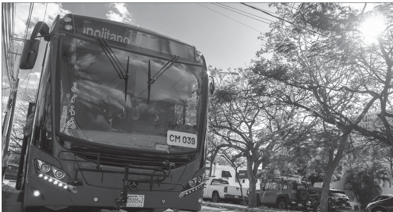
▲ "Las rutas hasta aquí exploradas coinciden en servir a un público cautivo que requiere del servicio: la población en edad escolar".

Síganos en: http://orga.enesmerida.unam.mx/ Facebook @ORGACovid19 Instagram @orgacovid19 X @ORGA_COVID19