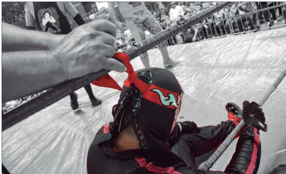
▲ Como los antiguos héroes del barrio, los luchadores cubren sus gastos personales y deportivos durante sus entrenamientos. Además de resistir el dolor, la mayoría gestiona todos sus pagos con otros negocios.