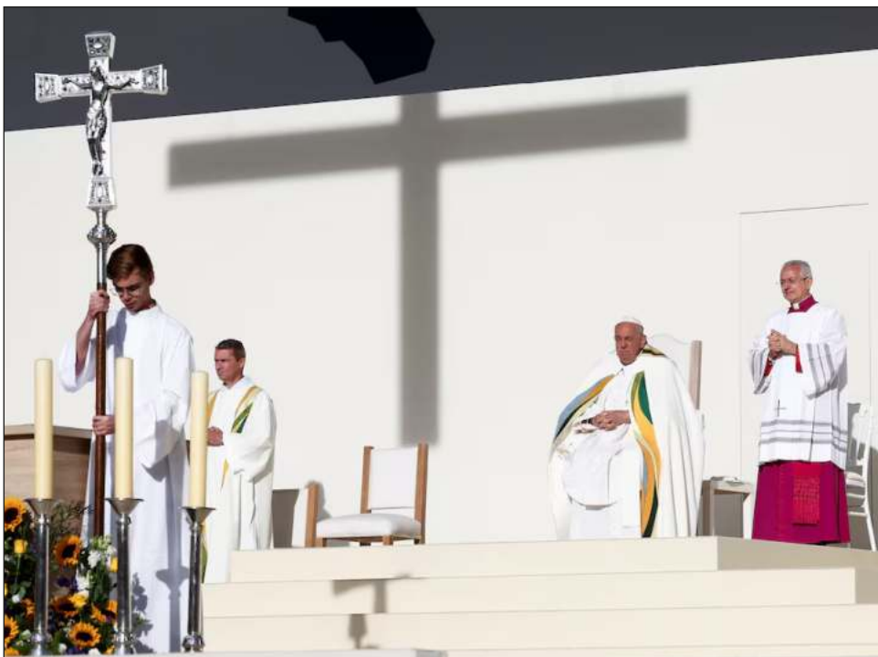
▲ El papa Francisco pidió este domingo en Bruselas que no se encubran los casos de violencia sexual en el ámbito de la Iglesia, en el cierre de una visita a Bélgica. En el estadio Rey Balduino, dijo que “no hay lugar para el abuso. No hay lugar para el encubrimiento del abuso. Le pido a los obispos que no encubran los abu-

sos y condenen a los abusadores”. También se refirió al encuentro reservado que mantuvo el viernes con 17 víctimas de agresiones sexuales en la Iglesia católica belga; dijo que sintió “su sufrimiento como abusados. Lo repito aquí: en la Iglesia hay lugar para todos. Pero todos serán juzgados”.