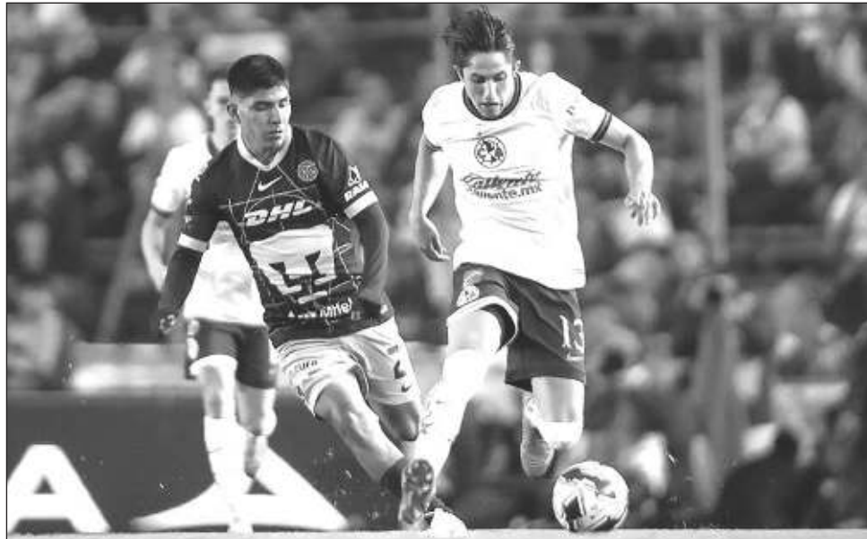
▲ Las Águilas cayeron en el clásico capitalino ante unos Pumas que están en ascenso.

Los universitarios, dirigidos por el argentino Gustavo Lema, son uno de los cuatro equipos más populares del país, pero no logran ser campeones de liga desde el torneo Clausura 2011. Pumas conquistó su segunda victoria consecutiva sobre el América, actual bicampeón de la Liga Mx.