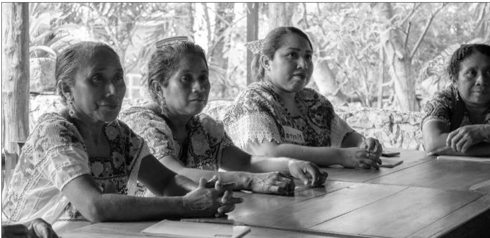
▲ "El bordado artesanal tiene múltiples retos, como la disminución de la transmisión de una generación a la siguiente (...) y violencias de género".