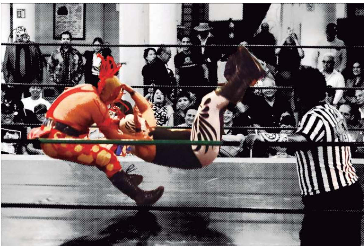
▲ “Aunque sabemos que no tenemos nada, estamos aquí por amor a la lucha”: Fuerza Guerrera.

Detalló que, en su caso, “he cuidado mucho mi cuerpo y siempre me he abstenido de los vicios, como fumar, beber, consumir drogas, que obviamente no me hubieran permitido llegar a esta etapa, en la que me siento pleno y muy orgulloso de demostrar la capacidad que aún tengo. Hasta hoy no he pensado en retirarme”.