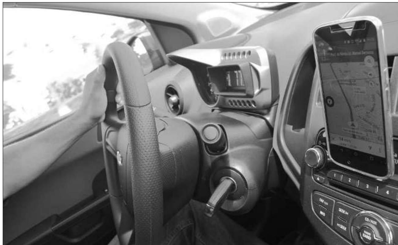
▲ Los socio conductores de la app de transporte también preparan una marcha para el 2 de octubre; será “totalmente pacífica, sin cortes a la circulación, sin bloqueo de calles”, sostuvo Omar Escobar, uno de los inconformes.

“Invitaremos a todos los grupos de vecinos de Cancún a que nos apoyen en una mar-