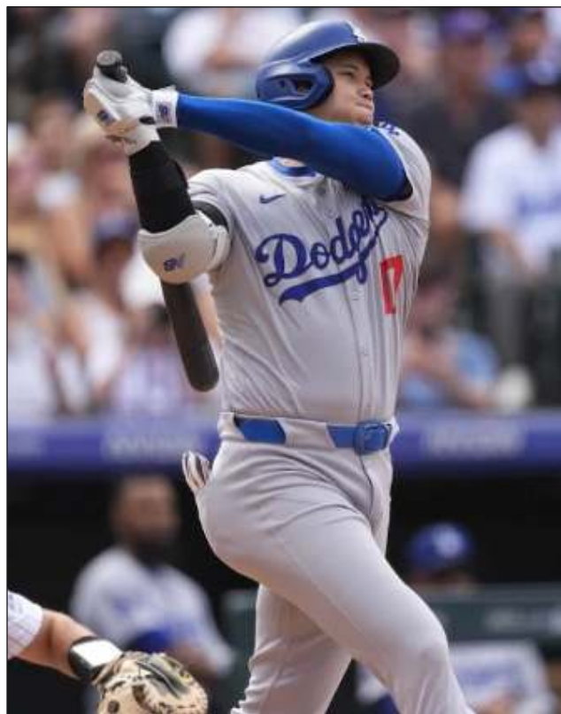
▲ Shohei Ohtani (foto) y Aaron Judge cosiguieron dos de las mejores temporadas ofensivas en la historia de las Mayores.

Nueva York tiene a su favor el criterio de desem-