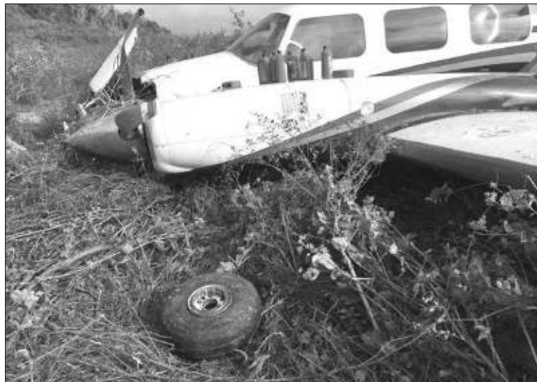
▲ “Si todo salía según lo planeado, la Operación Jaguar Maya sería una gran operación encubierta sincronizada en los puntos más calientes de la guerra contra las drogas”.

El avión privado había despegado sin pasajeros desde Río Negro, Colombia, hacia Cancún, México, pero fue descubierto por llevar