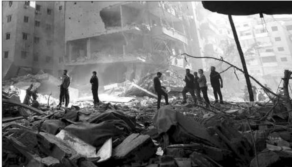
▲ El ejército israelí afirmó haber matado el viernes, junto con Nasralá, a más de 20 miembros de Hezbolá de diversos rangos presentes en el cuartel general subterráneo situado bajo edificios civiles.

fuerte explosión y vieron columnas de humo sobre los suburbios del sur de Beirut, bastión de Hezbolá, donde el viernes falleció Nasralá en un bombardeo israelí que arrasó edificios enteros.