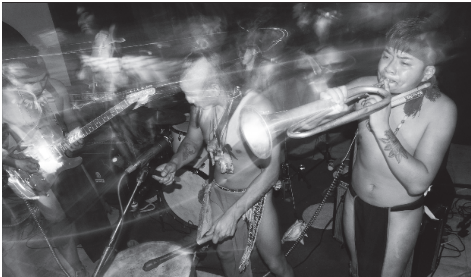
▲ "Habrá que impulsar talleres de pintura o teatro, y montar exposiciones de sus trabajos o poner en escena sus pequeñas obras dramáticas, entre otras manifestaciones infantiles. No será tan difícil, si se considera que las escuelas y los centros culturales cuentan con espacios para mostrar sus creaciones y difundirlas".