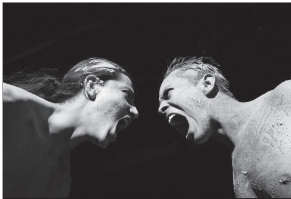
▲ Caleras es una pieza coreográfica que fue creada entre 1992 y 1993, que se ha convertido en un clásico de la danza contemporánea y refleja el compromiso social de la agrupación en su trabajo.

Entonces, Silva montó con los colonos recluidos la coreografía Caleras , cuya temática sustenta cómo el arte puede rehabilitar a personas privadas de su libertad, y su mensaje para los espectadores es “que no existen rejas ni encierros que puedan contener a un espíritu libre”.