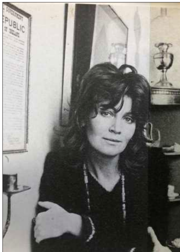
▲ Edna O'Brien, audaz cronista irlandesa de la vida de las mujeres, falleció a los 93 años. Su debut literario en 1960, Las chicas del campo , suscitó el desprecio nacional.

Sus seis primeras novelas fueron prohibidas por la censura de su país, Irlanda. Su última novela, Girl , de 2019 sobre las niñas secuestradas en Nigeria por militantes islamitas de Boko Haram, incluyó viajes de investigación a África Occidental cuando ya tenía más de 80 años.