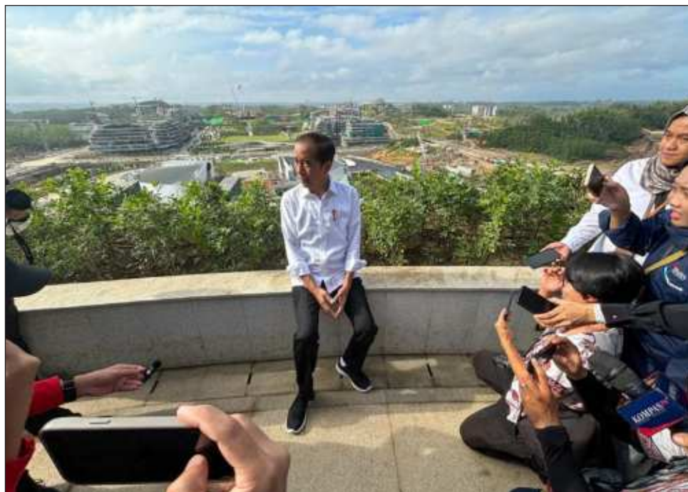
▲ Joko Widodo espera pasar los últimos meses de su presidencia en Nusantara, también conocida como IKN, en la provincia de Kalimantan Oriental, en la isla de Borneo.

Para facilitar el traslado, el secretariado presidencial prepara todos los muebles necesarios para la oficina del mandatario, mientras que el suministro de agua potable, electricidad e Internet “funciona todo bien”, dijo Widodo.