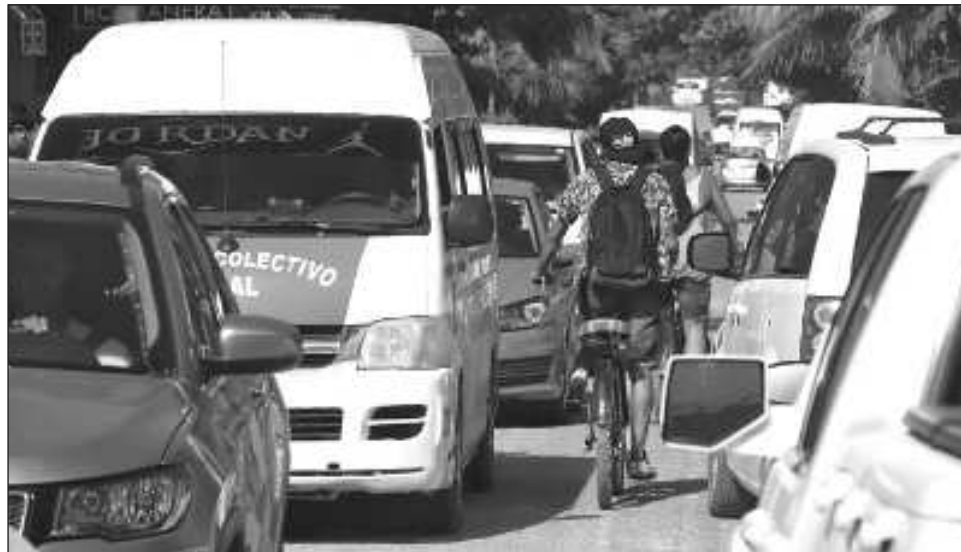
▲ Durante tres días, profesionistas, ambientalistas y miembros de la sociedad civil intercambiaron ideas para conformar un instrumento que fomente el crecimiento equilibrado de los centros de población que integran el corredor Tulum-Cobá.

La finalidad de dicho encuentro, al que fueron convocados profesionistas, ambientalistas y sociedad civil