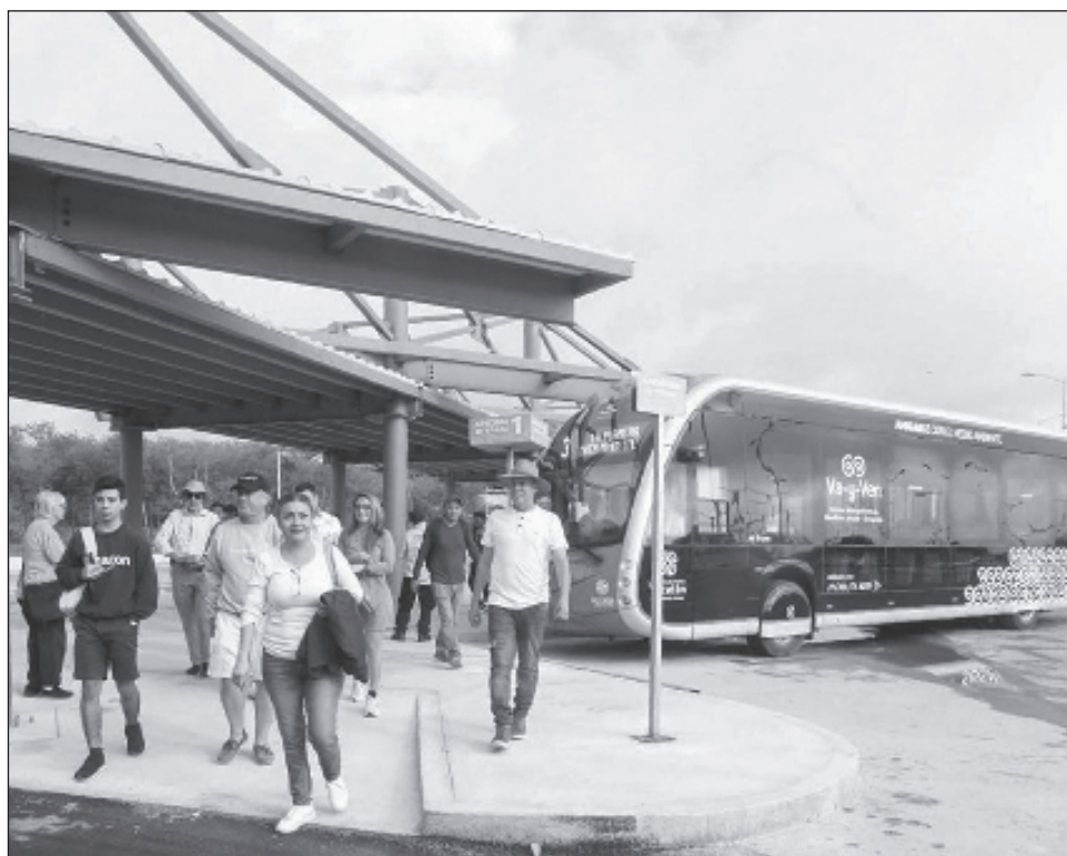
▲ "La expectativa de la llegada del Tren Maya ha hecho que haya llegado mucha nueva inversión turística a Yucatán, más de 300 proyectos de inversión", dijo Vila.

Vila Dosal celebró que el Tren Maya sea una obra que ha beneficiado ampliamente a Yucatán. "La expectativa de la llegada del Tren Maya ha hecho que haya llegado mucha nueva inversión tu-