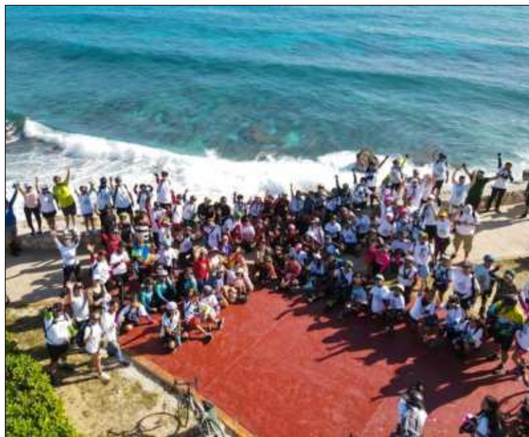
▲ La rodada se llevará a cabo el próximo 3 de agosto, y consiste en un recorrido de 13.4 kilómetros alrededor de la isla, pasando por puntos como el Mirador del Acantilado y Punta Sur.

La conservación de los manglares se ha vuelto cada vez más urgente debido al crecimiento urbano y la consecuente pérdida de estos ecosistemas, provocada por actividades agrícolas, ganaderas y turísticas, entre otras. Esto no solo afecta la biodiversidad, sino que también incrementa la vulnerabilidad de las comunidades costeras ante fenómenos hidrometeorológicos.