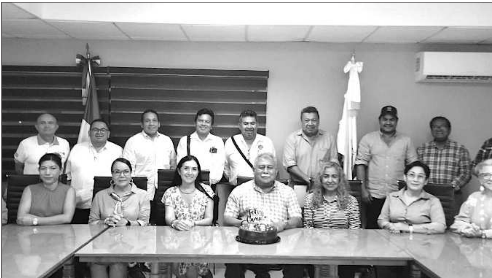
▲ Dentro de los retos que enfrentará en este período al frente de este organismo es el pago a los proveedores de Pemex y el Congreso Agroindustrial de Queso.