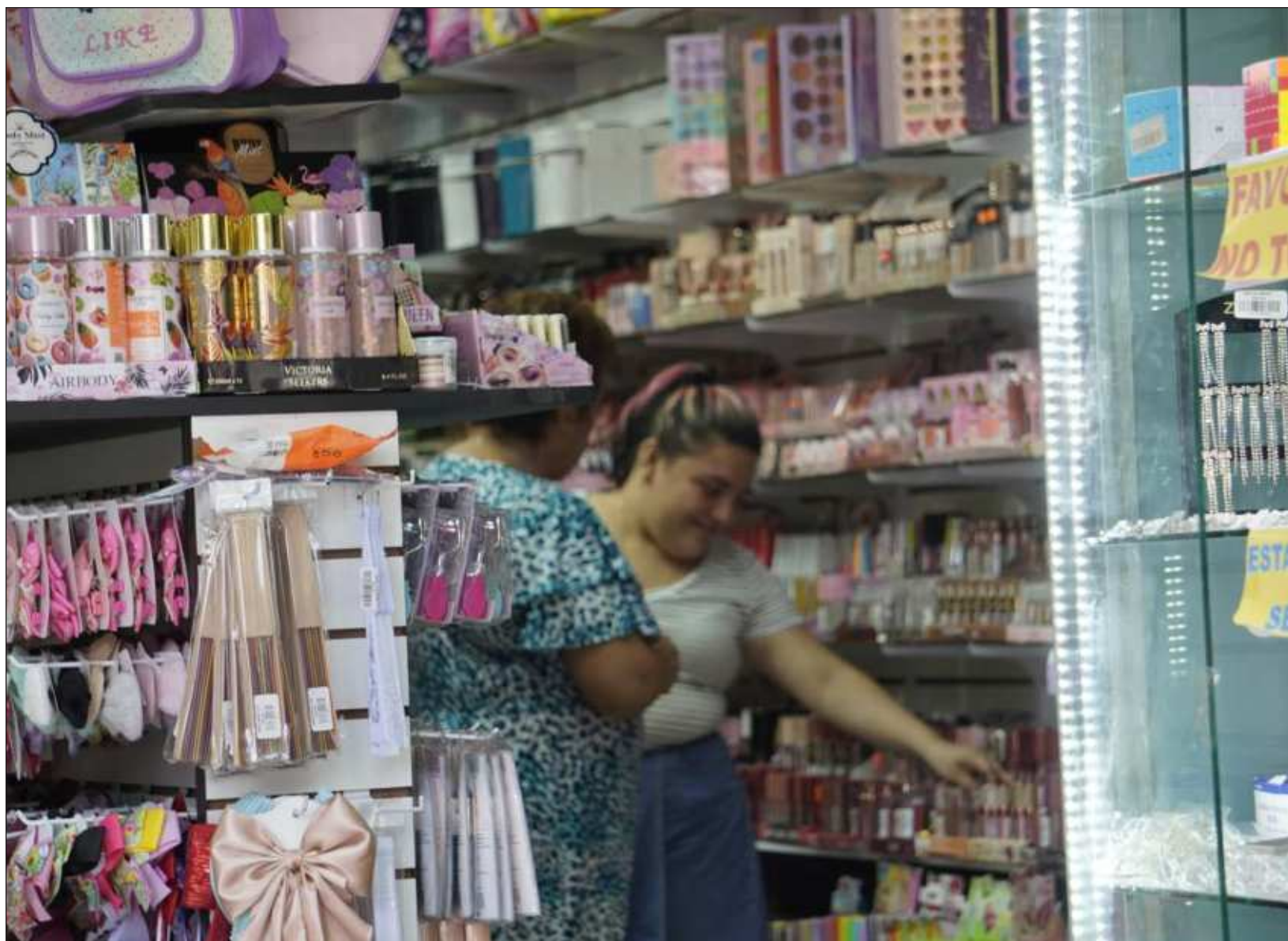
▲ Los resultados del Indicador Trimestral de la Actividad Económica Estatal 2024 del Inegi detallan que, comparado con el primer trimestre del año pasado, las actividades terciarias en Quintana Roo crecieron 5.5% y en Yucatán 2.8%, mientras que en Campeche incrementaron 0.1%.

El Itaee se actualiza una vez que se dispone de la información estadística más reciente de las Cuentas de Bienes y Servicios y del Producto Interno Bruto por Entidad Federativa (PIBE).