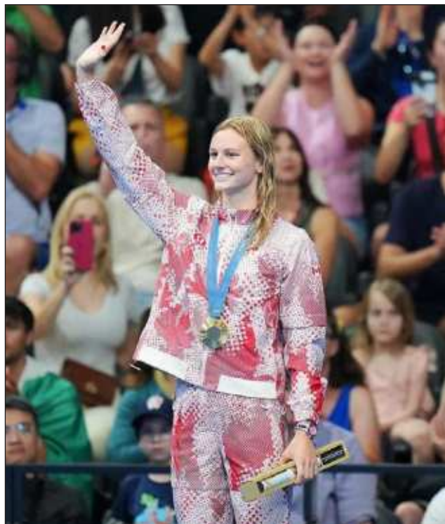
▲ Summer McIntosh celebra su victoria en los 400 metros combinados, donde dejó muy atrás a sus rivales.

Popovici emergió triunfante de un emocionante duelo en los 200 libres masculinos.