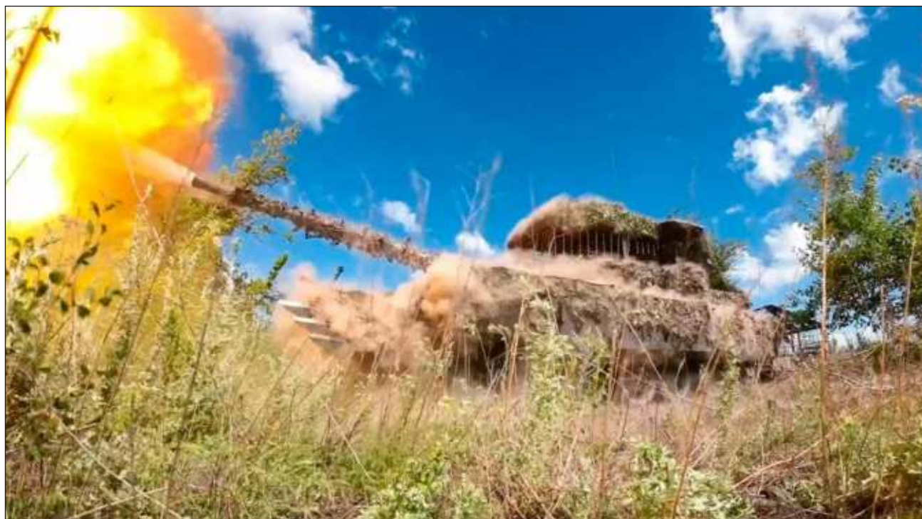
▲ Rusia anunció el lunes que sus fuerzas han conquistado el pueblo de Vovche, en el este de Ucrania, el último de una serie de avances en el frente en las últimas semanas. Vovche se encuentra a unos 16 kilómetros al noroeste de Avdiivka, una ciudad que Rusia tomó en febrero y desde la

cual sus tropas han estado avanzando desde entonces. El Ministerio de Defensa ruso dijo durante una conferencia de prensa que unidades de su ejército han "liberado la aldea de Vovche" en la región oriental de Donetsk y "mejorado su posición táctica".