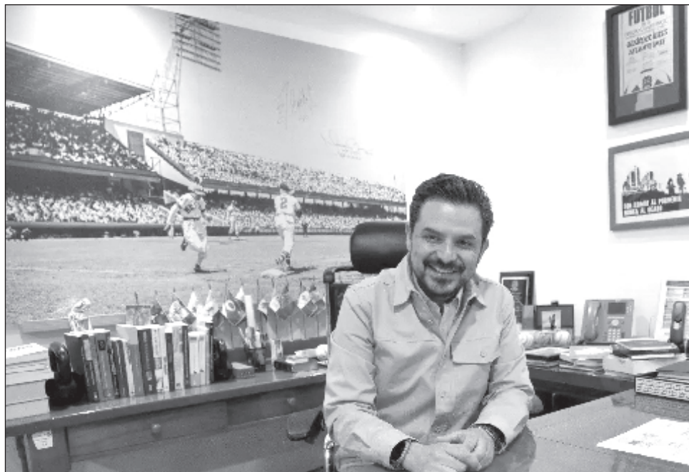
▲ Recién ratificado por la virtual presidenta electa, Claudia Sheinbaum, el director del IMSS tiene un conocimiento pleno de la situación de los servicios sanitarios e inevitablemente de las diferencias con la seguridad social.

Un botón de muestra es la inexistencia de categorías de trabajadores de higiene y limpieza y lavandería, servicios vitales en cualquier hospital, que están en manos privadas.