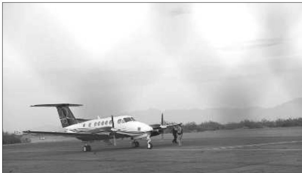
▲ El vuelo aterrizó a las 16:24 horas en Santa Teresa, aeropuerto en periferia de El Paso.

Durante la conferencia presidencial, la funcionaria comentó que el gobierno mexicano pidió un informe oficial de su contraparte estadounidense para conocer exactamente lo que ocurrió. México está a la espera de