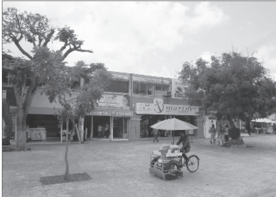
▲ En el fraccionamiento Corales hay entre 15 y 20 edificios a revisar, tarea que hará el Colegio de Ingenieros Civiles en conjunto con el ayuntamiento.

De momento, dijo la ingeniera, se desconocen los presupuestos necesarios, pues hay que definir primero lo que se hará, posiblemente a cargo del ayuntamiento