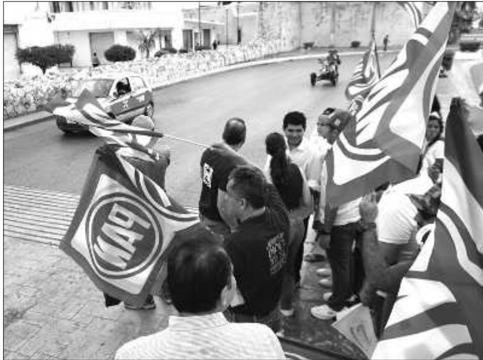
▲ Aunque el PAN casi no obtuvo funcionarios esta elección, al menos su votación aumentó comparado con 2021, cuando incluso obtuvieron dos alcaldías y una diputada electas.

Destacó que en esta elección aunque casi no obtuvieron funcionarios, al menos su votación au-