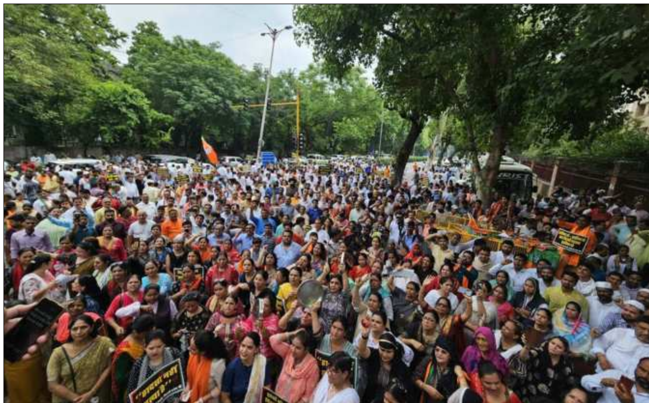
▲ Los manifestantes acusan a las autoridades de negligencia al permitir el uso de deficientes infraestructuras como centros de preparación, a los que acuden miles de estudiantes cada año a prepararse para pruebas académicas.

Asimismo, un amplio grupo de estudiantes acudió a protestar frente al centro de entrenamiento y en los alrededores, acusando a la Administración capitalina de no cumplir con su deber.