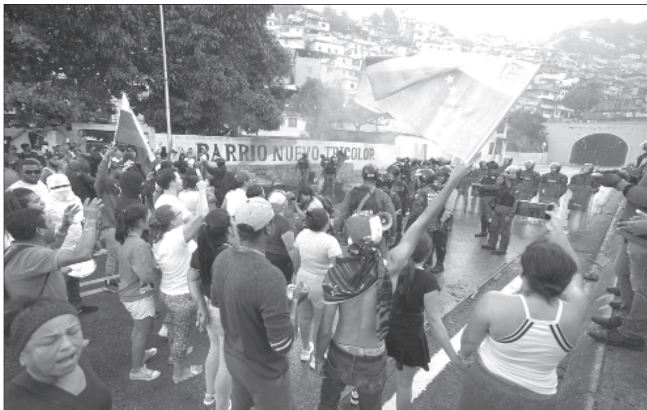
▲ El gobierno venezolano ha acusado a la oposición de intentar desestabilizar el país a través de la violencia. Las protestas se desarrollaron en paralelo al acto de proclamación de Nicolás Maduro, quien denunció un intento de golpe de Estado.

Panamá y Estados Unidos firmaron el 1 de julio un acuerdo mediante el cual Washington se compromete a financiar la deportación y expulsión de migrantes.