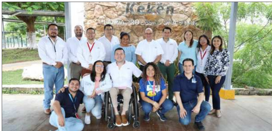
▲ La directora en Walmart Supply Chain, dijo que gracias al programa “se puede ver que disfrutan su trabajo, tienen autonomía y un desempeño exitoso que aporta a la empresa. Por eso Kekén debe sentirse orgulloso de lo que están haciendo”.

Los representantes de Walmart destacaron que la Compañía productora de proteína ha generado una cultura de inclusión laboral, por lo que brindan