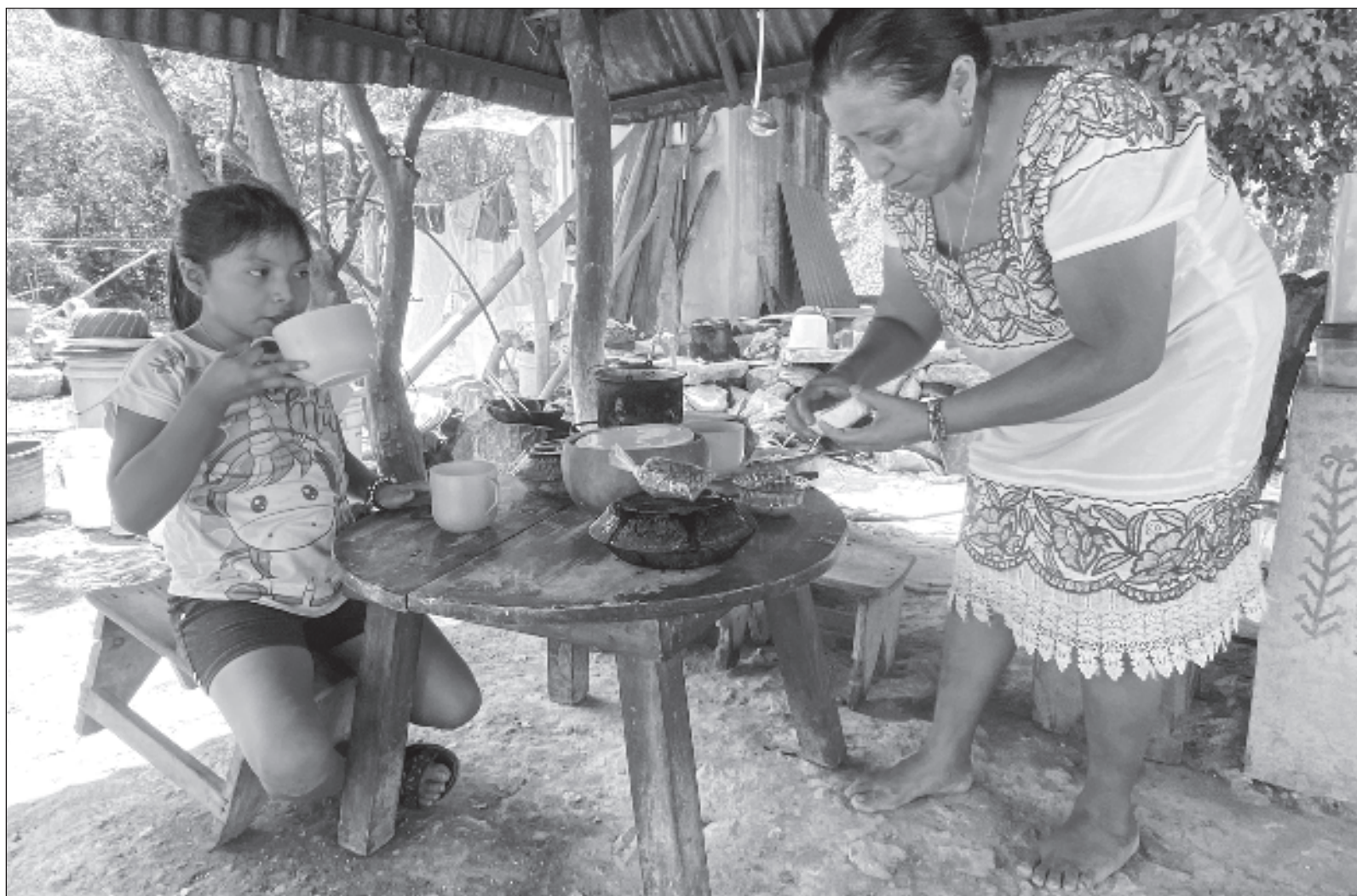
▲ "No hay duda, la cultura maya aún guarda conocimientos profundos en materia de salud, manejo de recursos naturales (...) educación, etc."