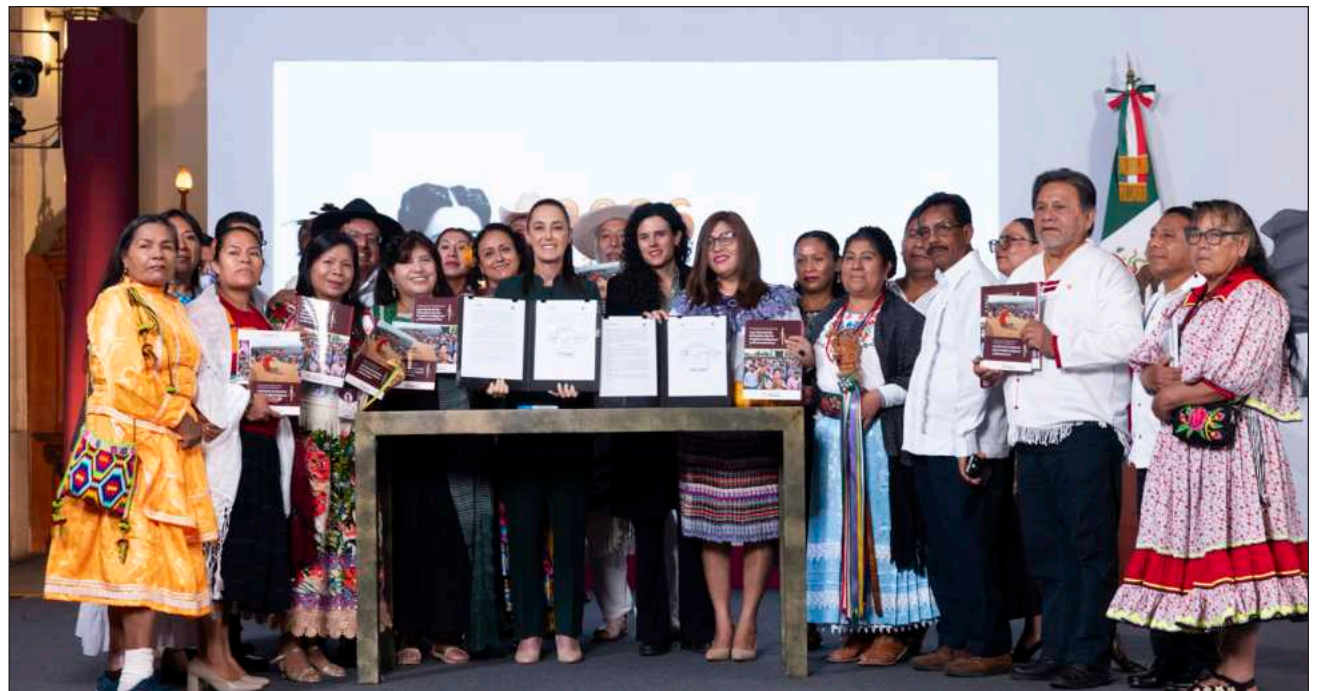
▲ Sheinbaum subrayó que los pueblos indígenas conforman uno de los pilares de la identidad nacional que están reconocidos en la Constitución, pero con esta ley se busca establecer mecanismos específicos para garantizar su cumplimiento.

El gobierno federal iniciará, del 1 de julio al 6 de agosto, un proceso de consulta dirigido a los pueblos indígenas y afroamericanos para la elaboración de la nueva Ley General de Derechos de los Pueblos Indígenas y Afroamericanos. Una vez incorporadas las propuestas surgidas de este ejercicio, la iniciativa será presentada al Congreso de la Unión el próximo 12 de octubre.