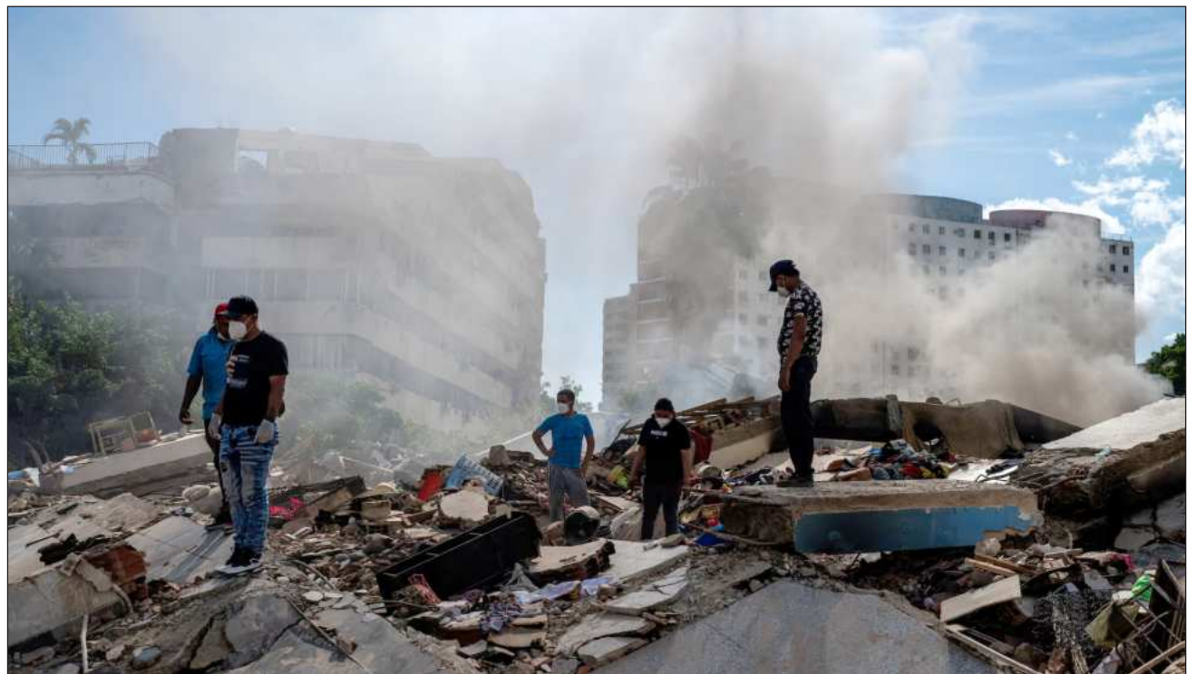
▲ Cientos de cadáveres se encuentran en morgues improvisadas en depósitos del puerto de La Guaira, a 40 km de Caracas y que fue la zona más golpeada por los terremotos, constataron reporteros de la Afp.

Cientos de cadáveres se encuentran en morgues im-