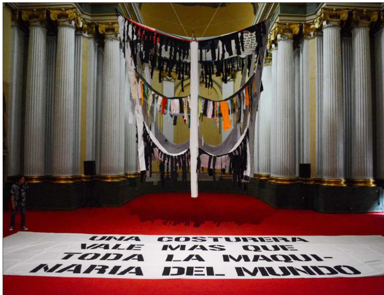
▲ En la zona de la capilla, se encuentra la instalación denominada Una textilera... , en el que se rinde homenaje a las costureras que fallecieron durante el terremoto de 1985, elaborada por Frank López, especialista que lleva más de 15 años trabajando en telas.

La exposición está en casa permanecerá abierta al público hasta el 30 de agosto en el Ex Teresa Arte Actual, ubicado en Licenciado Verdad 8, colonia Centro, CDMX.