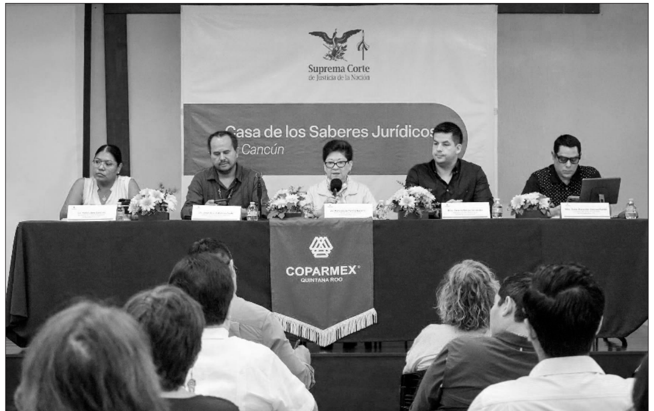
▲ Como parte de su sesión ordinaria de consejo, se formalizaron estas alianzas que buscan dotar a las empresas de herramientas para enfrentar los retos normativos actuales y promover un estado de derecho sólido en la entidad.

Como parte de su sesión ordinaria, se formalizaron estas alianzas que buscan dotar a las empresas de herramientas para enfrentar los retos normativos actuales y promover un estado de derecho sólido en la entidad.