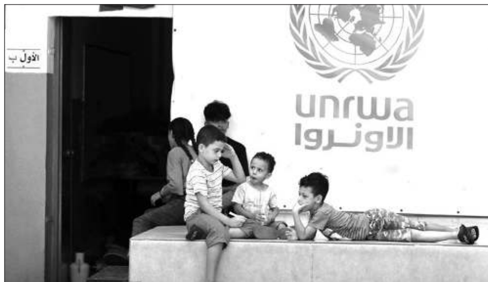
▲ Medios israelíes afirman que lo más probable es que la coalición de gobierno, integrada por partidos ultraderechistas y ultraortodoxos, termine por dar carpetazo al proyecto antes de su aprobación.

Sin embargo, medios israelíes afirman que lo más