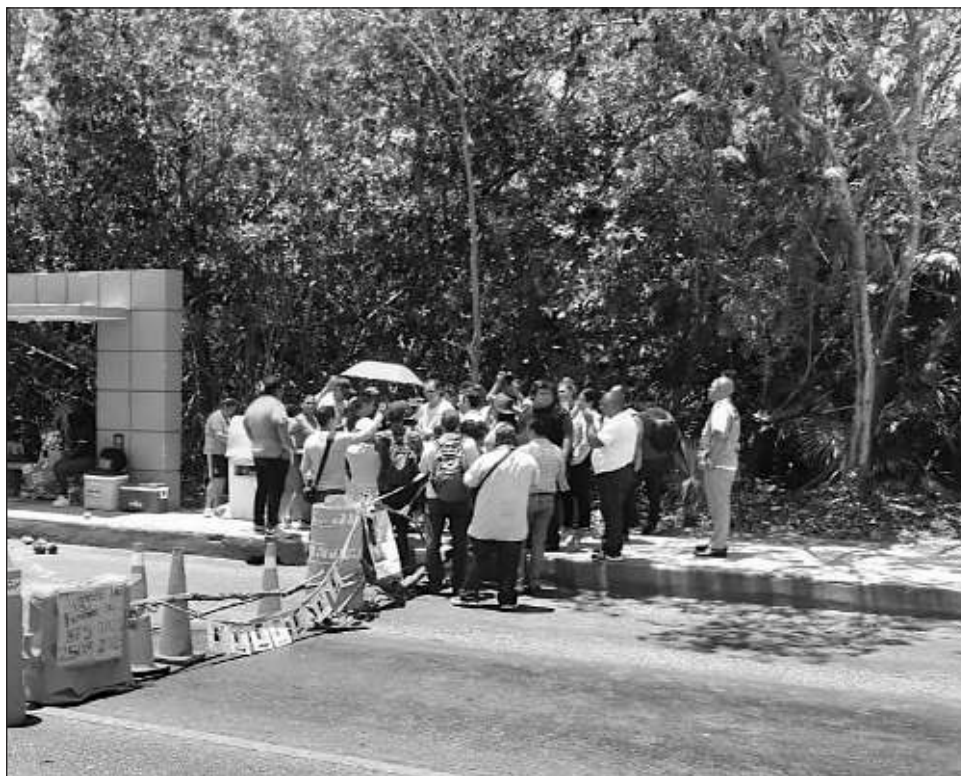
▲ La dirección municipal de Tránsito intervino en la protesta para garantizar la movilidad en la zona, quedando el bulevar Kukulcán con un carril bloqueado y uno liberado.