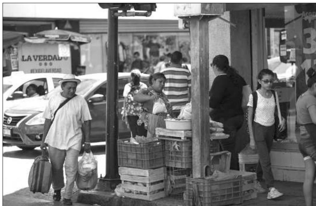
▲ Los números que presentan Campeche, Yucatán y Quintana Roo, que fueron reportados por el Consejo Nacional de Evaluación de la Política de Desarrollo Social, resultan alentadores.

Con todo y la dificultad que representó la pandemia de Covid-19, la recuperación del ingreso en México es una realidad. Eso sí, es un camino por el cual se debe perseverar, realizando los ajustes pertinentes a la estrategia. Nadie, con un trabajo formal, debería encontrarse en esta situación de pobreza.