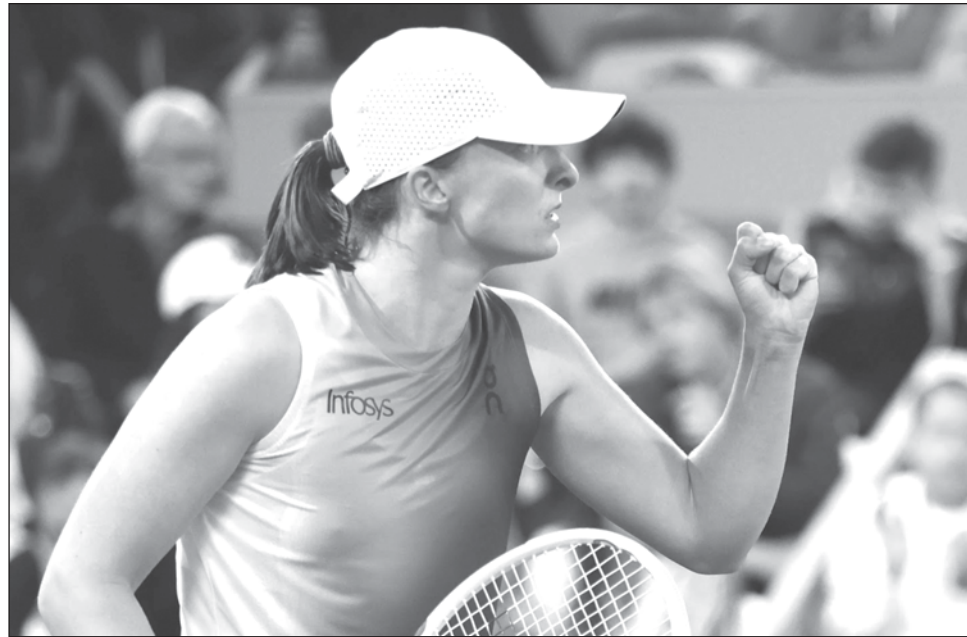
▲ La polaca Iga Swiatek sobrevivió en una batalla entre campeonas de "Grand Slam".

Arriba 5-3, Osaka sacó para la victoria en el set decisivo y estaba a un punto de llevarse el encuentro, pero su revés pegó en la red. Poco después, falló otro revés y Swiatek finalmente convir-