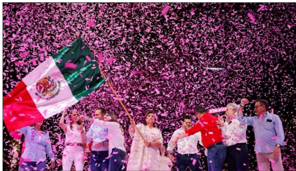
▲ La candidata de la oposición escogió la Arena Monterrey, la capital de Nuevo León, como el sitio para cerrar su campaña presidencial en un espacio diseñado para 17 mil 600 personas, pero en el que los palcos quedaron sin ocupar.

La abanderada de la oposición escogió la Arena Monterrey, en la capital de Nuevo León, como el sitio para cerrar su campaña presidencial. Aunque por la noche tenía previsto un último acto en su natal Tepatepec, Hidalgo, el de la tarde fue el último mitin masivo, realizado en un espacio diseñado para 17 mil 600 personas, pero en el que los palcos quedaron sin ocupar.