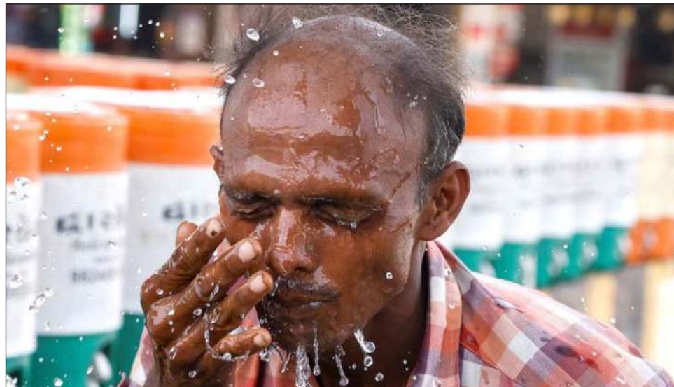
▲ El martes, dos estaciones de la ciudad, las de Mungeshpur y la de Narela, registraron una temperatura de 49,9 grados Celsius. Se ignora si esa cifra también tendrá que ser revisada.

“La estación meteorológica de Mungeshpur señaló 52.9 grados Celsius, valor distinto al de otras estaciones”, indicó el DMI.