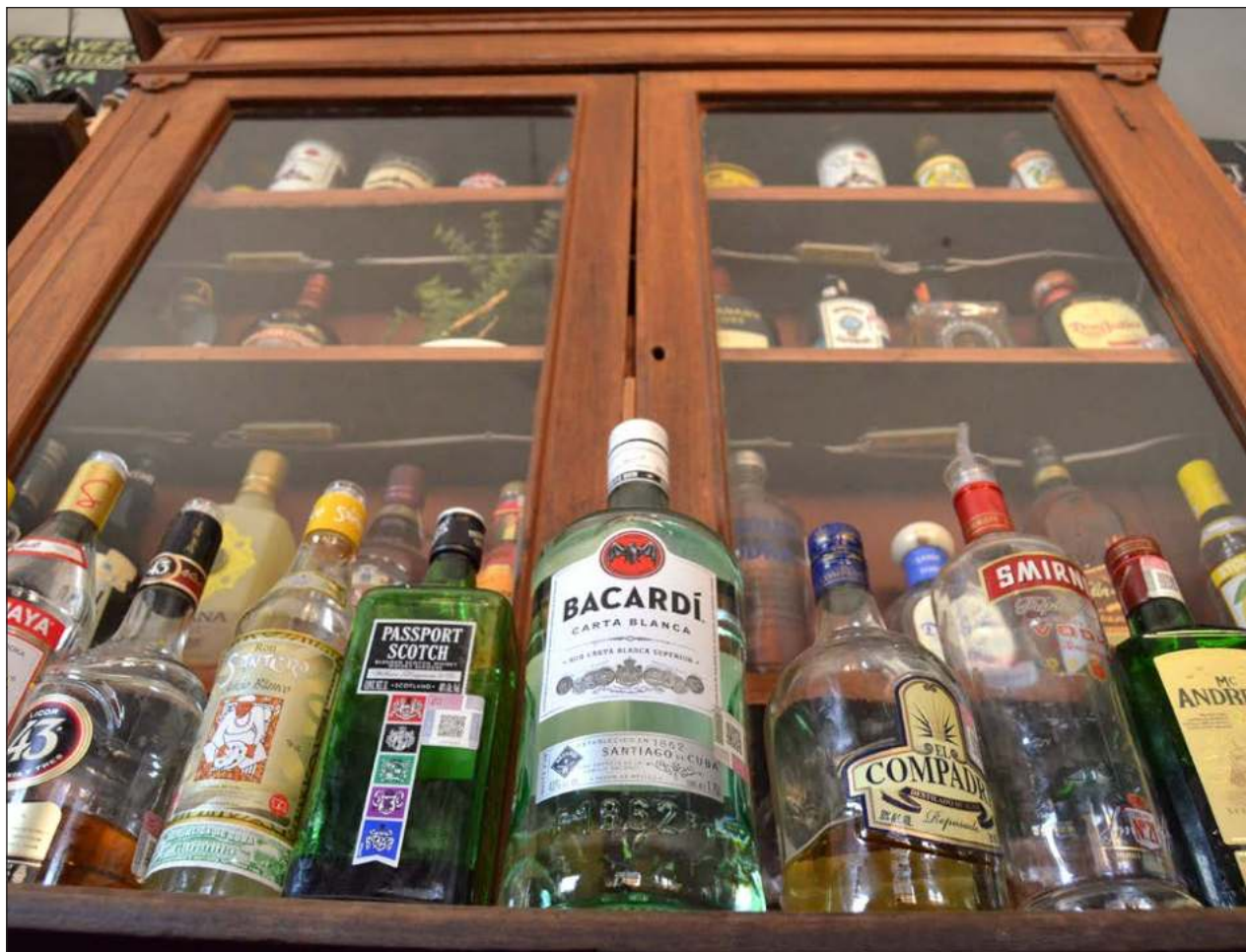
▲ El sector privado advirtió que la prohibición de la venta de alcohol durante la jornada electoral puede impulsar el mercado negro de alcohol adulterado, lo que aumenta el riesgo de daños severos e incluso la muerte.

La Alianza pidió que se ponga un alto a esta determinación, pues insistió que no hay relación directa al respecto del número de votantes que acude a las urnas.