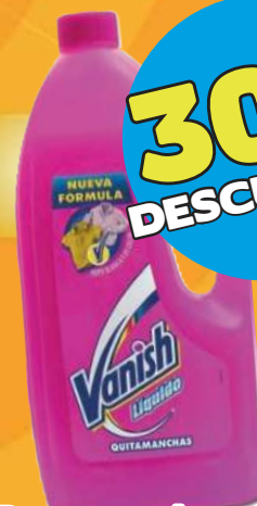
Removedor de manchas de ropa VANISH de 925 ml

VIGENCIA ÚNICAMENTE EL 30 DE MAYO DEL 2024.