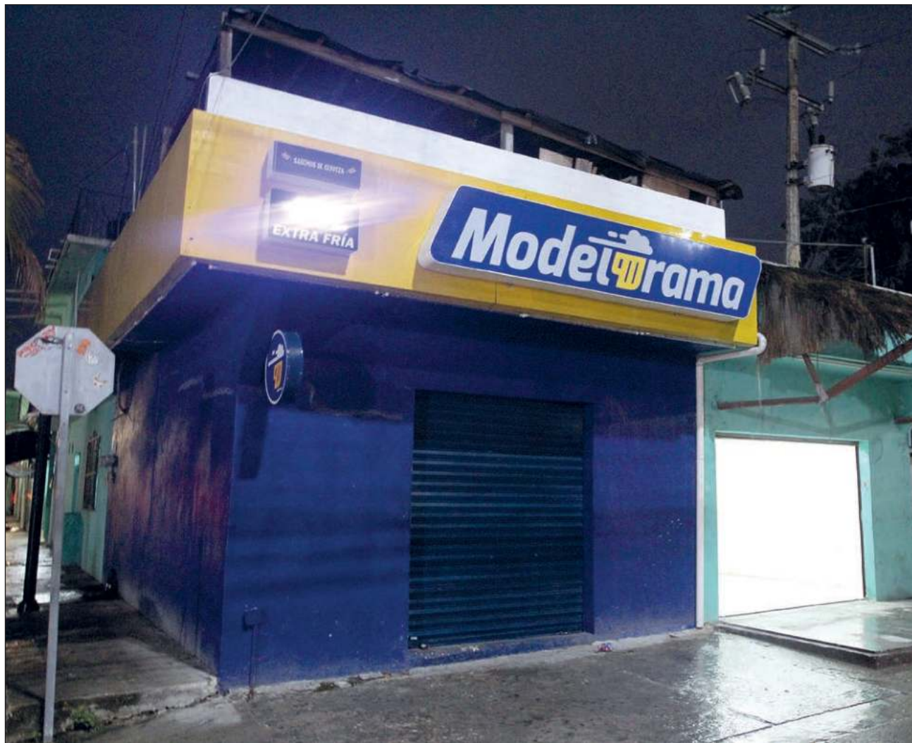
▲ El acuerdo suspende temporalmente la venta de bebidas alcohólicas el día de la elección y el previo.

El acuerdo también señala que se exceptúan de dicha prohibición los comercios establecidos en zonas turísticas con licencia de bebidas alcohólicas en establecimientos tipo restaurante y restaurante bar; es decir, en lugares donde se expendan bebidas alcohólicas acompañadas del consumo de alimentos.