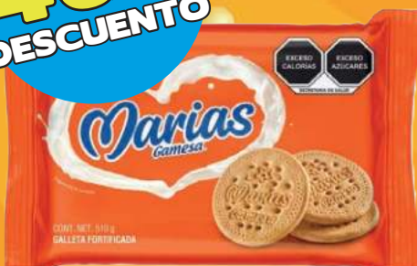
Galletas marías GAMEESA paquete de 510 gr (Las primeras 3 piezas)