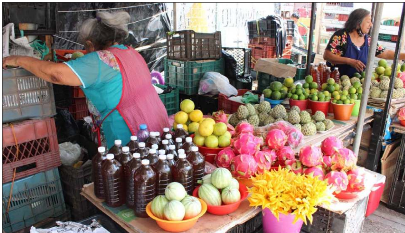
▲ Los datos muestran la brecha por sexo, ya que los hombres perciben un ingreso 1.3 veces superior a las mujeres; los hombres ocupados reportaron salarios mensuales de 8 mil 29.47 pesos y las mujeres de 6 mil 296.22 pesos reales.

El Coneval informó que entre el primer trimestre de 2023 y el primer trimestre de 2024, el porcentaje de la pobreza laboral presentó una disminución a nivel nacional de 1.9 puntos porcentuales al pasar de 37.7 a