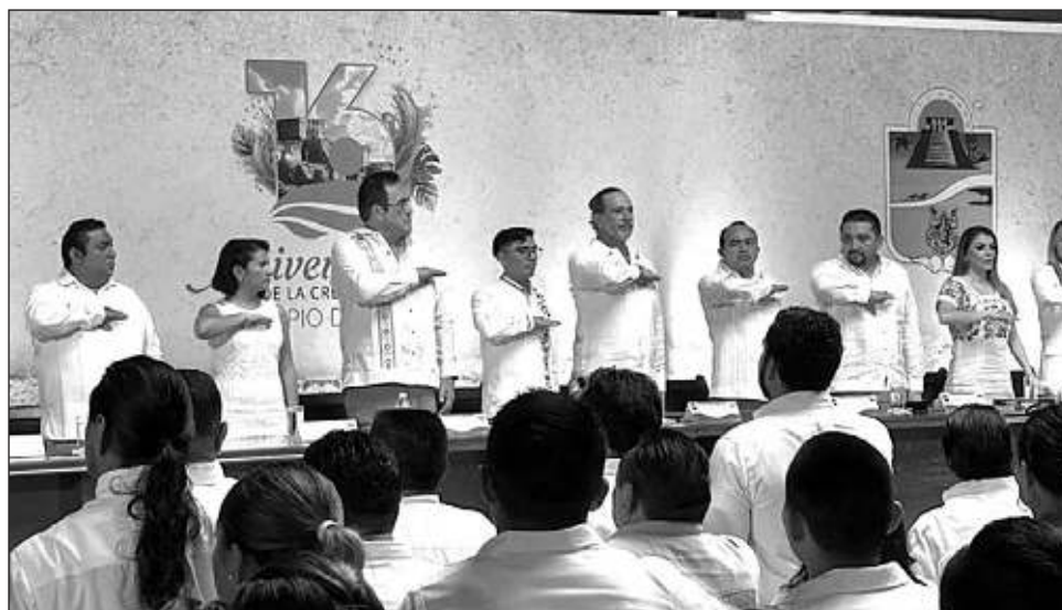
▲ Tulum, con su rica historia desde 1860, tuvo en la Guerra de Castas el liderazgo de María Petronila Uicab, cuyo nombre se encuentra escrito en letras doradas en el Congreso del Estado.

Recordó que Tulum llevó antiguamente el nombre de