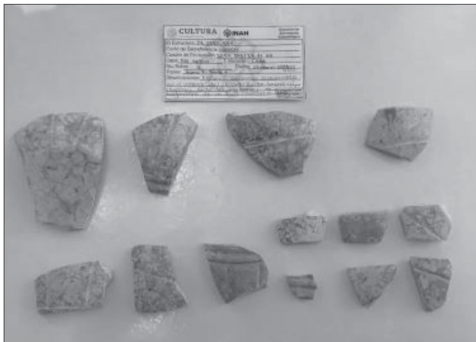
▲ Todos los elementos encontrados, puntualizó la coordinadora del frente 4, permiten plantear hipótesis interpretativas de los monumentos, así como de su función dentro de las comunidades mayas.

Los hallazgos, detalló, corresponden a 4 mil 513 cimientos con núcleo, mil 103