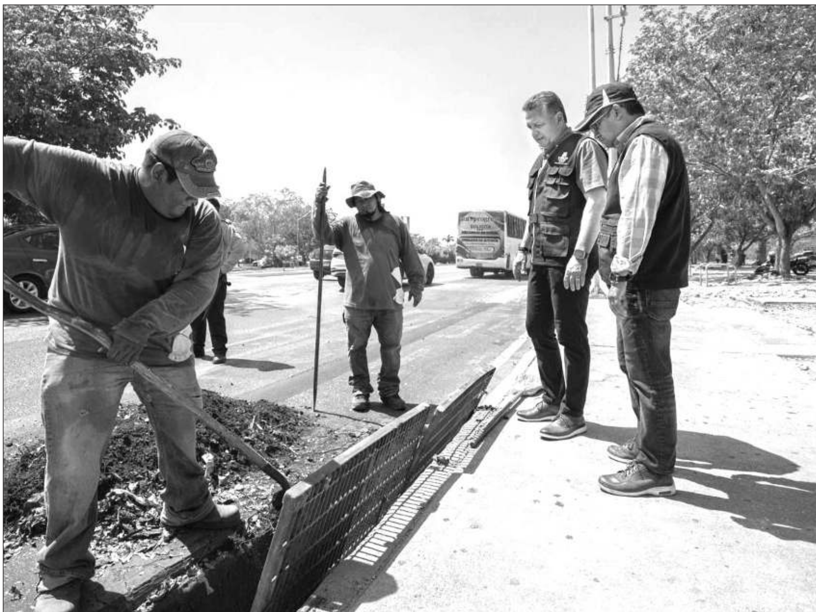
▲ El alcalde destacó que gracias al mantenimiento de los sistemas pluviales se garantiza el funcionamiento eficiente de las zanjas, aljibes y pozos.

Durante los trabajos de mantenimiento de los sistemas pluviales, también se realizó el desazolve de caños de interconexión de zanja a zanja. Cabe mencionar que en estas labores participaron una desazolvadora Vac-con y un volquete de 3 toneladas.