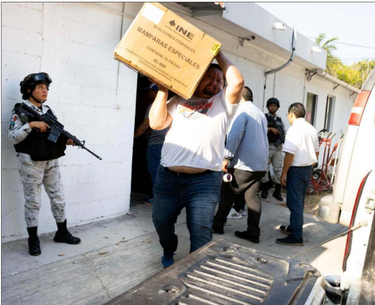
▲ El dirigente petista afirmó que la falta de claridad en la respuesta del Organismo Público Local Electoral (OPLE) da la pauta para sobreentender que existen vicios en el desarrollo de la jornada electoral de este domingo 2 de junio.

Confió en que las corporaciones policiacas y de seguridad desarrollen operativos de vigilancia y seguridad, brindando tranquilidad a los ciudadanos de que acudan a las casillas. "Hacemos un llamado a la civilidad, a que hagamos de esta jornada una fiesta democrática, no de violencia y de confrontación, ya que las elecciones se ganan con votos, no a golpes".