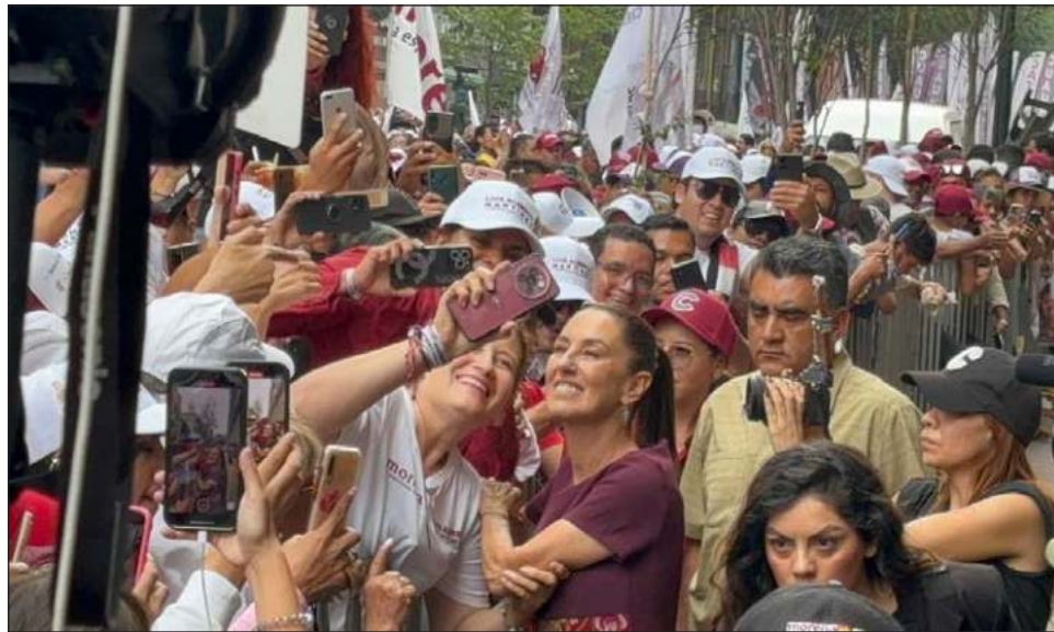
▲ La candidata de la coalición Sigamos Haciendo Historia realizó su cierre de campaña ante miles de simpatizantes, a quienes convocó a votar el próximo domingo.

Convocó a votar el próximo domingo para todos los cargos en juego y esto permita cumplir el plan C.