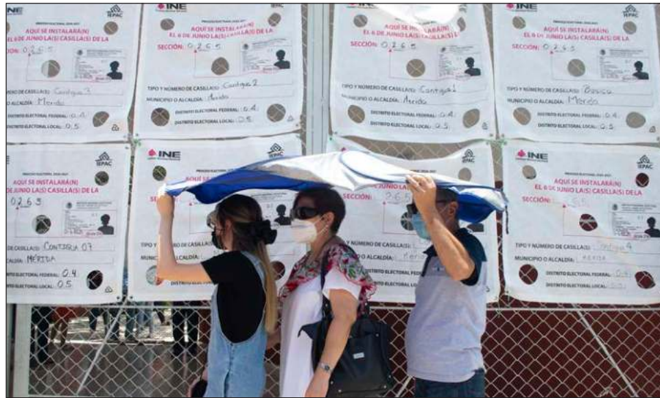
▲ Con la veda, queda prohibido publicar, difundir o dar a conocer, por cualquier medio de comunicación, resultados de encuestas o sondeos de opinión sobre preferencias electorales.

La normativa aplicable establece que durante los tres días previos a la elección y hasta la hora de cierre de las casillas de la jornada electoral, queda estrictamente prohibido publicar, difundir o dar a conocer, por cualquier medio de comunicación, los resultados de las encuestas o sondeos de opinión