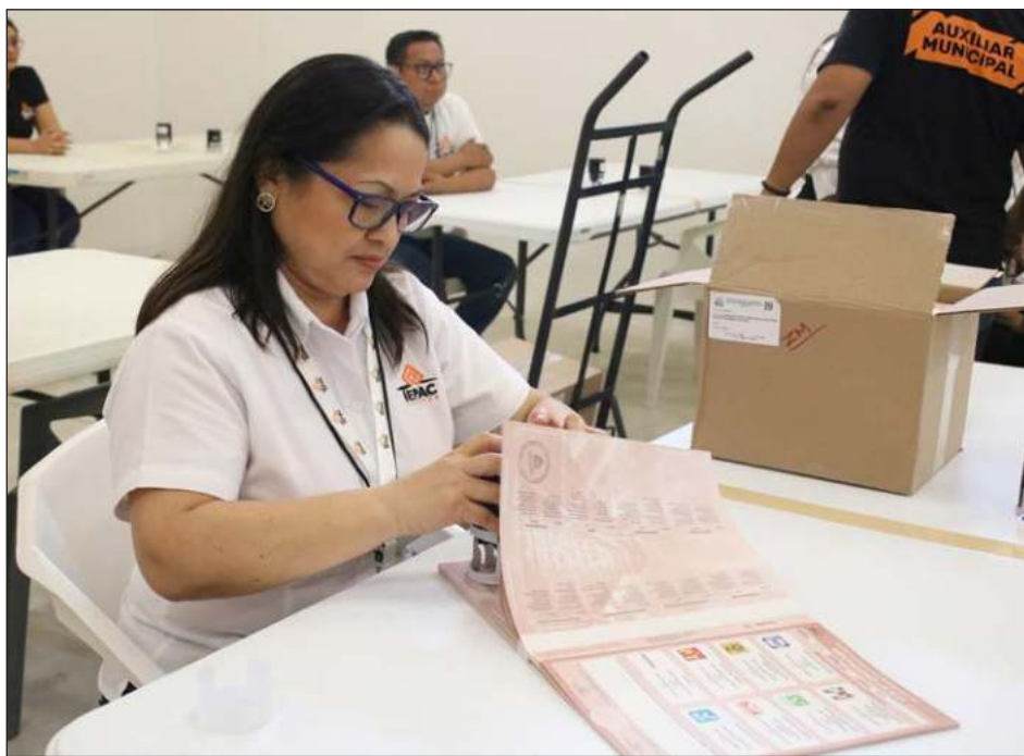
▲ Representantes de los partidos políticos criticaron este error del Iepac, que se suma a la reimpresión de más de 66 mil boletas por un error de logotipo en boletas de Valladolid.

Durante la sesión, en la que intervinieron consejeras y consejeros del Iepac así como representantes de los partidos políticos que participan en la contienda electoral, se informó que también se encontraban pérdidas alrededor de 200 boletas correspondientes a la casilla 546 del distrito 05, en Mérida.