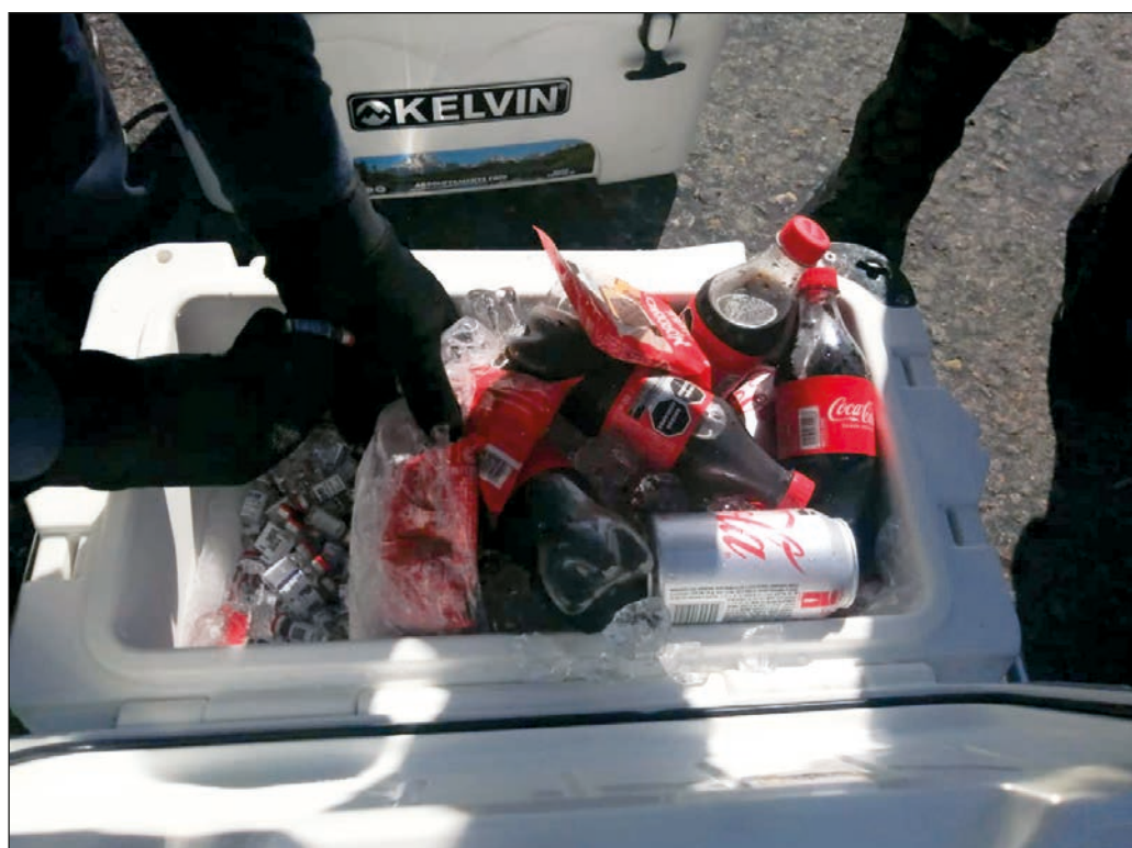
▲ En un escenario de escasez, es inevitable que grupos de interés tan delictivos como inescrupulosos hagan fortunas traficando con vacunas verdaderas o falsas.

Más allá de los esfuerzos que las autoridades aduanales, sanitarias y policiales están obligadas a desplegar para contrarrestar estos trasiegos criminales, es de fundamental importancia que la población se abstenga de acudir a estafadores privados para hacerse vacunar y que se atenga a los tiempos establecidos en el plan oficial de aplicación, para que pueda tener la certeza de una inoculación efectiva. También, es importante difundir elementos de juicio que permitan a los consumidores conocer la calidad y la autenticidad de los productos de protección y diagnóstico que se ofrecen en el mercado.