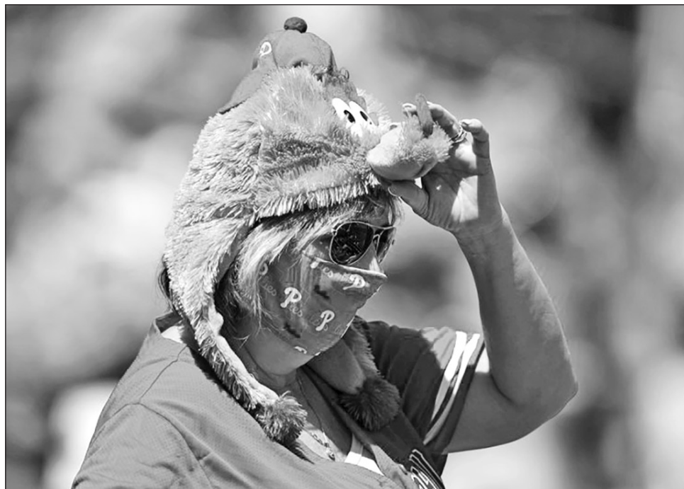
▲ Una aficionada de los Filis se ajusta su sombrero del “Phillie Phanatic” durante un encuentro de pretemporada entre Filadelfia y los Yanquis, en Clearwater, Florida.

“A los efectos del presente memorando, los individuos se consideran ‘to-