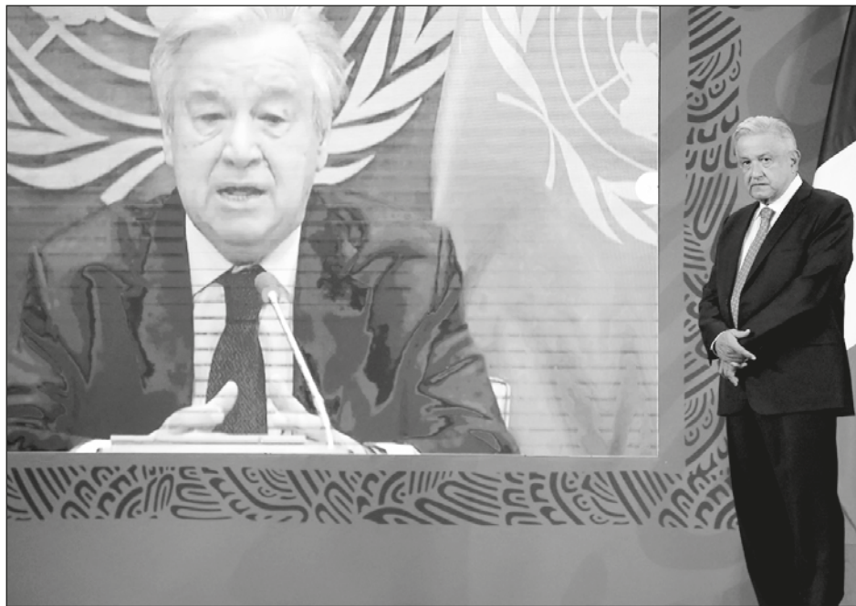
▲ En el foro participó António Guterres, secretario general de la ONU.

“Estamos en esta concepción de transformar e ir a fondo, estamos combatiendo el clasismo, discriminación y racismos como nunca. No hay tolerancia para el machismo, ni hay tampoco impunidad; se castigan crímenes de odio y feminicidios. Las mujeres