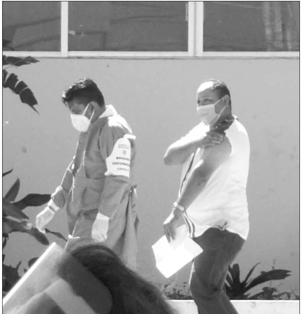
▲ El personal de primera línea ya recibió las dos dosis de la vacuna.

Guerrero del Rivero manifestó que en el caso de los adultos mayores, la fase de aplicación concluyó de manera satisfactoria; en Carmen se vacunó a 23 mil de las 83 mil personas beneficiadas con la inmunización. Comentó que de la misma manera aplicarán 5 mil dosis de la vacuna a maestros de la entidad, de los cuales, 2 mil se encuentran en este municipio.