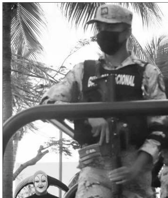
▲ La solución a la violencia pasa entonces por el funcionamiento correcto de varias estructuras y no solamente por los cuerpos de seguridad o el ejercicio de la fuerza.

En tanto, debe admitirse también que hacer realidad la atención a las causas de la violencia más que la aplicación de medidas coercitivas, brindando a los jóvenes acceso a educación, salud, oportunidades, así como garantizar el derecho al