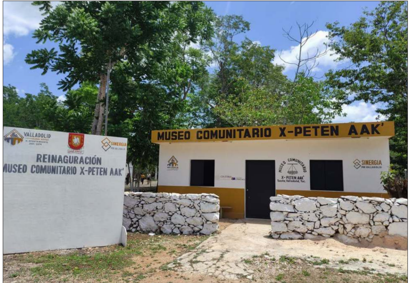
▲ Tuláakal ba'ax yane', yáax tsikbalta'ab tumen kaaj.