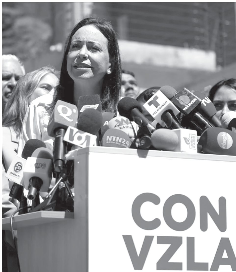
▲ “Represento a esa mayor soberanía popular. No pueden hacer elecciones sin mí”, sentenció la opositora Machado, descartando al mismo tiempo designar a un sustituto.

Según el ministro Galushchenko, con los reactores adicionales la central de Jmelnitski se convertiría en “la más grande de Europa e incluso más potentes que la de Zaporíyia”.