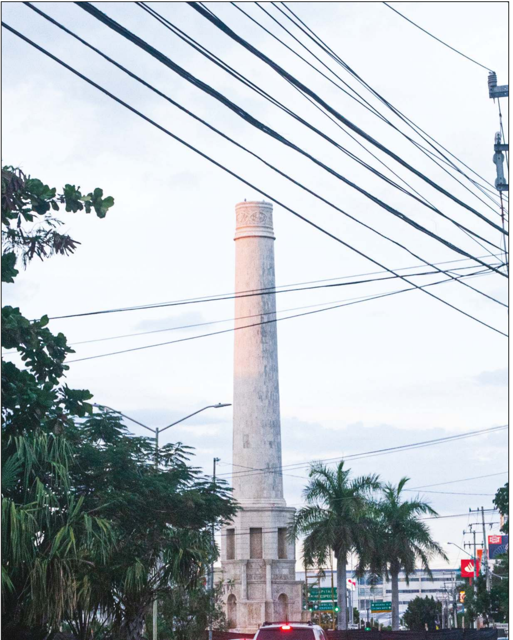
Hace más de 20 años Altabrisa se instaló en el norte de la ciudad como una de las zonas residenciales más modernas y caras de la ciudad. ▲