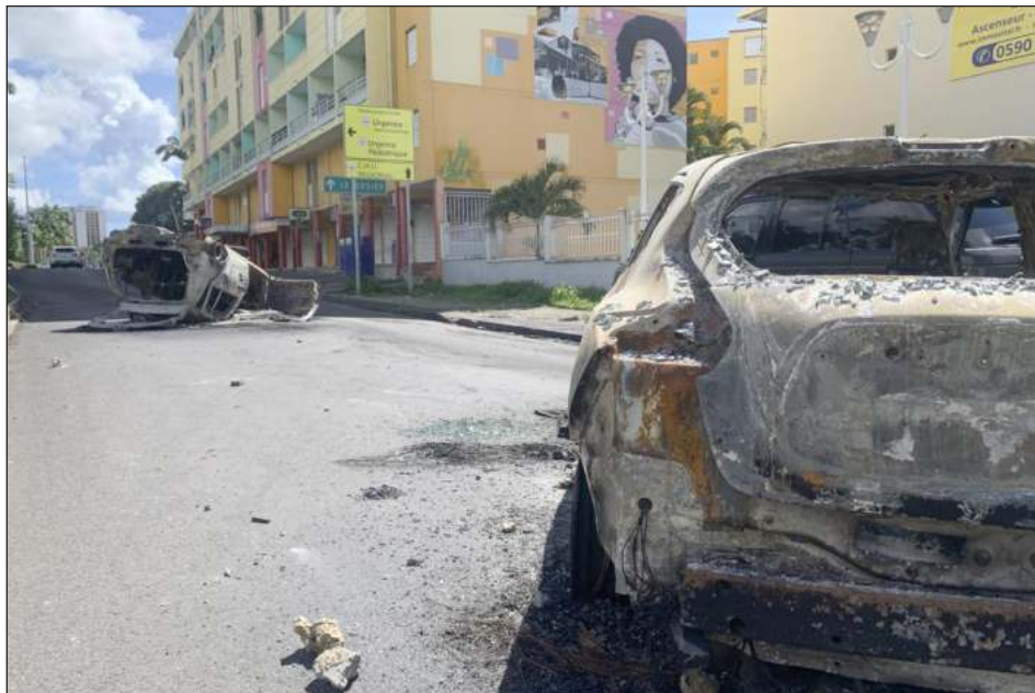
▲ La isla caribeña de Francia ha sido sacudida en los últimos días por una ola de protesta.

"Algunos funcionarios han hecho la pregunta sobre la autonomía", comentó