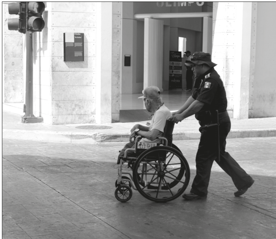
▲ Todo diciembre habrá concientización sobre la Discapacidad.