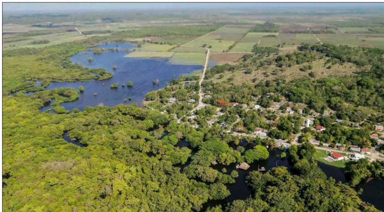
▲ La Geografía Aplicada está enfocada en la resolución de problemas socioambientales locales.

“La licenciatura se creó especialmente para Mérida