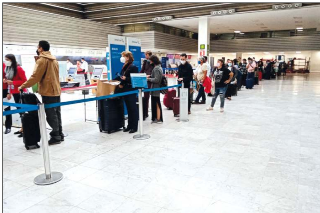
▲ En el Aeropuerto Internacional de la Ciudad de México se pasan por alto las más elementales precauciones para prevenir y detectar contagios.

Por ello, está claro que ómicron no debe tomarse como pretexto para hacer llamados a imponer restricciones de viaje o medidas francamente discriminatorias como las que se han vuelto comunes en otras latitudes; pero el pleno respeto a los derechos de nacionales y extranjeros tampoco puede justificar la temeraria laxitud en el AICM o en otras terminales aéreas, pues a estas alturas de la pandemia es sabido que la prevención y la responsabilidad son las primeras armas frente al coronavirus. Es en interés de todos los actores involucrados -gobierno, empresas y viajeros- proceder con prudencia a fin de evitar un recrudescimiento de la pandemia, con las indeseables consecuencias para la actividad económica y la vida cotidiana.