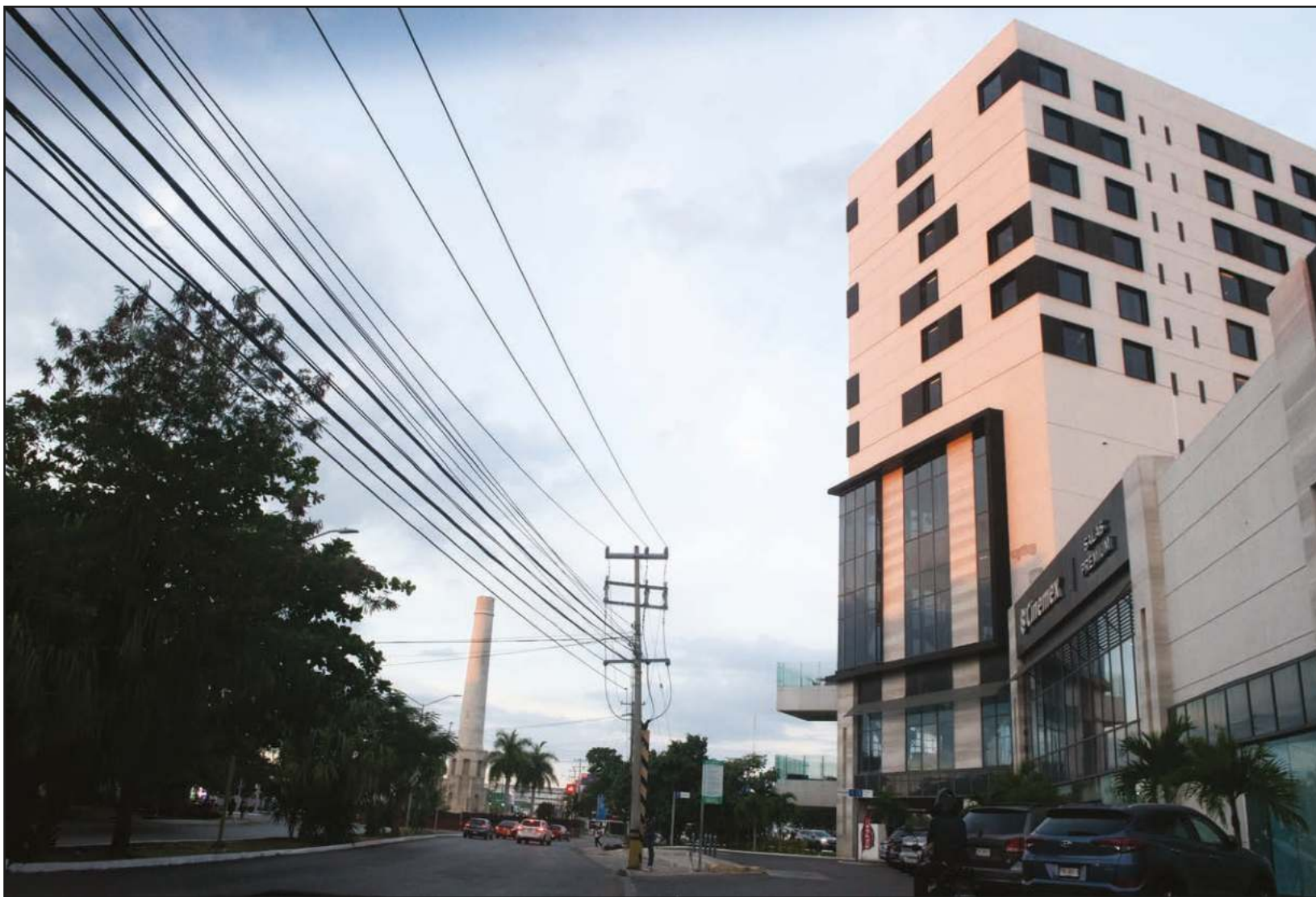
La construcción de esa zona también implicó el desplazamiento de quienes habitaban cerca de la zona principal de la colonia. Las casas con albarra se convirtieron en Home Depot, Oxxos, gasolineras. ▲

hueso”, es lo primero que dice cuando entramos a la sala de su casa. Vive en una residencial de Altabrisa desde hace 11 años, fue periodista por más de cuatro décadas y ha recorrido países y ciudades, los suficientes para concluir que Mérida es de las mejores ciudades para vivir en Latinoamérica.