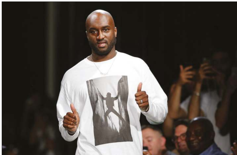
▲ En 2018, Abloh se convirtió en el primer director artístico afrodescendiente de ropa masculina en Louis Vuitton en la historia de la casa de diseño francesa.

Un comunicado de la familia de Abloh en la cuenta de Instagram del diseñador