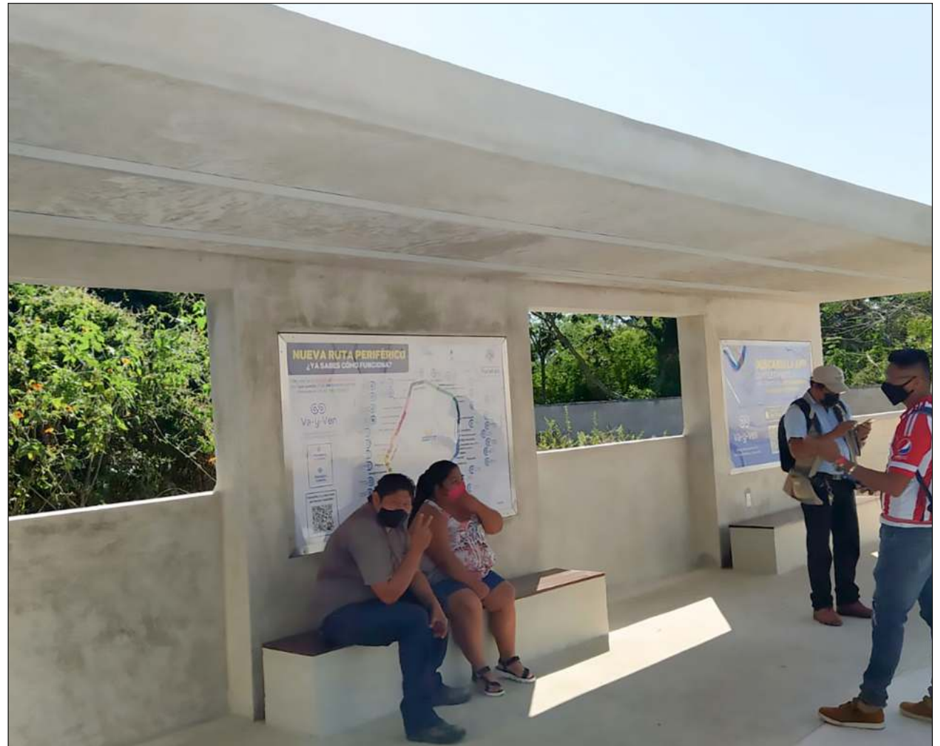
▲ Personas que antes no podían subirse a un camión, como quienes viven con alguna discapacidad, ahora pueden hacerlo y sin ningún problema.

Alrededor de las 10:15 de la mañana llego en mi bicicleta al paradero de Los Héroes para esperar al ca-