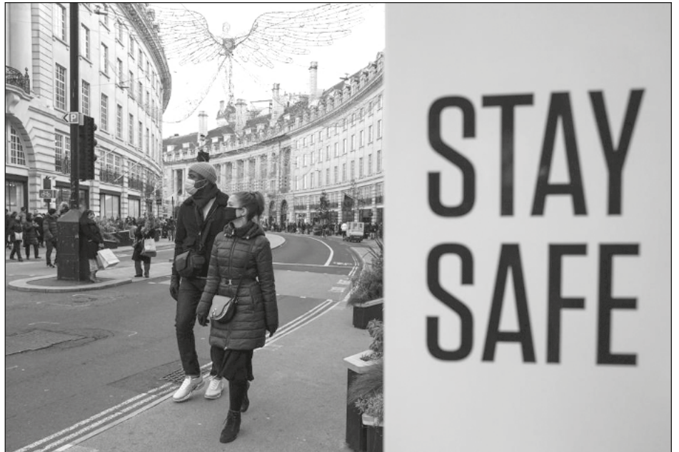
▲ La variante descubierta por investigadores sudafricanos es poco corriente y tiene un elevado número de mutaciones.