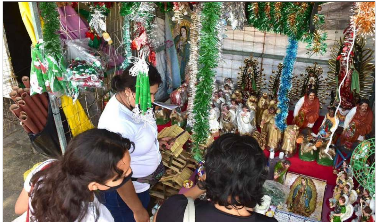
▲ Peregrinaciones, procesiones, las posadas y en general las fiestas decembrinas, son un riesgo sanitario, dado que pueden darse aglomeraciones.

Debido a la cercanía de las fiestas decembrinas, posadas y reuniones, pidió a la población responsabilidad, respeto y prevención, pues deben evitarse estas aglomeraciones constantemente o en su caso, cuidar