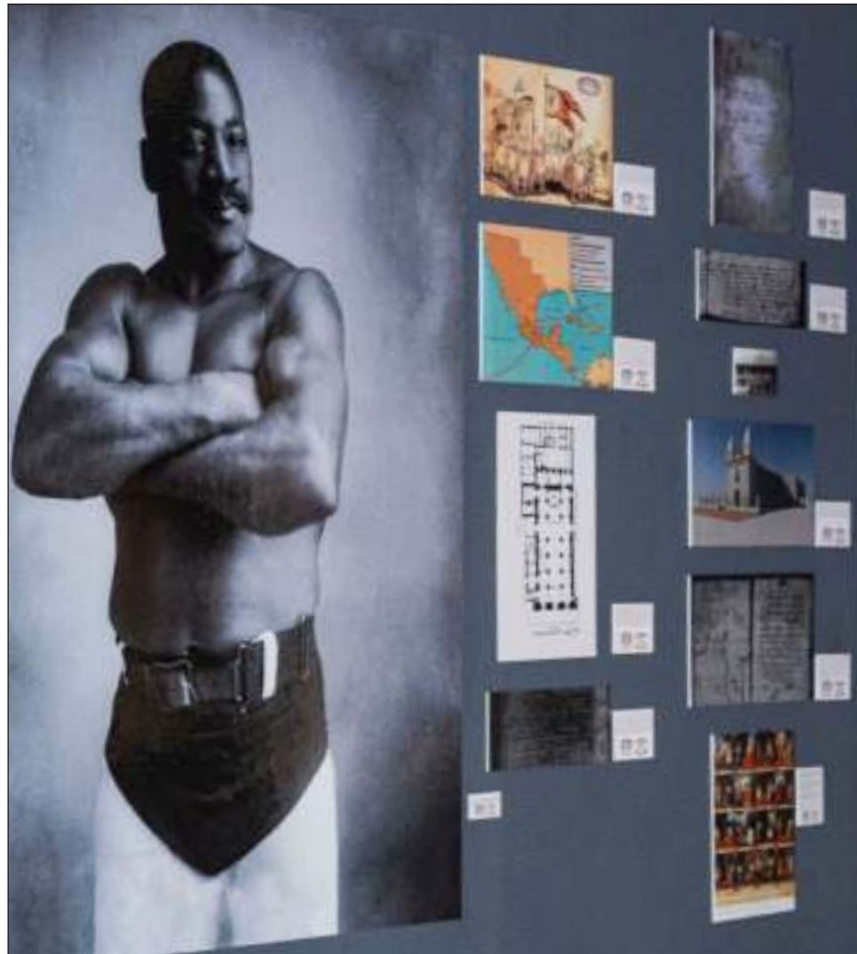
▲ Ninguna otra capital mexicana se ha atrevido a montar una exposición que visibilice la presencia de población afrodescendiente.

En México, explicó el doctor Victoria, al igual que en muchos otros países de Latinoamérica, estas poblaciones se han invisibilizado. En ese sentido, uno de los objetivos de la exposición es hacer visible a la negritud en espacios públicos y museísticos.