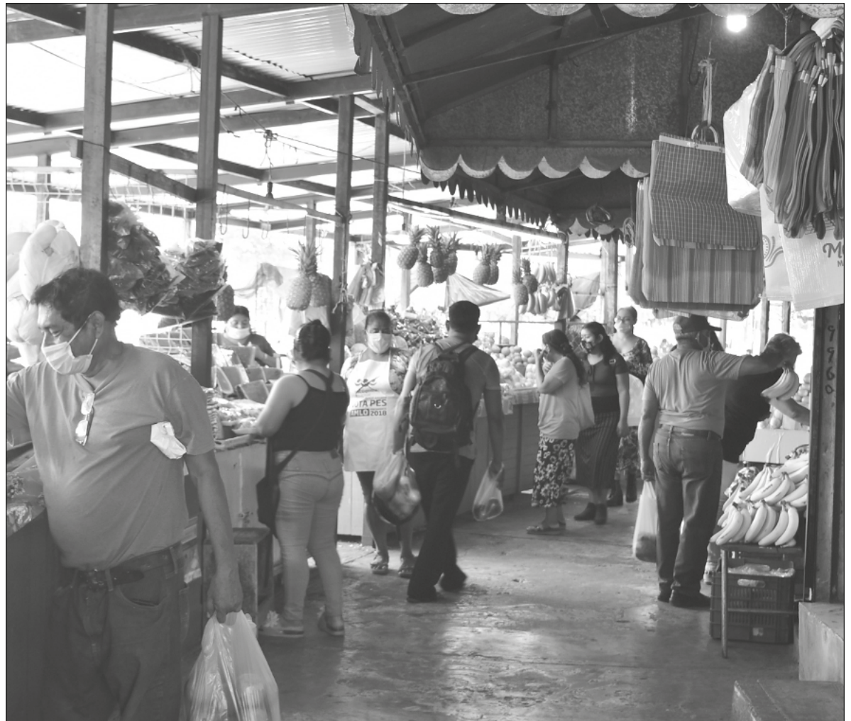
▲ El equipo Seguridad Alimentaria del ORGA trata de definir variables e indicadores que permitan analizar el vínculo entre posibles causas de la inseguridad alimentaria y la organización para contrarrestarla.

EN LOS HOGARES es donde se halla el núcleo que favorece el estudio de la seguridad alimentaria. La seguridad alimentaria