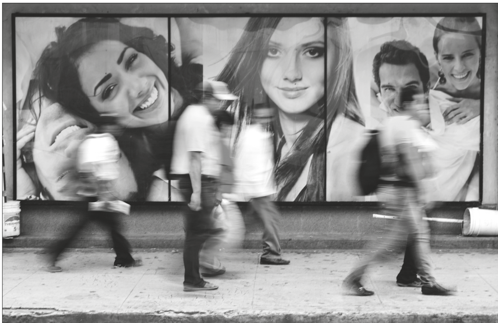
▲ Los mandatarios de Canadá, Estados Unidos y México acordaron dar aportaciones millonarias para el programa Sembrando Oportunidades , con lo que se espera beneficiar a 540 mil personas de Centroamérica y el sur de México.