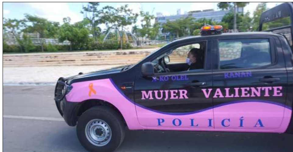
▲ Entre las medidas anunciadas está la creación del agrupamiento policial Zazil, que brindará atención prioritaria ante llamados de emergencia de mujeres.