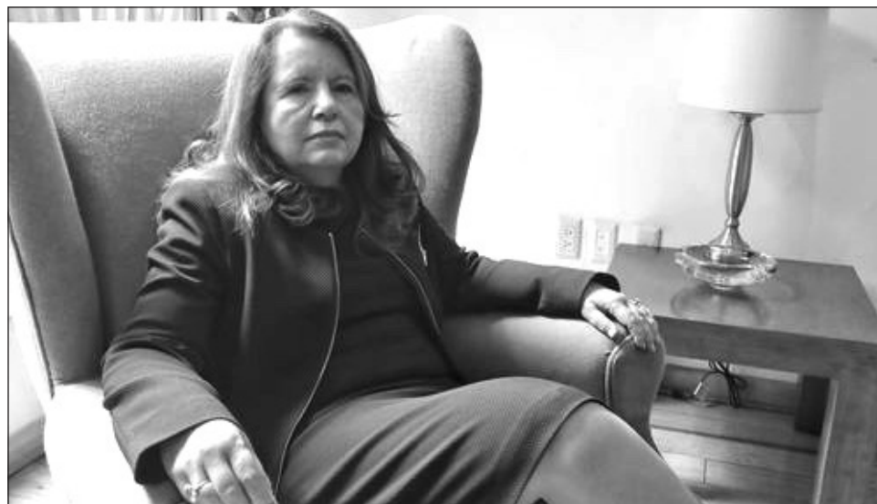
▲ La académica y jurista consideró que dependerá de quién suceda en la presidencia de la Suprema Corte a Arturo Zaldívar para que la reforma judicial pueda concretarse.

Entrevistada en su domicilio particular, precisó que desde hace 40 años es estudiosa de un tema que siempre le apasionó: la defensa de los derechos humanos, cuando aún ni se mencionaba siquiera ese concepto. Siendo una joven abogada, “fui al curso que imparte el Instituto Interamericano de Derechos Humanos, en San José, Costa Rica, y para mí fue muy significativo porque tomé conciencia de que no sólo en México, sino en todos los países de América Latina, se estaban padeciendo graves violaciones a las garantías fundamentales de los ciudadanos”.