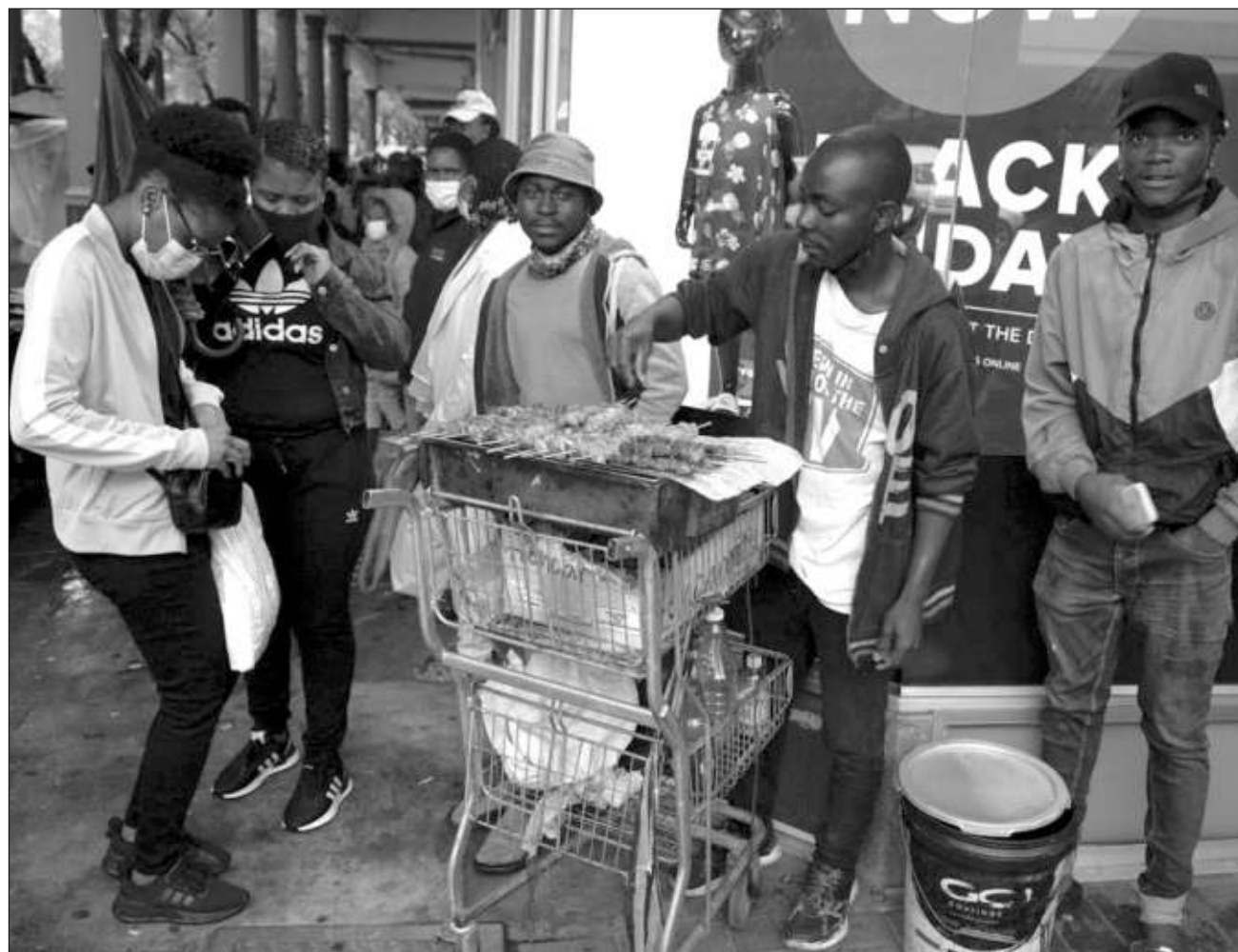
▲ La aparición de la variante omicron ha puesto en riesgo el avance contra el coronavirus en el país, pues sólo el 40 por ciento de la población local ha sido inmunizada completamente contra el virus.

Lo que parecía ser un brote entre universitarios en Pretoria derivó en cientos de nuevos casos primero, y luego miles, en la capital y