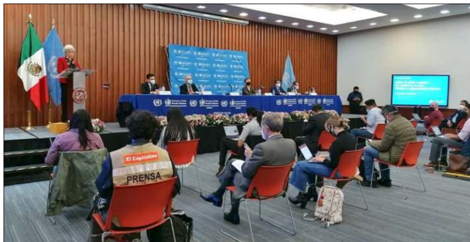
▲ Organizaciones que acompañan a familiares de desaparecidos coincidieron en que "hay que reaccionar muy positivo frente al pronunciamiento del CED", tras la visita de este organismo a México.