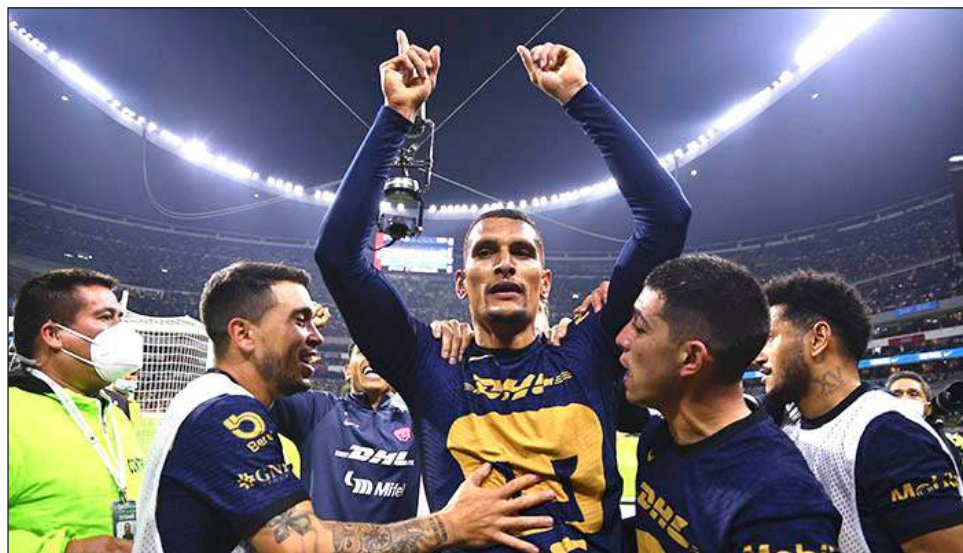
▲ Los Pumas eliminaron al líder América en el Azteca.

El club universitario despertó el tramo final de la fase regular del campeonato. Quedaron en la 11a. plaza de la tabla general y accedieron a la liguilla luego