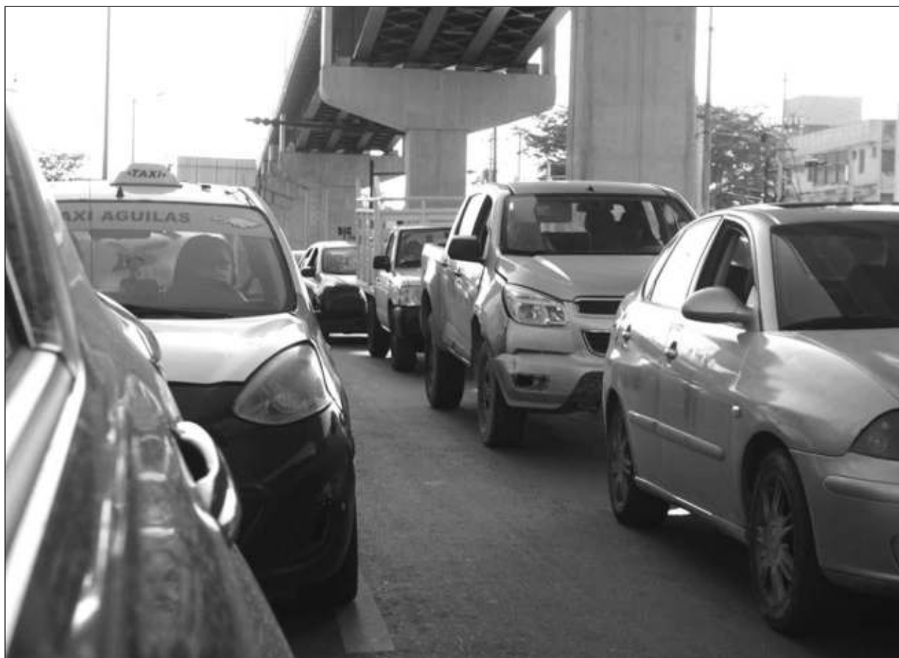
▲ El parque vehicular en Campeche es de 225 mil automóviles, pero sólo 100 mil de estos están dados de alta en el Repuve.