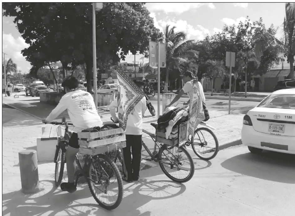
▲ Las autoridades eclesíásticas aseguraron que recibirán a los feligreses con todas las medidas higiénicas.

Destacó que en años anteriores han llegado más de cinco mil personas, pero para este año calculó alrededor de dos mil guadalupanos, así como feligreses que atestiguan esta tradición católica.