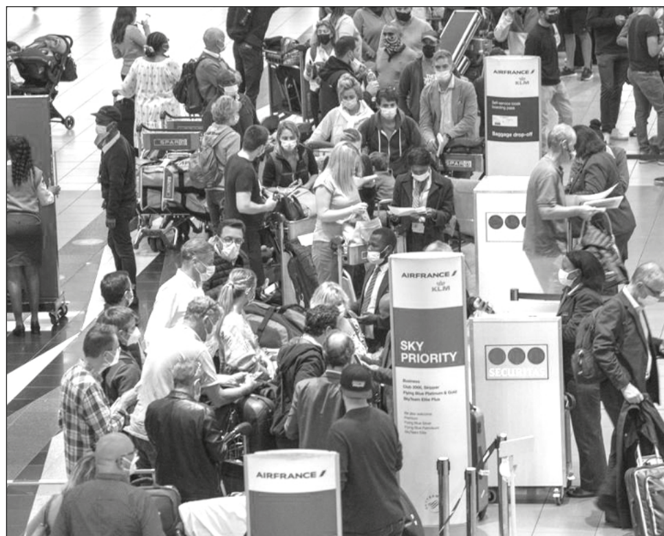
▲ Naciones de todo el mundo están imponiendo restricciones para frenar la propagación de la variante.

Si bien queda mucho por aprender sobre la nueva variante, a los investigadores les preocupa que pueda ser más resistente a las vacunas y podría significar que la pandemia durará más de lo previsto.