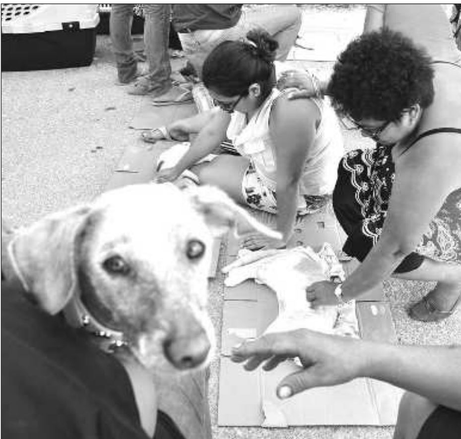
▲ Buscan disminuir la sobrepoblación entre animales domésticos.

Luego de la ceremonia eucarística en el estado universitario, la imagen de la Virgen del Carmen retornó por la calle 56, doblando sobre la calle 31, hasta llegar al Santuario Mariano Diocesano.