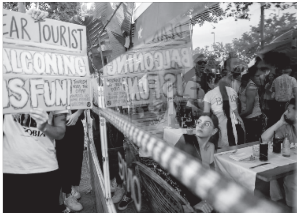
▲ “Estábamos cenando en un terraza y de repente fuimos objeto de gritos e insultos y nos lanzaron agua. Estaba claro que no éramos bienvenidos”, dijo un turista durante su estancia en Barcelona.

España se ha convertido en las últimas semanas en el centro neurálgico de la llamada turismofobia , que es en realidad una llamada de atención a las autoridades, a los sectores económicos involucrados en el sector y a la propia ciudadanía para