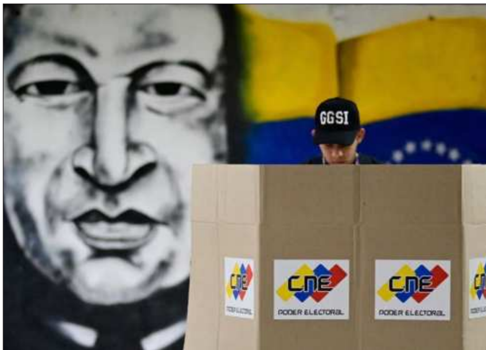
▲ Nadie va a llevar a Venezuela al caos. Yo soy Nicolás Maduro Moros, presidente-pueblo, y reconozco y reconoceré al árbitro electoral, los boletines oficiales y haré que se respeten”, dijo.

Aseguró que “funcionarios de Argentina, Costa Rica, Ecuador, Guatemala, Panamá, Paraguay, Perú, Uruguay y República Dominicana junto a un grupo de sicarios de ultraderecha especializados en desestabilizar gobiernos en América Latina como (los ex presidentes colombiano) Iván Duque, (argentino) Mauricio Macri, (colombiano) Andrés Pastrana, (costarricense) Óscar Arias, (los senadores estadounidenses republicanos Marco Rubio y Rick Scott pretenden desvirtuar lo que se ha expresado hoy en paz y