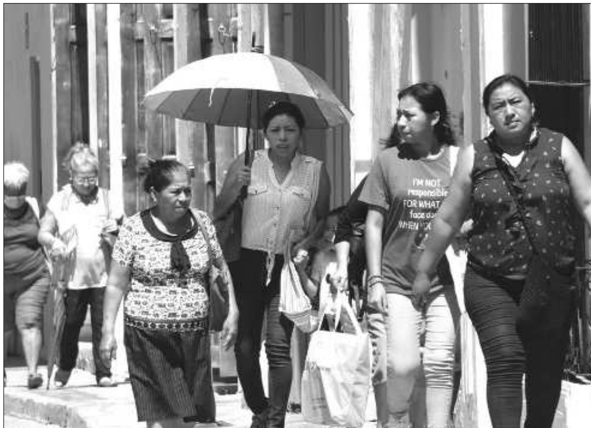
▲ "Algunos de sus logros fueron el incluir a mujeres cada vez más plurales y diversas, de distintas edades, corrientes ideológica y posiciones feministas que no se encuentran de forma regular en espacios de diálogo y diseño de políticas".

SU EJERCICIO SE fundamenta en el Plan Municipal de Desarrollo