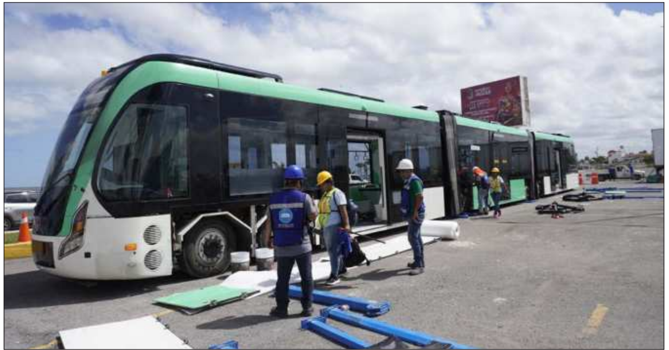
▲ Las unidades al traer llantas de caucho para su rodamiento, han causado polémica en los campechanos quienes manifestaron sus cuestionamientos sobre si es un tren ligero o un camión oruga, como los existentes en la Ciudad de México hace más de dos décadas.

Ya el sábado por la mañana, la mandataria le dio continuidad a dicha publicación, y volvió a postear en redes sociales que había llegado a Campeche el primer prototipo del Tren Ligero, compuesto por tres carros vagones y estará exhibido en el Centro de Convenciones Campeche XXI. Esto a vísperas de su Tercer Informe de Gobierno, en el mismo recinto, el próximo 1 de agosto.