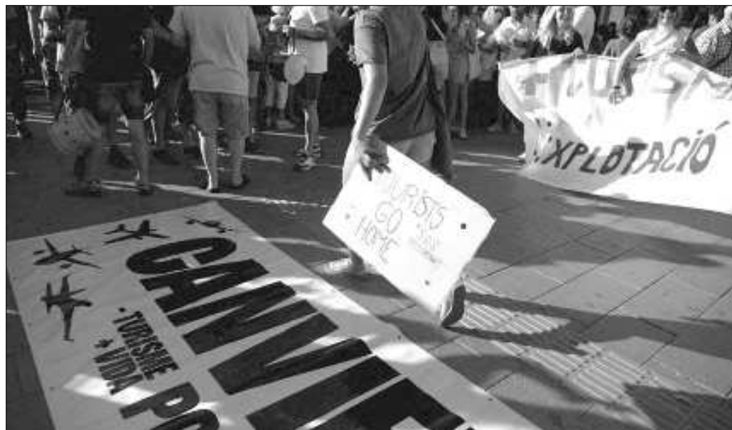
▲ Lo que ocultan los patrones es que tales beneficios son acaparados por un puñado de individuos adinerados, mientras que el grueso de la población padece los efectos nocivos de la "turistificación".

Por ello, sería necio llamar a que se cierren los flujos de viajeros, pero estos hechos no pueden usarse para negligir los profundos cambios que requiere el sector a fin de que el disfrute de los visitantes no se convierta en tragedia para los residentes, y de que las pingües ganancias dejadas por los turistas lleguen a los trabajadores que los atienden durante su estancia.