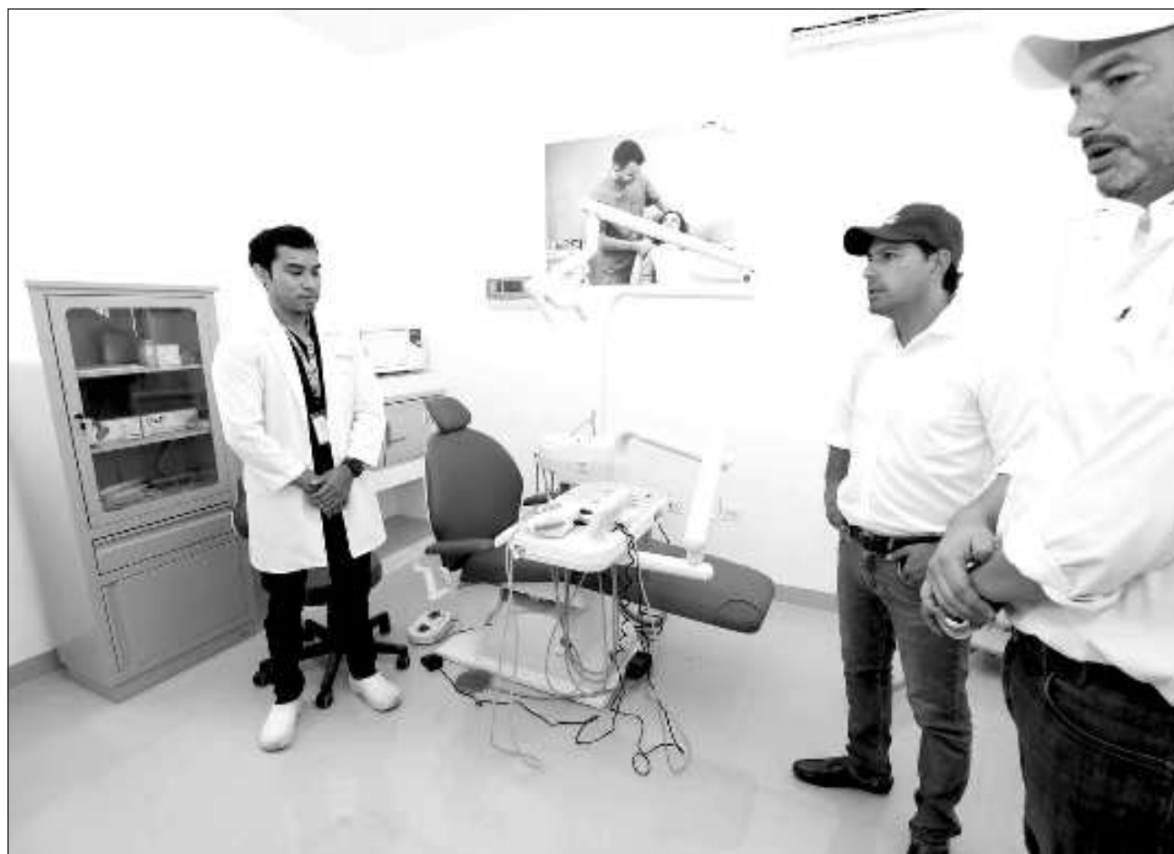
▲ El Centro de Salud de Nohbec contará con servicios como ultrasonido gratuito, examen de laboratorio, atención dental y psicológica, así como con un médico que estará disponible 24 horas, seis días de la semana.

En la comisaría de Nohbec, y junto al titular de la Secretaría de Salud de Yucatán (SSY), Mauricio Sauri Vivas, Vila Dosal cortó el listón inaugural y supervisó los trabajos de remodelación y rehabilitación efectuados en el Centro de Salud de esta localidad ubicada al sur del estado y al dirigir su mensaje, se dijo contento de poder visitar y agradecer a los pobladores de todas las comunidades, incluidas las más alejadas, por su confianza y trabajo en equipo para lograr la transformación histórica de la entidad.