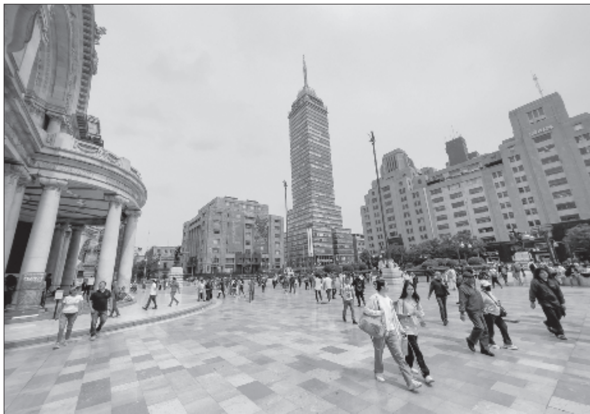
▲ La canción "nos pone a caminar por las calles de 5 de mayo, por Reforma, por la avenida Juárez; por Coyoacán, por La Merced, por Niño Perdido, por Tepito y La Lagunilla. El rehilete gira y nos muestra todos los colores y olores de México: los colores brillantes y los turbios, los aromas y los tufos, las formas diversas de ganarse la vida".

Mi ciudad , fruto magno de ese diálogo emprendido por Trigo, es