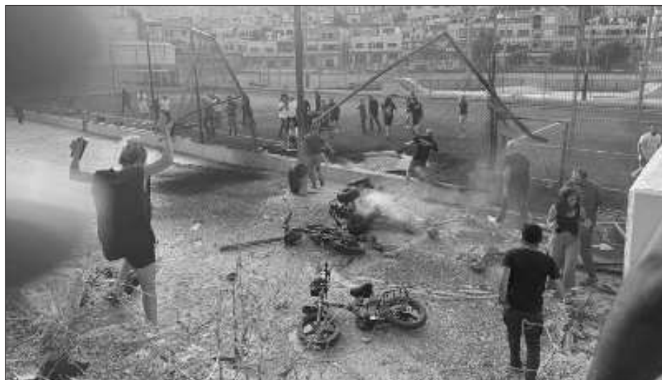
▲ Bombardeo lanzado desde Líbano e imputado a Hezbollah que dejó 12 muertos en la zona anexada de los Altos del Golán, atiza el temor a una conflagración regional derivada de la guerra en Gaza.

Hezbollah, que niega su responsabilidad en el bombardeo, “evacuó algunas posiciones” en el sur de Líbano y en el valle de Becá que teme que