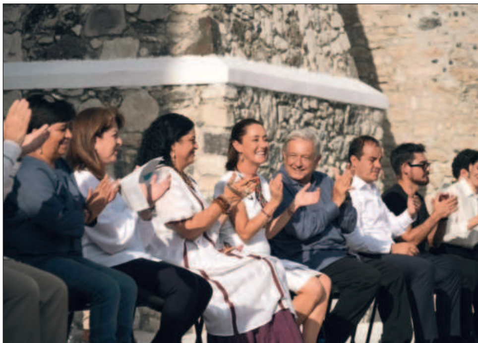
▲ El presidente López Obrador puntualizó que Claudia Sheinbaum es “una mujer con muchas convicciones, tiene experiencia, es honesta y le va a dar como se ha comprometido, además por convicción, continuidad a la cuarta transformación de la vida pública de México”.

Y es que, cada palabra de los ponentes, este conjunto se daba vuelo con las notas de fanfarria, en un duelo que sostuvieron con otros que a unos metros sacaban las matracas y las trompetas.