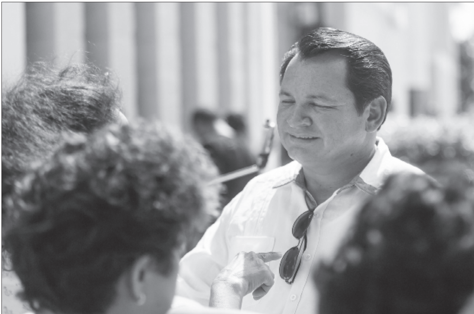
▲ "Quizá en otros tiempos, la granja daba para más , pero ahora, la naturaleza está pasando las facturas de nuestros abusos: no podemos permitir que las inmobiliarias sigan arrasando con nuestros árboles, las industrias contaminen nuestra agua, la ausencia de planeación atropelle nuestra armonía humana".