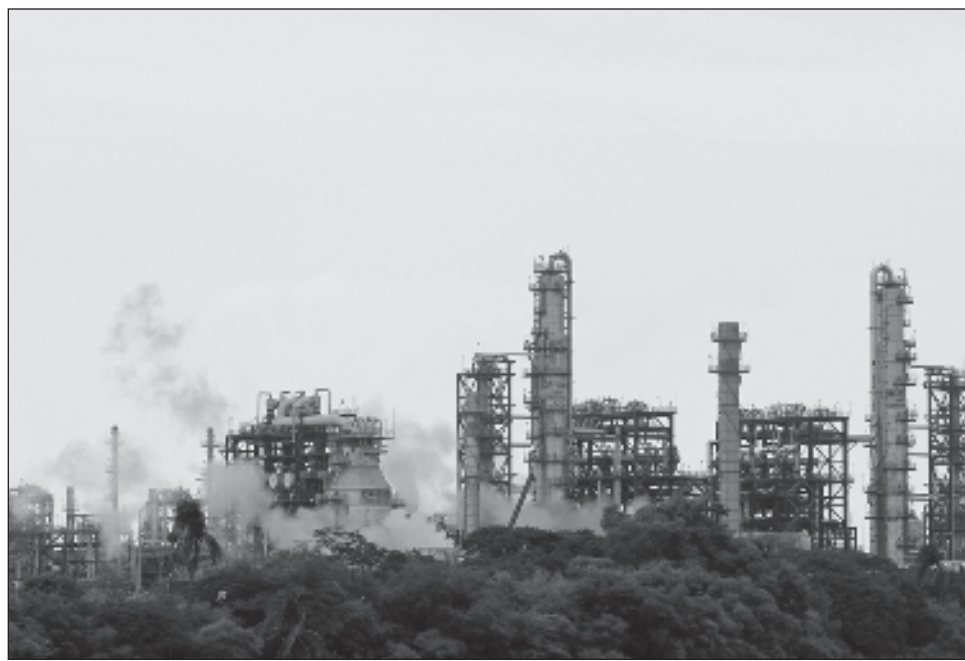
▲ Para Pemex, en la medida que se contabilice e incremente el proceso hasta su plena capacidad en la refinería Olmeca y se capturen las eficiencias de las coquizadoras en construcción en Tula y Salina Cruz, “se convergerá a la auto suficiencia nacional en materia de combustibles”.

“Si añadimos la actividad de Deer Park, el promedio escalaría más de 1.4 millones de barriles. La escena es muy distinta (al