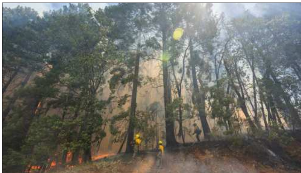
▲ Las autoridades emitieron órdenes de evacuación para unas 4 mil personas, en tanto otros cientos están bajo advertencia y podrían tener que abandonar sus hogares.

Las llamas se encendieron la tarde del miércoles cerca de la localidad