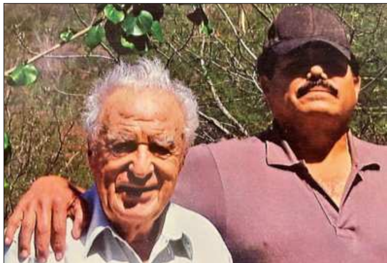
▲ "La crónica de su encuentro con El Mayo Zambada publicada en Proceso (2010), no está incluida en el tomo".

A continuación se presentan las pruebas de esta interpretación, en forma cronológica, escritas por este singular reportero que inhaló el plomo del crisol donde se fun-