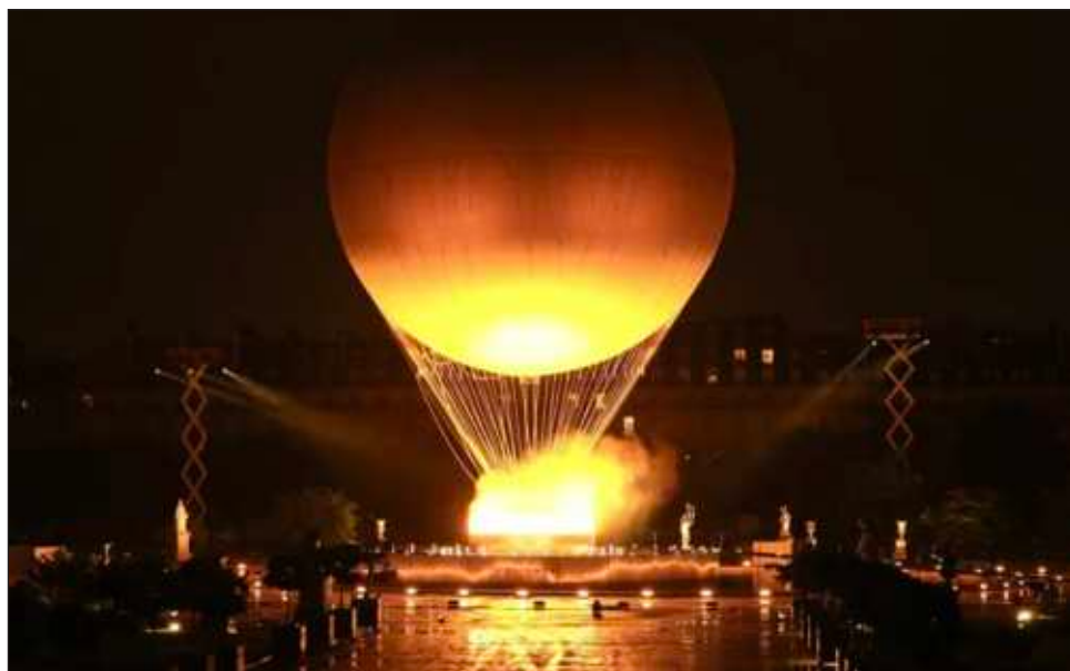
▲ El fuego olímpico es colgado en un globo aerostático tras ser encendido durante la ceremonia de inauguración, que tuvo como eje temático la diversidad de Francia.

El pretencioso espectáculo de casi cuatro horas se desarrolló casi en su totalidad bajo un aguacero, algo que no sucedía desde hace 70 años. De todos modos, el clima adverso no desanimó a los atletas que debieron protegerse con paraguas e impermeables al surcar en embarcaciones las aguas picadas del Sena, una muestra de la tenacidad de la ciudad durante un día que comenzó con un presunto sabotaje a la red ferroviaria de alta velocidad de Francia. "La lluvia no podrá pararnos", declaró LeBron James, el astro estadounidense de básquetbol, cu-