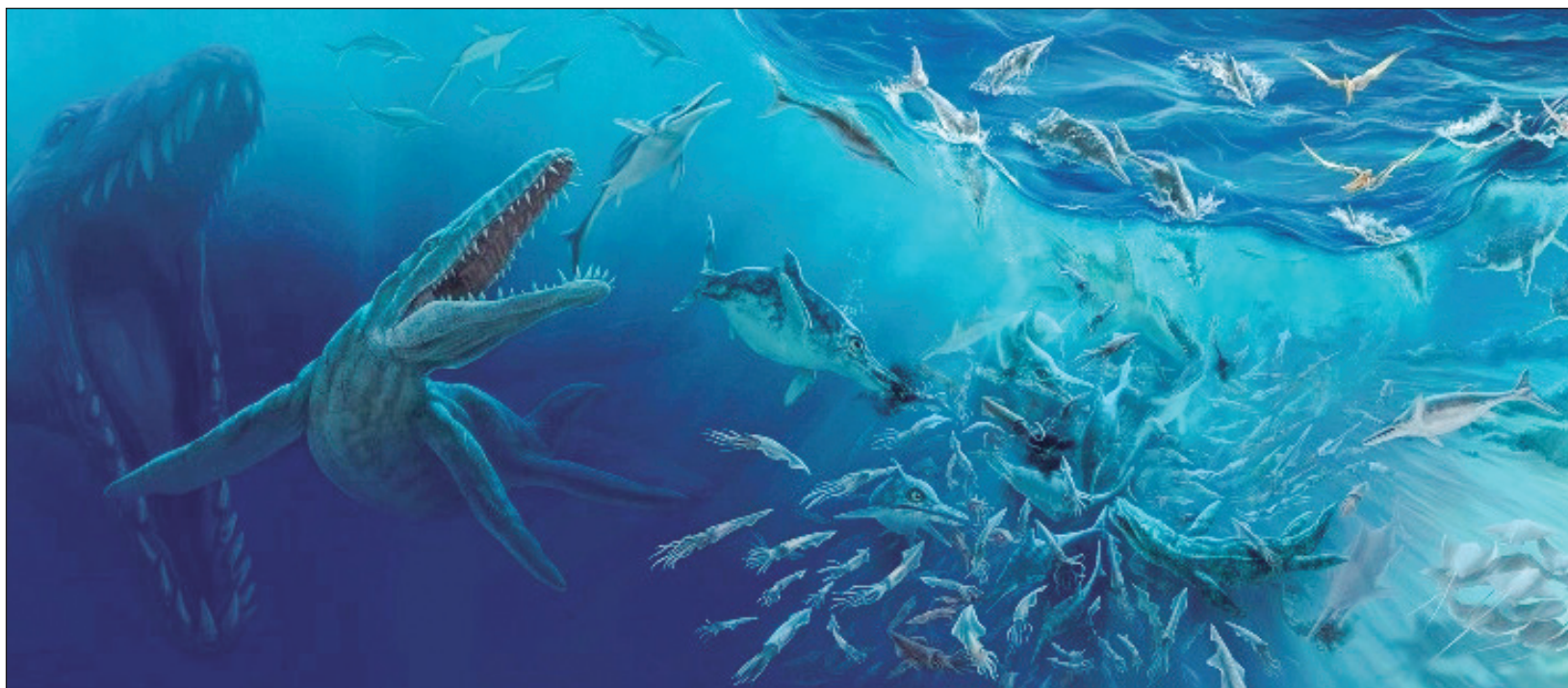
▲ Los retos de los ilustradores científicos van desde documentar especies en peligro de extinción, comunicar los impactos de la alteración en los hábitats, familiarizarse con nuevas herramientas para agilizar su labor y desarrollar la capacidad de equilibrar la precisión científica con la innovación tecnológica.