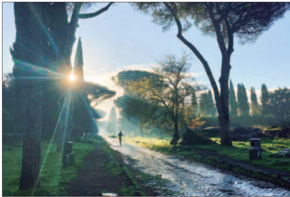
▲ La Unesco también agregó al listado el lugar donde ocurrió una masacre en tiempos del apartheid y un pueblo donde creció Nelson Mandela, entre otros sitios sudafricanos claves en la lucha que terminó con la dominación de la minoría blanca de la región.

La Unesco también agregó al listado el lugar donde ocurrió una masacre en tiempos