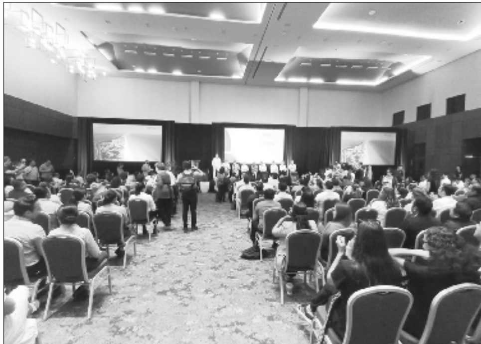
▲ El perfil de turistas en el segmento de grupos y convenciones también ha cambiado, pues ahora la balanza se inclina hacia dos temas: incentivos y wellness .

Este grupo hotelero mantiene un promedio anual de 80 por ciento de ocupación tan sólo en ese segmento, lo que significa cerca de 700 eventos, de los cuales 60 por ciento son internacionales y 40 por ciento nacionales.