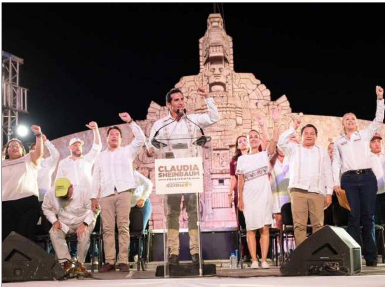
▲ El candidato de Sigamos Haciendo Historia destacó que su campaña fue satisfactoria y sus encuentros con los sectores de la sociedad le permitieron diseñar una agenda de trabajo que responderá las necesidades de la gente.