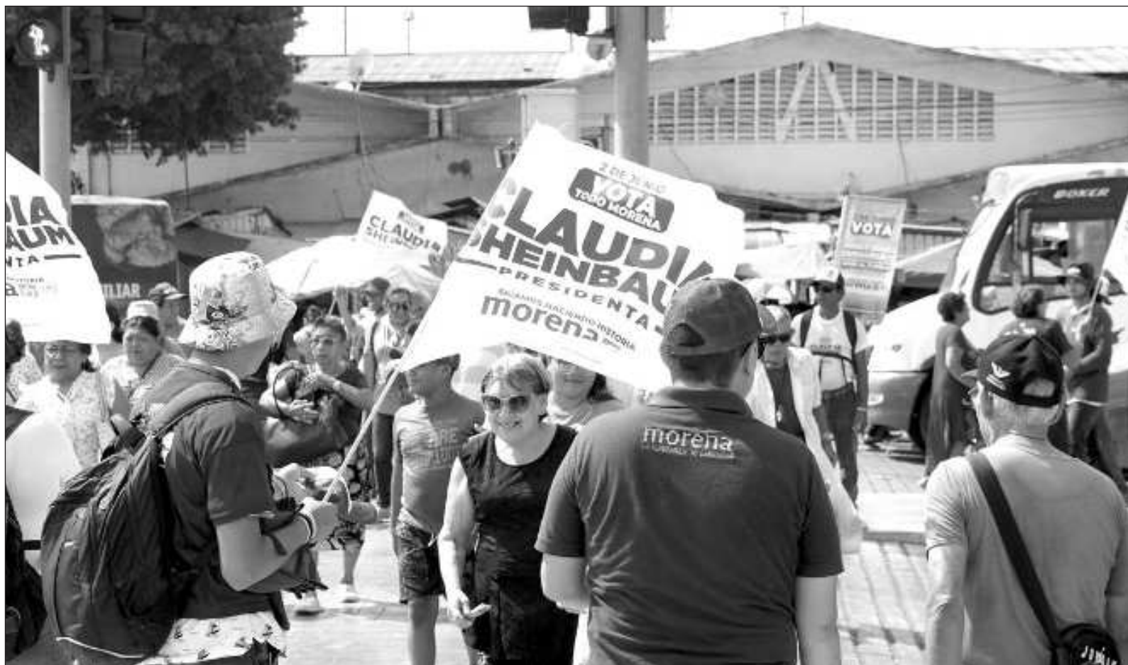
▲ “Los mexicanos merecemos más que una manada de mercenarios; los militantes de los partidos, en específico, se merecen aún más: no sólo son destino, son, principalmente, origen. Cuántos fueron relegados por los recién llegados; cuántos, hechos a un lado, obligados a tragarse agravios”.