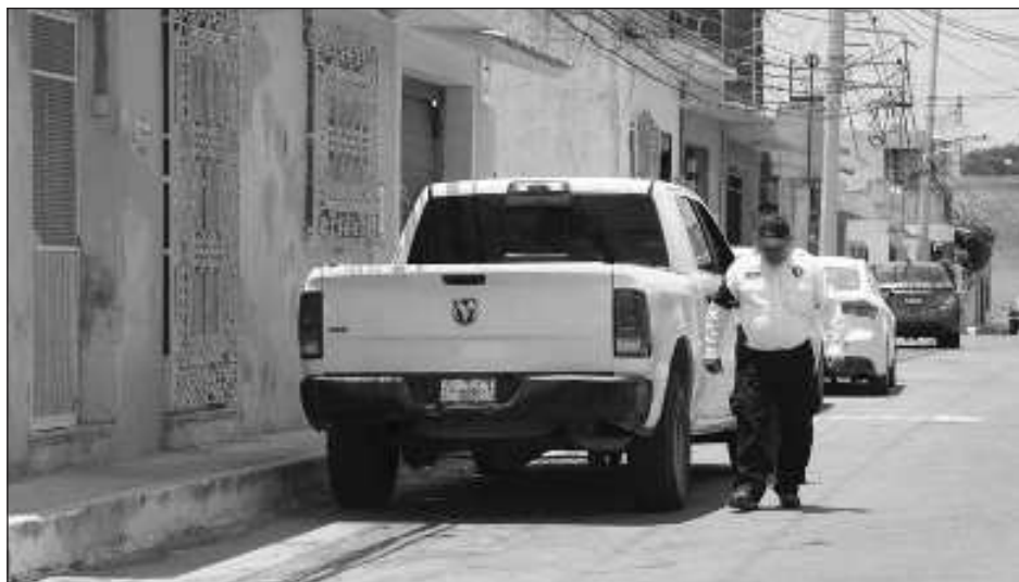
▲ Recientemente, se registró la ejecución de un hombre en el Malecón Costero; de igual forma una pareja fue agredida a tiros en el estacionamiento del hotel Linnos.

"Sin embargo, la delincuencia los confronta con la realidad, ya que hemos