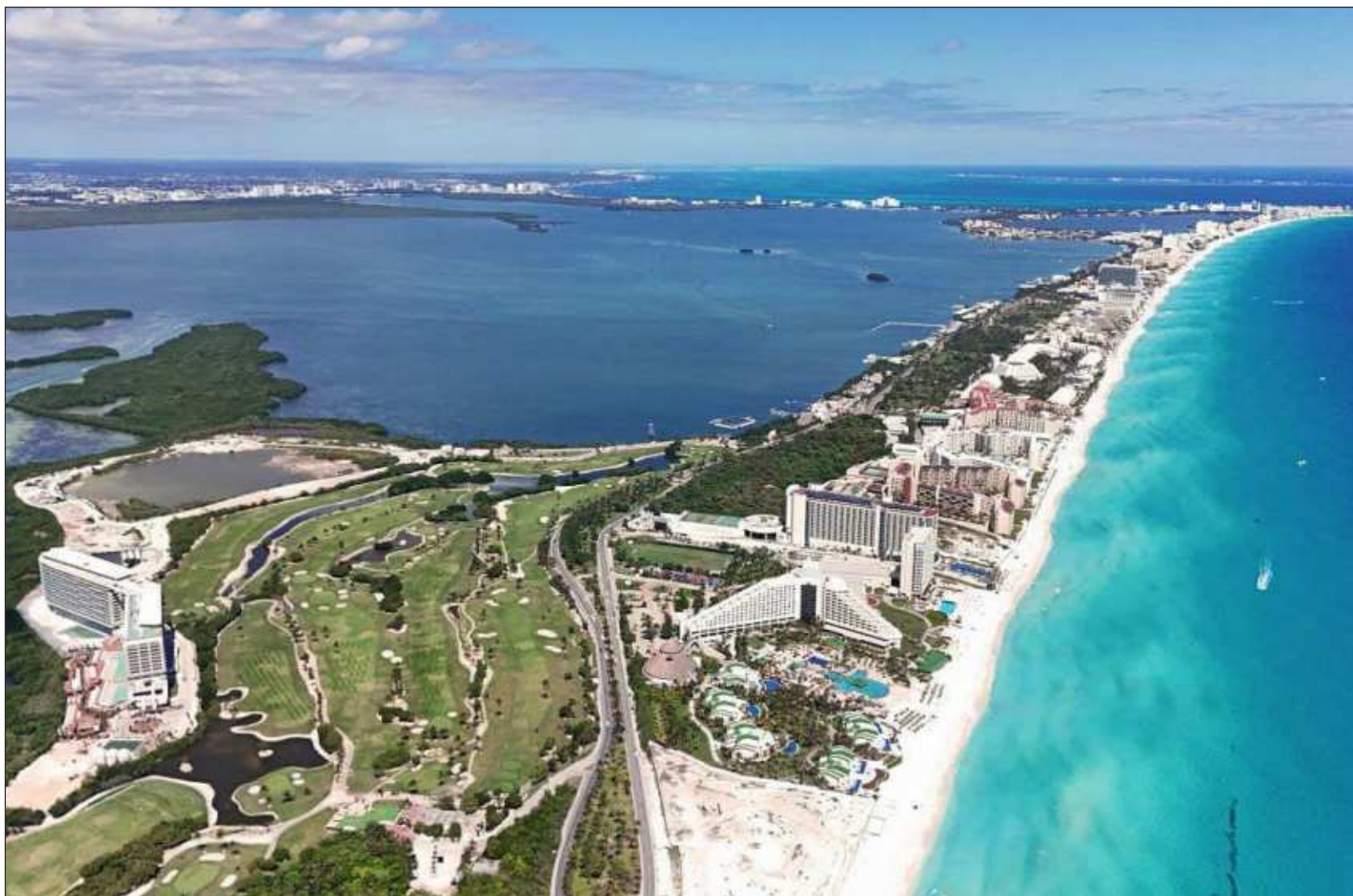
▲ El estado de Quintana Roo logró captar 74 millones de dólares, el equivalente a 15.8 por ciento del total de IEDT.

A su vez, de acuerdo con Organización de las Naciones Unidas (ONU) Turismo, antes OMT, en 2023 México se ubicó en el sexto lugar mundial en cuanto a número de proyectos de IEDT, con 105 proyectos.