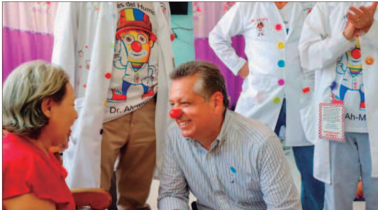
▲ El alcalde visitó la residencia de personas mayores San Nicolás de Bari A.C., en donde los voluntarios expresaron que involucrarse en acciones de ayuda a los demás aumenta su felicidad y les da un mayor sentido a su labor realizada.

“Esta plataforma nació en una de las peores circunstancias por las que ha atravesado el mundo, y hoy podemos asegurar que somos un ejemplo de cómo po-