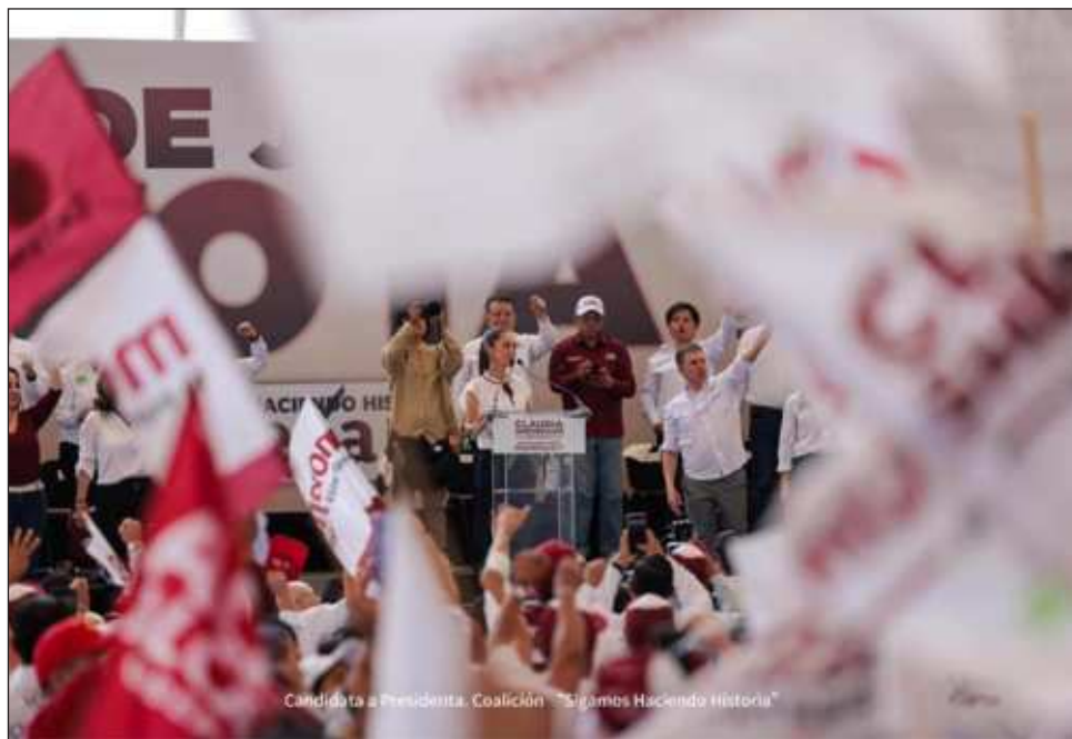
▲ El grito de “fuera el PAN, fuera el PAN”, inundó el Velaria de la Feria, donde hoy se llevó a cabo el penúltimo mitin de la candidata en los estados.

Ricardo Sheffield, candidato al Senado, resaltó que el estado “sufrir las consecuencias de gobiernos que nos metieron en una crisis de violencia, desigualdad y po-