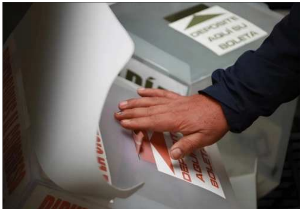
▲ El mandatario explicó que su administración sólo da facilidades para que en estas sedes diplomáticas puedan instalarse sitios para que los mexicanos en el extranjero puedan ejercer su voto.

"Nosotros estamos dando facilidades, pero no van a estar los funcionarios del Servicio Exterior no va haber consulado para que no se malinterprete es nada más para que sepan que va haber casillas, ahí se puede votar, pero quienes van a estar a cargo del proceso son funcionarios del INE, no tiene nada que ver el gobierno y en este caso del Servicio Exterior", apuntó.