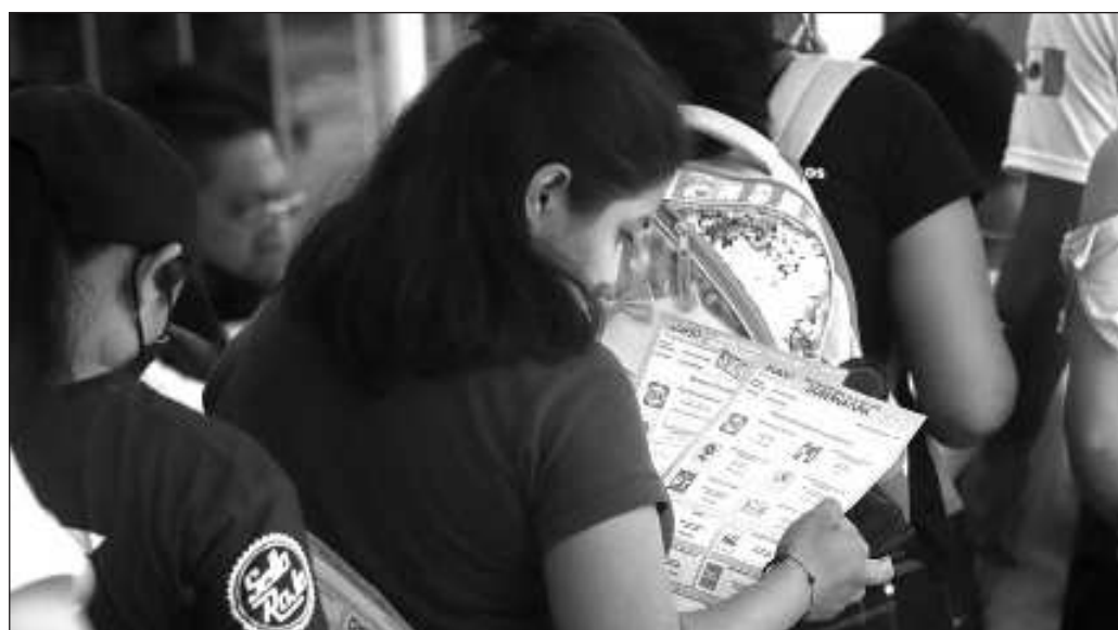
▲ El primer paso para llegar a esa democracia es acudir a la cita con las urnas, votar libremente, incluso si se acepta la despensa, el monedero o el efectivo.

El primer paso para llegar a esa democracia es acudir a la cita con las urnas, votar libremente, incluso si se acepta la despensa, el monedero o el efectivo. La participación es el ingrediente que concede legitimidad a quienes resulten electos, y al mismo tiempo inhibe cualquier intento de presión para controlar el voto; en fin, es la clave para alejar a los mapaches.