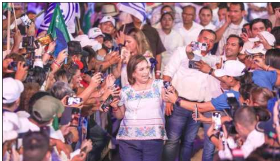
▲ Xóchitl Gálvez visitó la ciudad de Mérida para participar en el cierre de campaña de Cecilia Patrón Laviada, candidata a la presidencia municipal de la capital yucateca, y Renán Barrera Concha, candidato a la gubernatura de Yucatán.

En el encuentro con simpatizantes, Xóchitl Gálvez aseguró que Yucatán será prioridad para su gobierno y se encargará de proporcionar los recursos para que Renán Barrera y Cecilia Patrón cumplan sus compromisos con la ciudadanía.