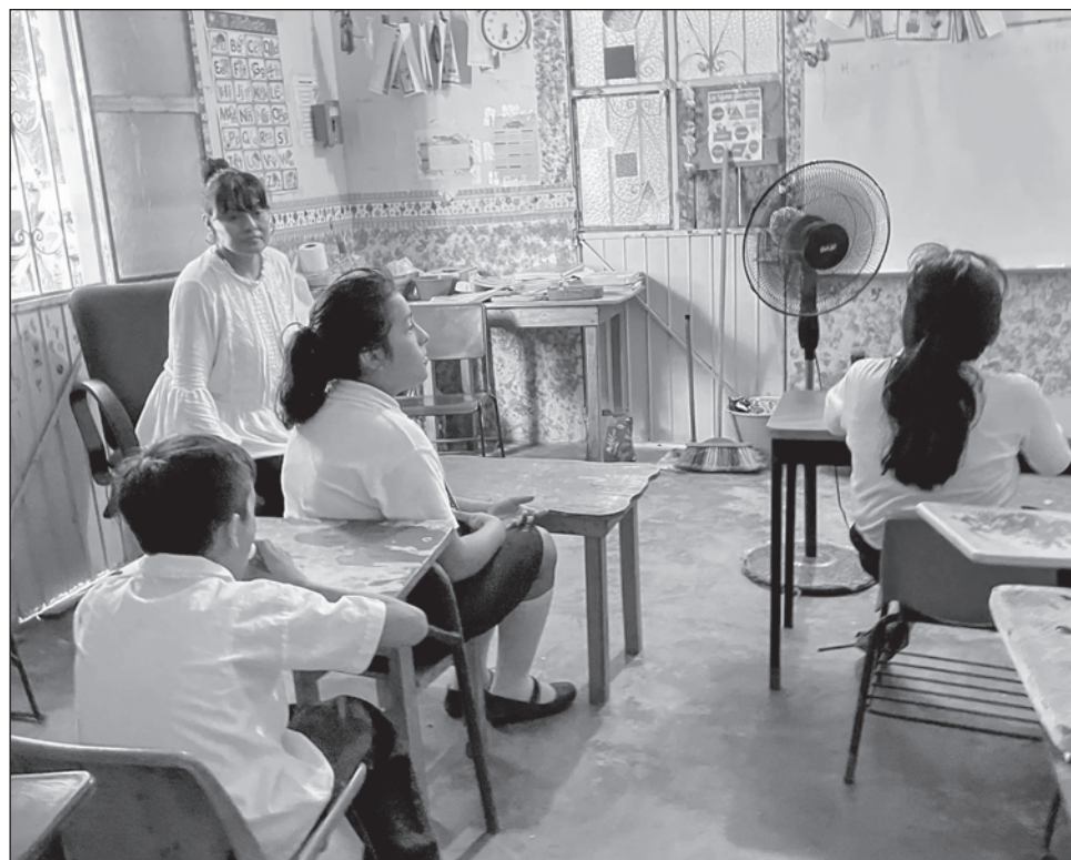
▲ Las clases podrán ser en línea o bien los alumnos podrán llevar a casa tareas a desarrollar, dijo la Secretaría de Educación estatal de Coahuila, en un comunicado.

"A partir del lunes 24 de junio y hasta el término del presente ciclo escolar los centros educativos de sostenimiento público de educación básica deberán iniciar con educación en casa, ya