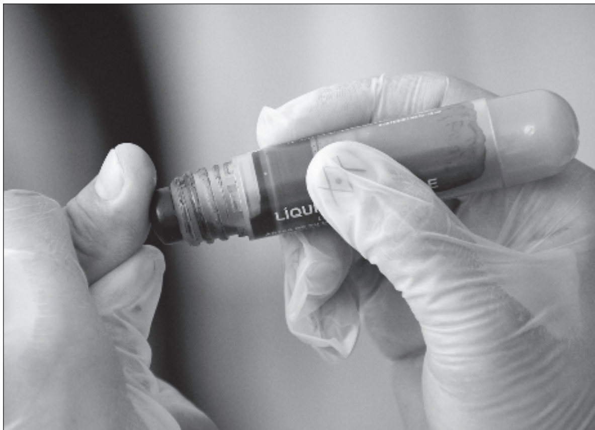
▲ “Un empresario (...) no tendría por qué pretender que le toca inducir a sus trabajadores a votar”.

El mensaje de marras resulta reprobable por varias razones. Para empezar, un empresario o empresaria, demócrata o no, no tendría por qué pretender que le toca inducir a sus trabajadores, garrote y zanahoria en mano, a votar de la manera que él o ella considera correcto. El voto democrático es individual, libre y secreto. Si se pretende un voto corporativo, obligatorio, e inducido, es cualquier cosa menos democrático. Es cierto que los partidos convencionales (y Morena, que, en realidad, tras el disfraz de movimiento social, mal esconde a un partido que podría haber salido del mismo molde que todos los demás) siempre han comprado