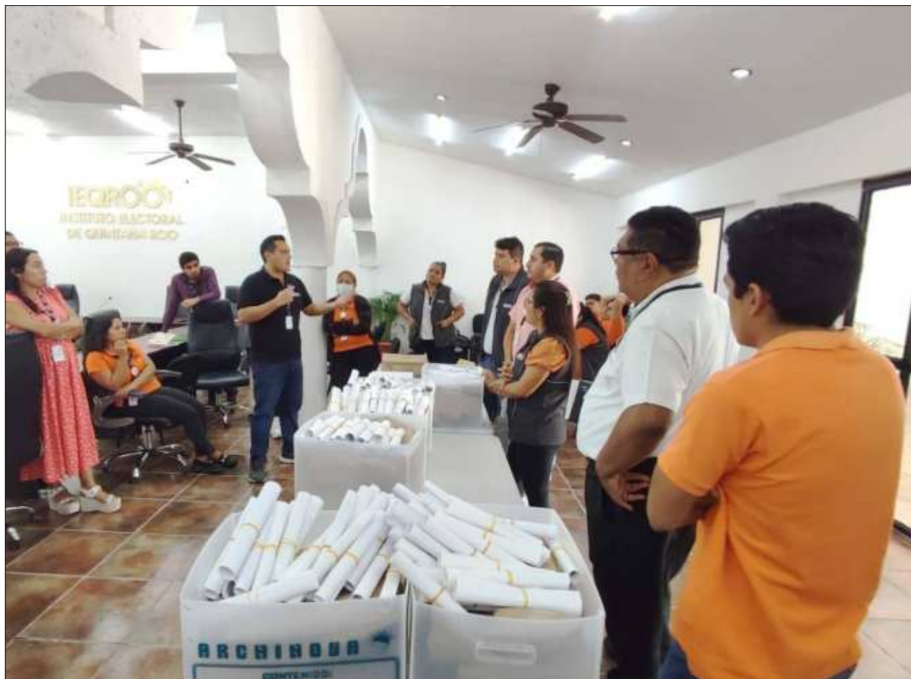
▲ De acuerdo con el último corte del 15 de abril del año en curso, se requieren de 718 ciudadanos para ocupar dichos cargos y hasta el momento hay 661 personas aspirantes que presentaron examen y tienen derecho a entrevista.

Cabe destacar que el periodo de contratación inicial era del 18 de marzo al 6 de abril, pero ante la