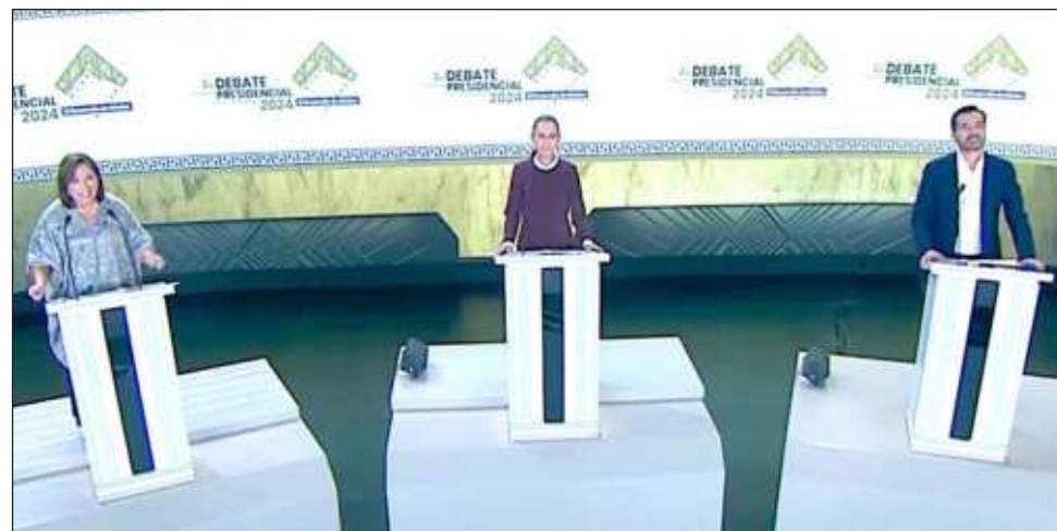
▲ El domingo se llevó a cabo el segundo debate presidencial, el cual resultó casi una calca del primero al predominar las acusaciones y reproches entre Sheinbaum y Gálvez

Gálvez denunció que “la candidata de las mentiras, donde aplicó la austeridad fue en los sistemas de agua”, además de retomar que “en el pasado debate le pregunté a la candidata de las mentiras que si su fami-