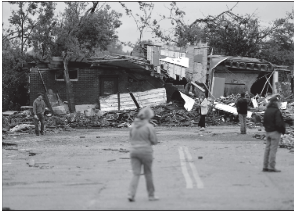
▲ “¿Cómo se reconstruye? Esto es una devastación total”, señaló una residente de Sulphur, y agregó que “es una locura, quieres ayudar, pero ¿por dónde empiezas?”.

Agregó que unas 30 personas resultaron heridas en Sulphur, incluidos algunos que estaban en un bar cuando azotó el tornado. Los hospitales de todo el estado informaron alrededor de 100 heridos, entre ellas algunas víctimas con aparentes cortes