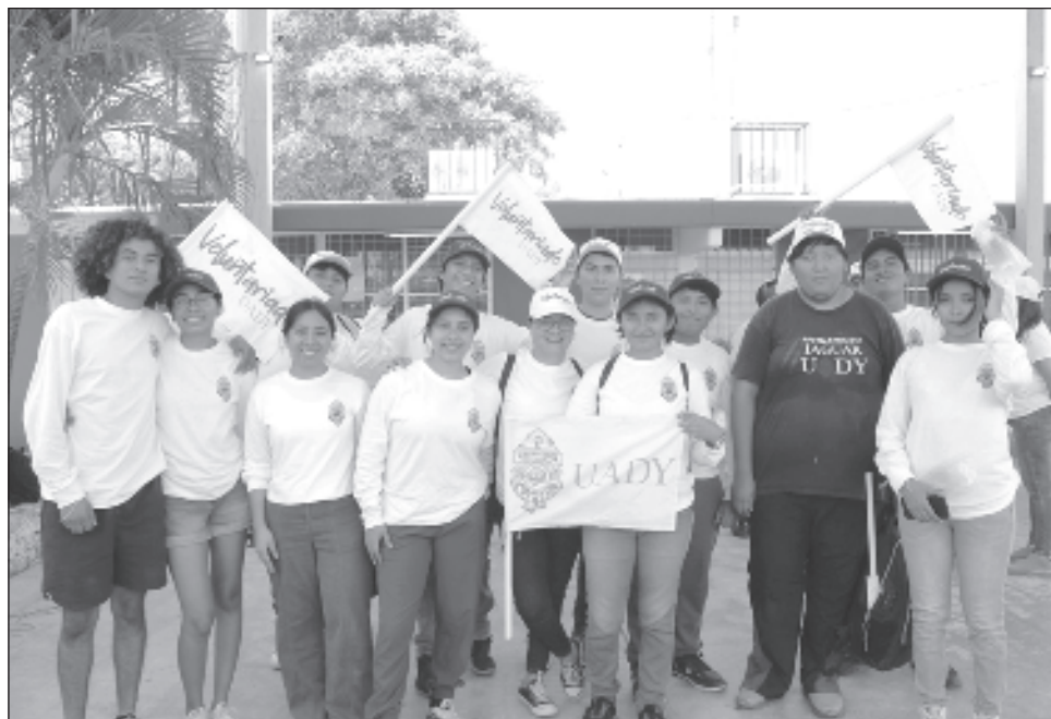
▲ La jornada en la Reserva Ecológica Cuxtal contó con la participación de 70 jóvenes voluntarios provenientes de distintas instituciones de educación superior.

Desde que surgió en 2020, la red Mérida nos une ha sumado hasta la fecha más de