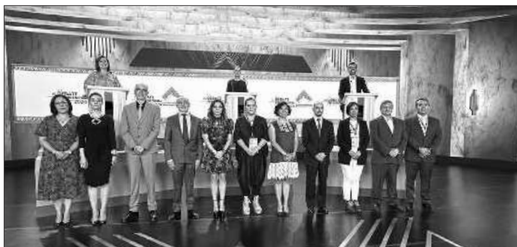
▲ Tal pareciera que el resultado ya está dado y las encuestas ya dan una ganadora anticipada pero, como reza el lugar común, la encuesta que cuenta es la del próximo 2 de junio.

A un mes de que concluyan las campañas, el panorama es de intensificación de actividades en los estados y municipios. La apuesta está ahora en la presencia en el territorio, pero especialmente en la presentación de planes de gobierno y en cómo realizar cada acción propuesta. Será el bombardeo propagandístico, y posiblemente el aturdimiento de la conciencia ciudadana.