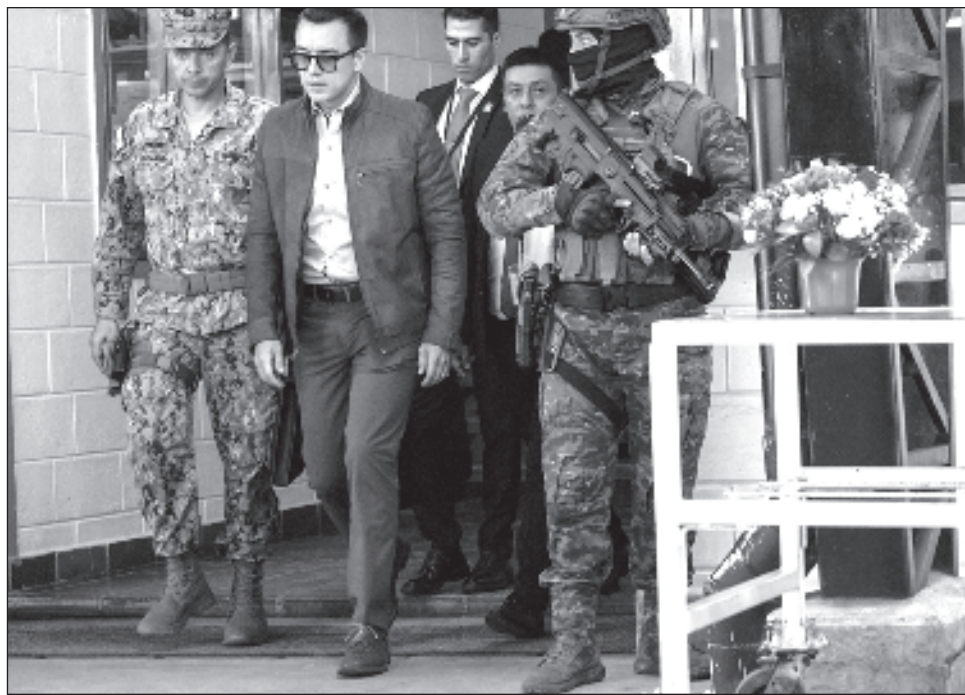
▲ La FGR está dotada para investigar, perseguir, procesar y sancionar a responsables de crímenes tipificados en el Código Federal y en instrumentos aplicables del Derecho Internacional.