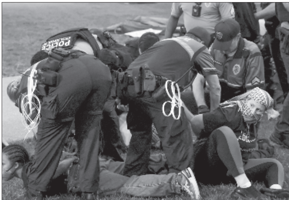
▲ Tras los últimos arrestos, ahora se protesta por las sanciones en contra de los alumnos, y tanto los estudiantes y un creciente número de profesores exigen una amnistía.

Muchas universidades estaban en calma el domingo en la tarde, pero unas 275 personas fueron arrestadas el sábado en varios centros educativos, entre ellos la Universidad de Indiana en Bloomington, la Universidad Estatal de Arizona y la Universidad Washington en San Luis. Con ello, la cifra de detenidos en todo el país ahora asciende a casi 900 desde que la policía de la Ciudad de Nueva York despejó un campamento propalestino en la Universidad de Columbia y arrestó a más de 100 manifestantes el 18 de abril.