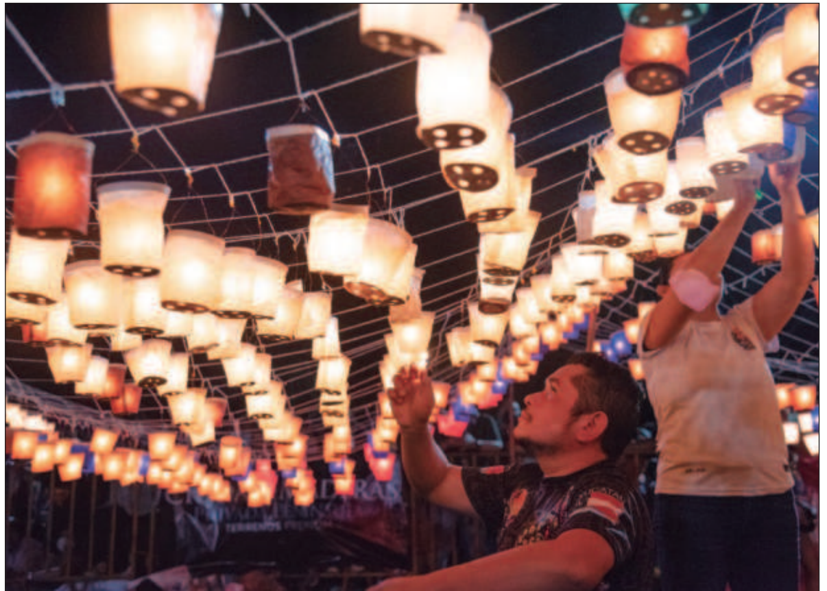
▲ “En suma, una idea se vuelve ideológica si permite naturalizar o justificar de forma oculta una determinada opresión. De hecho, mucho mejor si es verdadera para su efecto ideológico”.

AHORA BIEN, EL contexto en el que se desarrolló dicho término por parte de Marx corresponde