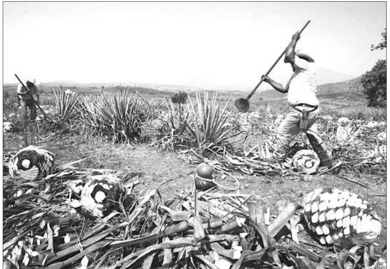
▲ La producción del agave azul alcanzó 2.52 millones de toneladas, con un crecimiento promedio anual de 5.7 por ciento.

El titular de la Sader, Víctor Villalobos, resaltó que cuando en 1974 se estableció la denominación de origen del tequila, no se anticipaba el impacto global que tendría en la economía esta