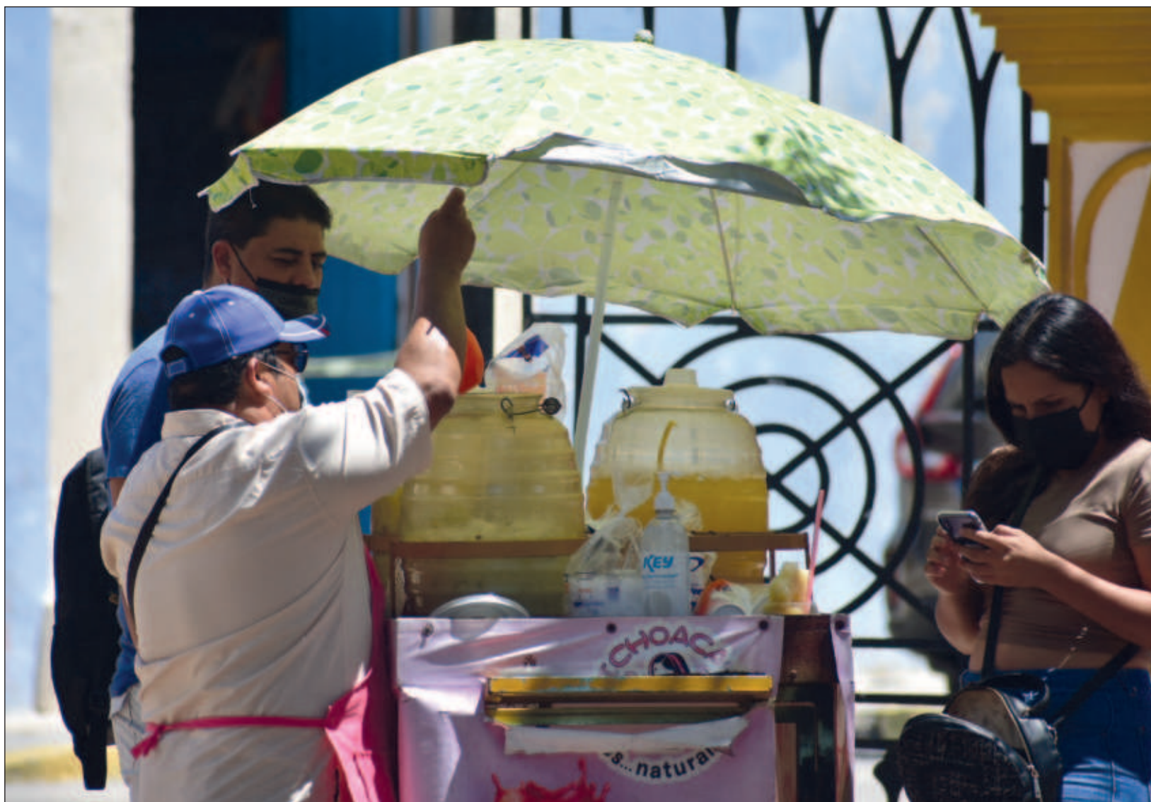
▲ De la Población Económicamente Activa nacional, 59.8 millones de personas estuvieron ocupadas en marzo de este año.