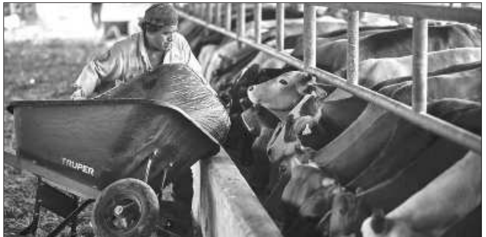
▲ La exportación fue concretada el pasado 11 de abril, luego de que los ganaderos de la comunidad de Juan Sarabia cumplieron con las especificaciones sanitarias.

Además de hacer esas propuestas, apuntó la necesidad de presionar a la administración pública para que cree las condiciones que propicien la lectura, convertirla en un hábito, en un gusto para toda la población; se debe resaltar la convicción del valor que tiene todo esto y una vez que el público esté convencido va a apoyar y ser partícipe de estas experiencias; el ejemplo de la Segunda Feria del Libro Cancún, opinó, es muy ilustrativo de cómo la suma de esfuerzos y no la inversión en gran infraestructura o de grandes recursos hacen posible un evento que atrae a lo bello, lo importante y lo trascendente que puede ser leer.