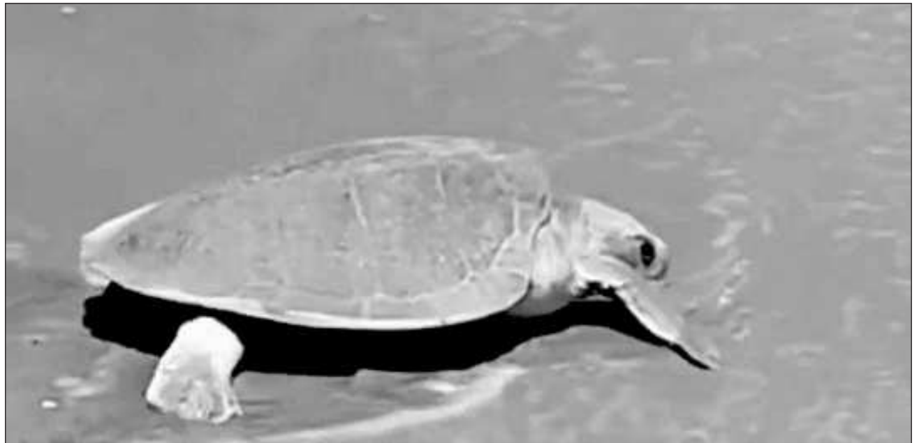
▲ Las autoridades y los curiosos estuvieron pendientes de que las aves cercanas, así como los caninos que deambulan por la zona no se acercaran para depredar los huevos de la tortuga, la cual regresó al mar después de lograr el desove.

Grande fue la sorpresa de los presentes cuando se dieron cuenta que este ejemplar, arribaba a la playa para depositar sus huevos tras previamente abrir un hoyanco.