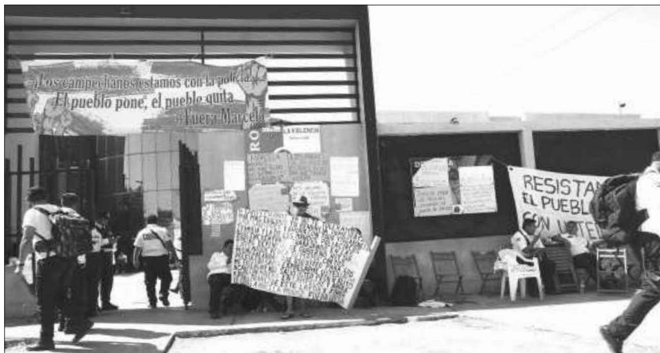
▲ Los elementos policiacos indicaron que alguien ha malinformado al Presidente sobre su situación, por lo que buscaban entregarle personalmente las pruebas que respaldan sus señalamientos, pero fueron bloqueados.

Los policías, entrevistados a las afueras de la terminal, en la carretera, señalaron que alguien ha mal informado al Presidente de