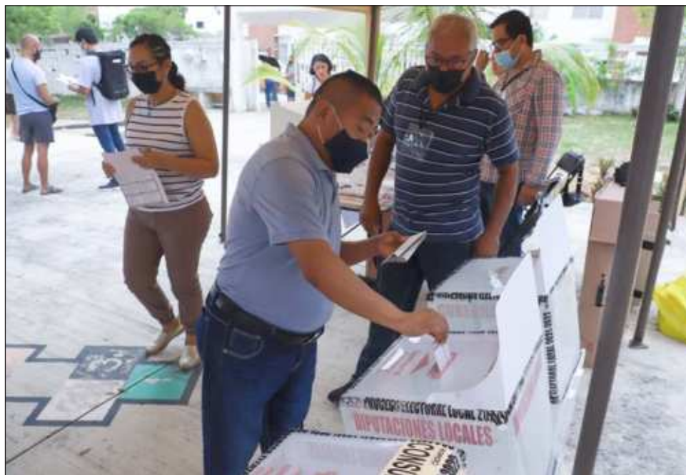
▲ Está previsto que para el 2 de junio se tendrán un total de mil 503 casillas y cada una deberá estar integrada por nueve funcionarios, todos ya insaculados.

Quienes sí fueron considerados son todos aquellos a quienes se les venció su credencial en el 2023, pero se les permitirá votar el próximo 2 de junio, por lo que van a salir en la lista nominal y podrán ejercer su derecho. Respecto a la integración y entrega de la documentación electoral para el voto de las personas en prisión preventiva, el INE en Quintana Roo, a través de la vocalía de