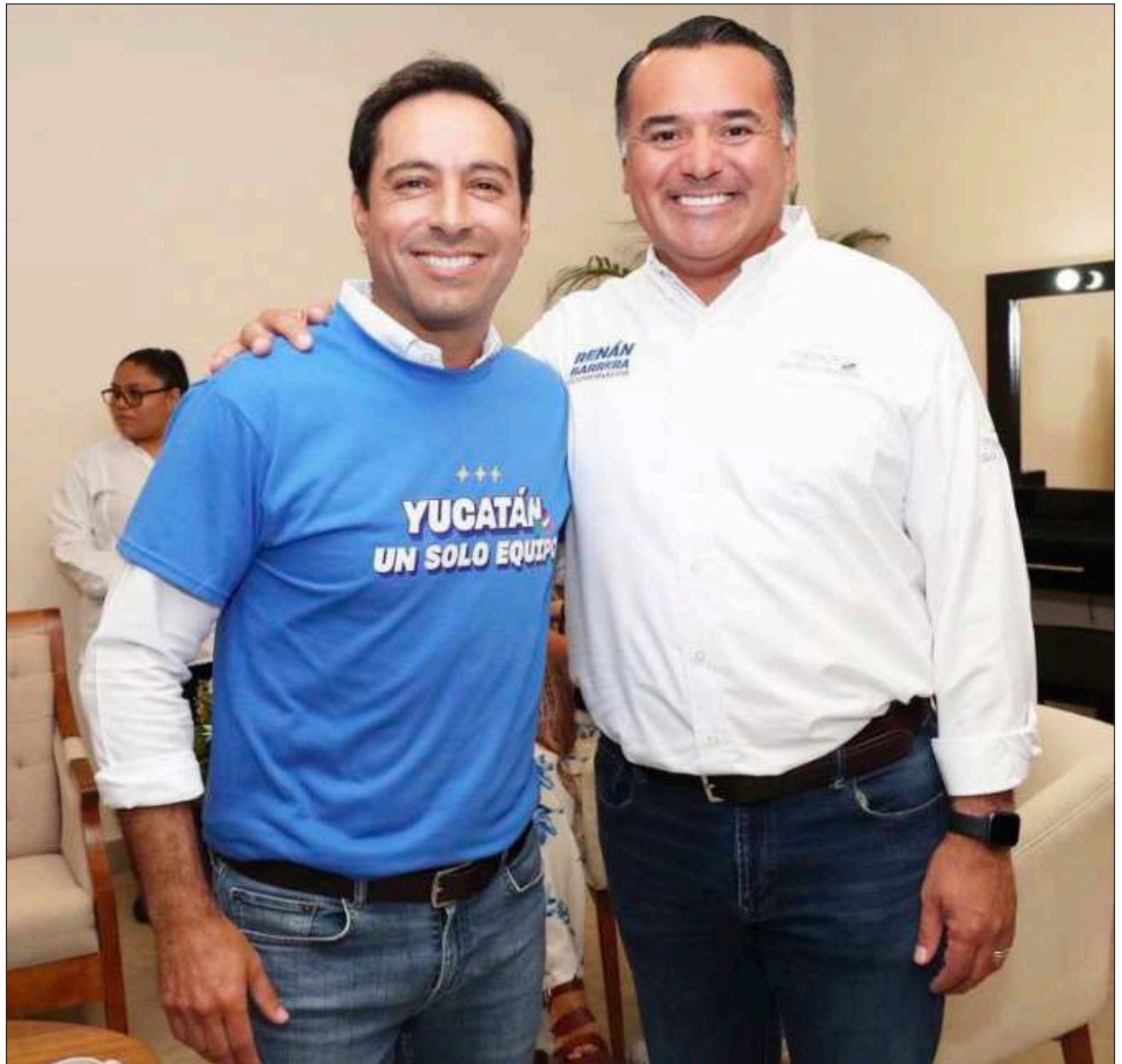
▲ Mauricio Vila representará a México en su calidad de presidente de la Conferencia Nacional de Gobernadores en el Foro sobre Cooperación, Crecimiento y Energía para el Desarrollo, que se realizará en Arabia Saudita.

El gobernador se encuentra en labores de promoción económica del estado de Yucatán, y representará a México en el Foro en Arabia Saudita.