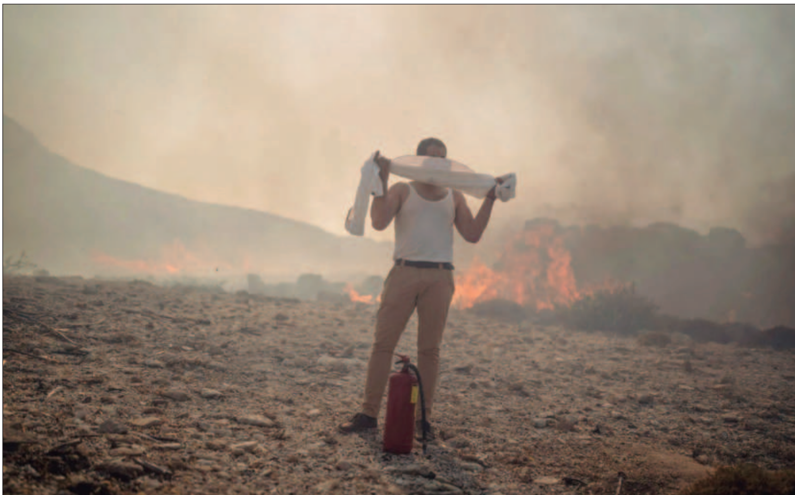
▲ "La sequía iniciada en 2023 y aún vigente, ha pasado de moderada a severa, afectando a por lo menos 72 municipios; como consecuencia según la Conafor, el estado de Yucatán se encuentra en la posición número diez entre los 32 estados del país con mayor superficie afectada por los incendios forestales".

SÍGANOS EN: http://orga.enesmerida.unam.mx/ Facebook @ORGACovid19 Instagram @orgacovid19 X @ORGA_COVID19