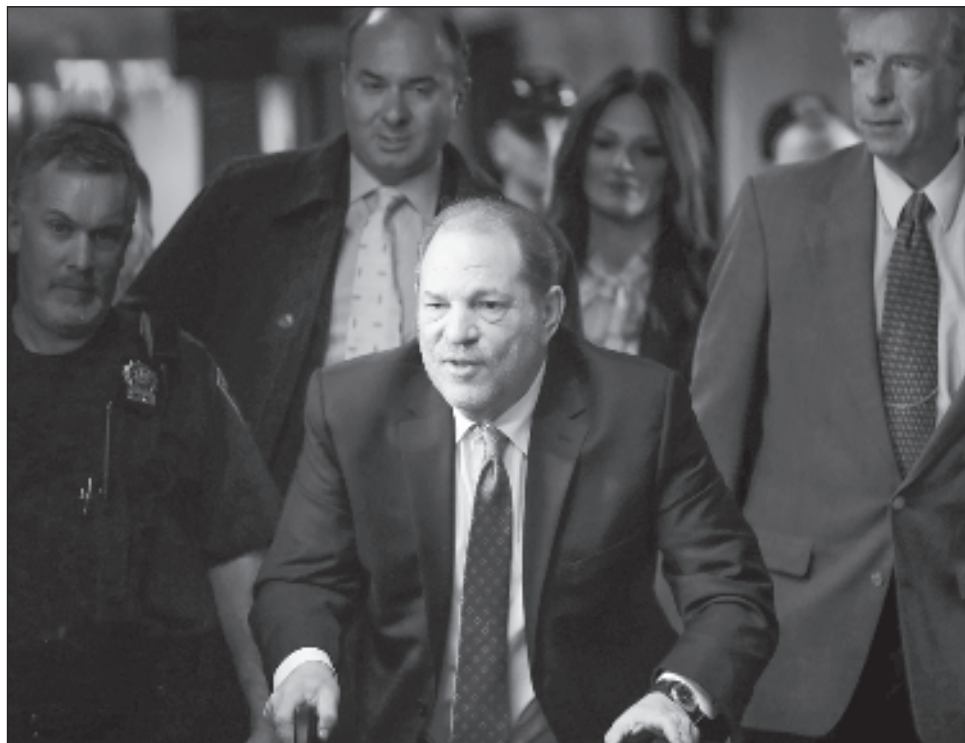
▲ Weinstein podría ser enviado al complejo carcelario de Riker's Island de la ciudad, o a California para comenzar a cumplir una sentencia por su condena allí.

En espera un nuevo juicio en Nueva York, Weinstein, de 72 años, podría ser