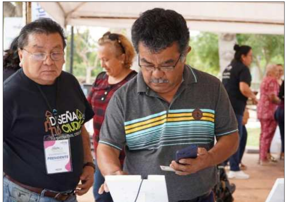
▲ Los habitantes eligieron este domingo los proyectos ciudadanos de mejoras en parques y áreas deportivas en los cuatro puntos cardinales de Mérida.