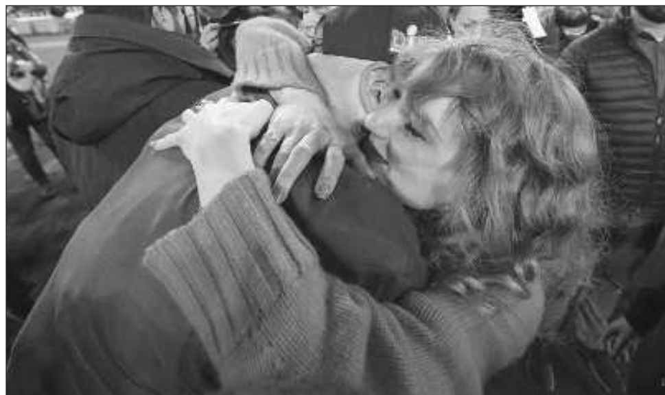
▲ Taylor Swift, con su novio, el ala cerrada, Travis Kelce, héroe de la victoria de los Jefes.

Kelce atrapó 11 pases para 116 yardas, y un touchdown, y ahora la gran pregunta rumbo al "Super