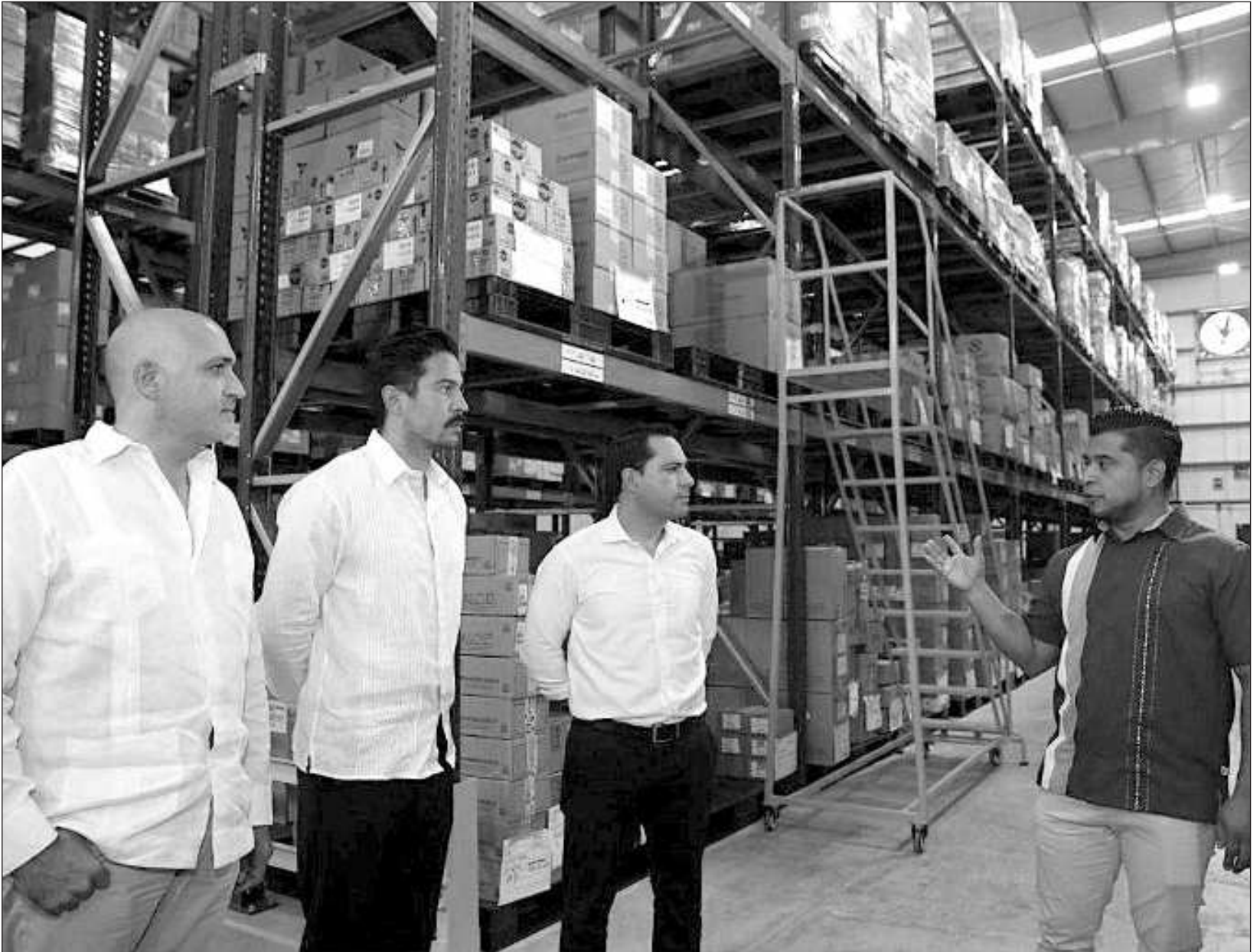
▲ De acuerdo al reporte del Inegi, el estado avanzó cuatro posiciones en el ranking nacional respecto de diciembre de 2022.