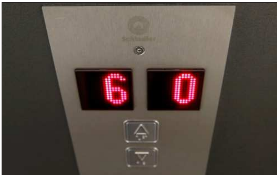
▲ La bitácoras de mantenimiento pueden incluir desde transformador hasta equipo que utilice gas y obviamente deben demostrar que los elevadores tienen un mantenimiento preventivo.

En el caso de esta institución, aclaró el director de Protección Civil, le compete directamente a la federación, quienes también deben hacer revisiones de bitácoras. “Se procedió a clausurar el elevador. Hay que mencionar también que nosotros, como ente municipal, no tenemos jurisdicción en las oficinas federales, por lo que será la Coordinación Nacional de Protección Civil y las mismas áreas de Protección Civil del IMSS los que van a determinar, pero por estar en nuestro ayuntamiento, les dejamos acta y lo clausuramos”, explicó.