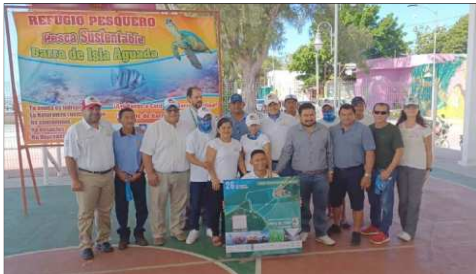
▲ El refugio pesquero consta de mil 19 hectáreas de mar que serán protegidas de las capturas con redes o de arrastre para evitar más daños a los arrecifes.

"Muchas reuniones se realizaron de forma virtual por el