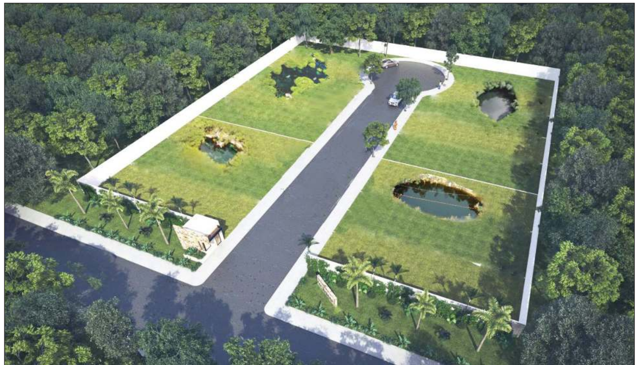
▲ Las empresas realizaron diferentes publicaciones usando publicidad engañosa, pues prometían un cenote en cada lote fraccionado; sin embargo, representantes del sector aclararon que esto era imposible de cumplir en cualquier zona del estado. Ilustración Víctor Cámara

Los afectados, hasta el momento, son 37 personas que se enteraron de la venta por medio de redes