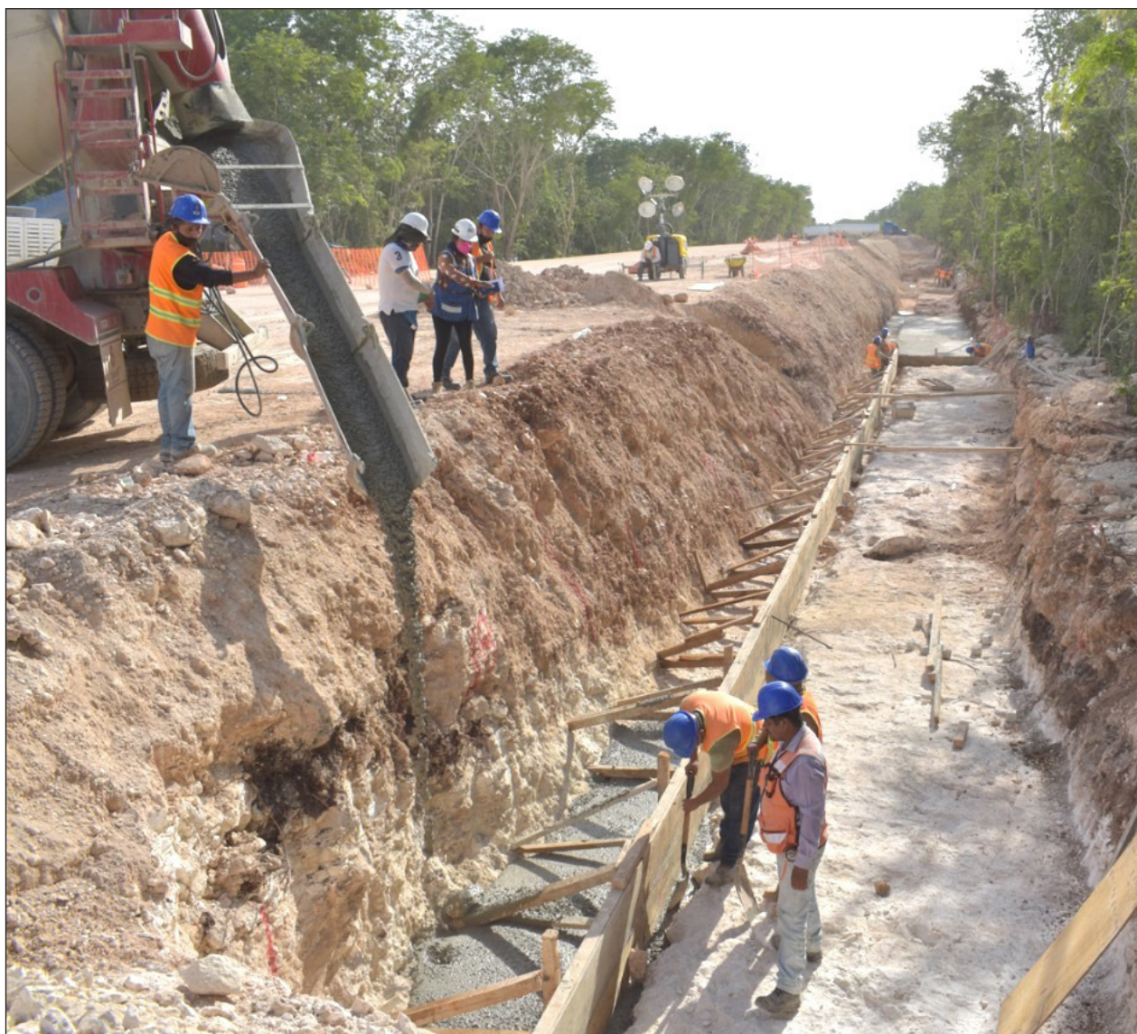
▲ Durante la realización de los trabajos se tratará de afectar lo menos posible la circulación sobre la carretera federal.