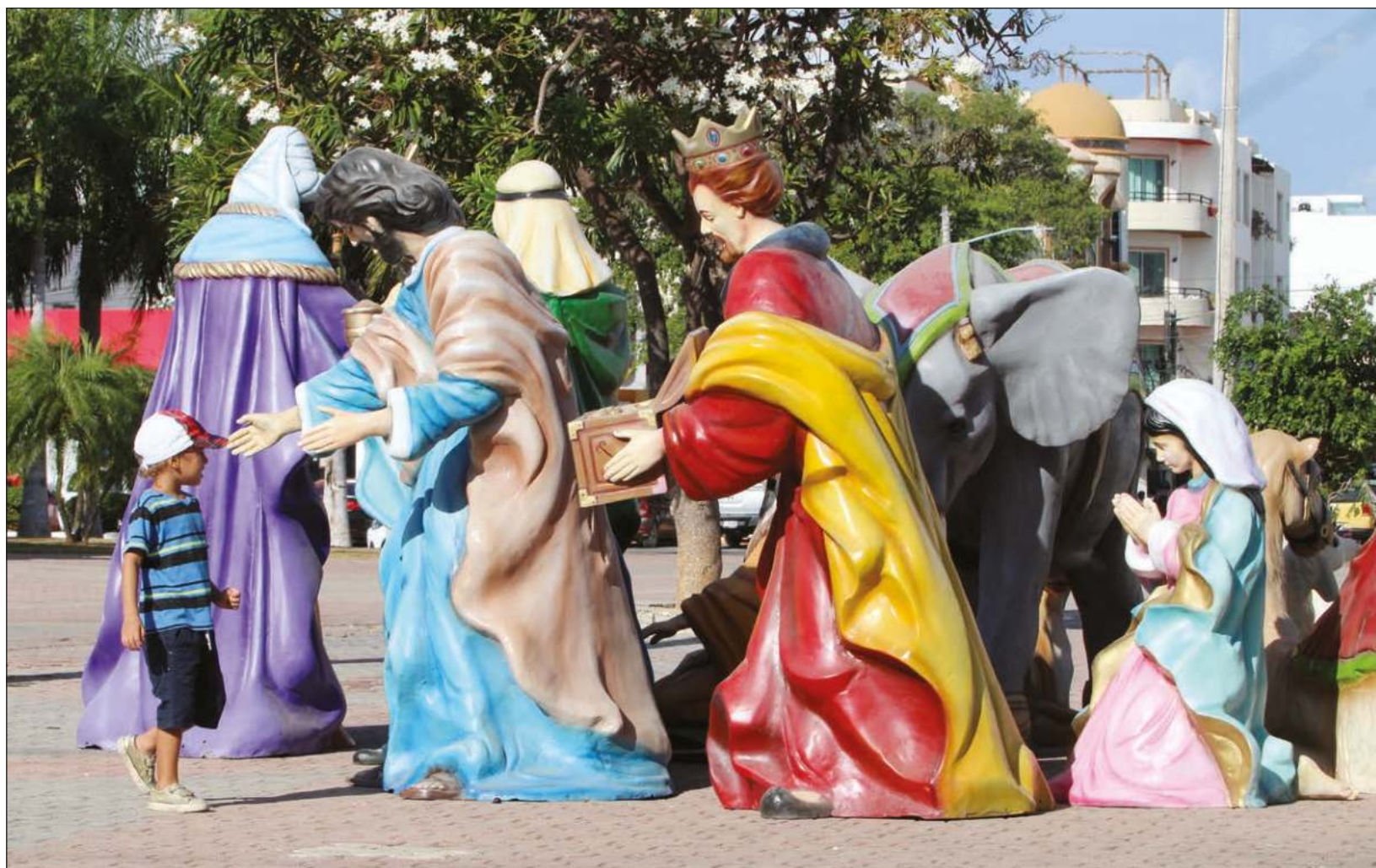
▲ Desde el catolicismo reconocen que, en la Edad Media, monaguillos y saristanes ya recordaban con humor, de forma paradójica, la masacre perpetrada por los soldados de Herodes en Belén.