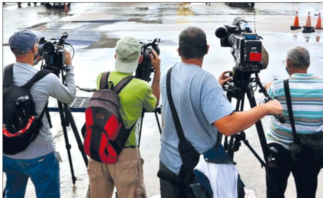
▲ El humor en el periodismo es sólo un componente más, el cual creemos debe ser parte crucial.