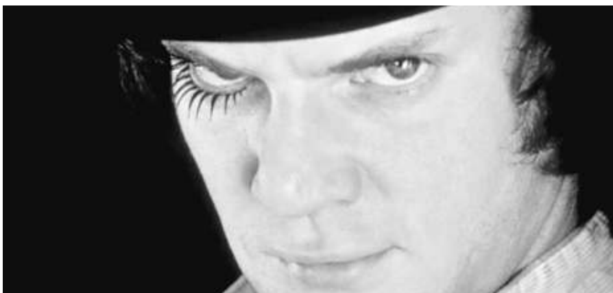
La naranja mecánica

Desde esa perspectiva, más que incorriar conmueven los intentos de Unoqueotro, quien desde su perspectiva contemporánea pretende sin éxito desdorar a La naranja... , ya sea porque el futuro planteado para 1971 no se ve como él quiere que se vea con sus ojos de 2021; ya porque uno o algunos de los elementos esenciales de la trama –la agresividad como atavismo, el individualismo a ultranza, la manipulación de los instintos–, y sobre todo la violencia inopinada, “se queda chiquita” comparada con el horror actual, y otras cegueras por el estilo. Lo cierto es que, como le sucedió a sus antecesores, Unoqueotro y su mezquindad, tan amiga de la mediocridad, pasarán a engrosar las huestes del dulce olvido, mientras Kubrick y su naranja seguirán cosechando, tal como sucede medio siglo después, adeptos y bienquerientes ●