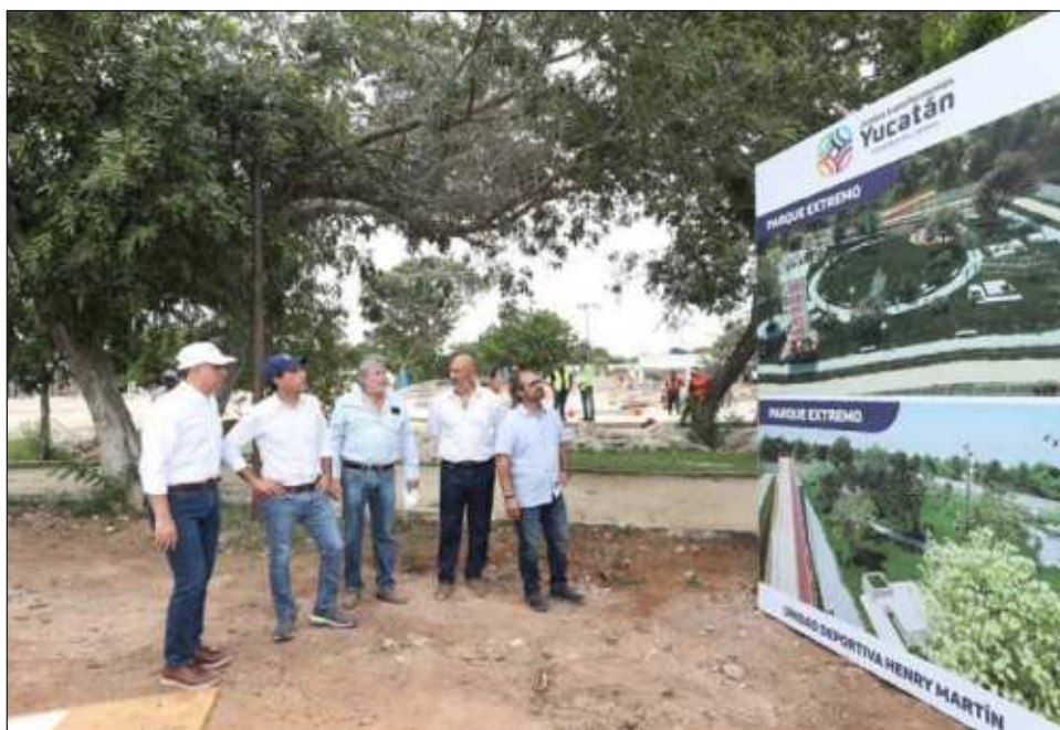
▲ La rehabilitación de la Unidad Deportiva del Sur Henry Martín forma parte una iniciativa para transformar al sur de la ciudad con la modernización de 23 parques del sur.

El área de oficinas estará recibiendo trabajos de mantenimiento y