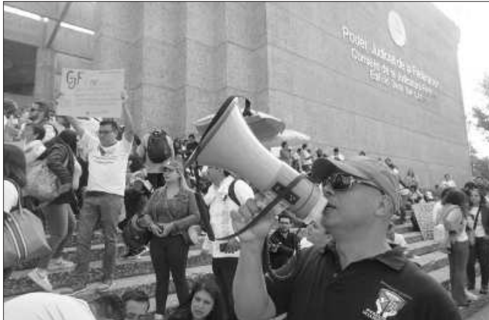
▲ En un comunicado, Jufed reiteró que la extinción de dichos fideicomisos afecta los derechos adquiridos previstos en las Condiciones Generales de Trabajo para el país.

"Jufed comunica que una jueza federal concedió la suspensión definitiva en el