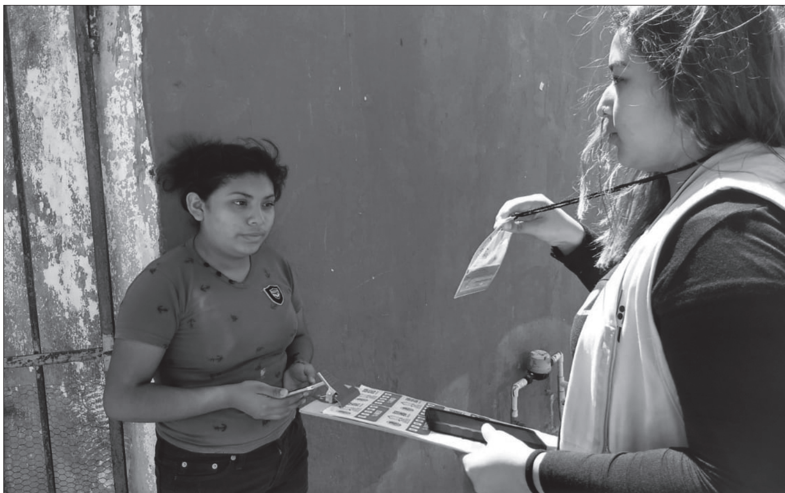
▲ “Las encuestas no han hecho predicciones certeras. Los resultados de las votaciones incluso son opuestos a las predicciones iniciales”.