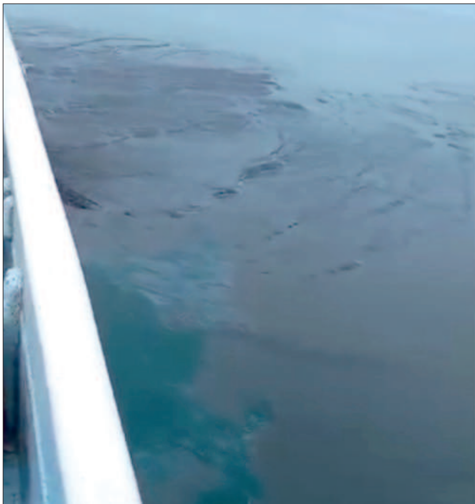
▲ Ciudadanos documentarán presencia de hidrocarburo en costas.

Indicó que se estima que en los próximos días, esta gran mancha comience a arribar a las playas de Carmen, principalmente en Isla Aguada y Sabancuy.