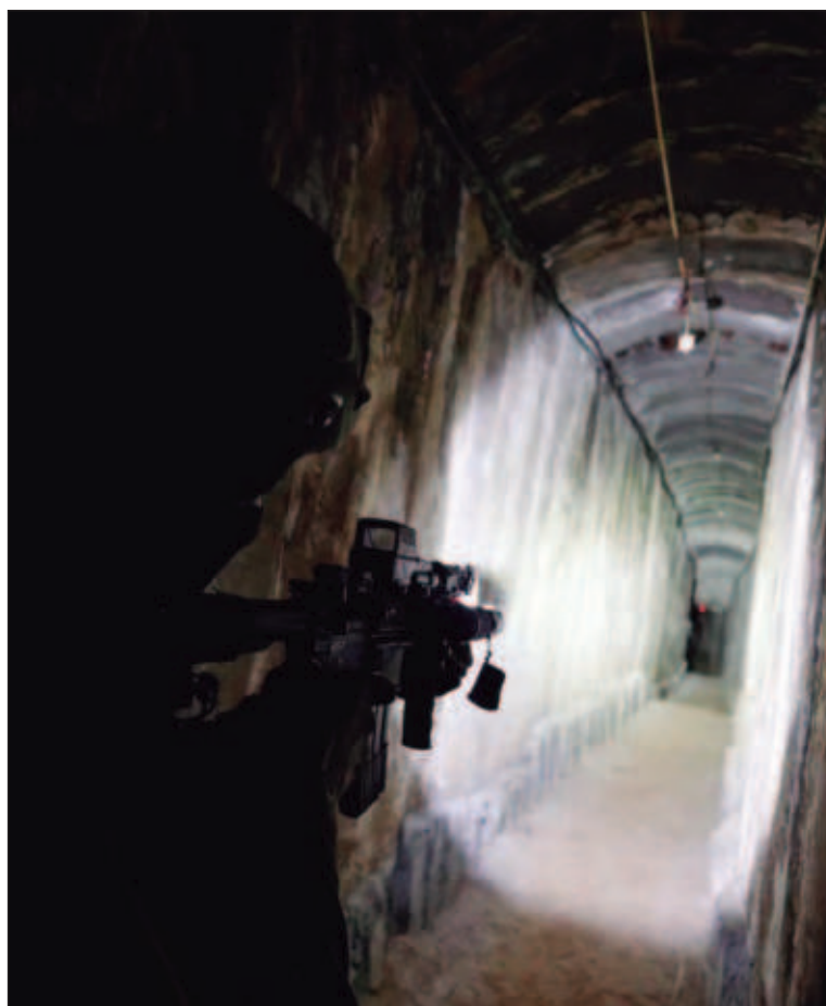
▲ "Can UN members states that vote on myriad anti-Israeli resolutions in all the Organization's agencies justify Hamas's continued existence?".

THERE HAVE BEEN accusations that UNRWA schools in refugee camps in Gaza use textbooks that justify hatred of and violence against Israelis and Jews. Rather than force Hamas to engage in good governance and use resources donated by member states to create a viable economy that can bring