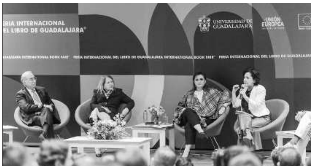
▲ La elección de ministros de la SCJN no es algo ajeno a la historia de México.

Y aún queda pendiente de mencionar si las candidaturas a jueces, magistrados y ministros estarán a cargo de los partidos, porque entonces esto implicará campañas electorales y mayor gasto en ese rubro, aparte de que también el Instituto Nacional Electoral podría imponerles criterios de representación, lo que inmediatamente hace de menos la trayectoria en impartición de justicia.