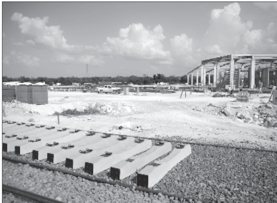
▲ El 15 de diciembre se pondrán en marcha las operaciones de la primera etapa del Tren Maya (de Campeche a Cancún, que corresponden a los tramos 2, 3 y 4).

El 22 de diciembre se pondrá en marcha el Tren del Corredor Interoceánico del Istmo de Tehuantepec, que unirá en Pacífico con el Atlántico, desde Salina Cruz, Oaxaca, hasta Coatzacoalcos, Veracruz.