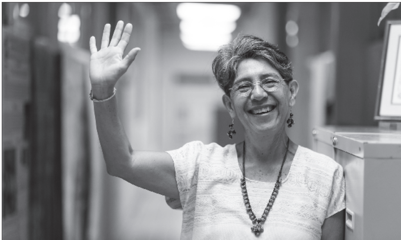
▲ "El estado y la península de Yucatán son una región que me han permitido vivir plenamente y realizar mi trabajo, mi savoir faire cotidiano".