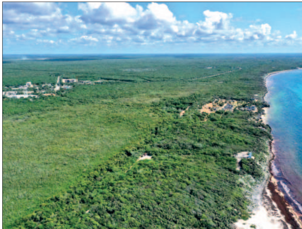
▲ La publicaci n del plan de manejo del parque estaba programada para julio.

A pregunta expresa de si la Comisi n Nacional de  reas Naturales Protegidas (Conanp) los consider  para elaborar