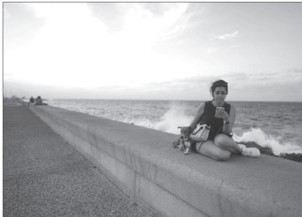
▲ Unas 5 mil 400 millones de personas, equivalente a 67% de la población mundial, usan Internet, según los datos estimados en el último informe de la UIT sobre la situación global.

El análisis de la UIT revela que en los países de bajos ingresos no sólo hay menos personas en línea, sino que, además, los que sí están