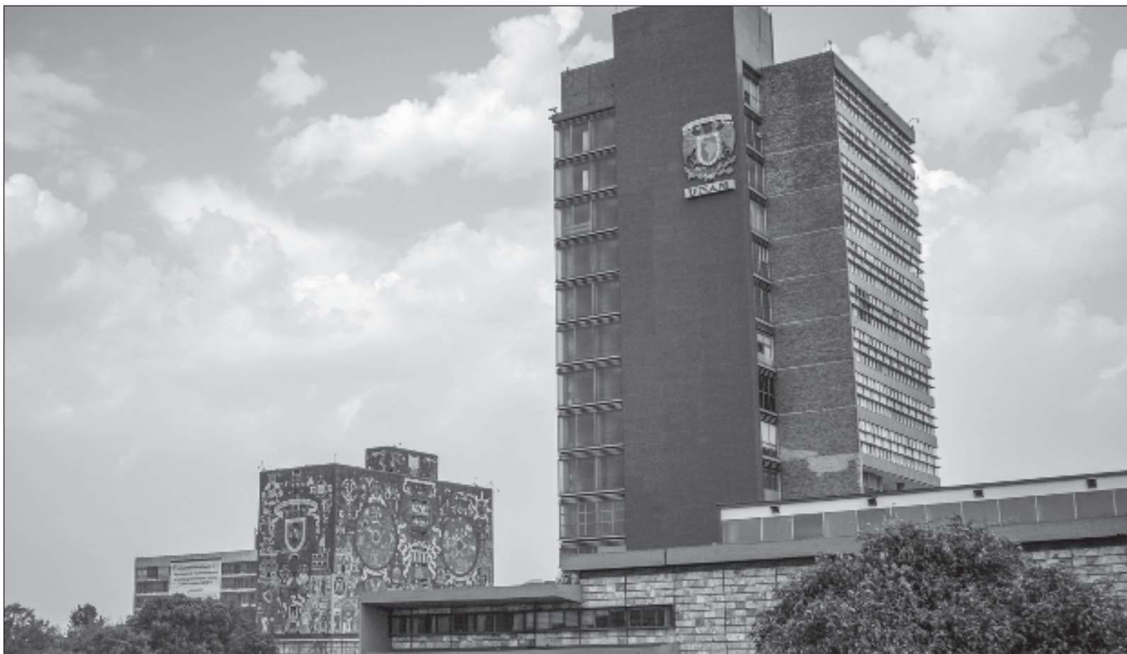
▲ “Los tiempos actuales son sumamente complejos para cualquier universidad pública. El debate en torno a la manera en que se debe conducir una institución educativa autónoma sólo aleja a dichas instituciones de su labor primordial: la generación, transmisión, difusión y aplicación del conocimiento”.