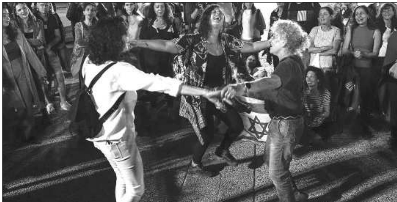
▲ Ambas partes han respetado el pacto, que ha visto la liberación de 58 rehenes cautivos en Gaza y 117 presos palestinos en cárceles israelíes; entre los 58 secuestrados liberados por Hamas desde el viernes se incluyen 19 extranjeros que no forman parte del pacto.

En declaraciones a la agencia de noticias estatal qatari, QNA, antes del anuncio de la extensión de la tregua, Al Ansari manifestó el deseo de Catar de que esta sirva para “alcanzar un alto el fuego permanente en la Franja y evitar el derramamiento de sangre de los civiles”.