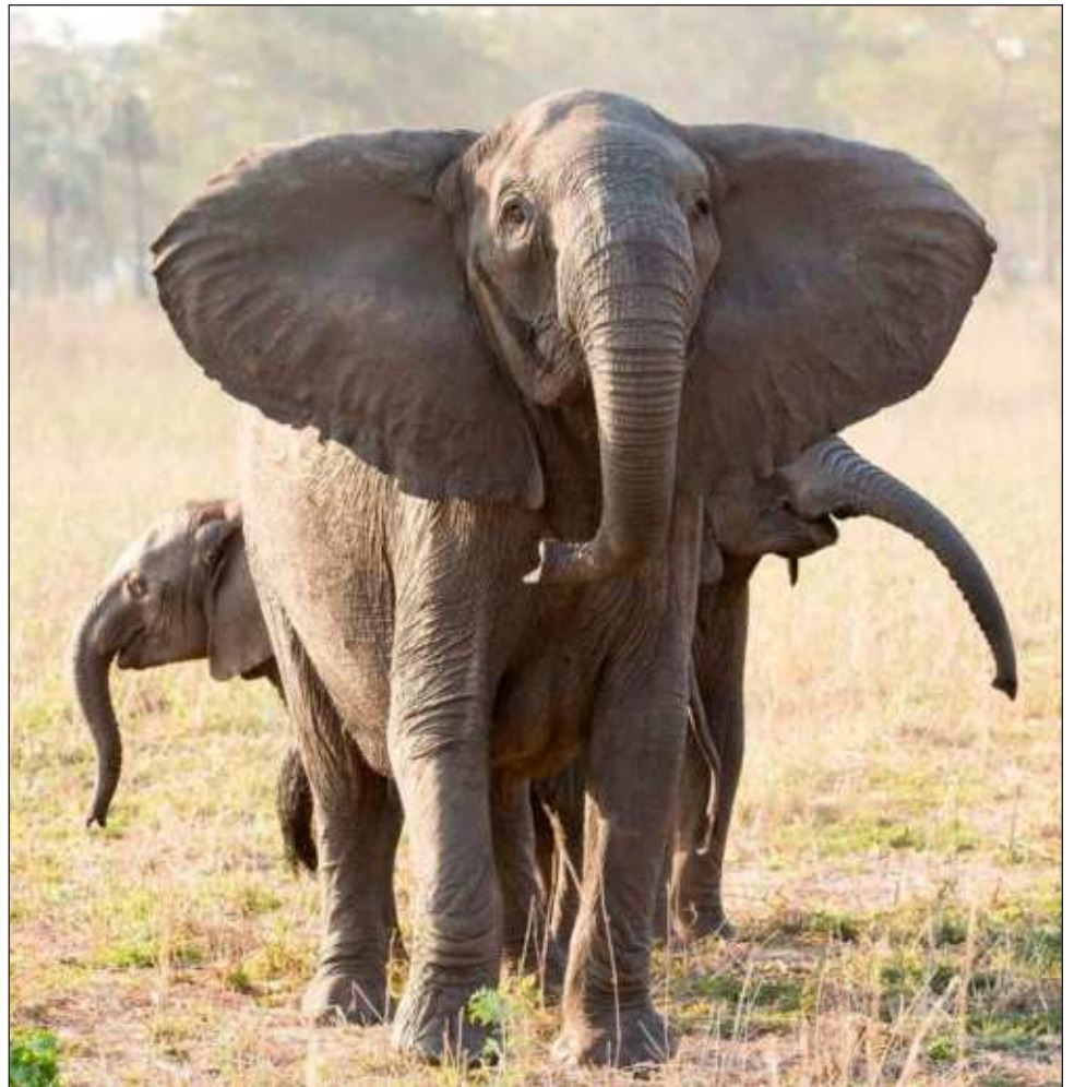
▲ U mola'ayil ONUe' tu jets'aj u lajunja'abilo'ob 2020 beey u jats k'iinilo'ob tu'ux kun ka'a kuxkiinsa'al yéetel líik'sa'al k'áaxo'ob.