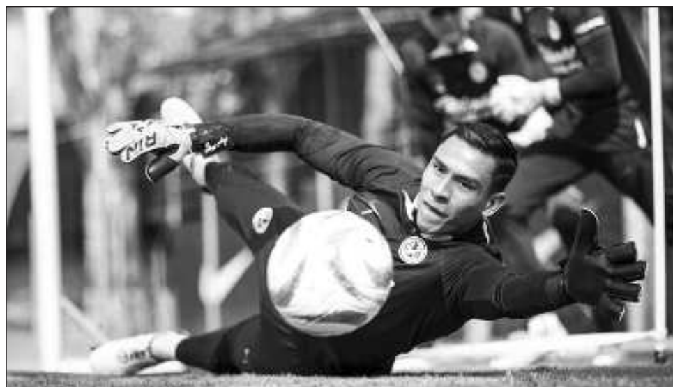
▲ Las Águilas se preparan para enfrentar a León por el pase a semifinales.

Este miércoles el América jugará luego de 18 días de inactividad y está por ver cómo sale ante un cuadro que llega motivado luego de eliminar el domingo a Santos.