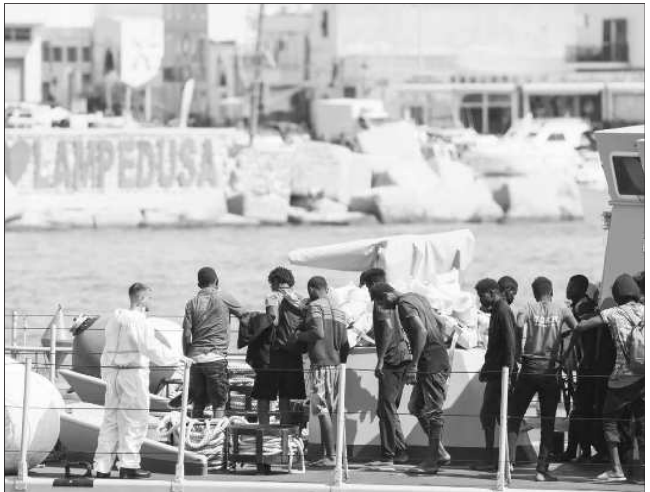
▲ De acuerdo con el Ministerio del Interior, se calcula que más de 150 mil migrantes han llegado a Italia desde principios de año, mientras que más de 2 mil 200 personas perdieron la vida en la zona central del Mediterráneo.

El Ministerio del Interior calcula que más de 150 mil migrantes han llegado a Italia desde principios de año, mientras que más de 2 mil 200 personas han perdido la vida en la zona central del Mediterráneo, según las estadísticas de la Organización Internacional para las Migraciones (OIM).