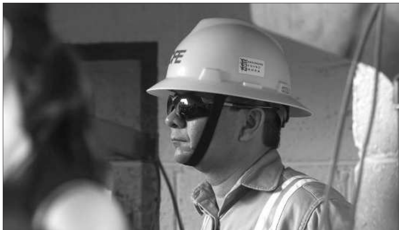
▲ Las cuchillas que suministran la energía eléctrica a la localidad de Nuevo Campechito se ubican en la comunidad de la Barra de San Pedro, en Tabasco, y al presentarse una falla, los habitantes de esta no permiten el ingreso del personal de CFE.

Añadió que siguiendo las instrucciones de la gobernadora del estado, Layda Elena Sansores San Román, y del secretario de Gobierno, Armando Toledo Jamit, se