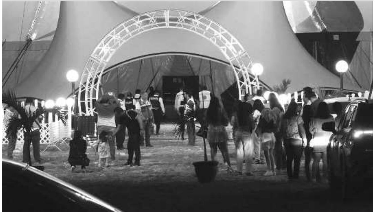
▲ La empresa, aparentemente de otro país, trae al municipio de Campeche un espectáculo de Disney sobre hielo; sin embargo, comenzaron a dar función sin antes solventar las medidas de seguridad señaladas por el ayuntamiento y fue clausurado.

Sin embargo, estos sólo atendieron tres de las recomendaciones, abrieron su taquilla, programaron su primer función el domingo por la tarde, vendieron los boletos, y no dieron señales de la intención de subsanar