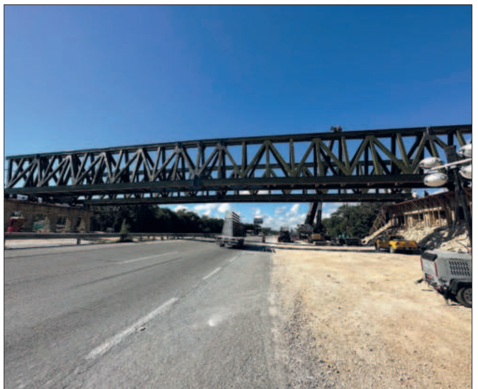
▲ La estructura conectará la zona arqueológica de Tulum y el Tren Maya.

Para esta obra ninguna autoridad anunció algún cierre provisional de la vía, aunque la movilidad y colocación del soporte y vigas del puente sí limitó el tráfico para la zona.