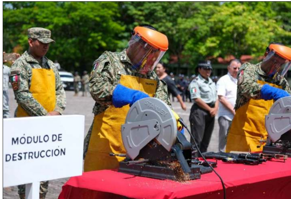
▲ Del total, 281 armas fueron puestas a disposición por autoridades civiles y 100 donadas por la Secretaría de Seguridad Ciudadana. La gobernadora Mara Lezama afirmó que "destruyendo armas construimos paz".

Del total, 281 armas fueron puestas a disposición por autoridades civiles y 100 donadas por la Secretaría de Seguridad Ciudadana. "Destruyendo ar-