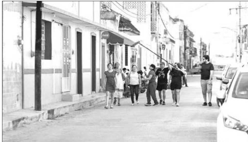
▲ La agrupación lleva dos años trabajando en una propuesta para fortalecer acciones para posicionar el idioma en ámbitos como la educación, los medios de comunicación, el arte, la iniciativa privada, la administración pública, la tecnología, entre otras.

“Creemos que el bilingüismo lejos de verse como amenaza para las administraciones públicas debe ser la aspiración de cualquier gobierno progresista y cercano a los derechos humanos, en la individualidad como en lo colectivo, las lenguas son territorios que enriquecen a quienes las portan”, compartió Red U