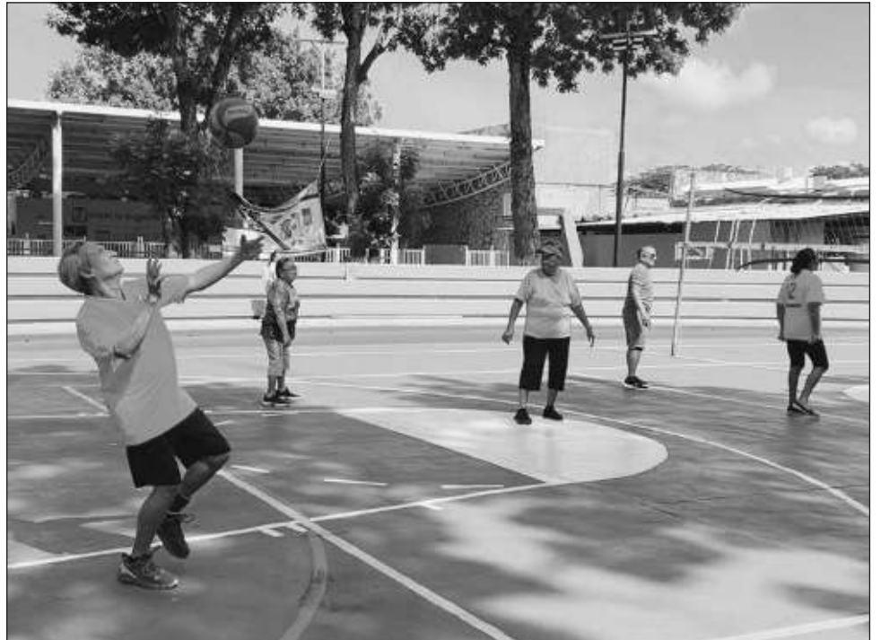
▲ La caminata es evento gratuito y las personas interesadas en participar únicamente tienen que acudir puntualmente al Estadio Salvador Alvarado el sábado a las 7 de la mañana.

“Las personas de 60 años y más, al tener hábitos de autocuidado, así como la atención médica adecuada, logran mantener su estado de salud y bienestar, además de que pueden evitar padecimientos que suelen presentarse con mayor frecuencia durante la senectud como: osteoporosis, infartos, embolias, deterioro cognitivo (pérdida de las capaci-