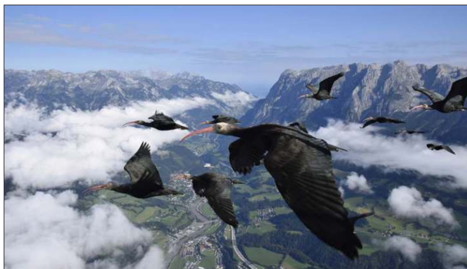
▲ Debido a que estas aves no saben instintivamente en qué dirección deben volar, “tenemos que enseñarles la ruta migratoria”, explicó el biólogo Johannes Fritz.

Aunque los ibis calvos del norte aún muestran el impulso natural de migrar, no saben en qué dirección volar sin la guía de compañeras mayores nacidas en libertad. Los primeros intentos del Waldrappteam para su