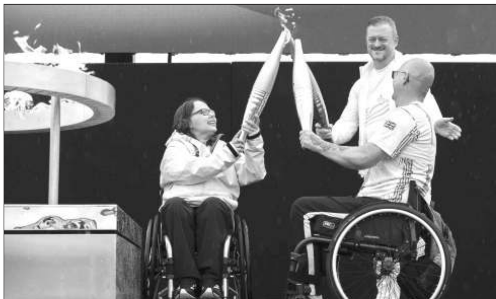
▲ Los atletas británicos Helene Raynsford y Gregor Ewan encienden la llama en Stoke Mandeville, considerado el lugar de nacimiento de los Juegos Paralímpicos, el sábado pasado.

De los 22 deportes paralímpicos, sólo dos no tienen un equivalente olímpico: el goalball y la boccia.