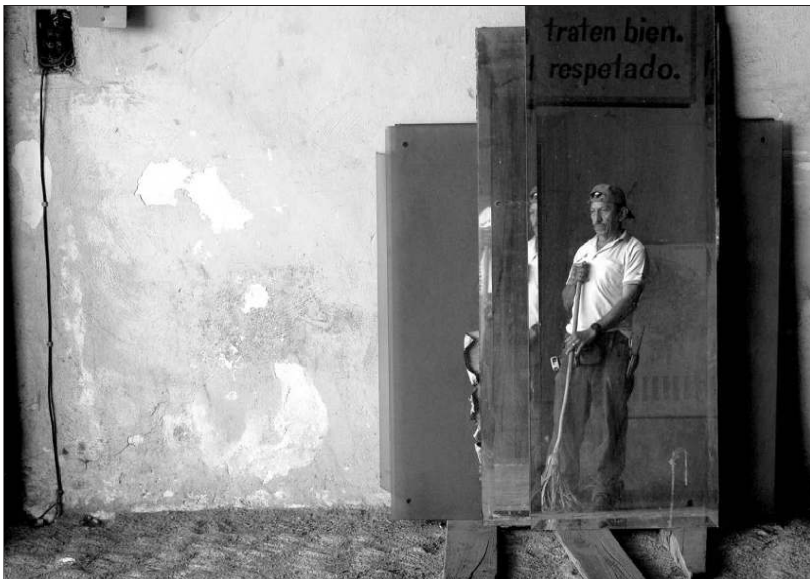
▲ “Puedes sobrevivir a la pérdida de un ser querido, pero no a la tuya. Se extrañaba tanto que sentía que su vida ya no tenía sentido”.