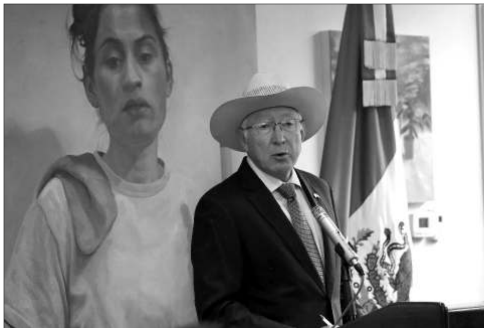
▲ El jefe de la misión diplomática, Ken Salazar, hizo comentarios sobre la inviabilidad de la elección de jueces magistrados y ministros en México.

-Ellos quisieran tener injerencia en asuntos que sólo corresponden a los mexicanos.