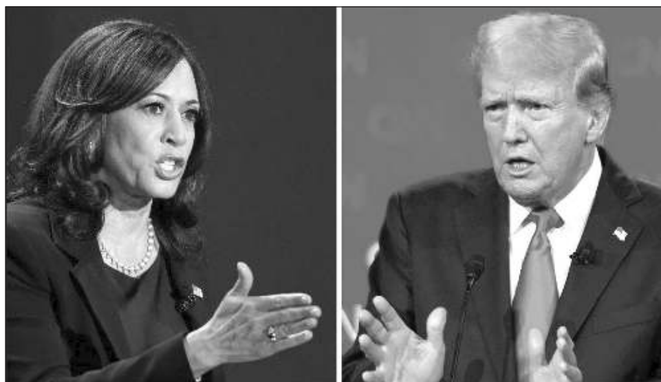
▲ Las encuestas indican que la contienda por la presidencia de Estados Unidos está muy cerrada, y por lo tanto el enfoque en las últimas 10 semanas será sobre esos estados claves.

Las encuestas indican que la contienda presidencial está muy cerrada y por lo tanto el enfoque en las últimas 10 semanas será sobre esos estados claves, entre los cuales están Pensil-