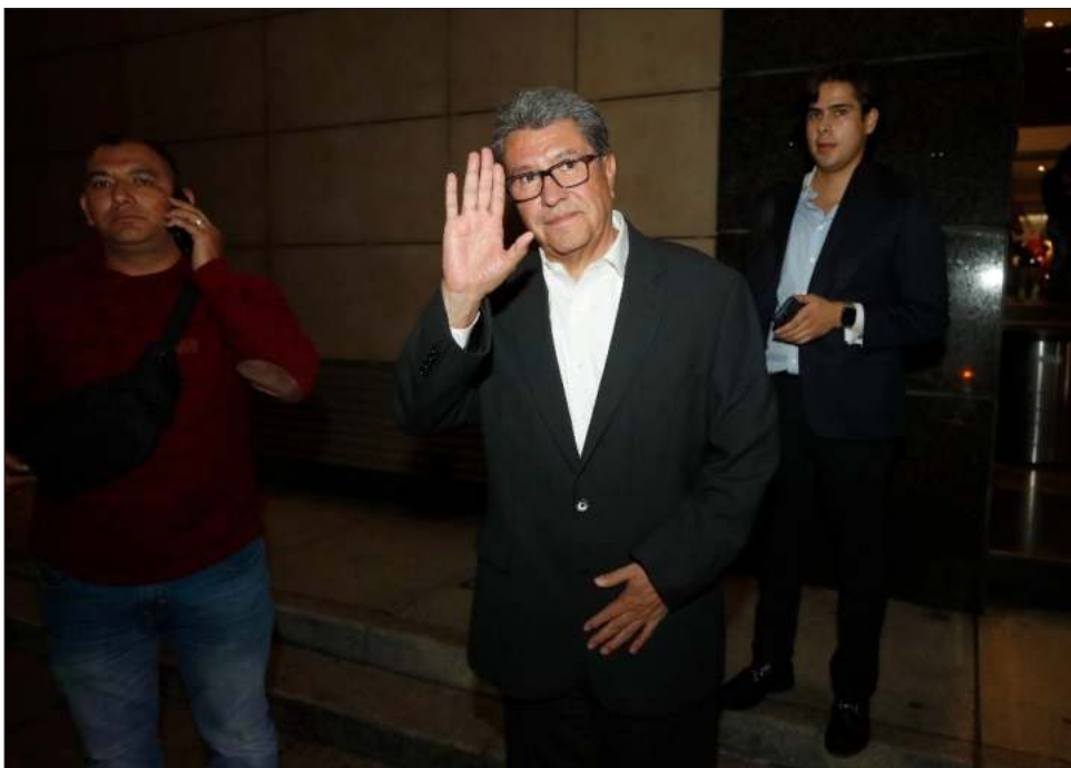
▲ Ricardo Monreal puntualizó que “con toda claridad y transparencia” las prioridades legislativas de Sheinbaum “van a ser nuestras prioridades”.

Monreal dijo que “con toda claridad y transparencia” las prioridades legislativas de Sheinbaum “van a ser nuestras prioridades”.