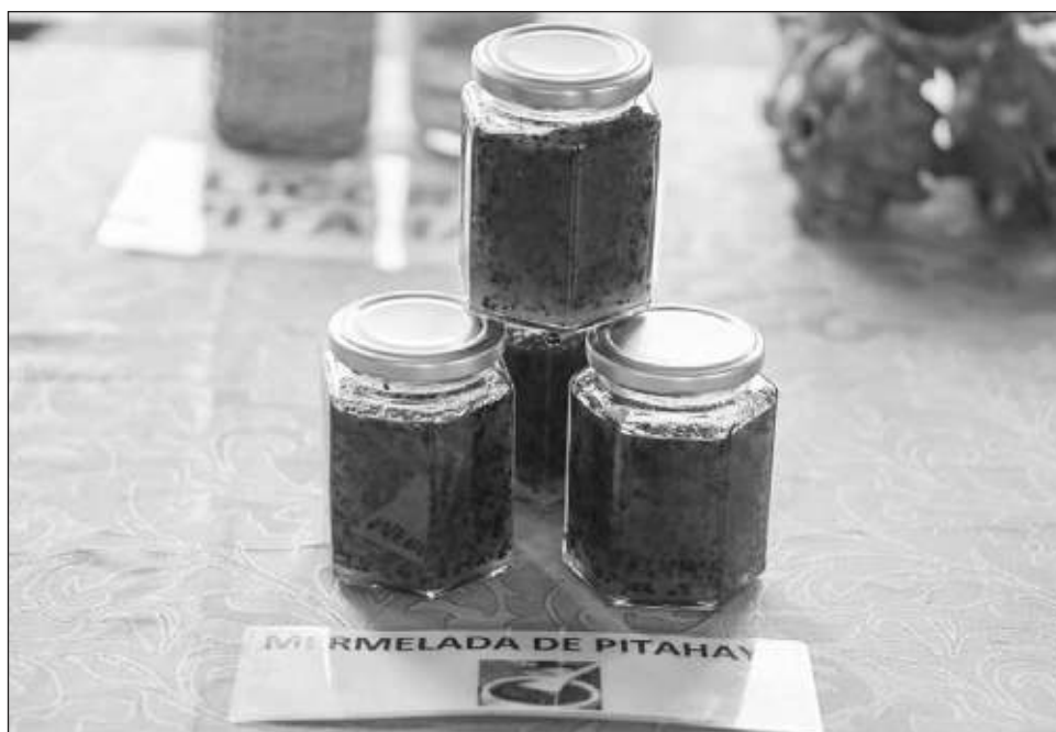
▲ De acuerdo con el director de Economía Municipal, “tenemos más de 300 personas inscritas en ese programa de Sembrando Vida . Toda la zona maya va a participar este viernes, donde además vamos a tratar de hacer un canal de comercialización”.

“Tenemos más de 300 personas inscritas en ese programa de Sembrando Vida . Toda la zona maya va a participar este viernes, donde además vamos a tratar de hacer un canal de comercialización, estamos invitando por ahí a los supermercados grandes de renombre para ver si podemos hacer equipo, ver