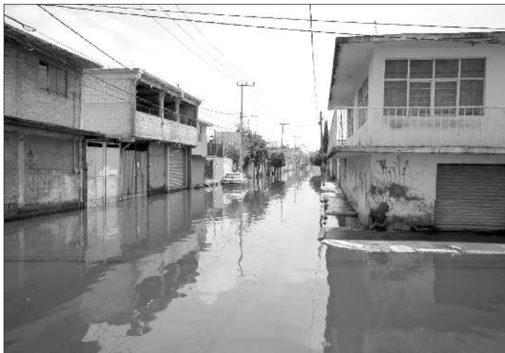
▲ Las declaraciones del funcionario obligan a inquirir por qué una obra pública de tan obvia urgencia permaneció detenida casi dos años y por qué sólo se reanudó después de la inundación.

Por último, ha de garantizarse la no repetición de una tragedia como la que se vive en las colonias referidas y que, con distinta gravedad y duración, es recurrente en el valle de Chalco. El histórico desinterés hacia estas catástrofes anunciadas constituye una muestra de insensibilidad por la suerte de un sector particularmente vulnerable de la sociedad, insensibilidad que no tiene cabida en el proceso de transformación del país.