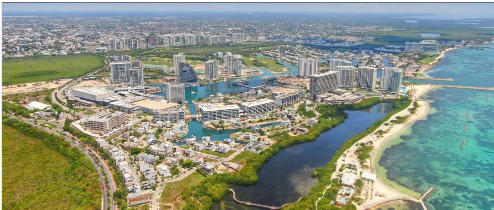
▲ Actualmente, el gobierno del estado de Quintana Roo busca atraer más turistas a las zonas centro y sur de la entidad.