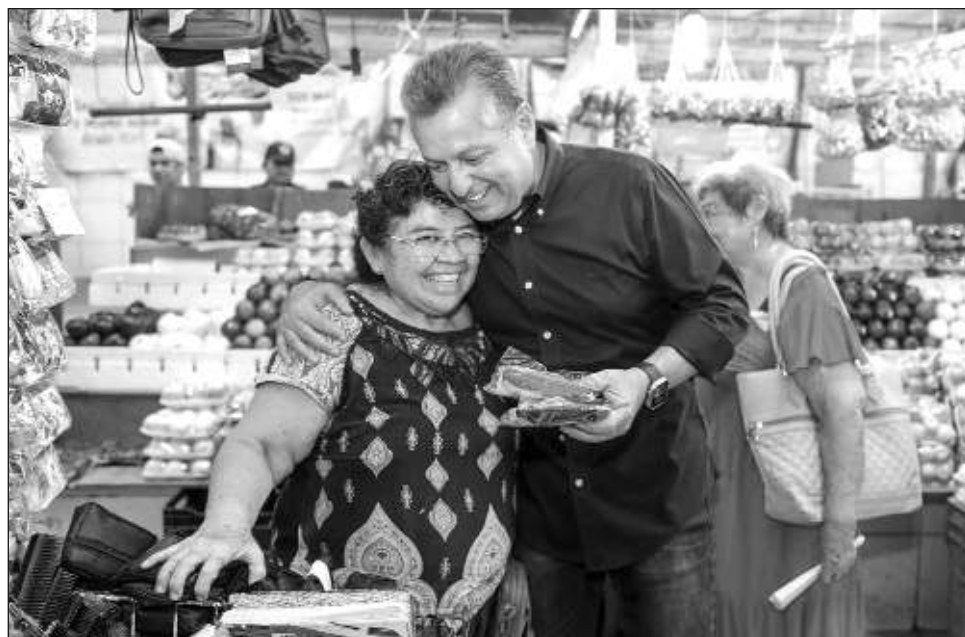
▲ En el recorrido que realizó el presidente municipal en el mercado, resaltó que esta nueva rampa eléctrica será un atractivo para visitantes nacionales e internacionales: “además de que facilitará el acceso y la movilidad.