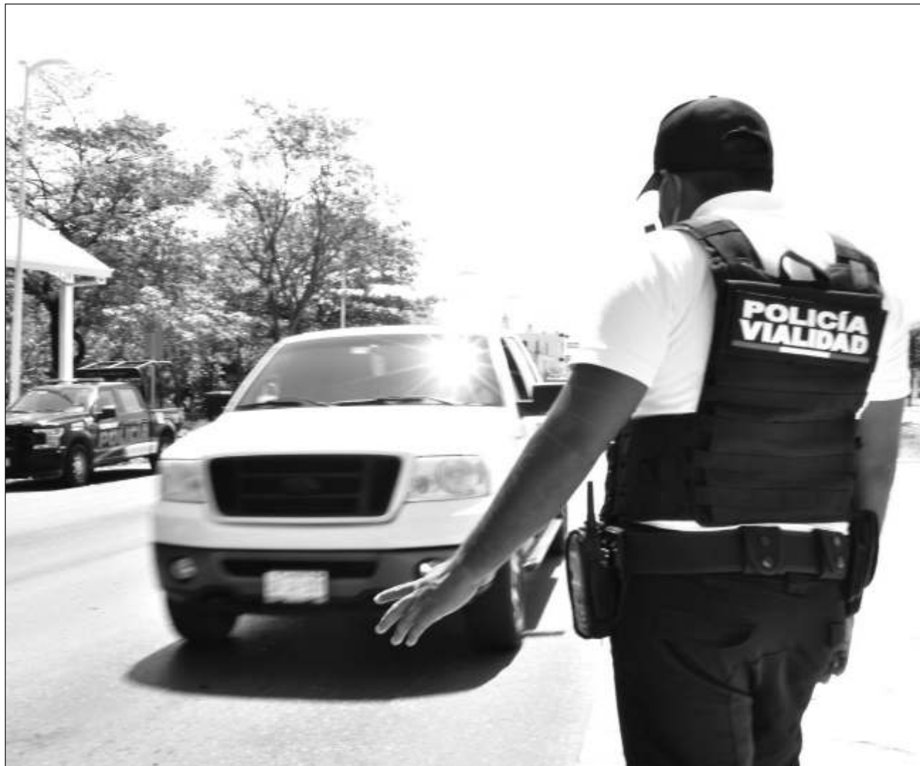
▲ La Secretaría de Seguridad Ciudadana pide a los padres de familia evitar estacionarse en doble fila.

Recordaron que en el caso de las zonas escolares, el límite de velocidad son los 20 kilómetros por hora.