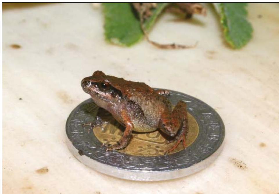
▲ Las seis especies de rana recién descubiertas podrían desempeñar un papel muy importante en el ecosistema como alimento de lagartijas y aves.

“Su estilo de vida es absolutamente fascinante. Estas ranas viven en la ho-