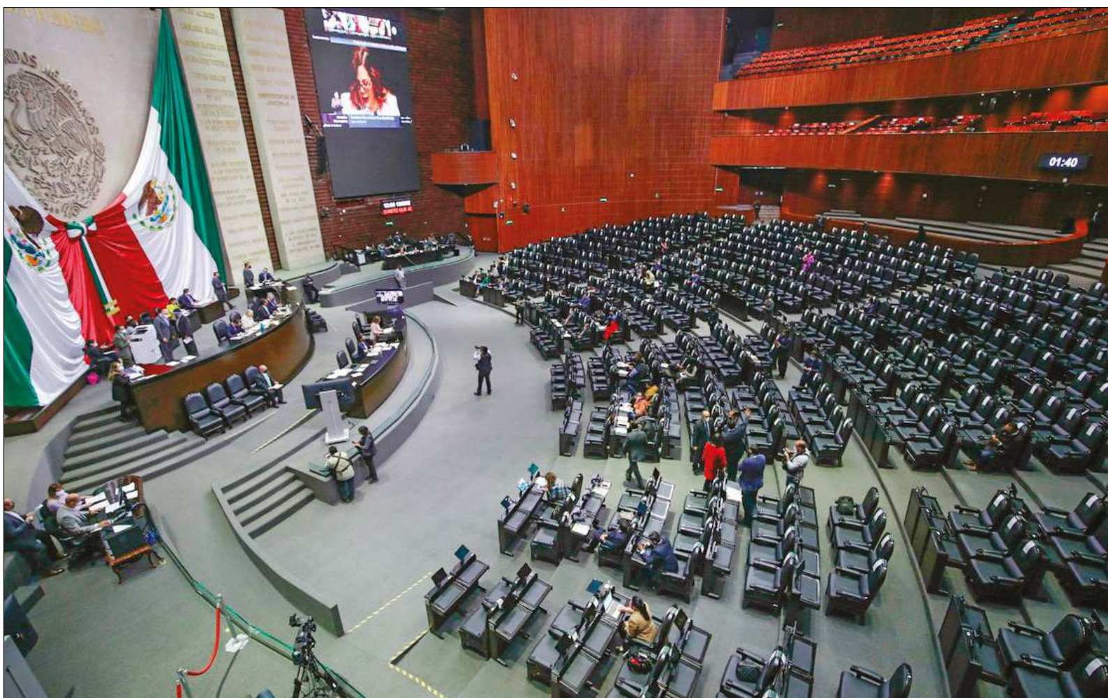
▲ "La democracia era una pantomima. Todos sabían que los candidatos de partidos diferentes al PRI perderían irremediablemente".