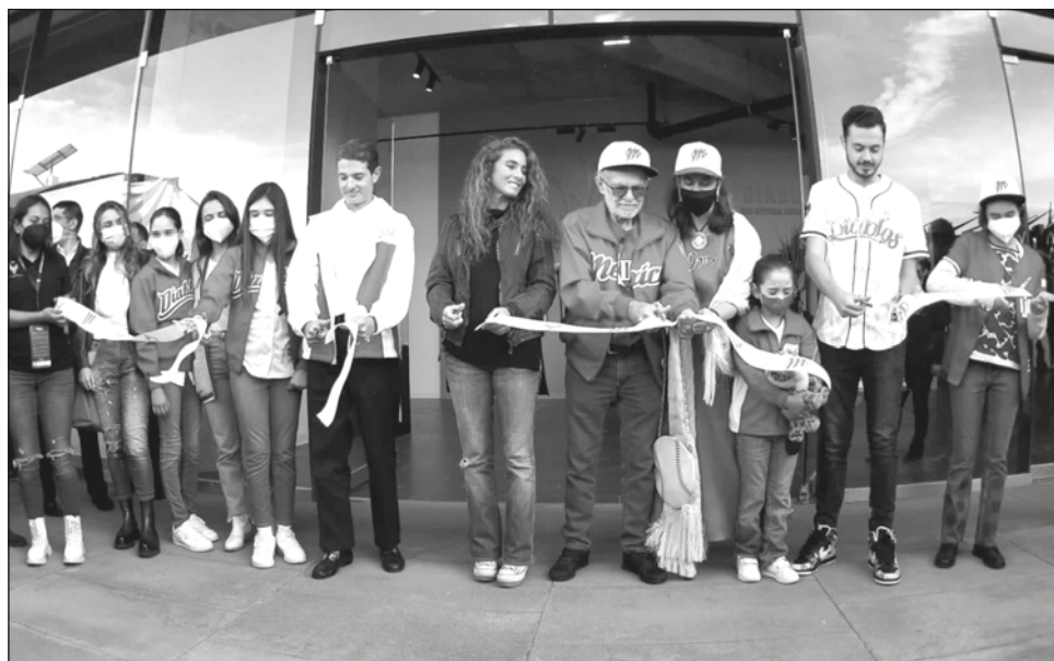
▲ El Museo de los Diablos Rojos fue inaugurado en la casa del equipo escarlata.

"No sabría decir qué falta en esta colección de toda una vida", dijo Harp