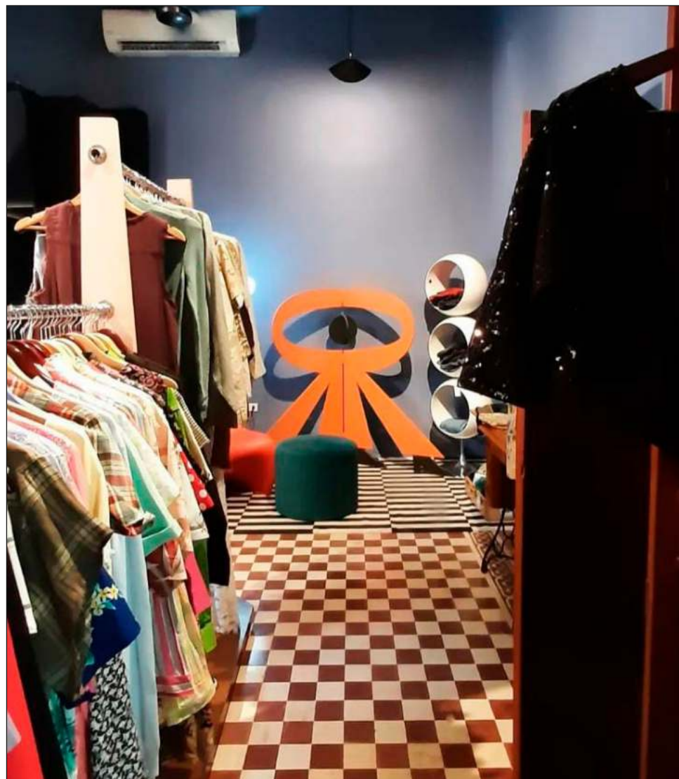
▲ Utilizar lo que ya existe significa que podemos retrasar el momento en que todo el material textil y plástico teñido llegará al ambiente como basura.

Para Daniela, la respuesta no es sencilla, si así fuera quizá los cambios