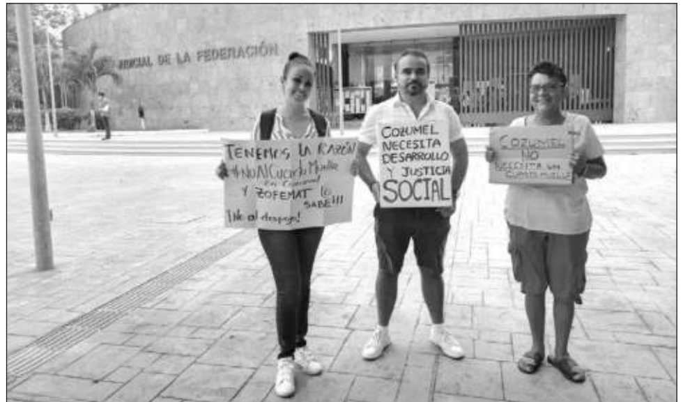
▲ Los integrantes de Isla Cozumel realizaron una manifestación en los juzgados federales de Cancún para reiterar su postura en contra del cuarto muelle.

A pesar de que existe la suspensión, indicaron que podrían continuar las ges-