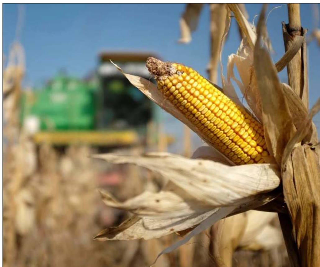
▲ La pandemia de Covid-19 fue una 'bomba atómica' en materia de hambre.

Lo que la representante de la FAO denomina una "tormenta perfecta" debe motivar a reflexión en torno a la forma en que se organiza un sistema económico global en el cual la gente pasa hambre pese a que existen alimentos suficientes y hasta de sobra para garantizar la nutrición de todos los seres humanos, y en el que el obstáculo al más elemental de los derechos no se halla primordialmente en factores naturales, sino en la decisión de librar todos los ámbitos de la vida a los mecanismos del "mercado".