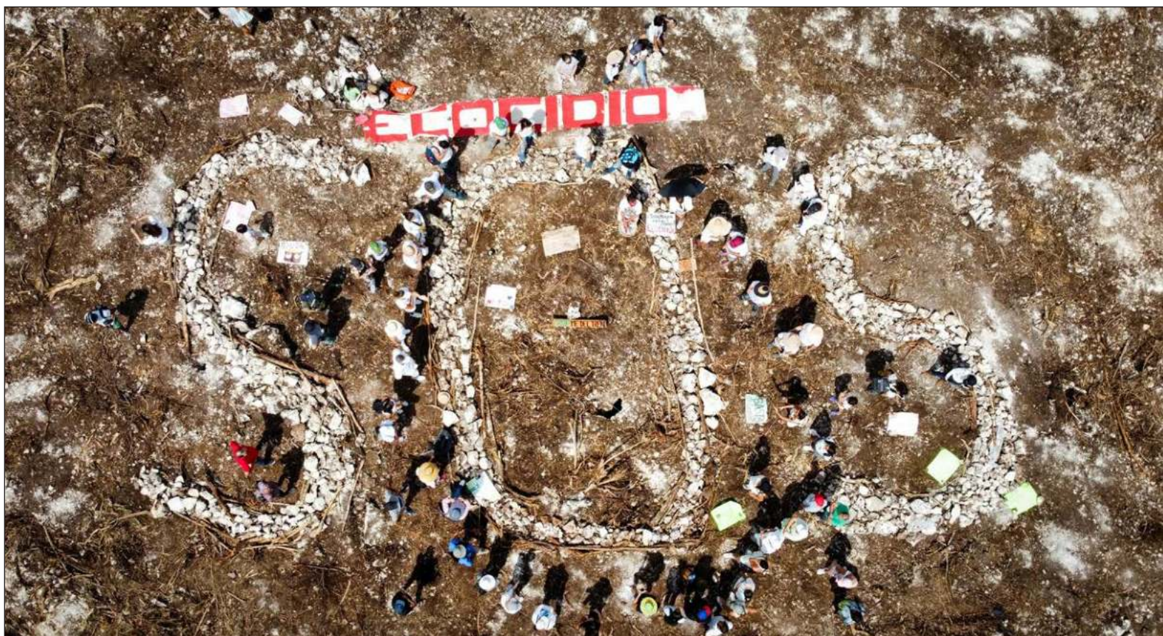
▲ La demanda ambientalista señala que no se ha evaluado el impacto ambiental antes de aprobar el trazo Playa-Tulum, con lo que estarían incumpliendo el Acuerdo de Escazú, y las reformas publicadas en el Diario Oficial de la Federación durante noviembre de 2021 para este fin.