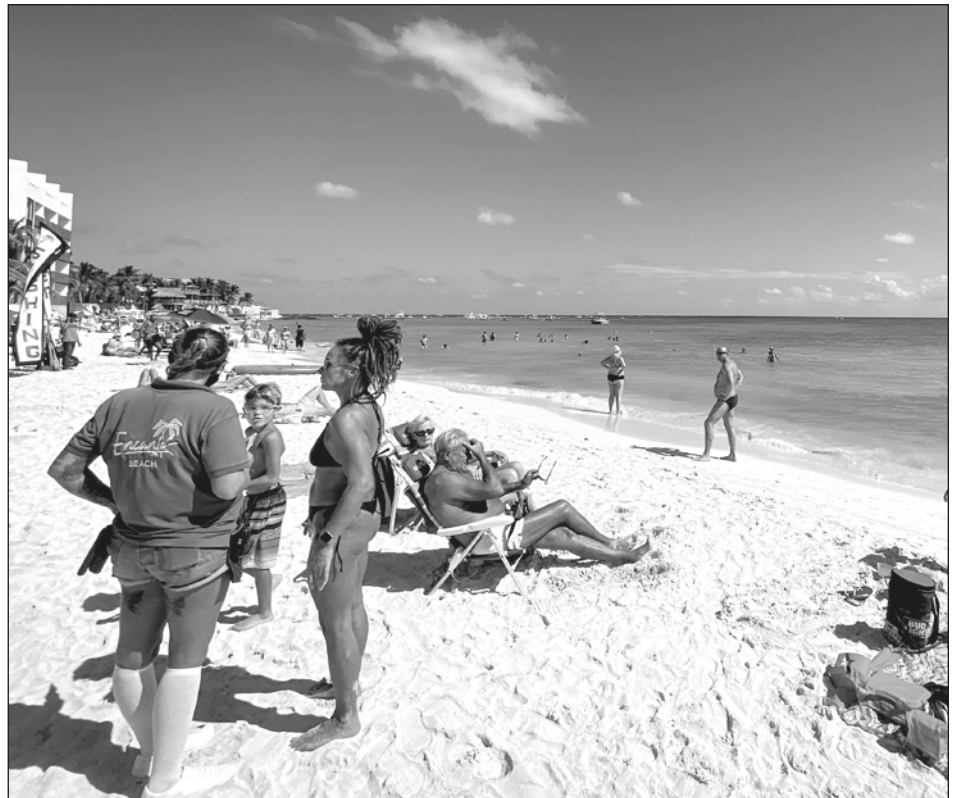
▲ El destino que registró mayor afluencia fue Riviera Maya con 564 mil 135 turistas, 75% más que en 2021; le sigue Cancún e Isla Mujeres.

Respecto a la afluencia de turistas en el sur, Chetumal presentó un incremento de 43%, equivalente a 45 mil 313 turistas; Bacalar con más del 40%, es decir 15 mil 775 turistas y Mahahual, con 8 mil 431 turistas. Por su parte los destinos de la zona maya, Felipe Carrillo Puerto y José María Morelos, superaron más del 90% en comparación con 2021.