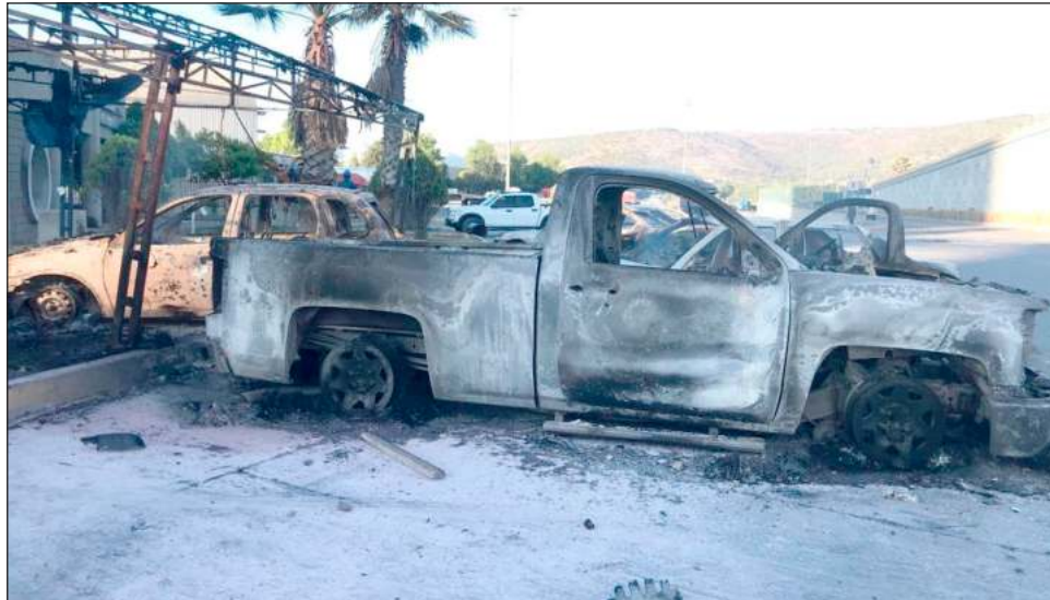
▲ Alrededor de las 5 horas de este miércoles, un convoy de microbuses supuestamente provenientes del Estado de México llegó a la planta ubicada en poblado de Jasso..

"Derivado de los hechos de violencia, fuerzas de seguridad resguardan la zona,