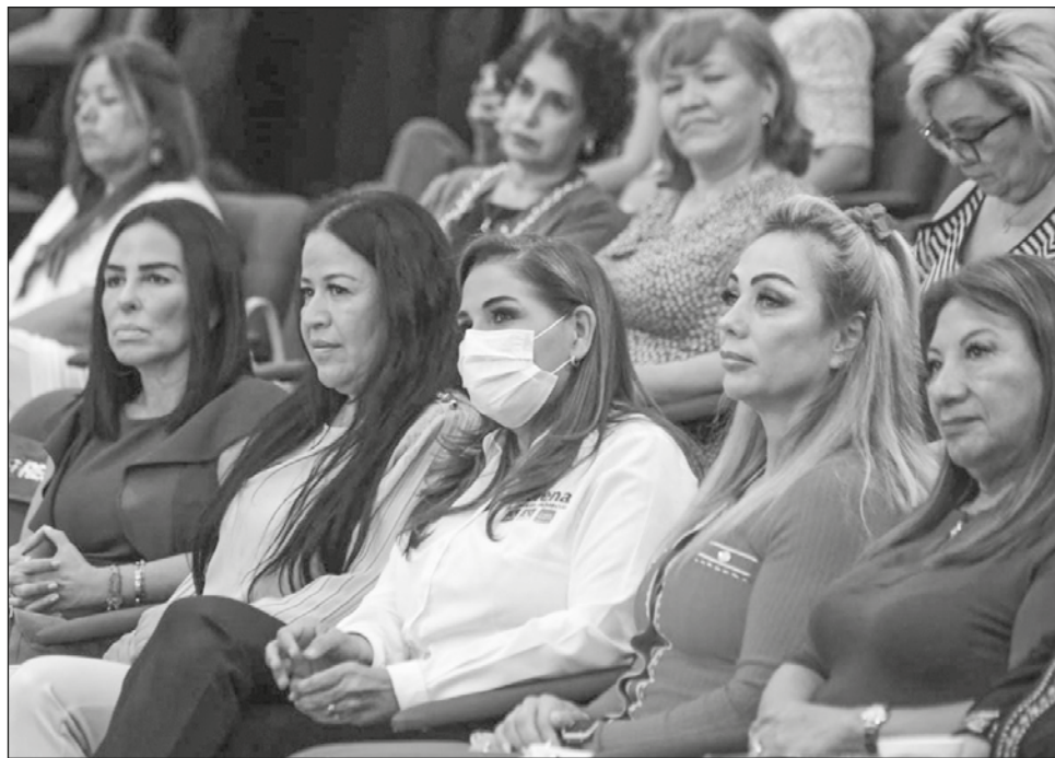
▲ La estrategia integral planteada por Mara Lezama incluye programas para prevenir la violencia de género y contra el feminicidio, entre otros.

En ese sentido, planteó un nuevo Pacto Económico y So-