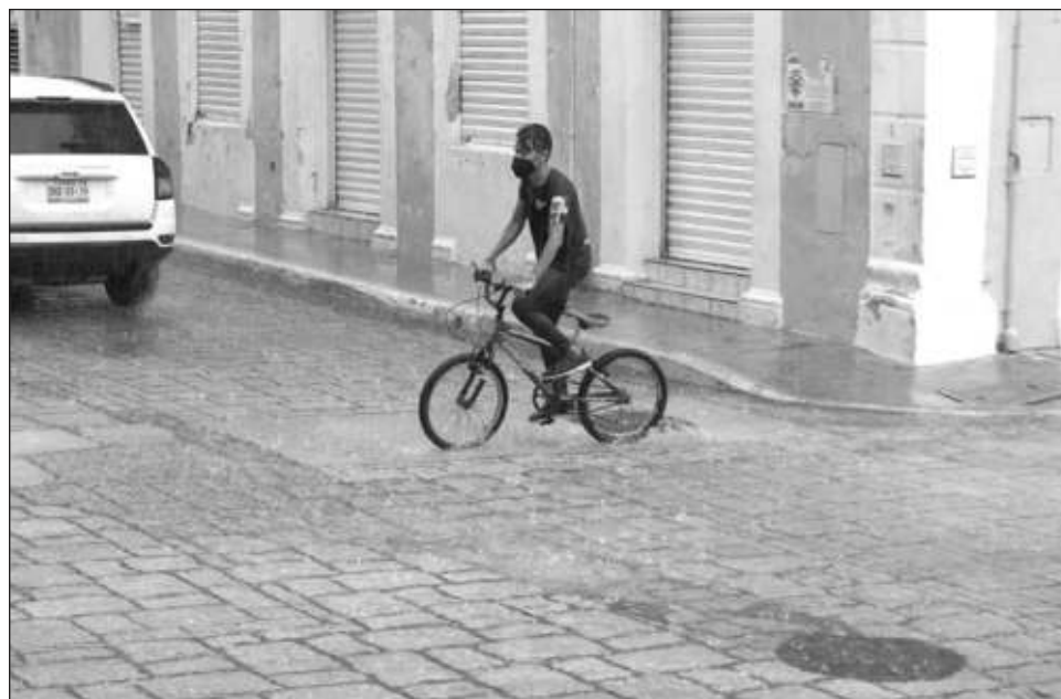
▲ En los municipios de Campeche y Carmen, donde hay mayor densidad urbana, las lluvias han estado más tranquilas; mientras que en el área rural han ayudado a hidratar la tierra.

Debido a una quema agropecuaria, desde el pasado