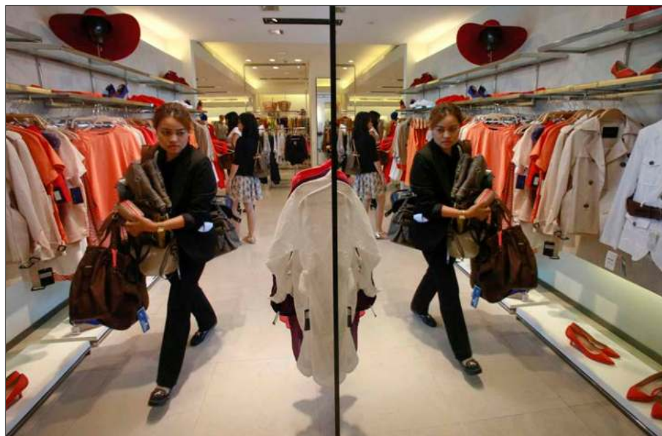
▲ El trueque, reparar ropa, vender ropa de segunda mano, son opciones para una moda sustentable, según recomendaron organizaciones ambientalistas.

Cuando no quieren salir, piden la ropa en línea: compran a mayoreo, prendas muy baratas, pero de una calidad cuestionable, a la segunda lavada ya se están deteriorando. Pero no les importa. "Es un pecado mortal usar la misma prenda más de dos veces. Ya