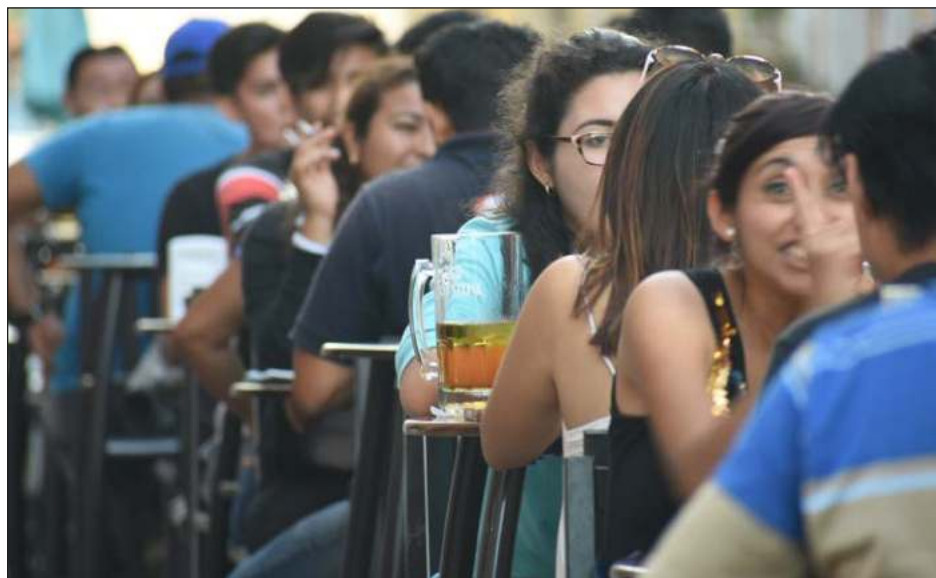
▲ De acuerdo con el director general de los Centros de Integración Juvenil, en Ciudad del Carmen se toma, en dos horas, lo que el italiano en una semana.

Detalló que de acuerdo con los índices con que cuentan, en el 2021, 88.3 por ciento de los varones confirma haber consumido alguna droga, en tanto que las mujeres,