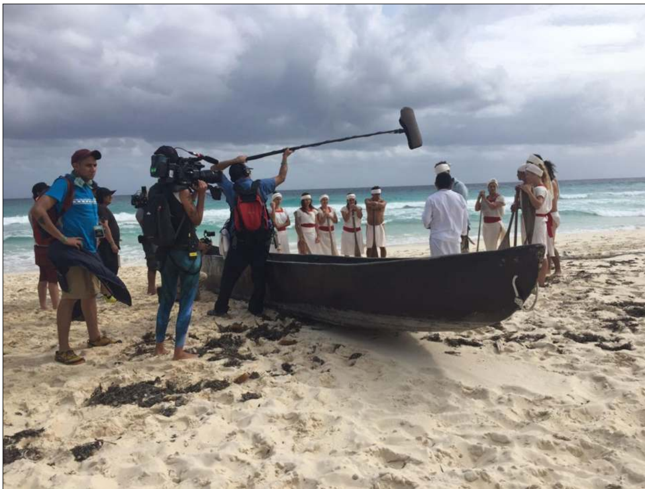
▲ El turismo cinematográfico es un fenómeno en desarrollo alrededor del mundo, acelerado por el crecimiento de la industria del entretenimiento y la expansión de los viajes internacionales.