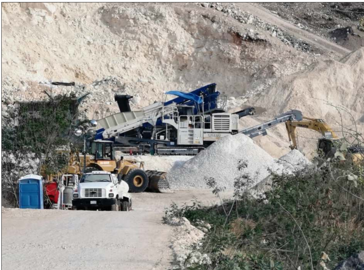
▲ Los ejidatarios de Pomuch argumentan que se les adeuda más de un millón 170 mil pesos por el material extraído de los bancos de sascab ubicados en sus terrenos, el cual se utiliza en el terraplén del Tren Maya.