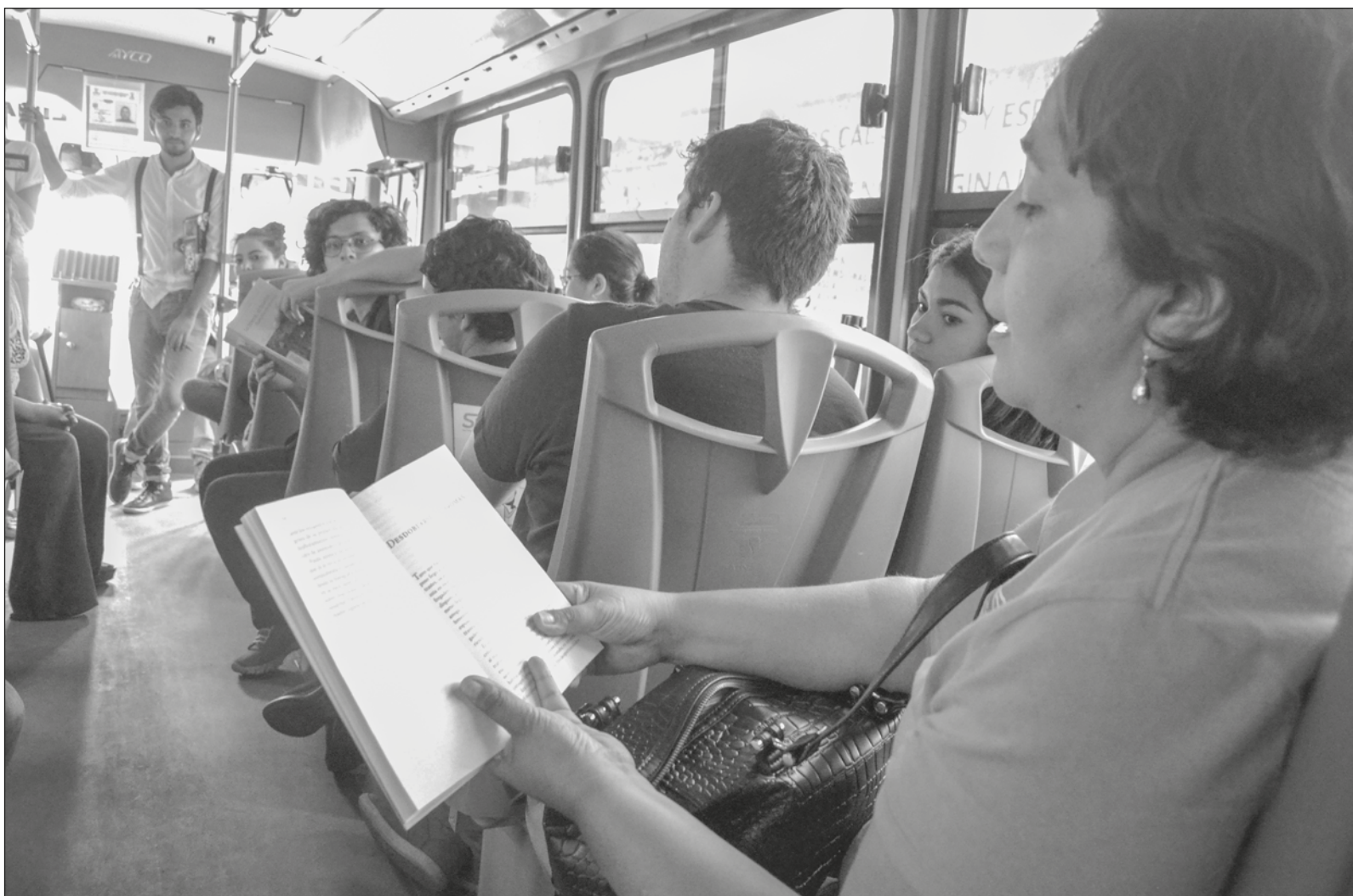
▲ "Es muy significativa la afirmación 'sin comprensión lectora, no es posible hacer matemáticas'".