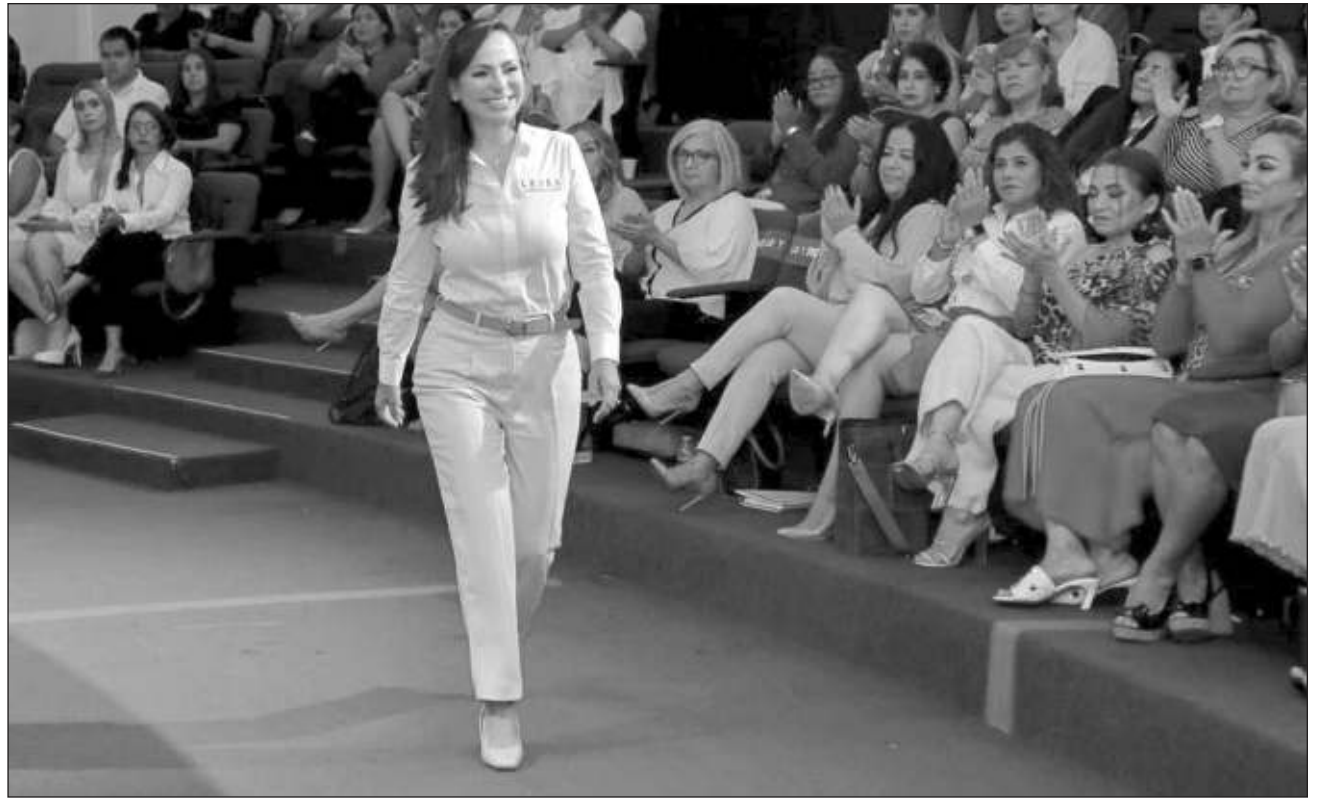
▲ La abanderada de Va por Q. Roo fue invitada a un diálogo con integrantes de la Amexme, capítulo Cancún.

"Vamos a instalar un botón naranja en varios puntos del estado, para que