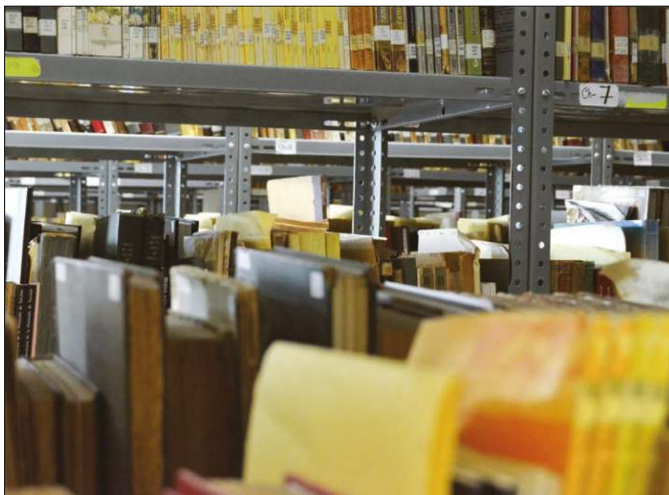
▲ El propósito del proyecto es contribuir a transformar las bibliotecas públicas, estatales y municipales, en espacios activos y dinámicos.

"Procurando que se ubiquen en espacios físicos, pero también virtuales, y que a través de mecanismos se promuevan y fomenten la lectura, así como la realización de actividades como pláticas, cursos de capacitación, y en general, se cuente con material didáctico que les facilite la continuación de estudios".