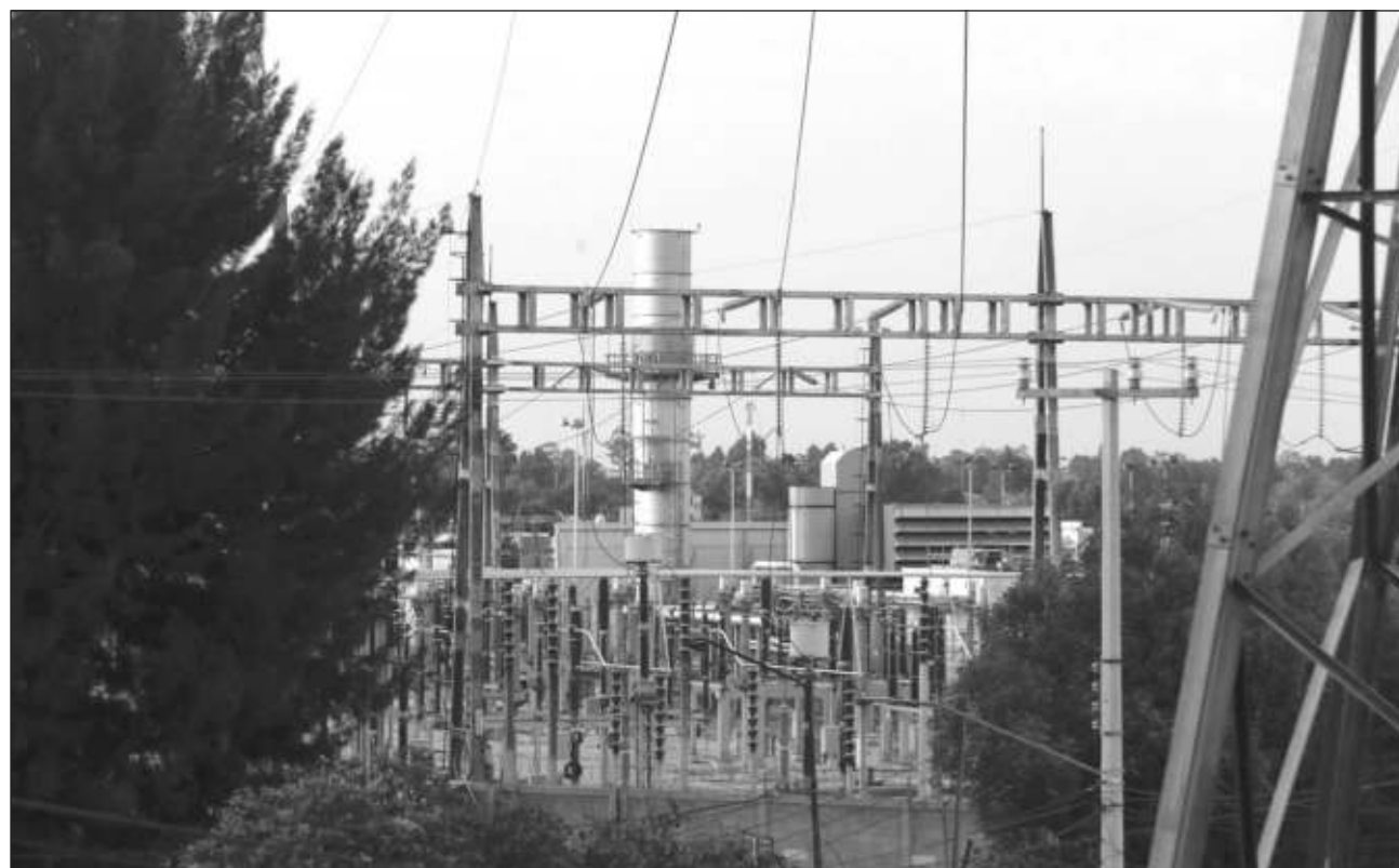
▲ Durante la conferencia de prensa matutina en Palacio Nacional, el mandatario federal expuso que las negociaciones con las empresas y consumidores se realizarán en la Secretaría de Gobernación.

Durante la conferencia de prensa matutina en Palacio Nacional, el mandatario expuso que las negociaciones con las empresas y consumidores se realizarán en la Secretaría de Gobernación (SG) y serán encabezadas por el titular de