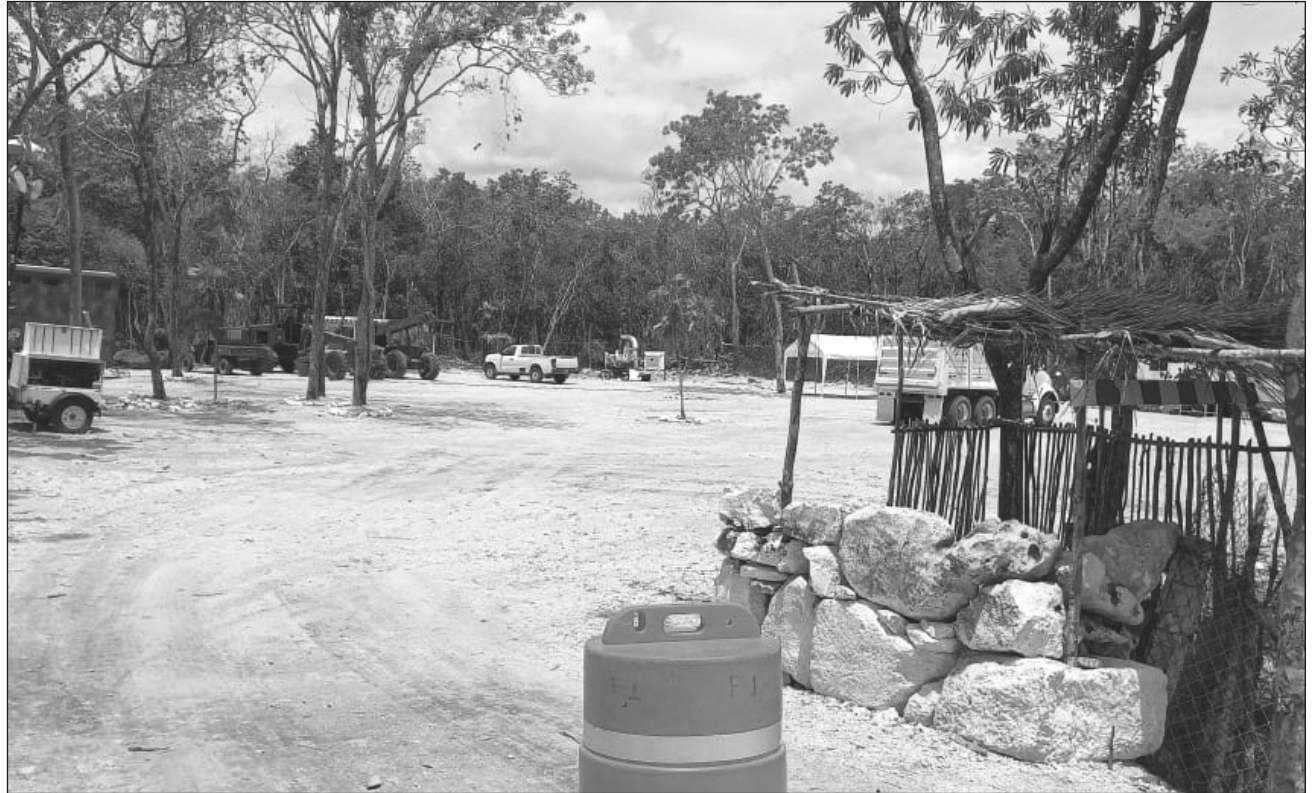
▲ El único acceso desde la carretera a la zona de construcción es una brecha y la entrada está restringida. El campamento provisional ha sido trasladado a la urbe del noveno municipio para recibir a los ingenieros militares.

En un recorrido llevado a cabo en la zona por donde se construirá el aeropuerto, ubicado entre las poblaciones de Chunyaxché (también conocido como Muyil) y Chumpón, en el municipio de Felipe Carrillo Puerto, se pudo constatar que el único acceso desde la carretera es una brecha y