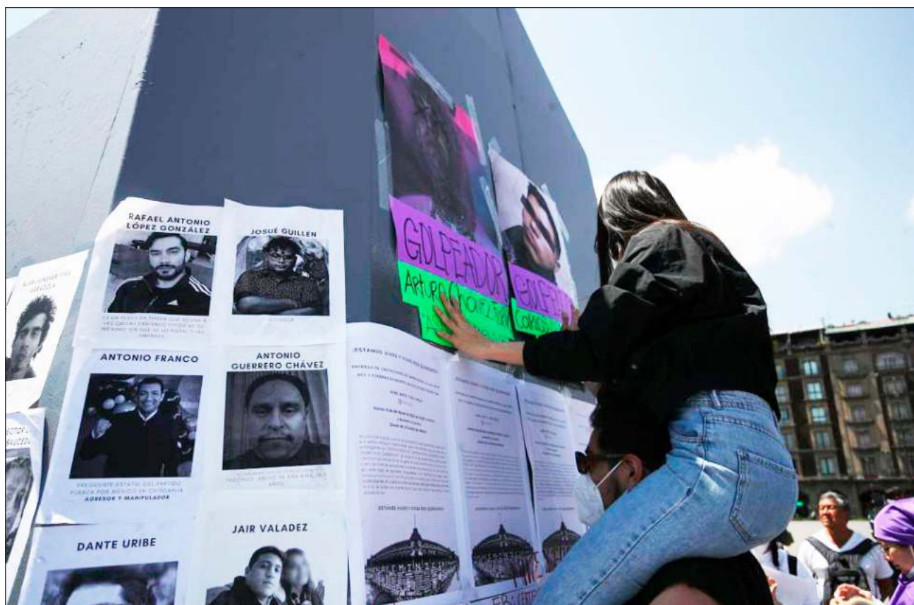
▲ Para asociaciones como Reinserta y Red en Defensa de los Derechos Digitales, el registro es violatorio de los derechos de protección de datos, intimidad o privacidad, aunque por lo novedoso del tema no existe jurisprudencia al respecto.

Los promoventes señalan que estas acciones del gobierno capitalino “violan los derechos de protección de datos, presunción de inocencia, debido proceso, intimidad o privacidad, en virtud de su especial situación frente al orden jurídico”.