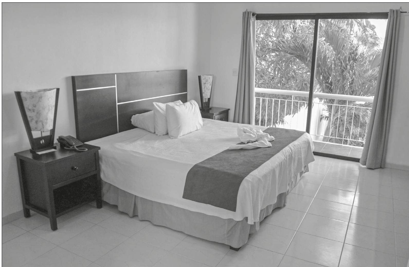
▲ “El encontrarse cuarenta años después habitando el cuarto que una vez fue de la poeta y en el que estaban apilados en una esquina sus libros casi deshechos por la humedad, abre las líneas de investigación”.