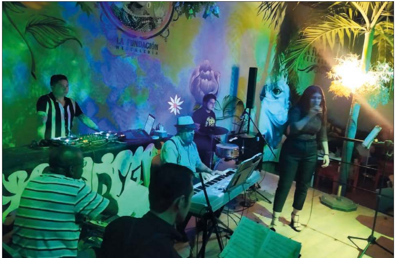
▲ La serie de conciertos busca profesionalizar a los artistas locales y ofrecer una identidad al público.

De igual modo, el empresario confirmó que La Mezcalería contará con una nueva banda conformada por un grupo de músicos muy diverso, todos con gran talento, que trabajan a base de partituras, arreglos propios y repertorios únicos.