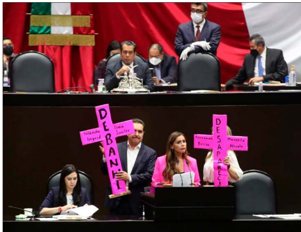
▲ En la Cámara de Diputados se aprobó sancionar con pena de ocho a 15 años de prisión a quien obligue a un menor de edad a cohabitar en forma equiparable al matrimonio.

Se impondrá prisión que no será menor a la mitad y podrá llegar hasta las dos terceras