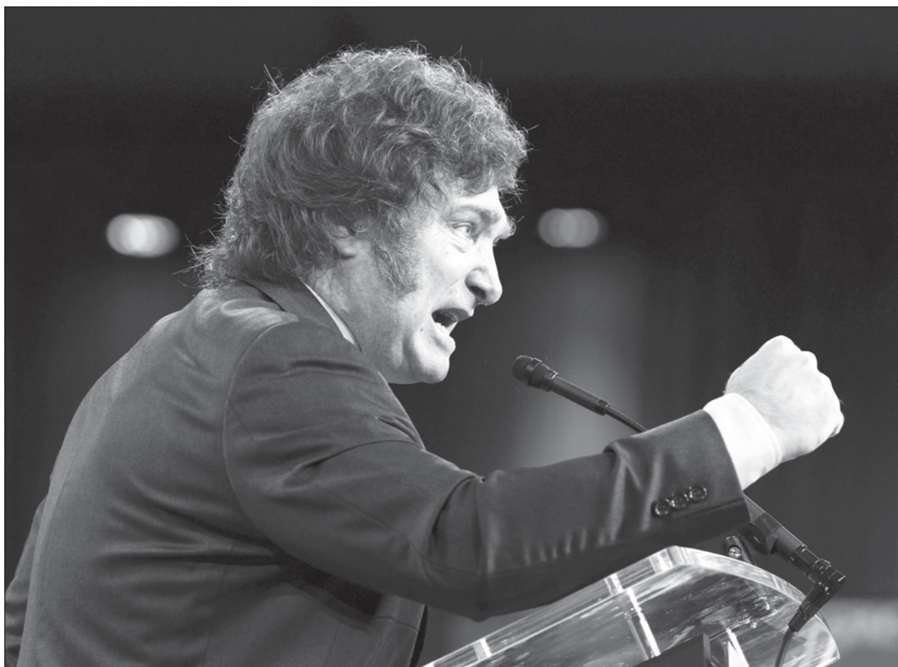
▲ Antes de llegar a la presidencia en diciembre, Milei llamaba a "dar la batalla cultural" contra el "adoctrinamiento del marxismo" al que considera responsable de haber acuñado la "ideología de género" y la "agenda ecologista".

A nivel de la UE, sólo están prohibidos nombrar productos vegetales con términos usados tradicionalmente para los lácteos, como yogur o queso.