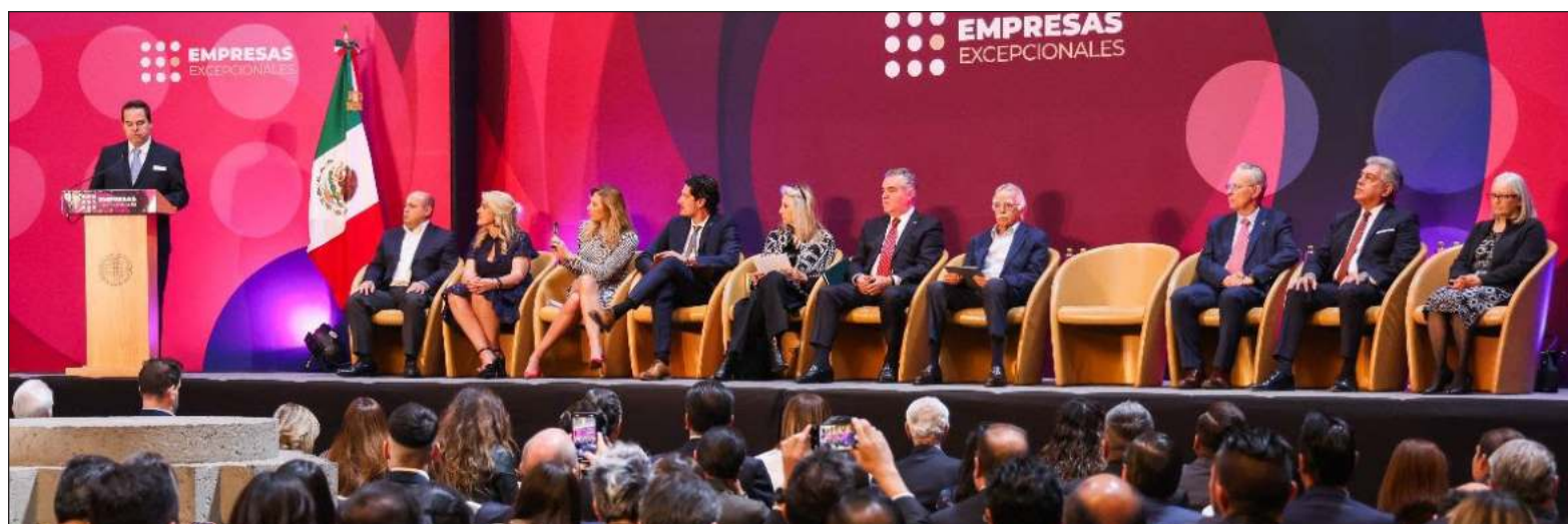
▲ La empresa Bepensa fue reconocida por su desempeño sobresaliente en la categoría Contribuir a los Objetivos de Desarrollo Sostenible en donde dio a conocer la forma en que lleva a cabo su programa permanente de acopio, ReQPET, práctica con más de una década de éxito en la península.

El Reconocimiento Empresas Excepcionales es un símbolo que representa el poder de la colaboración y una invitación abierta a todas las empresas del país a ser parte de la transformación positiva.