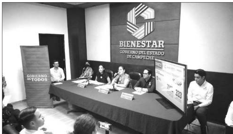
▲ La funcionaria destacó que realizarán un censo para entender cuáles son las necesidades específicas de cada zona, y será así que establecerán las estrategias de atención.

Por tiempos electorales, dijo que en el tema de apoyo a familias con el programa de comedores comunitarios