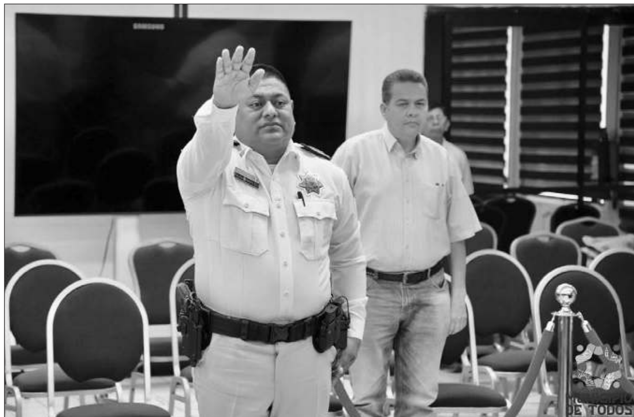
▲ El nuevo director de la Policía Municipal sostuvo que se habrán de implementar estrategias tendientes a disminuir los índices delictivos que se presentan en Carmen, para lo cual llevarán a cabo acercamientos con los ciudadanos.

Durante 2011, culminó satisfactoriamente el Curso de Alta Dirección en el