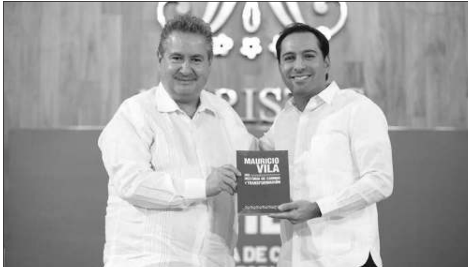
▲ El volumen es un vistazo a su vida como empresario, legislador local, alcalde de Mérida y gobernador, un “resumen de los últimos 10 años”.

Vila Dosal dijo que en sus páginas plasmó el viaje de