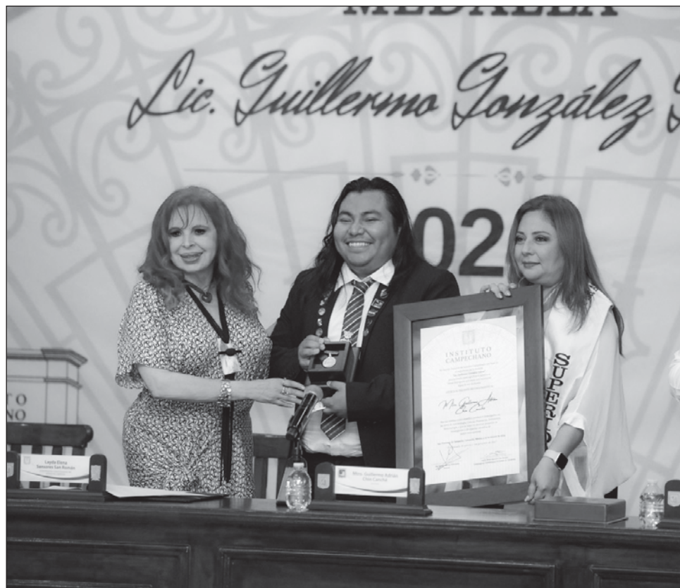
▲ La presea fue creada por autoridades del Instituto Campechano a los egresados de sus aulas que destaquen en las artes, ciencias o educación.