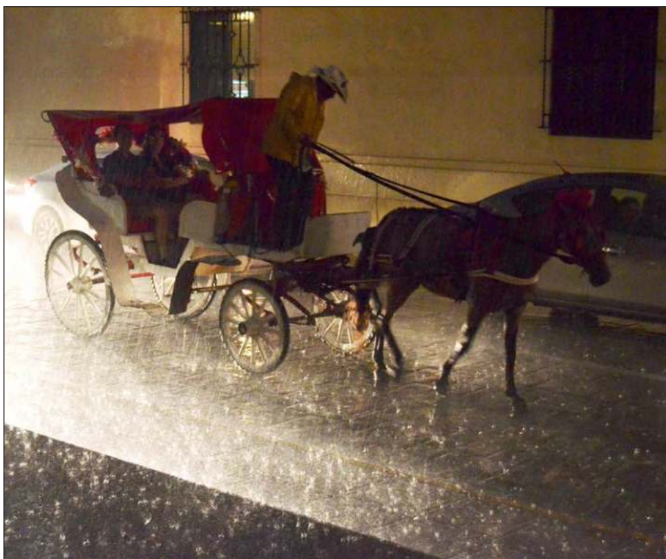
▲ La ley del estado ahora establece la prohibición de tránsito de animales en vialidades asfaltadas, para finalidades distintas a las relacionadas con las actividades agropecuarias.