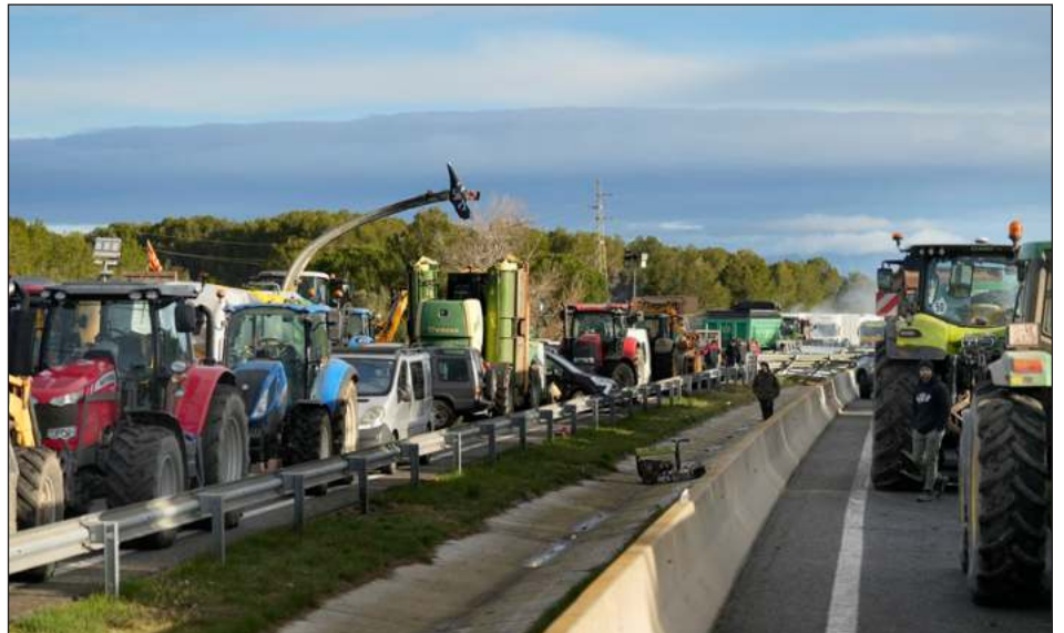
▲ Los agricultores exigen un acuerdo satisfactorio, sobre todo en las ayudas por las consecuencias de la sequía: buscan que el agua "sea equitativa para todos".

Días después de la crucial reunión en Bruselas de los ministros de agricultura de todos los países de la Unión Europea (UE), entre los agricultores españoles impera el escepticismo y el ánimo de mantener viva la llama de la protesta. Así lo hicieron patente en sus movilizaciones en el noreste del país, con un largo bloqueo de una de las carreteras más transitadas y que comunica con el sur de Francia. Además hubo