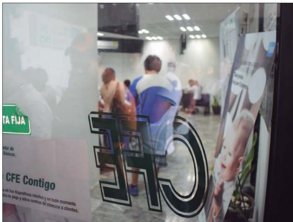
▲ La empresa estatal reportó los ingresos totales sumaron 644 mil 361 millones de pesos, lo que significó un aumento de 3.8 por ciento respecto a 2022.

La mayor demanda de electricidad en 2023 se registró principalmente en los usuarios domésticos, industriales agrícolas y comerciales, en sintonía con el crecimiento de la economía mexicana.