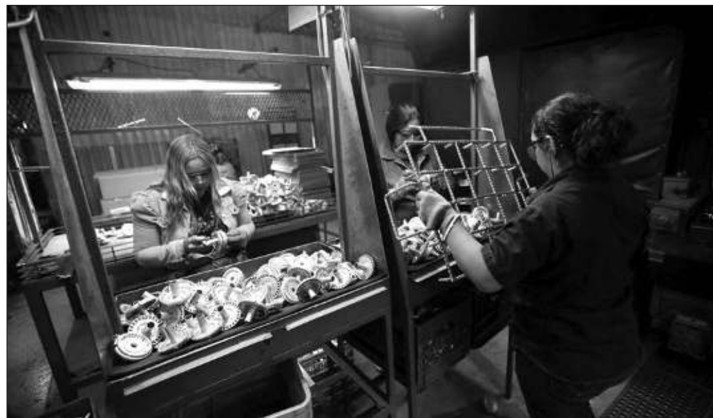
▲ El arranque de la relocalización de las cadenas productivas representa una ventana de oportunidad irrepetible para la citada reindustrialización con una verdadera perspectiva de futuro y un sentido de país.

Estos propósitos requieren incluir el apoyo orgánico a la investigación entre las políticas públicas del próximo gobierno federal. La institución que se haga cargo de ello puede tomar la forma de una empresa, una secretaría de Estado, un centro que combine la investigación teórica con la aplicación práctica, u otro tipo de organismo. Puede ser creada desde cero o construirse a partir de instituciones existentes como el Consejo Nacional de Humanidades, Ciencias y Tecnologías, siempre que se le otorgue un rango, atribuciones y presupuesto mayores. Sin importar su configuración específica, deberá operar con el objetivo de generar patentes en los campos de mayor relevancia para las necesidades nacionales. Así pues, vale la pena tomar al SETT como referencia de una política de Estado pertinente en materia de desarrollo tecnológico.