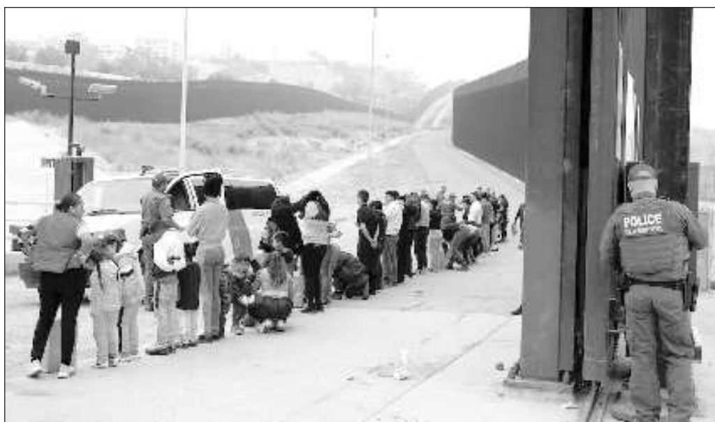
▲ Ha sido bastante cómodo mantener el esquema de migrantes legales/ilegales, cuando detrás del fenómeno migratorio hay condiciones de miseria y/o violencia que ya son estructurales en varios países americanos.

Y en última instancia, tendrá que haber acuerdos, y cualquiera será mejor que entrar en una escalada de aranceles. Trump, a fin de cuentas, no es otro Theodore Roosevelt, aunque quiera parecerlo.