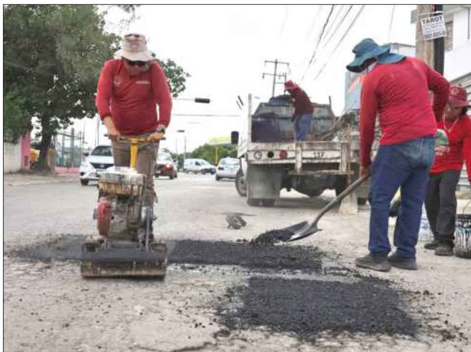
▲ En total, los Servicios Públicos del ayuntamiento de Benito Juárez cuentan con seis brigadas trabajando por cada uno de los tres turnos, con 80 colaboradores.

"En la avenida Chac Mool, por ejemplo, donde tenemos presencia de algunos baches ya considerables, es la realidad, ya para el ciudadano es molesto estar pasando por allí, sobre todo en las horas para transitar de