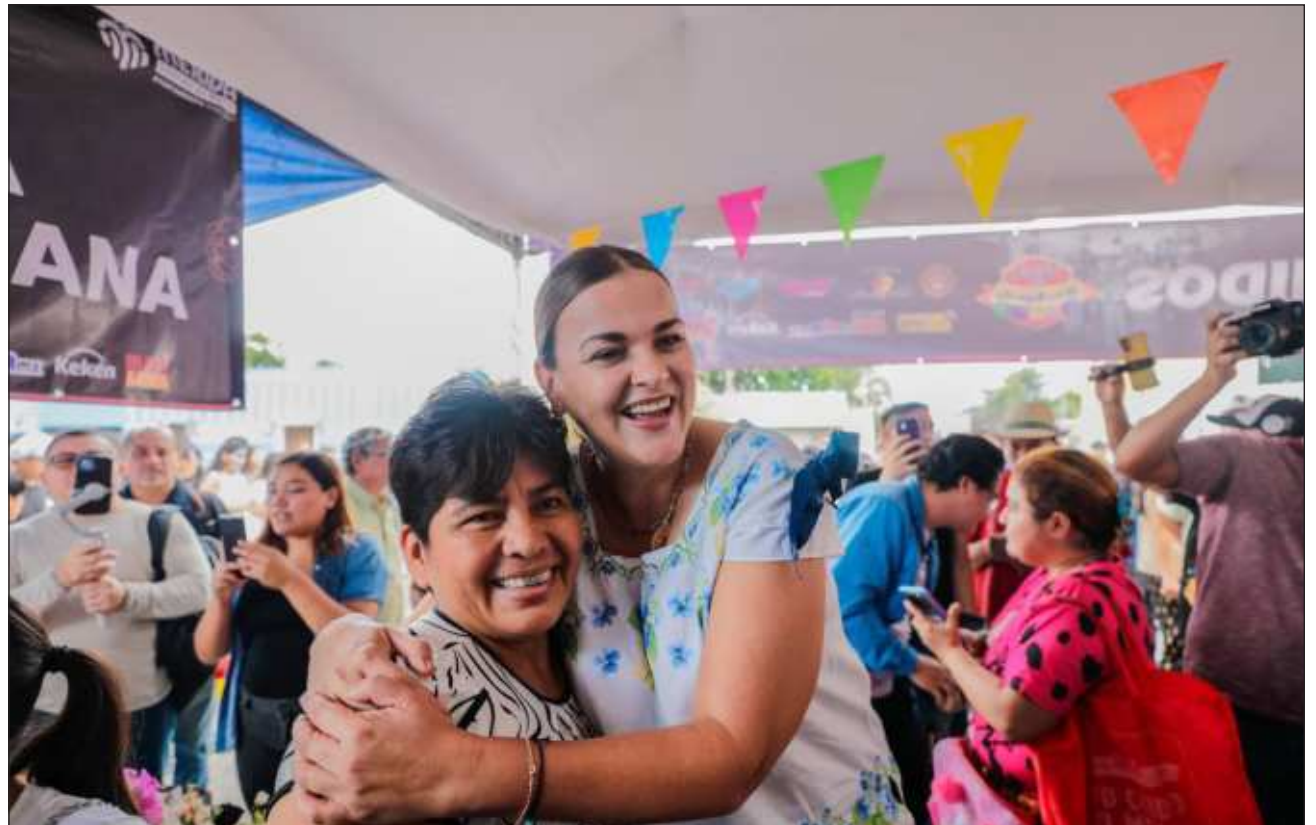
▲ La presidenta municipal de la capital yucateca, Cecilia Patrón, reiteró que “cuando llega una, llegamos todas y el compromiso es de mujer a mujer. Aquí las apoyamos, las cuidamos y protegemos”.

Por ello, como parte de las acciones para brindar atención oportuna y servicios de calidad, ahora se da atención a niñas y adolescentes y personal del área jurídica del Instituto brindará un acompañamiento integral y podrá nombrarse como representante