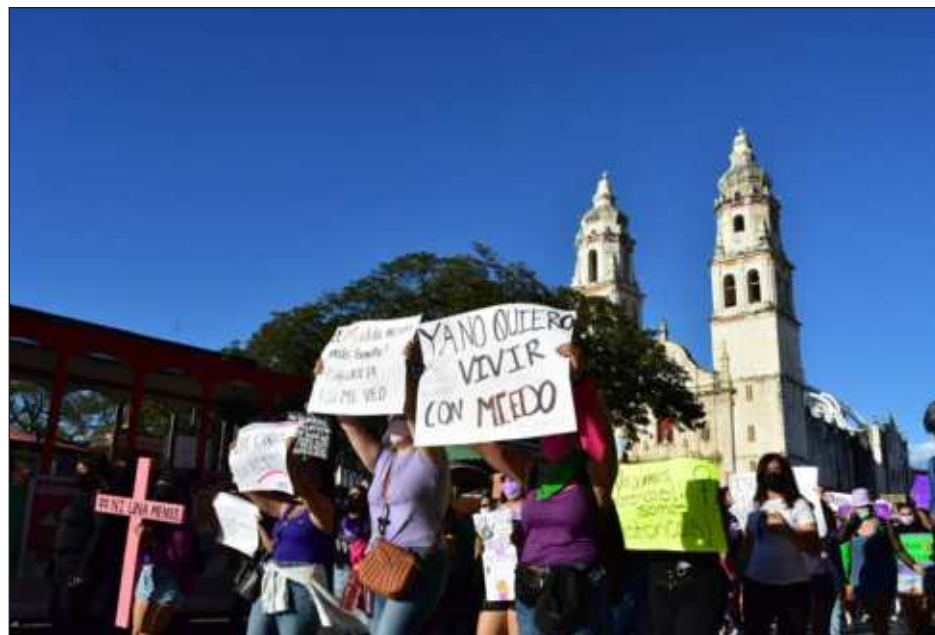
▲ La Redmyh hizo un llamado a las autoridades de procuración de justicia, derechos humanos y demás, a no dejar en letra muerta lo que establece la ley a nivel nacional.

Este 25N no salimos a las calles porque, paradójicamente, hasta ahora no se ha cumplido ni satisfecho el hacer los espacios públicos, espacios seguros para nosotras. Enfrentamos un empuje de los sectores conservadores y de grupos radicales (...) la criminalización de la protesta, al prestigio de los activismos”.