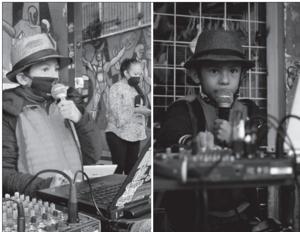
▲ La fundadora del colectivo femenino Musas Sonideras, asegura que “existen bastantes niños y jóvenes en esta actividad, pero no hay una red o colectivo que los aglutine, porque es muy delicado trabajar con infancias”.

El tigrillo del sabor , dijo, es versátil. “Hace todo lo que involucra un sonidero. Hace todo: pone su música,