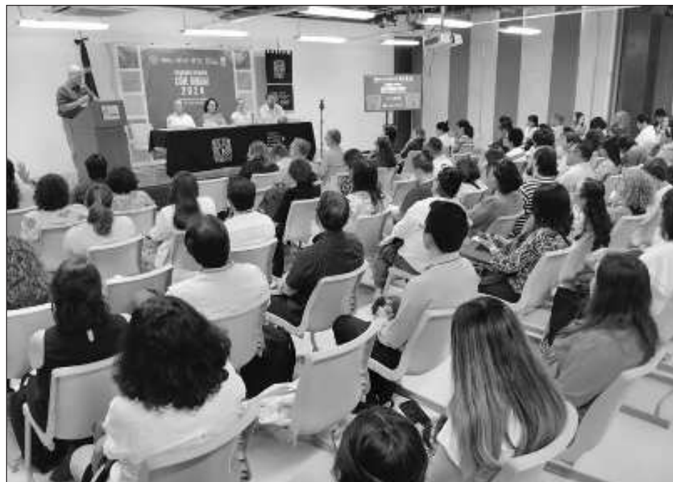
▲ Estas jornadas, por lo tanto, pondrán en relación a académicos, estudiantes y personal docente de países como Estados Unidos, Honduras, Brasil y México.

Las universidades implicadas en este proceso de vinculación bajo este modelo educativo son el Centro Paula Souza de Sao Paulo Brasil, Universidad Pedagógica Nacional Francisco Morazán de Honduras, la Universidad de Minnesota de Estados Unidos, así como di-