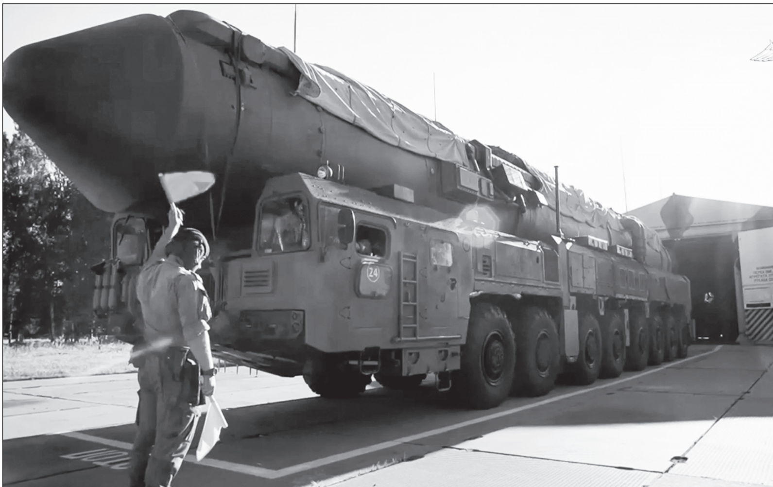
▲ "La reacción de Vladimir Putin fue liberar hordas del nuevo misil supersónico Oreshnik , espantando nubes a su paso. Esas nuevas hachas de guerra tienen un alcance capaz de rasguñar cualquier capital europea; no hay escudo ni defensa cien por cien eficaz".