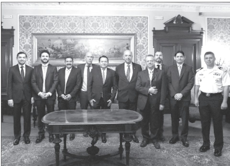
▲ El gobernador Joaquín Díaz Mena sostuvo pláticas en el Salón Azul del Municipio de Trieste, con el alcalde Roberto Dipiazza y ejecutivos de Fincantieri.

Próximamente realizarán ferias específicas como la enfocada al turismo y para mujeres.