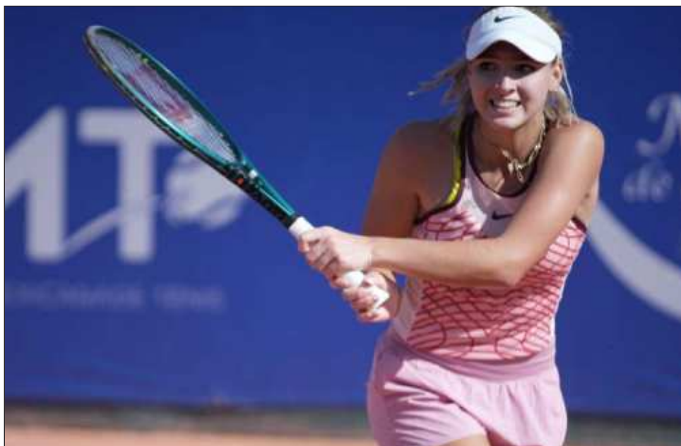
▲ Duelos intensos y de un alto nivel de tenis se viven en el Club Campestre.