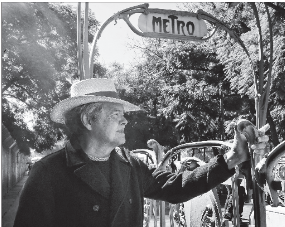
▲ Arturo Márquez obtuvo dos Grammys Latinos en los rubros de mejor álbum de música clásica y mejor composición clásica por Fandango para violín y orquesta.

“En este momento estoy componiendo un concierto de contrabajo para un joven venezolano asentado en Berlín. Tengo encargos para dos años, podría ser para más, pero no quiero ir más allá, prefiero ir poco a poco y hacer tiempo para cumplir mis inquietudes personales. Cuando acepto una obra es porque de alguna forma ya tengo un camino a seguir”, agrega.