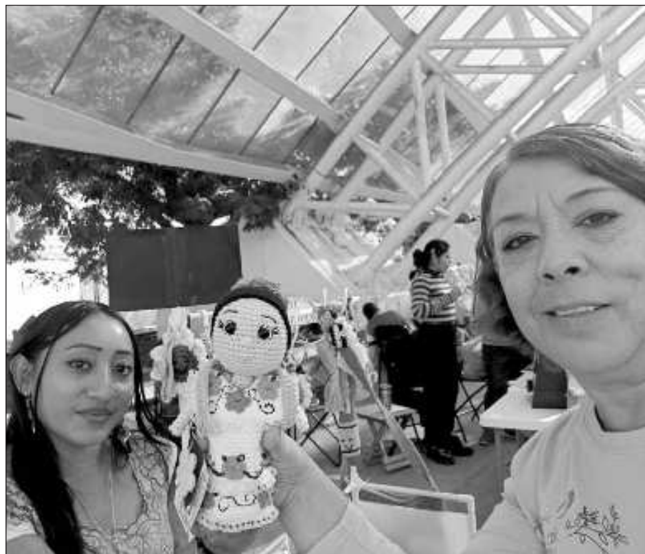
▲ El IMEC dio a conocer que la instalación de los stands fue totalmente gratuita, en el que participaron los comercios de los municipios de Candelaria, Calakmul, Escárcega y Calkiní.

En Seybaplaya, entregaron 50 refrigeradores a un mismo número de familias, lo que representa un beneficio para 200 personas en promedio, así como una inversión por arriba de los 433 mil pesos.