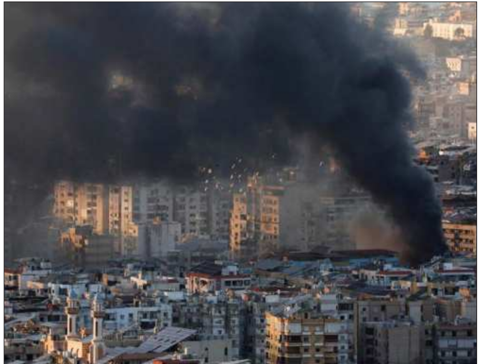
▲ Al menos dos bombardeos fueron visibles en los alrededores de la capital libanesa, poco después de que el ejército israelí llamara a evacuar una zona del centro de Beirut.

Un portavoz militar, Avichay Adraee, había difundido a través de redes sociales imágenes de los edificios que serían atacados y que las FDI vinculan al partido-milicia Hezbolá.