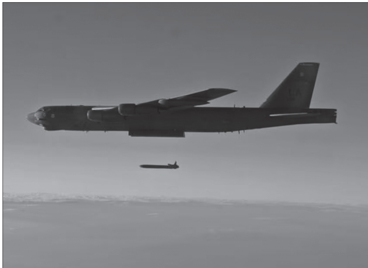
▲ “Tenemos que soportar, un día sí y otro también, la fría contabilidad de muertes de palestinos, libaneses e israelíes, en esta danza macabra en la que el señor Netanyahu, con sus acólitos y sicofantes, se empeña, en nombre del pueblo que sufrió el holocausto, en aplicar a todo un pueblo lo que ve como una ‘solución final’”.

No sabíamos que vendría esta era de la super información, cuando todo el tiempo, queramos que no, nos encontramos expuestos a visiones perturbadoras y frecuentemente incomprensibles, de los que los seres humanos podemos hacernos unos a otros, acompañadas de narrativas que hacen que lo absurdo sea solamente un juego pueril. Así, escuchamos al señor Putin decirnos que se esfuerza hasta lo indecible por evitar un conflicto nuclear, como si eso requiriese más esfuerzo que hacer caso de la voz de la más elemental sensatez, mientras se empeña en reducir a una Ucrania que no sabemos qué tan dividida se encuentra, entre ucranianos “patriotas”, que han olvidado que su país fue también cuna de los zares, y ucranianos “pro rusos” que añoran una unidad que hace una historia entera que no existe y que se defiende gracias a los pertrechos aportados por Estados Unidos y Europa, que se esfuerzan por dar salida a un arsenal caduco, para renovarlo y seguir alimentando sus economías con