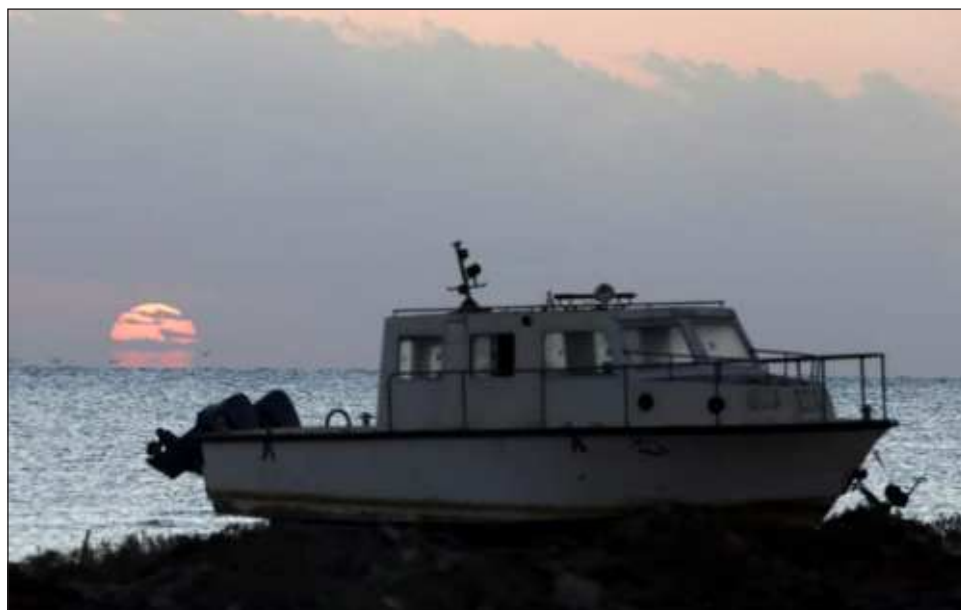
▲ En el yate Sea Story se hundió tras ser impactado por "una ola de alta mar".

Hanafi elevó así a 33 el total de rescatados y subrayó que los trabajos de búsqueda y rescate siguen