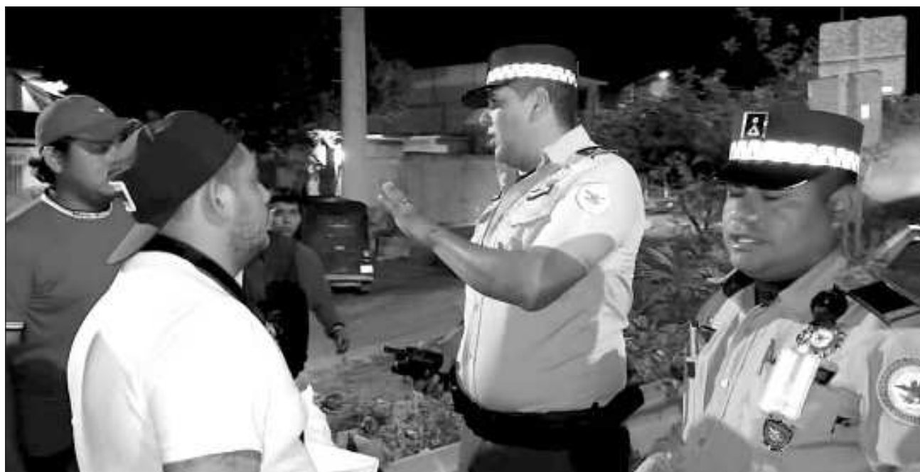
▲ Los aspirantes a la Comisaría Municipal piden a las autoridades estatales y municipales que se repitan las votaciones; argumentan que los hechos violentos se registraron durante el conteo, mismo que no concluyeron, desconociendo lo plasmado en "sábanas electoras".

En las inmediaciones del Hospital General IMSS-Bienestar, familiares de los lesionados durante este proceso, quienes pidieron