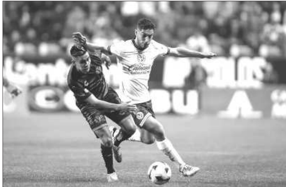
▲ Las Águilas buscarán tomar ventaja en el estadio de la Ciudad de los Deportes.